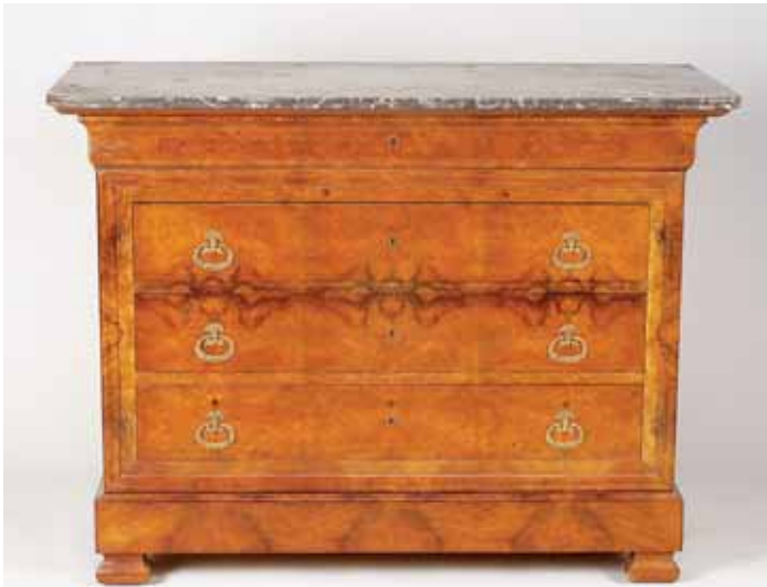
629 CÔMODA, Luís Filipe, noqueira e raiz de noqueira, ferragens em bronze, tampo de mármore, francesa, séc. XIX, mármore não original, pequenos defeitos Dim. - 99 x 130 x 60 cm €1.300 - 1.950