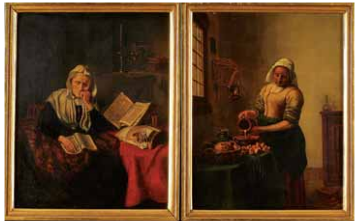
741 "CENAS DE INTERIOR", par de óleos sobre madeira, escola holandesa, séc. XIX