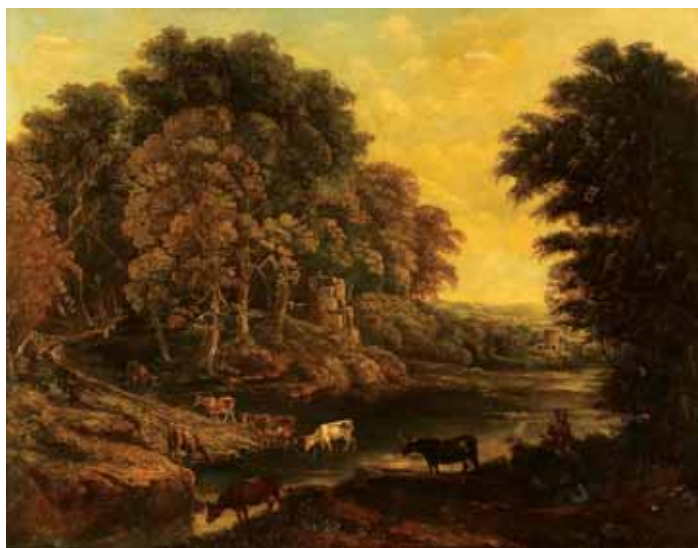
747 "PAISAGENS VACAS", óleo sobre tela, escola inglesa, séc. XIX, pequenos restauros Dim. - 96 x 123 cm