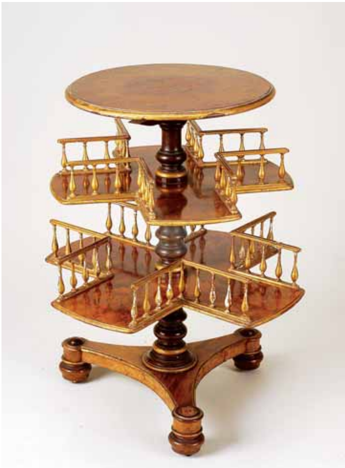
628 DUMBWAITER, victoriano, noqueira e raiz de noqueira, frisos e balastrada dourados, pés com rodízios, inglês, séc. XIX, faltas e defeitos Dim. - 71 x 58 cm €150 - 225