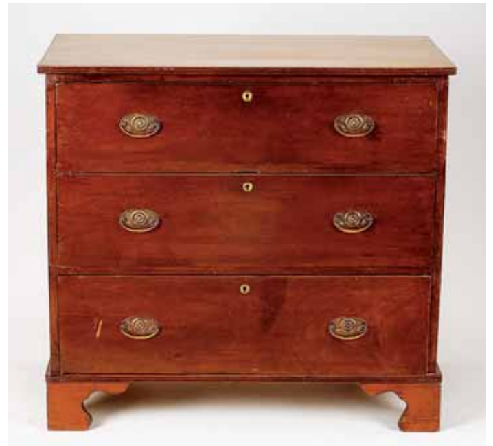
827 CÓMODA, estilo Jorge III, mogno, puxadores em metal amarelo, inglesa, séc. XIX, pequenas faltas e defeitos Dim. - 85 x 91 x 99 cm € 350 - 525