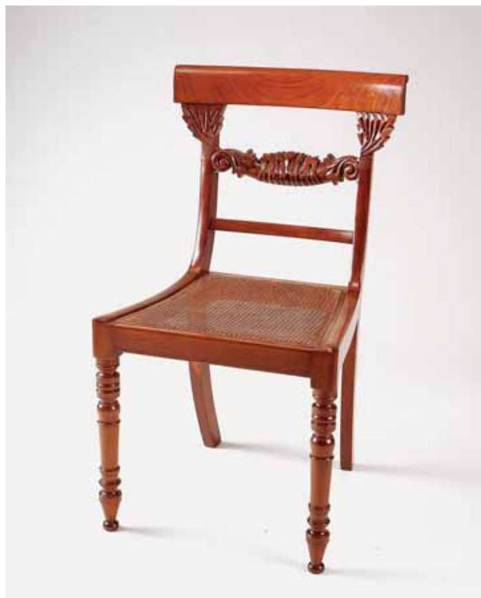
821 CONJUNTO DE SEIS CADEIRAS , victorianas, murta, costas com entalhamentos, assentos palhinha, inglesas, séc. XIX, pequenos defeitos Dim. - 90 x 48 x 51 cm € 700 - 1.050