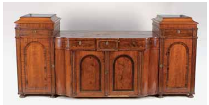
804 SIDEBORD , victoriano, mogno e raiz de mogno, frisos tremidos, ferragens em bronze, inglês, séc. XIX, faltas e defeitos Dim. - 113 x 249 x 73,5 cm €1.500 - 2.250