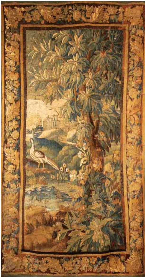
871 "PAISAGEM", tapeçaria de Aubusson em fio de lã policromada, francesa, séc. XVII/XVIII, faltas e defeitos, provavelmente terá sido cortada Dim. - 285 x 160 cm € 2.500 - 3.750