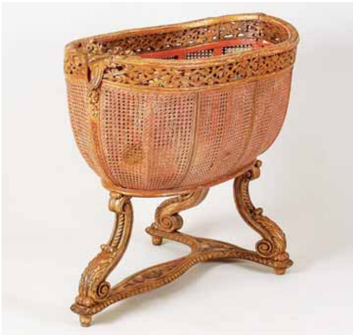
825 BERÇO, madeira entalhada, pintada e dourada, lateral com palhinha, francês, séc. XIX, faltas na pintura, pequenos defeitos Dim. - 85 x 105 x 56 cm € 2.000 - 3.000