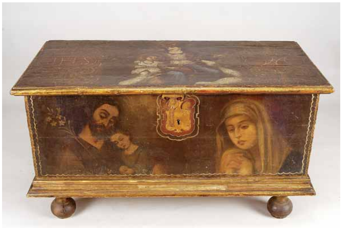
824 ARCA, madeira, revestimento em tela pintada "Nossa Senhora Pastora", "São José com o Menino" e "Nossa Senhora", simbologia mariana "AM" e Jesuíta "IHS", portuguesa, séc. XVII, pequenos defeitos Dim. - 70 x 129 x 61 cm