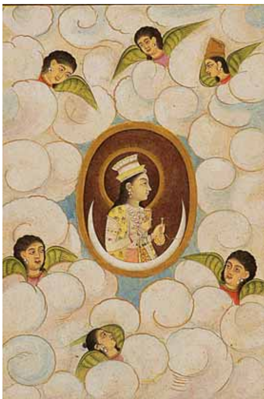
758 "FIGURA FEMININA RODEADA POR QUERUBINS", iluminura sobre papel, Índia Mogol, séc. XVII Dim. - 18 x 13 cm