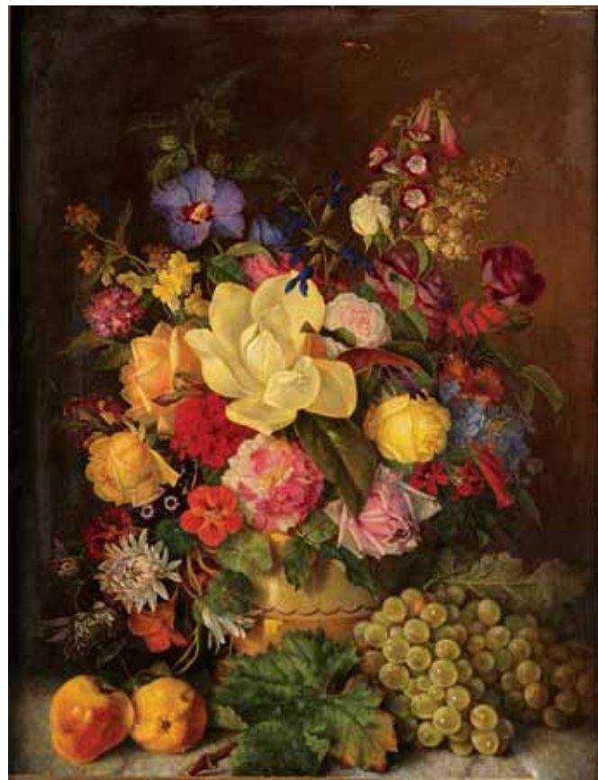
736 "NATUREZA MORTA - JARRA COM FLORES", óleo sobre tela, escola europeia, séc. XIX Dim. - 71 x 55 cm