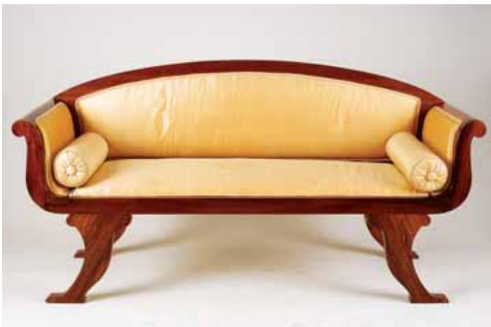
798 CANAPÉ , pau santo, estofado a tecido cor de salmão, Europa, séc. XIX, aro das costas em mogno, pequenos defeitos Dim. - 90 x 178 x 55 cm €600 - 900