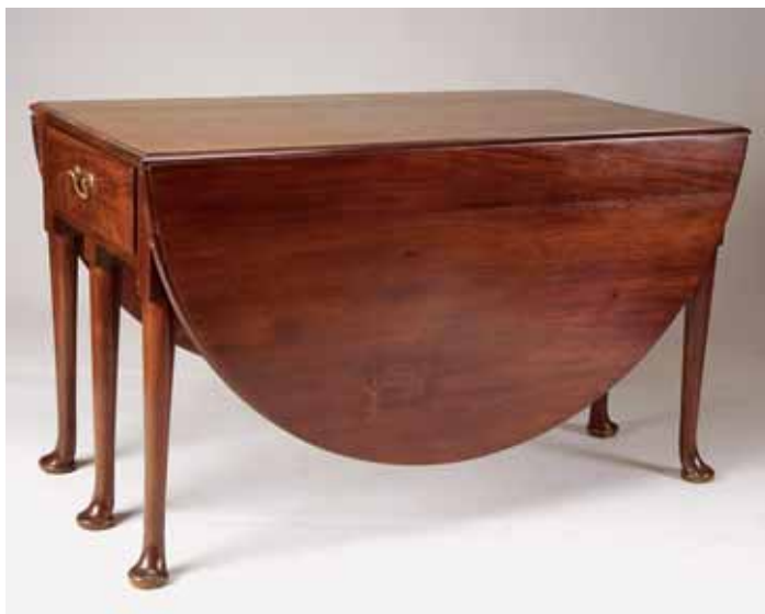
832 MESA DE ABAS COM SEIS PÉS, D. João V/D. José, vinhático, pés de "Bolacha", ferragens em metal amarelo, portuguesa, séc. XVIII, pequenos defeitos Dim. - 76 x 126 x 65 cm €1.200 - 1.800