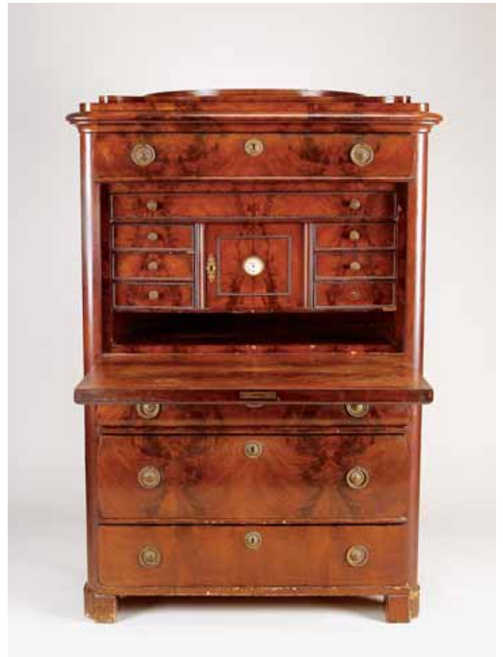
803 SECRETÁRIA "À ABATTANT" , estilo Biedermeier, mogno e raiz de mogno, interior com gavetas, gaveta central com relógio, ferragens em metal amarelo, Europa, séc. XIX, faltas e defeitos Dim. - 158 x 106 x 56 cm €1.200 - 1.800