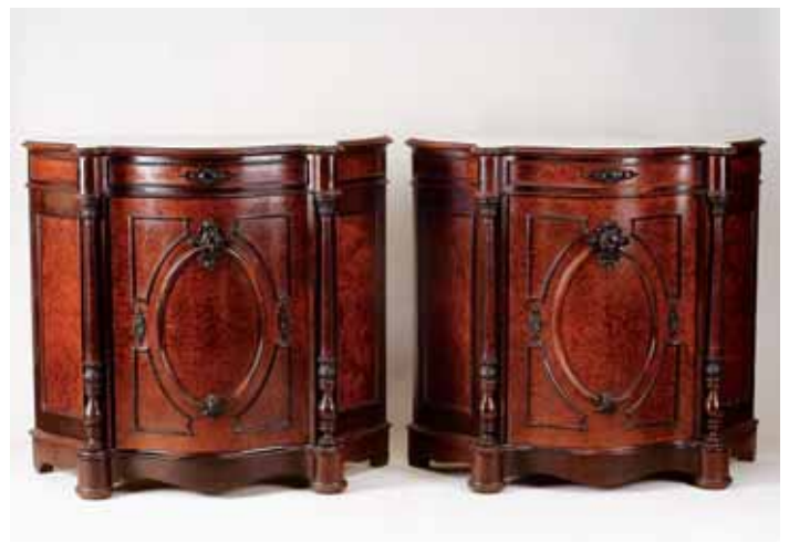
663 PAR DE ARMÁRIOS, Napoleão III, pau santo e raiz de nogueira com entalhamentos, tampos de mármore, franceses, séc. XIX, pequenas faltas e defeitos Dim. - 101 x 110 x 40 cm