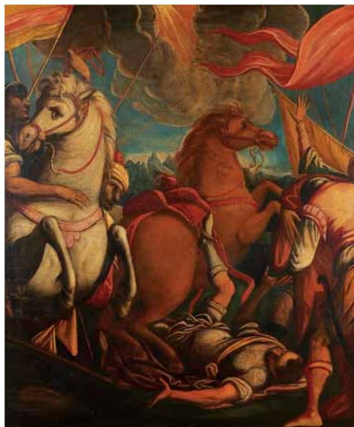
748 "BATALHA DE CAVALARIA", óleo sobre tela, escola italiana, séc. XVIII, pequenos restauros Dim. - 123 x 102 cm