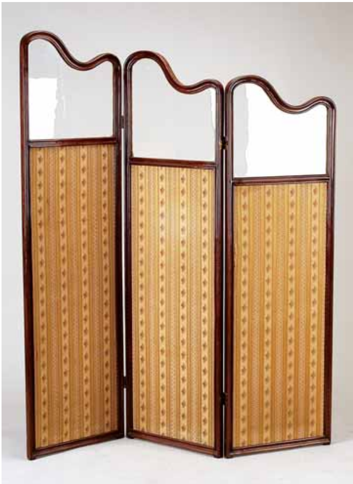
660 BIOMBO DE TRÊS FOLHAS, mogno, interior das folhas em vidro e tecido, inglês, séc. XX (1ª metade), pequenos defeitos Dim. - 170 x 48 cm (folha maior)