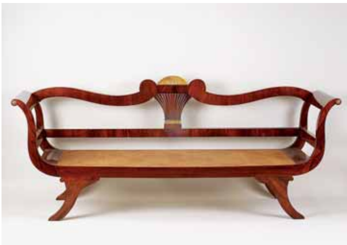
661 CANAPÉ, mogno e raiz de mogno, entalhamentos dourados, assento de palhinha, português, séc. XIX, pequenos defeitos Dim. - 90 x 220 x 61 cm