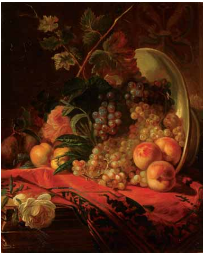
734 "NATUREZA MORTA - FRUTOS", óleo sobre tela, escola francesa, séc. XIX Dim. - 74 x 60 cm