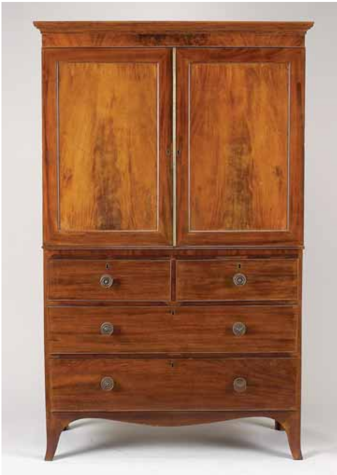
815 CÓMODA COM ALÇADO CAMISEIRO, estilo Jorge III, mogno e raiz de mogno, puxadores em metal, inglesa, séc. XIX, pequenas faltas e defeitos Dim. - 183 x 113 x 50 cm € 600 - 900