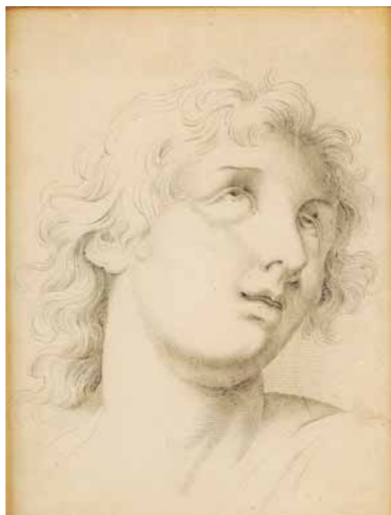
761 "CABEÇA MASCULINA", lápis sobre papel, Europa, séc. XVIII/XIX Dim. - 24,5 x 19,5 cm