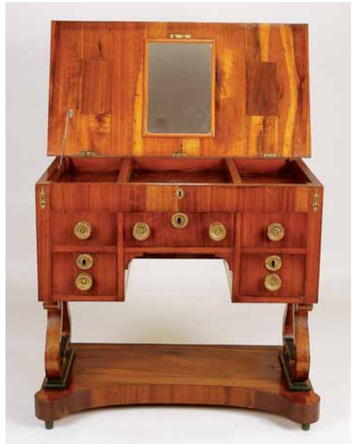
839 TOUCADOR, ao gosto Império, vinhático, pernas com "Liras", ferragens em metal amarelo, português, séc. XIX, restauros, pequenos defeitos Dim. - 89 x 97 x 52 cm € 1.250 - 1.875