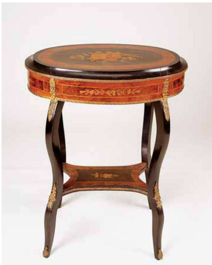
819 GUÉRIDON OVAL , Napoleão III, marchetaria de raiz de noqueira, madeira pintada de negro e outras madeiras "Flores", aplicações em metal dourado, francesa, séc. XIX, pequenos defeitos; Dim. - 75 x 56 x 39 cm € 250 - 375