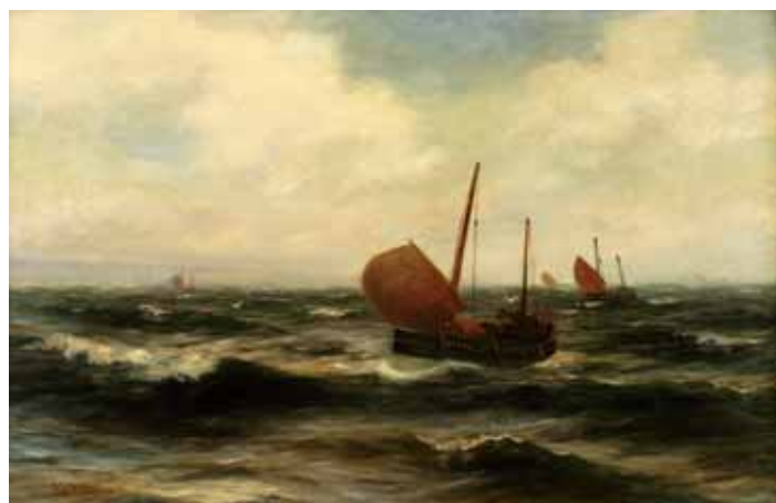
745 H. S. HENSLEN - SÉC. XIX, "MARINHA", óleo sobre tela, assinado Dim. - 77 x 120 cm