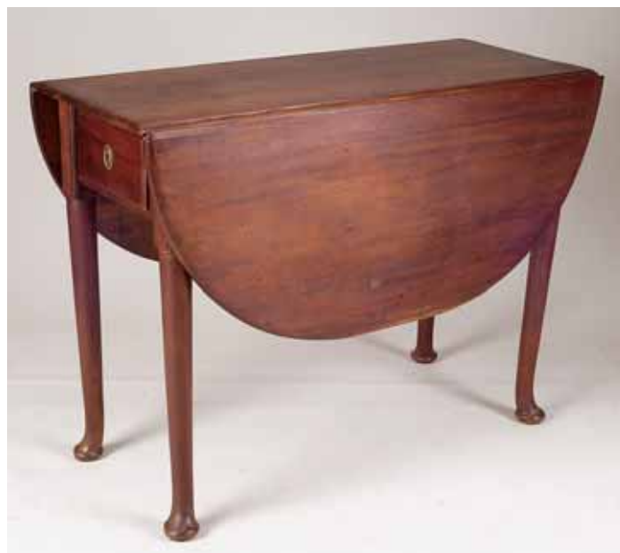
835 MESA DE ABAS COM GAVETAS, mogno, abas redondas, pé "Queen Anne", inglesa, séc. XVIII, restauros, pequenos defeitos Dim. - 80 x 106 x 46 cm €600 - 900