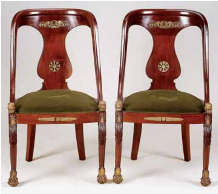
652 PAR DE CADEIRAS, ao gosto Império, mogno, aplicações em metal "Cabeças de animais fantásticos, pés zoomórficos e rosetas", francesas, séc. XIX/XX, pequenas faltas e defeitos Dim. - 95 x 54 x 58 cm € 400 - 600