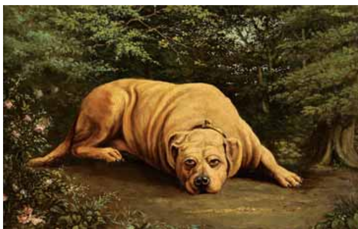
731 "CÃO", óleo sobre cartão, escola francesa, séc. XIX, pequenos restauros Dim. - 26 x 41 cm