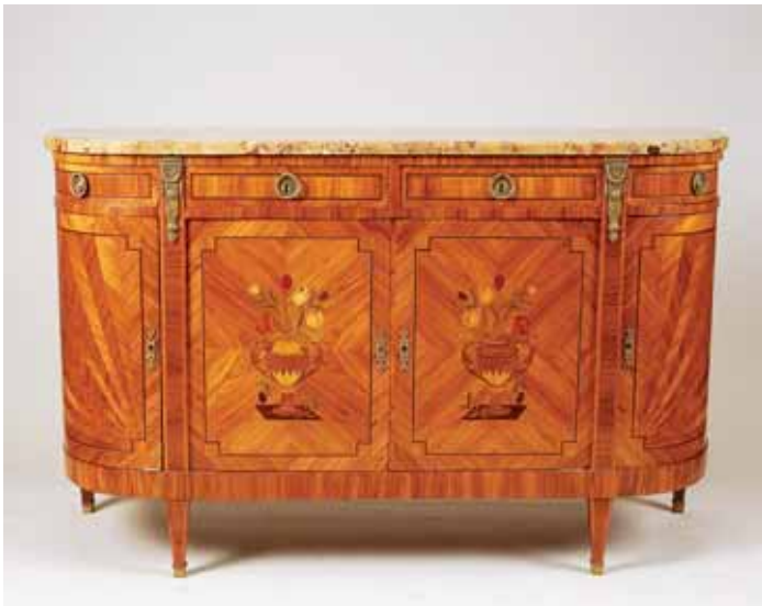
838 APARADOR, estilo Luís XVI, marchetaria de raiz de pau rosa, pau cetim, mogno e outras madeiras "Vasos com flores", aplicações em bronze, tampo de mármore, francês, séc. XIX/XX, pequenos defeitos; Dim. - 103 x 166 x 53 cm € 2.500 - 3.750