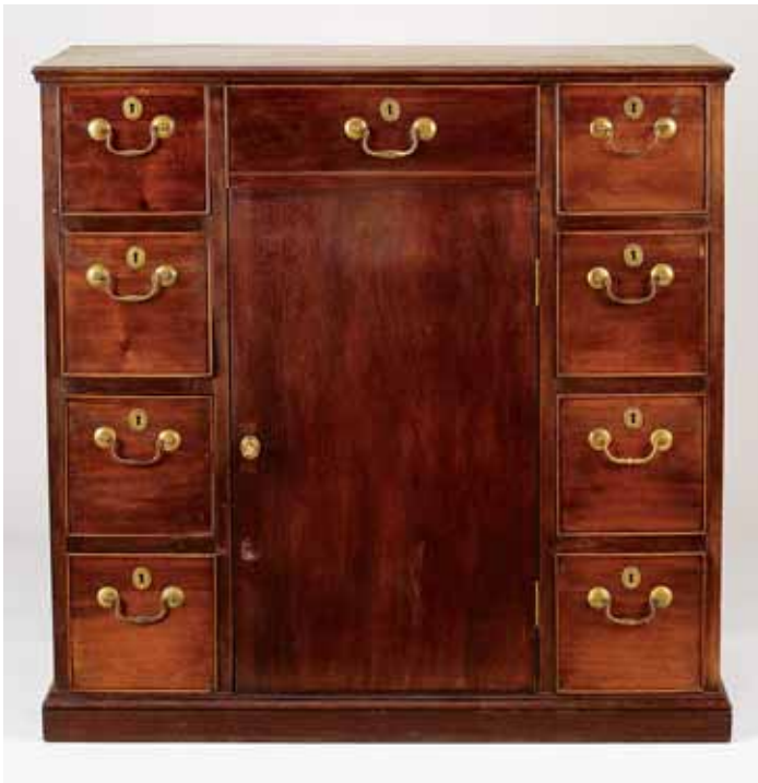
826 MÓVEL COM GAVETAS E PORTA, estilo Jorge III, mogno, puxadores em metal amarelo, inglês, séc. XIX, pequenos defeitos Dim. - 96 x 96 x 46 cm € 300 - 450