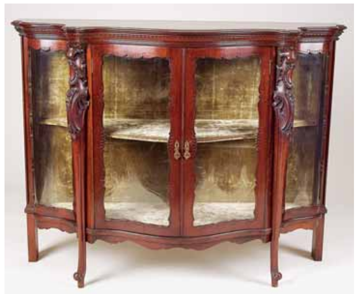
818 VITRINE, victoriana, mogno com entalhamentos, portas e laterais com vidros moldados, inglesa, séc. XIX, pequenos defeitos Dim. - 100 x 130 x 45 cm € 1.500 - 2.250