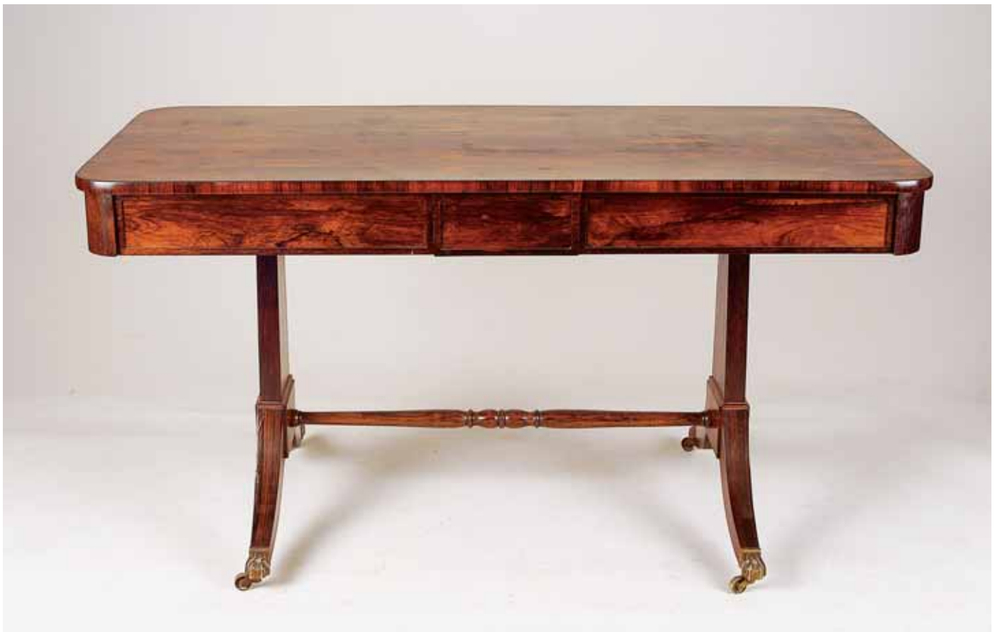
823 SOFA TABLE, madeira folheada a raiz de pau santo, pés zoomórficos em bronze,

inglesa, séc. XIX, restauros, pequenos defeitos Dim. - 73 x 137 x 64,5 cm