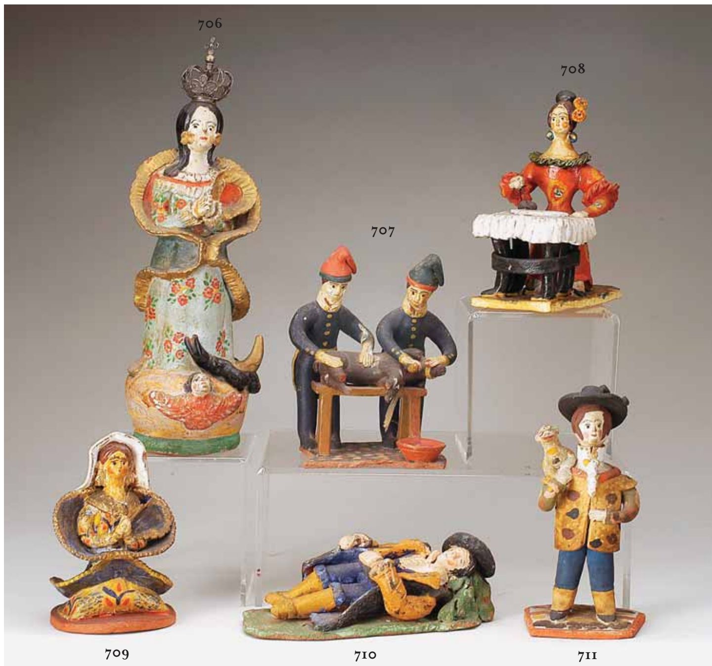
706 "NOSSA SENHORA DA CONCEIÇÃO" , escultura em barro policromado, Estremoz, séc. XIX, coroa em filigrana de prata, falta de um lado do crescente Dim. - 25,5 cm € 500 - 750