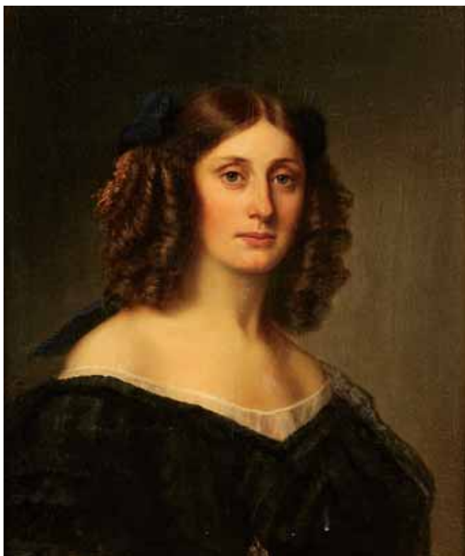
754 "RETRATO DE SENHORA", óleo sobre tela, escola inglesa, séc. XIX Dim. - 65 x 54 cm