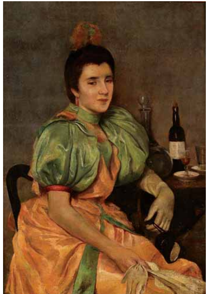
740 GARCIA Y GAMOS - SÉC. XIX/XX, "SENHORA À MESA",

óleo sobre tela, reentelado e restaurado, assinado