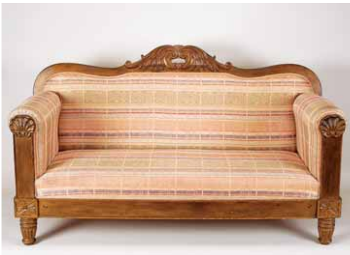
816 CANAPÉ, romântico, mogno com entalhamentos, restos de dourado, estofado, português, séc. XIX, faltas e defeitos, estofado não original Dim. - 107 x 188 x 73 cm € 500 - 750