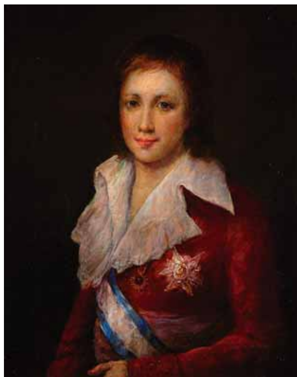
757 "RETRATO DE RAPAZ", óleo sobre tela, escola europeia, séc. XIX Dim. - 40,5 x 31 cm