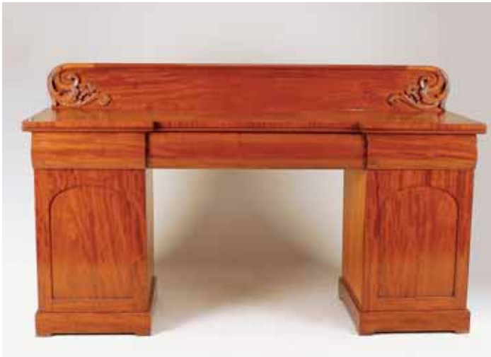
802 SIDEBORD , victoriano, mogno e raiz de mogno, pequeno alçado com entalhamentos, inglês, séc. XIX, pequenos defeitos Dim. - 113 x 189 x 59 cm €2.500 - 3.750