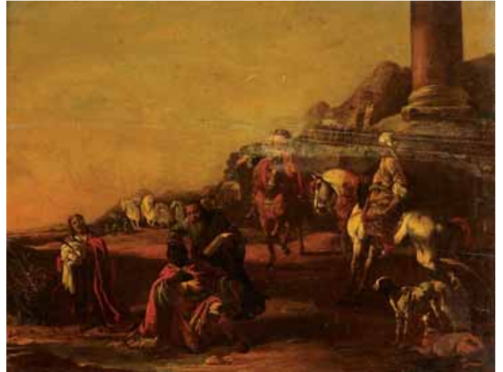
752 "PAISAGEM - FIGURAS E ANIMAIS PERTO DE RUÍNAS" , óleo sobre madeira, escola francesa, séc. XVII, defeito na madeira, pequenos defeitos, selo da "Galerie Pedre Daupias" no verso Dim. - 39 x 52 cm