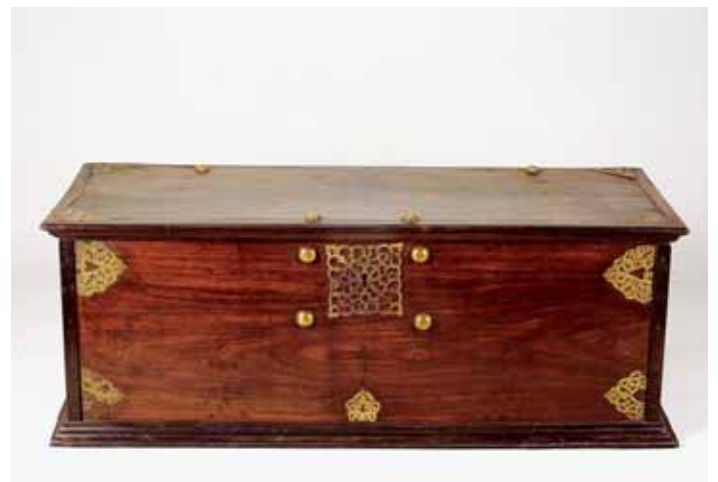
655 ARCA, teca, frisos e guarnições em sissó, ferragens em bronze, Índia, séc. XIX, pequenos restauros, pequenas faltas e defeitos Dim. - 50 x 135 x 55 cm € 1.000 - 1.500