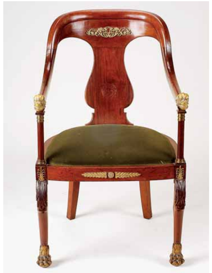
654 CADEIRA DE BRAÇOS, ao gosto Império, mogno, aplicações em metal "Cabeças de animais fantásticos, pés zoomórficos e rosetas", francesas, séc. XIX/XX, falta de uma "Roseta", pequenas faltas e defeitos Dim. - 95 x 57 x 61 cm € 300 - 450