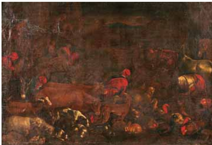
743 "FAMÍLIA DE NOÉ FAZENDO ENTRAR OS ANIMAIS PARA A ARCA", óleo sobre tela, escola italiana, séc. XVII, muito mau estado Dim. - 104 x 150 cm