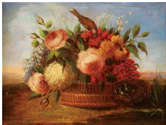
737 "NATUREZA MORTA - FLORES", óleo sobre tela, escola francesa, séc. XIX Dim. - 41 x 55 cm