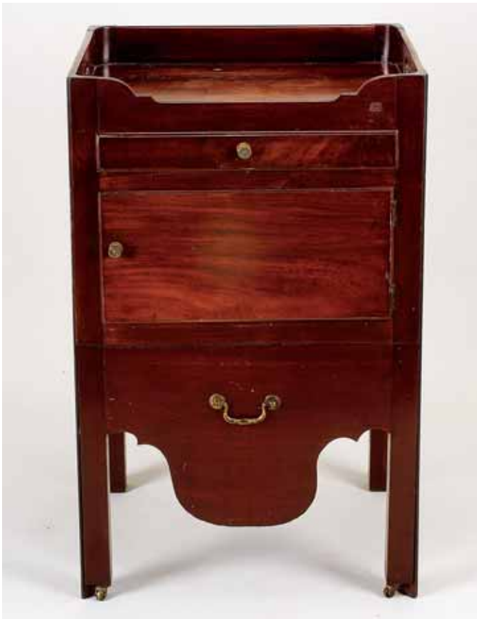
837 MESA DE CABECEIRA, estilo Jorge III, mogno, ferragens em metal amarelo, pernas frontais com rodízios, inglesa, pequenas faltas Dim. - 86 x 54 x 48 cm € 800 - 1.200