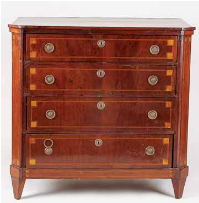
653 CÓMODA, Jorge III, mogno e raiz de mogno, embutidos e filetes em pau cetim, inglesa, séc. XVIII/XIX, restauros, pequenas faltas e defeitos Dim. - 100 x 104 x 53 cm € 1.000 - 1.500