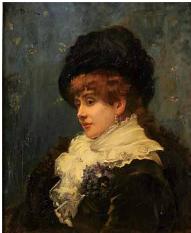
756 "RETRATO DE SENHORA", óleo sobre tela, escola europeia, assinatura não identificada Dim. - 46,5 x 38,5 cm