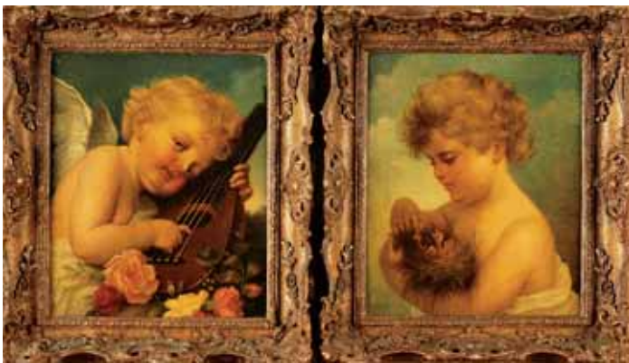
739 "AMORES", par de óleos sobre tela, escola francesa, séc. XIX, reentelados, pequenos defeitos