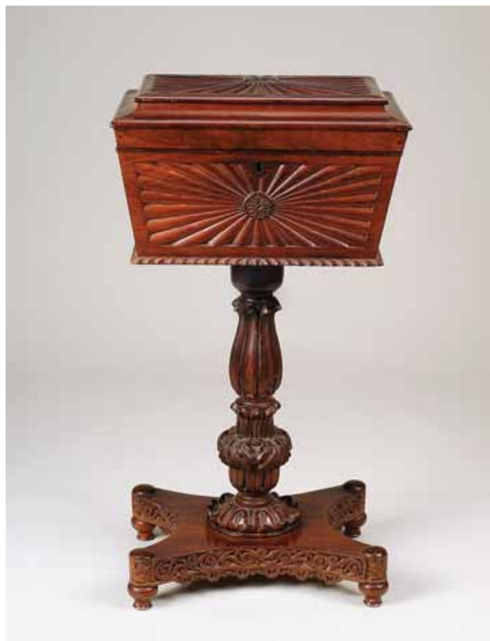
634 CAIXA DE CHÁ , Guilherme IV, sissó com entalhamentos, coluna central entalhada com quatro pés, recipiente em zinco, anglo-indiana, séc. XIX, pequenos defeitos Dim. - 86 x 46 x 31,5 cm € 600 - 900