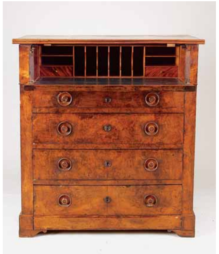
817 CÓMODA COM GAVETA SECRETÁRIA, nogueira e raiz de noqueira, interior da gaveta com gavetas e escaninhos, inglesa, séc. XIX, pequenos defeitos Dim. - 105 x 95 x 51,5 cm € 1.000 - 1.500