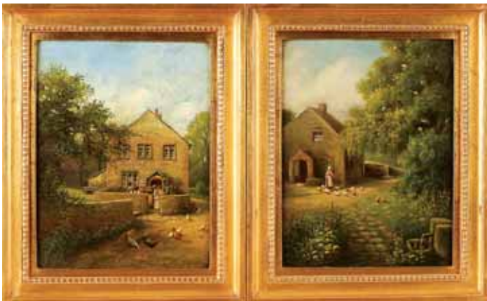
751 "CASAS RURAIS COM FIGURAS E GALINHAS" , par de óleos sobre cartão, escola inglesa, séc. XIX, assinaturas não identificadas Dim. - 30 x 22,5 cm