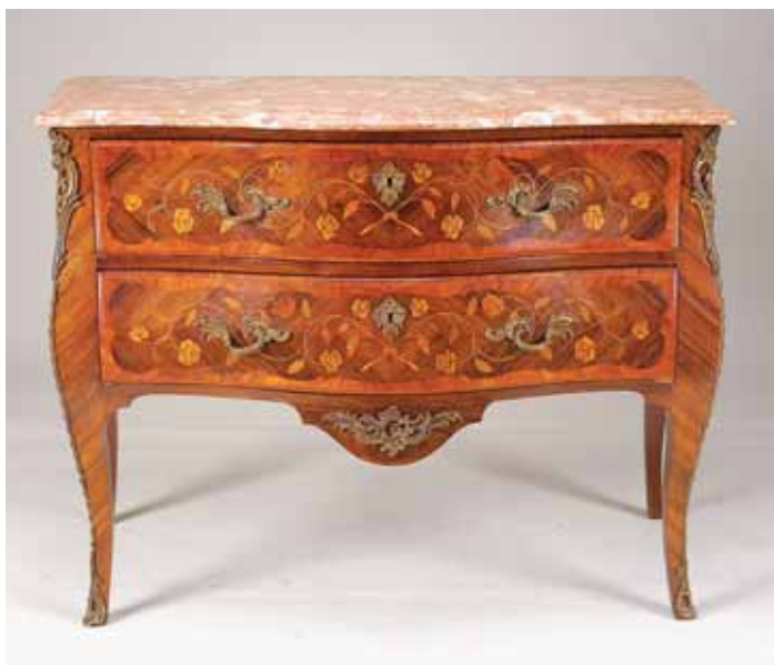
820 CÓMODA , estilo Luís XV/Luís XVI, marchetaria de pau santo, mogno e outras madeiras "Flores", ferragens e aplicações em bronze, tampo em mármore, portuguesa, séc. XX, pequenos defeitos; Dim. - 86 x 113 x 56 cm € 1.300 - 1.950