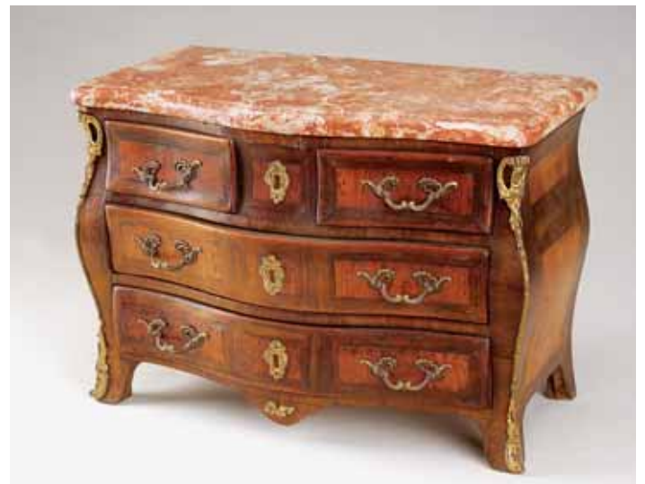
800 CÓMODA DE PEQUENAS DIMENSÕES , estilo Luís XV, carvalho, marchetaria de pau santo e outras madeiras, ferragens em metal amarelo, tampo em mármore rosa, francesa, séc. XIX/XX, pequenos defeitos; Dim. - 30,5 x 43 x 23 cm €1.500 - 2.250