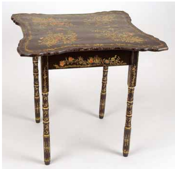
834 MESA DE JOGO, D. Maria, madeira lacada de verde com dourados "Flores", pernas simulando "Bambu", portuguesa, séc. XVIII/XIX, alterada com tampo fixado, pernas não originais, tampo invertido, faltas e defeitos; D. - 77 x 80 x 80 cm €700 - 1.050