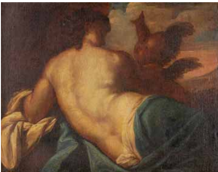
735 "VÊNUS E CUPIDO", óleo sobre tela, escola italiana, séc. XVII/XVIII, reentelado e restaurado atribuível ao círculo de Pietro Liberi - 1605-1687 Dim. - 61 x 80 cm