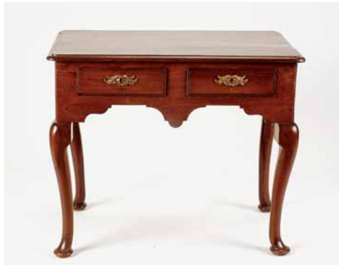
635 MESA COM DUAS GAVETAS , Jorge II, mogno, pés de "Bolacha", ferragens em bronze dourado, portuguesa, séc. XVIII, ferragens não originais, pequenos defeitos Dim. - 66,5 x 79 x 51 cm € 750 - 1.125