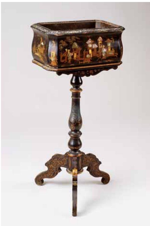
632 FLOREIRA COM PÉ DE GALO , madeira lacada a negro com dourados "Figuras orientais", incrustações de madrepérola, recipiente em cobre, séc. XIX, pequenas faltas e defeitos Dim. - 82 x 37 x 28 cm € 400 - 600