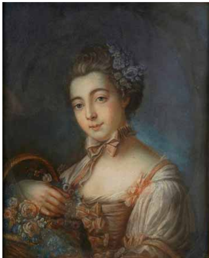
744 "RETRATO DE SENHORA", pastel sobre papel, escola francesa, séc. XIX, assinatura não identificada Dim. - 57 x 46 cm