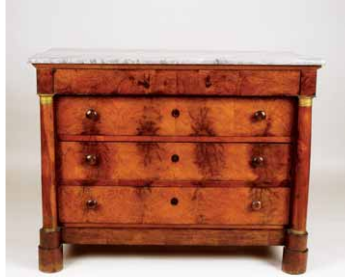
840 CÓMODA, Império, mogno e raiz de mogno, aplicações em bronze dourado, tampo de mármore, francesa, séc. XIX, pequenos defeitos Dim. - 95 x 123 x 66 cm € 800 - 1.200