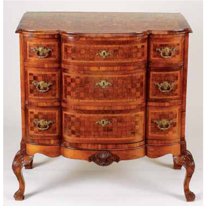
828 CÓMODA, estilo rocaille, marchetaria de pau santo e outras madeiras "Parquet", Europa, séc. XIX/XX, pequenos defeitos Dim. - 83 x 58 x 88 cm € 3.000 - 4.500