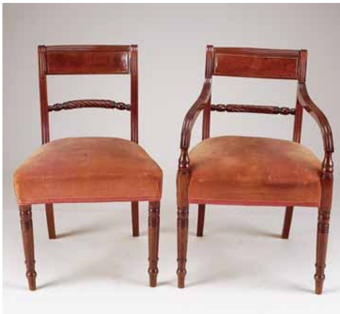
831 CONJUNTO DE VINTE CADEIRAS (SENDO DUAS DE BRAÇOS), mogno, costas com entalhamento "Rolo" e filete em metal, assentos estofados, inglesas, séc. XIX/XX, pequenos defeitos Dim. - 81 x 58 x 52 cm €7.000 - 10.500