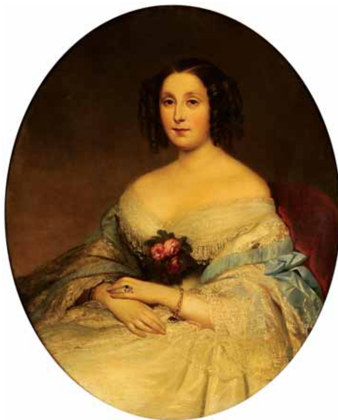
732 "RETRATO DE SENHORA", óleo sobre tela oval, escola alemã, séc. XIX, tabela atribuindo a Winterhalter (1806-1873) Dim. - 99 x 81 cm