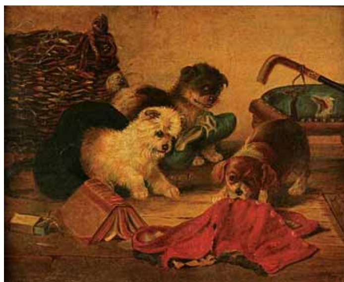
733 "CÃES BRINCANDO", óleo sobre tela, escola inglesa, séc. XIX Dim. - 25,5 x 31,5 cm