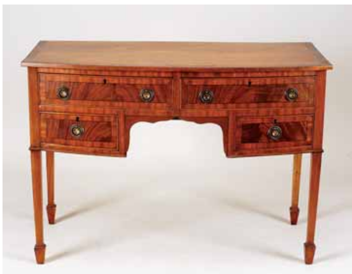
633 SIDEBBOARD , estilo Jorge III, mogno e raiz de mogno com filetes, ferragens em metal amarelo, inglês, séc. XIX/XX, pequenos defeitos Dim. - 76 x 107,5 x 55 cm € 500 - 750