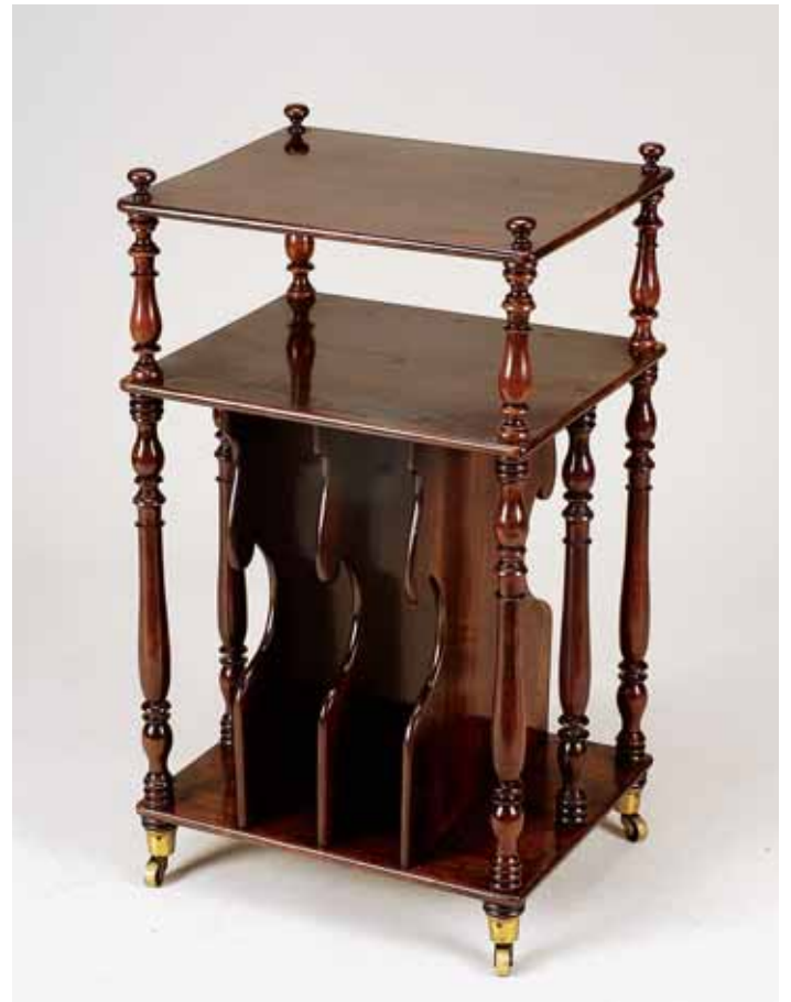
630 PORTA REVISTAS, pau santo, colunas torneadas, pés em metal amarelo com rodízios, inglês, séc. XIX/XX, pequenos defeitos Dim. - 68 x 39 x 32 cm 550 - 825