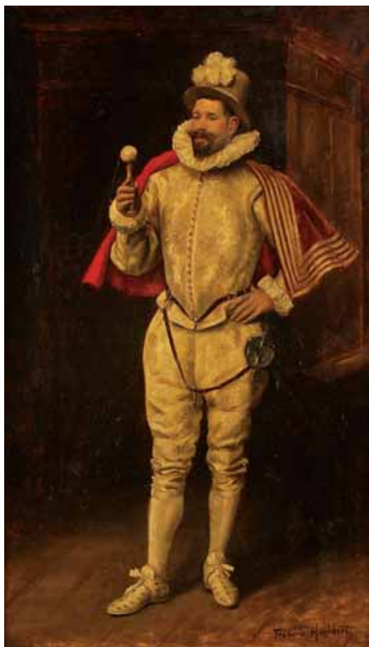
730 FRÉDÉRIC HUMBERT - SÉC. XIX/XX, "FIGURA MASCULINA", óleo sobre madeira, assinado Dim. - 55 x 33 cm