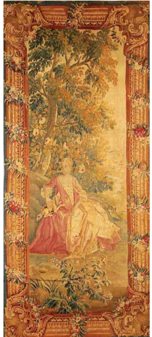
874 "PAISAGEM COM SENHORA E CÃO DE COMPANHIA", tapeçaria de Aubusson, fio de lã, decoração policromada, francesa, séc. XVIII, restaurada nas oficinas de restauro da FRESS Dim. - 283 x 125 cm € 2.000 - 3.000