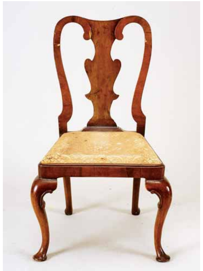
662 CONJUNTO DE SEIS CADEIRAS, estilo Jorge I, nogueira e raiz de nogueira, assentos estofados, inglesas, séc. XIX, faltas e defeitos Dim. - 57 x 50 x 97 cm