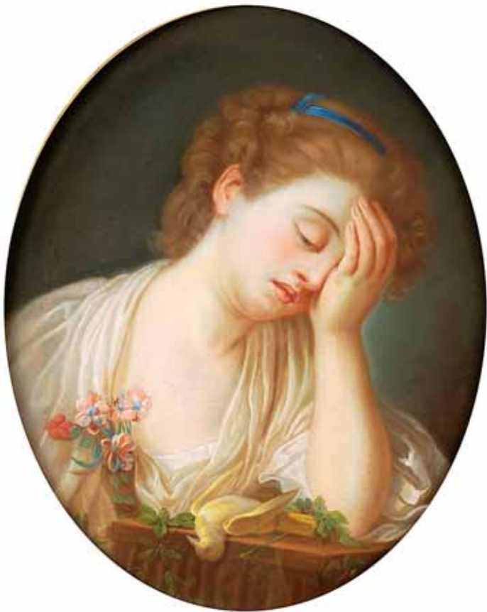
742 "CHORANDO O PÁSSARO MORTO", pastel sobre papel oval, escola francesa, séc. XIX Dim. - 49 x 40 cm