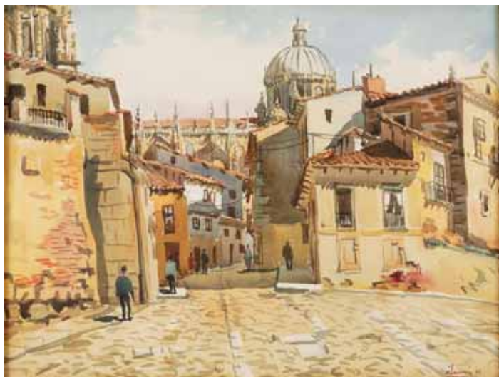
759 VILARROIA - SÉC. XX, "TRECHO DE CIDADE COM FIGURAS", aguarela sobre papel, assinada e datada de 1960 Dim. - 40 x 51 cm