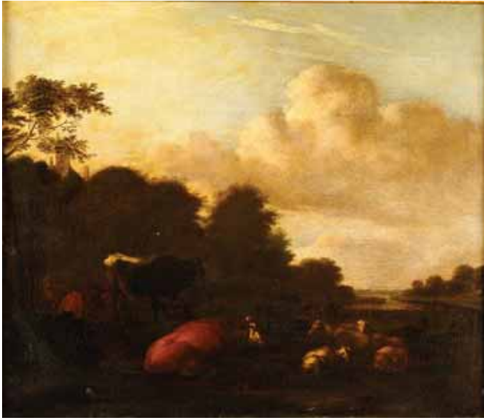
750 "PAISAGEM COM GADO" , óleo sobre tela, escola holandesa, séc. XVIII, reentelado, pequenos restauros, tabela atribuindo a Albert Jansen Klomp Dim. - 48,5 x 57 cm