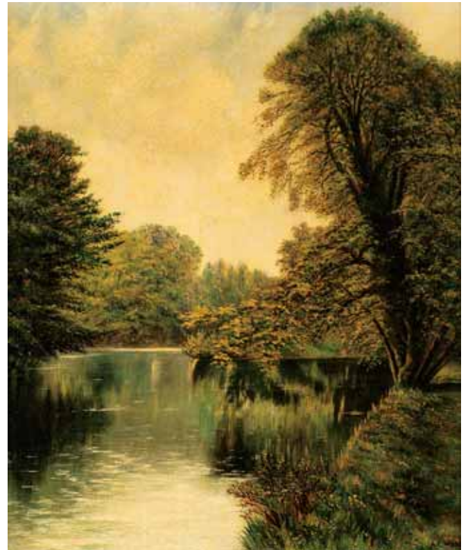
753 A. C. WOOD - SÉC. XIX, "PAISAGEM - LAGO" , óleo sobre tela, reentelado e restaurado, assinado Dim. - 66 x 56 cm