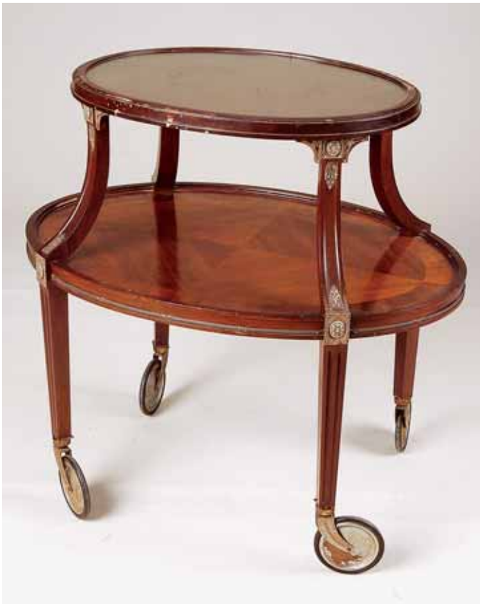
797 CARRINHO DE CHÁ COM DOIS TAMPOS , mogno e raiz de mogno, aplicações em prata, marca de ourives LEITÃO & IRMÃO (Vidal - 635), portuguesa, séc. XX, pequenos defeitos Dim. - 78 x 78 x 57 cm €1.000 - 1.500