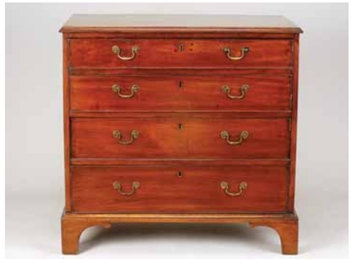
631 CÔMODA, Jorge III, mogno, ferragens em metal amarelo, inglesa, séc. XIX (1º quartel), pequenos defeitos Dim. - 92 x 94 x 51 cm €600 - 900