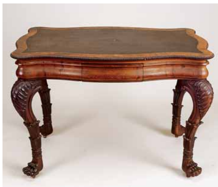
822 SECRETÁRIA , romântica, mogno e raiz de mogno, duas gavetas com divisórias, tampo forrado a couro, pé zoomórficos com rodízios, portuguesa, séc. XIX, defeitos Dim. - 70 x 98 x 60 cm € 500 - 750