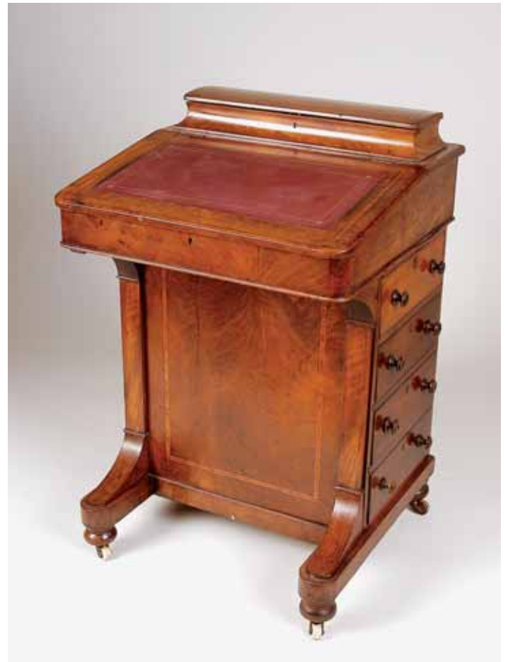
799 SECRETÁRIA DAVENPORT , victoriana, nogueira e raiz de nogueira, faixa em pau rosa, pés com rodízios, inglesa, séc. XIX, pequenas faltas e defeitos Dim. - 85 x 56 x 54 cm €800 - 1.200