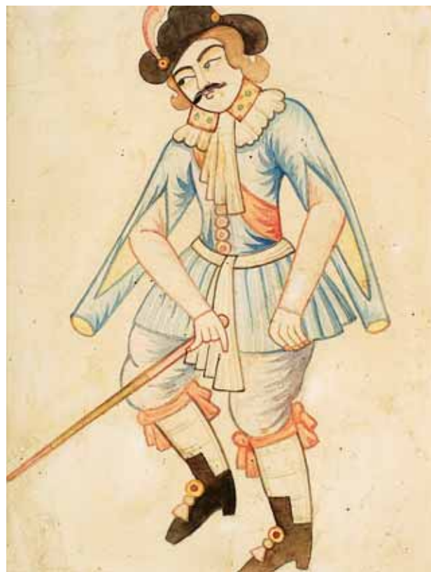
760 "FIDALGO EUROPEU", aguarela sobre papel colado noutro papel, Pérsia, séc. XVIII Dim. - 22,5 x 17,5 cm