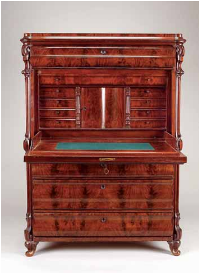
801 SECRETÁRIA "À ABATTANT" , romântica, mogno e raiz de mogno, interior com gavetas, estirador com feltro, divisória para canetas e tinteiros, Europa, séc. XIX, pequenos defeitos; Dim. - 147 x 105 x 60 cm €1.500 - 2.250