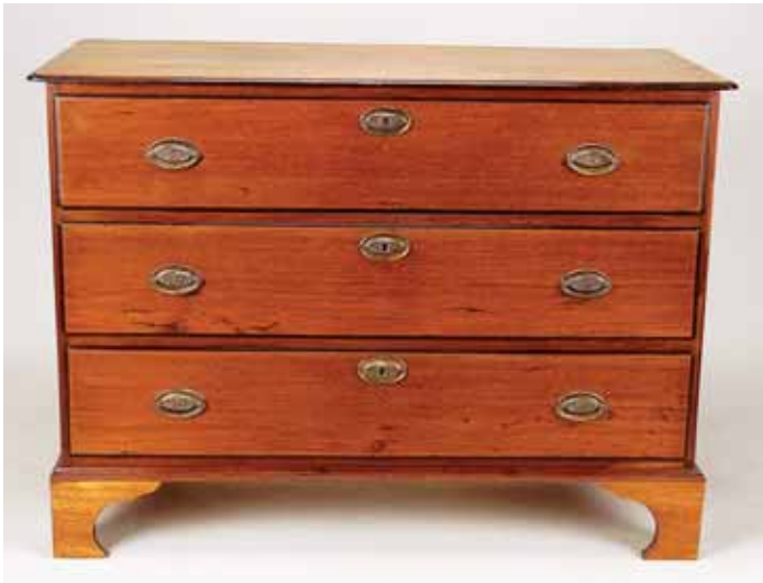
329 CÓMODA, D. Maria, vinhático, ferragens em metal amarelo, portuguesa, séc. XVIII/XIX, pequenos restauros, pequenos defeitos Dim. - 88 x 120 x 54,5 cm