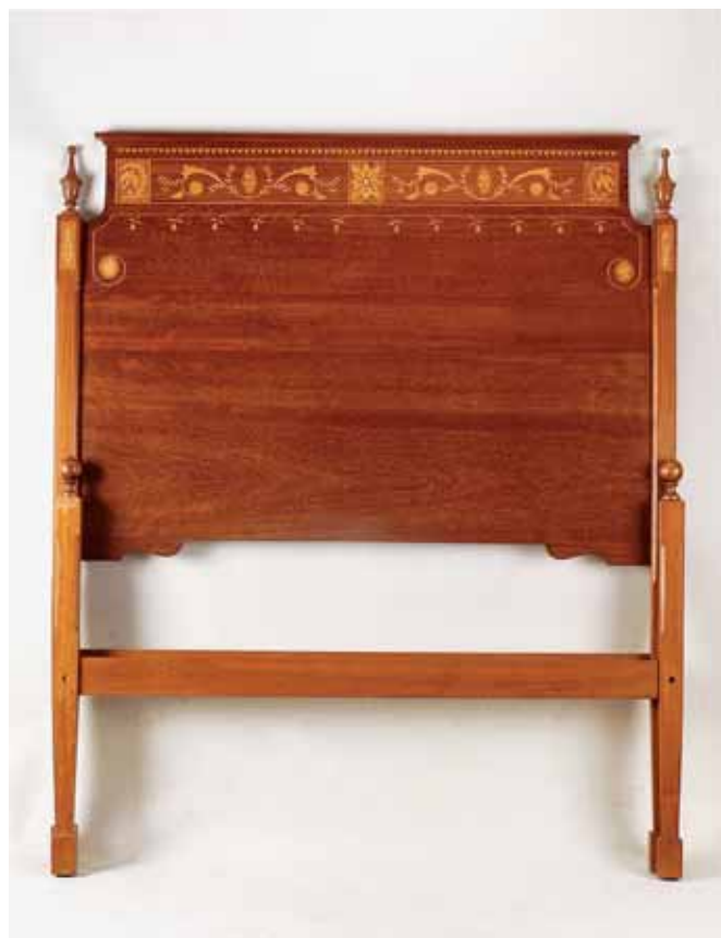
544 CAMA DE CASAL, estilo D. Maria, mogno, friso com embutidos em pau cetim "Flores e pássaros", portuguesa, séc. XX, pequenos defeitos Dim. - 166 x 208 x 140 cm