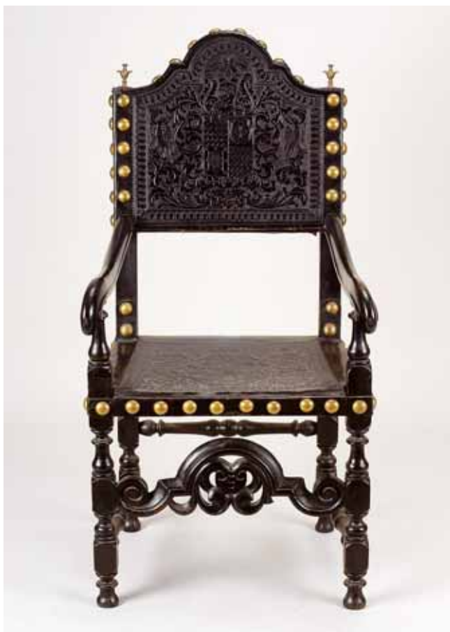
354 CADEIRA, castanho escurecido com entalhamentos, assento e costas em couro lavrado "Armas de família portuguesa" com pregaria, portuguesa, séc. XIX, pequenos defeitos Dim. - 115,5 x 59 x 54 cm € 350 - 525