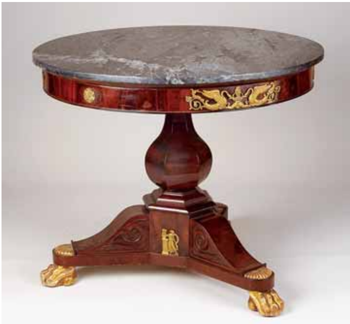
341 MESA REDONDA, ao gosto Império, mogno e raiz de mogno, pés zoomórficos em madeira entalhada e dourada, aplicações em bronze dourado, tampo de mármore, portuguesa, séc. XIX, pequenas faltas e defeitos Dim. - 77 x 92,5 cm