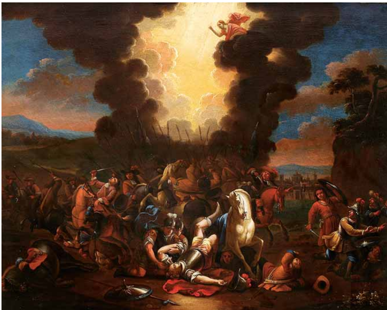
491 HONDIUS - SÉC. XVII, "CONVERSÃO DE SÃO PAULO NA ESTRADA DE DAMASCO", óleo sobre madeira, restaurado, assinado Dim. - 61 x 77 cm € 5.000 - 7.500