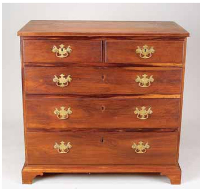
361 CÔMODA, estilo D. Maria, mogno com filetes, ferragens em metal amarelo, portuguesa, séc. XIX, pequenas faltas e defeitos Dim. - 99 x 101 x 54,5 cm €550 - 825