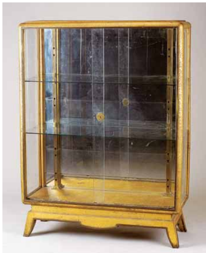
521 VITRINE EXPOSITORA , Art Déco, madeira dourada e vidros bizoté, fundo com espelho, prateleiras em vidro, Europa, séc. XX, pequenos defeitos Dim. - 149 x 111 x 40 cm € 500 - 750