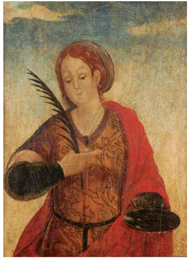
489 "SANTA LUZIA", pintura a têmpera sobre madeira, escola portuguesa, séc. XV/XVI, faltas na pintura Dim. - 61 x 45 cm