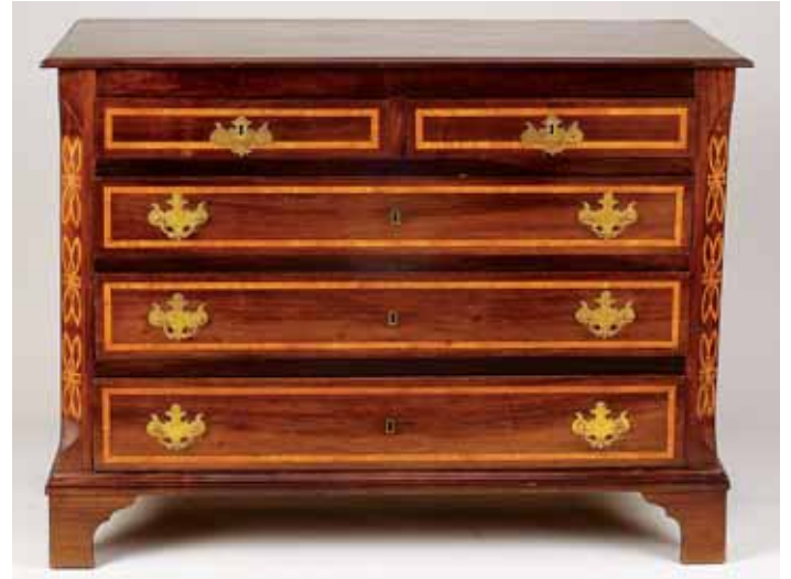
331 CÓMODA, estilo neoclássico, pau santo e outras madeiras exóticas, filetes em pau cetim "Laços", Europa, séc. XIX, pequenos defeitos Dim. - 77 x 102 x 51 cm