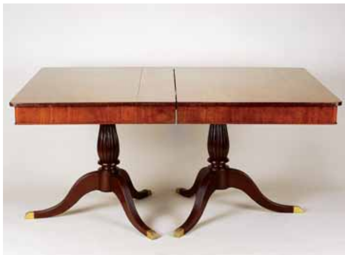
543 MESA DE CASA DE JANTAR, mogno, dois pés de galo canelados, pés em metal amarelo, duas tábuas de extensão, portuguesa, séc. XX, pequenos defeitos Dim. - 75 x 232 x 115 cm (total)