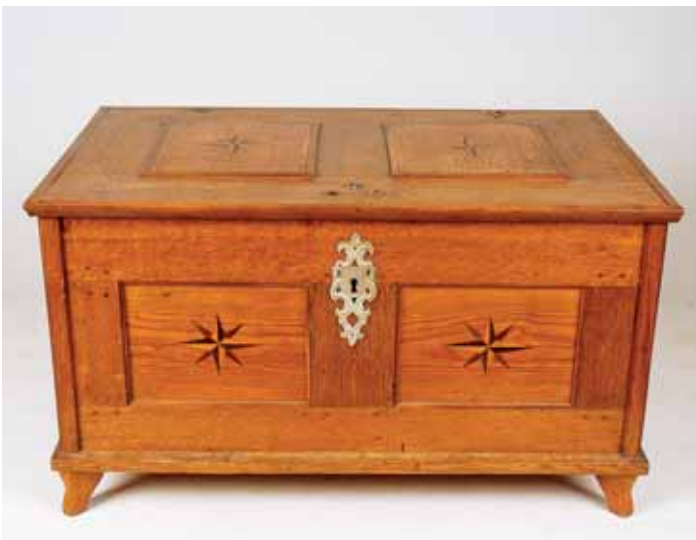
547 ARCA, carvalho e espinheiro, embutidos em pau santo e espinheiro "Rosa dos Ventos", ferragens em ferro estanhado, Europa Central, séc. XIX, pequenos defeitos Dim. - 60 x 106 x 63 cm € 500 - 750