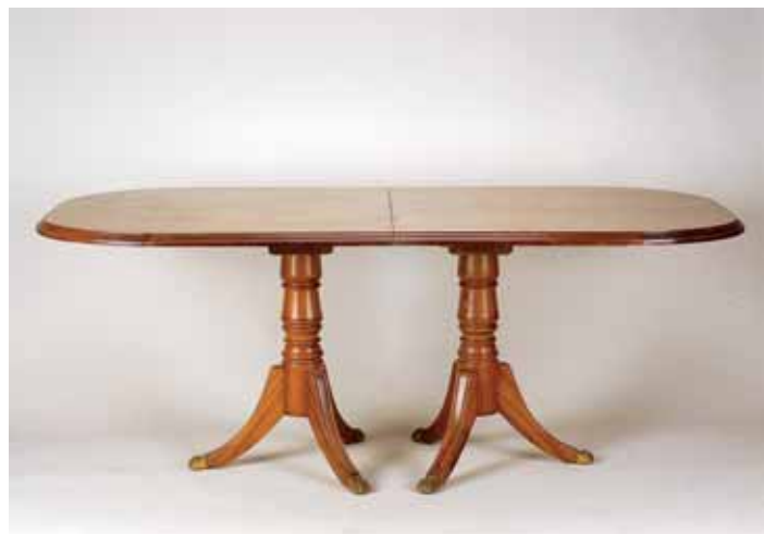
545 MESA DE CASA DE JANTAR, madeira folheada a mogno com faixa em pau rosa, dois pés de galo com pés zoomórficos em bronze, portuguesa, séc. XX, pequenos defeitos Dim. - 78 x 244 x 102 cm (total)