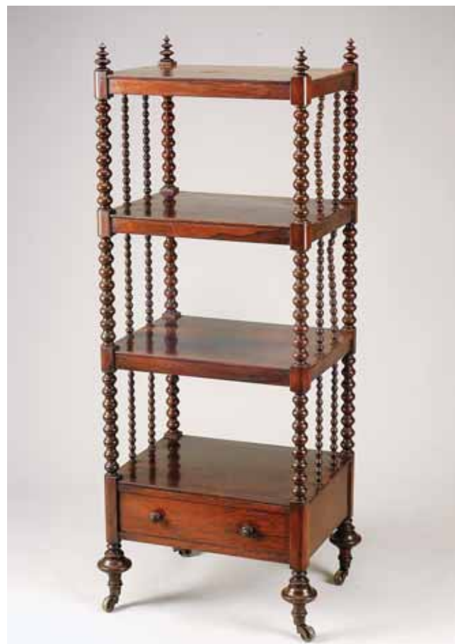
356 ÉTAGERE COM GAVETA, romântica, pau santo, colunas torneadas, pés com rodízios, portuguesa, séc. XIX/XX, pequenos defeitos Dim. - 130 x 52 x 42 cm € 650 - 975