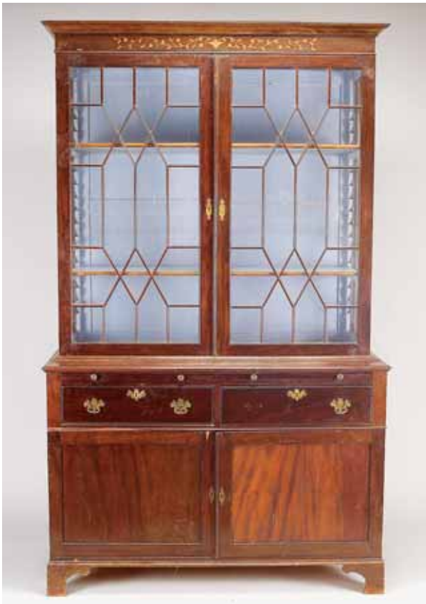
523 ARMÁRIO LOUCEIRO, D. Maria, vinhático, cimalha com embutidos, corpo superior com portas e laterais com vidrinhos, português, séc. XVIII/XIX, falta de um vidro, defeitos Dim. - 225 x 136 x 59 cm €1.500 - 2.250