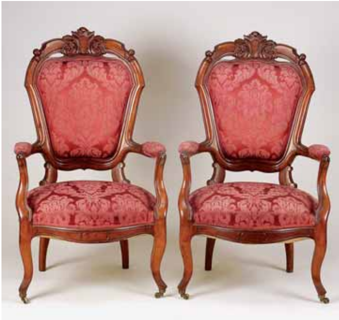
340 PAR DE CADEIRÕES DE BRAÇOS, românticos, mogno com entalhamentos, assentos e costas estofados a damasco, pés frontais com rodízios, portugueses, séc. XIX, pequenos defeitos Dim. - 111 x 65 x 71 cm