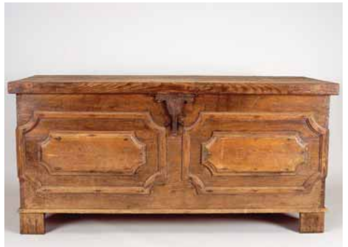
549 ARCA, castanho, tampo em sicupira, frente e laterais com almofadas e frisos moldados, ferragens em ferro, portuguesa, séc. XVII, faltas e defeitos Dim. - 82 x 170 x 68 cm € 350 - 525