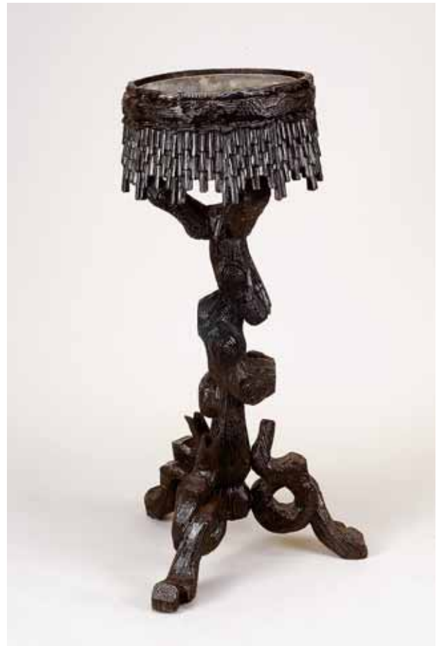
330 FLOREIRA, "Floresta Negra", madeira entalhada e escurecida, recipiente em zinco, alemã, séc. XIX, pequenos defeitos Dim. - 95,5 cm