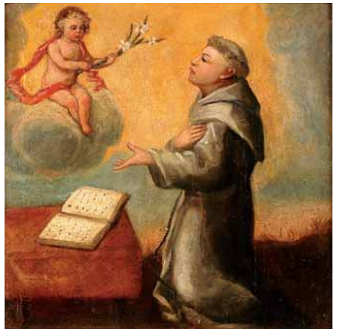
496 "SANTO ANTÓNIO ADORANDO O MENINO", óleo sobre madeira, escola portuguesa, séc. XVIII/XIX, restauros Dim. - 37 x 37,5 cm € 700 - 1.050