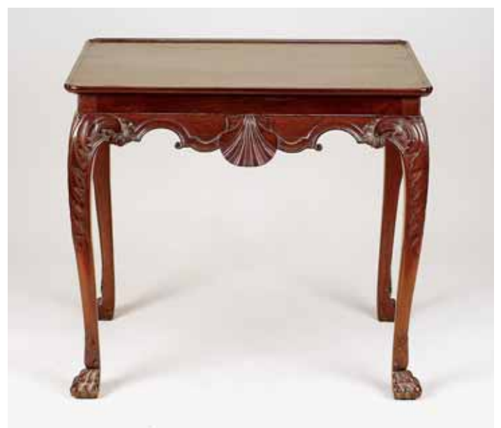
335 MESA DE CENTRO , estilo Jorge II, mogno, laterais e pernas com entalhamentos, inglesa, séc. XIX, pequenos defeitos Dim. - 70 x 76 x 53 cm € 800 - 1.200