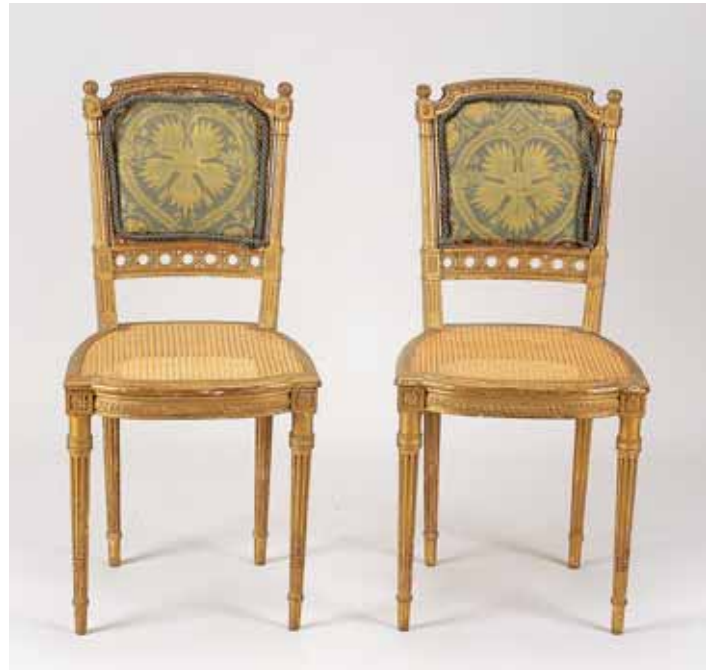
342 PAR DE CADEIRAS, estilo Luís XVI, madeira entalhada e dourada, assentos de palhinha, costas estofadas, francesas, séc. XIX, pequenas faltas e defeitos Nota: pertenceram ao espólio do escultor Canto da Maia, conforme etiqueta de leilão colada no fundo Dim. - 88 x 41 x 41 cm