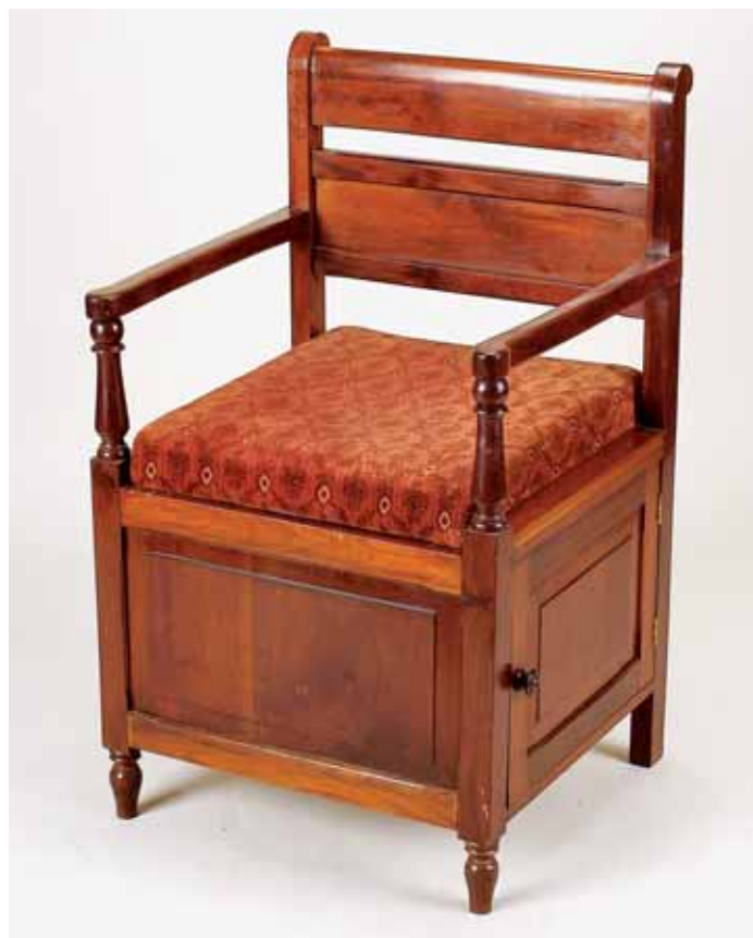
360 CADEIRA PENIQUEIRA, romântica, mogno, portuguesa, séc. XIX, pequenos defeitos Dim. - 92 x 56 x 51 cm €300 - 450