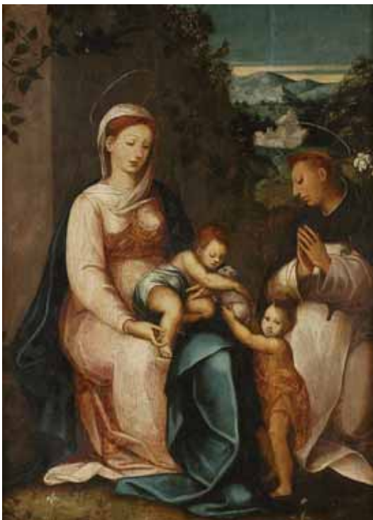
494 "NOSSA SENHORA DO ROSÁRIO, SÃO JOÃO BAPTISTA E SANTO", óleo sobre madeira, escola italiana, séc. XVI/XVII, restauros; Dim. - 88 x 64 cm € 2.000 - 3.000