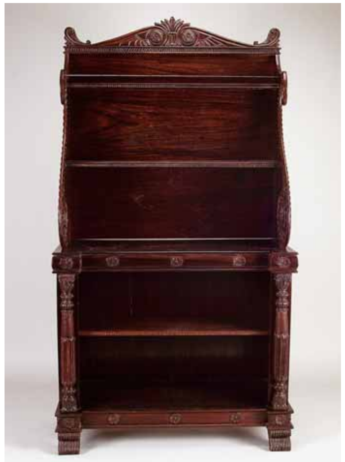
548 ESTANTE, sissó com entalhamentos, parte inferior com colunas, indo-inglesa, séc. XIX, faltas e defeitos Dim. - 202 x 109 x 47 cm € 700 - 1.050