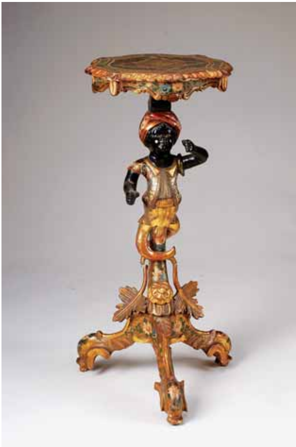
332 COLUNA FLOREIRA , madeira entalhada, pintada e dourada "Negro veneziano", veneziana, séc. XIX, pequenas faltas e defeitos Dim. - 75 cm € 600 - 900