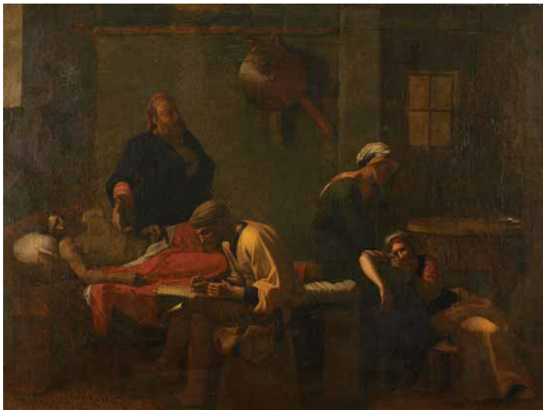
492 "MORTE DE LÁZARO", óleo sobre tela, escola portuguesa, séc. XVII/XVIII, reentelado e muito restaurado Dim. - 103 x 135 cm € 1.500 - 2.250