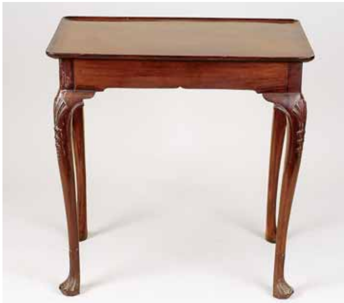
333 MESA DE CENTRO , estilo Jorge II, mogno, pernas com entalhamentos, inglesa, séc. XIX, pequenos defeitos Dim. - 73 x 71 x 48 cm € 500 - 750