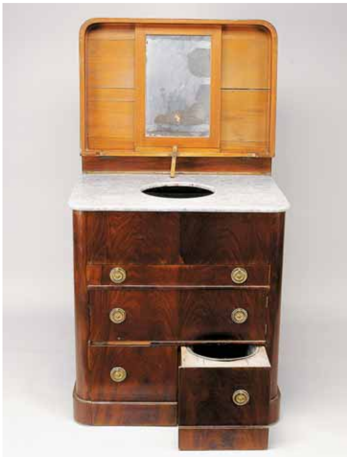
546 MÓVEL LAVATÓRIO, mogno e raiz de mogno, tampo em mármore, interior com espelho, gaveta com bidé, português, séc. XIX, faltas e defeitos Dim. - 91 x 77 x 55 cm € 250 - 375