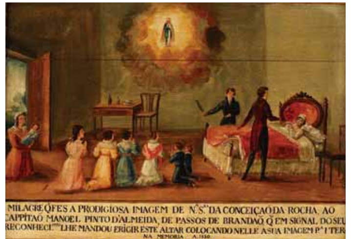
490 EX-VOTO "NOSSA SENHORA DA CONCEIÇÃO", óleo sobre madeira, escola portuguesa, séc. XIX, pequenas faltas, datado de 1830 Dim. - 35 x 48,5 cm