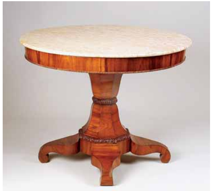
343 MESA REDONDA, romântica, madeira revestida a raiz de murta, coluna central com frisos entalhados e quatro pés, tampo de mármore, portuguesa, séc. XIX, pequenos defeitos Dim. - 79 x 103 cm