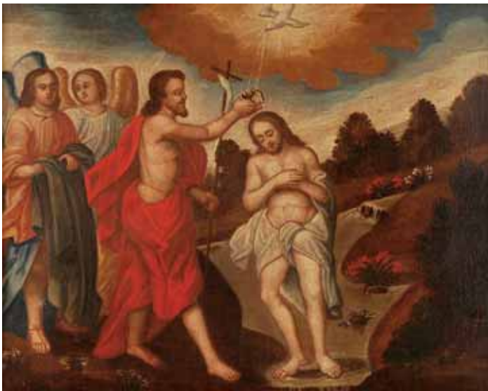
488 "BAPTISMO DE CRISTO", óleo sobre tela, escola portuguesa, séc. XVII, reentelado e restaurado Dim. - 71 x 91 cm