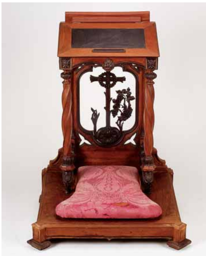
358 GENUFLEXÓRIO, romântico, mogno com entalhamentos, português, séc. XIX, pequenos defeitos Dim. - 99 x 71 x 62 cm €100 - 150