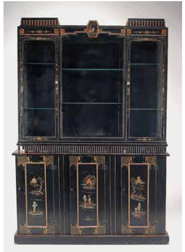
525 ARMÁRIO COM ALÇADO/VITRINE, madeira lacada a negro e dourado, decoração policromada "Paisagens com figuras orientais", China, séc. XIX/XX, faltas e defeitos Dim. - 82,5 x 257 x 30 cm €250 - 375