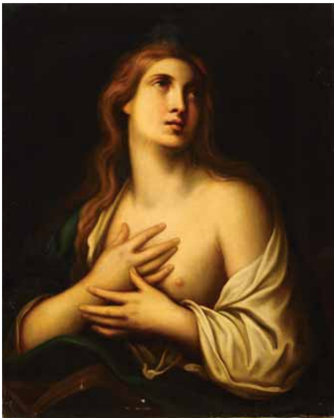
493 "SANTA MADALENA", óleo sobre tela, escola portuguesa, séc. XVIII/XIX, pequenos defeitos Dim. - 71,5 x 57 cm € 1.000 - 1.500