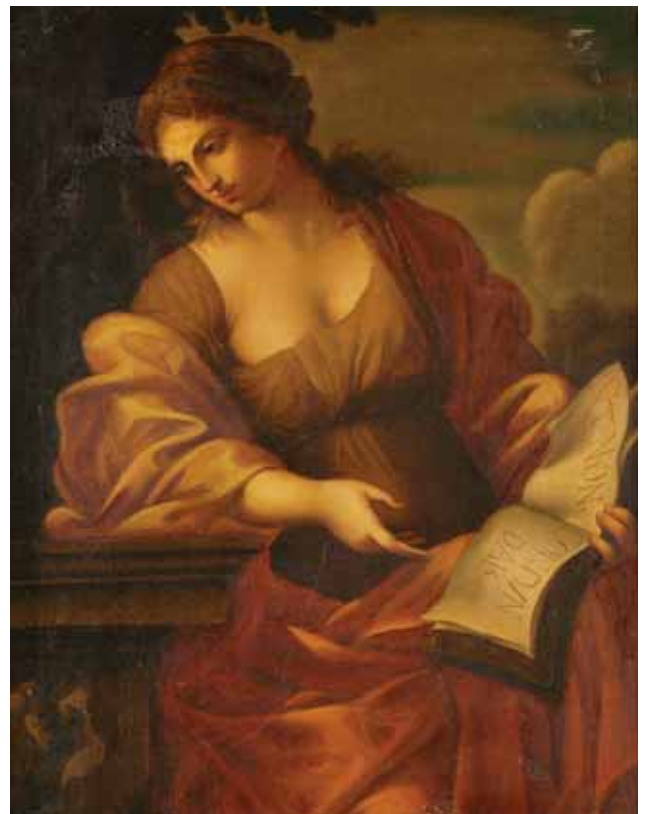
495 "SANTA COM LIVRO", óleo sobre tela, escola portuguesa, séc. XIX, reentelado, pequenos defeitos Dim. - 65 x 52 cm € 400 - 600