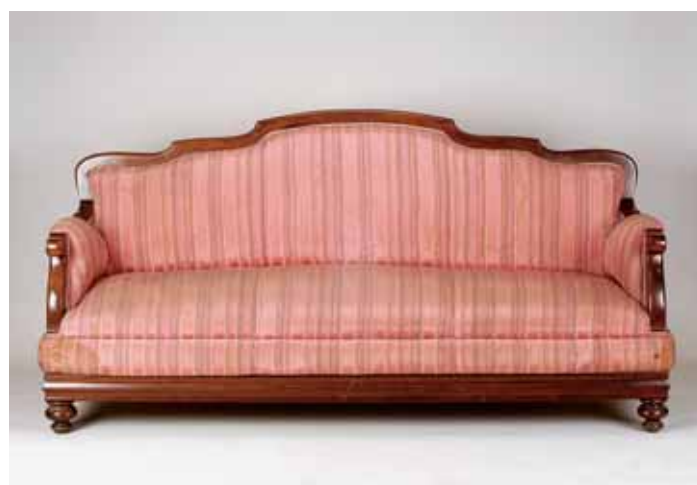
357 CANAPÉ, romântico, mogno, assen, costas e laterais estofados, português, séc. XIX, estofos não originais, pequenos defeitos Dim. - 98 x 203 x 65 cm € 800 - 1.200