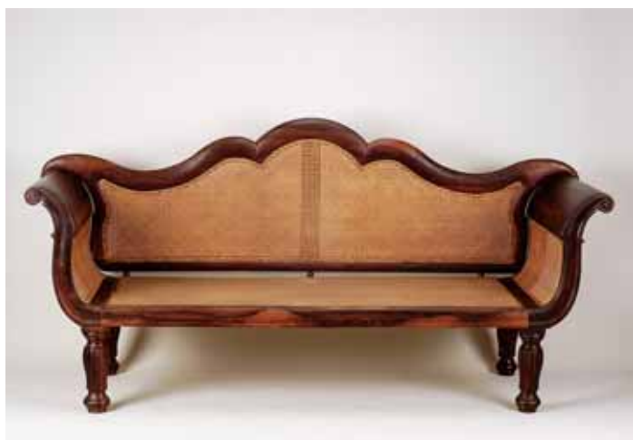
355 CANAPÉ, ao gosto Guilherme IV, pau santo, pés canelados, costas e laterais com palhinha, português, séc. XIX, falta da palhinha do assento, tendo sido colocado um estrado, pequenos defeitos; Dim. - 102 x 110 x 64 cm € 600 - 900