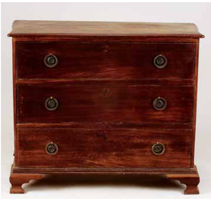
359 CÔMODA, D. Maria, vinhático, entradas da chave em pau santo, ferragens em bronze, portuguesa, séc. XVIII/XIX, pequenas faltas e defeitos Dim. - 88 x 109 x 56 cm €800 - 1.200