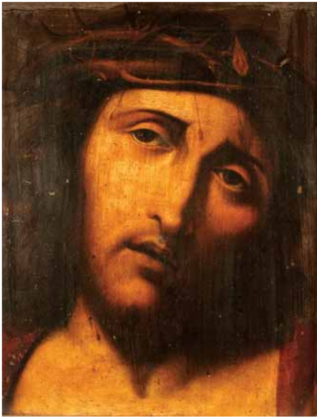
487 "CRISTO MARTIRIZADO", óleo sobre cobre, escola portuguesa, séc. XVII/XVIII, defeitos Dim. - 34,5 x 28 cm