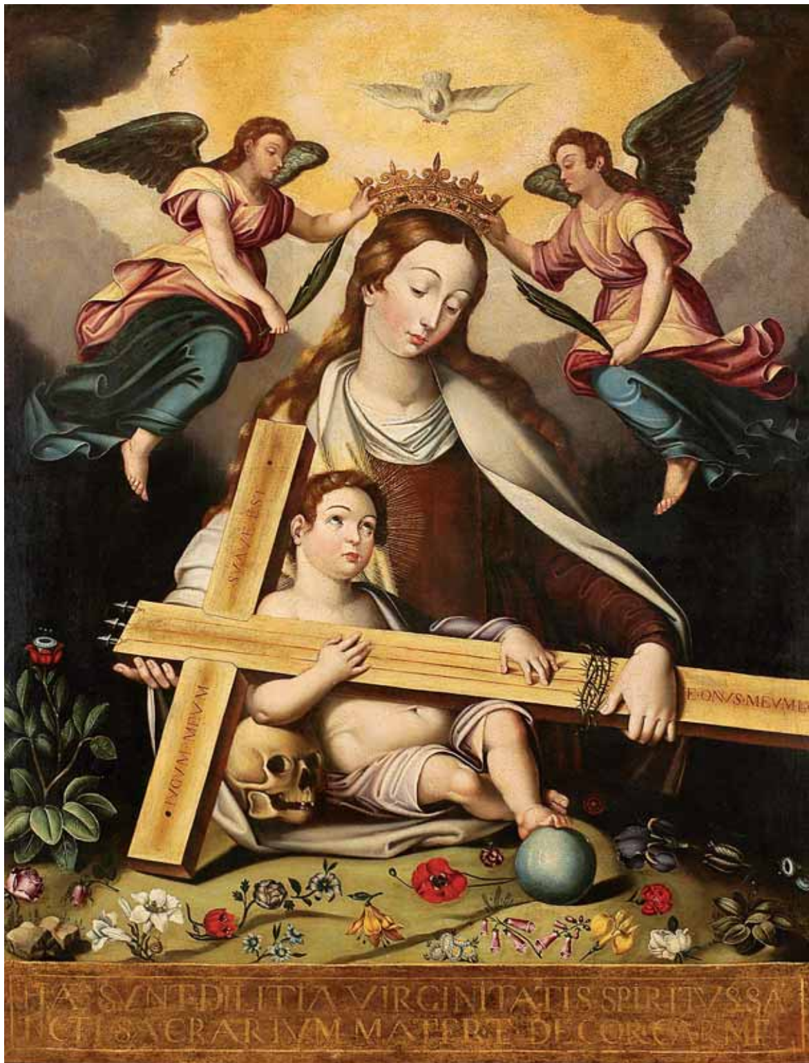
497 "NOSSA SENHORA COM O MENINO", óleo sobre tela, escola espanhola, séc. XVII, reentelado e restaurado; Dim. - 128 x 100 cm