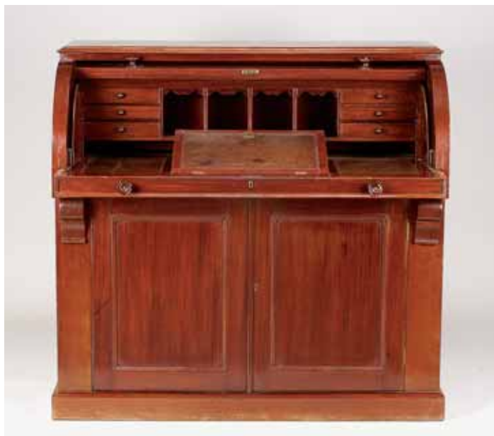
520 SECRETÁRIA DE ROLO , romântica, mogno, interior com gavetas e escaninhos e tampo forrado a couro, portuguesa, séc. XIX, pequenos defeitos Dim. - 102 x 118 x 51 cm € 1.000 - 1.500