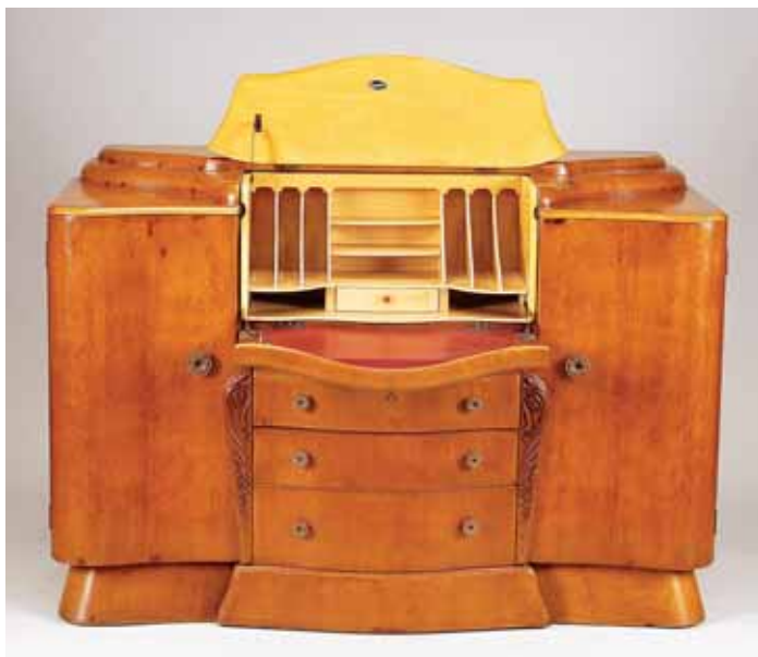
524 MÓVEL COM SECRETÁRIA, Art Déco, carvalho, interior em pau cetim, tempo forrado a tecido vermelho, francês, séc. XX, pequenos defeitos, marcado BUREAUMATIC Dim. - 95 x 137 x 51,5 cm €700 - 1.050