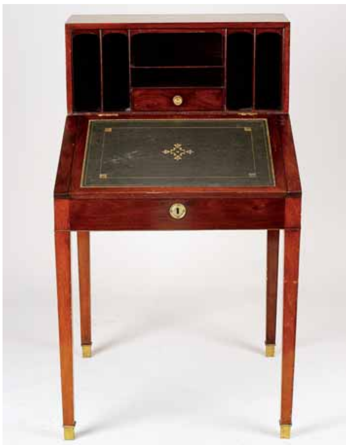
519 SECRETÁRIA COM PEQUENO ALÇADO , mogno, alçado com gaveta e escaninhos, tampo revestido a couro, puxadores em bronze dourado, portuguesa, séc. XIX/XX, pequenas faltas e defeitos; Dim. - 105,5 x 61 x 61 cm € 600 - 900