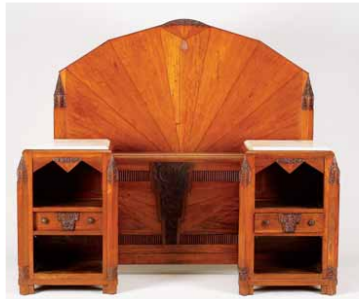
526 CAMA DE CASAL E PAR DE MESAS DE CABECEIRA, Art Déco, noogueira e raiz de noogueira com entalhamentos, tampos das mesas de cabeceira em mármore, Europa, séc. XX, pequenos defeitos; Dim. - 137 x 206 x 140 cm (cama) €1.000 - 1.500