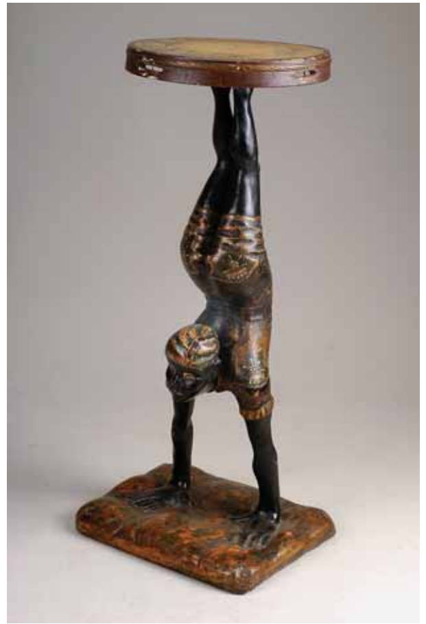
334 COLUNA , madeira entalhada, pintada e dourada "Negro fazendo o pino", tampo em forma de "Pandeireta", veneziana, séc. XIX, pequenas faltas, defeitos Dim. - 89 x 41 x 31 cm € 1.000 - 1.500