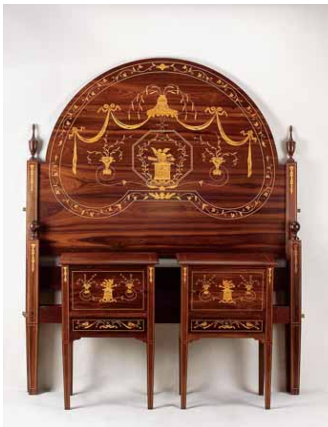
542 CAMA DE CASAL E PAR DE MESAS DE CABECEIRA, estilo D. Maria, pau santo, embutidos em pau cetim "Baldaquino, pássaros e fachos", portuguesas, séc. XX, pequenos defeitos Dim. - 179 x 205 x 144 cm