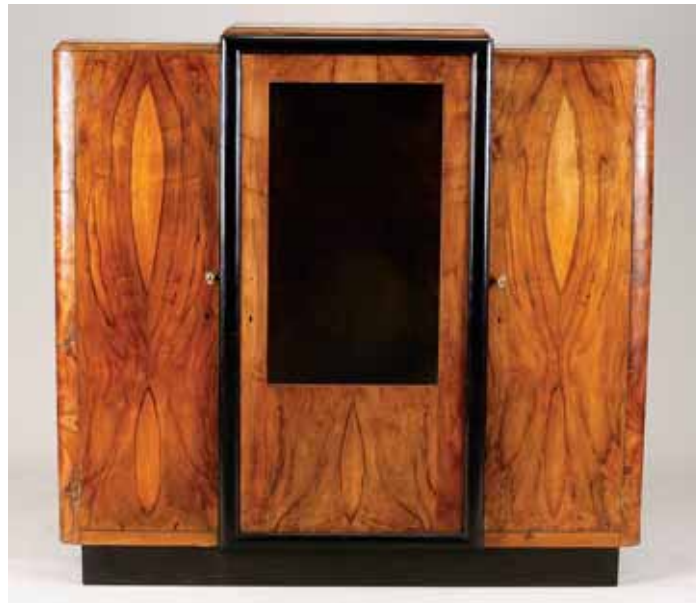
522 ARMÁRIO COM VITRINE , Art Déco, nogueira e raiz de nogueira, base e frisos pintados de negro, porta central com vidro, Europa, séc. XX, pequenas faltas e defeitos Dim. - 132 x 140 x 36 cm € 250 - 375