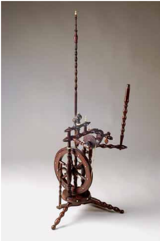
328 ROCA DE FIAR, madeira exótica, aplicações em marfim, portuguesa, séc. XIX, pequenas faltas e defeitos Dim. - 115 x 117 x 54 cm