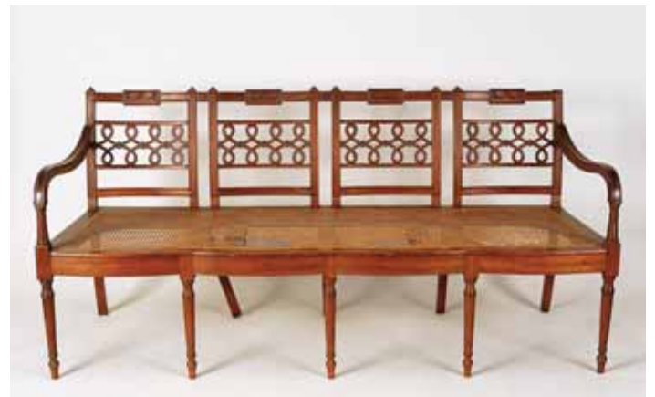
583 CANAPÉ DE 4 LUGARES , murta com entalhamentos, assento de palhinha, português, séc. XIX, palhinha em mau estado, pequenas faltas e defeitos Dim. - 88 x 185 x 69 cm € 400 - 600