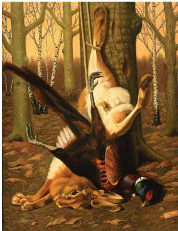
471 T. MIZONAY - SÉC. XIX, "NATUREZA MORTA - LEBRE E FAISÃO JUNTO A ÁRVORE", óleo sobre tela, assinado Dim. - 65 x 55 cm