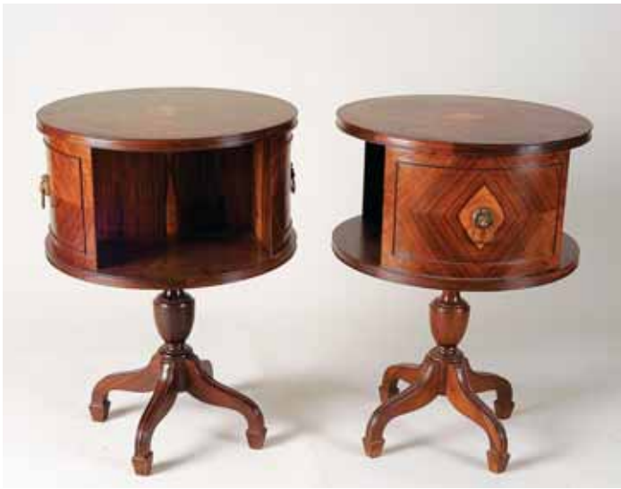
336 PAR DE MESAS LIVREIRAS ROTATIVAS, pau santo e raiz de pau santo, portuguesas, séc. XX, pequenos defeitos Dim. - 70 x 50 cm