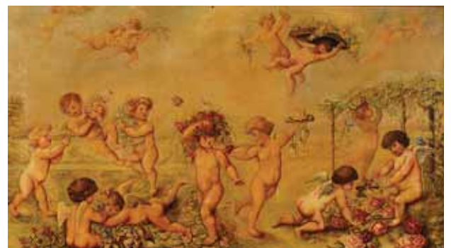
457 "PUTTI", par de óleos sobre tela, Europa, séc. XIX/XX, faltas na tinta Dim. - 60 x 107 cm