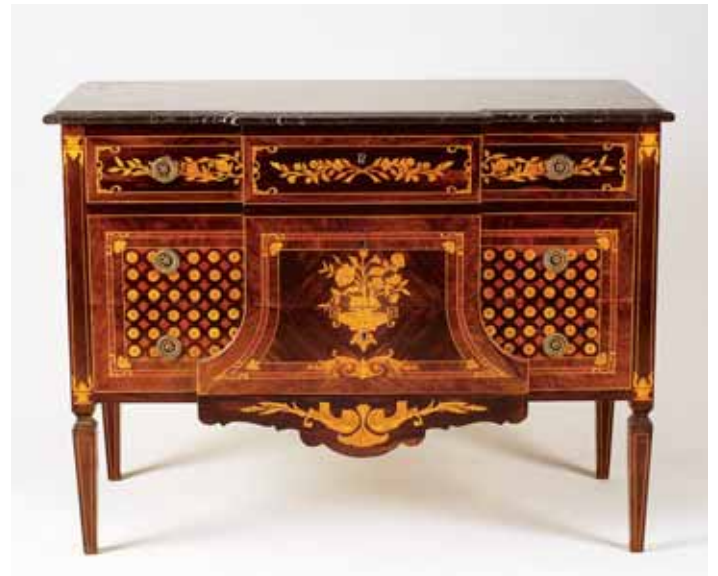
579 CÓMODA, estilo Luís XVI, madeira revestida a marchetaria de diversas madeiras, tampo em mármore, Europa, séc. XX, pequenos defeitos Dim. - 87 x 114 x 54 cm