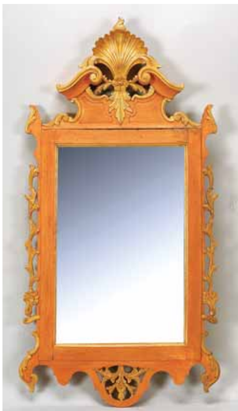
403 ESPELHO, estilo D. José, moldura em nogueira pintada de vermelho e dourada, português, séc. XIX, pequenos defeitos, pintura não original Dim. - 110 x 57 cm