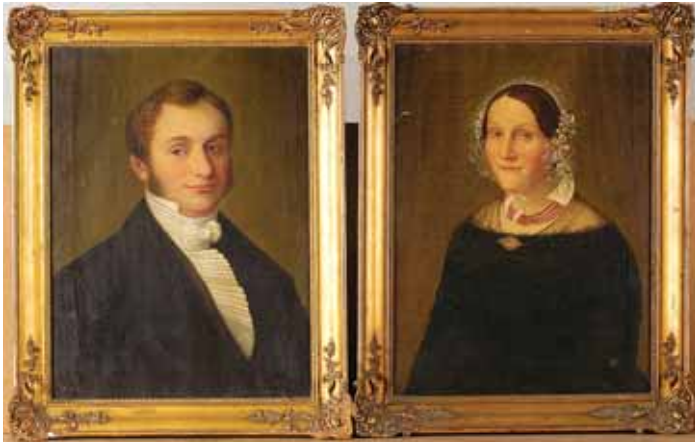
483 "SENHOR" E "SENHORA", par de óleos sobre tela, molduras em madeira e gesso dourados, escola inglesa, séc. XIX, pequenos defeitos Dim. - 57 x 42 cm