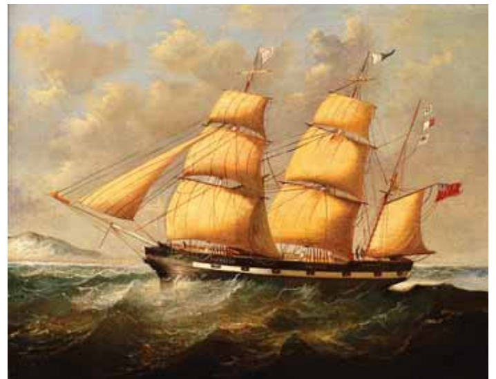
480 "VELEIRO" , óleo sobre tela, escola inglesa, séc. XIX Dim. - 38 x 51 cm