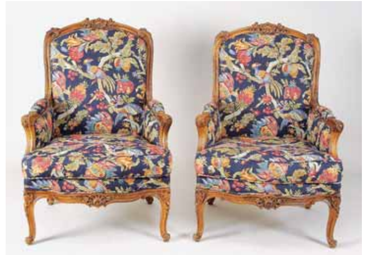
330 PAR DE BERGÈRES, estilo Luís XV, noqueira com entalhamentos, assento e costas estofados, francesas, séc. XIX/XX, estofa não original Dim. - 108 x 74 x 72 cm € 2.500 - 3.750