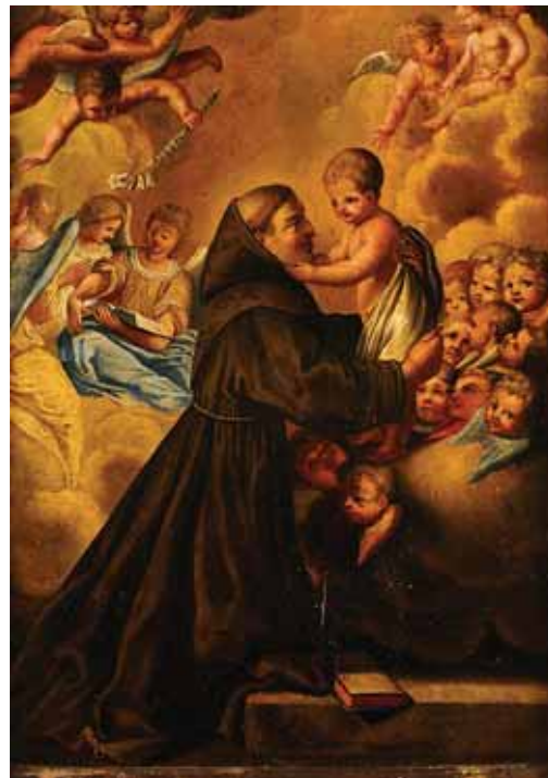
460 "SANTO ANTÓNIO COM O MENINO RODEADO DE ANJOS E QUERUBINS", óleo sobre cobre, escola espanhola, séc. XVIII, pequenos defeitos Dim. - 38 x 28 cm