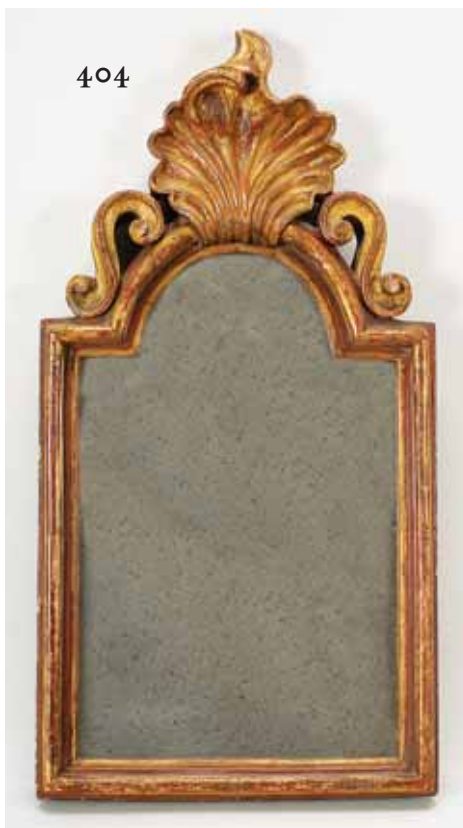
404 ESPELHO, D. José, moldura em madeira entalhada e dourada, português, séc. XVIII dourado não original Dim. - 72 x 36 cm