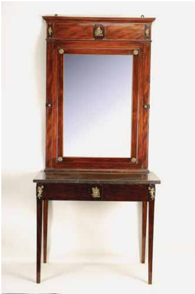
580 TREMÓ , ao gosto Império, mogno, tampo em mármore, aplicações em bronze "Esculturas", português, séc. XIX, pequenos defeitos Dim. - 220 x 100 x 47 cm € 700 - 1.050