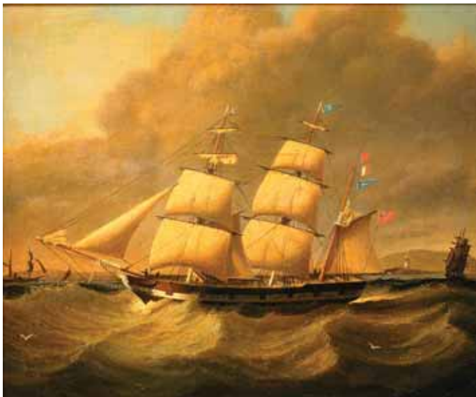
478 "VELEIRO" , óleo sobre tela, escola inglesa, séc. XIX Dim. - 34 x 38 cm