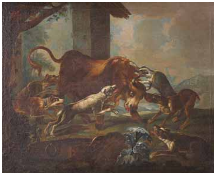
462 "CENA DE CAÇA" , óleo sobre tela, escola francesa, séc. XVIII, reentelado e restaurado Dim. - 66 x 82 cm