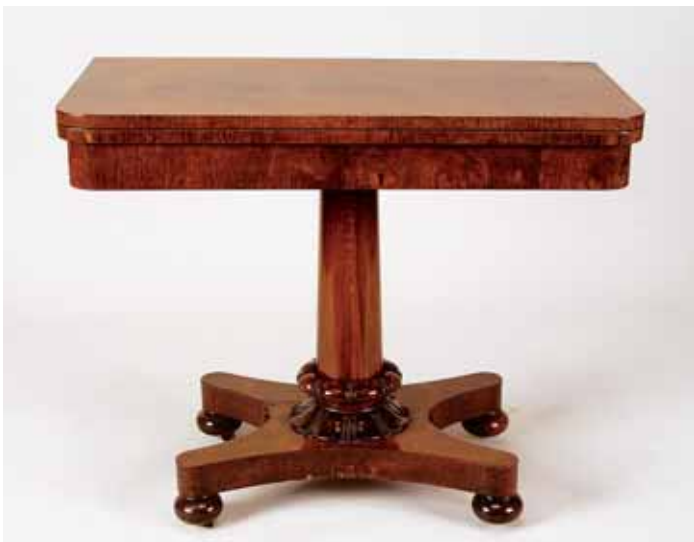
347 MESA DE JOGO , Guilherme IV, pau santo, coluna central com entalhamento, inglesa, séc. XIX, pequenos defeitos Dim. - 73 x 92 x 45,5 cm € 800 - 1.200