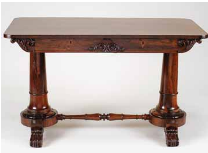
558 SOFA-TABLE , Guilherme IV, pau santo e raiz de pau santo, duas colunas laterais, inglesa, séc. XIX, pequenos defeitos Dim. - 72 x 60 x 122 cm € 2.500 - 3.750