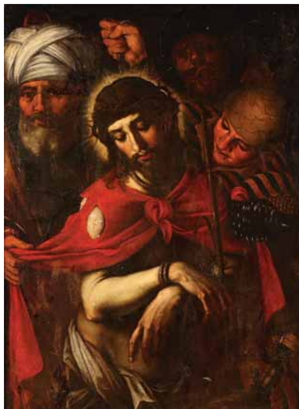
452 "CENA DA PAIXÃO DE CRISTO", óleo sobre tela, moldura em madeira pintada de negro e dourada com inscrição a ouro, escola europeia, séc. XVII, reentelado e restaurado Dim. - 82 x 67 cm €1.200 - 1.800