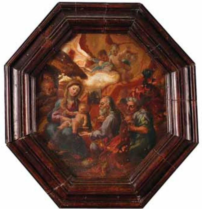
450 "ADORAÇÃO DOS REIS MAGOS", pintura a óleo sobre mármore, Itália, séc. XVIII, faltas na pintura Dim. - 28 x 27 cm