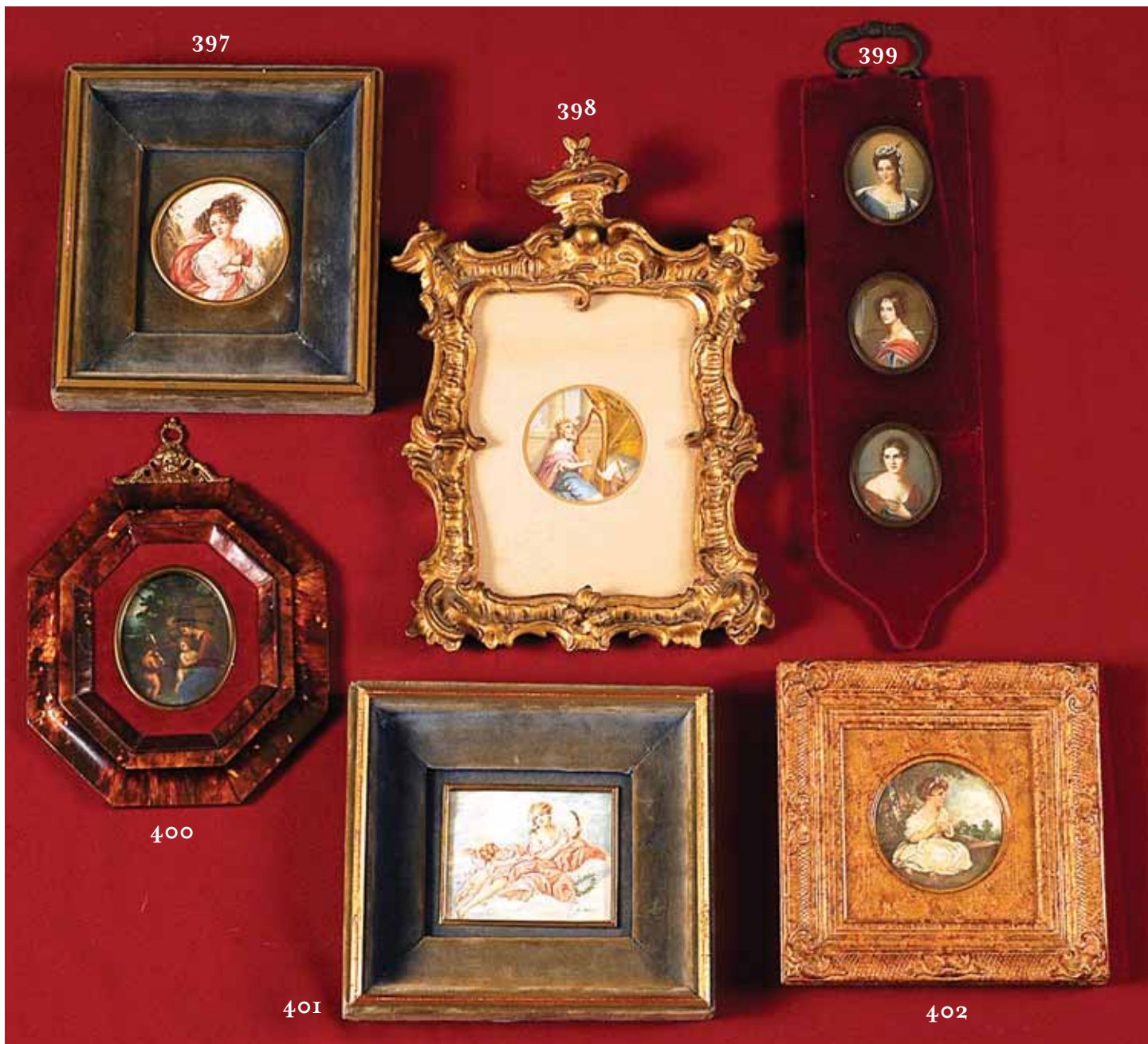
397 "SENHORA" , miniatura sobre marfim, Europa, séc. XIX/XX Dim. - 8 cm