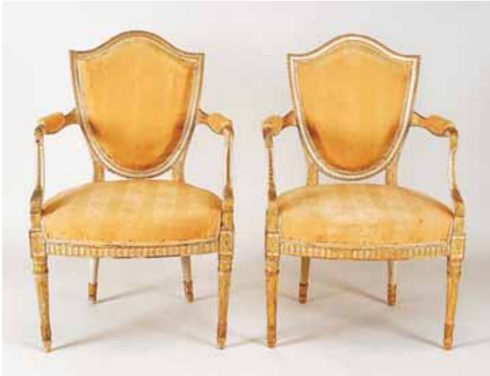
328 PAR DE FAUTEUILS, Luís XVI, faia pintada de branco e dourado, assentos estofados a seda adamacada, italianos, séc. XVIII, restaurados, estofa antigo mas não original Dim. - 100 x 65 x 53 cm € 2.000 - 3.000