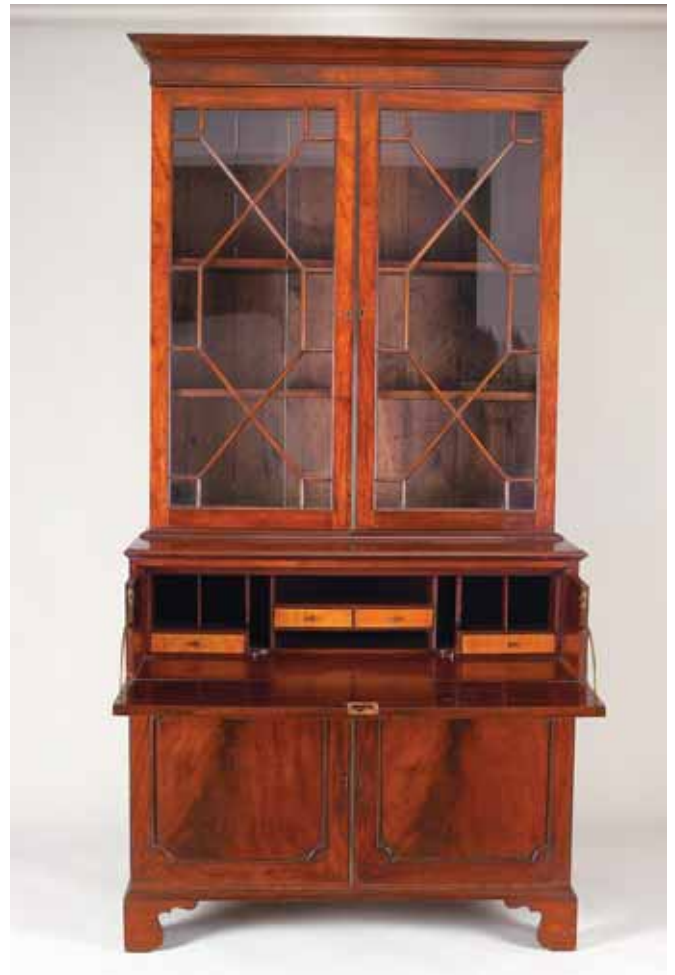
334 CÓMODA COM GAVETA SECRETÁRIA E ALÇADO LIVREIRO , Jorge III, mogno e raiz de mogno, corpo superior com vidrinhos, frentes das gavetas do interior em pau cetim, ferragens em metal amarelo, inglesa, séc. XIX (1º quartel), pequenas faltas e defeitos; Dim. - 235 x 115 x 60 cm € 3.000 - 4.500