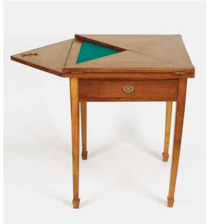
344 MESA DE JOGO DE ENVELOPE, victoriana, nogueira, tampo forrado a feltro verde, inglesa, séc. XIX, pequenos defeitos Dim. - 72 x 55 x 55 cm € 800 - 1.200