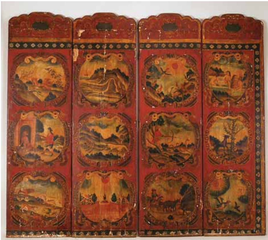
414 BIOMBO DE QUATRO FOLHAS , madeira lacada, decoração policromada "Cenas europeias do quotidiano", Europa, séc. XIX, mau estado Dim. - 200 x 56 cm (cada folha) € 600 - 900