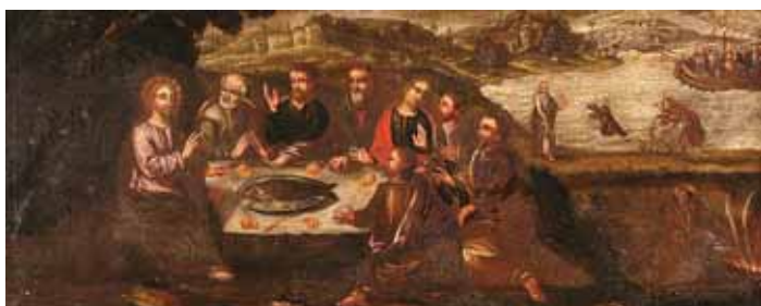
449 "CENA DA VIDA DE CRISTO", óleo sobre tela, escola portuguesa, séc. XVII, reentelado e restaurado Dim. - 33,5 x 81 cm €1.200 - 1.800