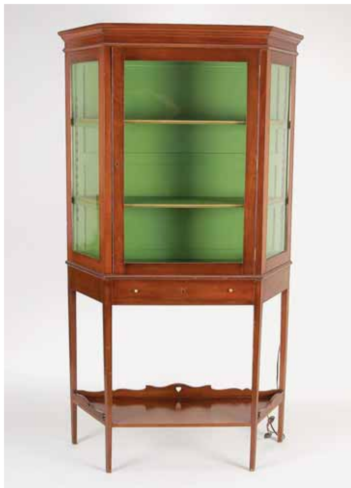
352 VITRINE, estilo D. Maria, mogno, porta e laterais com vidros, interior pintado de verde com frisos dourados, portuguesa, séc. XIX/XX, pequenos defeitos Dim. - 177 x 96 x 36 cm € 250 - 375