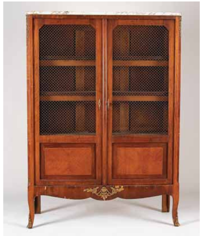
339 LIVREIRA, estilo Luís XVI, marchetaria de mogno, pau santo e pau rosa, portas com gradinha, aplicações em bronze, tampo de mármore, francesa, séc. XIX/XX, pequenas faltas e defeitos Dim. - 158 x 113 x 38 cm