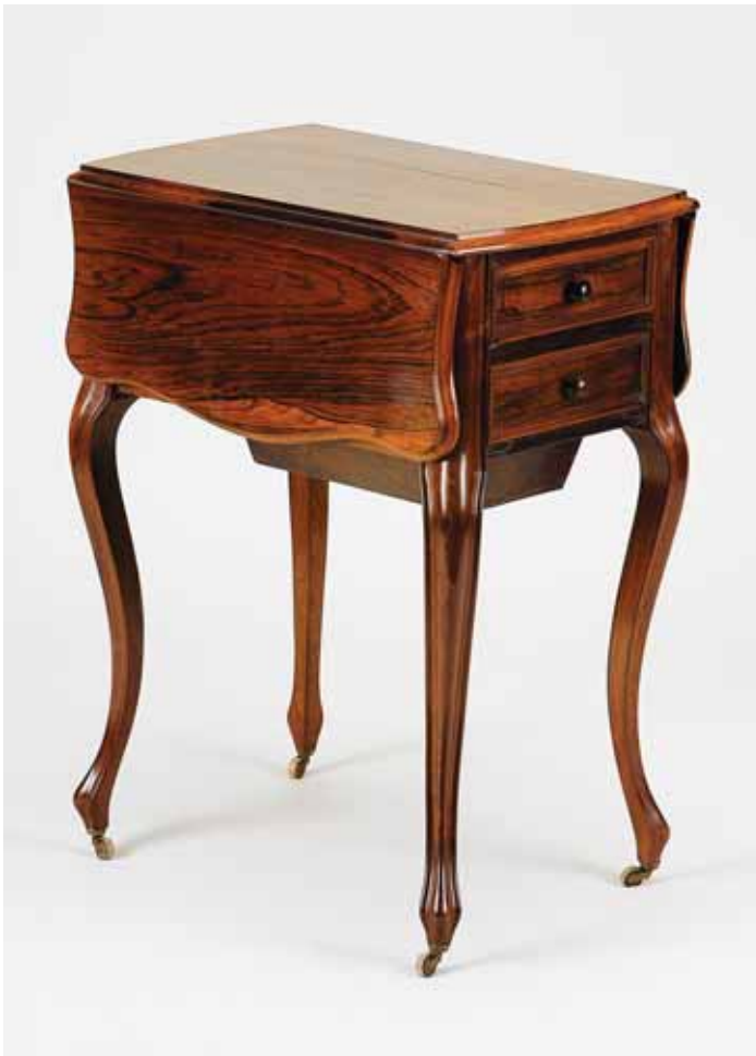
557 COSTUREIRA COM ABAS , Napoleão III, pau-santo, porta e duas gavetas, suporte para lãs, pés com rodízios, francesa, séc. XIX, pequenos defeitos Dim. - 73 x 56 x 38 cm € 800 - 1.200