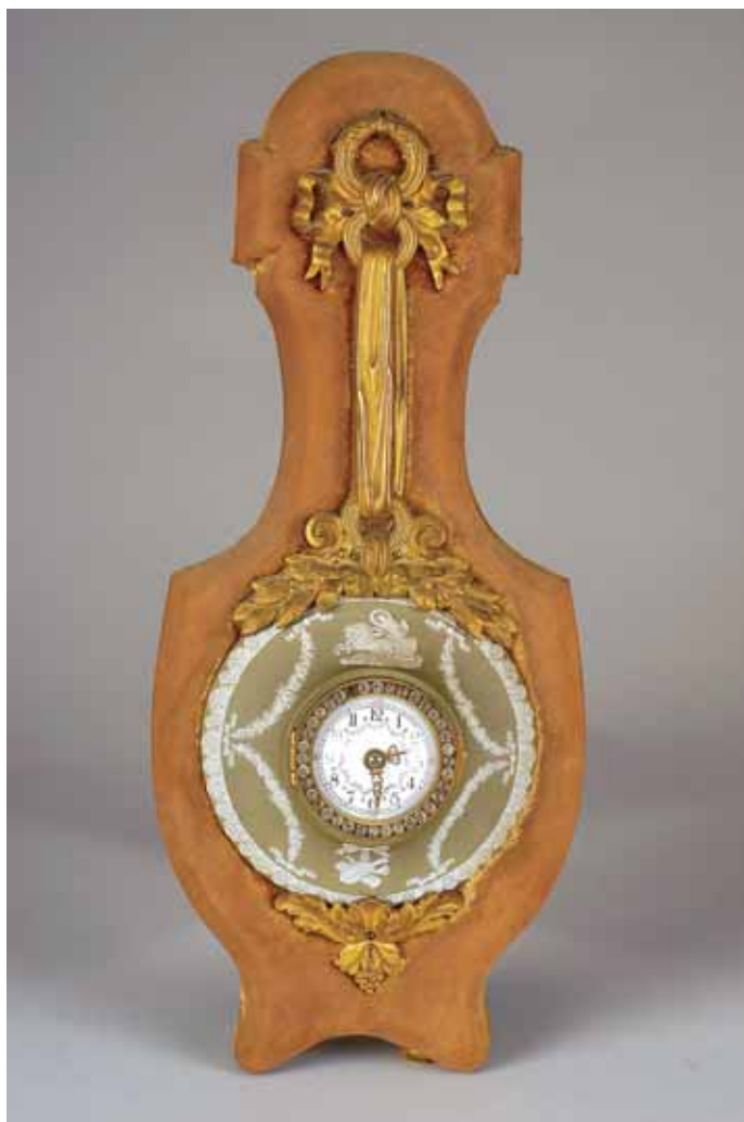
531 RELÓGIO, biscuit relevado e bronze dourado, aro em metal com vidros, mostrador em esmalte, assente sobre suporte de pendurar ou de pousar revestido a veludo gasto, inglês, séc. XIX/XX Dim. - 41 cm (total) €150 - 225