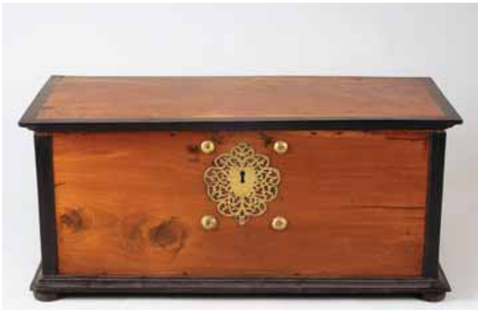
333 ARCA , teca, frisos em ébano, ferragens em metal amarelo, Índia, séc. XVIII/XIX, pequenos defeitos Dim. - 52 x 119 x 55,5 cm € 1.000 - 1.500