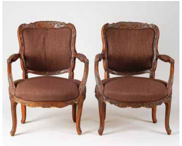
338 PAR DE FAUTEUILS, estilo Luís XV, noogueira com entalhamentos, assentos e costas estofadas, franceses, séc. XVIII/XIX, pequenos defeitos, estofado não original Dim. - 88 x 64 x 64 cm