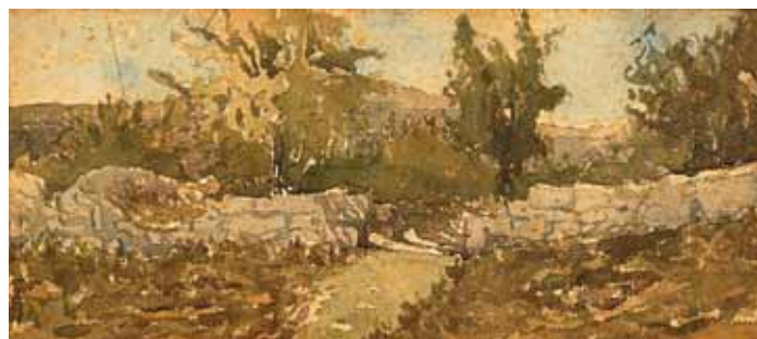
493 "PAISAGEM COM CERCA", aguarela sobre papel, escola europeia, séc. XIX/XX Dim. - 11,5 x 25 cm