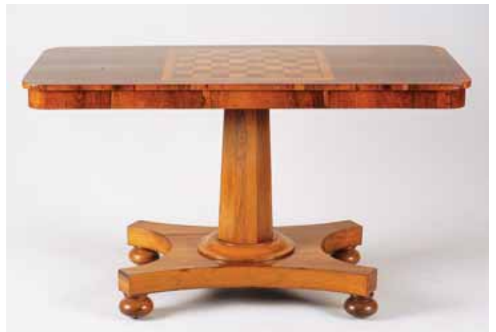
335 SOFA TABLE , victoriana, pau santo, marchetaria em raiz de pau santo e pau cetim "Xadrez", coluna central com quatro pés, inglesa, séc. XIX, pequenos defeitos Dim. - 73 x 127 x 60 cm € 2.500 - 3.750