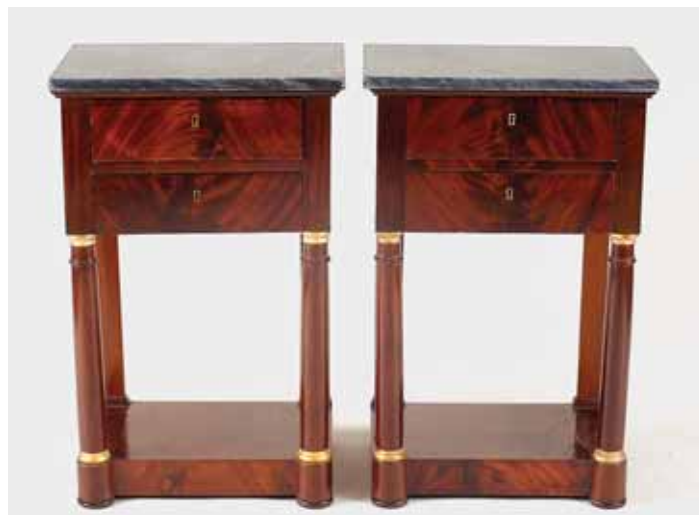
353 PAR DE MESAS DE CABECEIRA, estilo Império, mogno e raiz de mogno, colunas com dourados, portuguesas, séc. XX, pequenos defeitos Dim. - 72 x 45,5 x 31 cm € 500 - 750