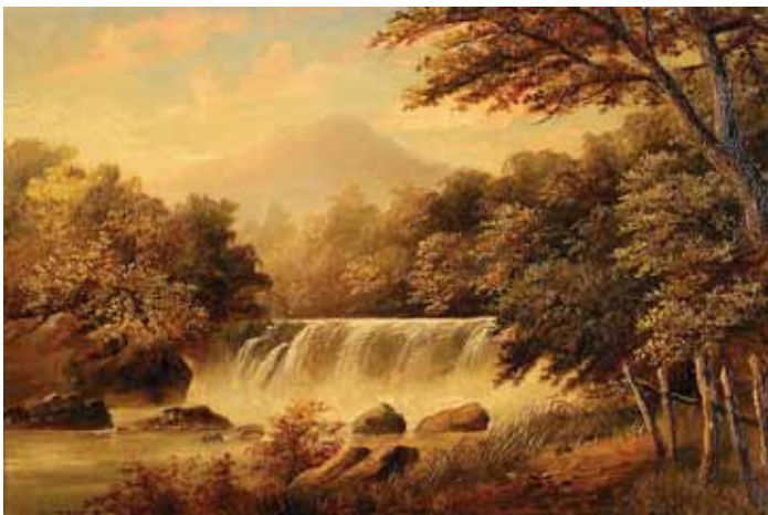
484 H. MASSER - SÉC. XIX, "PAISAGENS COM QUEDAS DE ÁGUA", par de óleos sobre tela, assinados Dim. - 34 x 52 cm