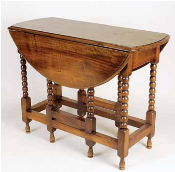
576 MESA DE CANCELA, noqueira, abas redondas, pernas torneadas, inglesa, séc. XVIII, pequenos defeitos Dim. - 75 x 100 x 44 cm (fechada)