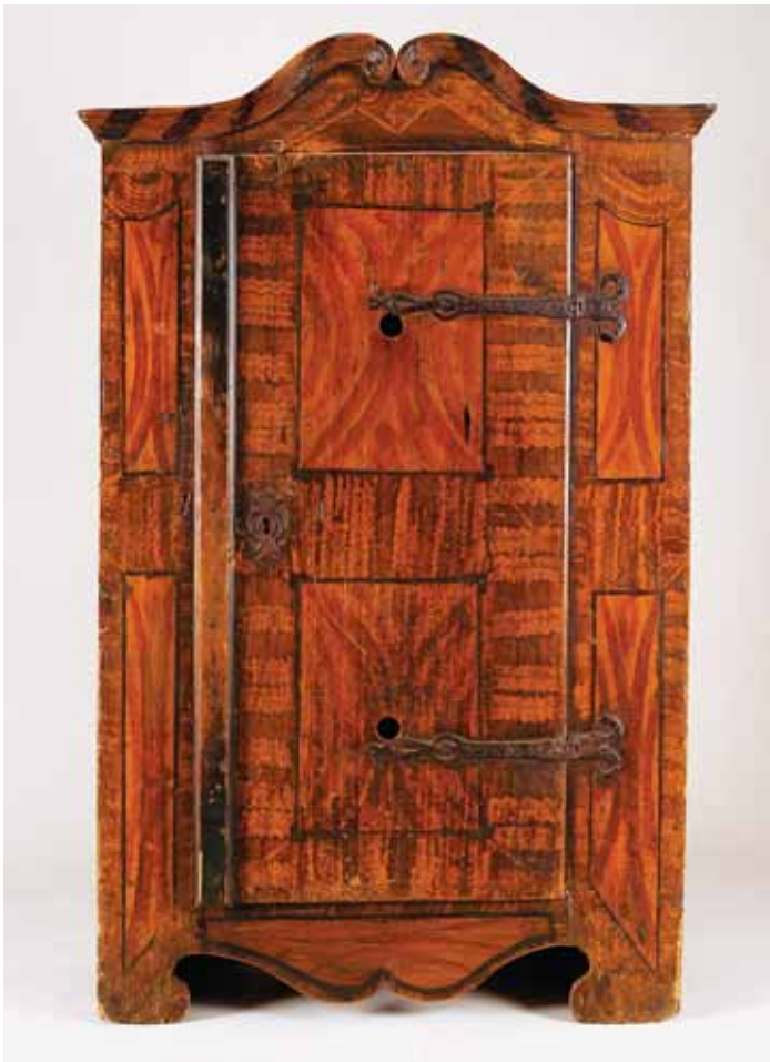
346 ARMÁRIO , casquinha pintada, decoração policromada, ferragens em ferro, Europa Central, séc. XIX, defeitos, faltas na tinta Dim. - 160 x 101 x 40 cm € 800 - 1.200