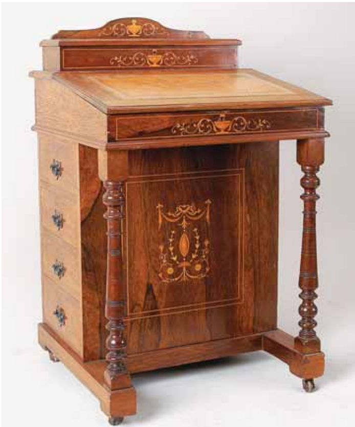
545 SECRETÁRIA DAVENPORT , victoriana, nogueira e raiz de nogueira, embutidos e filetes em pau cetim, colunas torneadas, tampo com couro, inglesa, séc. XIX, pequenos defeitos; Dim. - 89 x 55 x 53 cm € 1.500 - 2.250