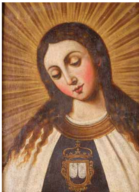
453 "NOSSA SENHORA DO CARMO", óleo sobre tela, escola portuguesa, séc. XVIII; Dim. - 37,5 x 28 cm €400 - 600