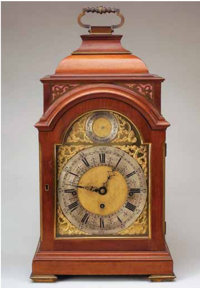
537 RELÓGIO DE MESA DE TRÊS MOVIMENTOS, mogno, aplicações de latão, toca horas, meias-horas e quartos num carrilhão de oito campainhas, autonomia de 8 dias, inglês, séc. XIX (finais), falta de um ponteiro, mecanismo a necessitar de revisão, marcado GRAHAM - LONDON Dim. - 53 x 27 x 20 cm € 2.000 - 3.000