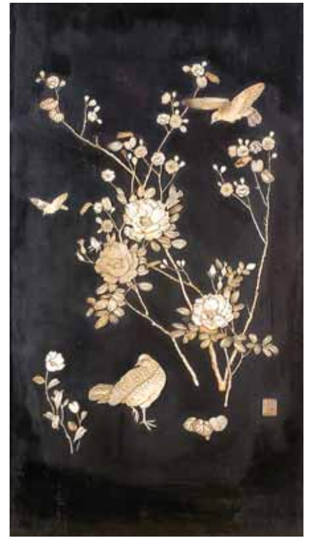
413 "FLORES E AVES" , painel em madeira lacada a negro, aplicações de madre-perola e marfim, Japão, período Meije, séc. XIX, pequenos defeitos, assinada Dim. - 76 x 42 cm € 300 - 450