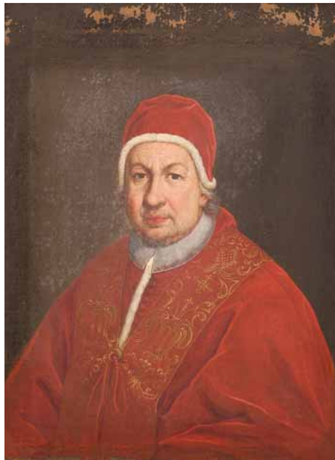
467 "RETRATO DE S.S. O PAPA BENTO XIV", óleo sobre tela, inscrição no verso "P. B. XIV - 1742", Europa, séc. XVIII, mau estado Dim. - 89 x 66 cm € 500 - 750