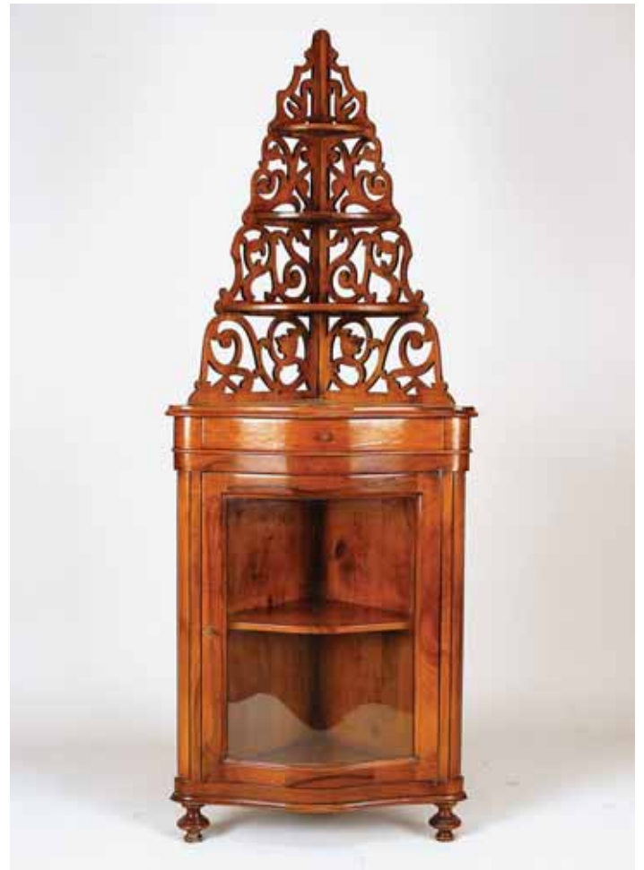
582 CANTONEIRA COM PEQUENO ALÇADO , romântica, nogueira, parta do corpo inferior com vidro abaulado, alçado vazado, portuguesa, séc. XIX, pequenos defeitos Dim. - 175 x 63 x 39 cm € 350 - 525