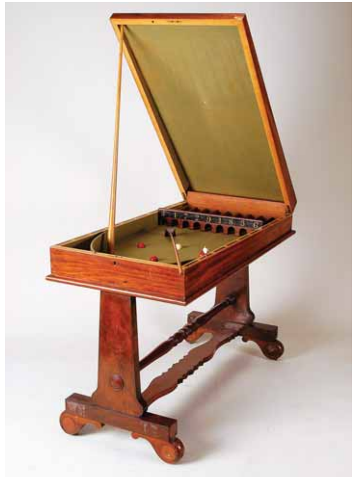
348 MESA DE BILHAR CHINÊS , victoriana, mogno e raiz de mogno, interior forrado a feltro, tacos em madeira, bolas em marfim, inglesa, séc. XIX, pequenos defeitos Dim. - 80 x 110 x 59 cm € 1.000 - 1.500