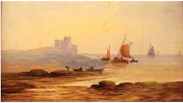
481 "MARINHA COM CASTELO, BARCOS E FIGURAS", óleo sobre papel colado sobre madeira, escola inglesa, séc. XIX Dim. - 16 x 29 cm