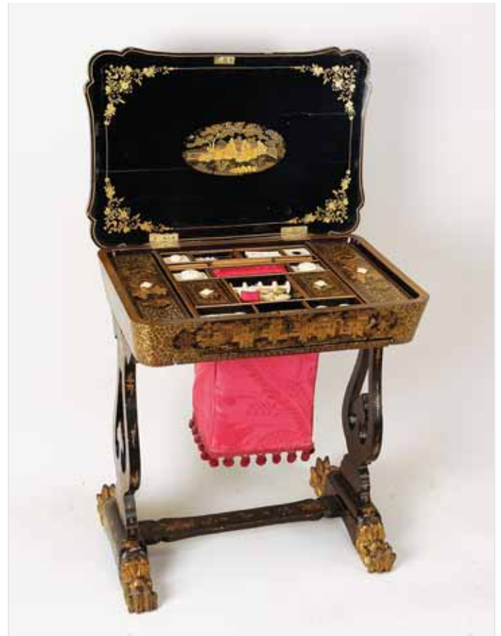
547 COSTUREIRA , madeira lacada de negro com dourados "Chinoiseries", pés entalhados e dourados, interior com divisórias e utensílios em marfim rendilhado e esculpido, China, séc. XIX, pequenos defeitos Dim. - 70 x 64 x 43 cm € 1.000 - 1.500