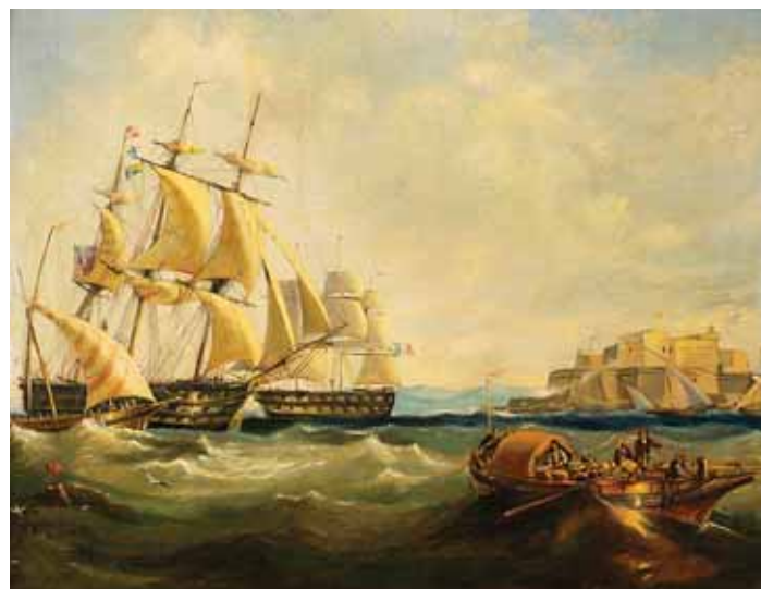
476 "MALTA VISTA DO MAR", óleo sobre tela, escola inglesa, séc. XIX Dim. - 40 x 50 cm € 1.500 - 2.250