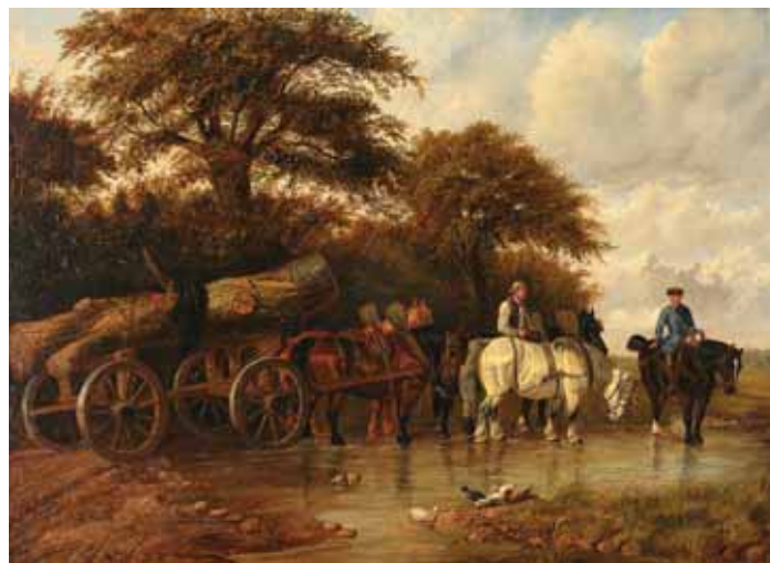
464 ROBERTSON - SÉC. XIX, "PAISAGEM COM FIGURAS E CAVALOS" , óleo sobre tela, restaurado e reentelado, assinado Dim. - 71 x 98 cm