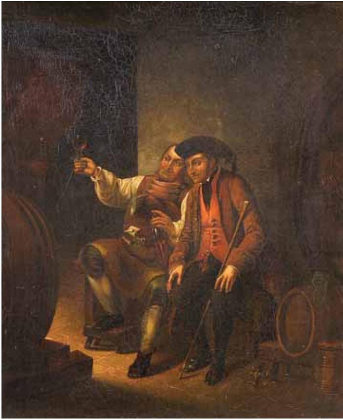
477 "INTERIOR COM FIGURAS" , óleo sobre tela, escola francesa, séc. XVIII/XIX Dim. - 57,5 x 48 cm