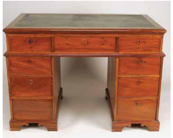
331 SECRETÁRIA, estilo Jorge III, mogno, tampo forrado a couro verde, esticadores laterais, inglesa, séc. XIX, sem puxadores, faltas e defeitos Dim. - 87 x 123 x 71 cm € 400 - 600