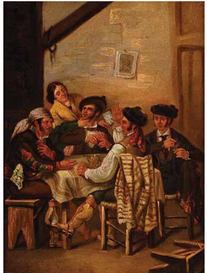
479 "JOGO DE CARTAS" , óleo sobre tela, escola espanhola, séc. XIX, reentelado, pequeno restauro Dim. - 39 x 29 cm