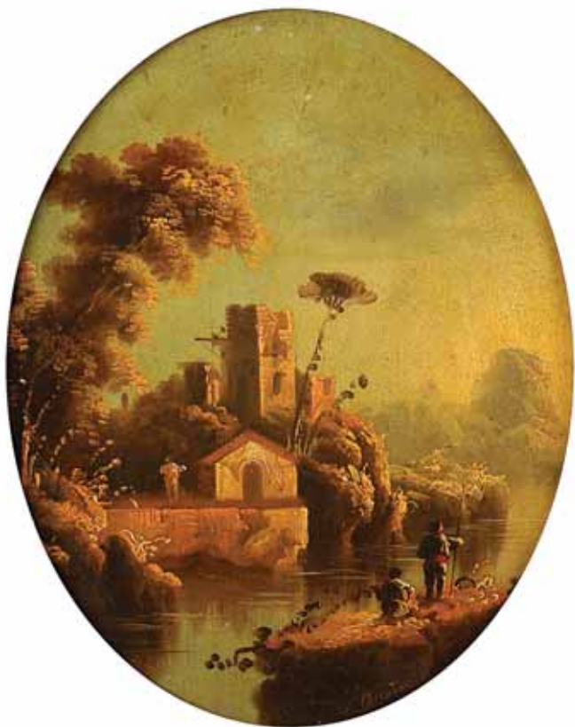
473 "PAISAGEM - RIO E FIGURAS", óleo sobre tela, escola europeia, séc. XIX, assinatura não identificada Dim. - 40 x 34 cm € 500 - 750