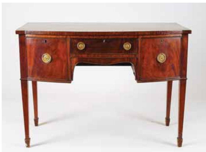
351 SIDEBOARD DE PEQUENAS DIMENSÕES, estilo Jorge III, mogno, inglês, séc. XIX, pequenos defeitos Dim. - 77 x 106 x 53 cm € 350 - 525