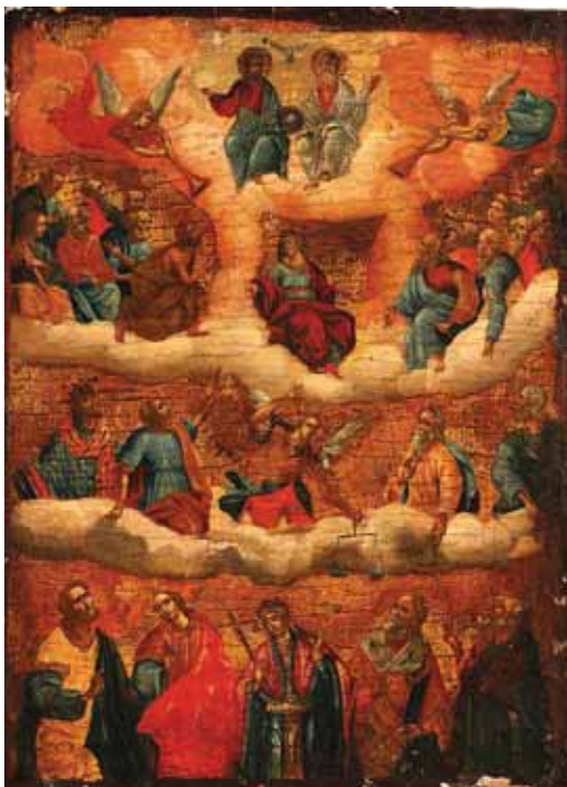
459 ÍCONE "SANTÍSSIMA TRINTADE E SANTOS", óleo sobre madeira, Europa de Leste, séc. XVIII/XIX, faltas na pintura Dim. - 57 x 42 cm

três óleos sobre tela com recorte das molduras formando um arco, escola portuguesa, séc. XVIII, defeitos Dim. - 107 x 50cm (tela central) e 100 x 112 cm (os arcos) €1.500 - 2.250