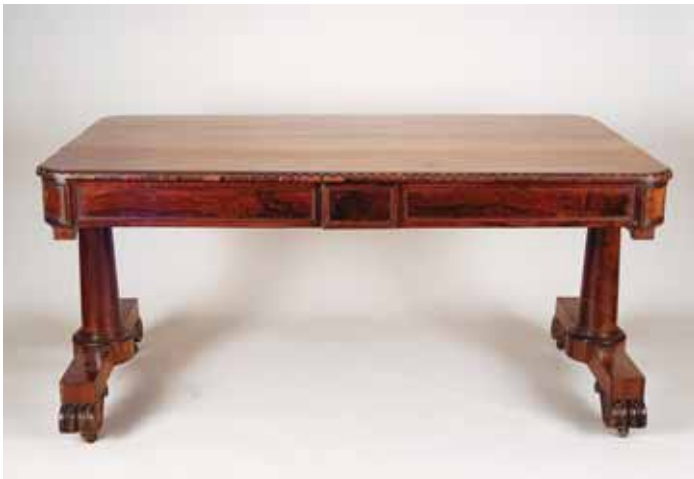
355 SECRETÁRIA, victoriana, pau santo e raiz de pau santo, friso entalhado, dupla coluna lateral com dois pés cada, pés com rodízios, inglesa, séc. XIX, pequenos defeitos Dim. - 74 x 153 x 91 cm