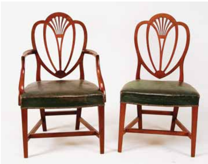
573 CONJUNTO DE OITO CADEIRAS , victorianas, mogno, assentos estofados, inglesas, séc. XIX, pequenos defeitos Dim. - 95 x 59 x 53 cm (cadeira de braços) € 1.500 - 2.250