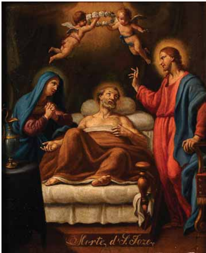
454 "MORTE DE SÃO JOSÉ", óleo sobre cobre, escola portuguesa, séc. XVII/XVIII Dim. - 34 x 27,5 cm