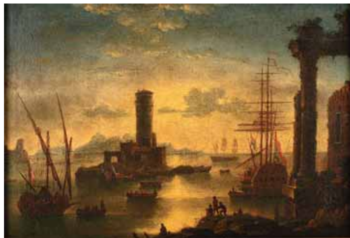
472 "PORTO DE MAR - BARCOS E RUÍNAS", óleo sobre tela, escola italiana, séc. XVIII, reentelado Dim. - 65 x 95 cm