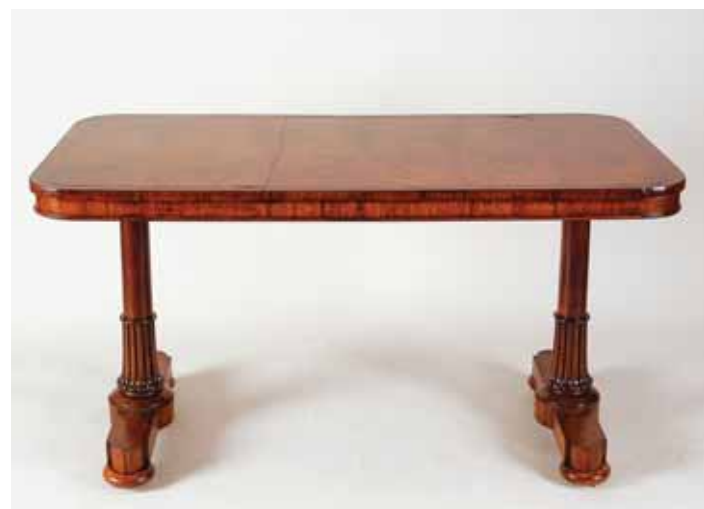
560 SECRETÁRIA , Guilherme IV, pau santo e raiz de pau santo, filetes em metal amarelo, inglesa, séc. XIX, pequenos defeitos Dim. - 72 x 135 x 68,5 cm € 1.200 - 1.800