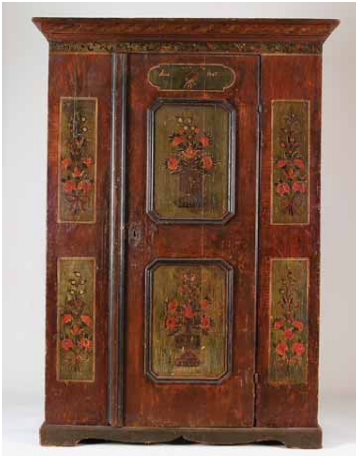
337 ARMÁRIO, casquinha pintada, decoração policromada "Flores e pássaros", inscrição 1807, Europa Central, séc. XIX, pequenos defeitos, faltas na tinta; Dim. - 178 x 127 x 48 cm