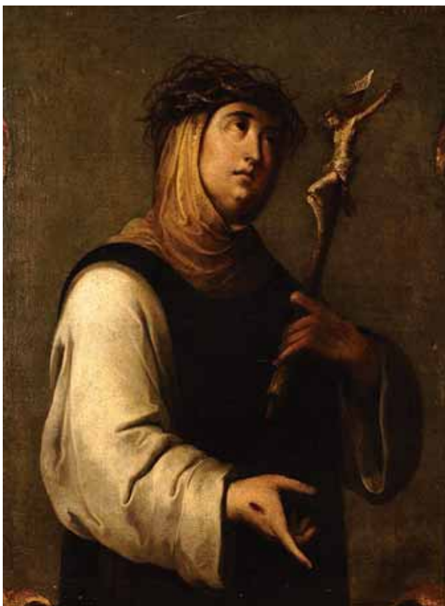
448 "SANTA INÊS", óleo sobre tela, escola portuguesa, séc. XVII, reentelado e restaurado Dim. - 93 x 71 cm €1.200 - 1.800