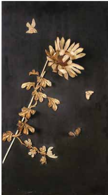
412 "CRISÂNTEMO, AVE E INSECTOS" , painel em madeira lacada a negro com trabalho relevado em marfim, moldura em madeira entalhada e vazada "Dragões", chinês, séc. XIX/XX, faltas e defeitos Dim. - 76 x 42 cm € 200 - 300