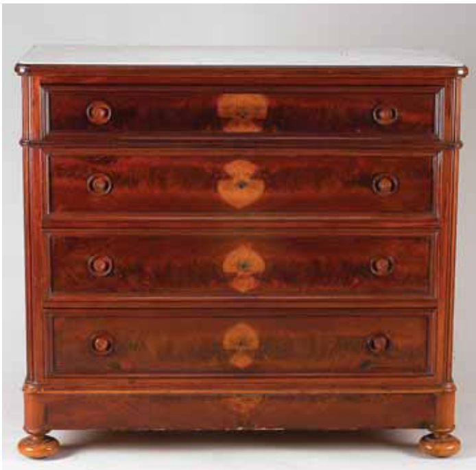
577 CÓMODA, romântica, mogno, puxadores em madeira, tampo de mármore, portuguesa, séc. XIX, pequenos defeitos Dim. - 114 x 125 x 60 cm