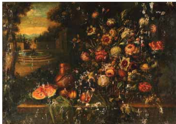
468 "NATUREZA MORTA - FLORES", óleo sobre tela, escola holandesa, séc. XVIII/XIX, reentelado, restauros, faltas na pintura Dim. - 105 x 147 cm € 2.000 - 3.000