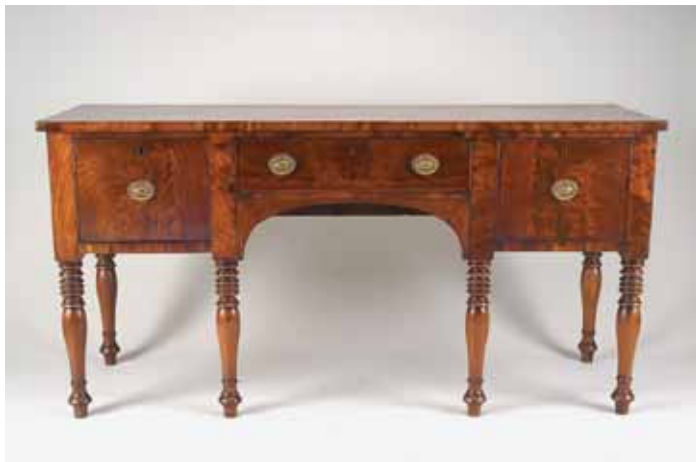
581 SIDEBBOARD , victoriano, mogno e raiz de mogno, pernas torneadas, ferragens em metal amarelo, inglês, séc. XIX, pequenos defeitos Dim. - 89 x 176 x 59 cm € 1.250 - 1.875