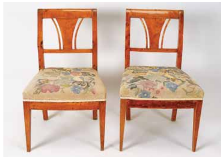
548 PAR DE CADEIRAS DE LAREIRA , Biedermeier, nogueira, assentos em "Petit point", Europa Central, séc. XIX, pequenos defeitos Dim. - 73 x 45 x 41 cm € 400 - 600