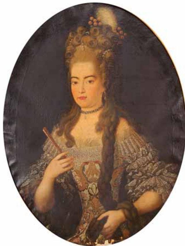
463 "RETRATO DE FIDALGA" , óleo sobre tela, escola francesa, séc. XVII, faltas na tela, reentelado, restaurado Dim. - 100 x 74 cm