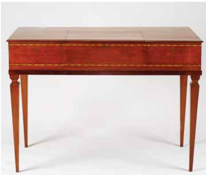
343 MÓVEL DE FAQUEIRO, Jorge III, mogno, embutidos em pau cetim, inglês, séc. XVIII/XIX, pequenos defeitos Dim. - 84 x 116,5 x 58,5 cm € 2.000 - 3.000