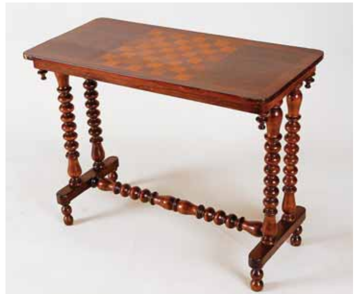
345 MESA DE JOGO, victoriana, nogueira, tampo com embutidos em mogno e pau cetim "Xadrez", pernas torneadas, inglesa, séc. XIX, pequenos defeitos Dim. - 67 x 87 x 42 cm € 400 - 600