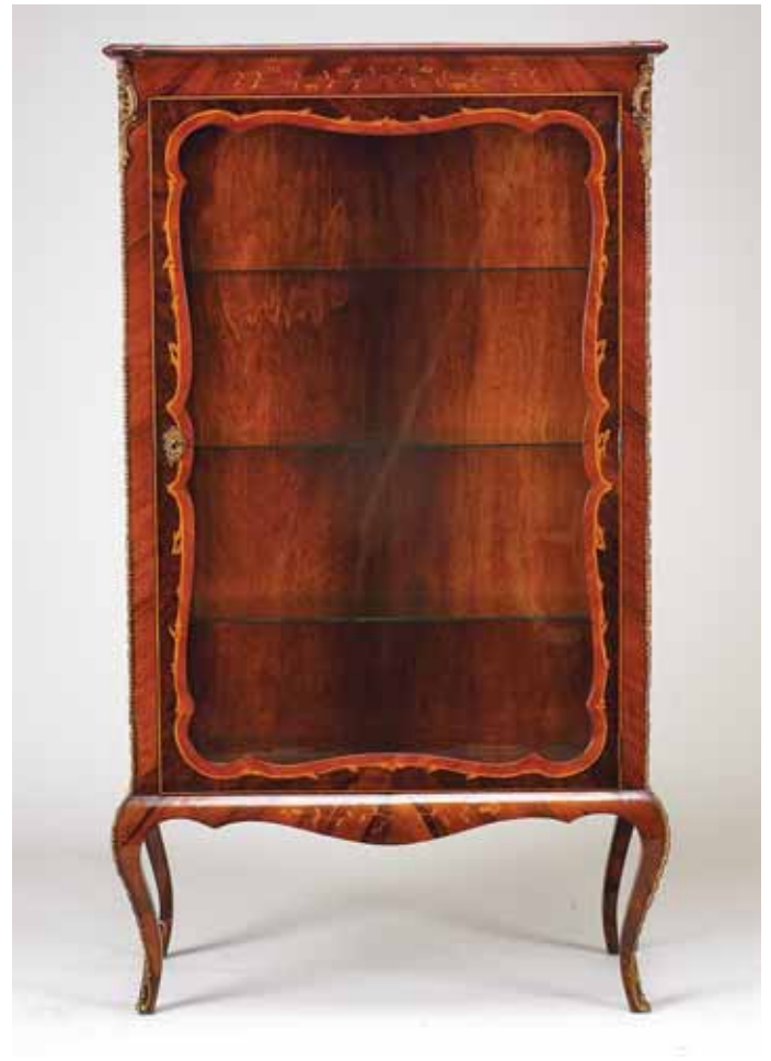
559 VITRINE , estilo Luís XV, marchetaria de pau santo e outras madeiras, ferragens em bronze, portuguesa, séc. XIX/XX, pequenos defeitos; Dim. - 130 x 73 x 34 cm € 700 - 1.050