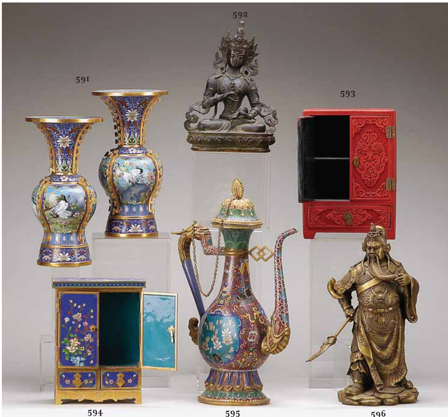
591 PAR DE JARRAS, metal cloisonné, decoração policromada "Flores e pássaros", China, séc. XX Dim. - 31,5 cm