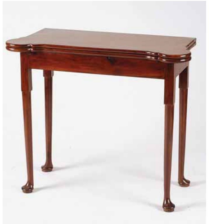
356 MESA DE JOGO, Jorge II, mogno, pés de "Bolacha", inglesa, séc. XVIII, pequenos defeitos Dim. - 73,5 x 85 x 40 cm