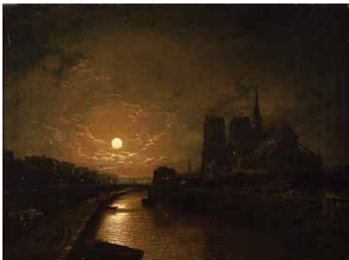
491 HENRY PETHER - SÉC. XIX, "PARIS - CATEDRAL DE NOTRE DAME AO LUAR", óleo sobre tela, reentelado e restaurado, assinado Dim. - 46 x 61 cm