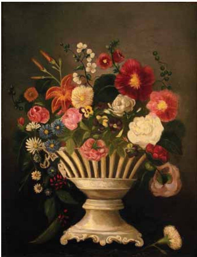
469 CORINO MILANOS - SÉC. XIX, "VASO DE FLORES", óleo sobre tela, reentelado, restaurado, assinado Dim. - 66 x 51 cm