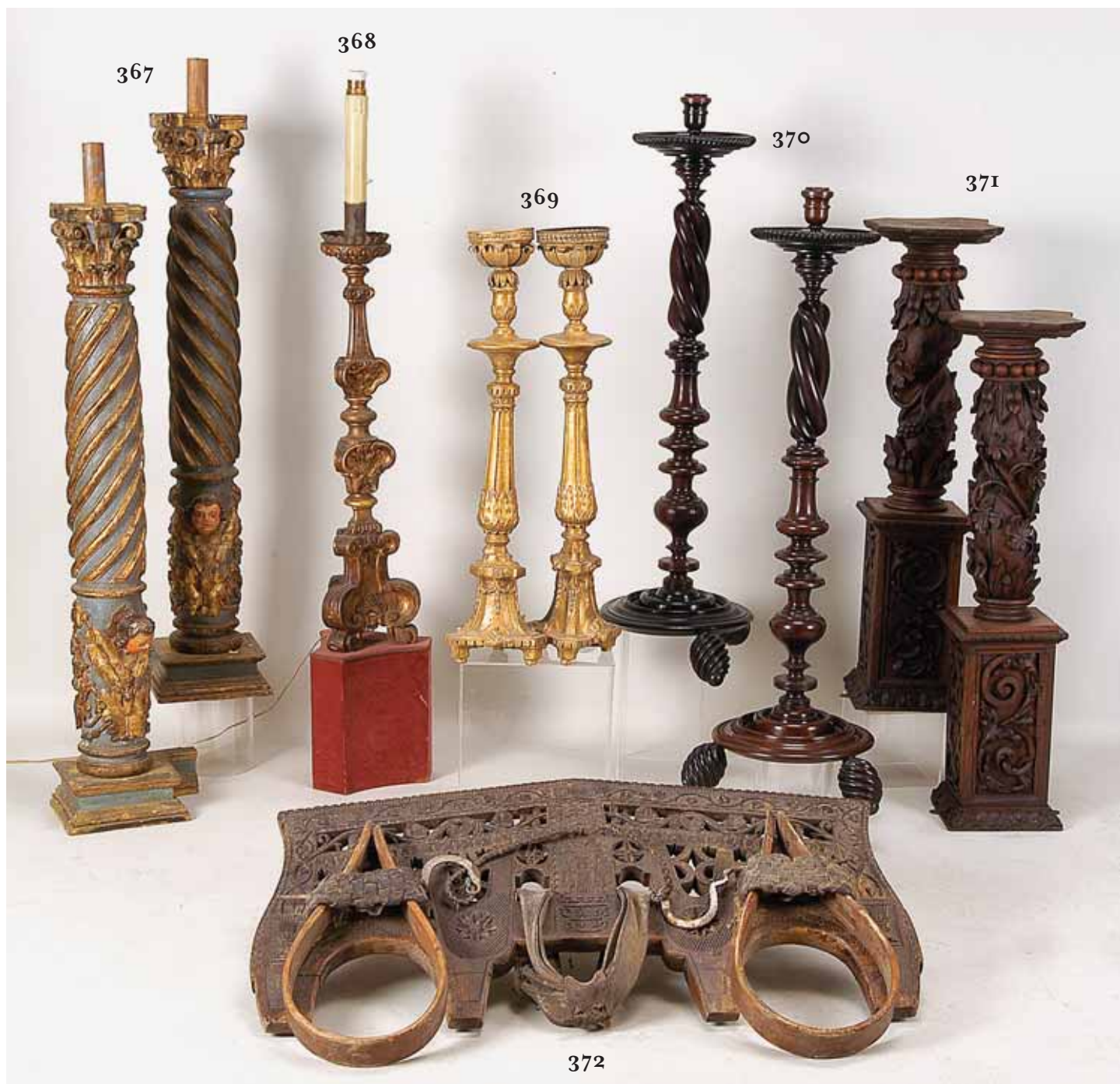
367 PAR DE COLUNAS , madeira entalhada "Anjos", portuguesas, séc. XVII pequenas faltas e defeitos Dim. - 116 cm € 800 - 1.200