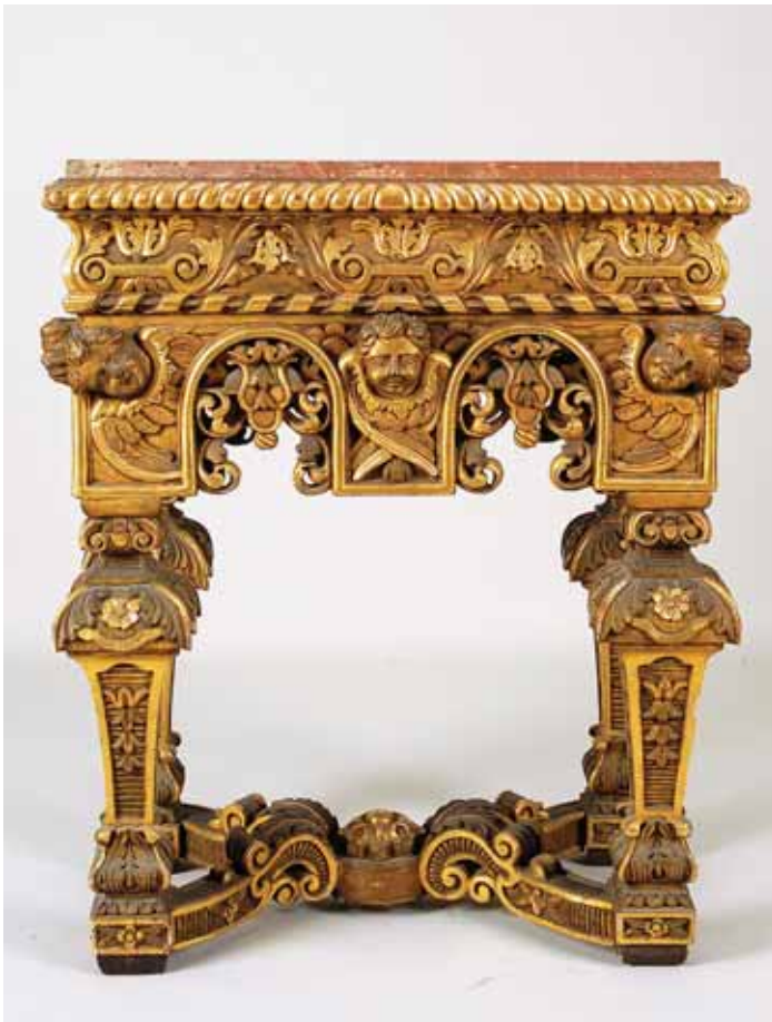
572 CRÊDÊNCIA DE CENTRO , estilo Renascença, madeira entalhada, pintada e dourada "Cabeças de anjo", tampo em mármore, Europa, séc. XIX, pequenas faltas e defeitos Dim. - 84 x 71 x 45 cm € 600 - 900