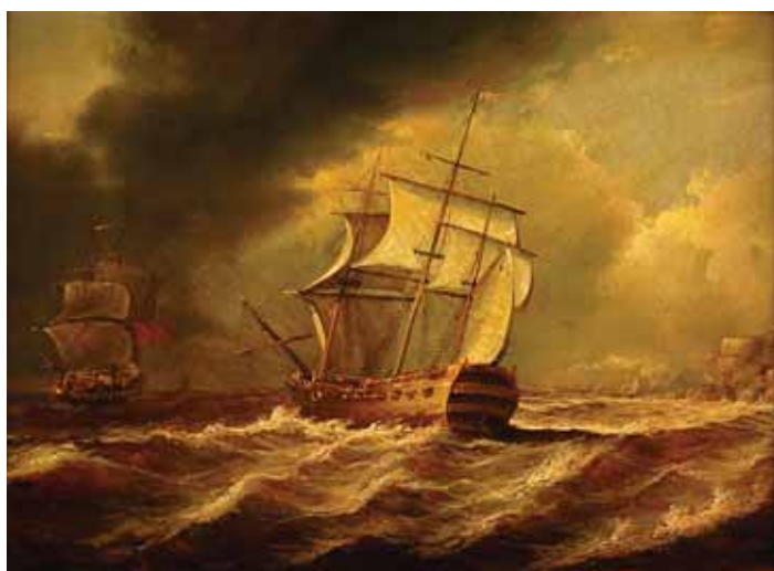
474 "MARINHA - DOIS NAVIOS", óleo sobre madeira, escola inglesa, séc. XIX Dim. - 25 x 35 cm € 600 - 900