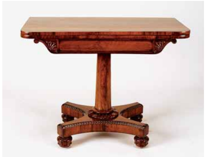
349 MESA DE CHÁ , victoriana, pau santo, coluna central, inglesa, séc. XIX, pequenos defeitos Dim. - 71 x 92 x 45 cm € 600 - 900