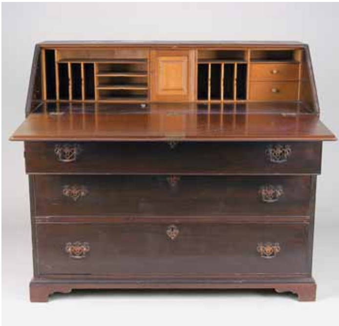
329 PAPELEIRA, estilo Jorge III, mogno, inglesa, séc. XIX, faltas e defeitos Dim. - 104 x 118 x 55 cm € 500 - 750