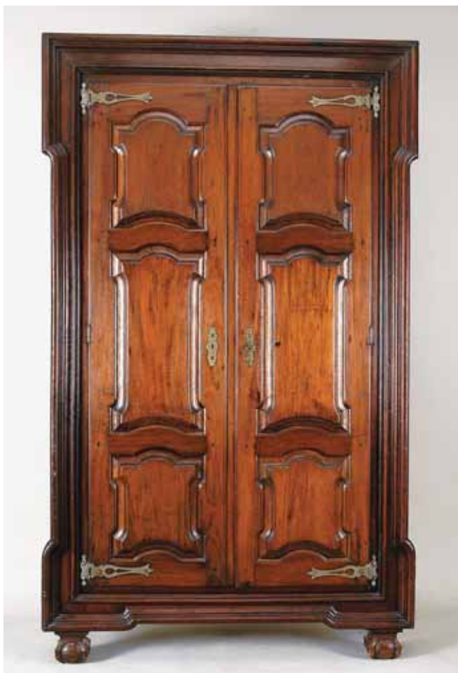
350 ARMÁRIO DE DUAS PORTAS, mogno, portas apaineladas, ferragens em ferro estanhado, Europa, séc. XX, faltas, pequenos defeitos Dim. - 226 x 134 x 48 cm € 400 - 600