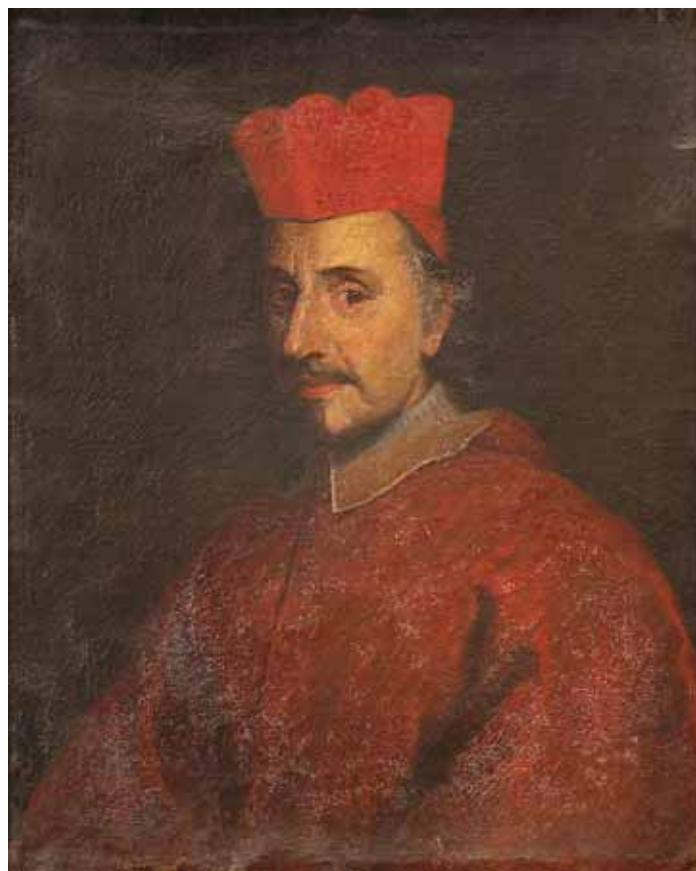
492 "RETRATO DE CARDEAL", óleo sobre tela, Europa, séc. XVIII, muito mau estado Dim. - 74 x 61 cm