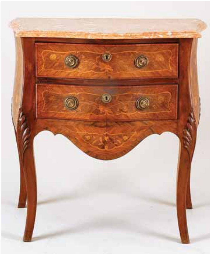
342 CÓMODA, estilo Luís XV, marchetaria de pau santo, espinheiro e pau rosa "Flores", ferragens em metal amarelo, tampo de mármore, portuguesa, séc. XIX/XX, pequenos defeitos Dim. - 79,5 x 78,5 x 50,5 cm € 600 - 900