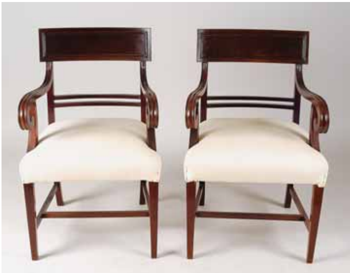
546 PAR DE CADEIRAS DE BRAÇOS , mogno, assentos estofados, inglesas, séc. XIX, pequenos defeitos, estofa em tecido cru moderno; Dim. - 87 x 58 x 55 cm € 400 - 600