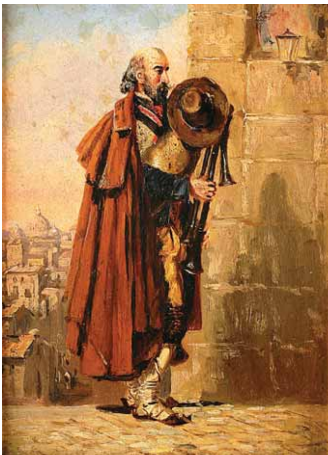
490 "GAITEIRO COM ROMA EM FUNDO", óleo sobre cartão, escola italiana, séc. XIX Dim. - 18 x 12,5 cm