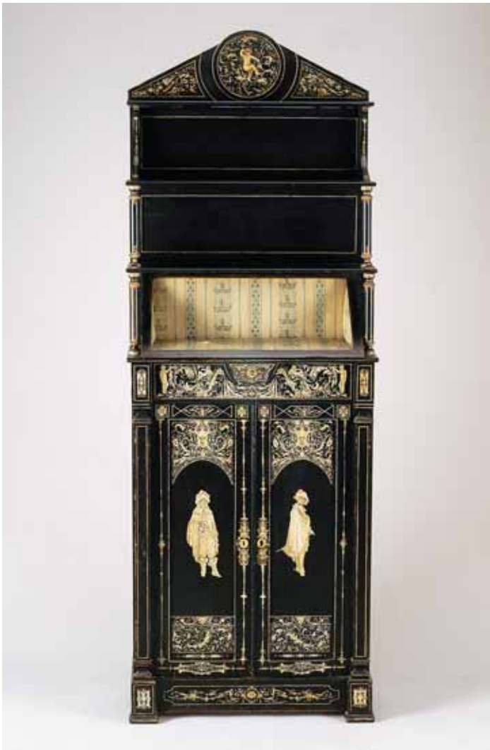
332 ARMÁRIO COM ALÇADO , madeira pintada de negro, embutidos em marfim "Figuras", Europa, séc. XIX, pequenos defeitos Dim. - 190 x 78 x 39 cm € 2.000 - 3.000