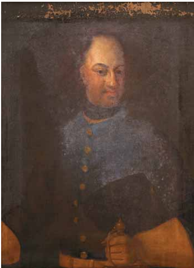
465 "RETRATO DE CARLOS XII, REI DA SUÉCIA", óleo sobre tela, Europa, séc. XVIII, muito mau estado Dim. - 88 x 65 cm € 500 - 750