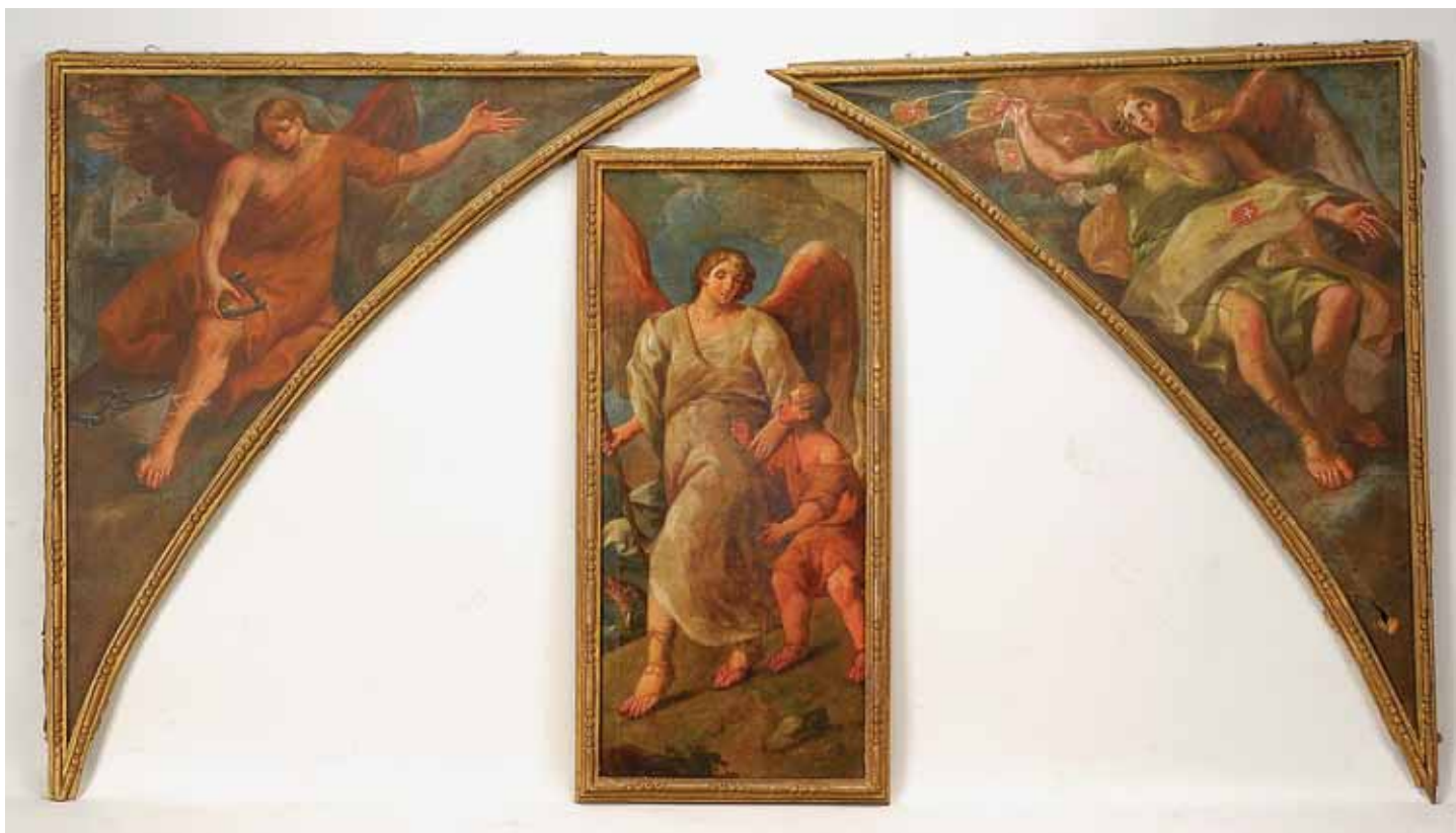
458 "TOBIAS E O ANJO", "ANJO COM ESCAPULÁRIO" E "ANJO ACORRENTADO",

três óleos sobre tela com recorte das molduras formando um arco, escola portuguesa, séc. XVIII, defeitos Dim. - 107 x 50cm (tela central) e 100 x 112 cm (os arcos) €1.500 - 2.250