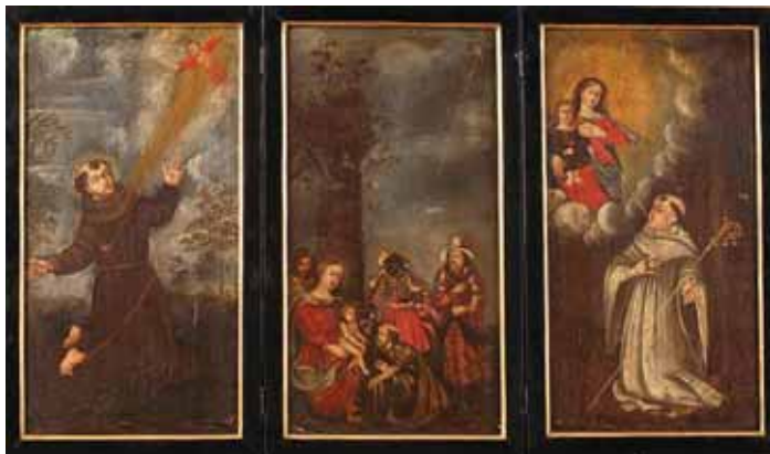
455 "ADORAÇÃO DOS REIS MAGOS", "SÃO FRANCISCO DE ASSIS" E "SÃO BERNARDO", três óleos sobre portas de oratório em madeira, escola portuguesa, séc. XVII, adaptadas a tríptico Dim. - 40,5 x 22 cm (cada)