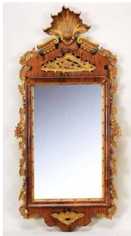
407 ESPELHO, estilo D. José, moldura em madeira revestida a pau santo com entalhamentos dourados, português, séc. XIX, pequenos defeitos Dim. - 106 x 51 cm