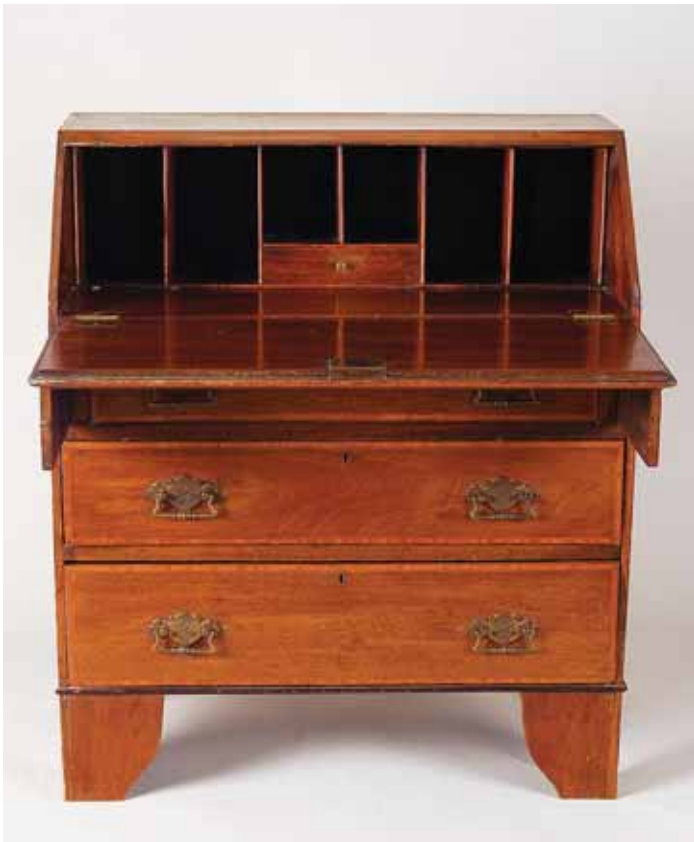
354 PAPELEIRA DE PEQUENAS DIMENSÕES, eduardiana, mogno, embutidos em pau cetim, inglesa, séc. XIX/XX, pequenos defeitos Dim. - 89 x 105 x 40 cm