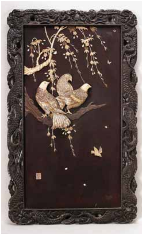
411 "AVES EM RAMOS" , painel em madeira pintada de negro com relevos em marfim, madreperola e outros materiais, moldura em madeira entalhada e vazada "Dragões", chinês, séc. XIX/XX, pequenas faltas, assinado; Dim. - 106 x 64 cm (total) € 400 - 600