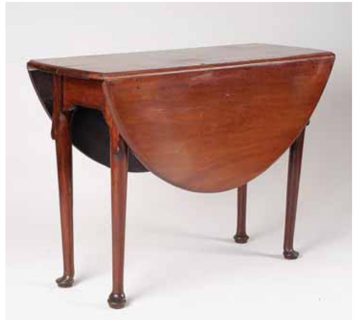
578 MESA DE ABAS, mogno, abas redondas, portuguesa, séc. XIX, pequenos defeitos Dim. - 72 x 100 x 40 cm (fechada)