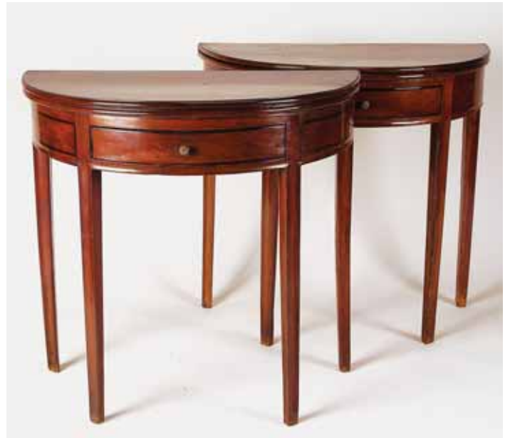
357 PAR DE MESAS DE JOGO DE MEIA LUA, Jorge III, mogno, faixas em pau santo, inglesas, séc. XVIII/XIX, pequenos defeitos Dim. - 78 x 82 x 40 cm