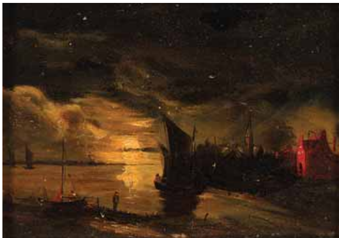
470 "NOCTURNO - PORTO DE MAR", óleo sobre madeira, escola europeia, séc. XIX Dim. - 16 x 22 cm