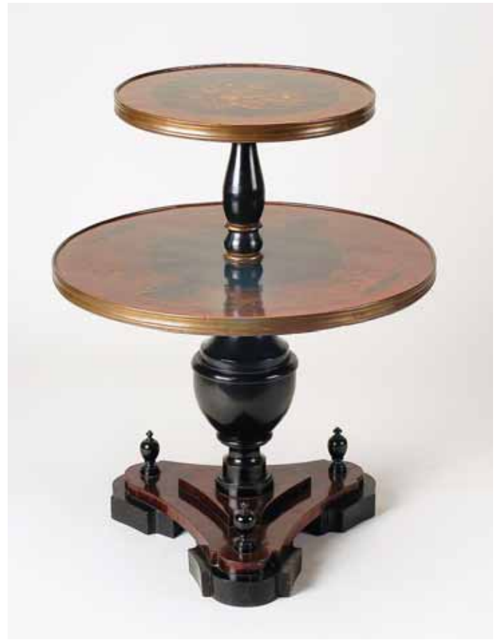
574 DUMB-WAITER , marchetaria em várias madeiras e madrepérola, pé central em mogno, inglês, séc. XIX, pequenos defeitos Dim. - 82,5 x 65 cm € 1.200 - 1.800