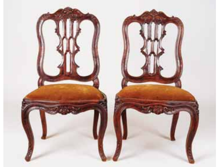
575 PAR DE CADEIRAS , D. José ao gosto francês, nogueira entalhada, tabela recortada e vazada, coxins estofados a veludo verde, portuguesas, séc. XVIII (3º quartel), coxins não originais, faltas e defeitos; Dim. - 95 x 52 x 43 cm € 600 - 900