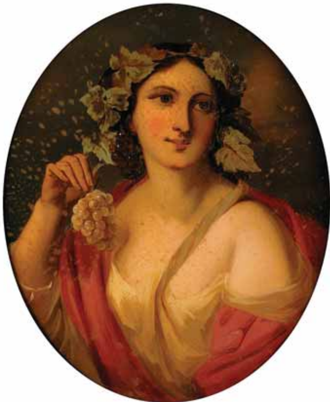
461 "BACANTE - OUTONO" , pintura sobre vidro, Europa, séc. XIX, faltas na pintura Dim. - 54 x 46 cm