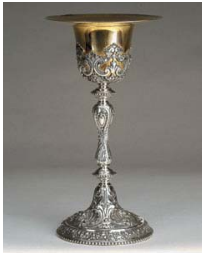
1046 CÁLICE E PATENA , prata, contraste Javali do Porto (1887-1937) português, séc. XIX/XX; Dim. - 30,5 cm; Peso - 625 grs. € 350 - 525