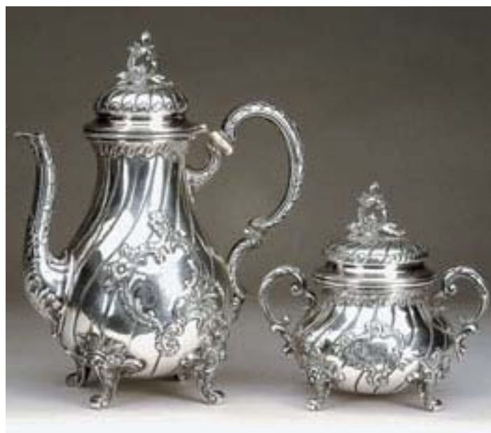
1047 CAFETEIRA E AÇUCAREIRO , prata, contraste de Moscovo (1896) marca de Karl Fabergé, russos, séc. XIX, datado Dim. - 26 cm (cafeteira); Peso - 1586 grs. € 1.800 - 2.700