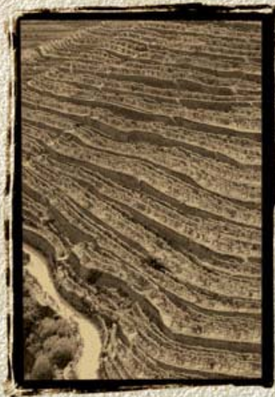
Região Vinícola do Alto Douro Patrimônio Mundial UNESCO 2001