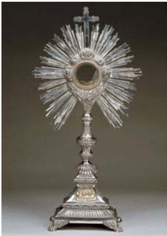
1044 CUSTÓDIA , prata e prata dourada, francesa, séc. XIX/XX, amolgadelas, marcada; Dim. - 47 cm; Peso - 562 grs. € 500 - 750