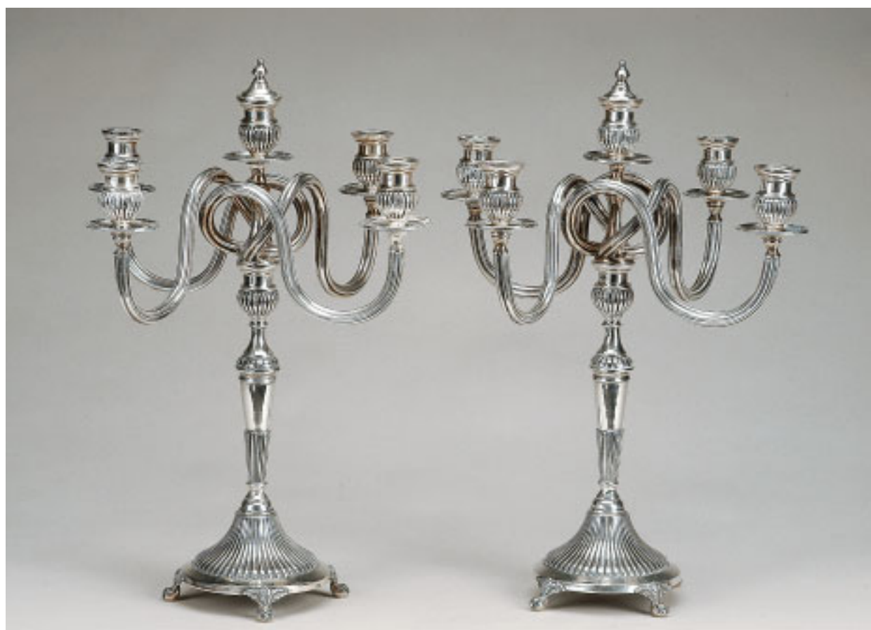
II70 PAR DE CANDELABROS DE CINCO LUMES, estilo D. Maria, prata, contraste Águia do Porto (1938-1984) (Vidal - 49), portugueses, séc. XX Dim. - 45 cm Peso - 2.763 grs. €1.400 - 2.100