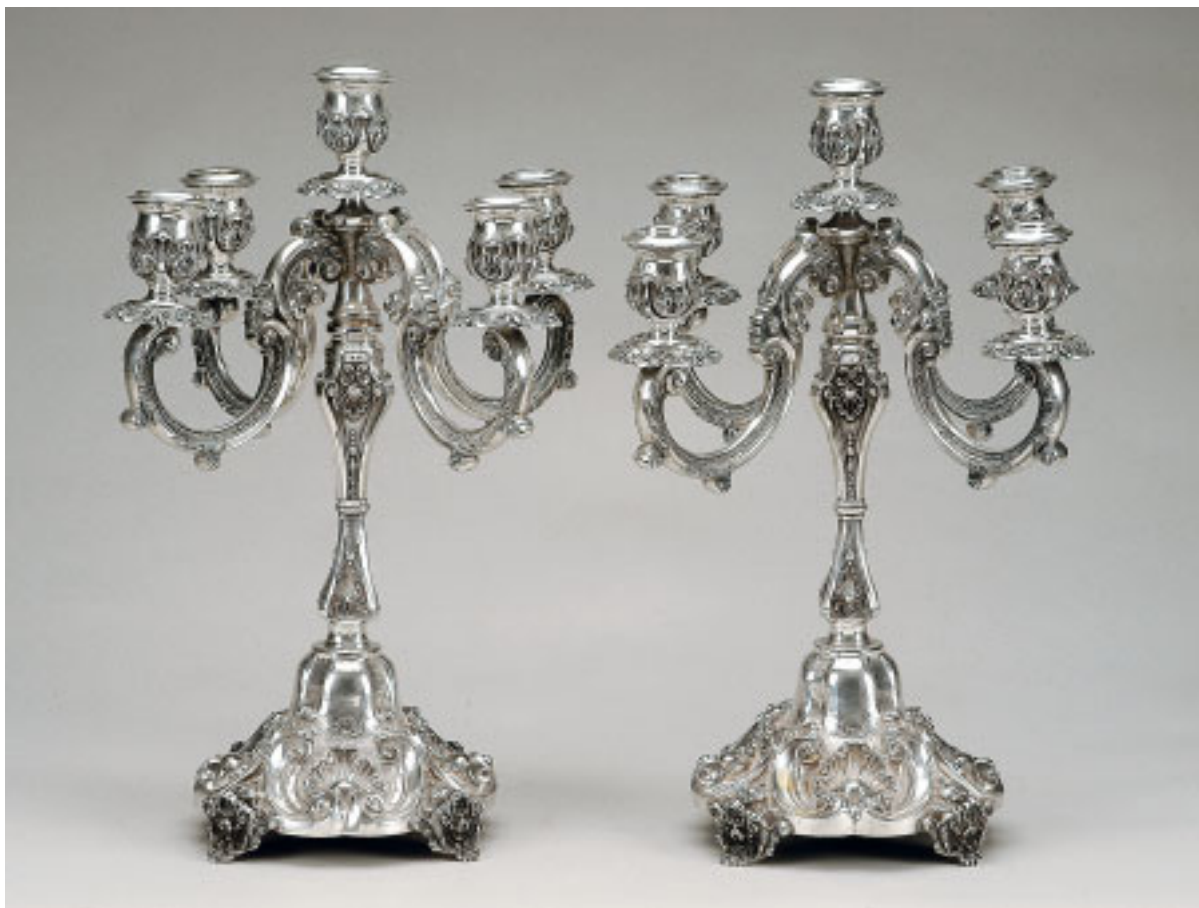
II69 PAR DE CANDELABROS DE CINCO LUMES, estilo D. João V, prata, contraste Águia do Porto (1938-1984) (Vidal - 49), portugueses, séc. XX Dim. - 45 cm Peso - 6.019 grs. €1.500 - 2.250