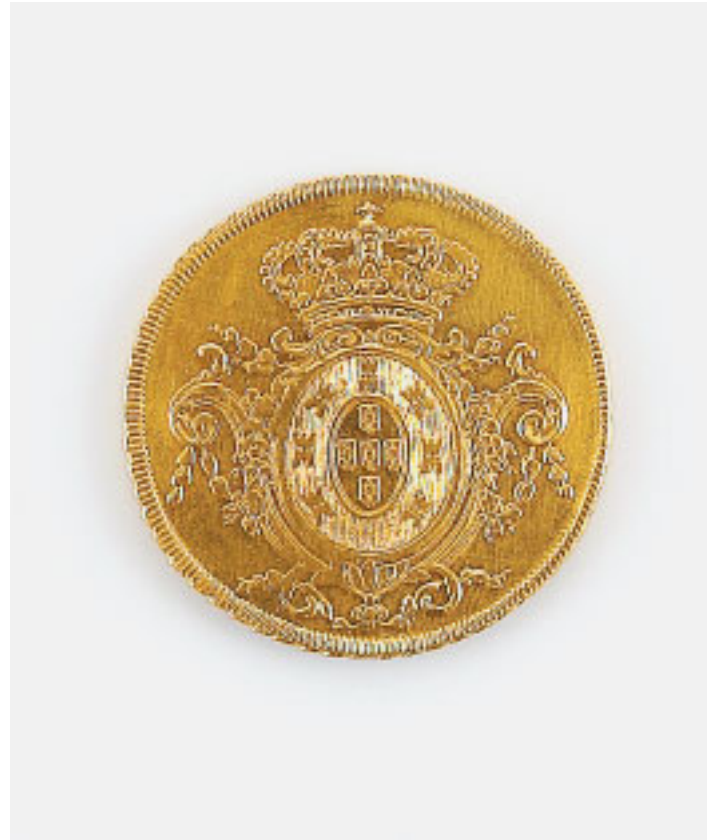
1076 D. JOÃO VI - 1816-1826, PEÇA, ouro,

Rio de Janeiro, 1810, A.G. JR-33.12, MBC+ Dim. - 3,1 cm; Peso - 14,1 grs.