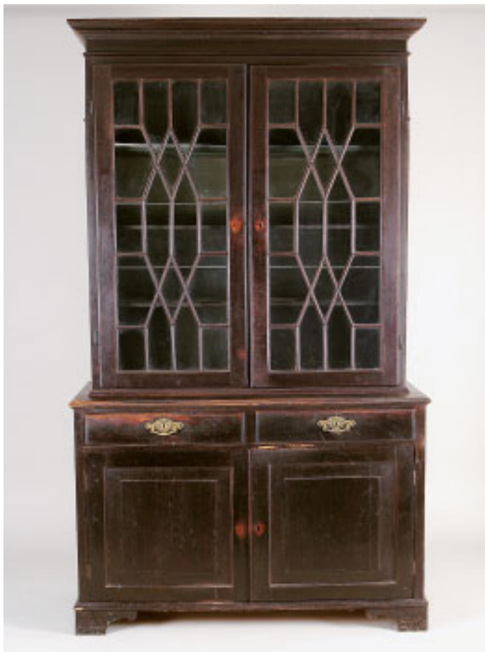
365 ARMÁRIO LOUCEIRO, estilo D. Maria, mogno, corpo superior com vidrinhos, português, séc. XIX, pequenas faltas e defeitos Dim. - 234 x 120 x 53 cm € 800 - 1.200