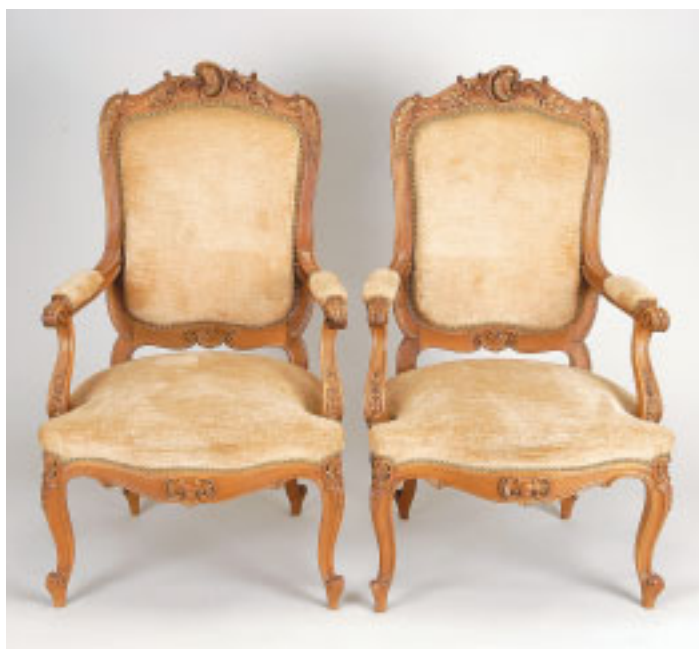
576 PAR DE CADEIRÕES DE BRAÇOS, noqueira com entalhamentos, assentos e costas estofados a veludo, portugueses, séc. XX, vestígios de dourado Dim. - 111 x 63,5 x 55 cm € 420 - 630