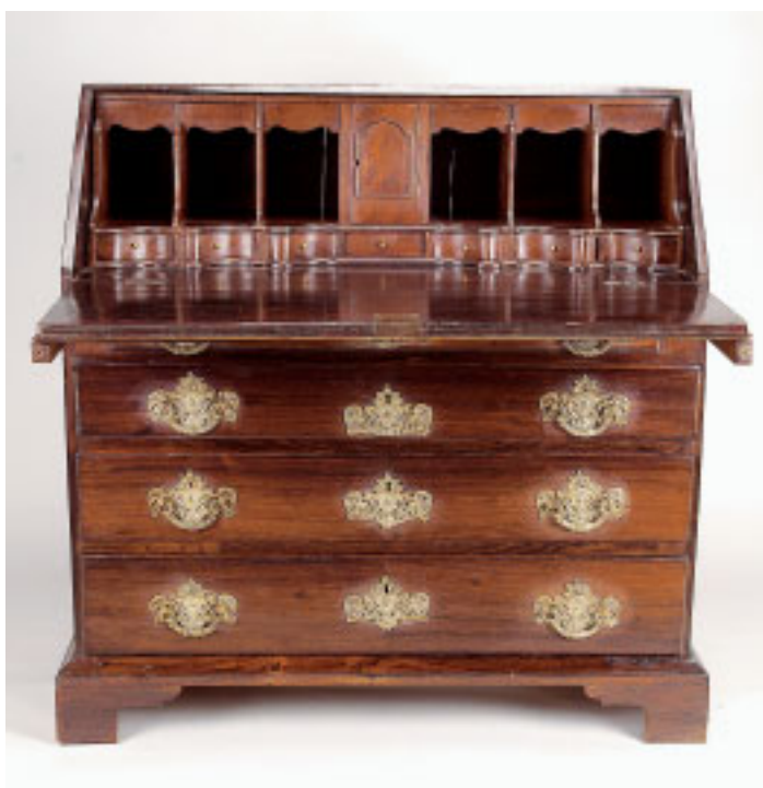
374 PAPELEIRA, D. Maria, madeira folheada a pau santo, interior com gavetas e escaninhos em sicupira, ferragens em bronze, portuguesa, séc. XVIII/XIX, restauros, faltas e defeitos Dim. - 111 x 112 x 54 cm