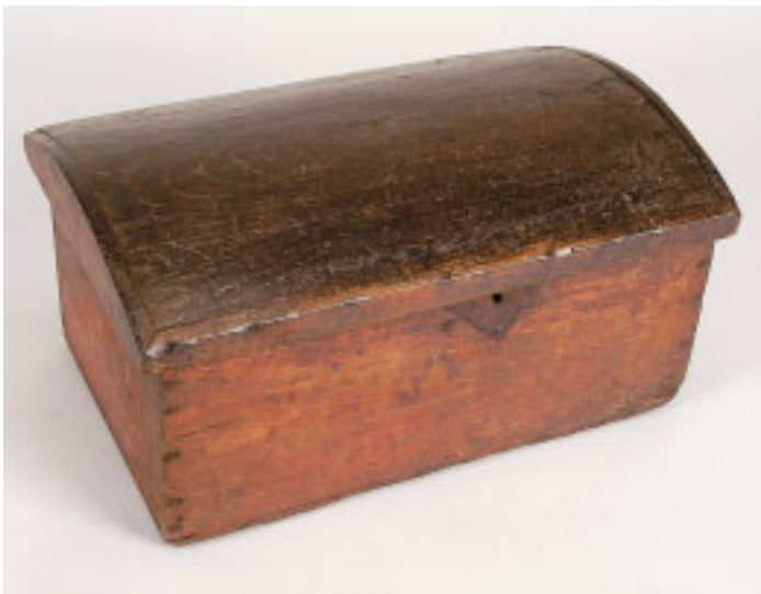
553 BAÚ DE PEQUENAS DIMENSÕES , castanho com restos de pintura vermelha, ferragem em ferro, português, séc. XVIII, muitas faltas na pintura Dim. - 24,5 x 48 x 31 cm € 200 - 300