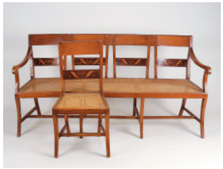
555 CANAPÉ E SEIS CADEIRAS , mogno, embutidos em espinheiro "Enrolamentos", assentos e costas em palhinha, portugueses, séc. XIX, faltas e pequenos defeitos Dim. - 86 x 160 X 55 cm € 1.200 - 1800