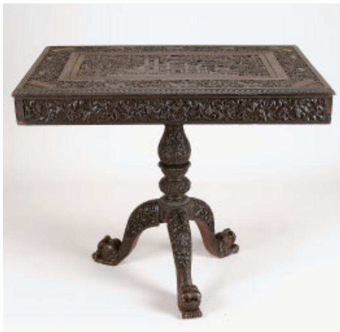
577 MESA DE PÉ DE GALO, sissó entalhado, tampo rectangular, decoração central "Paisagem com Igreja e animais diversos", friso "Animais e vasos com flores", pés "Cabeças e patas de leão", goesa, séc. XIX, defeitos; Dim. - 84 x 97 x 66 cm € 1.000 - 1.500