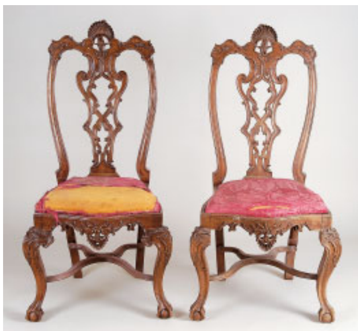
371 PAR DE CADEIRAS DE ESPALDAR ALTO, estilo D. José, mogno com entalhamentos, assentos estofados a seda adamascada, portuguesas, séc. XIX/XX, pequenos defeitos, estofos em mau estado Dim. - 126 x 57 x 64 cm € 500 - 750