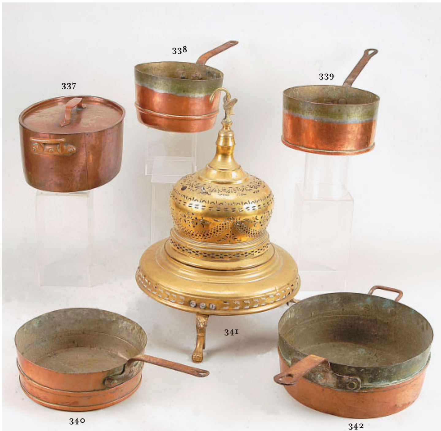
337 PANELA OVAL COM TAMPA, cobre, portuguesa, séc. XIX, pequenas amolgadelas Dim. - 23 x 54 x 32 cm