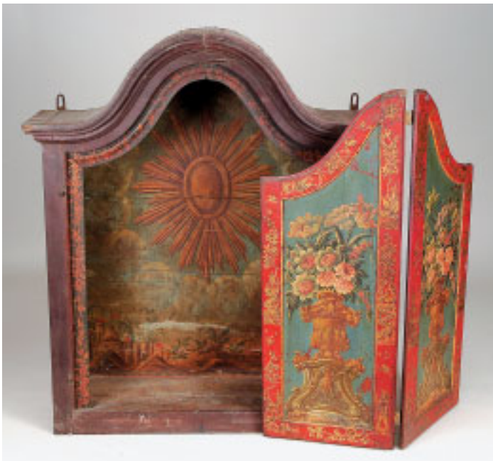
557 ORATÓRIO , D. Maria, vinhático, interior pintado, portas pintadas com "Flores", português, séc. XVIII/XIX, portas retiradas e adaptadas a pára-fogo, faltas e defeitos Dim. - 122 x 104 x 34 cm € 800 - 1.200