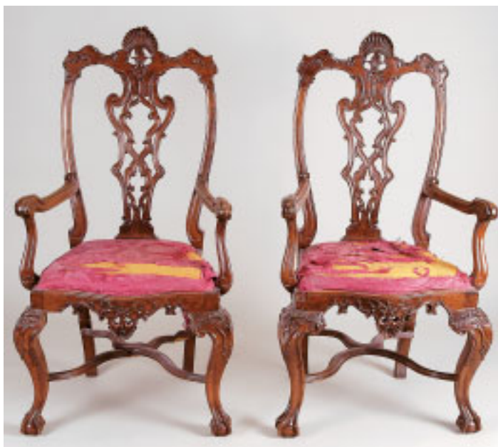
369 PAR DE CADEIRAS DE ESPALDAR ALTO COM BRAÇOS, estilo D. José, mogno com entalhamentos, assentos estofados a seda adamascada, portuguesas, séc. XIX/XX, pequenos defeitos, estofos em mau estado Dim. - 127,5 x 58 x 68 cm € 700 - 1.050