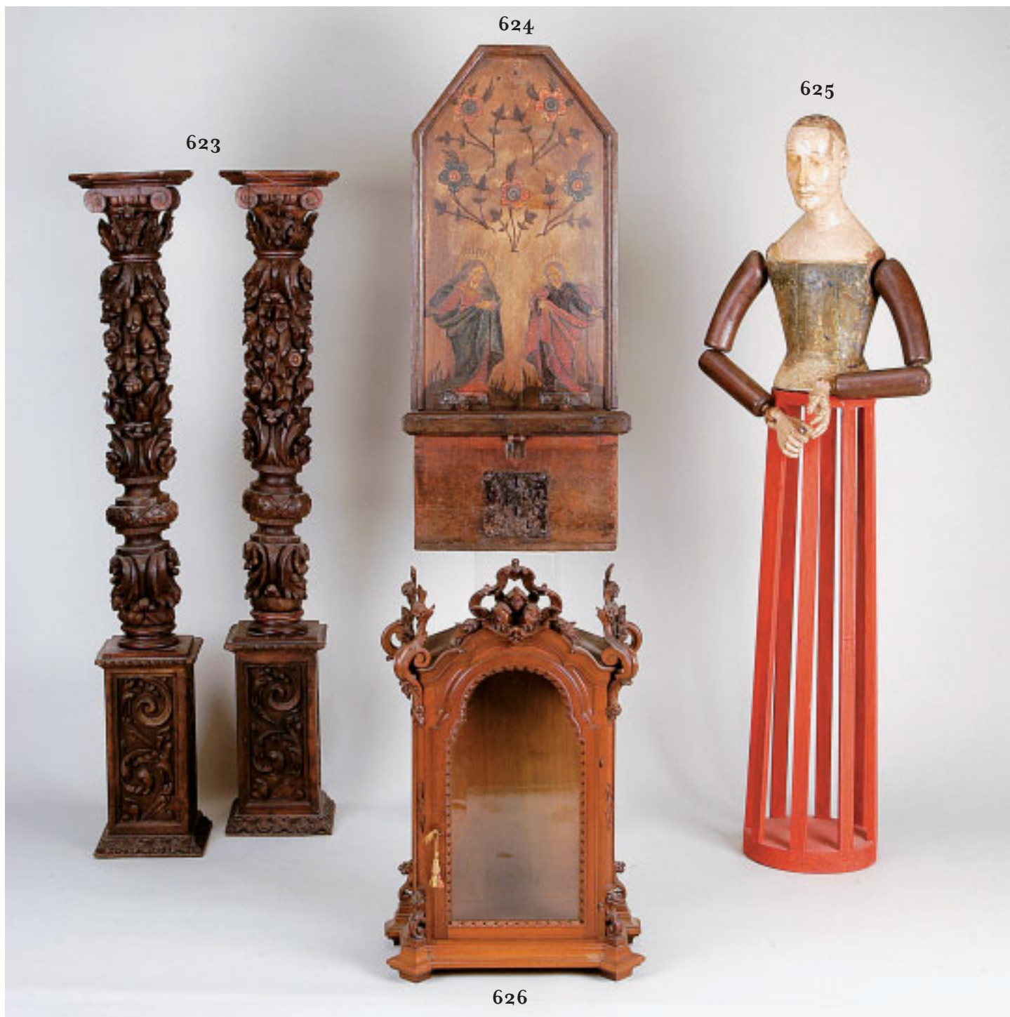
623 PAR DE COLUNAS, castanho entalhado "Folhas e frutos", ~ portuguesas, séc. XVII/XVIII, faltas e defeitos Dim. - 144,5 cm