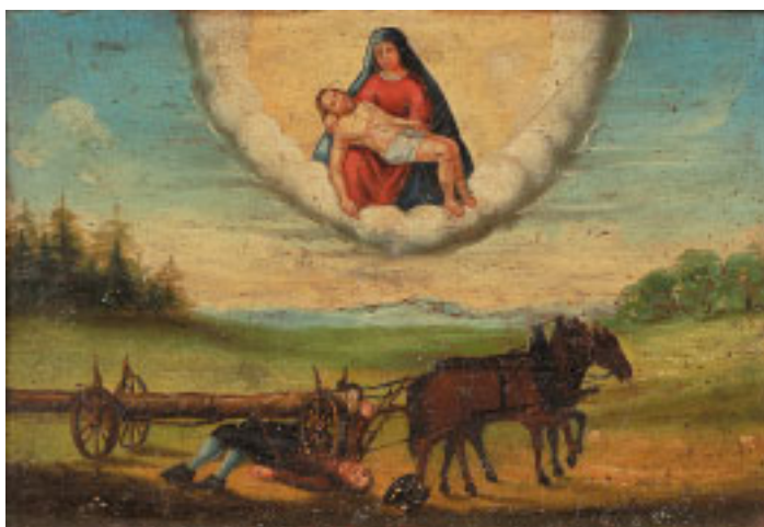
494 EX-VOTO "PIETÀ", óleo sobre madeira, português, séc. XIX, pequenos restauros Dim. - 22 x 32 cm