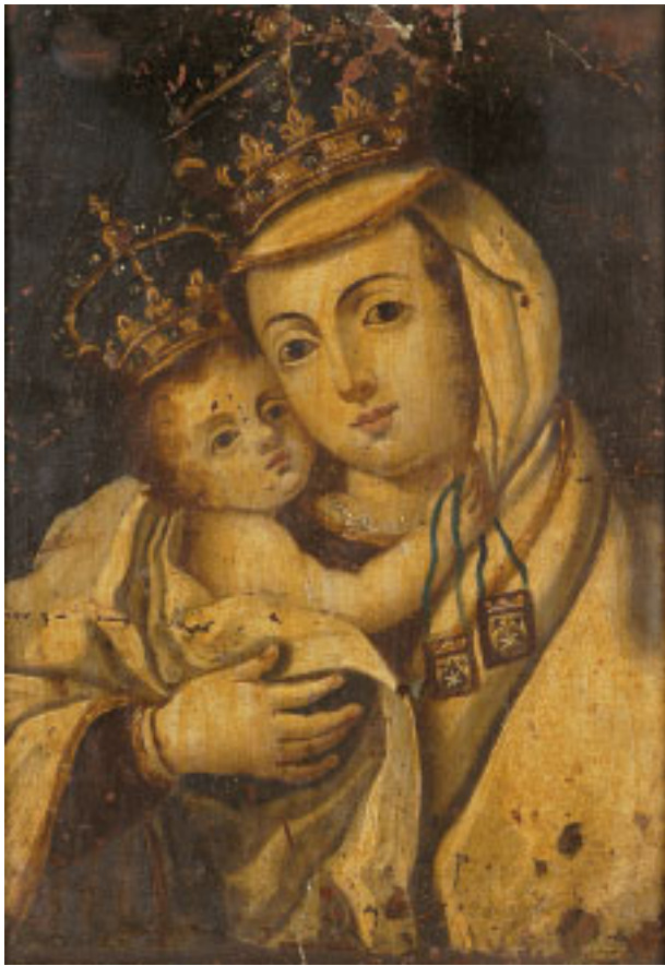
483 "NOSSA SENHORA DO CARMO" , óleo sobre cobre, escola portuguesa, séc. XVIII, pequenas faltas e defeitos Dim. - 27 x 20 cm