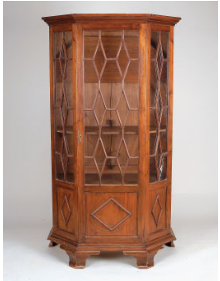
554 ARMÁRIO VITRINE FACETADO , casquinha, portas e laterais com vidrinhos, português, séc. XIX, pequenas faltas e defeitos Dim. - 170 x 90 x 40 cm € 420 - 630