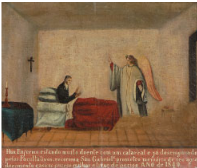
484 EX-VOTO "SÃO GABRIEL" , óleo sobre tela, português, séc. XIX, datado de 1849 Dim. - 36 x 42 cm