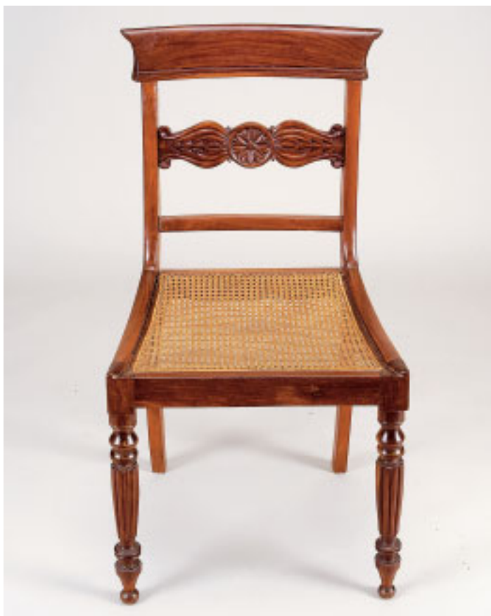
361 CONJUNTO DE OITO CADEIRAS, românticas, murta com entalhamentos, pernas caneladas, assentos de palhinha, portuguesas, séc. XIX, pequenos defeitos Dim. - 88 x 46 x 44 cm € 600 - 900