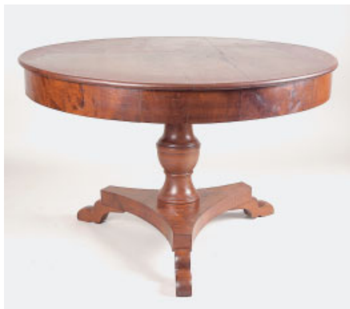
383 MESA REDONDA, nogueira, coluna central com três pés, portuguesa, séc. XIX, restauros e defeitos Dim. - 80 x 115 cm €500 - 750