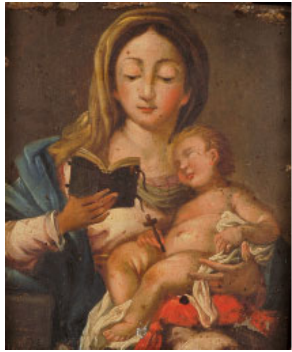
477 "NOSSA SENHORA COM O MENINO",

óleo sobre cobre, escola portuguesa, séc. XVIII/XIX, pequenos defeitos