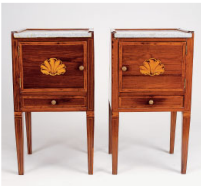
378 PAR DE MESAS DE CABECEIRA , estilo D. Maria, vinhático, embutidos em pau cetim "Concha" e "Búzio", tampo em mármore, portuguesas, séc. XIX/XX, defeitos Dim. - 73 x 39,5 x 35 cm € 600 - 900