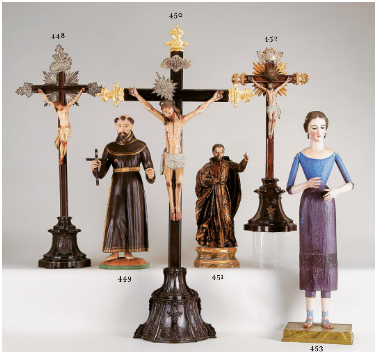
448 "CRISTO CRUCIFICADO" , escultura em madeira policromada, cruz em pau santo com aplicações em prata, portuguesa, séc. XVIII, pequenos defeitos Dim. - 102 cm € 1.000 - 1.500