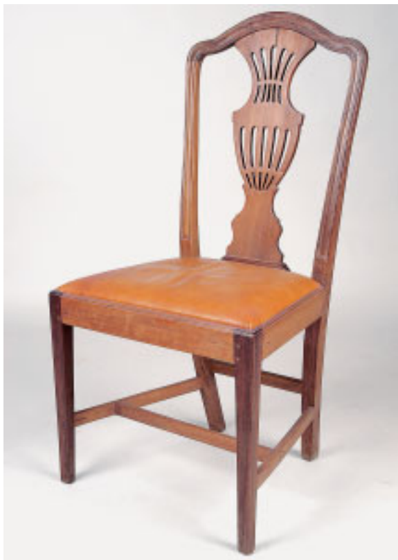
377 CONJUNTO DE OITO CADEIRAS , estilo pombalino, cinco em vinhático, três em mogno, assentos estofados, portuguesas, sécs. XIX e XX, faltas e defeitos Dim. - 100 x 50,5 x 46 cm € 1.400 - 2.100