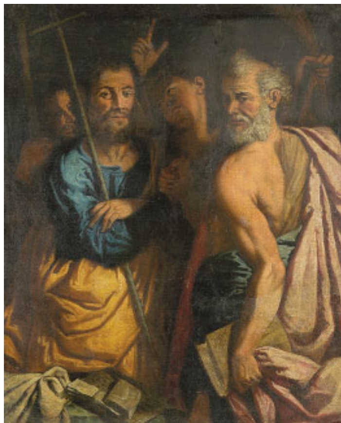
481 "CENA BIBLICA", óleo sobre tela, escola italiana, séc. XVIII, reentelado e restaurado Dim. - 158 x 130 cm € 1.800 - 2.700