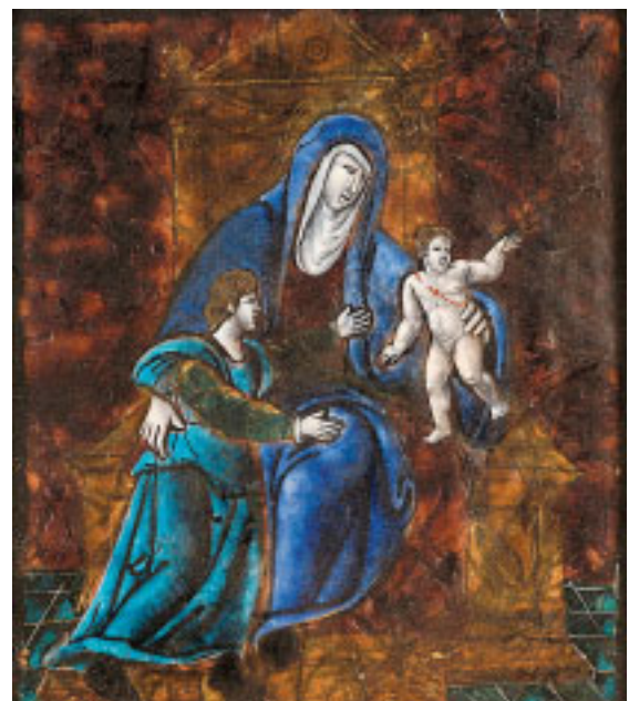
486 "SANTAS MÃES" , placa em esmalte de Limoges policromado sobre cobre, francesa, séc. XVII, pequenos defeitos Dim. - 18,5 x 16 cm