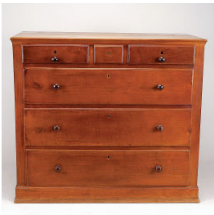
382 CÓMODA, estilo D. Maria, cerejeira, puxadores em madeira, portuguesa, séc. XIX, pequenos defeitos Dim. - 103 x 115 x 61 cm €500 - 750