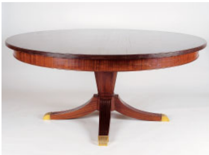
373 MESA DE CASA DE JANTAR REDONDA, estilo Jorge III, mogno, coluna central com quatro pés, ponteiros em metal amarelo, portuguesa, séc. XX, pequenos defeitos Dim. - 76 x 172 cm