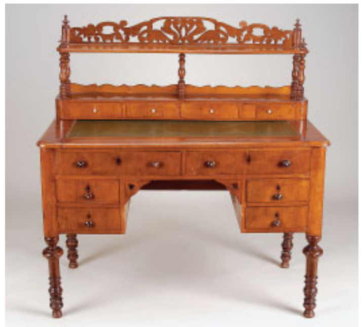
565 SECRETÁRIA COM PEQUENO ALÇADO, romântica, noqueira e raiz de noqueira, tampo com couro verde, portuguesa, séc. XIX, pequenos defeitos Dim. - 117 x 112 x 61 cm € 400 - 600