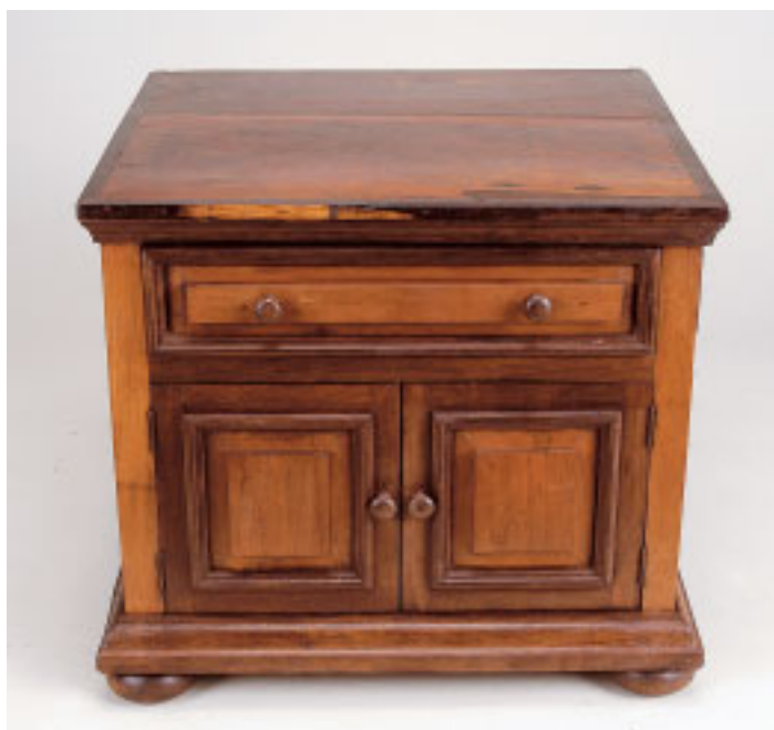
380 MÓVEL DE APOIO , estilo D. Maria, pau santo, português, séc. XX (1ª metade), pequenos defeitos Dim. - 53 x 60 x 58 cm € 250 - 375