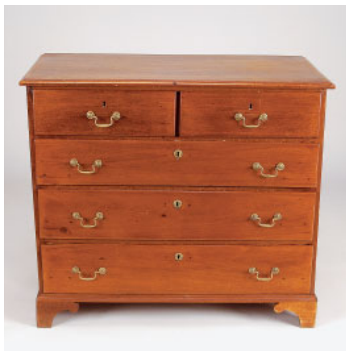
384 CÓMODA, estilo D. Maria, vinhático, puxadores em metal amarelo, portuguesa, séc. XIX, pequenos defeitos Dim. - 78 x 89 x 46 cm €1.000 - 1.500