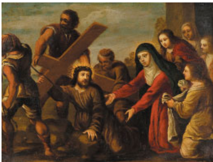
480 "SUBIDA PARA O CALVÁRIO", óleo sobre cobre, escola portuguesa, séc. XVII/XVIII, pequenos defeitos Dim. - 16 x 22 cm € 500 - 750