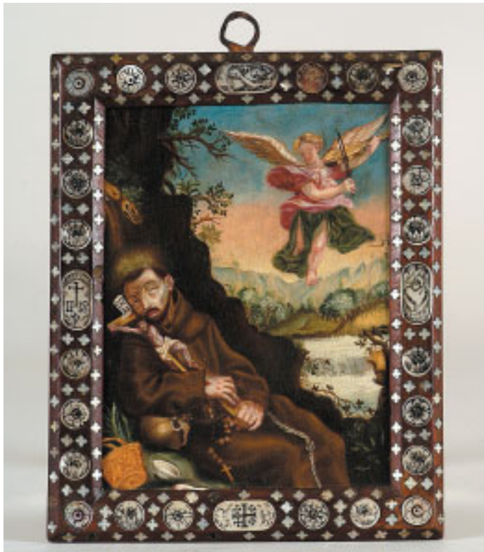
476 "SÃO FRANCISCO DE ASSIS",

óleo sobre madeira, moldura em madeira com embutidos em madreperola gravada, Europa, séc. XVIII, faltas na moldura