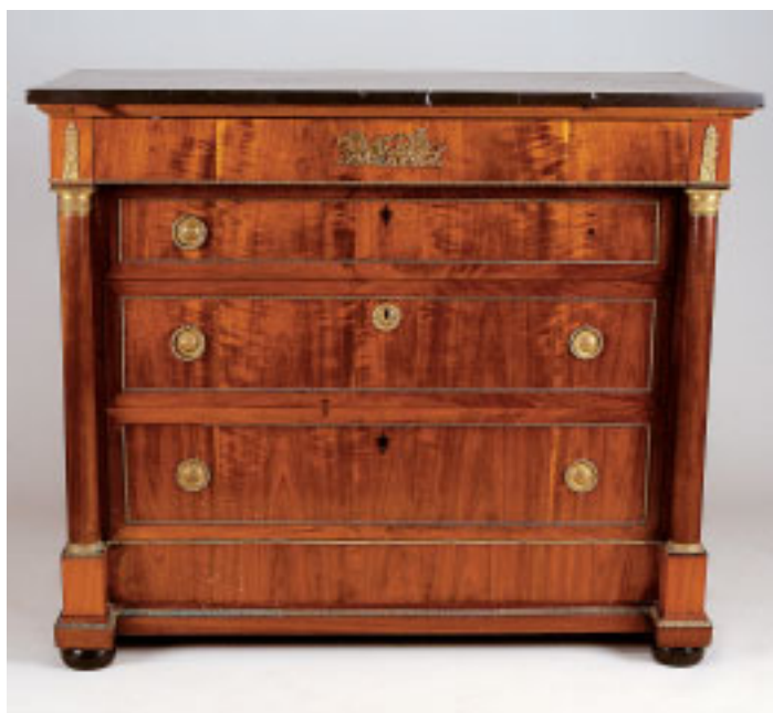
372 CÓMODA, ao gosto Império, murta, tampo em mármore negro, aplicações em bronze, portuguesa, séc. XIX, pequenos defeitos, mármore colado e com esbeçadelas Dim. - 111 x 131 x 67,5 cm € 850 - 1.275