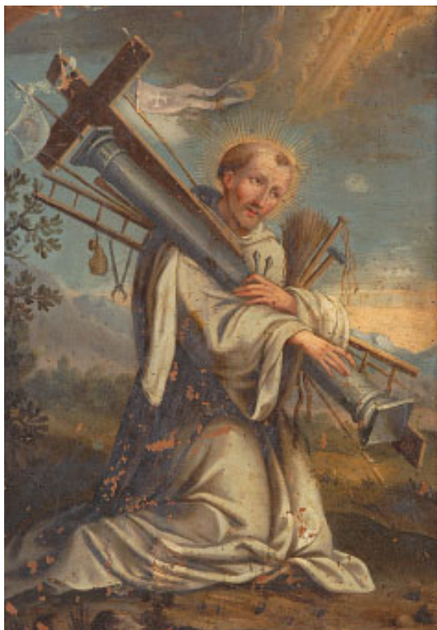
489 "SANTO COM INSTRUMENTOS DA PAIXÃO", óleo sobre cobre, escola portuguesa, séc. XVIII, pequenos defeitos Dim. - 22 x 16 cm