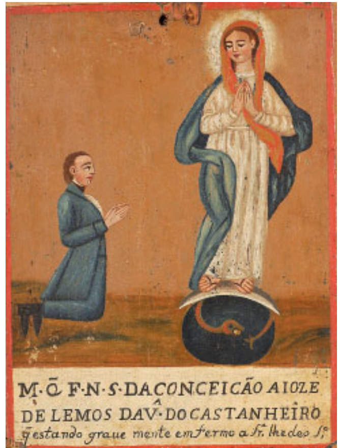
485 EX-VOTO "NOSSA SENHORA DA CONCEIÇÃO" , óleo sobre madeira, português, séc. XIX, pequenos defeitos Dim. - 24 x 18 cm