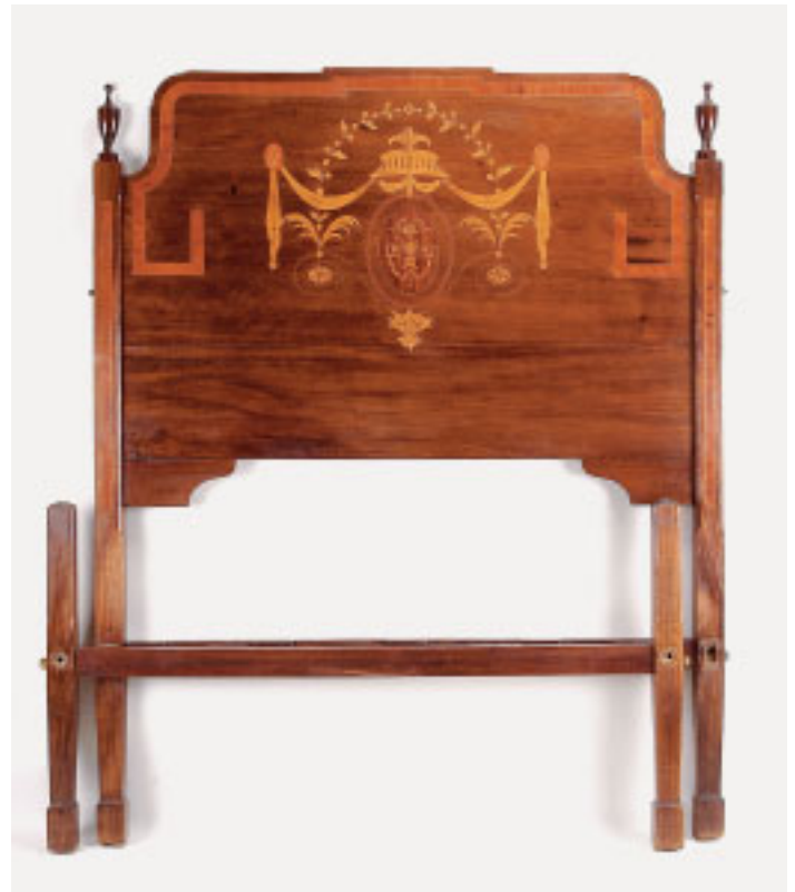
564 CAMA DE CASAL, estilo D. Maria, vinhático com embutidos "Grinaldas", portuguesa, séc. XX (1ª metade), pequenos defeitos Dim. - 175 x 182 x 142 cm € 1.400 - 2.100