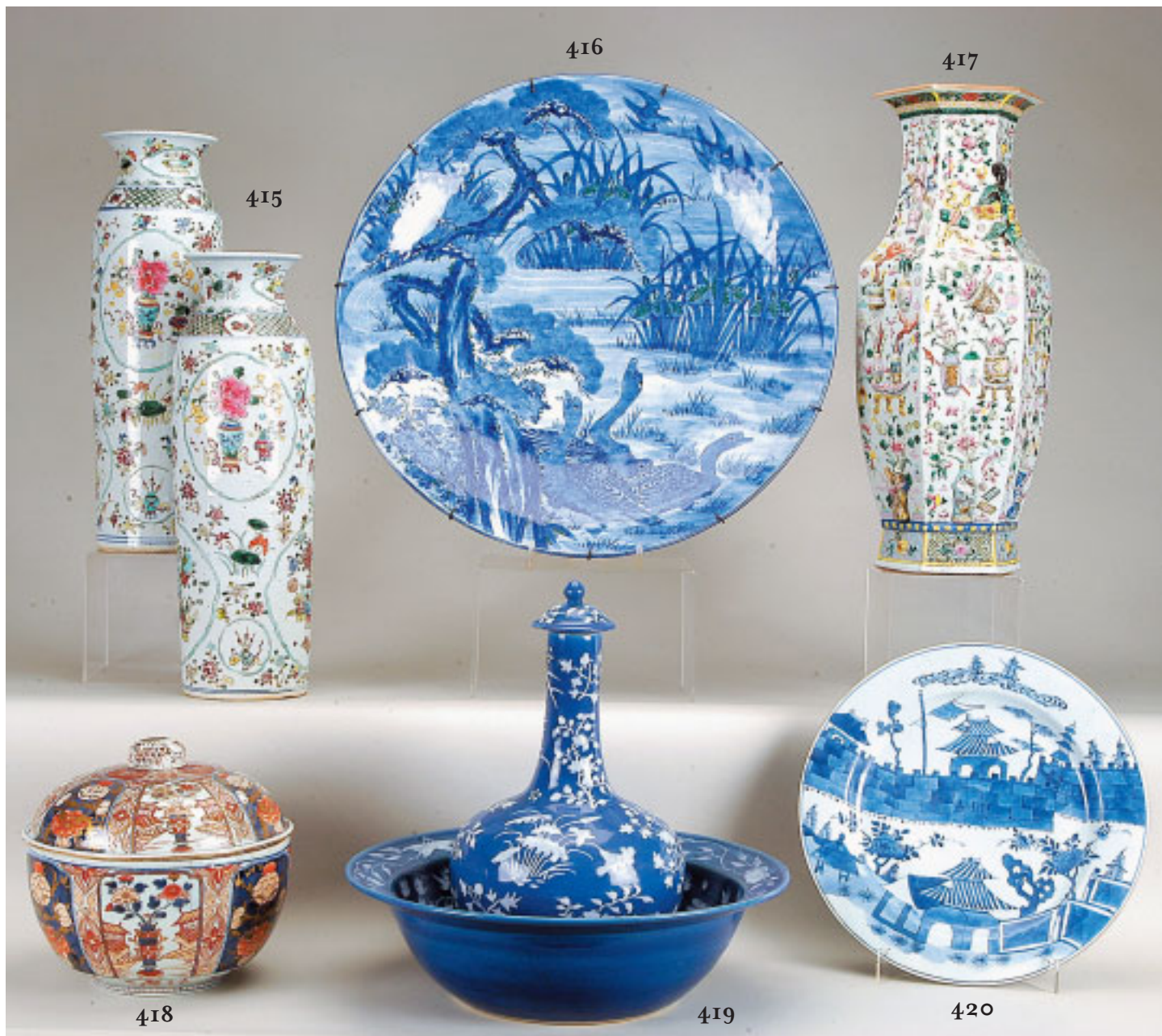
415 PAR DE JARRÕES, porcelana da China, decoração policromada "Figuras orientais", reinado Qianlong, séc. XVIII Dim. - 53 cm € 1.800 - 2.700