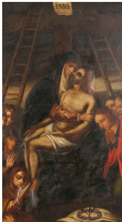
491 "PIETÀ", óleo sobre tela, escola portuguesa, séc. XVII/XVIII, reentelado, restaurado Dim. - 130 x 74 cm