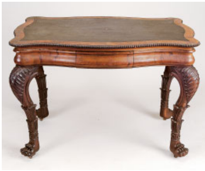
364 SECRETÁRIA, romântica, mogno e raiz de mogno, duas gavetas com divisórias, tampo forrado a couro, pé zoomórficos com rodízios, portuguesa, séc. XIX, defeitos Dim. - 70 x 98 x 60 cm € 700 - 1.050