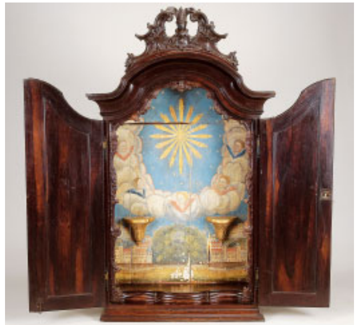
559 ORATÓRIO , D. José/D. Maria, pau santo com entalhamentos, cimalha vazada, interior pintado "Vista de Jerusalém", português, séc. XVIII, pequenas faltas e defeitos Dim. - 163 x 96 x 36 cm € 1.400 - 2.100