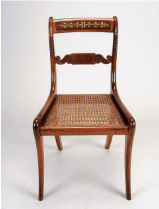
556 QUATRO CADEIRAS , Guilherme IV, mogno com embutidos e filetes em metal amarelo, assentos em palhinha, inglesas, séc. XIX, pequenos defeitos Dim. - 82,5 x 46,5 x 52 cm € 1.000 - 1.500