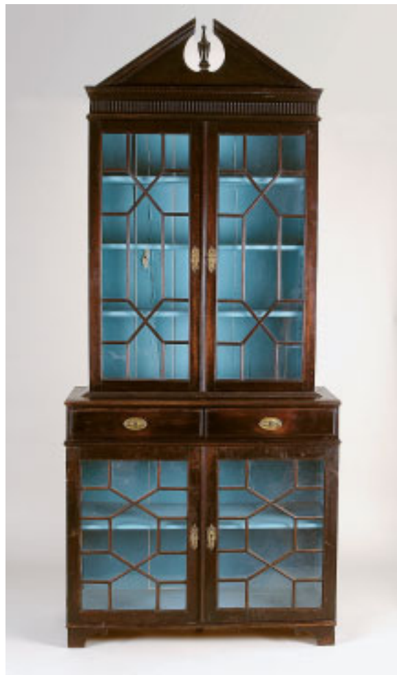
367 ARMÁRIO LOUCEIRO, estilo D. Maria, mogno, ambos os corpos com vidrinhos, português, séc. XIX/XX, pequenos defeitos Dim. - 248 x 108 x 43 cm € 700 - 1.050