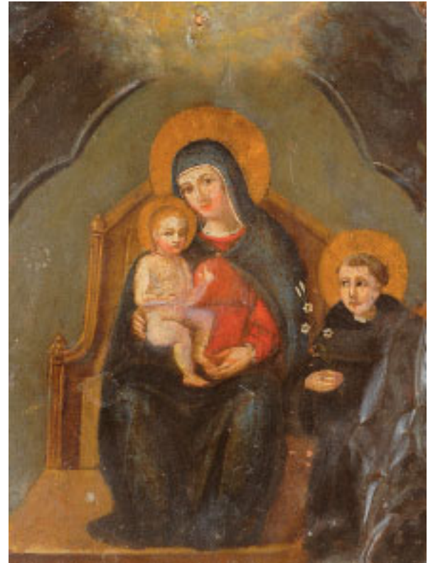
478 "NOSSA SENHORA COM O MENINO E SANTO",

óleo sobre cobre, Europa, séc. XVIII, cobre amolgado e com furo, restauros