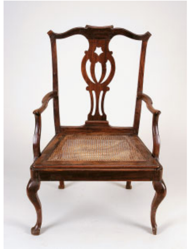
558 CADEIRA DE BRAÇOS , estilo D. José, mogno, assento em palhinha com aro em pau santo, portuguesa, séc. XIX, faltas e defeitos Dim. - 100 x 70 x 52 cm € 200 - 300