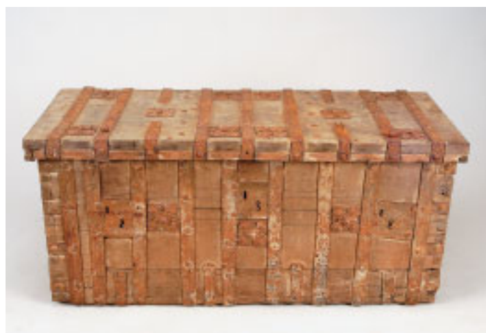
368 ARCA, sicupira, precintas e ferragens em ferro, portuguesa, séc. XVII/XVIII, faltas e defeitos Dim. - 55 x 118 x 51 cm € 800 - 1.200