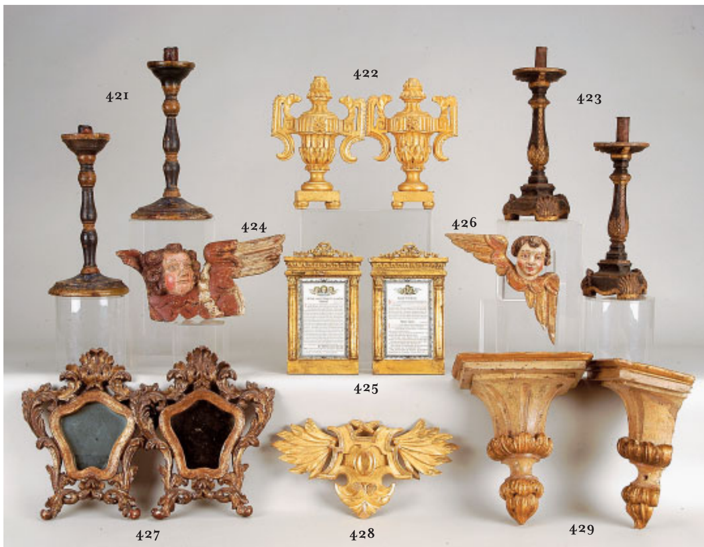
421 PAR DE TOCHEIROS, maneiristas, madeira torneada e pintada, portugueses, séc. XVII, faltas e defeitos Dim. - 37 cm € 150 - 225