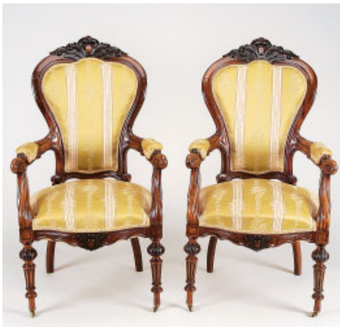
574 PAR DE CADEIRÕES DE BRAÇOS, românticos, mogno com entalhamentos, assentos e costas estofados, portuguesas, séc. XIX, pequenos defeitos Dim. - 109 x 61 x 70 cm € 800 - 1.200