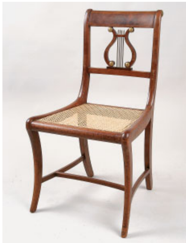
379 CONJUNTO DE SEIS CADEIRAS , nogueira e raiz de nogueira, costas com liras, aplicações em metal, assentos de palhinha, portuguesas, séc. XIX, faltas e defeitos Dim. - 86 x 44,5 x 43 cm € 1.000 - 1.500