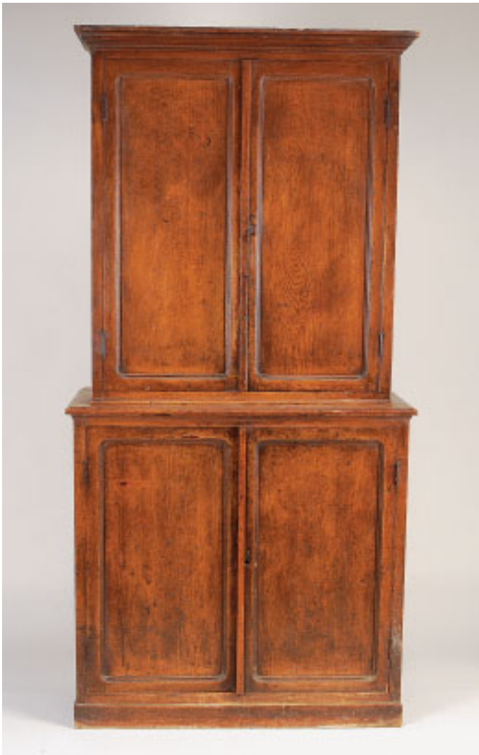
560 ARMÁRIO LIVREIRO, mogno, português, séc. XIX, pequenas faltas e defeitos Dim. - 210 x 104 x 41 cm € 700 - 1.050