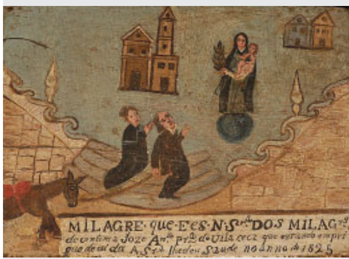
496 EX-VOTO "NOSSA SENHORA DOS MILAGRES", óleo sobre madeira, português, séc. XIX, datado de 1825 Dim. - 17 x 23 cm