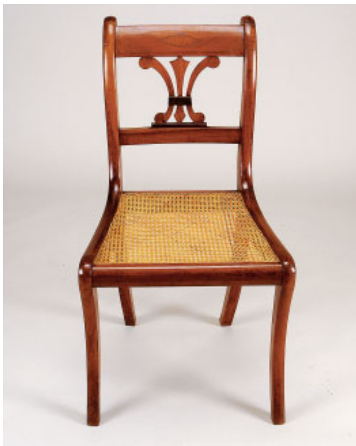
363 CONJUNTO DE SEIS CADEIRAS, murta, embutidos em pau cetim, assentos de palhinha, portuguesas, séc. XIX (1ª metade), pequenos restauros, defeitos Dim. - 86 x 47 x 521 cm € 1.500 - 2.250