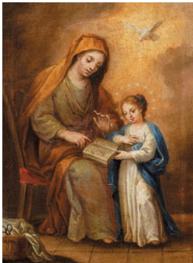
495 "SANTANA EN SINANDO NOSSA SENHORA A LER", óleo sobre tela, escola portuguesa, séc. XVIII/XIX Dim. - 44 x 34 cm