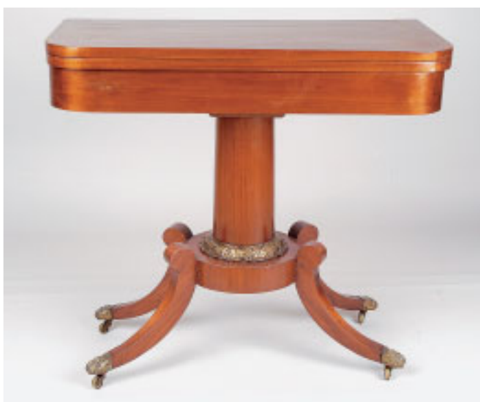
362 MESA DE JOGO, mogno, coluna central com entalhamento dourado, portuguesa, séc. XIX, pequenos defeitos Dim. - 77 x 88 x 44 cm € 300 - 450