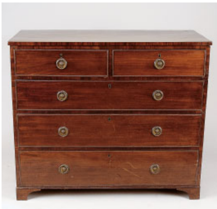
370 CÓMODA, estilo Jorge III, mogno, puxadores em metal amarelo, inglesa, séc. XIX, pequenos defeitos Dim. - 100 x 116 x 53 cm € 500 - 750