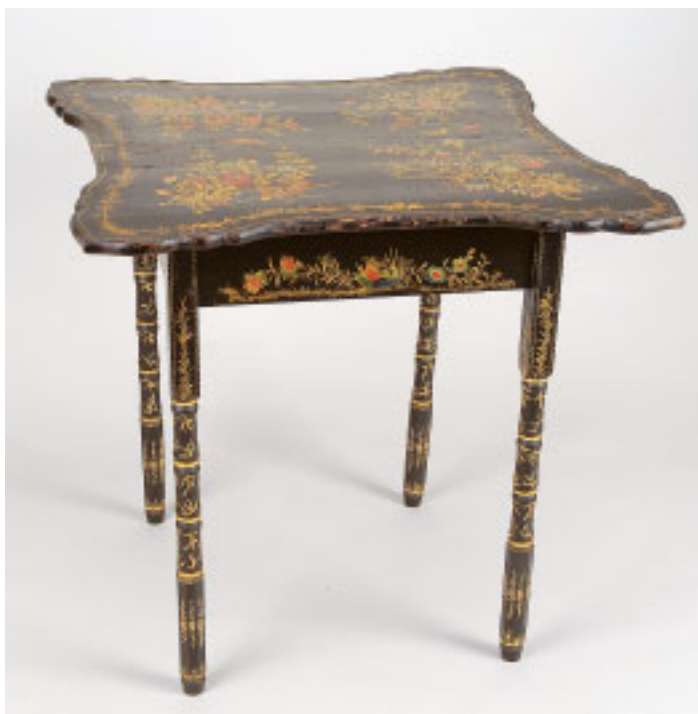
381 MESA DE JOGO, D. Maria, madeira lacada de verde, dourados "Flores", pernas "Bambu", portuguesa, séc. XVIII/XIX, alterada com tampo fixado, pernas não originais, tampo invertido, faltas e defeitos Dim. - 77 x 80 x 80 cm €1.000 - 1.500