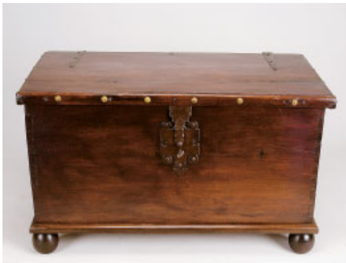
366 ARCA, sicupira com tampo em vinhático, pregaria em metal amarelo, ferragens em ferro, portuguesa, séc. XVIII/XIX, pequenos defeitos Dim. - 63,5 x 106 x 55 cm € 600 - 900