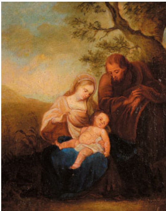
493 "SAGRADA FAMÍLIA", óleo sobre tela, escola portuguesa, séc. XVIII, restaurado Dim. - 28 x 24 cm