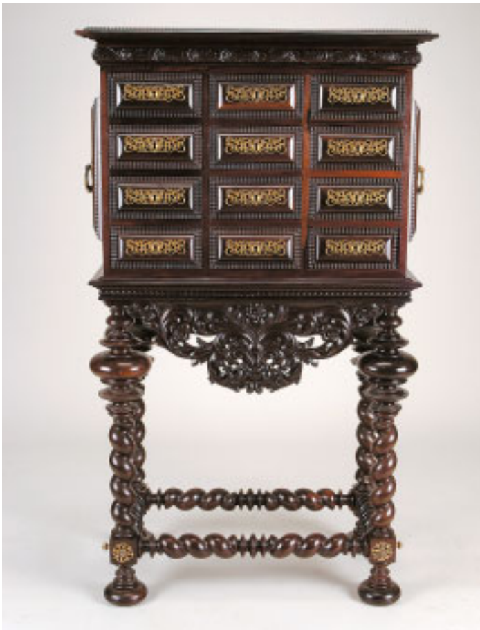
552 CONTADOR COM TREMPE , pau santo, frisos tremidos, trempe com saiais entalhados, pernas e travejamento torneados, ferragens em metal amarelo, português, séc. XIX, pequenos defeitos; Dim. - 143 x 82 x 46 cm € 2.500 - 3.750