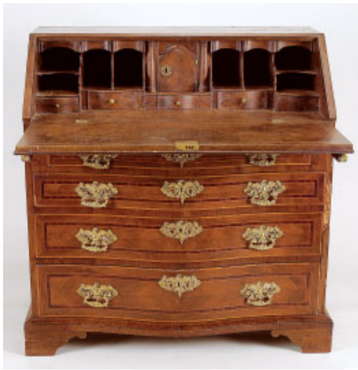
376 PAPELEIRA, D. Maria, marchetaria de noqueira e mogno, interior com gavetas e escaninhos, ferragens em bronze, portuguesa, séc. XVIII/XIX, faltas e defeitos Dim. - 107 x 101 x 52,5 cm