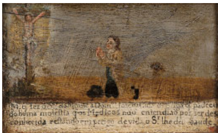
490 EX-VOTO "SENHOR DO MONTE", óleo sobre madeira, português, séc. XVIII/XIX, pequenos defeitos Dim. - 15 x 23 cm