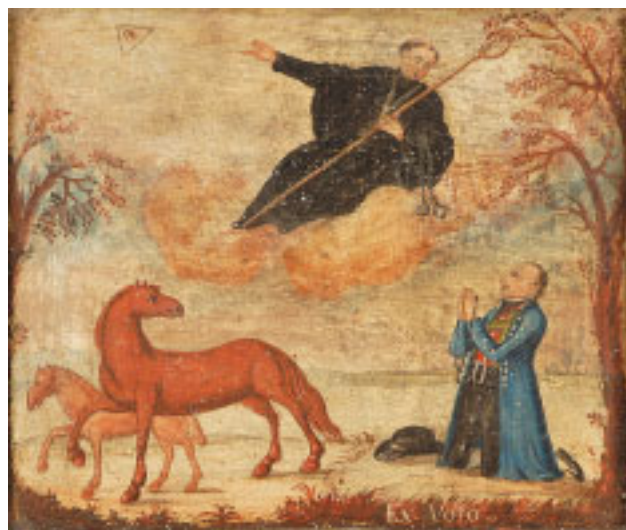
482 EX-VOTO "SANTO", óleo sobre madeira, português, séc. XVIII, pequenos defeitos Dim. - 23 x 26 cm € 250 - 375