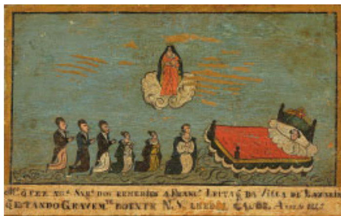
492 EX-VOTO "NOSSA SENHORA DOS REMÉDIOS", óleo sobre madeira, português, séc. XIX, faltas na tinta, datado de 1845 Dim. - 27 x 43 cm