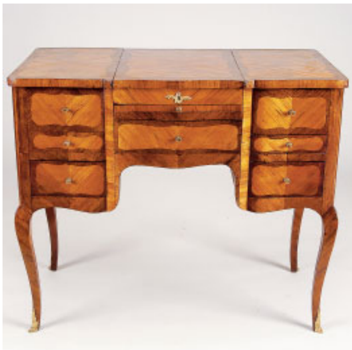
575 TOUCADOR, estilo D. Maria, marchetaria de mogno e pau rosa, puxadores em metal amarelo, portuguesa, séc. XIX, pequenos defeitos Dim. - 74 x 87 x 50 cm € 800 - 1.200