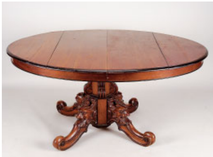
375 MESA DE CASA DE JANTAR, romântica, noqueira, pé central entalhado "Fauces", quatro tábuas de extensão, portuguesa, séc. XIX, pequenos defeitos Dim. - 74 x 268 x 160 cm