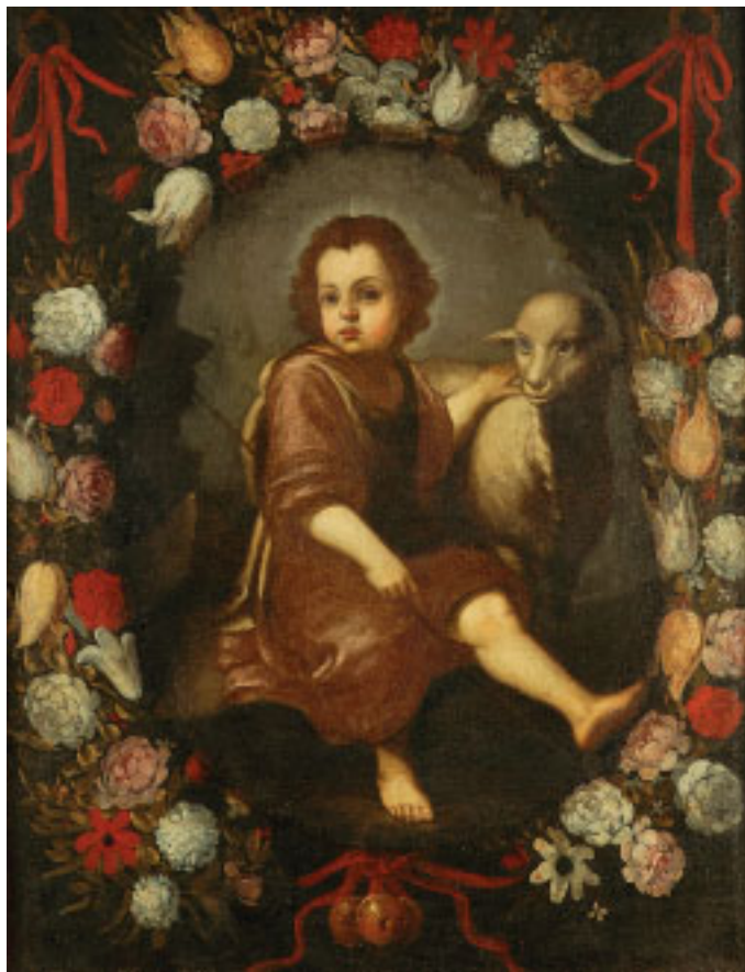
479 "MENINO JESUS BOM PASTOR RODEADO DE FLORES", óleo sobre tela, escola espanhola, séc. XVII/XVIII, reentelado e restaurado Dim. - 109 x 83 cm € 1.000 - 1.500