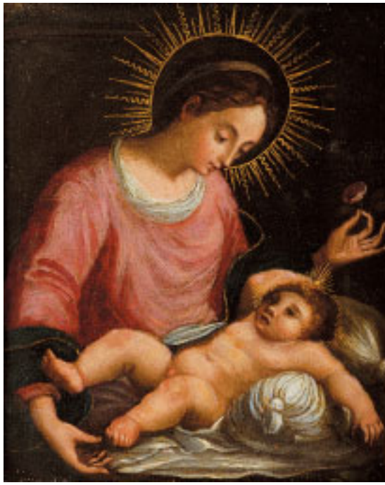
475 "NOSSA SENHORA COM O MENINO",

óleo sobre cobre, escola portuguesa, séc. XVII