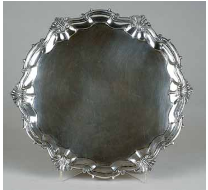
II56 SALVA RECORTADA DE TRÊS PÉS, D. José, prata, marca de ensaiador de Lisboa (1750-1770), marca de ourives MMT (M. A. - L27 e L431), portuguesa, séc. XVIII; Dim. - 31 cm Peso - 1.017 grs.