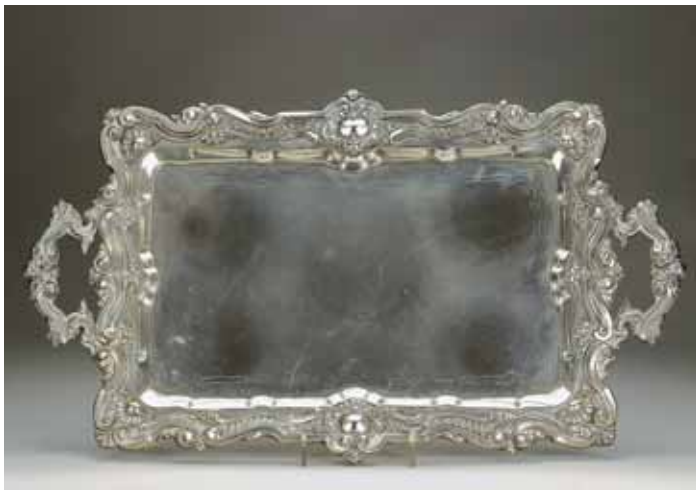
II96 BANDEJA DE BORDO TRABALHADO, estilo D. João V, prata, contraste Águia do Porto (1938-1984) (Vidal - 49), portuguesa, séc. XX Dim. - 79 x 46,5 cm Peso - 4.583 grs.