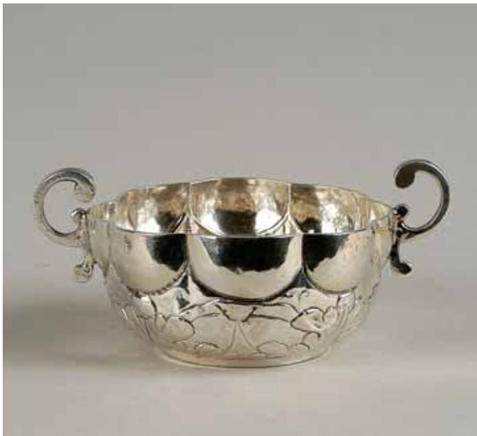
II53 TAMBULADEIRA, prata lavrada e gomada, marca de ensaiador do Porto (1700-1750), marca de ourives AR (1700-1758) (M. A. - P10 e P180) L27 e L431), portuguesa, séc. XVIII Dim. - 5 x 8 cm Peso - 130 grs.