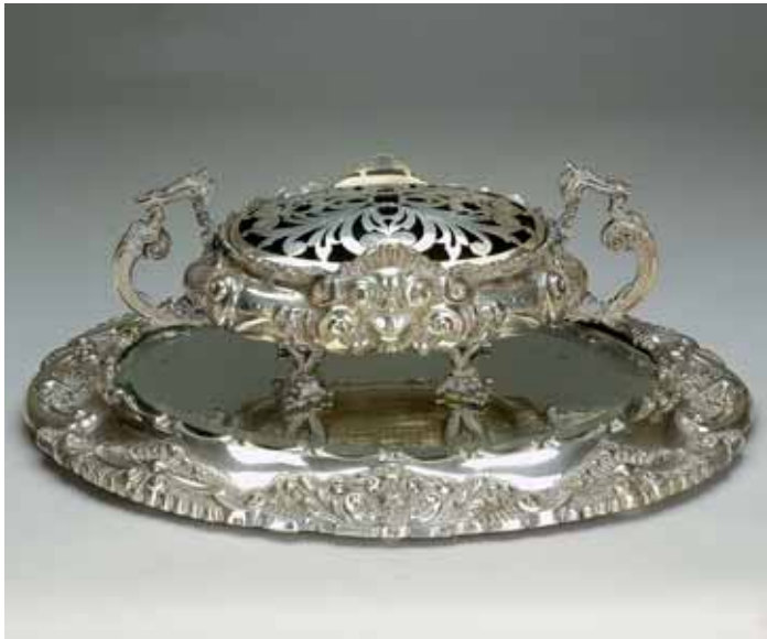
II95 CENTRO DE MESA - FLOREIRA COM PLATEAU, estilo D. João V, prata, plateau com espelho, contraste Águia do Porto (1938-1984) (Vidal - 49), português, séc. XX, falta e defeitos Dim. - 15 x 37,5 x 19 cm (floreira) Peso - 1.384 grs. (floreira)