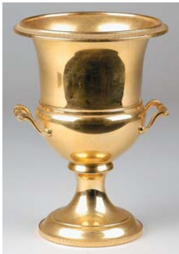
I326 TAÇA, casquinha dourada, alemã, séc. XX, sem marcas Dim. - 34,5 cm