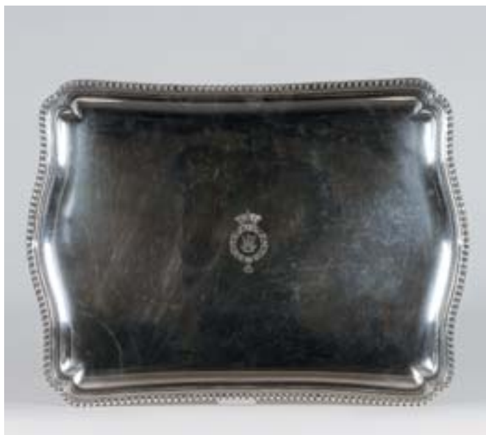
I327 BANDEJA, casquinha, gravação "coroa de marquês e timbre", Europa, séc. XIX, pequenas faltas na casquinha Dim. - 70 x 52 cm