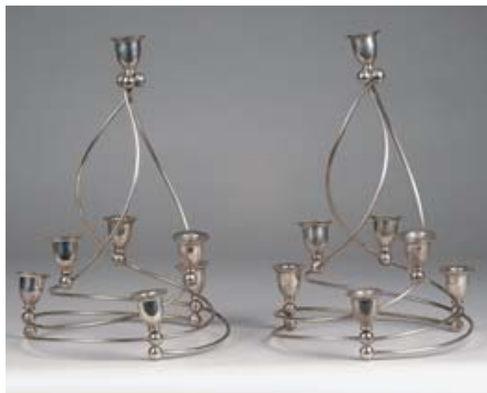
IO14 PAR DE CASTIÇAIS DE SETE LUMES , prata, contraste do Porto (pós-1985) (Vidal - 4109), portuguesas, séc. XX, algumas roscas moídas Dim. - 46 cm € 4.000 - 6.000 Peso - 3.956 grs.