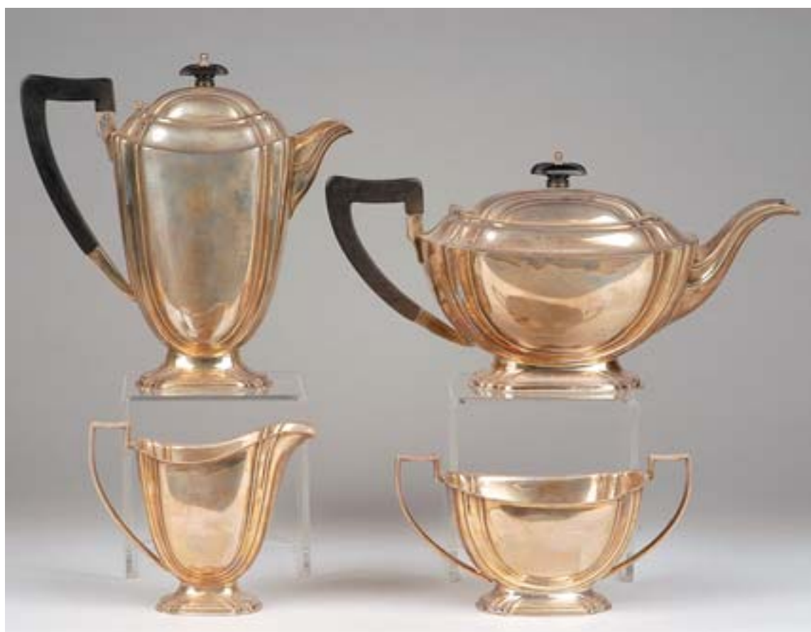
I240 SERVIÇO DE CHÁ E DE CAFÉ, prata inglesa, composto por bule, cafeteira, açucareiro e leiteira, contraste de Sheffield (1945-1947), marca de ourives HA, inglês, séc. XX Dim. - 18,5 cm Peso - 1.515 grs.