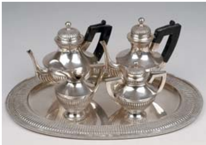
994 SERVIÇO DE CHÁ E DE CAFÉ , prata gomada, composto por bandeja, bule, cafeteira, açucareiro e leiteira, contraste Águia do Porto (1938-1984) (Vidal - 49), decoração da bandeja diferente, português, séc. XX, bandeja com ourives diferente; Dim. - 52,5 x 38,5 cm (bandeja) - 22 cm (cafeteira) Peso - 3.870 grs. € 1.800 - 2.700