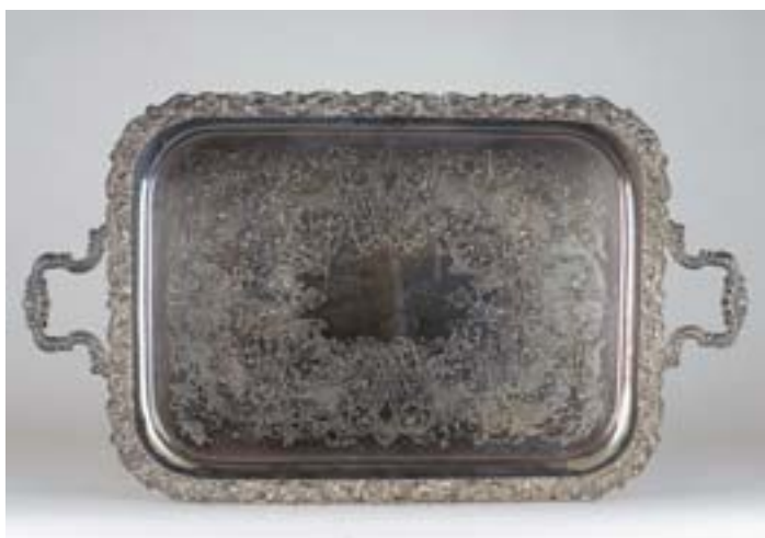
I325 BANDEJA, casquinha, Europa, séc. XIX/XX, marcada Dim. - 81 x 46 cm