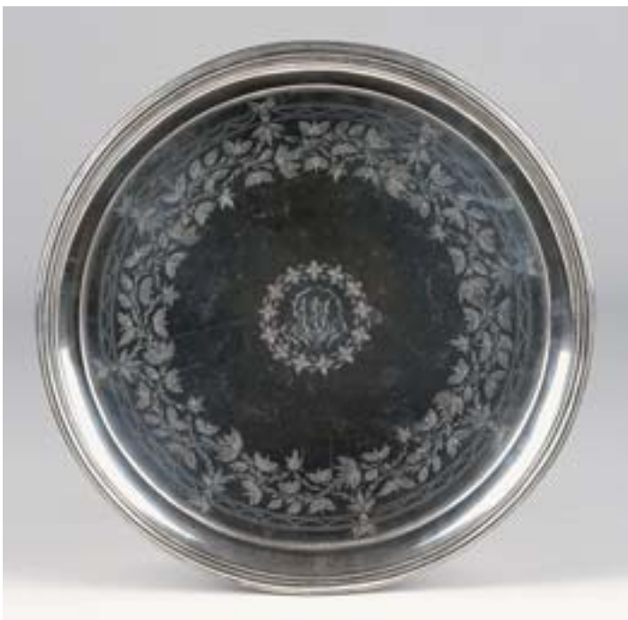
989 SALVA COM QUATRO PÉS, prata monogramada, marca de ensaiador do Porto (1843-1853), marca de ourives APC (1843-1853) (M.A. - P34 e variante P172), portuguesa, séc. XIX; Dim. - 41,5 cm Peso - 1740 grs. € 1.500 - 2.250