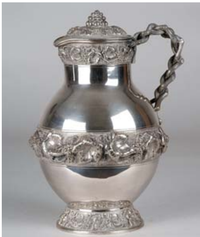
IO11 JARRO COM TAMPA , prata, contraste Javali do Porto (1887-1937), marca da joalheria do CARMO (Vidal - 73), português, séc. XIX/XX, Dim. - 31,5 cm Peso - 1.896 grs. € 1.250 - 1.875