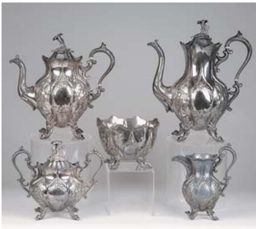
I324 SERVIÇO DE CHÁ E DE CAFÉ, casquinha, composto por bule, cafeteira, açucareiro, leiteira e taça de pingos, Europa, séc. XX, marcado Dim. - 29 cm