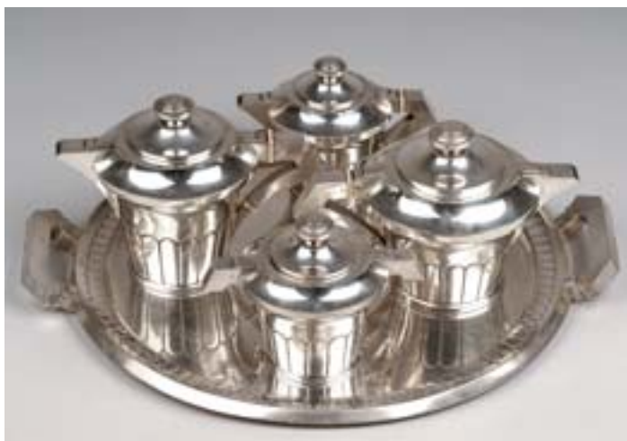
992 SERVIÇO DE CHÁ E DE CAFÉ , Art Déco, prata, composto por bandeja, bule, cafeteira, açucareiro e leiteira, contraste Águia de Lisboa (1938-1984) (Vidal - 48), português, séc. XX, ligeiras amolgadelas, marca de ourives diferente Dim. - 53 x 45,5 cm (bandeja) - 17,5 cm (cafeteira) Peso - 4.262 grs. € 2.800 - 4.200