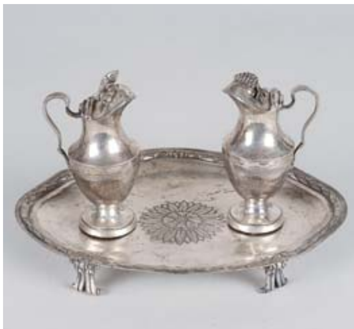
I241 BANDEJA COM GALHETAS, prata, contraste de Cordova (1793), marca de ourives MARTINEZ, espanhola, séc. XVIII (2ª met.), adaptação Dim. - 13 x 23,5 x 17 cm Peso - 535 grs.