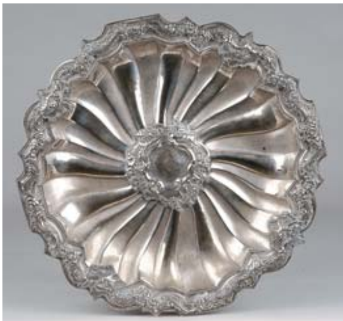
997 BANDEJA, estilo D. João V, prata, contraste Águia do Porto (1938-1984) (Vidal - 49), portuguesa, séc. XX Dim. - 73 x 48 cm Peso - 5.937 grs. € 2.400 - 3.600