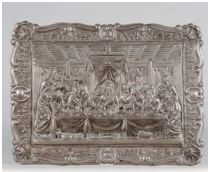
999 "ÚLTIMA CEIA", placa em prata cinzelada e repuxada, pseudo-contraste do Porto, marca de ourives do Rio de Janeiro APCX (M. A. - Br25A e Br80B), brasileira, séc. XIX (2ª metade), pequenos restauros; Dim. - 77 x 57,5 cm Peso - 3.780 grs. € 1.900 - 2.850