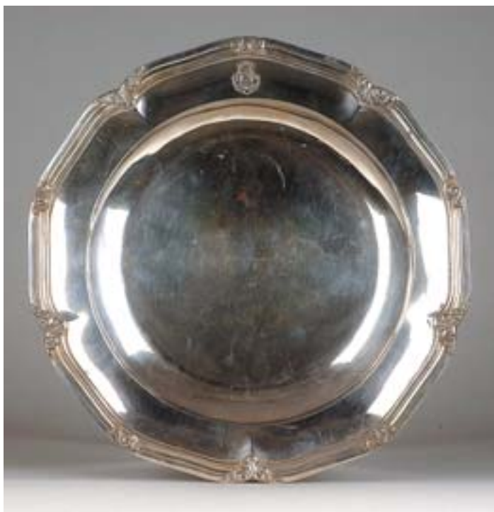
I239 PRATO DE SERVIR DE BORDO RECORTADO, prata brasonada, escudo espartelado 1º e 4º Monteiro; 2º e 3º Barros, francês, séc. XIX/XX, Dim. - 32 cm Peso - 811 grs.