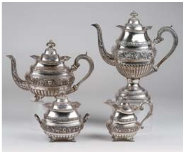
990 SERVIÇO DE CHÁ E DE CAFÉ, prata, composto por bule, cafeteira, leiteira e açucareiro, marca de ensaiador do Porto (1843-1853), marca de ourives APC (1836-1853) (M. A. - P34 e P171), português, séc. XIX Dim. - 33,5 cm Peso - 3.914 grs. € 2.100 - 3.150