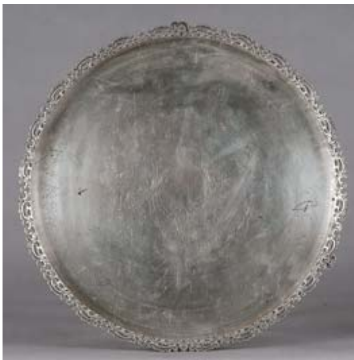
996 SALVA DE GRADINHA, prata, contraste Águia do Porto (1938-1984) (Vidal - 49), portuguesa, séc. XX Dim. - 42 cm; Peso - 1.913 grs. € 700 - 1.050