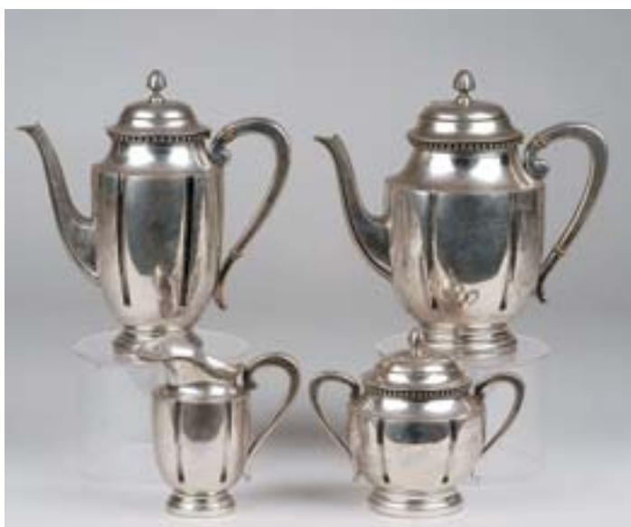
993 SERVIÇO DE CHÁ E DE CAFÉ , prata perlada, composto por bule, cafeteira, açucareiro e leiteira, contraste Águia do Porto (1938-1984), marca da ourivesaria da GUIA (Vidal - 49), português, séc. XX; Dim. - 24,5 cm Peso - 2.975 grs. € 1.700 - 2.550