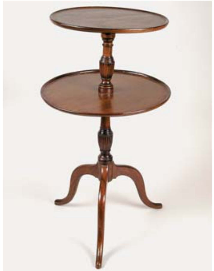
843 DUMB-WAITER DE DOIS TAMPOS , estilo Jorge III, mogno, pé de galo, inglês, séc. XIX, pequenos defeitos Dim. - 110 x 60 cm € 500 - 750