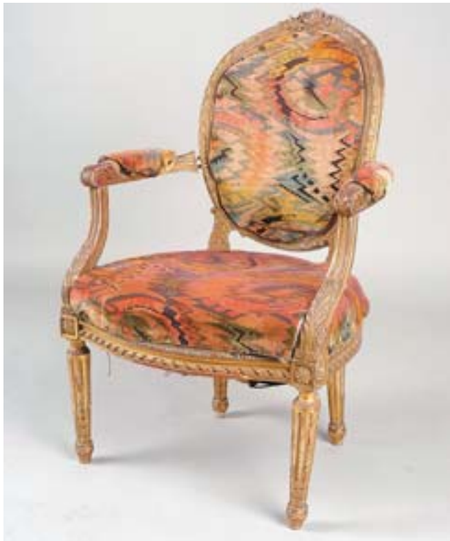
636 FAUTEUIL , estilo Luís XVI, madeira entalhada e dourada, assento e costas estofados, francês, séc. XIX, estofa não original, defeitos Dim. - 93 x 60 x 58 cm € 300 - 450