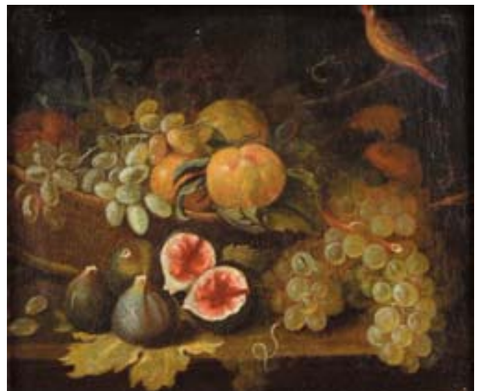
735 "NATUREZA MORTA - FRUTOS E PÁSSARO", óleo sobre tela, escola espanhola, séc. XIX, reentelado e restaurado Dim. - 37 x 44,5 cm