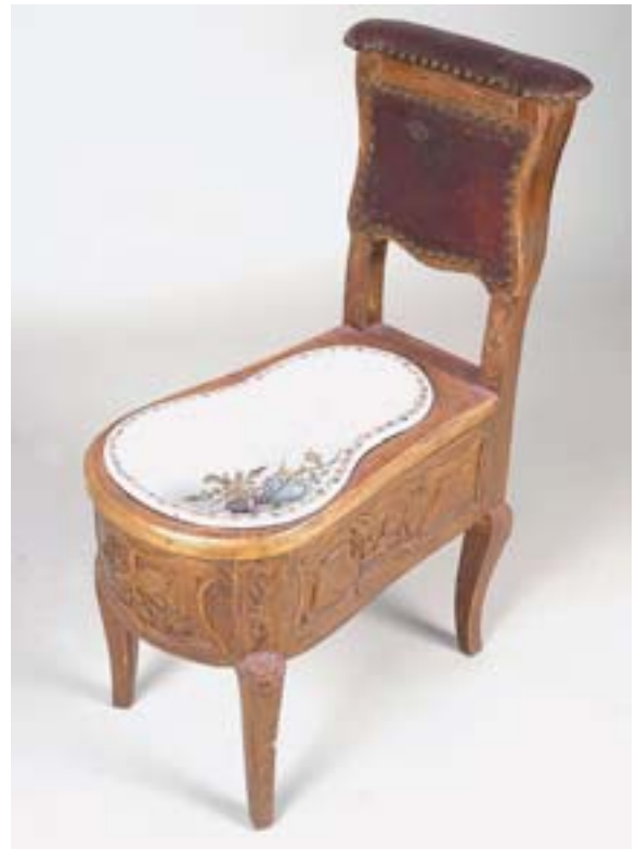
638 CADEIRA DE BIDÉ , nogueira dourada, costas com couro, bidé em faiança com decoração policromada "flores", francês, séc. XIX, faltas e defeitos Dim. - 81 x 55 x 34 cm € 350 - 525