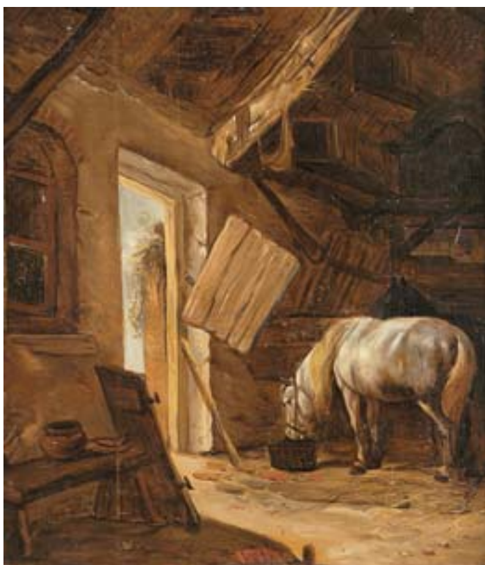
740 "INTERIOR DE CAVALARIÇA", óleo sobre madeira, escola holandesa, séc. XVIII/XIX, restauro Dim. - 41,5 x 38 cm