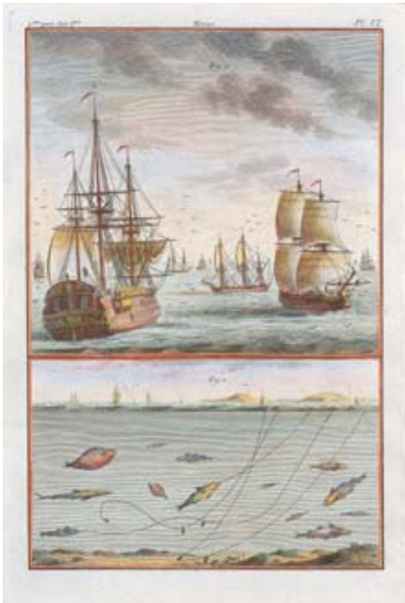
882 "BARCOS", par de gravuras aguareladas sobre papel, francesas, séc. XVIII Dim. - 34 x 22,5 cm