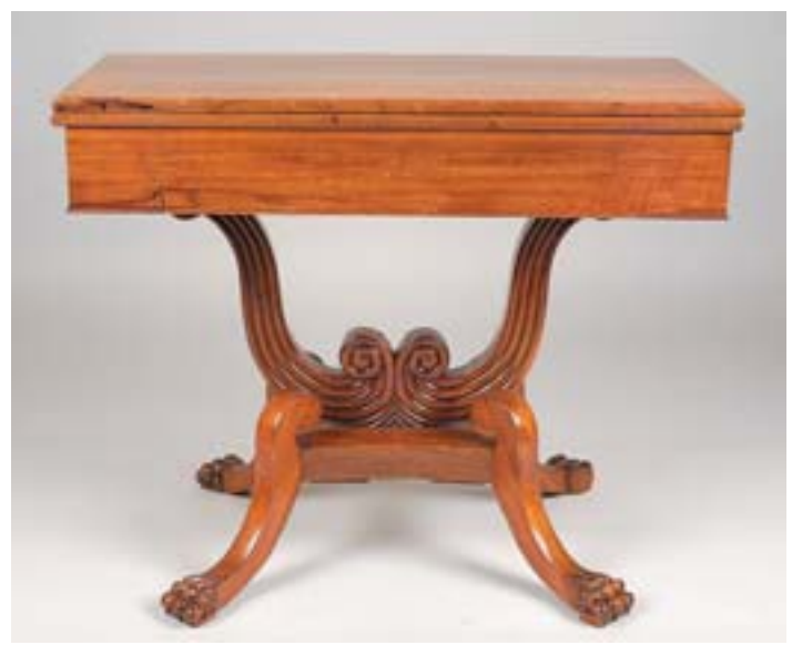
844 MESA DE CHÁ , Gonçalo Alves, coluna central, quatro pés zoomórficos, portuguesa, séc. XIX, pequenos defeitos Dim. - 72,5 x 88 x 43,5 cm € 800 - 1.200