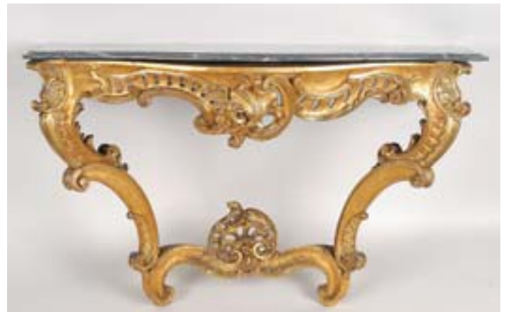
852 CREDÊNCIA, estilo Luís XV, madeira entalhada e gesso dourados, tampo de mármore, francesa, séc. XIX, faltas e defeitos Dim. - 81 x 138 x 84,5 cm