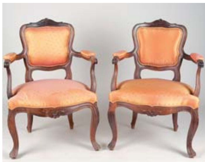
631 PAR DE FAUTEUILS , estilo D. José, pau santo, assentos, costas e braços estofados, portugueses, séc. XIX, estofos não original Dim. - 88 x 62 x 59 cm