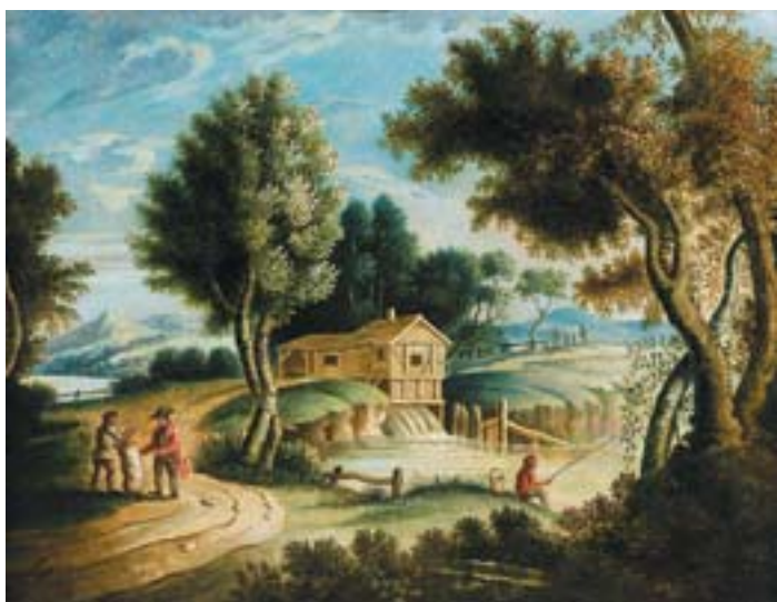
892 "PAISAGEM COM FIGURAS PERTO DE LAGO", óleo sobre tela, escola holandesa, séc. XIX, reentelado Dim. - 29 x 38,5 cm