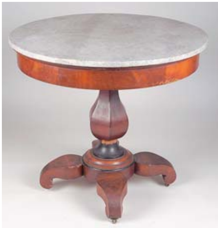
634 MESA REDONDA , romântica, mogno, coluna central com quatro pés, tampo de mármore, portuguesa, séc. XIX, faltas e defeitos Dim. - 80 x 88 cm € 250 - 375