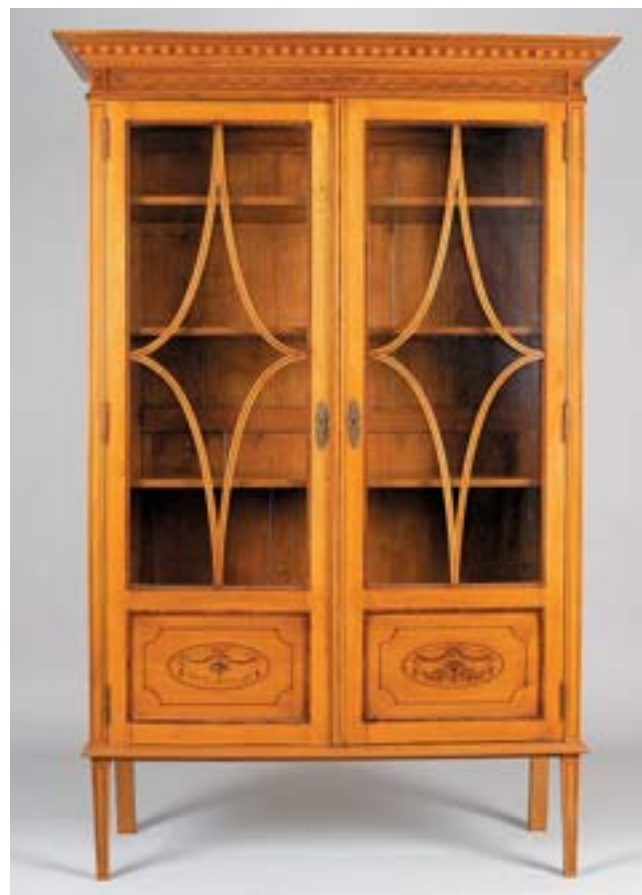
630 VITRINE , estilo Jorge III, pau cetim com pinturas, portas com vidrinhos, inglesa, séc. XIX/XX, pequenas faltas e defeitos Dim. - 194 x 128 x 47 cm