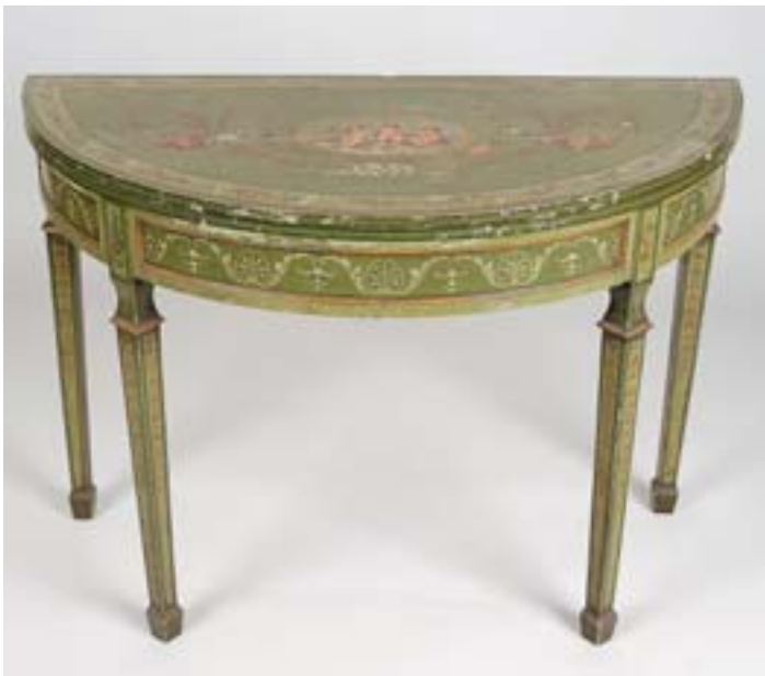
632 MESA DE JOGO DE MEIA LUA , estilo neoclássico, madeira pintada, fundo verde com decoração policromada "grinaldas" e reserva central "putti", Itália, séc. XIX, pequenas faltas e defeitos Dim. - 73 x 101 x 49,5 cm € 3.000 - 4.500