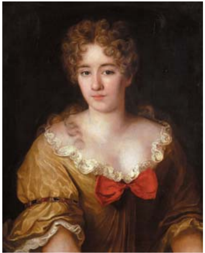
734 "RETRATO DE SENHORA", óleo sobre tela, escola inglesa, séc. XIX, reentelado e restaurado Dim. - 71 x 57 cm