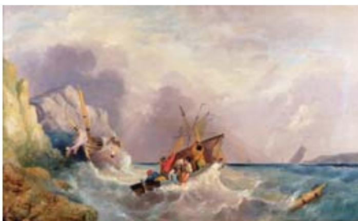
741 "MARINHA - TEMPESTADE NO MAR", óleo sobre tela, escola inglesa, séc. XIX, reentelado e restaurado Dim. - 61 x 100 cm