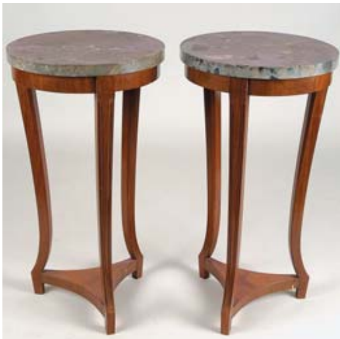
637 PAR DE GUÉRIDONS , estilo Império, mogno, tampo de mármore, portugueses, séc. XX, pequenos defeitos Dim. - 80,5 x 42,5 cm € 350 - 525