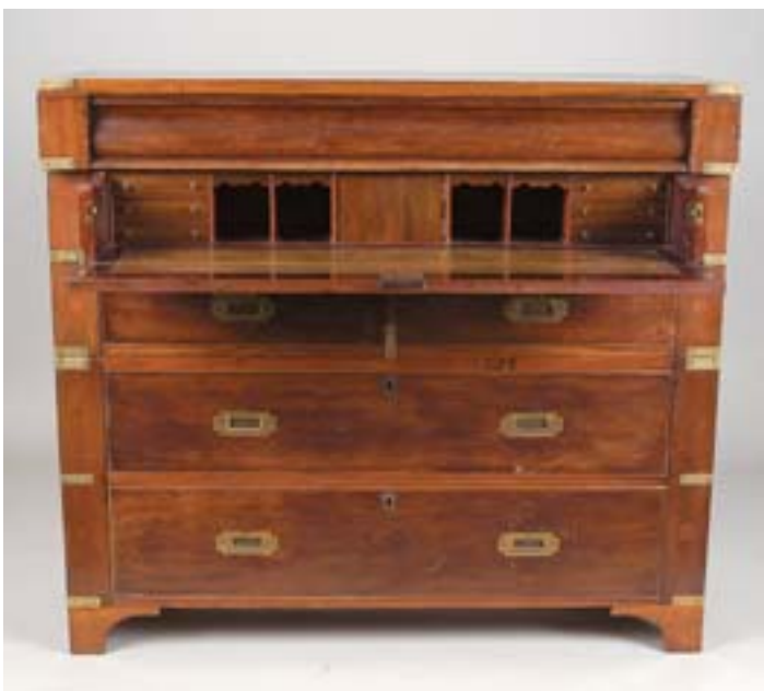
633 CÓMODA MILITAR COM GAVETA SECRETÁRIA , mogno com aplicações de metal amarelo, interior com escaninhos, inglesa, séc. XIX, pequenos defeitos Dim. - 110 x 122 x 50,5 cm € 1.000 - 1.500