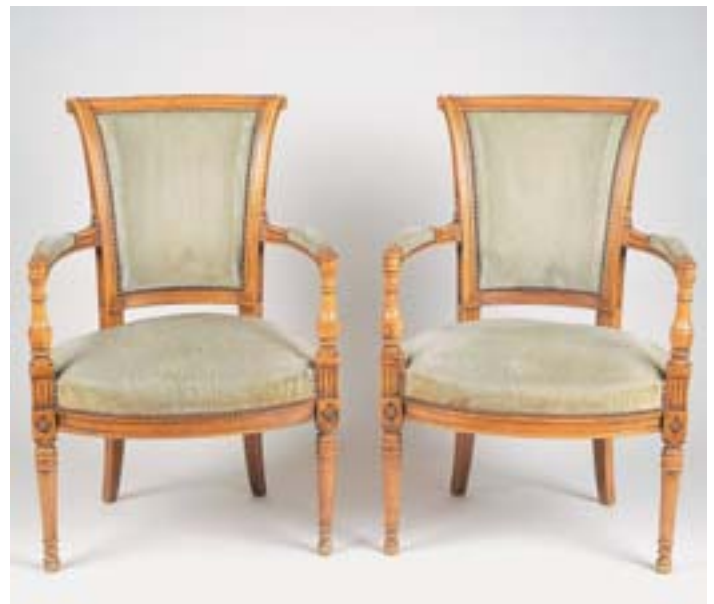
639 PAR DE FAUTEUILS , estilo Luís XVI, pau cetim, franceses, séc. XIX, pequenos defeitos Dim. - 87,5 x 56,5 x 51,5 cm € 800 - 1.200