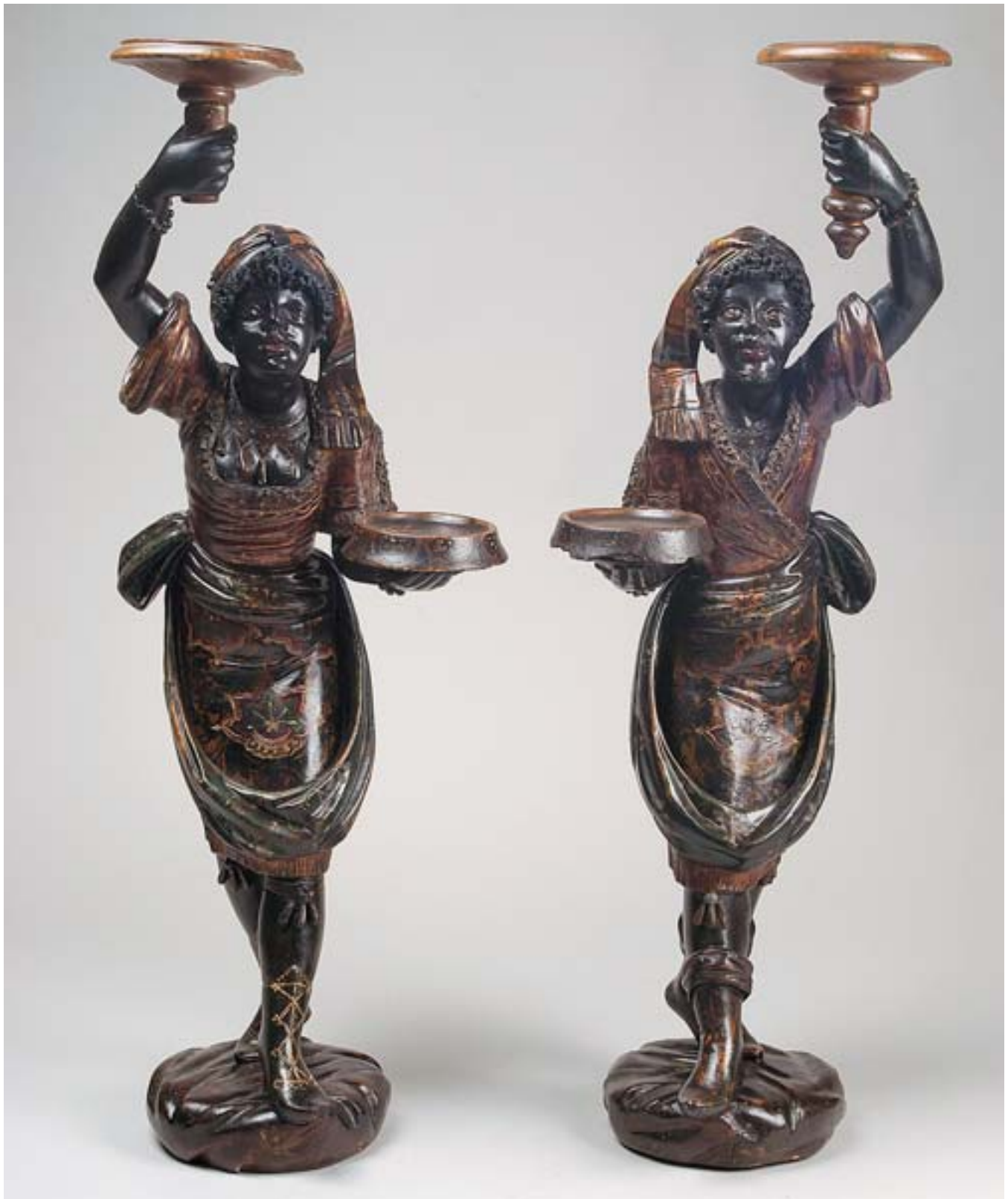
877 ↑ "VENEZIANOS - FIGURA FEMININA E FIGURA MASCULINA", par de esculturas em madeira pintada de negro, decoreção policromada e dourada, Itália, séc. XIX, faltas, pequenos defeitos e restauros num braço Dim. - 90,5 cm