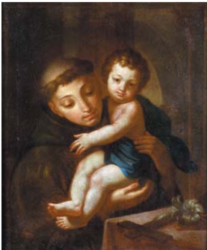
746 "SANTO ANTÓNIO COM O MENINO", óleo sobre tela, escola portuguesa, séc. XVIII, reentelado e pequenos restauros Dim. - 67 x 56 cm