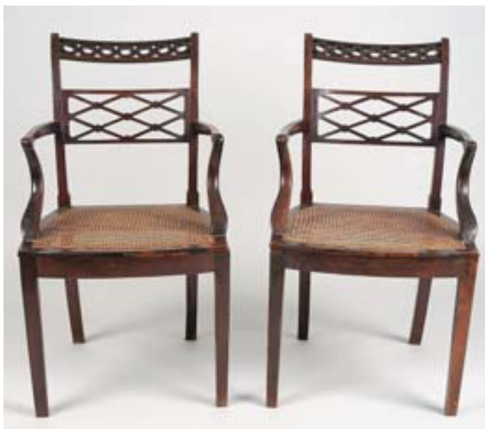
857 PAR DE CADEIRAS DE BRAÇOS, pau santo, assentos de palhinha, portuguesas, séc. XIX, pequenos defeitos Dim. - 90,5 x 50,5 x 45 cm