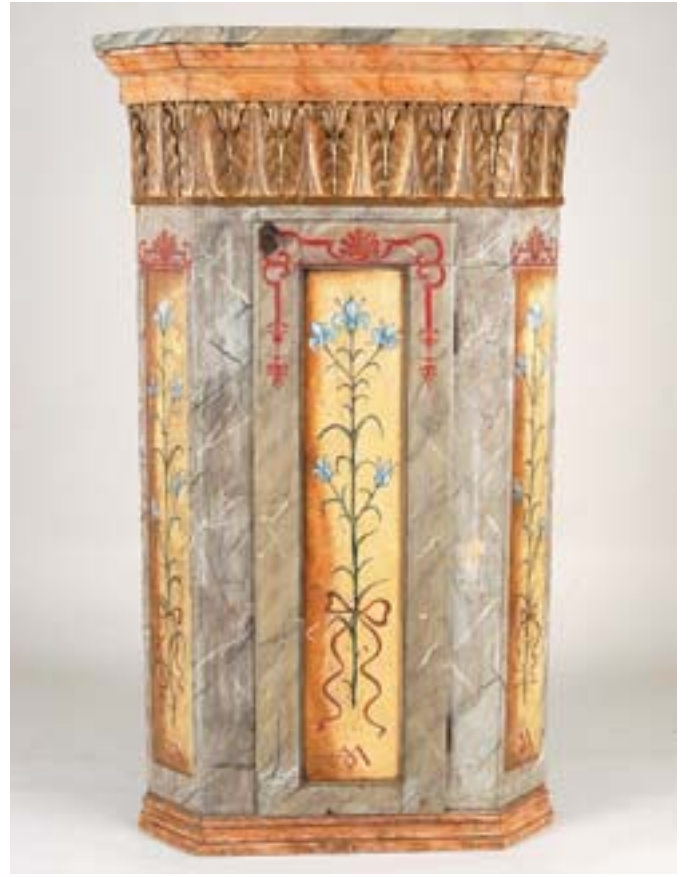
851 CANTONEIRA, rústica, madeira pintada, decoração policromada "flores", friso entalhado e dourado, Europa Central, séc. XIX, faltas na pintura, pequenos defeitos, restauros Dim. - 153 x 92 x 61 cm