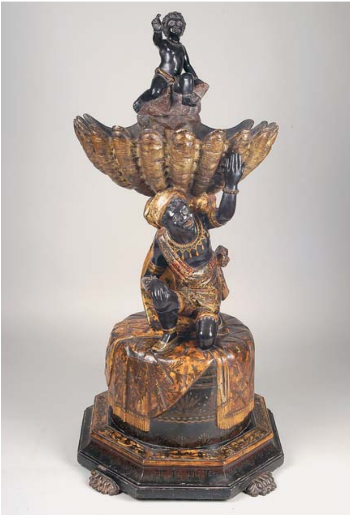
879 FLOREIRA "NEGROS", madeira entalhada, pintada e dourada, Veneziana, séc. XVIII/XIX,

restauros, pequenas faltas e defeitos Dim. - 142 cm