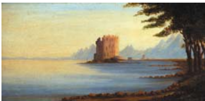
898 "LAGO LOMOND - ESCÓCIA", óleo sobre tela, escola inglesa, séc. XIX Dim. - 19 x 37 cm