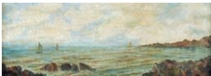
900 "MARINHA", óleo sobre tela, escola inglesa, séc. XIX Dim. - 21,5 x 57,5 cm