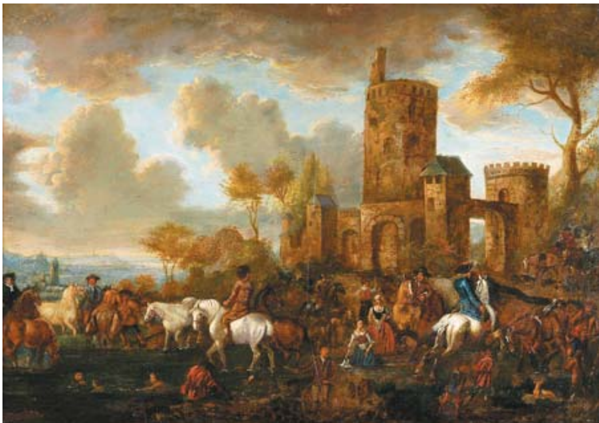
744 "FIGURAS E CAVALOS PERTO DE RUÍNAS", óleo sobre madeira, escola holandesa, séc. XVII/XVIII, pequenos restauros Dim. - 50,5 x 70 cm € 3.000 - 4.500