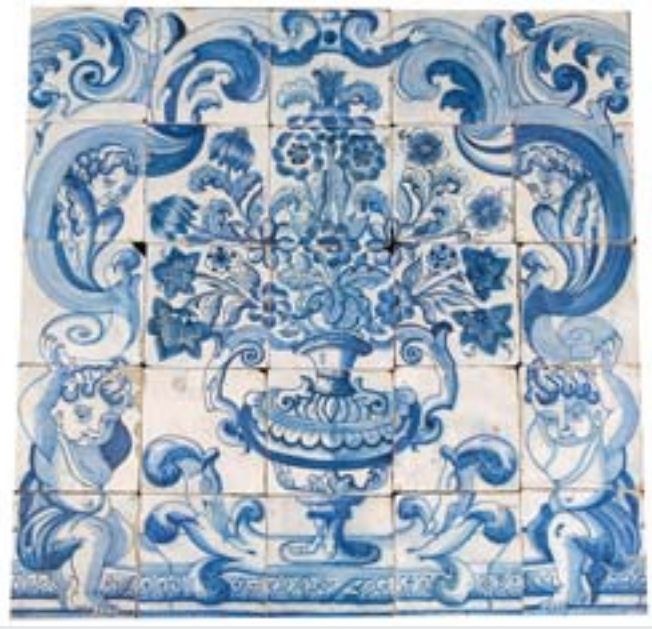
870 b) "TAÇA COM FLORES E PUTTI", painel de vinte e cinco azulejos barrocos, português, séc. XVIII, pequenas faltas Dim. - 73 x 73 cm € 2.000 - 3.000