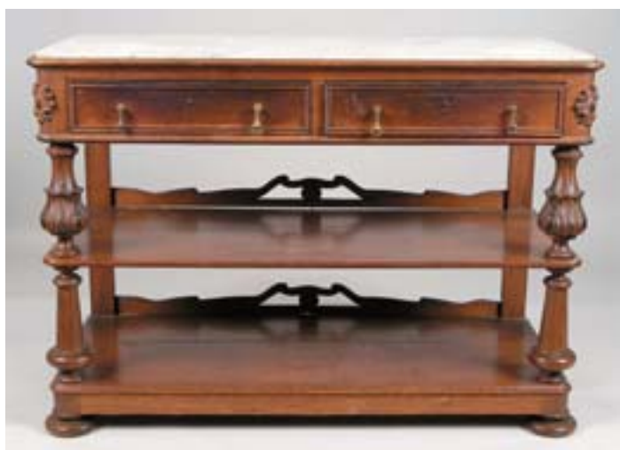
856 APARADOR , romântico, carvalho com entalhamentos, tampo de mármore, português, séc. XIX, pequenos defeitos Dim. - 95 x 134 x 55 cm € 400 - 600