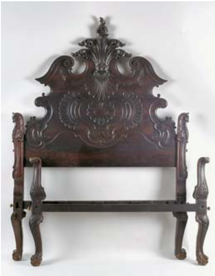
865 CAMA, D. José, pau santo com entalhamentos, portuguesa, séc. XVIII, travejamentos lateral posterior, pequenos defeitos Dim. - 178 x 200 x 130 cm € 1.000 - 1.500