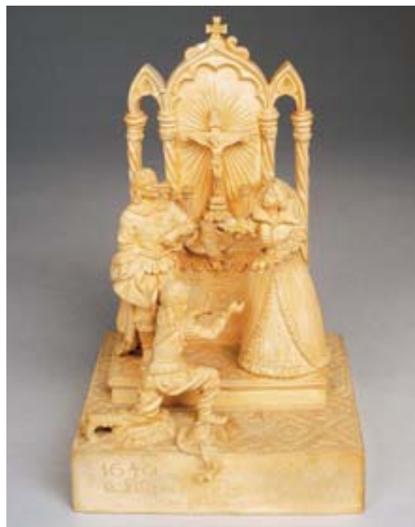
694 FRANCISCO ELIAS - SÉC. XX, "D. FILIPA DE VILHENA ARMANDO OS FILHOS CAVALEIROS - 1640", escultura em terracota, Caldas, faltas e colagens, assinada Dim. - 14,5 x 9,5 x 8 cm