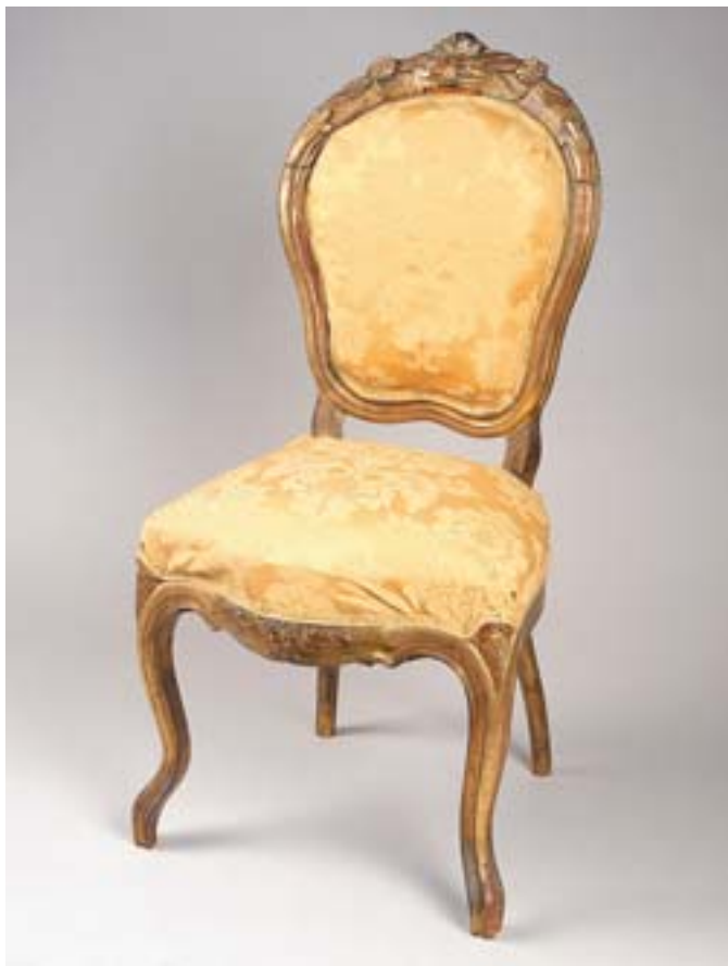
845 DOZE CADEIRAS , estilo Luís XV, madeira entalhada e dourada, estofadas a tecido, portuguesas, séc. XIX, faltas e defeitos Dim. - 99,5 x 47 x 37 cm € 800 - 1.200