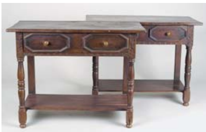
644 PAR DE APARADORES RÚSTICOS, carvalho, pernas torneadas, ingleses, séc. XIX, defeitos Dim. - 77 x 99 x 46 cm