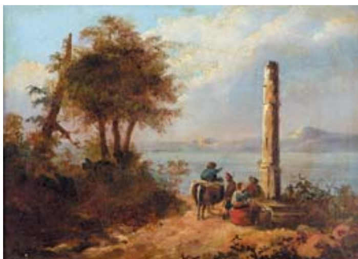
895 "PAISAGEM - FIGURAS PERTO DE COLUNA", óleo sobre tela, escola italiana, séc. XIX, reentelado e restaurado Dim. - 28,5 x 38 cm