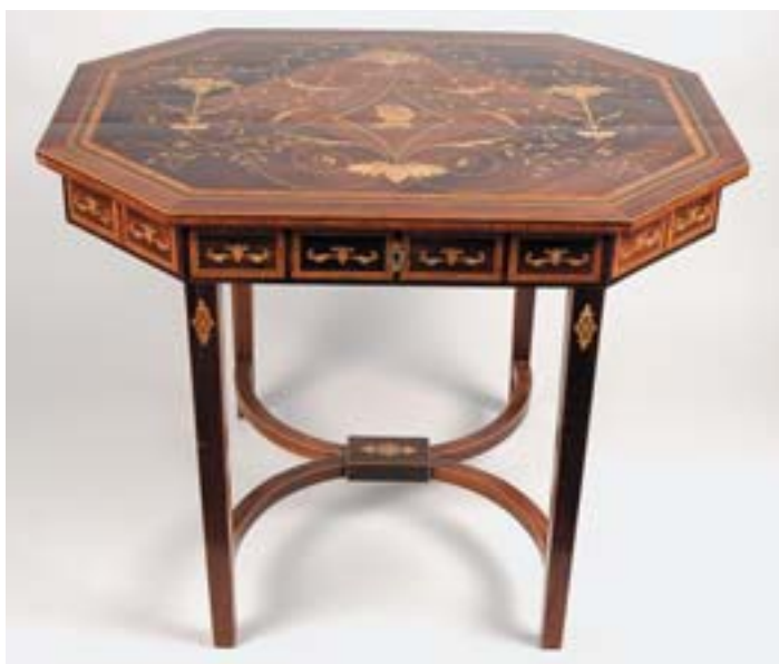
846 MESA DE CENTRO OITAVADA , estilo D. Maria, pau santo com embutidos "flores e perfil feminino", portuguesa, séc. XIX/XX, pequenos defeitos Dim. - 78 x 102 x 78,5 cm € 1.200 - 1.800