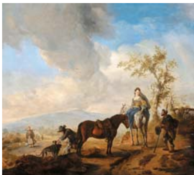
752 "PAISAGEM - SENHORA A CAVALO, FIGURAS E ANIMAIS", óleo sobre madeira, escola holandesa, séc. XVIII/XIX Dim. - 36,5 x 41 cm € 3.000 - 4.500