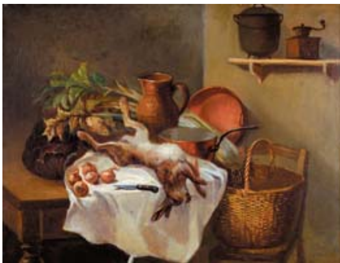
747 "INTERIOR DE COZINHA COM NATUREZA MORTA", óleo sobre tela, escola francesa, séc. XIX, pequeno restauro Dim. - 32,5 x 40,5 cm