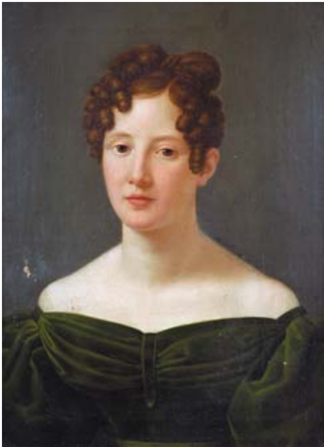
732 "RETRATO FEMININO", óleo sobre tela, Europa, séc. XIX, faltas na pintura Dim. - 60,5 x 48 cm