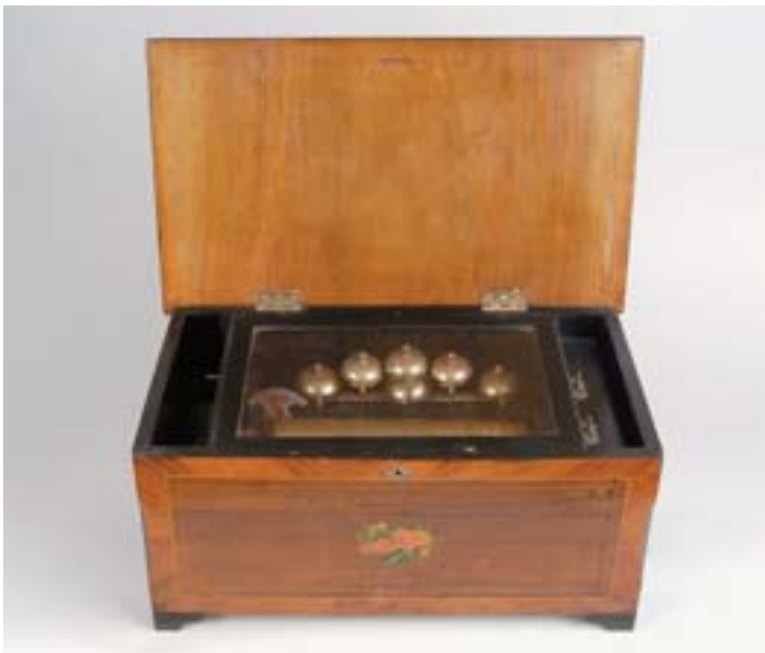
870 s) CAIXA DE MÚSICA, pau santo com embutidos "pauta e instrumentos musicais", inglesa, séc. XIX, pequenas faltas e defeitos Dim. - 26,5 x 55,5 x 33 cm € 1.800 - 2.700