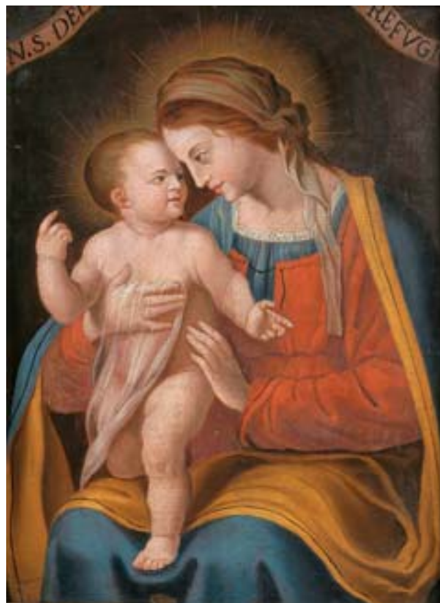
738 "N. S. DEL REFUGIO", óleo sobre cobre, escola espanhola, séc. XVIII, pequenos defeitos Dim. - 21 x 16 cm € 600 - 900