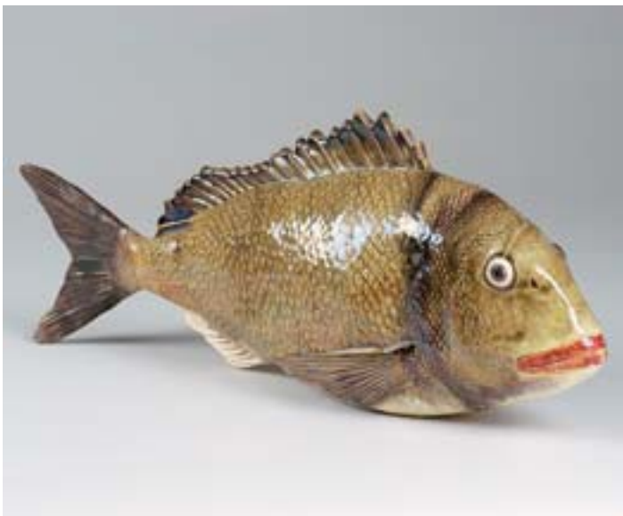
692 "PEIXE", escultura de suspensão em barro vidrado, decoração policromada, Caldas, séc. XIX/XX, restauro na cauda Dim. - 57 cm