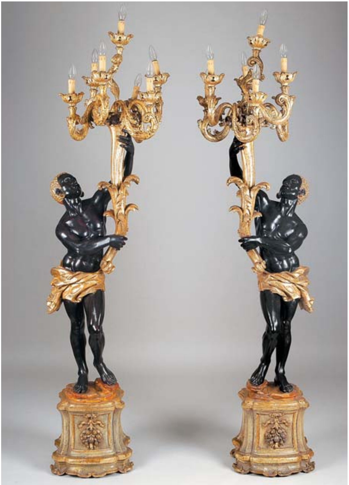
876 "NEGROS VENEZIANOS", par de esculturas candelárias em madeira policromada,

candelabros com sete lumes cada, italianas, séc. XIX/XX, pequenas faltas e defeitos Dim. - 195,5 cm