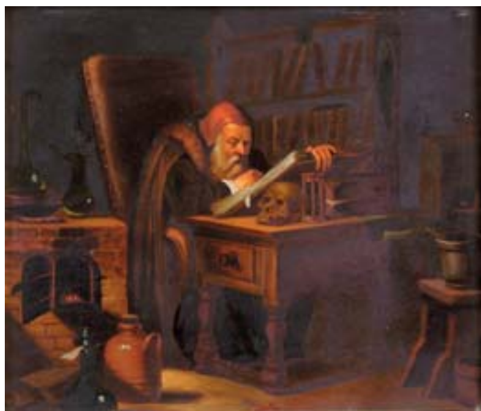
756 "CIENTISTA NO LABORATÓRIO", óleo sobre chapa de metal, escola flamenga, séc. XIX Dim. - 21,5 x 25 cm €400 - 600