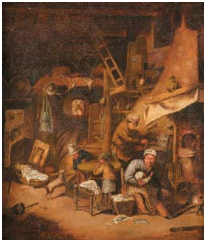
742 "CENA DE INTERIOR", óleo sobre tela, escola holandesa, séc. XVII, reentelado e restauros Dim. - 42 x 37 cm