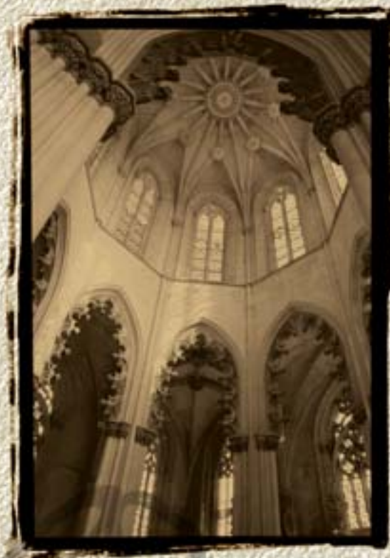
Mosteiro da Batalha Património Mundial UNESCO 1983

O segredo das catedrais, dos mosteiros e dos templos milenares é terem sido construídos para a eternidade. Perante a solidez das suas colunas temos uma certeza de durabilidade superior ao tempo da nossa vida. Outros, depois de nós, sentirão o mesmo espanto ante o seu poder e a sua beleza.