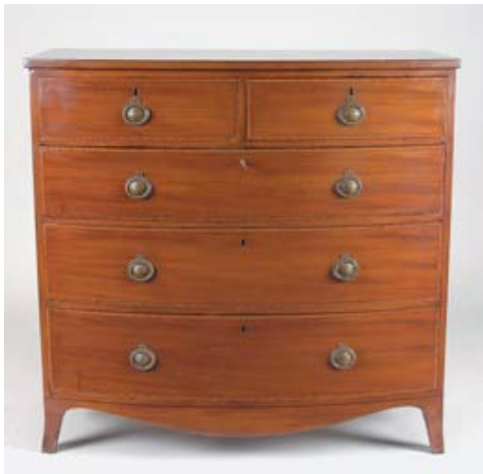
635 CÓMODA , Jorge III, mogno com filetes, inglesa, séc. XIX Dim. - 105,5 x 109 x 56 cm € 700 - 1.050