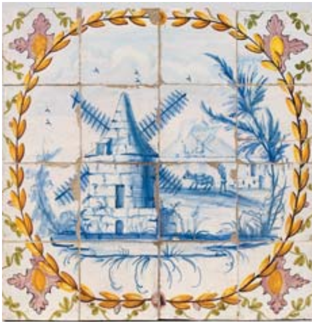
870 "PAISAGEM COM MOINHOS E FIGURAS", painel de dezasseis azulejos, decoração a azul com cercadura policromada, português, séc. XVIII, restauros, defeitos Dim. - 56 x 55 cm € 600 - 900