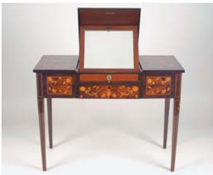
862 TOUCADOR , estilo D. Maria, faixeadado a pau santo com trabalho de marchetaria em espinheiro, português, séc. XIX/XX, pequenos defeitos Dim. - 97,5 x 44,5 x 75 cm € 800 - 1.200