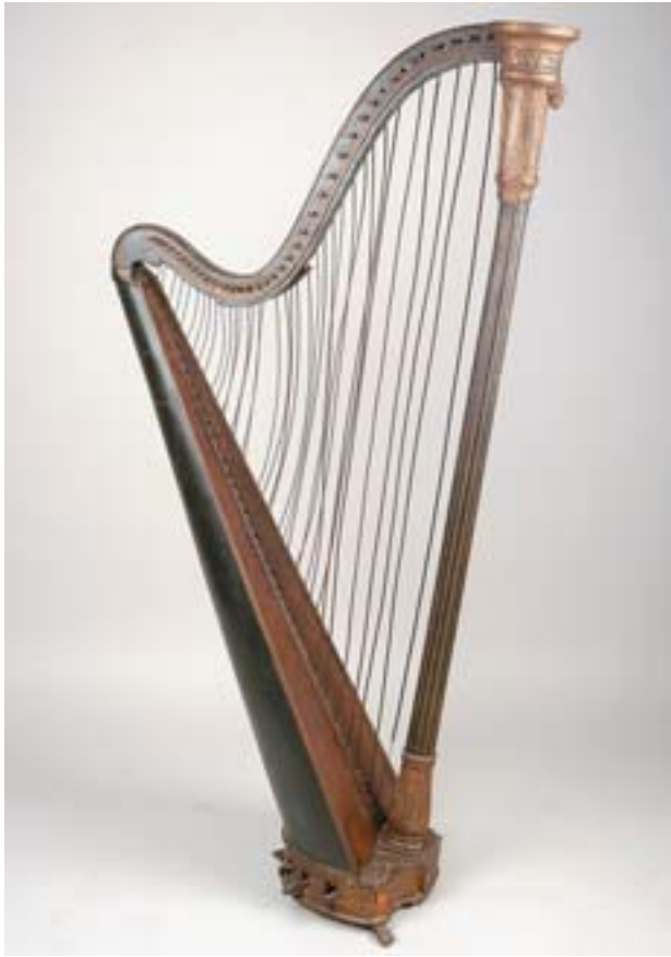
849 HARPA, madeira pintada e dourada, Europa, séc. XIX, restauros, faltas e defeitos Dim. - 163,5 x 85 cm