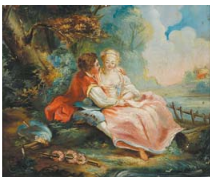
758 "CENA GALANTE NO CAMPO", óleo sobre madeira, escola francesa, séc. XIX, pequenas faltas na pintura Dim. - 29,5 x 35,5 cm €900 - 1.350