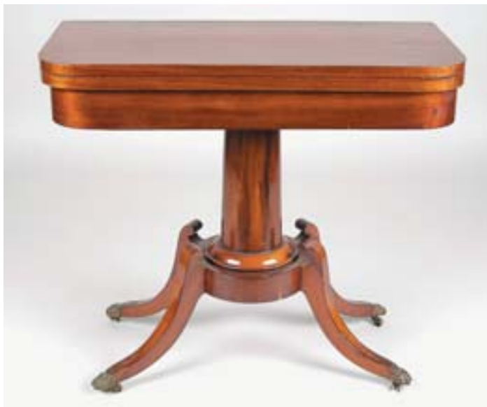
842 MESA DE JOGO , mogno, coluna central com quatro pés, portuguesa, séc. XIX, pequenos defeitos Dim. - 74,5 x 84 x 40,5 cm € 600 - 900