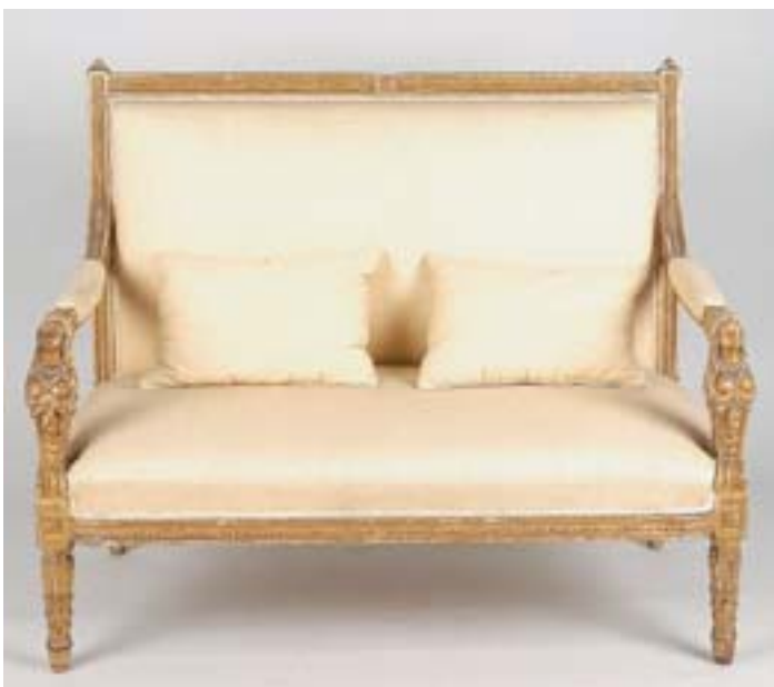
646 CANAPÉ, neoclássico, madeira entalhada e dourada, braços com entalhamentos "bustos femininos", Itália, séc. XVIII, faltas e defeitos Dim. - 99 x 119 x 64 cm