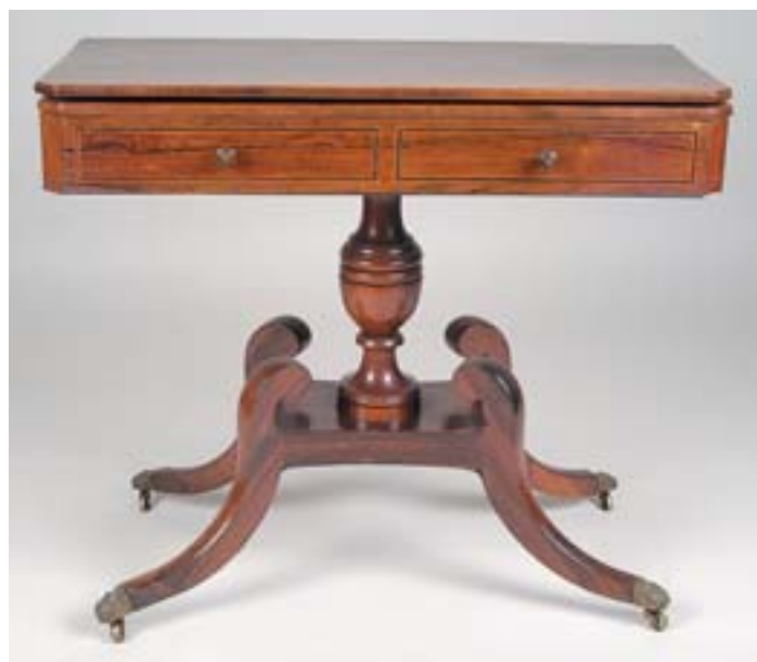
860 MESA DE CHÁ, pau santo com filetes, coluna central e quatro pés, portuguesa, séc. XIX, pequenos defeitos Dim. - 72,5 x 85 x 44 cm