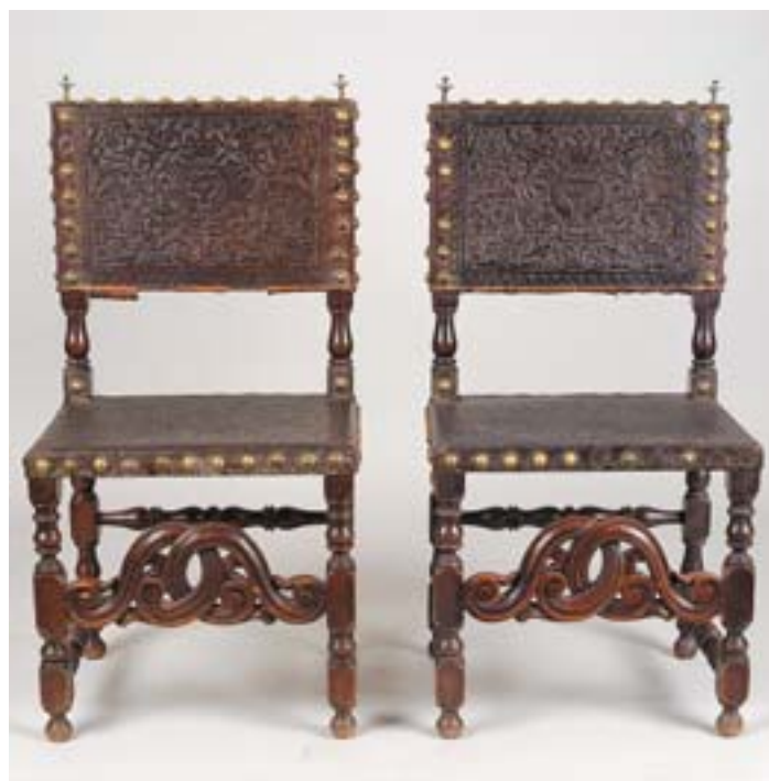
859 PAR DE CADEIRAS, castanho, assento e costas em couro lavrado "águia bicéfala" com pregaria, portuguesas, séc. XVIII, restauros e defeitos Dim. - 98 x 50 x 40 cm