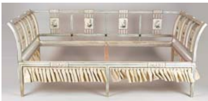
854 CANAPÉ , estilo Luís XVI, madeira pintada a branco e policromada "flores" e "paisagens", português, séc. XX, defeitos, estampilhado F.R.E.S.S. Dim. - 86 x 216 x 100 cm € 500 - 750