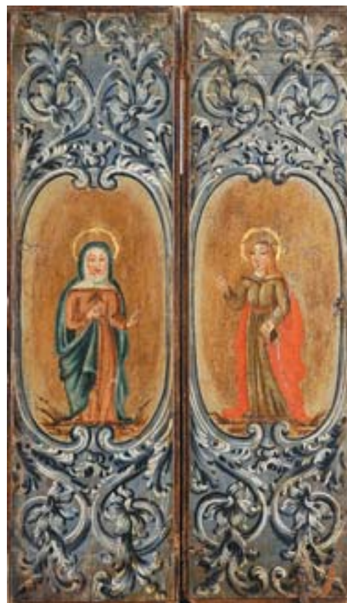
748 PAR DE PORTAS DE ORATÓRIO, madeira pintada "Santas", portuguesas, séc. XVII, restauros e pequenos defeitos Dim. - 97 x 28 cm