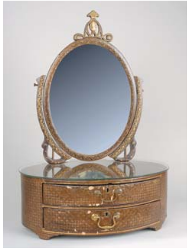
870 t) TOUCADOR DE CÔMODA OVAL, madeira revestida a laca com dourados, Europa, séc. XIX, restauros, faltas e defeitos Dim. - 74 x 51,5 x 33 cm € 700 - 1.050