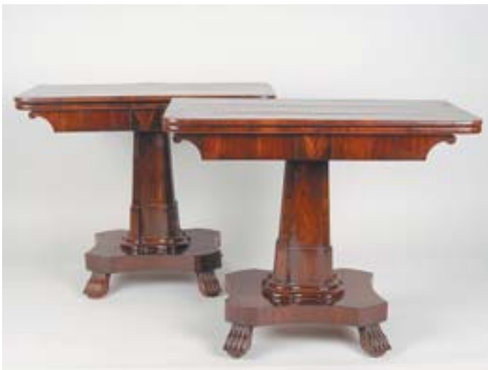
866 PAR DE MESAS DE JOGO, victorianas, mogno e raiz de mogno, coluna central, inglesas, séc. XIX, pequenas faltas e defeitos Dim. - 75,5 x 92 x 46 cm € 2.500 - 3.750