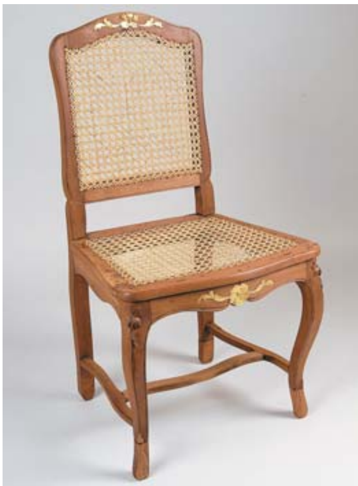
853 CONJUNTO DE SEIS CADEIRAS , D. José/D. Maria, nogueira e vinhático, entalhamentos dourados, assentos de palhinha, portuguesa, séc. XVIII, restauradas, emendas nalgumas pernas, dourados não originais; Dim. - 90 x 50 x 46 cm € 600 - 900