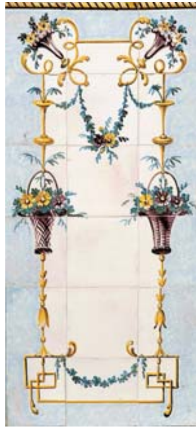
870 a) "FLORES E GRINALDAS", painel de dezoito azulejos neoclássicos português, séc. XVIII, ligeiras faltas Dim. - 83 x 39 cm € 800 - 1.200