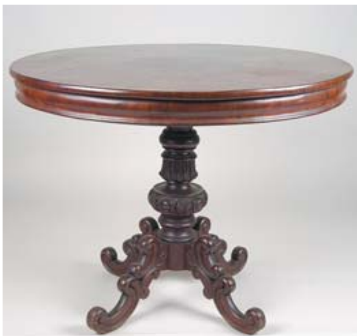
858 MESA REDONDA, victoriana, mogno e raiz de mogno, coluna central com entalhamentos, tampo basculante, inglesa, séc. XIX, pequenos defeitos Dim. - 76,5 x 98 cm