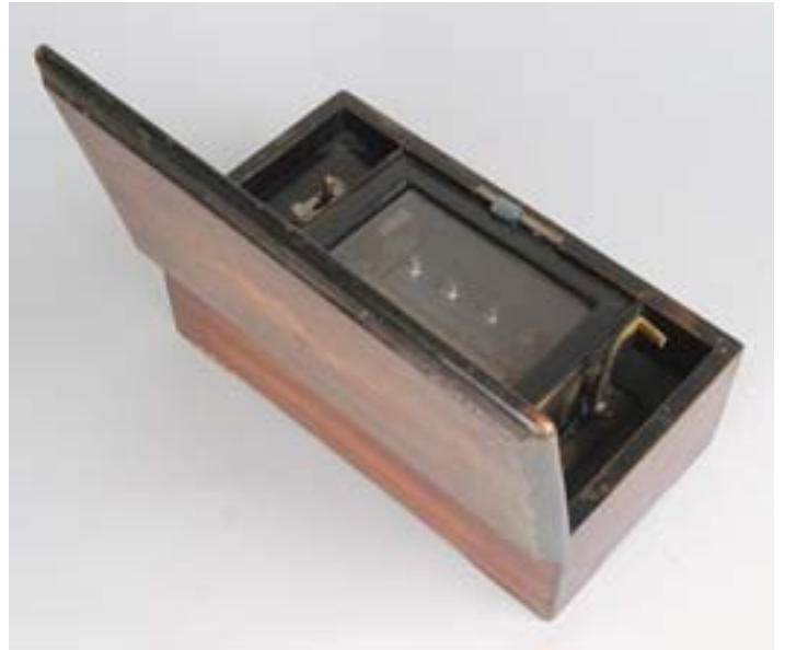
870 u) CAIXA DE MÚSICA, pau santo com embutidos "flores", inglesa, séc. XIX, pequenas faltas e defeitos Dim. - 12 x 35 x 19 cm € 500 - 750