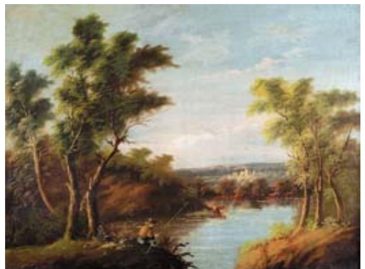
884 "PAISAGEM - RIO COM PESCADOR", óleo sobre tela, escola inglesa, séc. XIX, reentelado e restauros Dim. - 62 x 83 cm