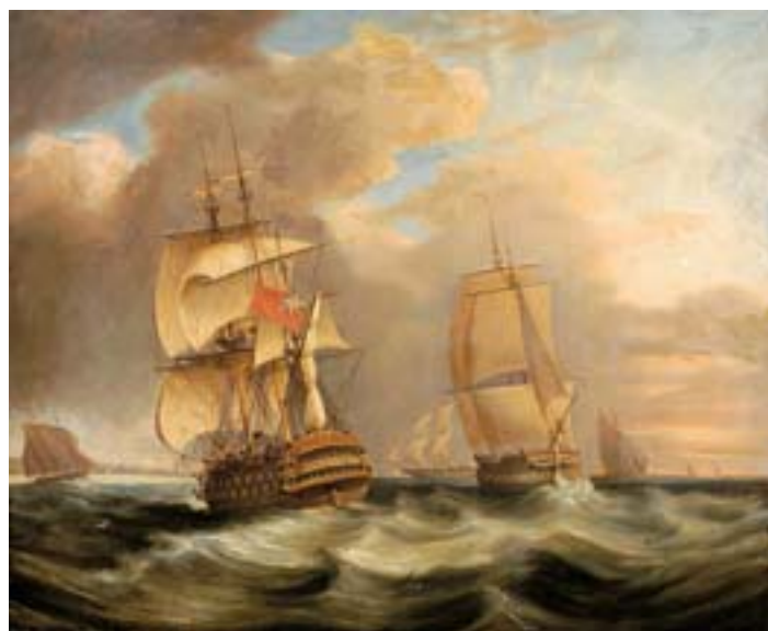
743 "MARINHA", óleo sobre tela, escola inglesa, séc. XVIII/XIX Dim. - 63 x 76 cm