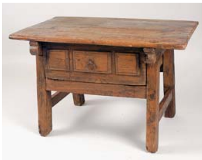
848 MESA DE PEQUENAS DIMENSÕES , rústica, castanho, espanhola, séc. XVIII, restauros, defeitos Dim. - 57 x 89,5 x 58 cm € 300 - 450