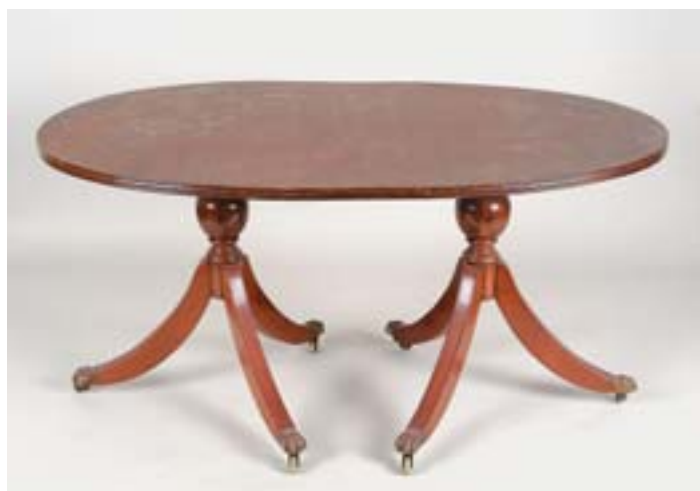
629 MESA DE CASA DE JANTAR OVAL , estilo Jorge III, mogno, duplo pé de galo, pés com aplicações em bronze, inglesa, séc. XIX/XX, pequenas faltas e defeitos Dim. - 75 x 150 x 100 cm