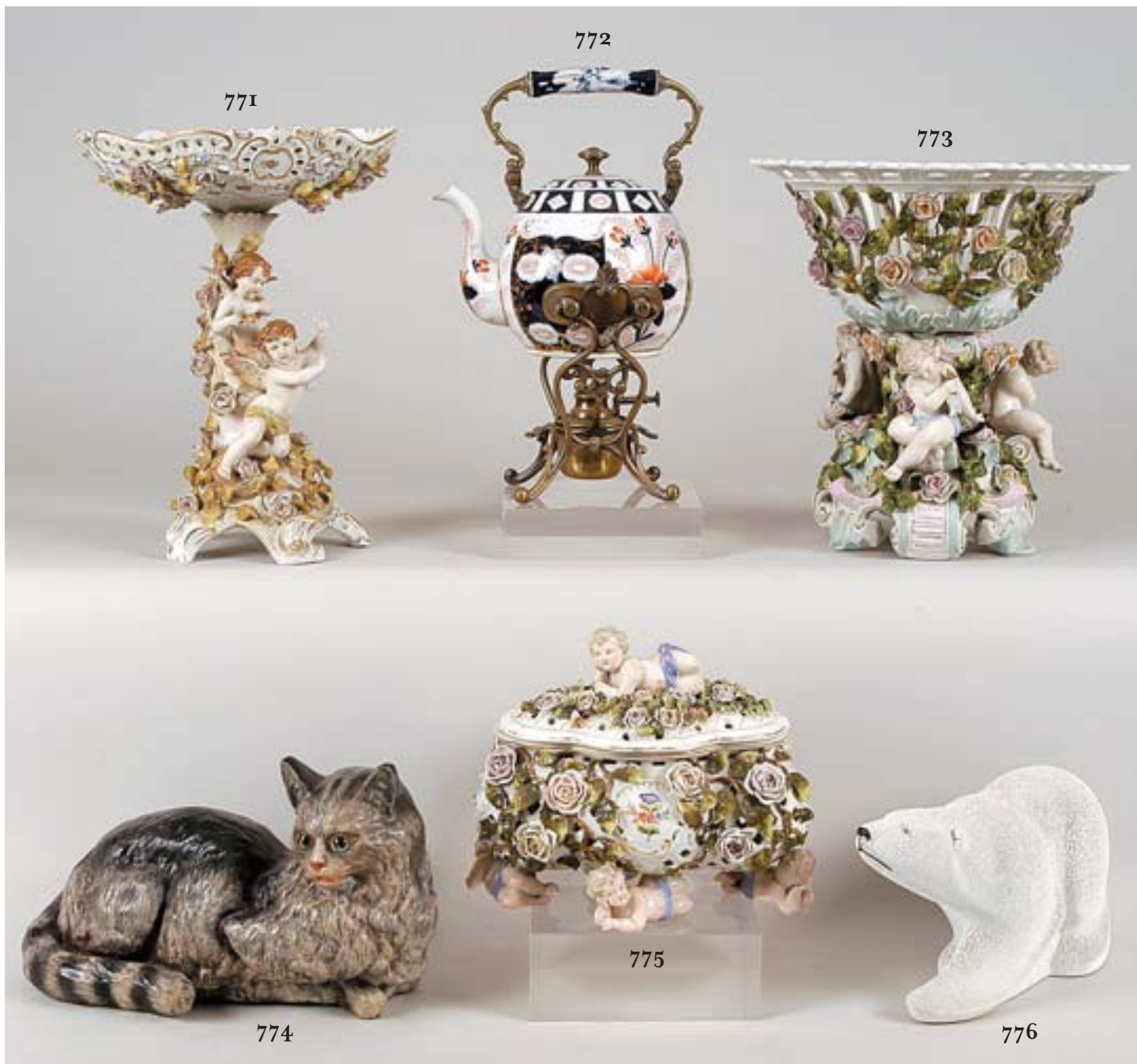
771 FRUTEIRO , porcelana, decoração relevada e policromada "putti e flores", alemão, séc. XIX, pequenas faltas e defeitos, marcado Dim. - 34,5 cm € 500 - 750