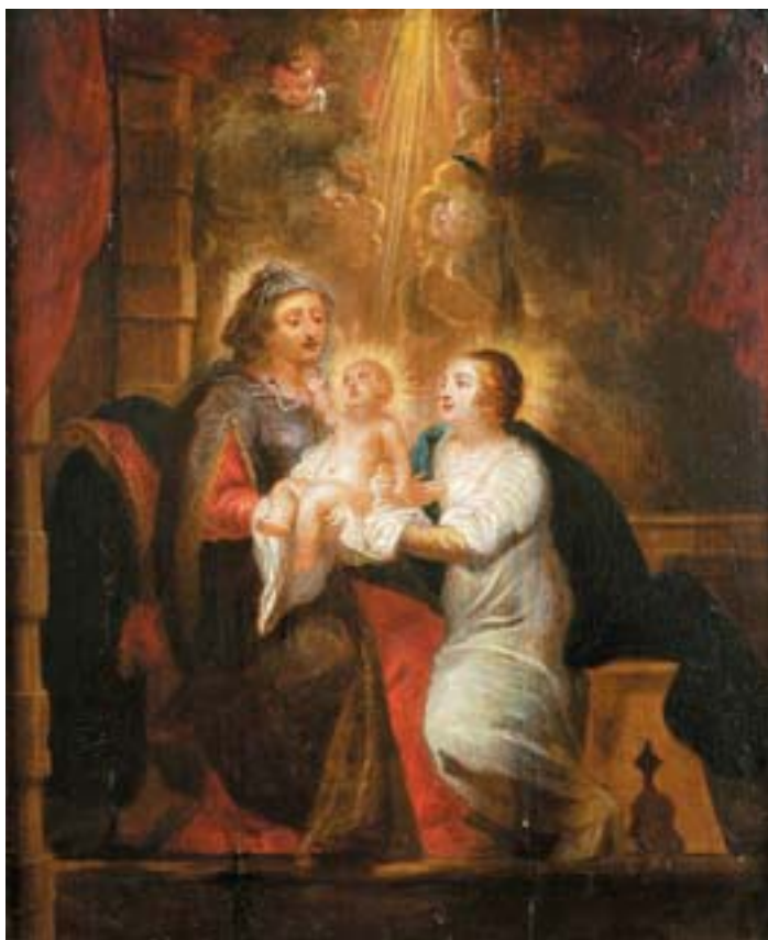
736 "SANTANA, NOSSA SENHORA E MENINO JESUS", óleo sobre madeira, moldura em madeira entalhada e dourada, escola flamenga, séc. XVII, restauros, defeitos, marca da cidade de Antuérpia no verso Dim. - 43 x 35 cm € 2.000 - 3.000