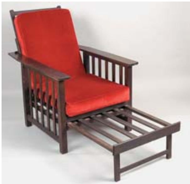
850 CADEIRA DE DECK, sicupira, Europa, séc. XIX/XX, pequenos defeitos Dim. - 102 x 76 x 101 cm