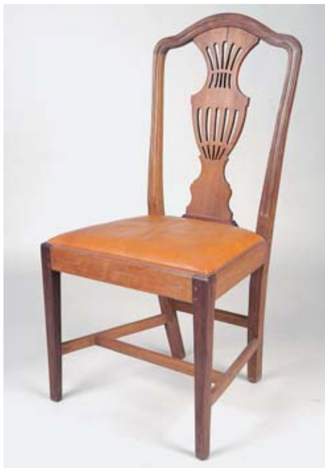
855 CONJUNTO DE OITO CADEIRAS , estilo pombalino, cinco em vinhático, três em mogno, assentos estofados, portuguesas, sécs. XIX e XX, faltas e defeitos Dim. - 100 x 50,5 x 46 cm € 2.000 - 3.000