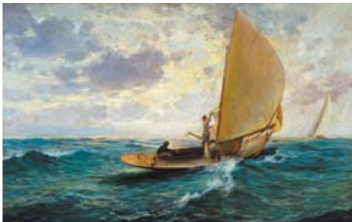
891 "MARINHA - BARCO À VELA", óleo sobre tela, Europa, séc. XIX/XX, assinatura não identificada Dim. - 75 x 120 cm