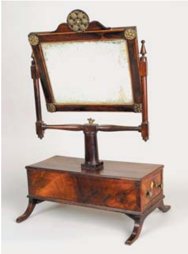
870 r) TOUCADOR DE CÔMODA, estilo Império, pau santo e mogno, aplicações em metal amarelo, português, séc. XIX, restauro e adaptação Dim. - 64 x 40 x 31 cm € 200 - 300