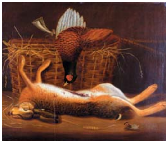
749 L. PARKER - SÉC. XIX, "NATUREZA MORTA - CAÇA", óleo sobre tela, reentelado, pequenos restauros, assinado Dim. - 64 x 76 cm