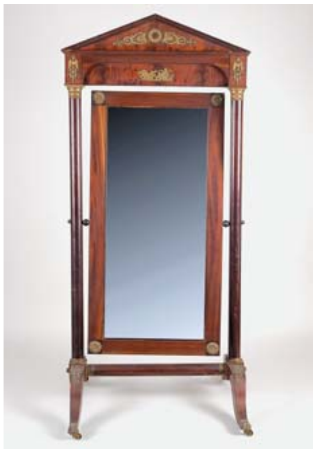
628 ESPELHO DE PÉ , estilo Império, mogno e raiz de mogno, aplicações em bronze, português, séc. XIX, faltas e defeitos Dim. - 211 x 100 x 90 cm