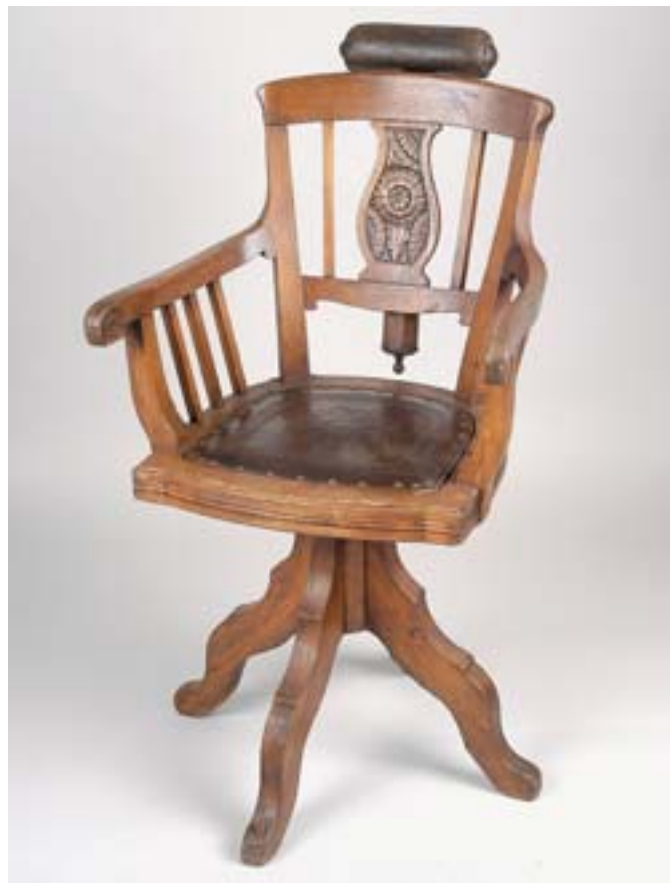
847 CADEIRA DE BARBEIRO , castanho, tabela entalhada, assento em couro lavrado com pregaria, portuguesa, séc. XIX/XX, pequenos defeitos Dim. - 113 x 59,5 x 61,5 cm € 400 - 600