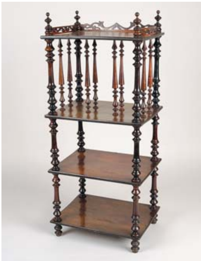
861 ESTANTE DE MÚSICA , nogueira, tampos faixeados a pau santo, gradinha rendilhada, francesa, séc. XIX, pequenos defeitos Dim. - 110,5 x 47 x 36 cm € 1.000 - 1.500