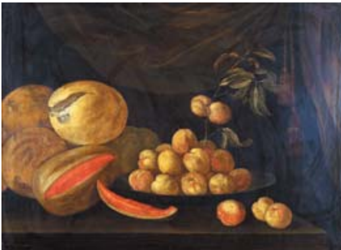
733 "NATUREZA MORTA - MESA COM FRUTOS", óleo sobre tela, escola espanhola, séc. XIX, reentelado e restaurado Dim. - 83 x 112 cm