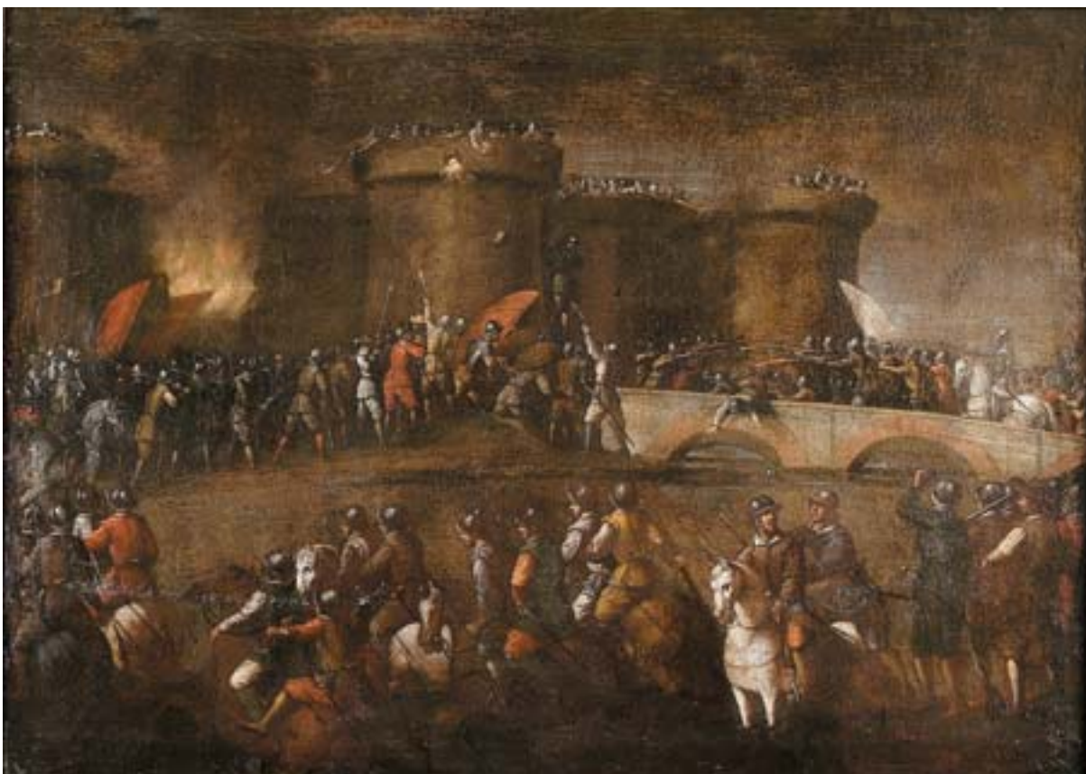
745 "ASSALTO AO CASTELO", óleo sobre tela, escola francesa, séc. XVII, reentelado e restauros Dim. - 75 x 102 cm € 4.000 - 6.000