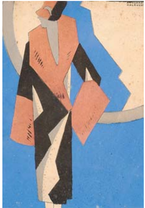
883 EDOUARD HALOUZE- SÉC. XX, "SENHORA", guache sobre papel, assinado Dim. - 17 x 12 cm