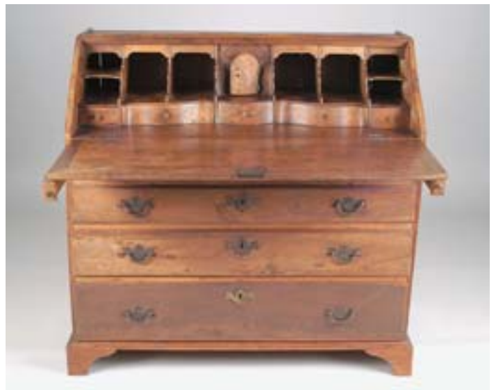
868 PAPELEIRA, D. Maria, nogueira, interior com gavetas e escaninhos, portuguesa, séc. XVIII, restauros e defeitos, sinais de xilófagos Dim. - 99 x 101 x 46 cm € 1.800 - 2.700