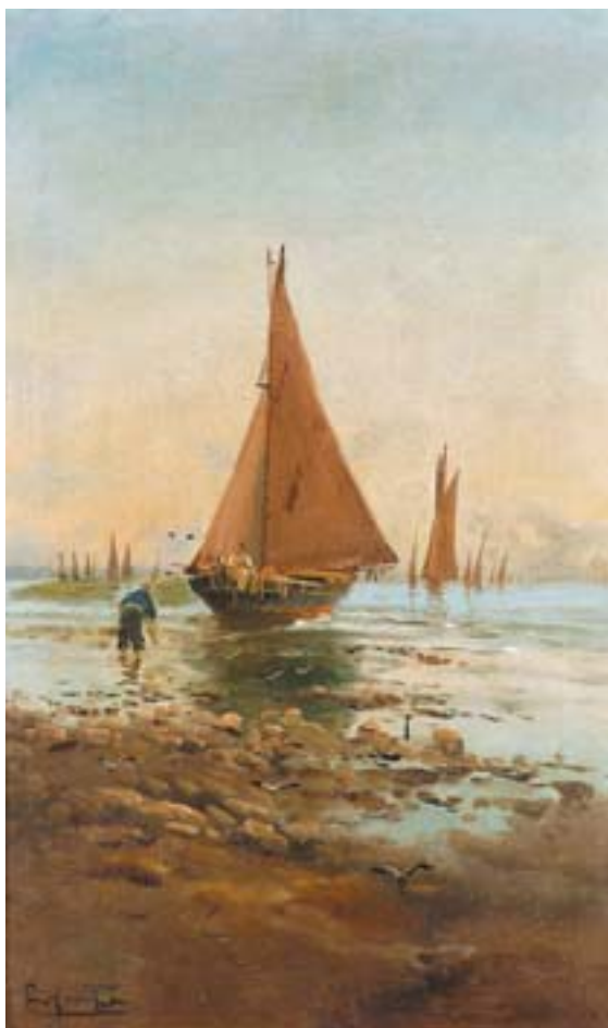
751 "MARINHA", óleo sobre tela, escola inglesa, séc. XIX, assinatura ilegível Dim. - 50 x 30 cm € 500 - 750