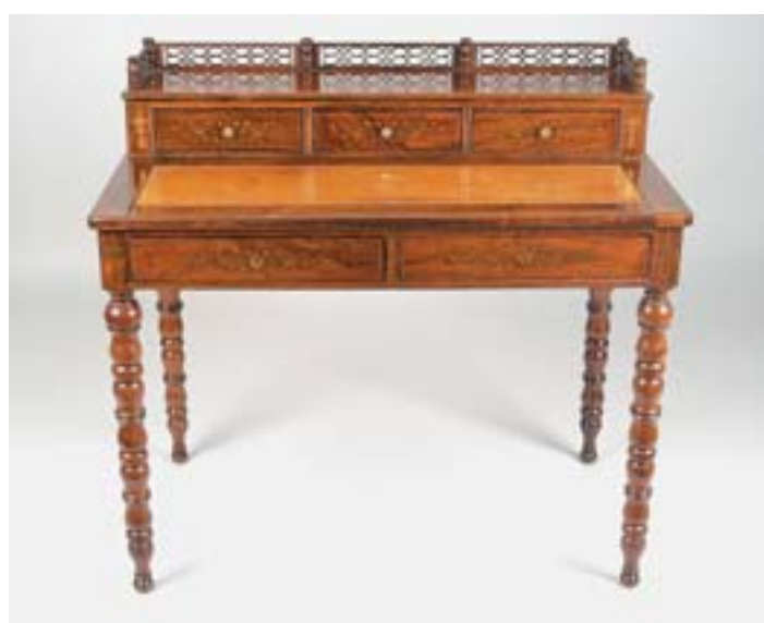
864 SECRETÁRIA COM PEQUENO ALÇADO , Carlos X, pau santo com filetes e embutidos em metal, alçado com gradinha rendilhada, tampo em pele, francesa, séc. XIX, pequenos defeitos Dim. - 92,5 x 97,5 x 59 cm € 2.000 - 3.000