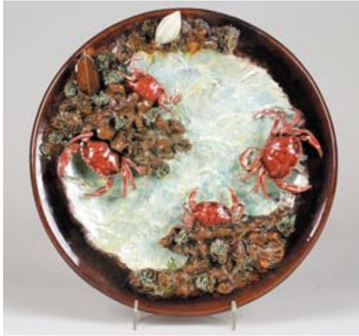
695 PRATO DECORATIVO DE GRANDES DIMENSÕES, barro vidrado, decoração relevada e policromada "marisco", Caldas, séc. XX, restaurado e gateado, marcado da FÁBRICA DE FAIANÇAS DAS CALDAS DA RAINHA Dim. - 43 cm