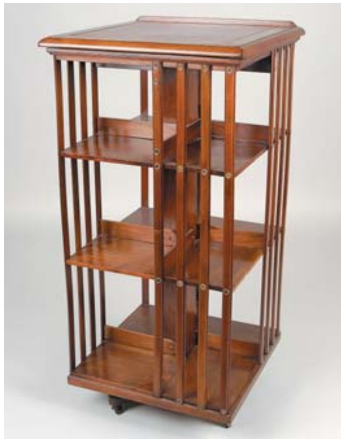
863 ESTANTE ROTATIVA PARA LIVROS , estilo Jorge III, carvalho, tampo forrado a couro, inglesa, séc. XIX/XX, pequenos defeitos Dim. - 117 x 56 cm € 700 - 1.050