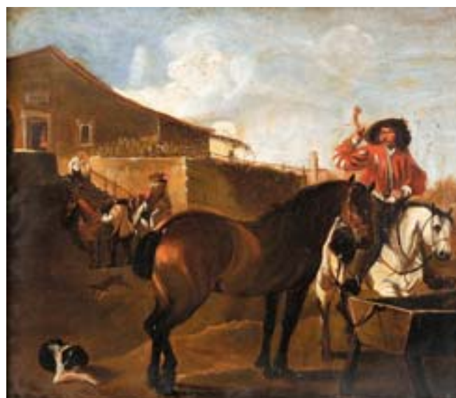
754 "CAVALEIROS SAINDO DA ESTALAGEM", óleo sobre tela, escola holandesa, séc. XIX, faltas na tinta, assinado com iniciais AT, datado de 27 de Junho de 1876 Dim. - 27,5 x 34,5 cm € 500 - 750