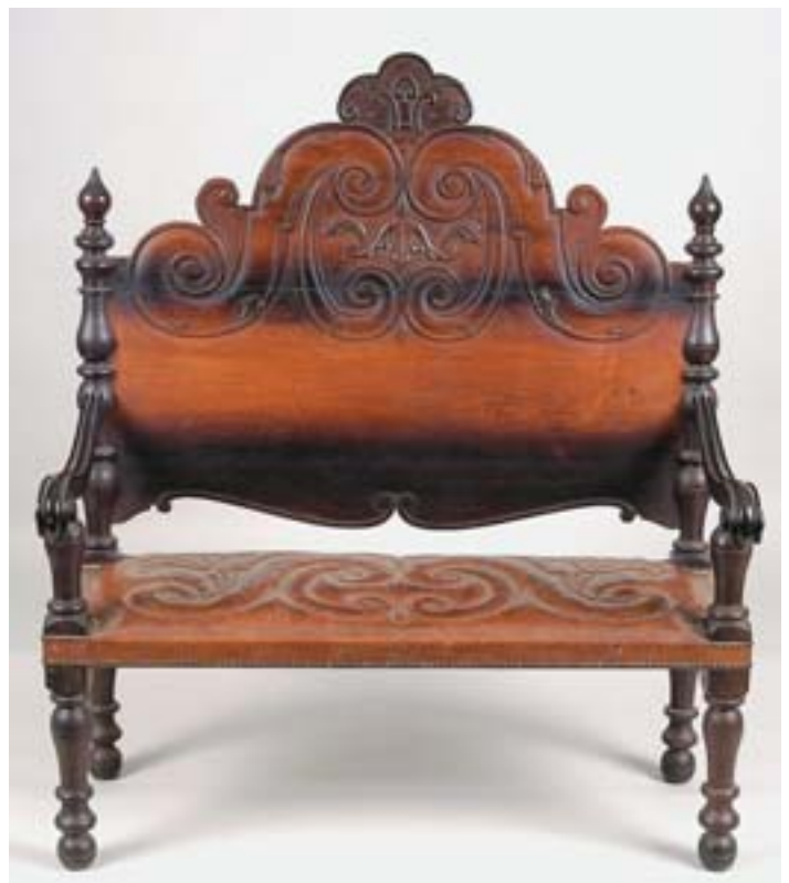
867 BANCO DE DOIS LUGARES, pau santo com entalhamentos, assento em couro, português, adaptação de cama D. José do séc. XVIII, couro moderno, pequenos defeitos Dim. - 130,5 x 111 x 53 cm € 300 - 450