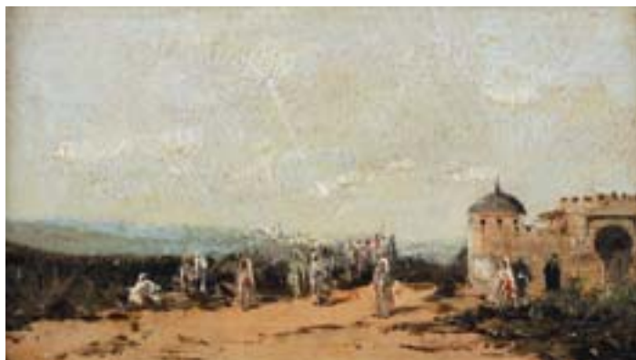
894 "PAISAGEM DO MAGREB", óleo sobre madeira, assinado com iniciais Dim. - 11,5 x 21 cm