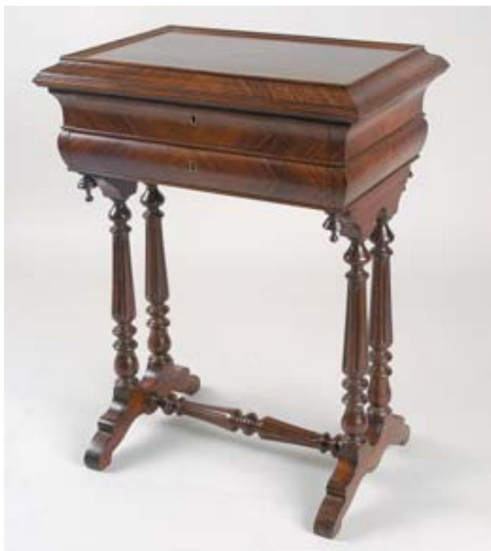
645 COSTUREIRA, victoriana, faixead a pau santo, interior com divisórias e espelho, inglesa, séc. XIX, pequenos defeitos Dim. - 55 x 39 x 75 cm