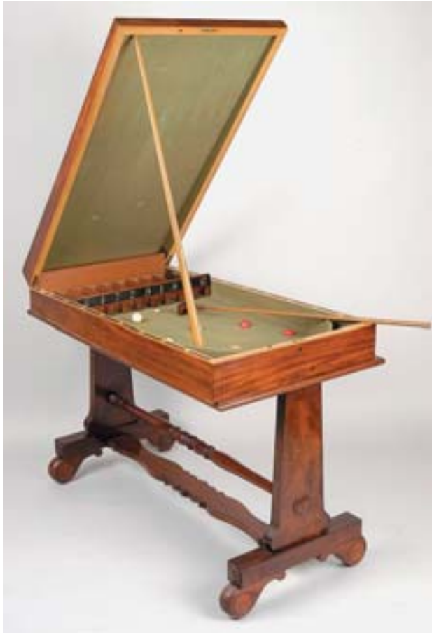
841 MESA DE BILHAR CHINÊS , victoriana, mogno e raiz de mogno, interior forrado a feltro, tacos em madeira, bolas em marfim, inglesa, séc. XIX, pequenos defeitos Dim. - 80 x 109,5 x 53,5 cm € 1.500 - 2.250