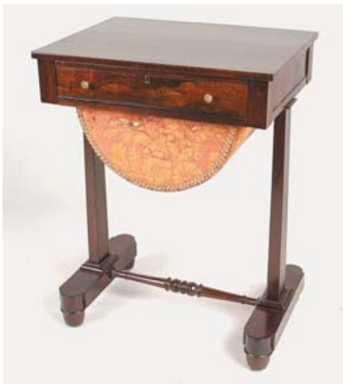
643 COSTUREIRA, victoriana, folheada a pau santo, cesto forrada a seda, inglesa, séc. XIX, pequenos defeitos Dim. - 72 x 53 x 39 cm