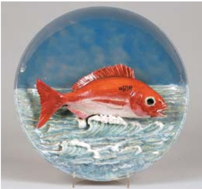
693 PRATO DECORATIVO DE GRANDES DIMENSÕES, barro vidrado, decoração relevada e policromada "peixe", Caldas, séc. XX, restauro na cauda do peixe, marcado da FÁBRICA DE FAIANÇAS ARTÍSTICAS BORDALO PINHEIRO - vd. Simas & Isidro, nº 108 Dim. - 45 cm