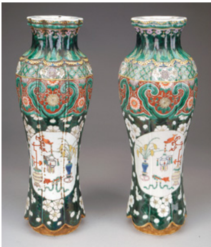
502 PAR DE JARRAS GOMADAS, porcelana da China, decoração policromada "objectos" sobre fundo negro e verde, reinado Jiaqing, séc. XVIII/XIX Dim. - 39 cm € 1.500 - 2.250