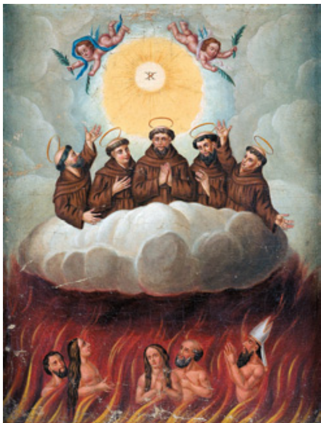
458 "CINCO MÁRTIRES DE MARROCOS",

óleo sobre tela, escola portuguesa, séc. XVIII, reentelado, faltas na tinta