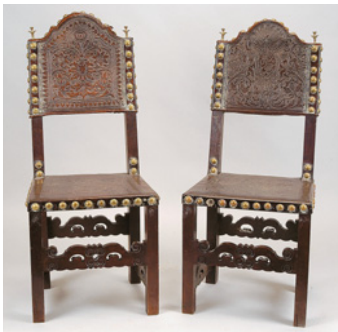
293 DUAS CADEIRAS, nogueira, assentos e costas em couro lavrado com pregaria, portuguesas, séc. XVII, diferenças, defeitos