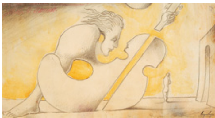
549 CRUZEIRO SEIXAS - NASC. 1920, "FIGURA SURREALISTA COM VIOLINO", desenho a lápis e aguarela sobre papel, assinado Dim. - 12 x 21,5 cm