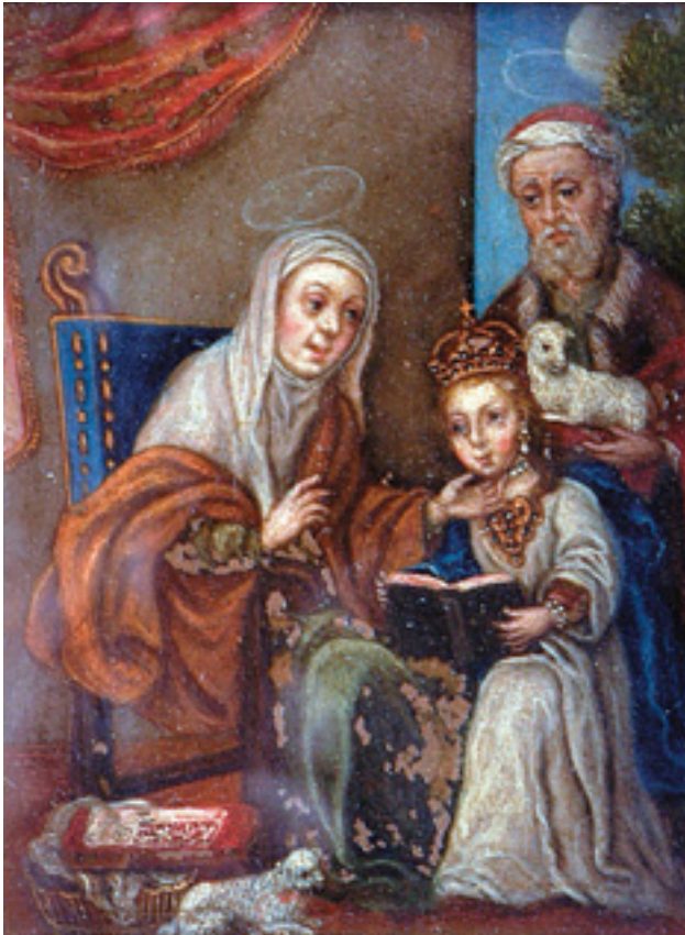
441 "SÃO JOAQUIM E SANTANA ENSINANDO NOSSA SENHORA A LER" , óleo sobre cobre, escola portuguesa, séc. XVIII, faltas na tinta Dim. - 11 x 8 cm