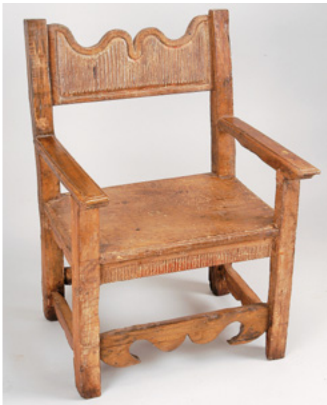
303 CADEIRA DE BRAÇOS, rústica, noqueira e castanho com vestígios de pintura, costas com painel canelado, portuguesa, séc. XVII Dim. - 100 x 67 x 61 cm € 700 - 1.050