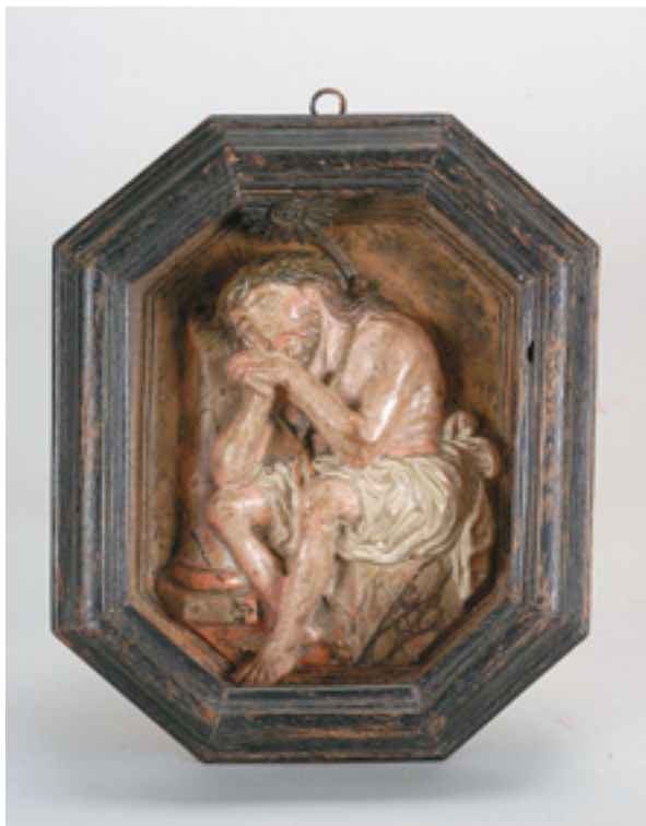
454 "SENHOR ATADO À COLUNA", placa oitavada em terracota policromada, resplendor em prata, moldura em madeira pintada, portuguesa, séc. XVIII/XIX Dim. - 21,5 x 17 cm € 300 - 450