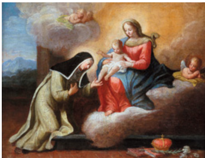
440 "SANTA TERESA DE ÁVILA ADORANDO O MENINO AO COLO DE NOSSA SENHORA", óleo sobre tela, escola portuguesa, séc. XVIII, reentelado e restaurado Dim. - 32 x 42 cm