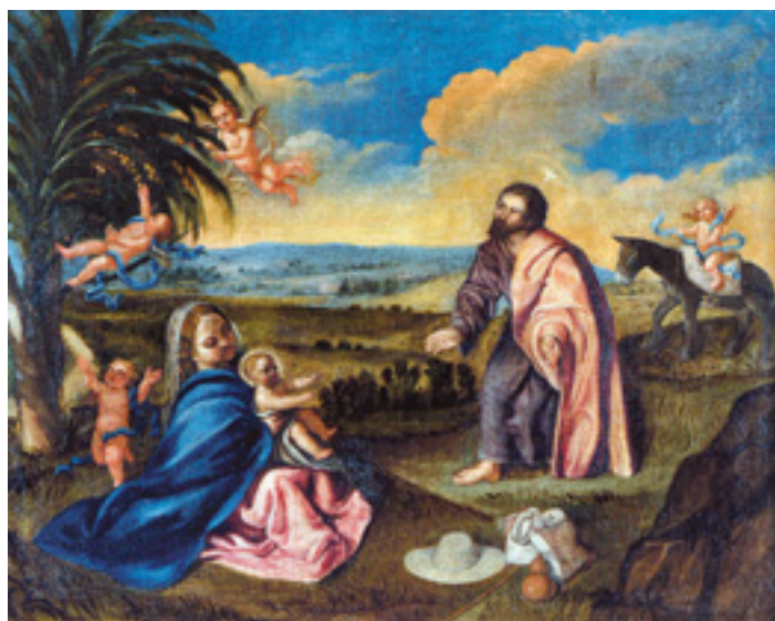
459 "DESCANSO DURANTE A FUGA PARA O EGIPTO",

óleo sobre tela, escola portuguesa, séc. XVIII, reentelado e restaurado