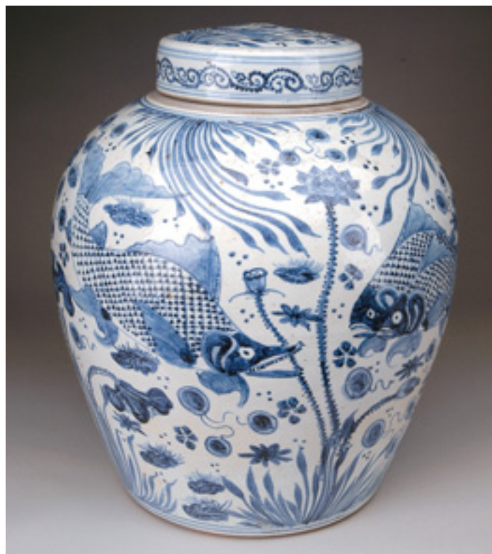
509 POTE DE GRANDES DIMENSÕES COM TAMPA, porcelana da China, decoração a azul "plantas e peixes", dinastia Ming, séc. XVII, cabelo na tampa Dim. - 42 cm € 1.000 - 1.500