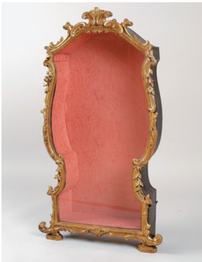
299 MAQUINETA DE SUSPENSÃO, D. José, moldura frontal em madeira entalhada e dourada, interior forrado, portuguesa, séc. XVIII, pequenos defeitos Dim. - 100 x 54 x 19 cm € 800 - 1.200