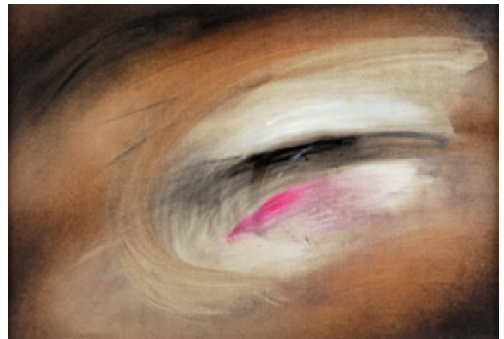
527 GRACINDA CANDEIAS - NASC. 1947, "INTERLÚDIO", óleo sobre tela, assinado e datado de 1993 no verso Dim. - 25 x 35 cm