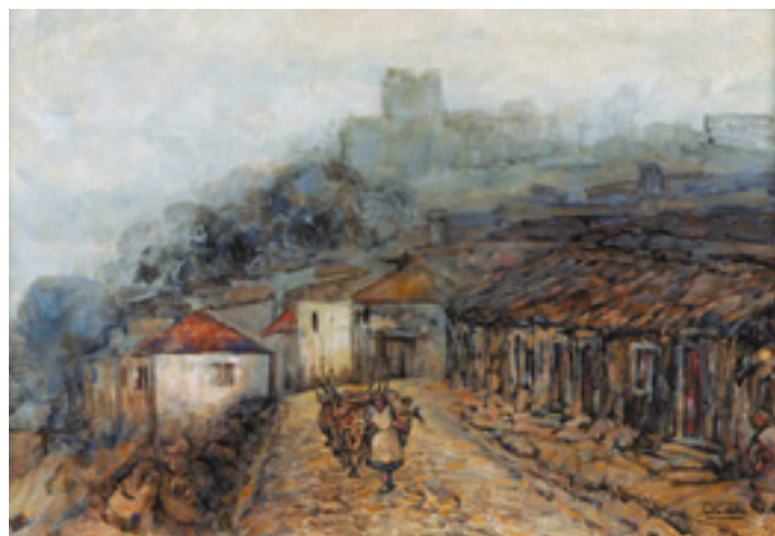
535 AUGUSTO COSTA, "NA GALIZA",

óleo sobre tela, assinado Dim. - 38 x 56 cm