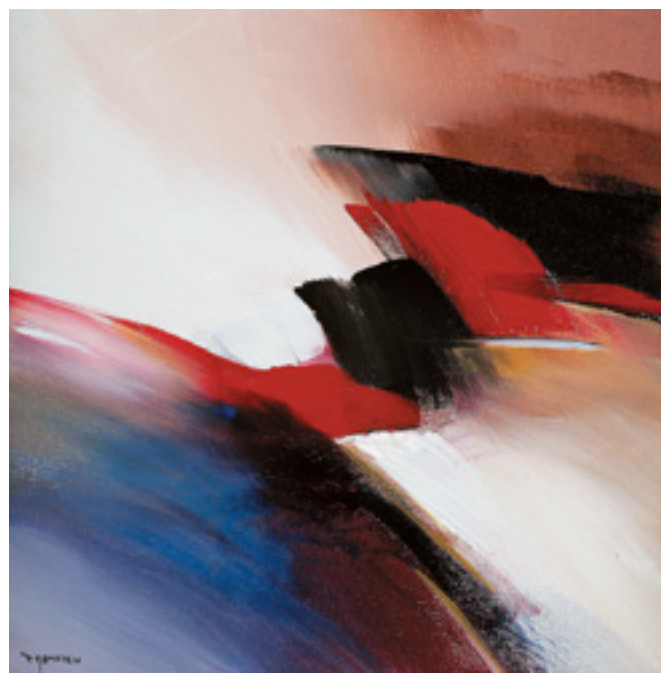
531 PAUL MATHIEU - NASC. 1953, "THE NEW TWENTIES II", acrílico sobre tela, assinado e datado de 2005 Dim. - 20 x 20 cm