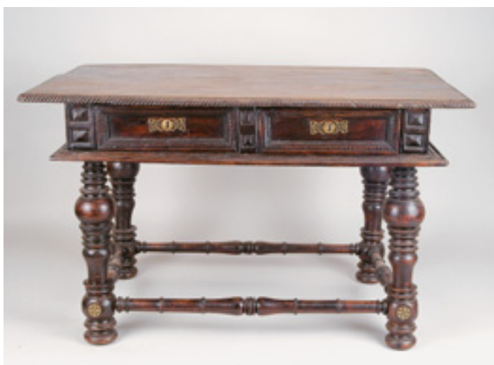
304 BUFETE DE TREMIDOS, castanho, travejamento torneado, frisos com sulcos, português, séc. XVII/XVIII, faltas e defeitos Dim. - 82 x 130 x 77 cm € 1.000 - 1.500