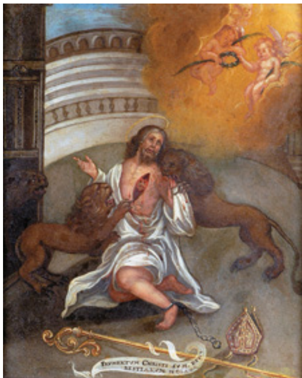
455 "BISPO MÁRTIR NA ARENA ATACADO POR LEÕES", óleo sobre cobre, escola italiana, séc. XVII/XVIII Dim. - 21,5 x 17,5 cm € 250 - 375