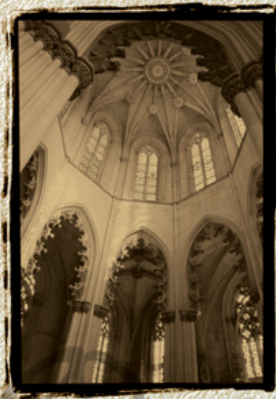
Mosteiro da Batalha Património Mundial UNESCO | 1983

O segredo das catedrais, dos mosteiros e dos templos milenares é terem sido construídos para a eternidade. Perante a solidez das suas colunas temos uma certeza de durabilidade superior ao tempo da nossa vida. Outros, depois de nós, sentirão o mesmo espanto ante o seu poder e a sua beleza.