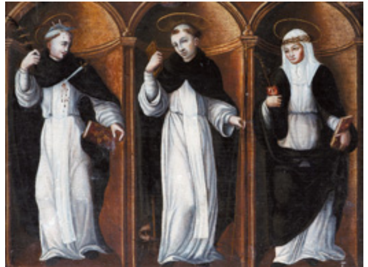
453 "TRÊS SANTOS DOMINICANOS", óleo sobre madeira, escola espanhola, séc. XVII, pequenos restauros, assinatura no verso DON ANTÓNIO QUIÑONES Dim. - 38 x 51 cm