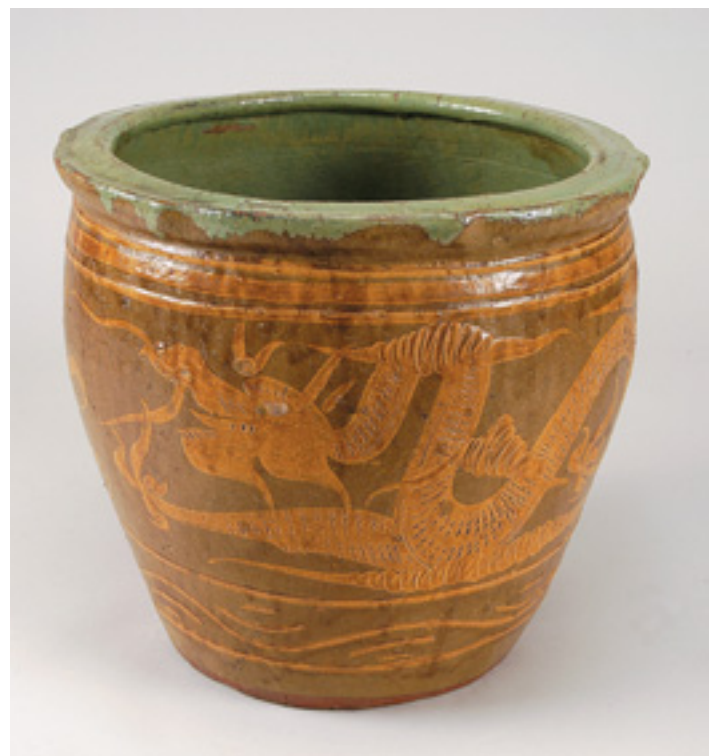
519 CACHEPOT DE GRANDES DIMENSÕES, grés vidrado, decoração a sépia "dragões" sobre fundo verde, China, séc. XIX, pequenas faltas no vidrado Dim. - 46,5 cm € 150 - 225