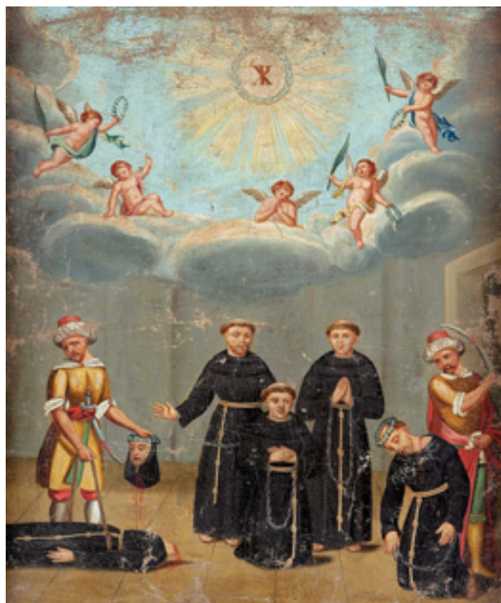
460 "CINCO MÁRTIRES DE MARROCOS",

óleo sobre tela, escola portuguesa, séc. XVIII, reentelado, faltas na tinta