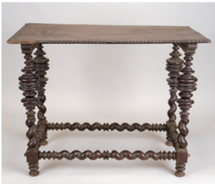
288 BUFETE SEM GAVETAS, de torcidos, pau santo com tampo em sicupira, travejamento torneado, português, séc. XVIII, pequenas faltas e defeitos Dim. - 79,5 x 104 x 58 cm € 600 - 900