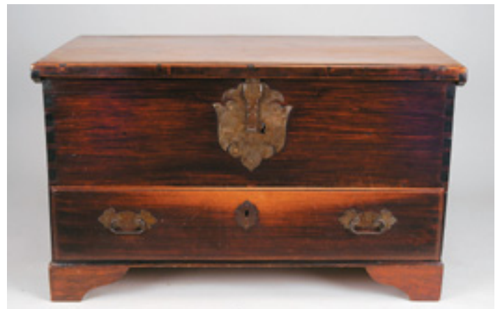
298 ARCA, vinhático, com gaveta, portuguesa, séc. XIX Dim. - 70 x 115 x 58 cm € 600 - 900