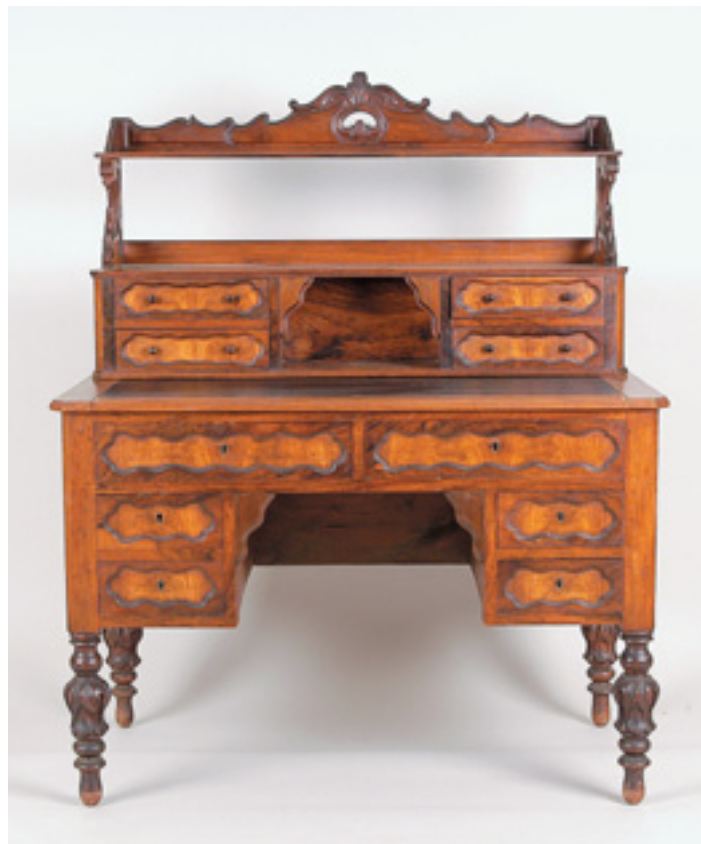
575 SECRETÁRIA COM PEQUENO ALÇADO , nogueira e raiz de noqueira, portuguesa, séc. XIX, pequenos defeitos Dim. - 138 x 112 x 61 cm