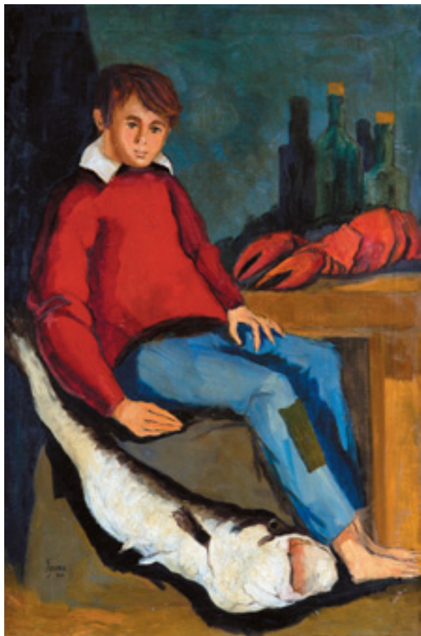
532 JOSÉ LUÍS FIGUEIROA - NASC. 1925, "PESCADOR",

óleo sobre tela, assinado e datado de 1967 Dim. - 93 x 62 cm