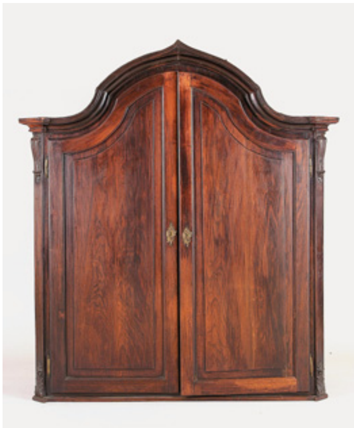
573 ORATÓRIO , D. Maria, pau santo, interior forrado a damasco vermelho, português, séc. XVIII, pequenos defeitos Dim. - 137 x 121 x 42 cm