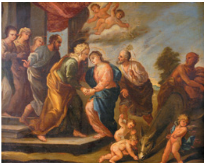
438 "VISITAÇÃO", óleo sobre madeira, escola portuguesa, séc. XVIII Dim. - 38 x 49 cm