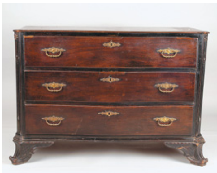
576 CÓMODA , D. José, vinhático com entalhamentos, portuguesa, séc. XVIII, restauros, pequenas faltas e defeitos, ferragens não originais Dim. - 87,5 x 131 x 61 cm