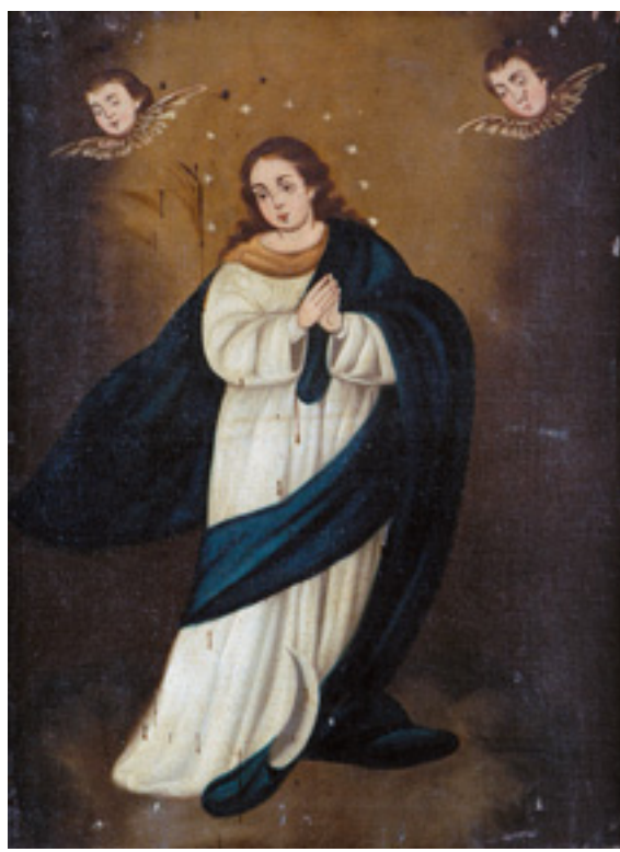
465 "NOSSA SENHORA DA CONCEIÇÃO", óleo sobre tela, escola portuguesa, séc. XVIII, reentelado, restaurado; Dim. - 80 x 60 cm € 500 - 750