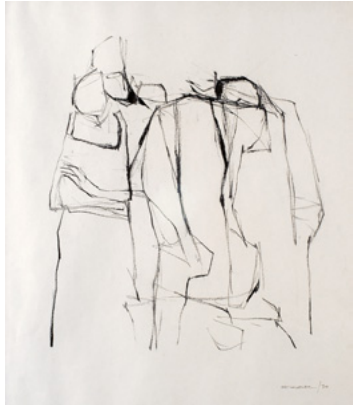
526 DOURDIL - NASC. 1914, "FIGURAS", desenho a lápis sobre papel, assinado e datado de 1970 Dim. - 50 x 45 cm