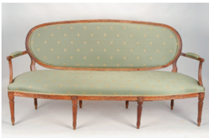
300 CANAPÉ, D. Maria, nogueira, assento estofado, português, séc. XVIII/XIX, pequenos defeitos Dim. - 95,5 x 188 x 56 cm € 800 - 1.200