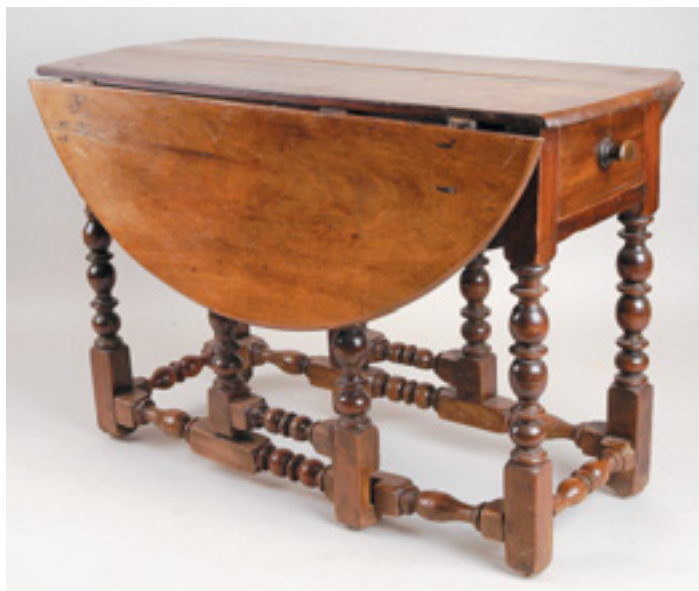
306 MESA DE ABAS, vinhático, travejamento torneado, portuguesa, séc. XVIII, pequenos defeitos Dim. - 78 x 114 x 50 cm € 800 - 1.200