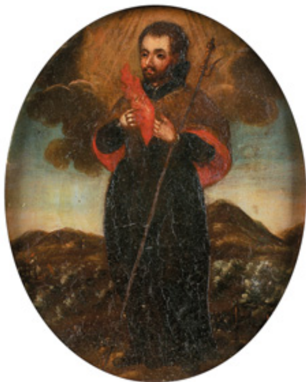
462 "SÃO FRANCISCO XAVIER", óleo sobre cobre, escola portuguesa, séc. XVII/XVIII, restauros Dim. - 19 x 15,5 cm € 300 - 450