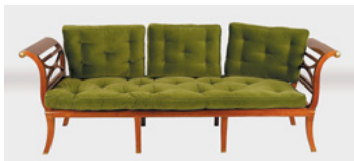
302 CANAPÉ, mogno, assento em palhinha, séc. XIX/XX, pequenos defeitos, pequena falta na palhinha Dim. - 78 x 230 x 70 cm € 600 - 900