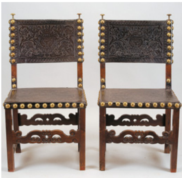
291 PAR DE CADEIRAS, nogueira, travejamentos entalhados, assentos e costas em couro lavrado com pregaria, portuguesas, séc. XVII, defeitos