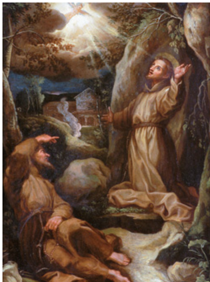
439 "SÃO FRANCISCO DE ASSIS E OUTRO SANTO FRANCISCANO", óleo sobre cobre, escola italiana, séc. XVIII, inscrição no verso ROMA 1723 Dim. - 34 x 26 cm