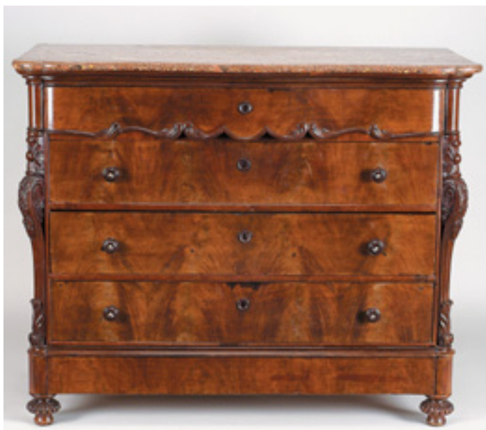
574 CÓMODA , romântica, mogno e raiz de mogno com entalhamentos, puxadores com aplicação de marfim, tampo de mármore, portuguesa, séc. XIX, pequenas faltas e defeitos; Dim. - 107,5 x 133 x 64 cm