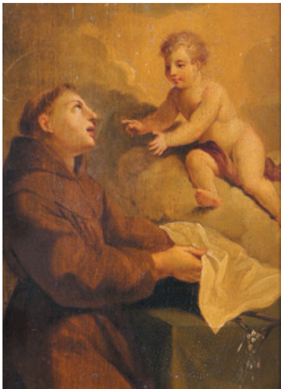
433 "SANTO ANTÓNIO COM O MENINO",

óleo sobre madeira, escola portuguesa, séc. XVIII