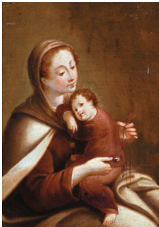
435 "NOSSA SENHORA DO CARMO",

óleo sobre cobre, escola portuguesa, séc. XVIII/XIX, restaurado