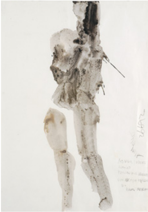
524 GRAÇA MORAIS - NASC. 1948, "FIGURA", tinta da China sobre papel, assinado e dedicado Dim. - 61 x 43 cm