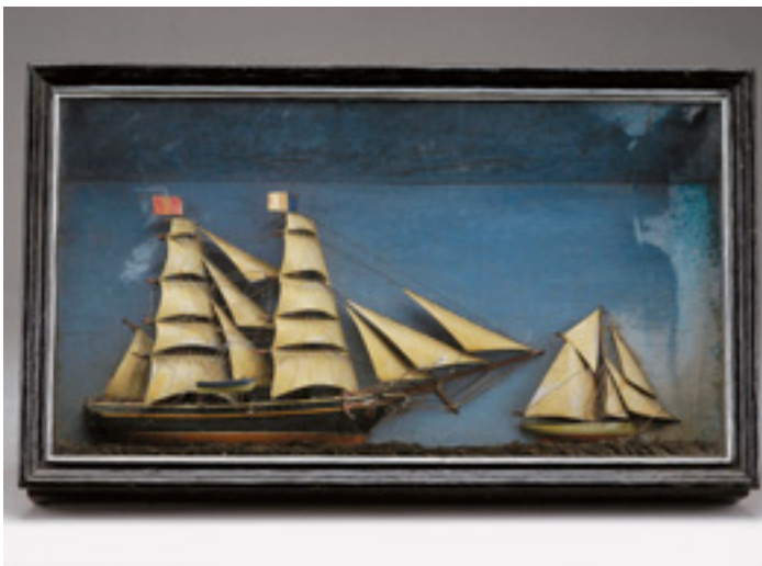
517 "VELEIROS", maquete em madeira relevada e outros materiais, emoldurada, portuguesa, séc. XIX, pequenos defeitos Dim. - 38 x 64 x 9 cm € 500 - 750