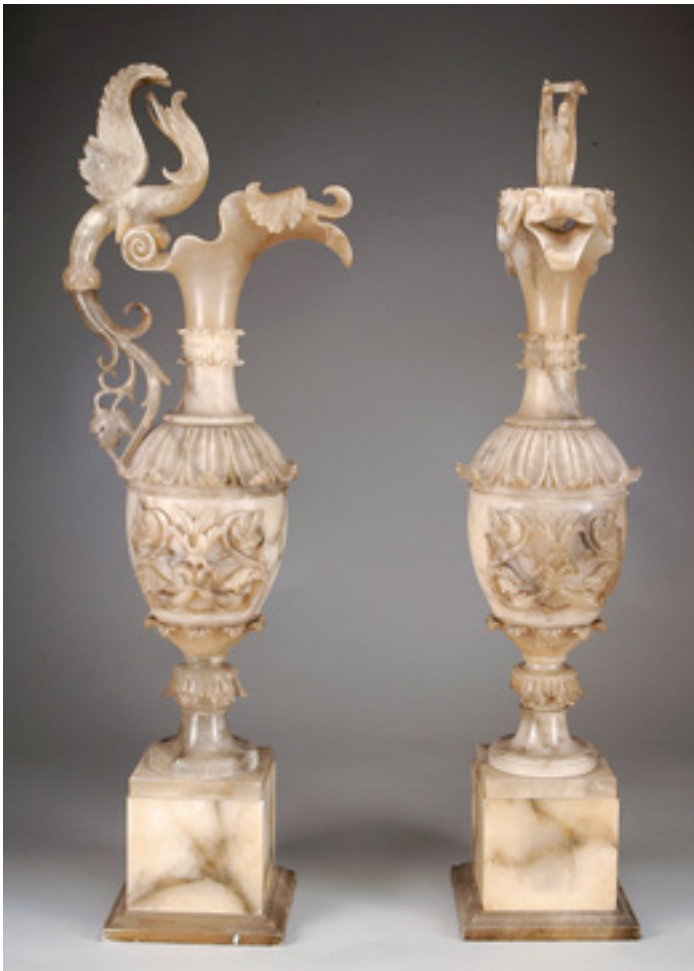
516 PAR DE ÂNFORAS, alabastro esculpido, Europa, séc. XIX/XX, uma partida e colada Dim. - 94,5 cm € 700 - 1.050