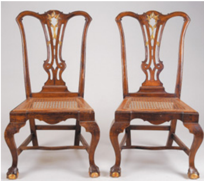
567 PAR DE CADEIRAS , estilo D. José, nogueira com entalhamentos dourados, assentos em palhinha, portuguesas, séc. XIX, restauros nos dourados, pequenos defeitos Dim. - 103 x 58 x 59 cm € 1.200 - 1.800