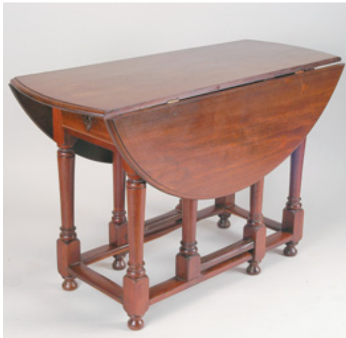
294 MESA DE CANCELA, sicupira, abas redondas, portuguesa, séc. XVIII, pequenos defeitos