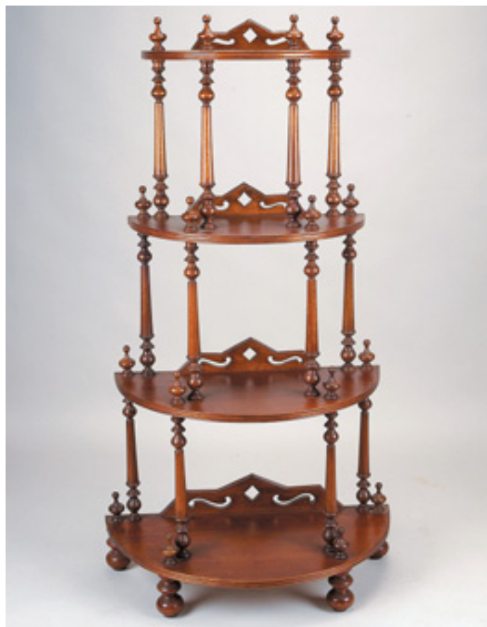
301 ETAGÈRE, romântica, mogno, colunas torneadas, portuguesa, séc. XIX, pequenos defeitos Dim. - 141,5 x 76,5 x 41 cm € 250 - 375