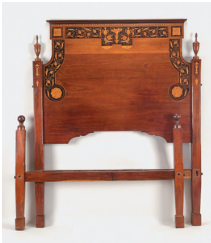
305 CAMA, estilo D. Maria, mogno, faixa em pau santo com embutidos em buxo "ânforas e flores", portuguesa, séc. XIX/XX Dim. - 180 x 209 x 147 cm € 1.000 - 1.500