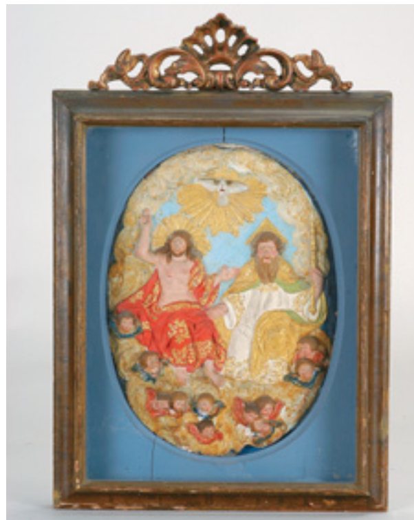
456 "SANTÍSSIMA TRINDADE RODEADA DE QUERUBINS", placa oval em terracota relevada e policromada, moldura em madeira dourada, portuguesa, séc. XVIII/XIX, faltas Dim. - 37 x 27 cm (placa) € 600 - 900