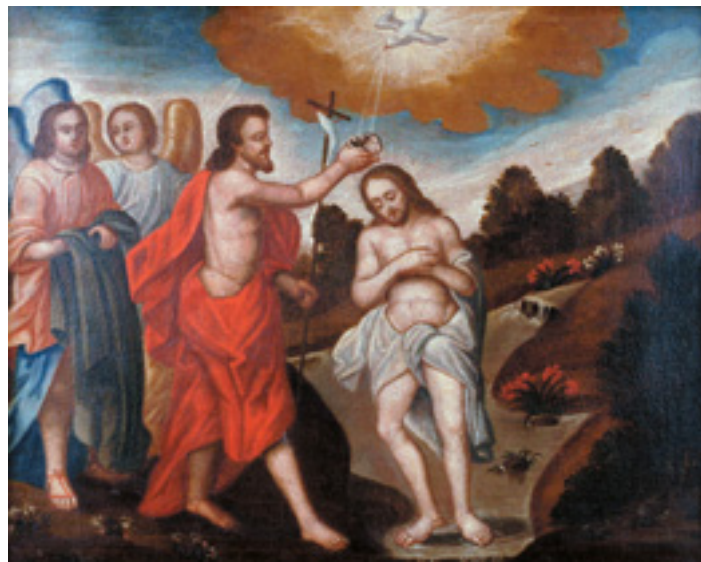
461 "BAPTISMO DE CRISTO",

óleo sobre tela, escola portuguesa, séc. XVIII/XIX, reentelado, restaurados