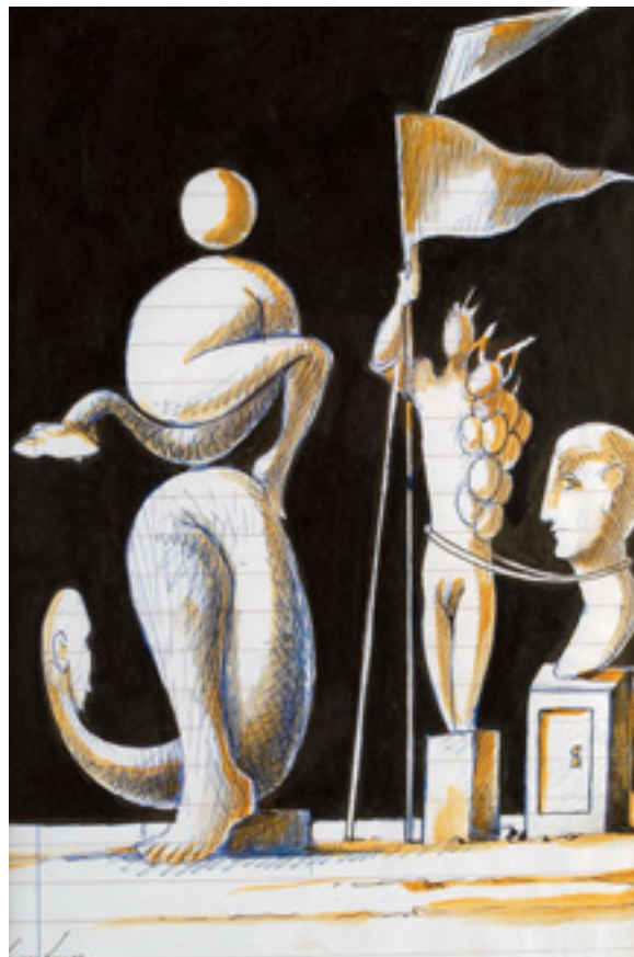
550 CRUZEIRO SEIXAS - NASC. 1920, "FIGURAS SURREALISTAS", tinta da China, caneta e aguarela sobre papel, assinada Dim. - 21 x 14 cm