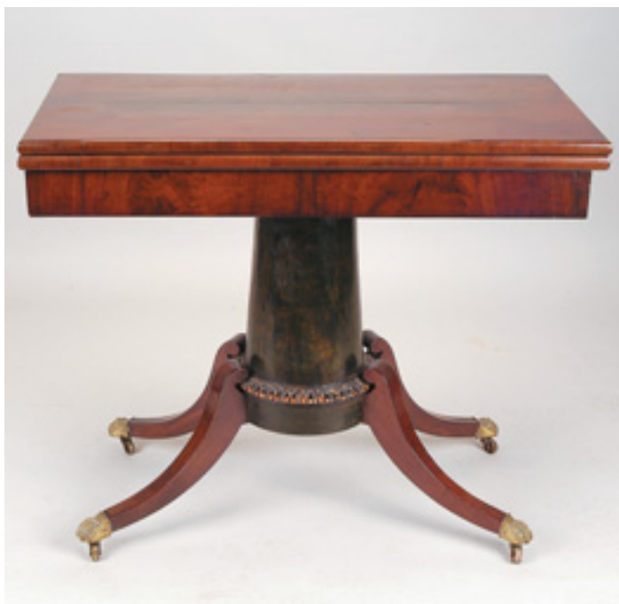
292 MESA DE CHÁ, murta, coluna central, portuguesa, séc. XIX, defeitos