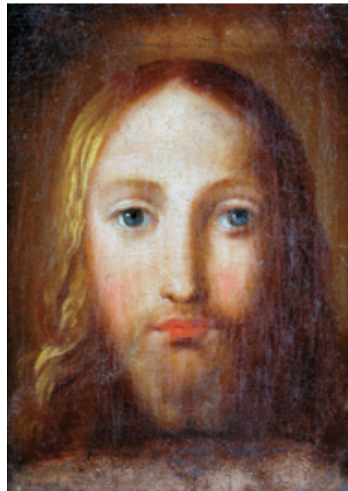
436 "FACE DE CRISTO",

óleo sobre tela, escola espanhola, séc. XVIII/XIX