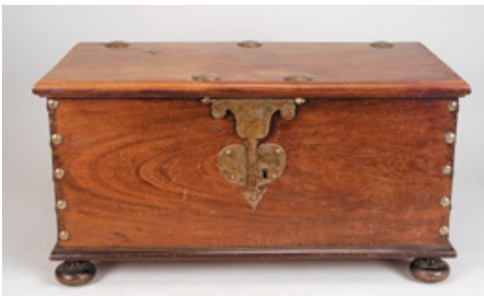
296 ARCA, sicupira, ferragens, portuguesa, séc. XIX Dim. - 58 x 108 x 53 cm € 400 - 600