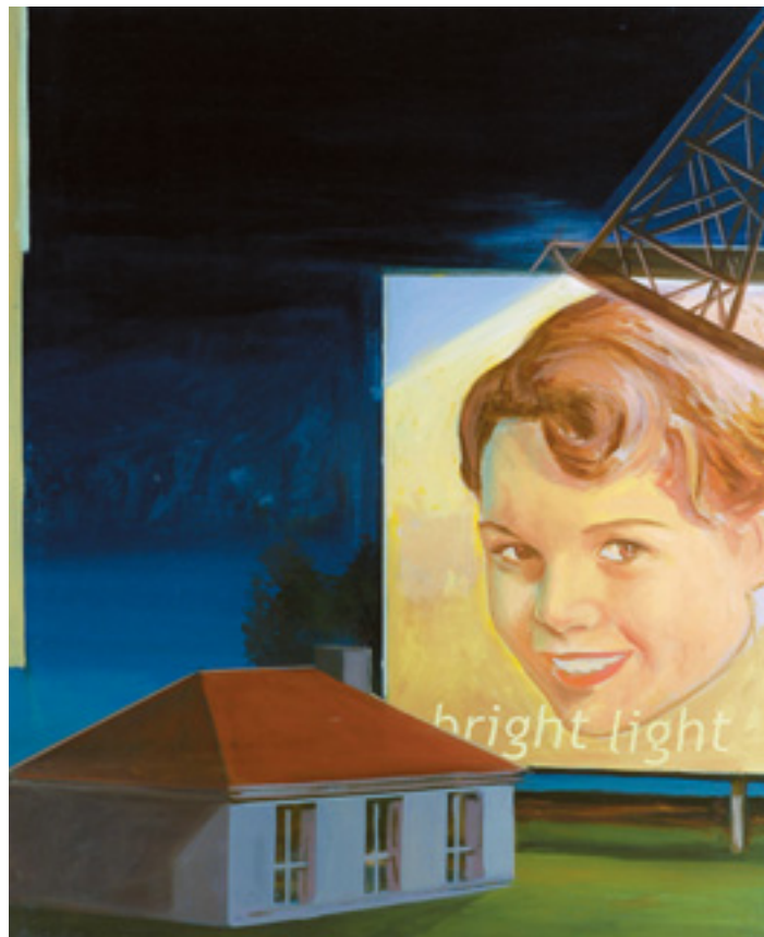
534 PEDRO PASCOINHO - NASC. 1972, "BRIGHT LIGHT",

óleo sobre tela, pequeno defeito na tela, assinado Dim. - 100 x 80 cm