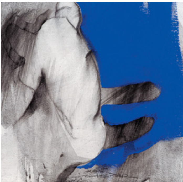
528 FERNANDO GASPAR - NASC. 1966, "MOMENTO # 5", acrílico sobre tela, assinado e datado de 2005 Dim. - 20 x 20 cm