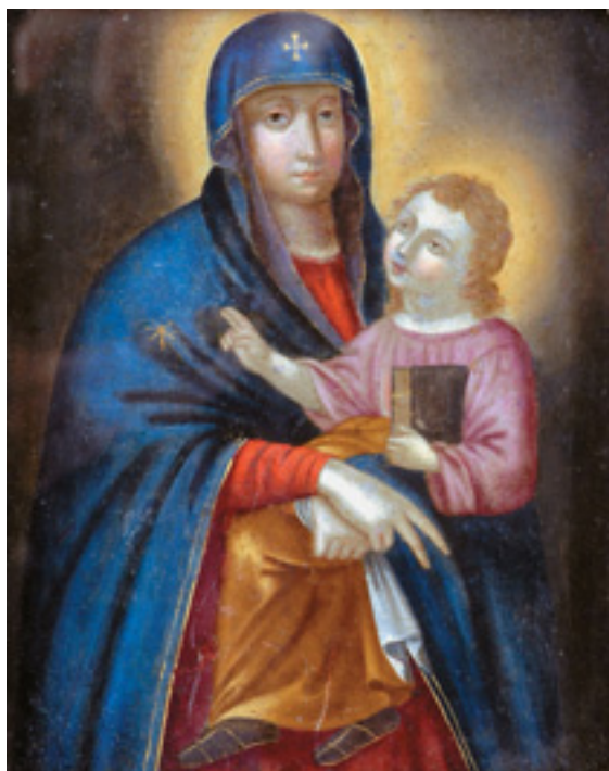
434 "NOSSA SENHORA DO POPOLO",

óleo sobre cobre, moldura em pau santo com aplicações em prata, escola italiana, séc. XVIII, pequenos restauros