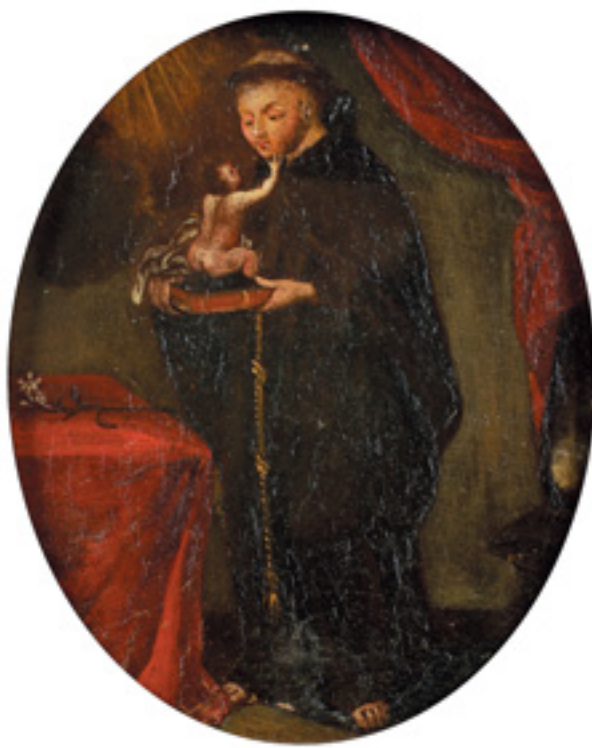
464 "SANTO ANTÓNIO COM O MENINO", óleo sobre cobre, escola portuguesa, séc. XVII/XVIII, restauros Dim. - 19 x 15,5 cm € 300 - 450