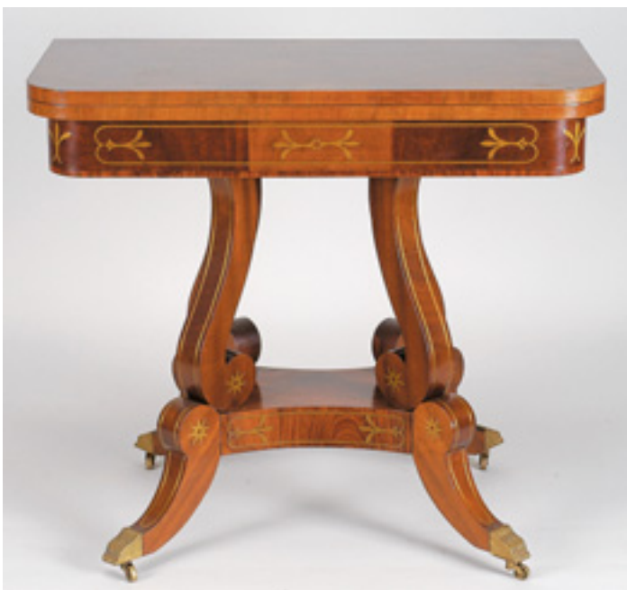
569 MESA DE JOGO , mogno e raiz de nogueira com embutidos, inglesa, séc. XX, pequenos defeitos Dim. - 77,5 x 88 x 44 cm € 300 - 450