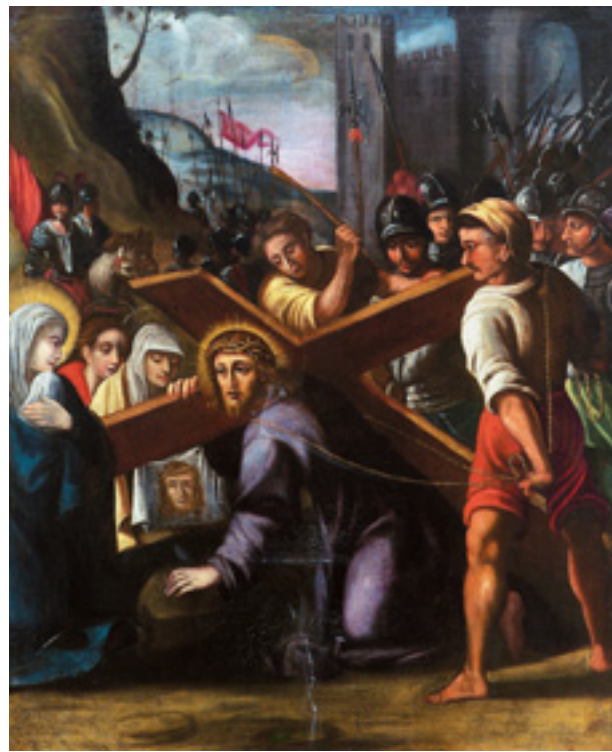
457 "CRISTO CARREGANDO A CRUZ", óleo sobre tela, escola portuguesa, séc. XVIII, reentelado, restaurado; Dim. - 106 x 87 cm € 2.000 - 3.000