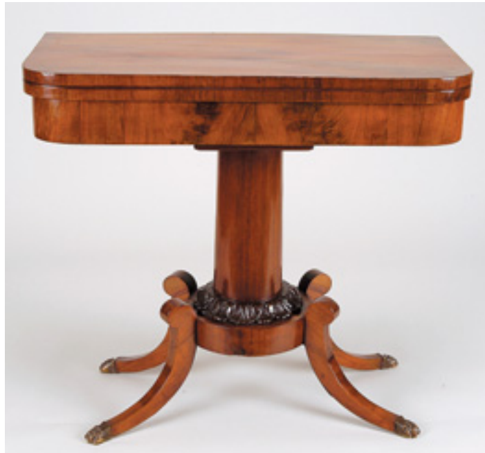
572 MESA DE JOGO , mogno e raiz de mogno, coluna central com entalhamentos, quatro pés com extremidades em bronze, portuguesa, séc. XIX, pequenos defeitos Dim. - 76 x 84 x 42 cm € 600 - 900