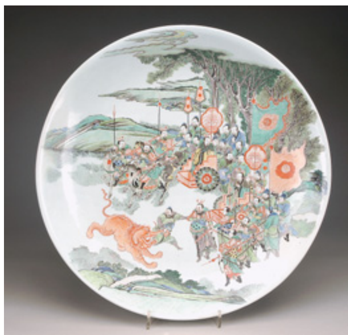
505 PRATO DE GRANDES DIMENSÕES, porcelana da China, decoração policromada "figuras orientais", reinado Kangxi, séc. XVII/XVIII, dois restauros no bordo Dim. - 54,5 cm € 1.000 - 1.500