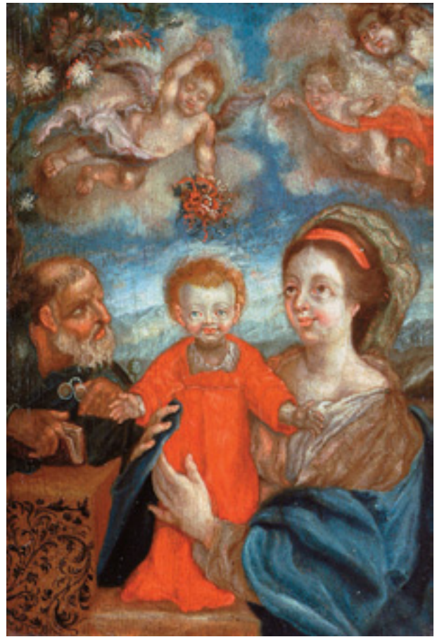
452 "SAGRADA FAMÍLIA", óleo sobre madeira, escola portuguesa, séc. XVIII/XIX, pequenos restauros Dim. - 26 x 17,5 cm