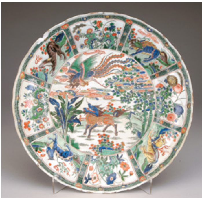
506 PRATO DE GRANDES DIMENSÕES, porcelana da China, decoração a verde e policromada, "paisagem oriental com animais", reinado Kangxi, séc. XVII/XVIII, restaurado Dim. - 36,5 cm € 1.000 - 1.500