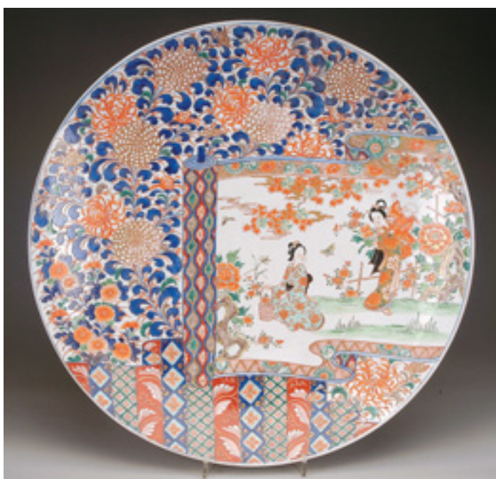
503 PRATO DE ENORMES DIMENSÕES, porcelana da China, decoração policromada "figuras orientais", base em madeira com torneados, séc. XIX, restauro Dim. - 61,5 cm € 150 - 225