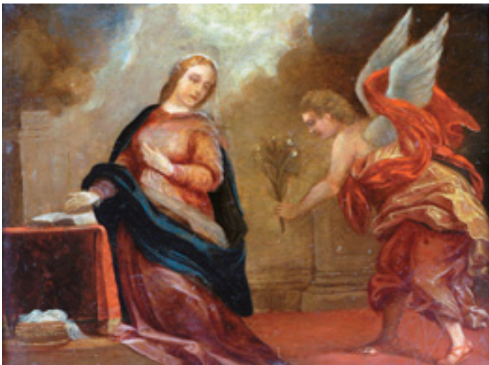
451 "ANUNCIÇÃO", óleo sobre cobre, escola portuguesa, séc. XVIII, restaurado Dim. - 20 x 25 cm