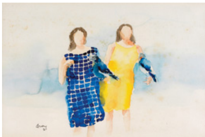
533 PAULO OSSIÃO - SÉC. XX, "AS MENINAS",

aguarela sobre papel, assinada e datada de 1985 Dim. - 23 x 36 cm