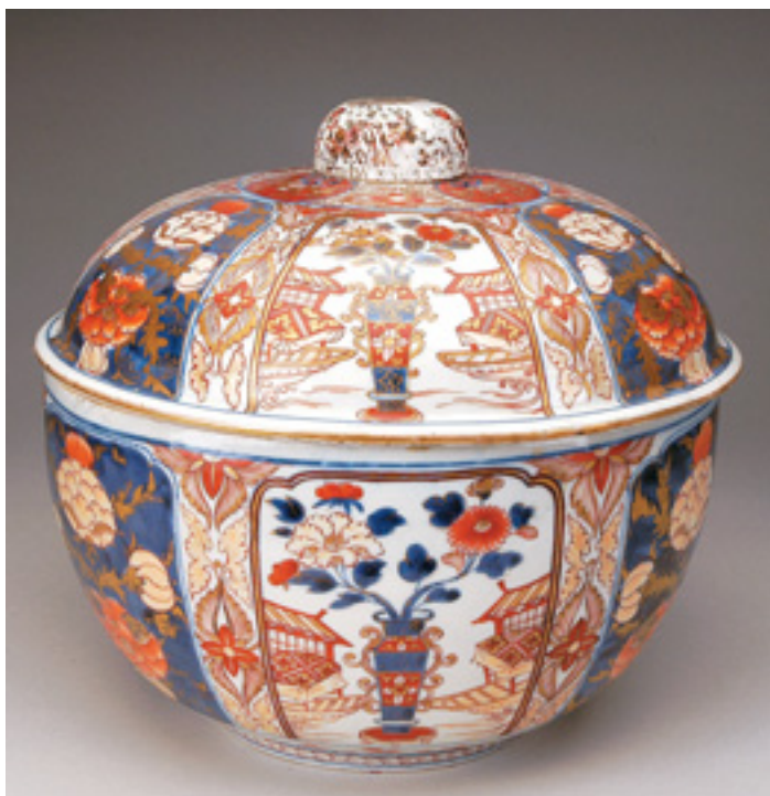
507 TERRINA REDONDA, porcelana da China, decoração policromada Imari "flores", reinado Qianlong, séc. XVIII, cabelo no corpo, falta no fruto da pega Dim. - 29 cm € 2.000 - 3.000