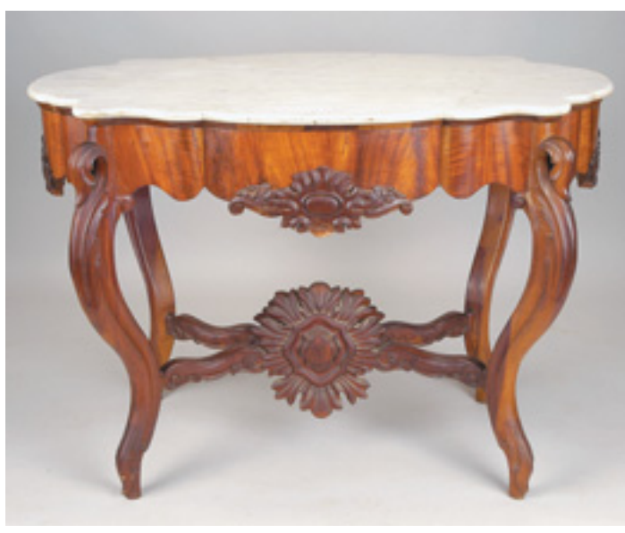
290 MESA DE CENTRO, romântica, mogno e raiz de mogno com entalhamentos, tampo de mármore, portuguesa, séc. XIX, pequenas faltas e defeitos Dim. - 82 x 14,5 x 61,5 cm € 250 - 375