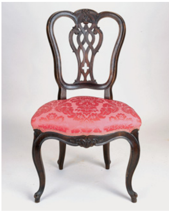
289 CONJUNTO DE SEIS CADEIRAS, estilo Luís XV, nogueira, assentos estofados a damasco vermelho, portuguesas, séc. XIX, defeitos Dim. - 89,5 x 51,5 x 45 cm € 500 - 750