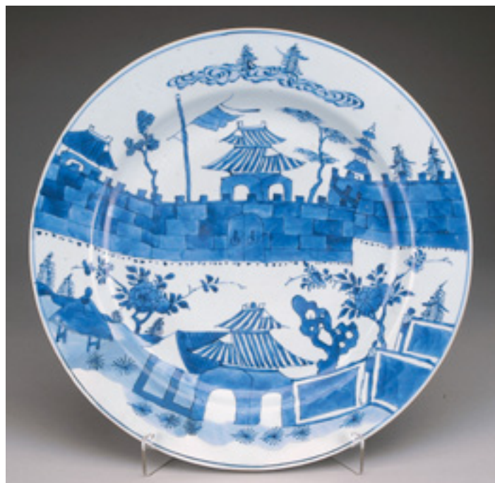
508 PRATO DE GRANDES DIMENSÕES, porcelana da China, decoração a azul "paisagem com muralha oriental", reinado Qianlong, séc. XVIII, restaurado Dim. - 39 cm € 400 - 600