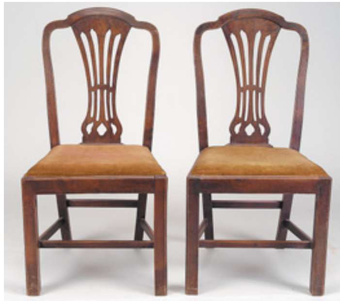
570 PAR DE CADEIRAS , estilo pombalino, nogueira, assentos estofados a veludo verde, portuguesas, séc. XIX, faltas e defeitos Dim. - 100 x 49 x 50 cm € 1.000 - 1.500