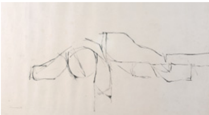
525 DOURDIL - NASC. 1914, "FIGURA DEITADA", desenho a lápis sobre papel, assinado e datado de 1979 Dim. - 69 x 100 cm