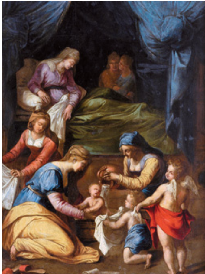
450 "O BANHO DO MENINO", óleo sobre cobre, escola portuguesa, séc. XVII/XVIII Dim. - 43 x 32 cm