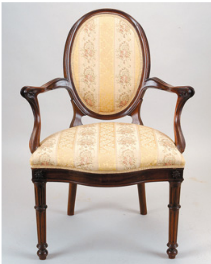
287 FAUTEUIL, estilo D. José, madeira exótica, assento e costas estofados, português, séc. XIX, pequenos defeitos Dim. - 98,5 x 71 x 55 cm € 600 - 900