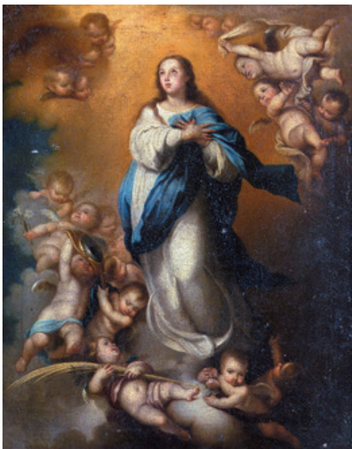
437 "NOSSA SENHORA DA CONCEIÇÃO", óleo sobre tela, escola espanhola, séc. XVIII/XIX, reentelado e restaurado Dim. - 41 x 33 cm