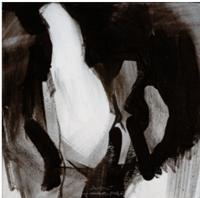
529 FERNANDO GASPAR - NASC. 1966, "MOMENTO # 3", acrílico sobre tela, assinado e datado de 2005 Dim. - 20 x 20 cm