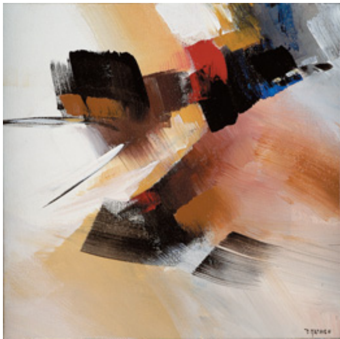
530 PAUL MATHIEU - NASC. 1953, "THE NEW TWENTIES I", acrílico sobre tela, assinado e datado de 2005 Dim. - 20 x 20 cm