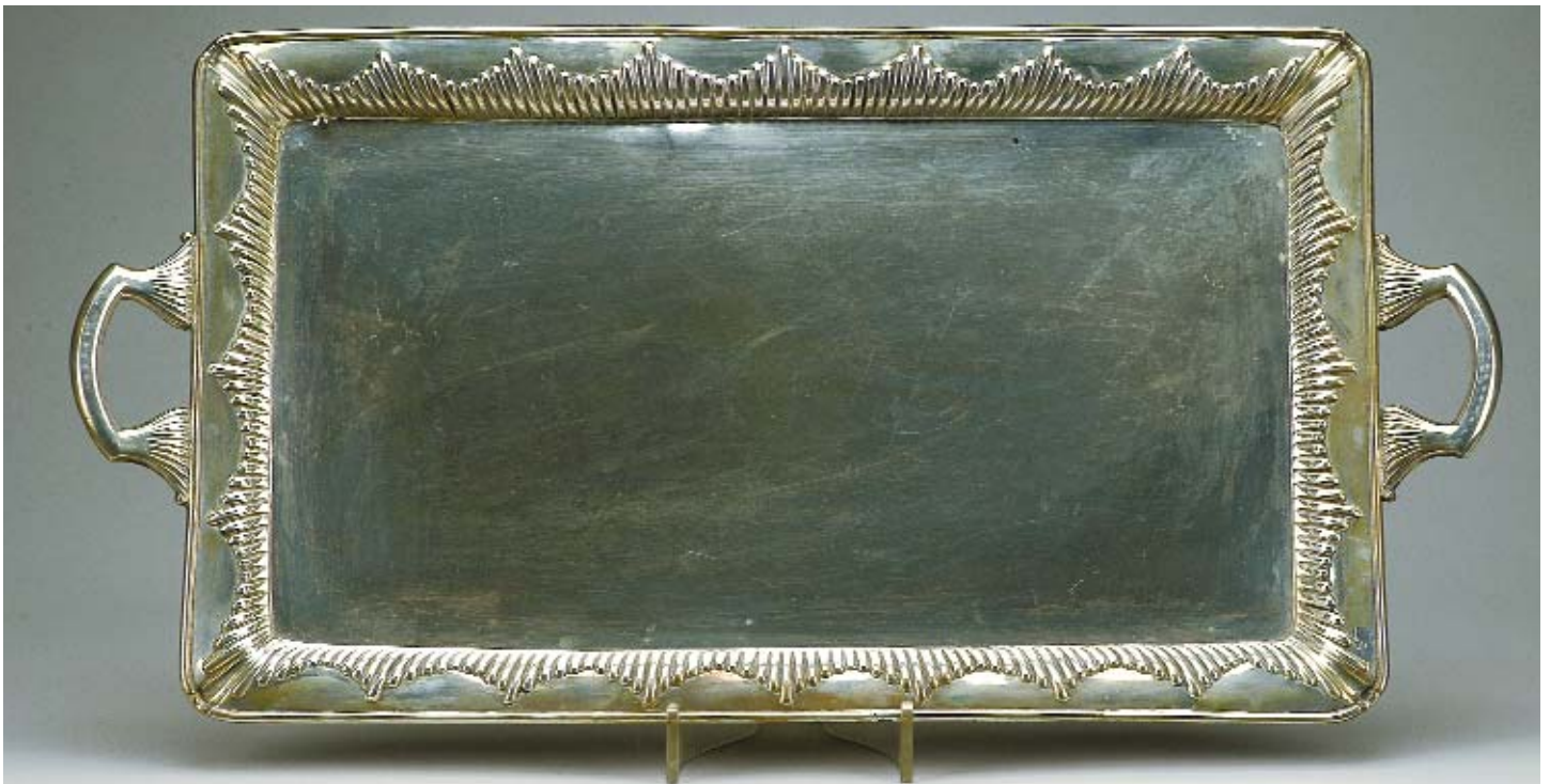
1104 BANDEJA EM PRATA PORTUGUESA, séc. XIX/XX,

contraste Javali do Porto (1887-1937) (Vidal - 73)