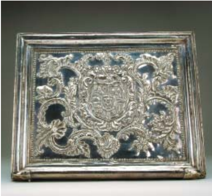
III5 ESTANTE DE MISSAL EM MADEIRA REVESTIDA A FOLHA DE PRATA RELEVADA E BRASONADA, colonial espanhola (?), séc. XVII/XVIII, sem marcas, pequenas faltas e defeitos Dim. - 30 x 38 x 7 cm € 2.000 - 3.000