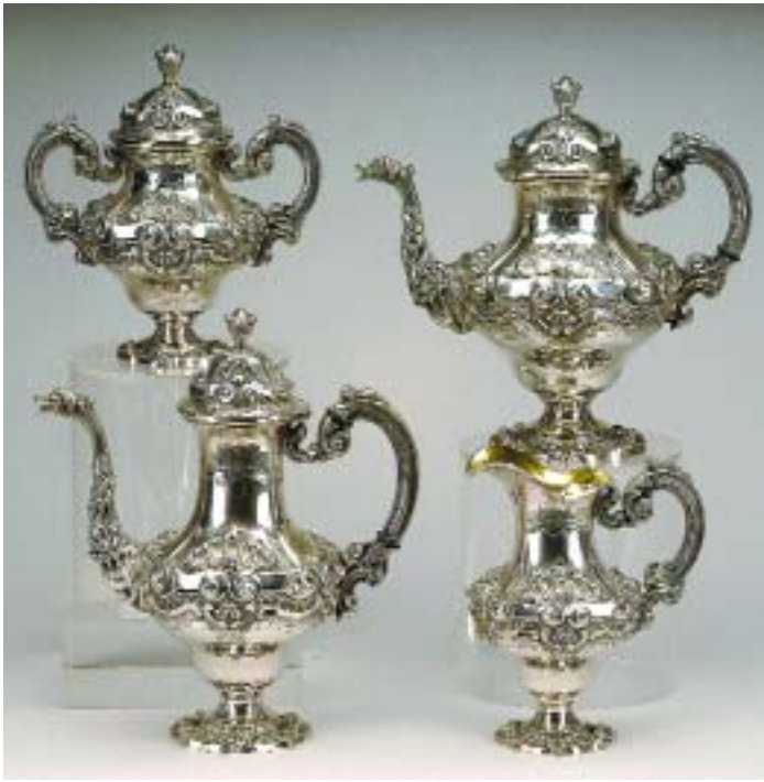
1103 SERVIÇO DE CHÁ E DE CAFÉ ESTILO D. JOÃO V EM PRATA PORTUGUESA, composto por bule, cafeteira, açucareiro e leiteira, séc. XX, contraste Águia do Porto (1938-1984) (Vidal - 49) Dim. - 28 cm; Peso - 3,490 grs. € 1.750 - 2.500