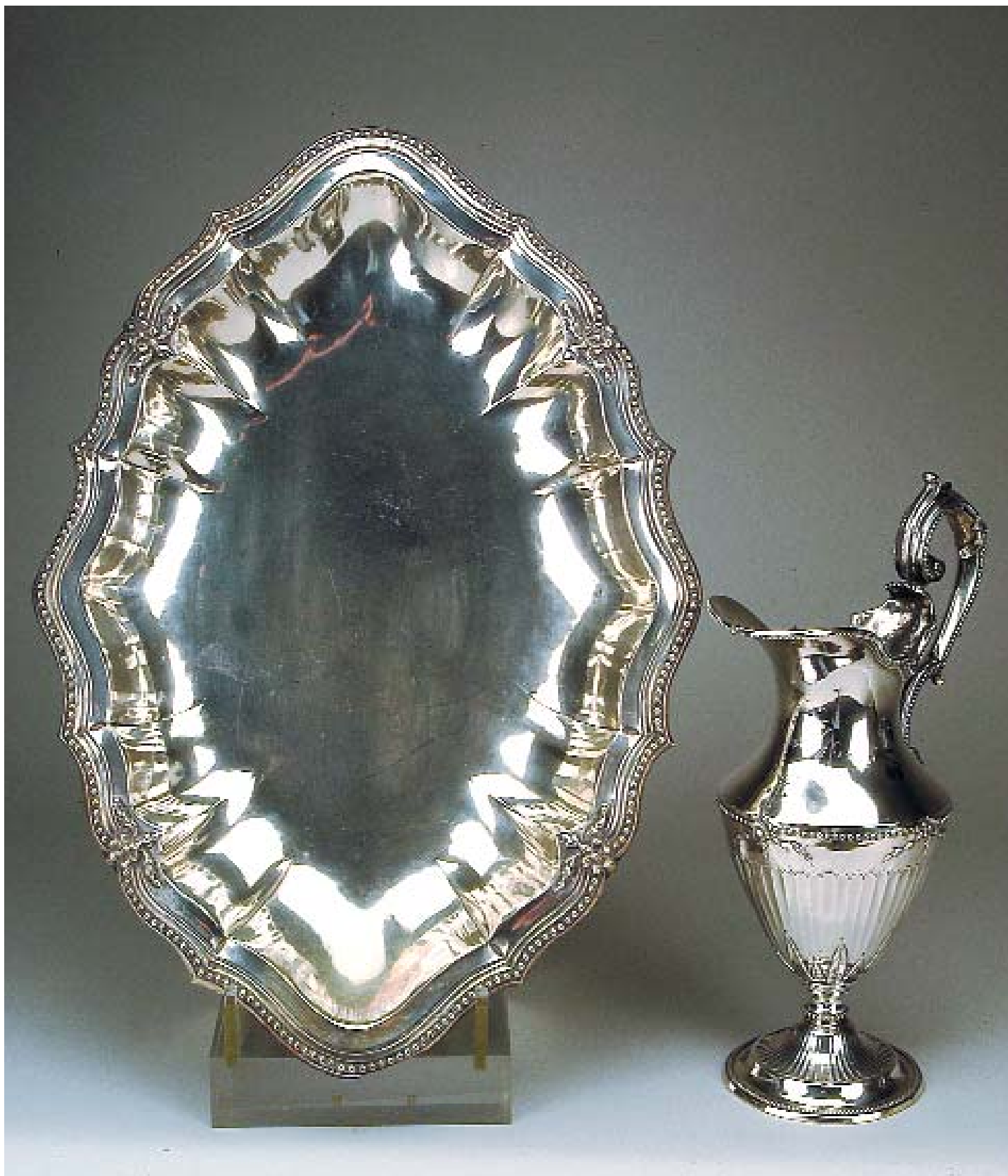
1093 LAVANDA E GOMIL D. MARIA EM PRATA PORTUGUESA, séc. XVIII/XIX, contraste do Porto (1790-1804), marca de ourives atribuível a