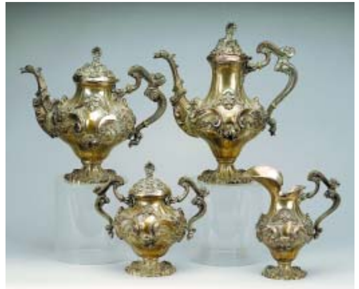
1105 SERVIÇO DE CHÁ E DE CAFÉ ESTILO D. JOÃO V EM PRATA PORTUGUESA, composto por bule, cafeteira, açucareiro e leiteira, séc. XX, contraste Águia do Porto (1938-1984) (Vidal - 49), tampa da cafeteira solta e amolgada Dim. - 33 cm; Peso - 5.101 grs. € 1.800 - 2.500