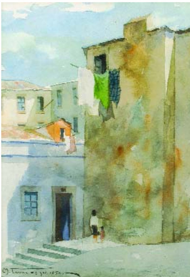
760 MANUEL TAVARES JUNIOR - SÉC. XX "Trecho de Lisboa", aguarela sobre papel, assinada e datada de 1956 Dim. - 26,5 x 19 cm