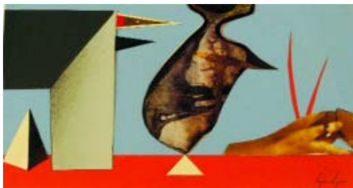
769 CRUZEIRO SEIXAS - NASC. 1920 "Abstracto", colagem sobre papel, assinada Dim. - 25 x 14 cm