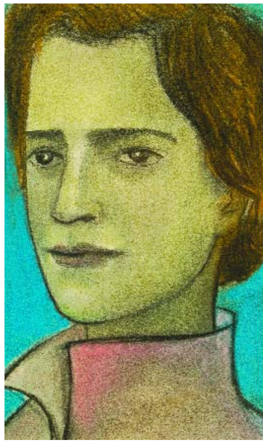
762 MARTINS CORREIA - 1910-19?? "Retrato", técnica mista sobre papel, assinado e datado de 1955 Dim. - 33 x 20 cm