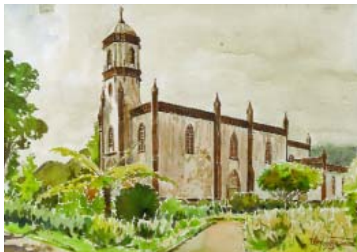
763 VITOR CÂMARA - NASC. 1921 "Igreja em São Miguel - Açores", aguarela sobre papel, assinada e datada de 1950, manchas de humidade Dim. - 29 x 42 cm