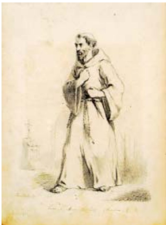
789 MANUEL DE MACEDO - 1839-1915 "Vasco" (personagem do "Monge de Cister", de Alexandre Herculano), desenho a lápis sobre papel, assinado e datado de 1858; Dim. - 28 x 20,5 cm € 300 - 450