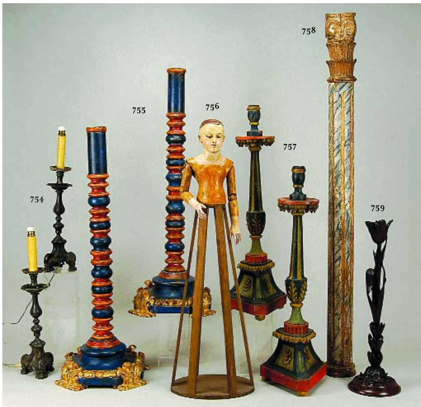
754 PAR DE TOCHEIROS D. JOSÉ EM ESTANHO, portugueses, séc. XVIII electrificados, com quebra-luz Dim. - 75 cm (total) € 800 - 1.200