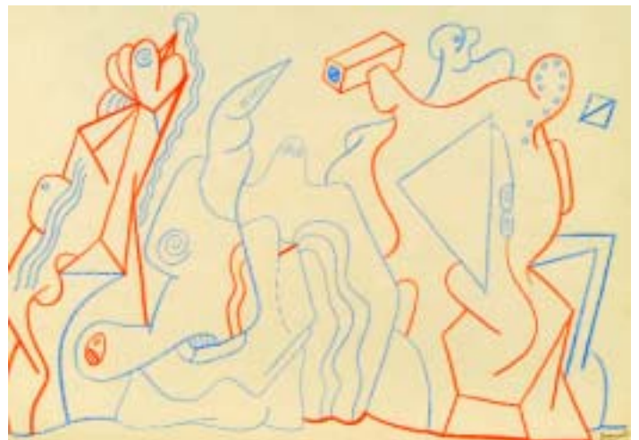
807 GONÇALO DUARTE - NASC. 1935 "Surrealista", desenho a lápis de cor, assinado e datado de 1970 Dim. - 21 x 30 cm