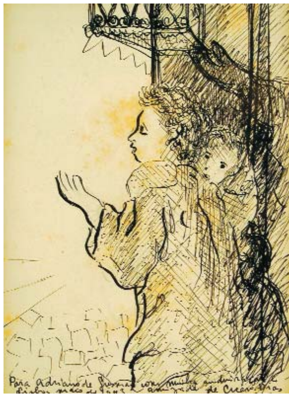
790 CÍCERO DIAS - SÉC. XX "Duas figuras", desenho a tinta da China, assinado, dedicado e datado de 1943; Dim. - 13 x 10,5 cm € 800 - 1.200