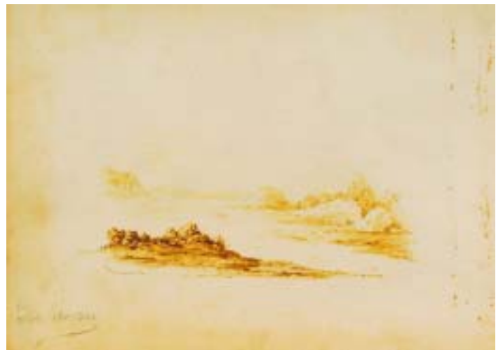
767 TOMÁS DA ANUNCIÇÃO - 1818-1879 "Paisagem", desenho a sépia sobre papel, assinado e datado de Lisboa de Setembro de 1860 Dim. - 20 x 27,5 cm € 500 - 750