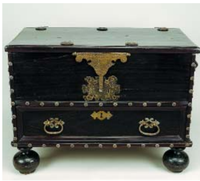
729 ARCA EM SICUPIRA E VINHÁTICO COM GAVETA, portuguesa, séc. XVII/XVIII, restaura, pequenos defeitos Dim. - 73 x 101 x 61 cm € 1.000 - 1.500