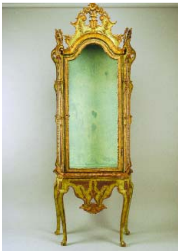
726 ORATÓRIO D. JOSÉ/D. MARIA EM MADEIRA ENTALHADA MARMOREADA E DOURADA, português, séc. XVIII, trempe posterior, restaura e pequenos defeitos Dim. - 240 x 88 x 41 cm € 1.000 - 1.500