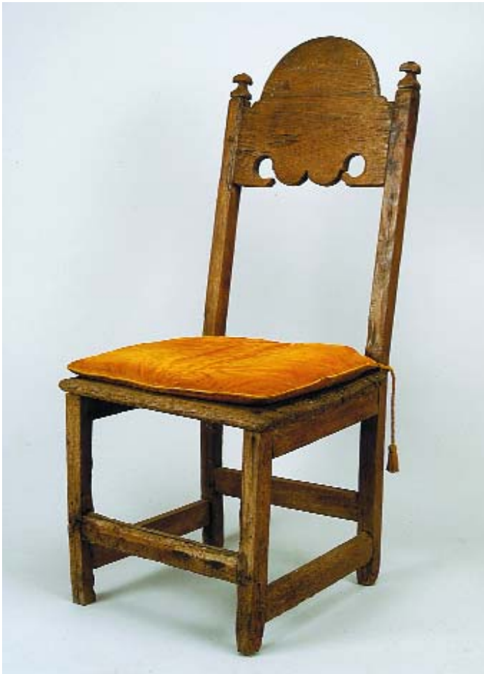
710 CADEIRA RÚSTICA EM CASTANHO, portuguesa, séc. XVII, faltas e defeitos