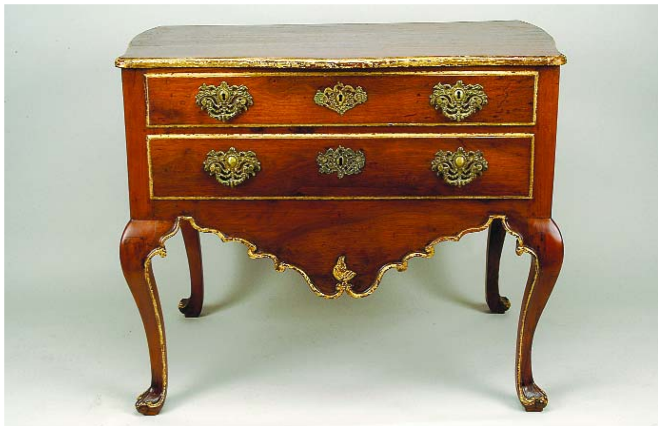
715 CÓMODA D. JOSÉ DE PERNAS ALTAS EM NOGUEIRA COM DOURADOS, tampo em vinhático, portuguesa, séc. XVIII, restauros e dourados não originais Dim. - 81,5 x 102 x 69 cm € 2.500 - 3.750