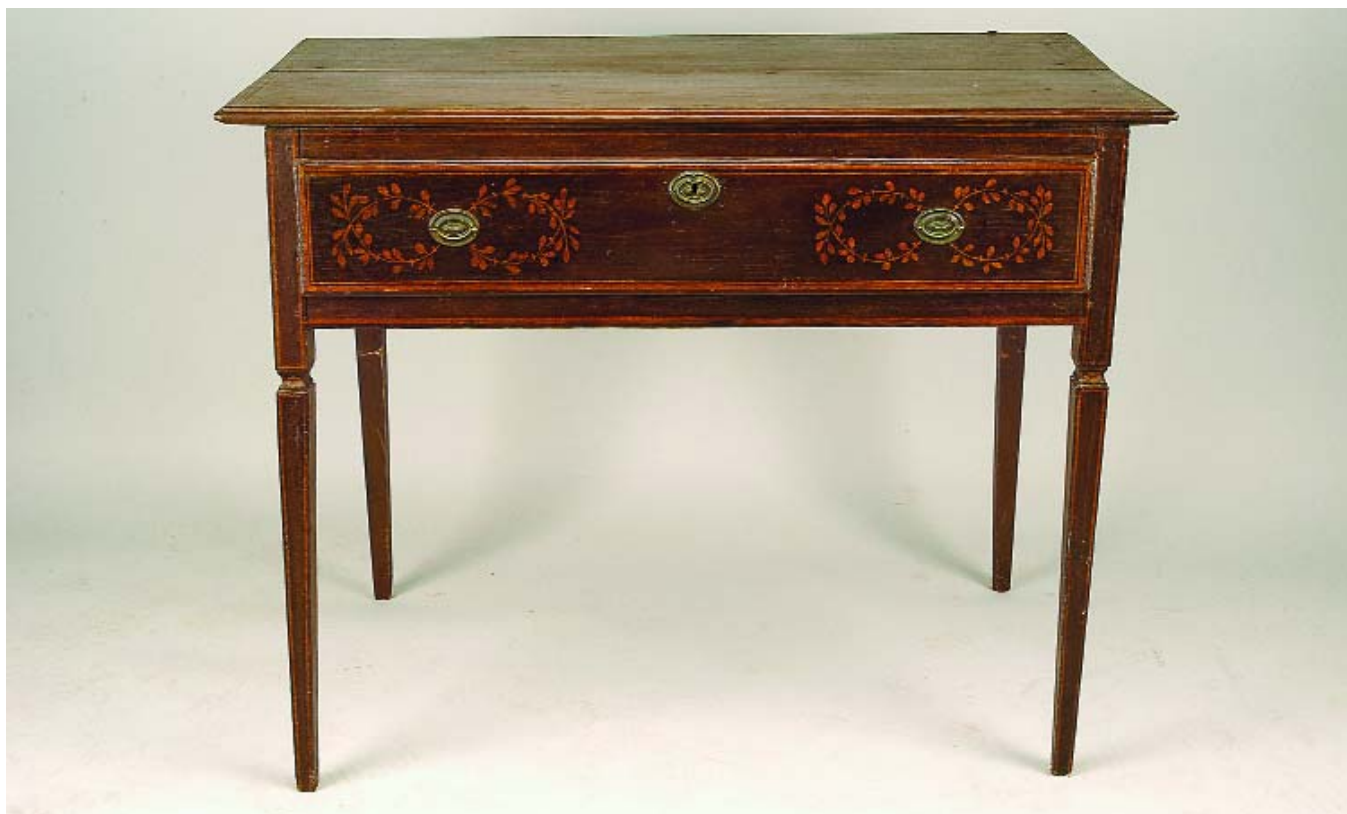
714 MESA DE ENCOSTAR D. MARIA EM CASQUINHA PINTADA "FLORES", portuguesa, séc. XVIII, faltas e defeitos Dim. - 88 x 110,5 x 60 cm