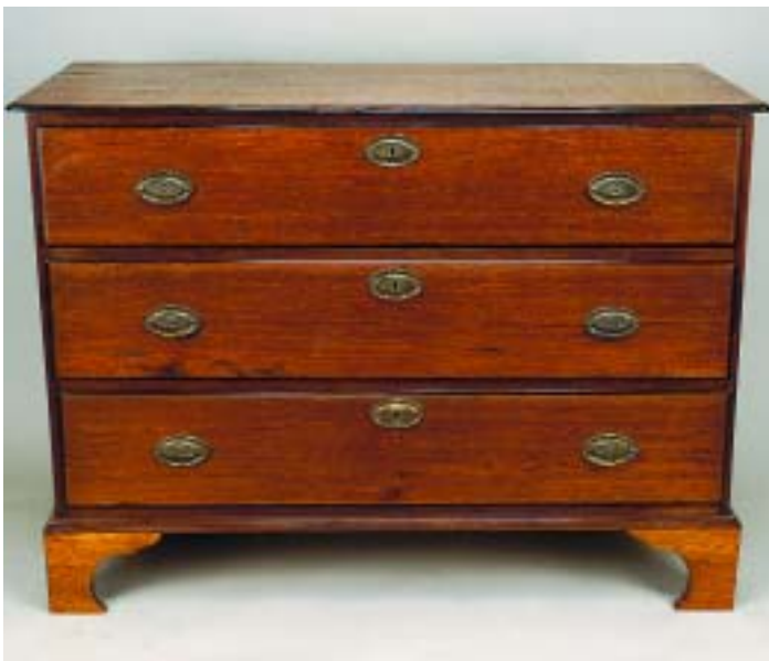
731 CÓMODA D. MARIA EM VINHÁTICO, portuguesa, séc. XVIII/XIX, pequenos restauros Dim. - 88 x 120,5 x 55 cm € 1.500 - 2.250