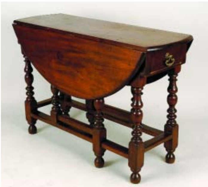
717 MESA DE CANCELA EM VINHÁTICO COM ABAS REDONDAS, portuguesa, séc. XVIII/XIX, pequenos defeitos Dim. - 76,5 x 112 x 42,5 cm € 800 - 1.200