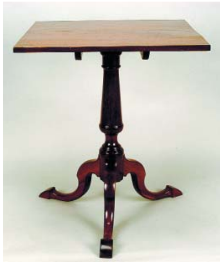
732 MESA DE PÉ DE GALO D. JOSÉ/D. MARIA EM MURTA, tampo quadrado basculante, portuguesa, séc. XVIII Dim. - 78,5 x 67,5 x 66 cm € 1.500 - 2.250