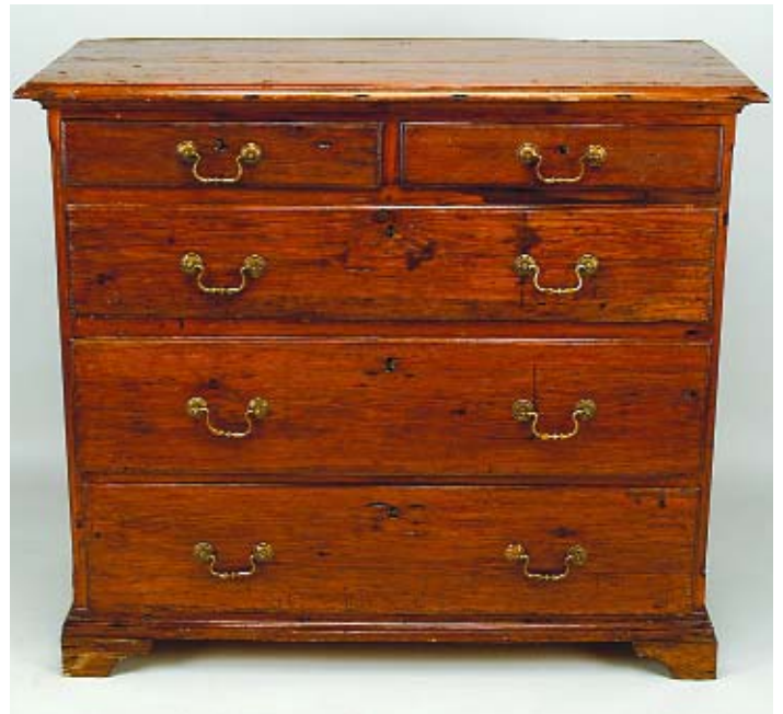
733 CÓMODA ESTILO D. MARIA EM CASQUINHA, portuguesa, séc. XIX, pequenas faltas e defeitos Dim. - 99 x 111 x 48 cm € 500 - 750