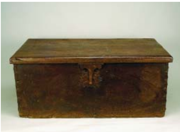
711 ARCA DE GRANDES DIMENSÕES EM SICUPIRA, ferragens em ferro, portuguesa, séc. XVII, faltas e defeitos