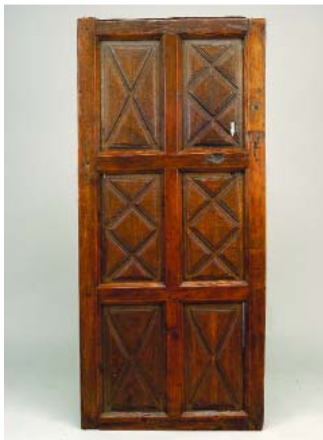
728 PORTA EM CASQUINHA E CARVALHO, portuguesa, séc. XVII, faltas e defeitos Dim. - 124 x 55 cm € 200 - 300