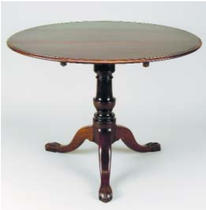
730 MESA DE PÉ DE GALO EM MOGNO E OUTRAS MADEIRAS, tampo redondo basculante, portuguesa, séc. XVIII/XIX, restauros, pequenos defeitos Dim. - 73 x 98,5 cm € 1.000 - 1.500