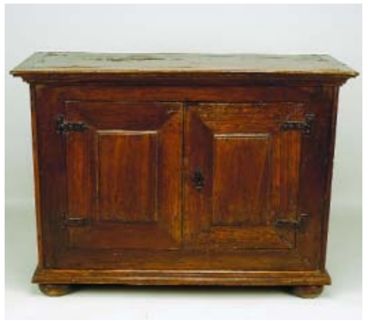
719 ARMÁRIO RÚSTICO EM CASTANHO, português, séc. XVII/XVIII, restauros, faltas e defeitos Dim. - 83 x 112 x 47 cm € 500 - 750