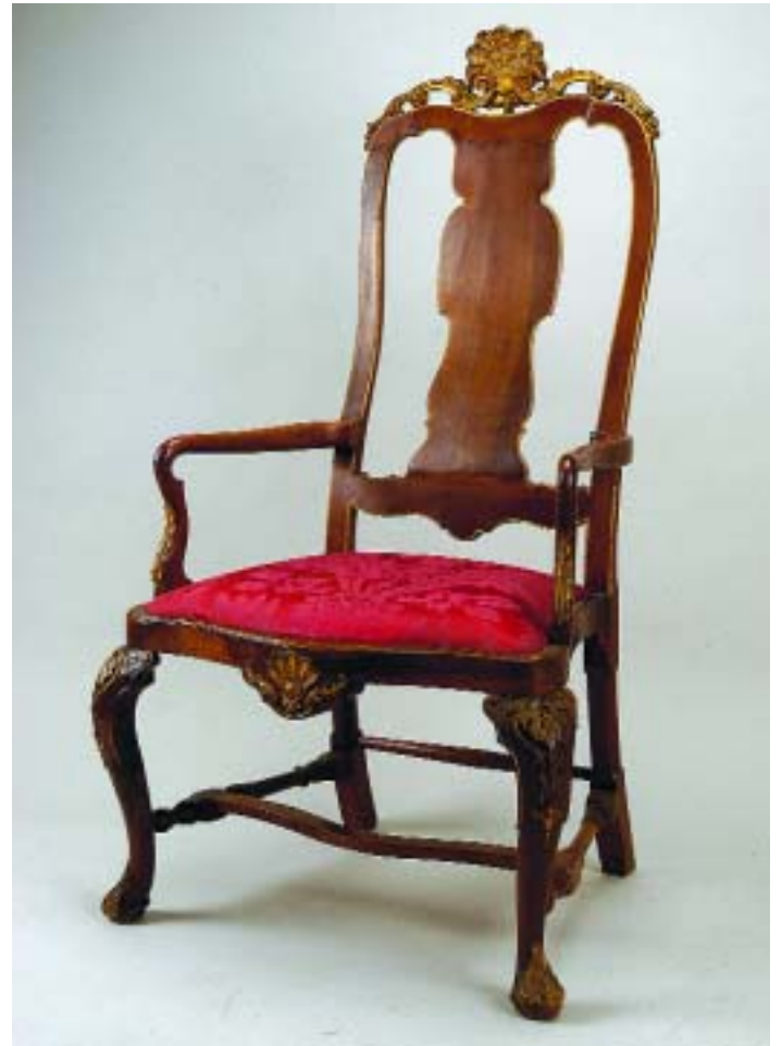
712 CADEIRÃO DE BRAÇOS D. JOSÉ EM NOGUEIRA COM ENTALHAMENTOS DOURADOS, assento estofado a damasco português, séc. XVIII, restauros, pequenos defeitos