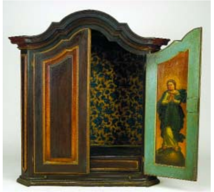
718 ORATÓRIO D. MARIA EM MADEIRA PINTADA, interior das portas com pinturas "Nossa Senhora" e "Pietà", português, séc. XVIII/XIX, restauros, faltas e defeitos Dim. - 112 x 100 x 35 cm € 800 - 1.200