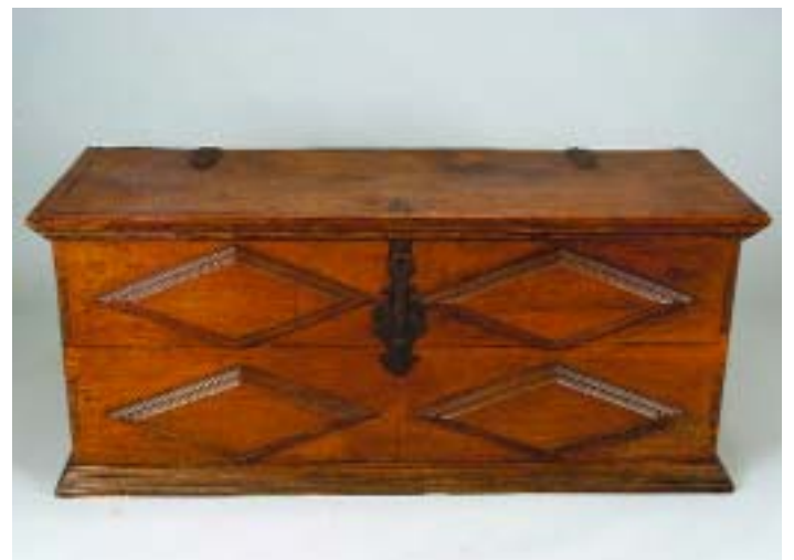
713 ARCA EM VINHÁTICO COM LOSANGOS, ferragens em ferro, portuguesa, séc. XIX, pequenos defeitos