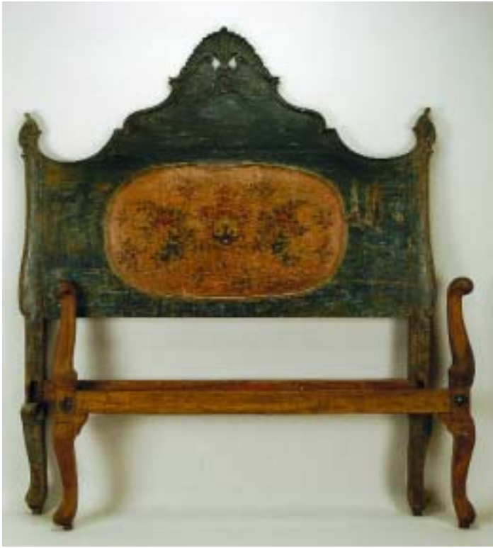
716 CAMA D. JOSÉ/D. MARIA EM MADEIRA ENTALHADA E PINTADA reserva policromada com armas dos Carmelitas, portuguesa, séc. XVIII, faltas e defeitos Dim. - 163 x 210 x 137 cm € 1.000 - 1.500