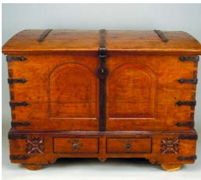
727 ARCA EM TECA COM PRECINTAS EM FERRO, Damão, séc. XVIII/XIX, pequenos defeitos Dim. - 92 x 129 x 76 cm € 2.500 - 3.750