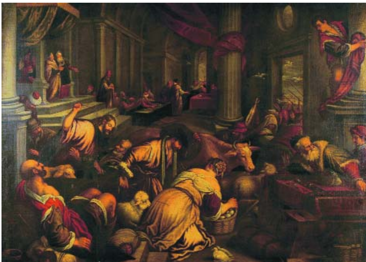
561 "CRISTO EXPULSANDO OS VENDILHÕES DO TEMPLO", óleo sobre tela, escola italiana, séc. XVIII/XIX, restauros e pequenos defeitos; Dim. - 100 x 135,5 cm € 3.000 - 4.500