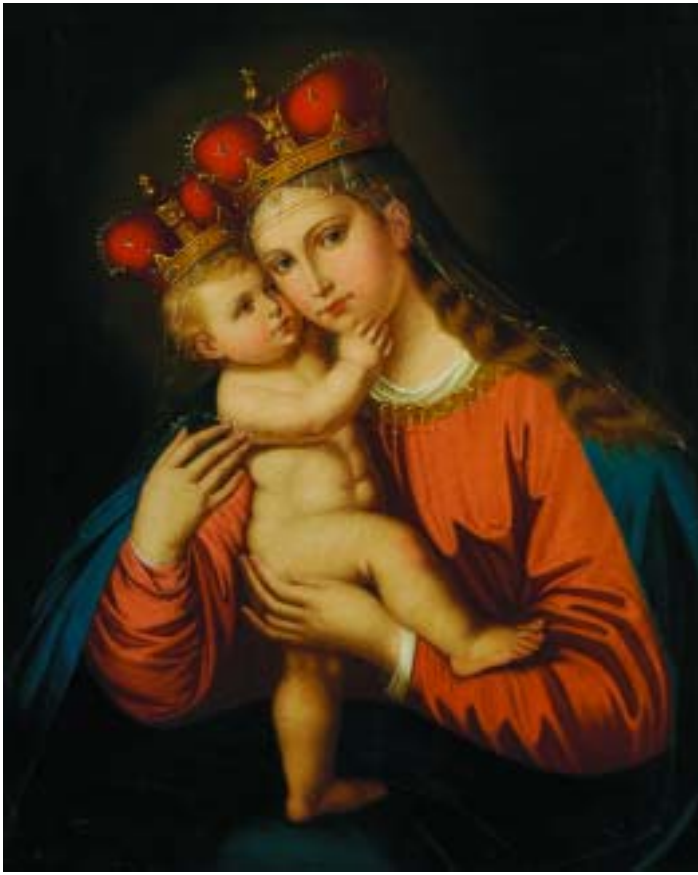
562 "NOSSA SENHORA COM O MENINO COROADOS", óleo sobre tela, Europa Central, séc. XIX, pequenos restauros Dim. - 69 x 56 cm € 1.000 - 1.500