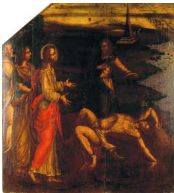
558 "CENA BÍBLICA", óleo sobre castanho, escola portuguesa, séc. XVII, faltas e defeitos Dim. - 104 x 95 cm