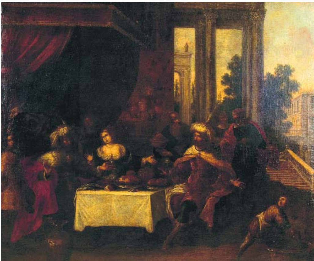
560 "CENA BÍBLICA - FIGURAS À MESA", óleo sobre tela, escola italiana, séc. XVII/XVIII, restauros e pequenos defeitos; Dim. - 89,5x105,5 cm € 2.500 - 3.750