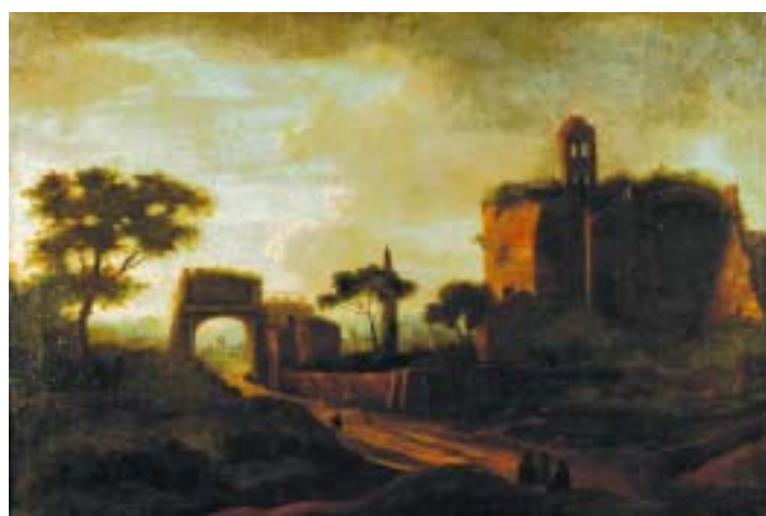
559 "PAISAGEM COM FIGURAS PERTO DE RUÍNAS", óleo sobre tela, escola italiana, séc. XVII/XVIII, reentelado e restaurado Dim. - 62,5 x 92,5 cm