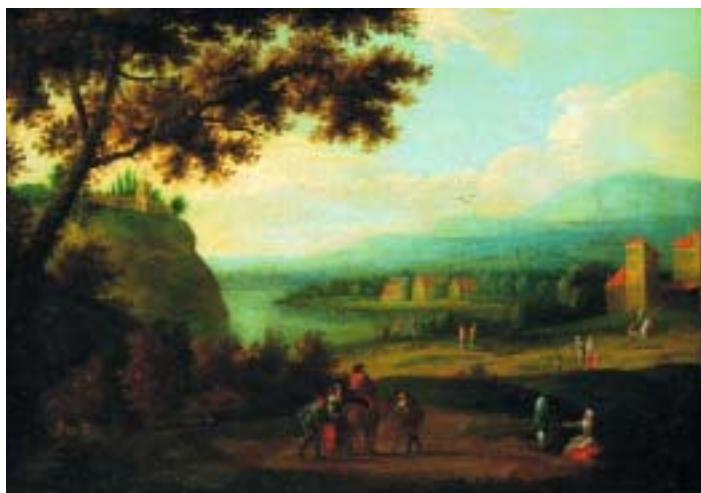
557 "PAISAGEM COM FIGURAS E CASA", óleo sobre tela, escola flamenga, séc. XVIII/XIX, reentelado e pequenos restauros Dim. - 40,5 x 57,5 cm