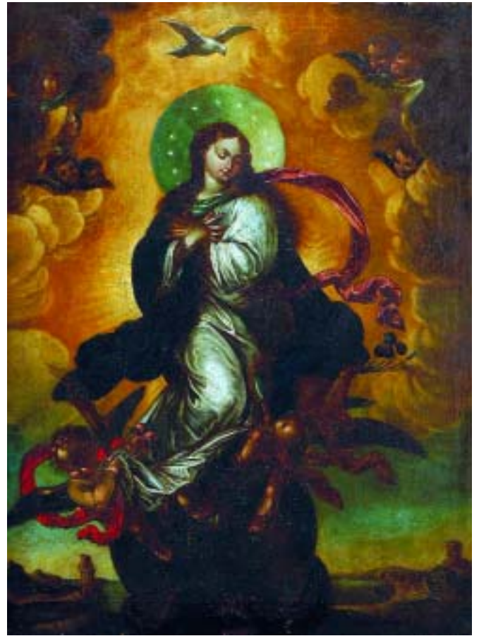
564 "NOSSA SENHORA DA CONCEIÇÃO", óleo sobre tela, escola espanhola, séc. XVIII, reentelado e pequenos restauros Dim. - 79 x 59 cm € 1.000 - 1.500