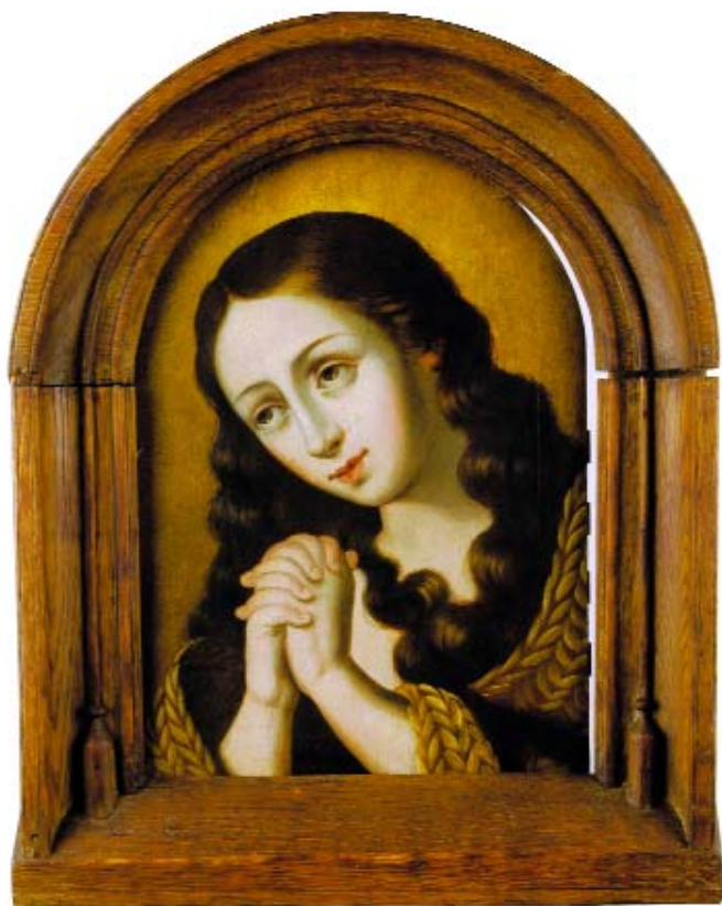
556 "SANTA MADALENA", óleo sobre madeira, séc. XVII, lacre brasonado no verso, pequenos restauros Dim. - 41 x 29,5 cm