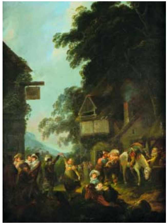
414 "CENA DE ALDEIA COM FIGURAS", óleo sobre cobre, escola holandesa, séc. XVIII, pequenas faltas Dim. - 63 x 47 cm