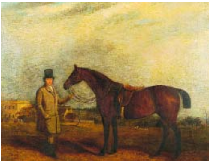
425 "SENHOR COM CAVALO", óleo sobre tela, escola inglesa, séc. XIX, restauros e pequenos defeitos Dim. - 66 x 85 cm € 1.000 - 1.500