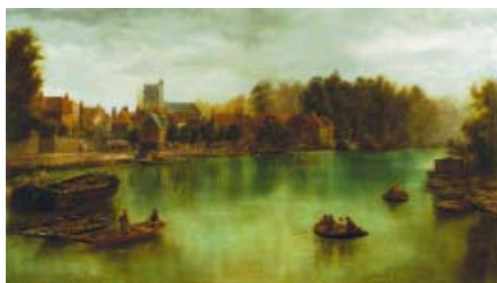
419 "PAISAGEM COM RIO E FIGURAS", óleo sobre tela, escola inglesa, séc. XIX, reentelado e restaurado Dim. - 60,5 x 106,5 cm