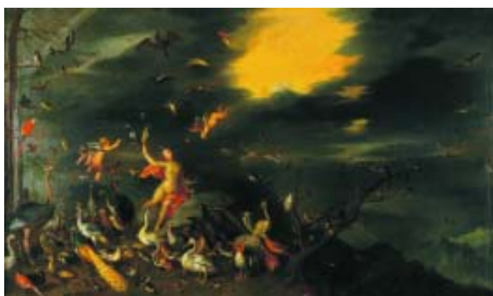
417 "CENA ALEGÓRICA COM FIGURA FEMININA E ANIMAIS", óleo sobre tela, escola holandesa, séc. XVIII, reentelado e restaurado Dim. - 55,5 x 92 cm