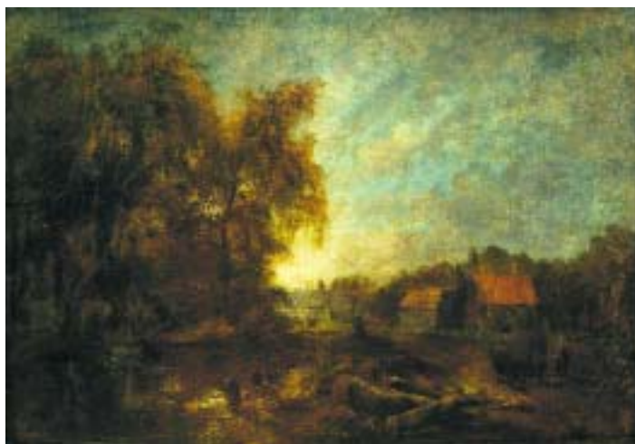
421 "PAISAGEM NOCTURNA", óleo sobre tela, escola inglesa, séc. XIX, reentelado e restaurado Dim. - 47,5 x 69 cm € 1.400 - 2.000