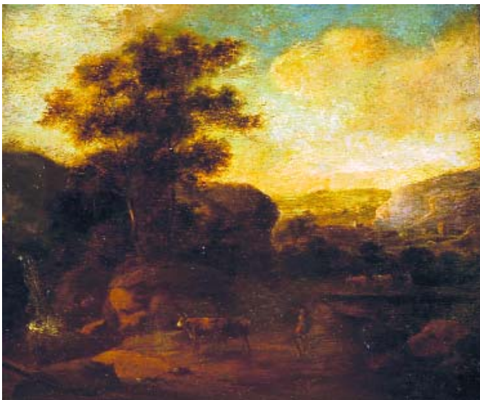
413 "PAISAGEM COM CAMPONESES E GADO", óleo sobre madeira, escola flamenga, séc. XVIII Dim. - 27,5 x 32,5 cm