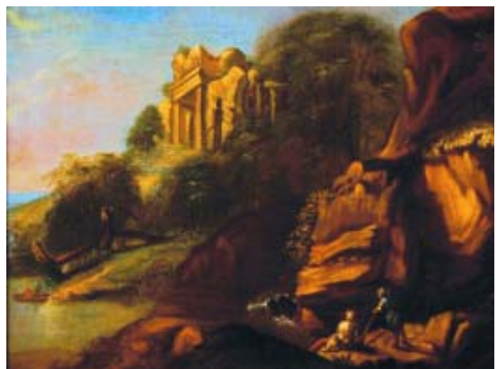
427 "PAISAGEM COM RUÍNAS E FIGURAS", óleo sobre tela, séc. XVIII/XIX, reentelado e restaurado Dim. - 45,5 x 59 cm € 1.500 - 2.250