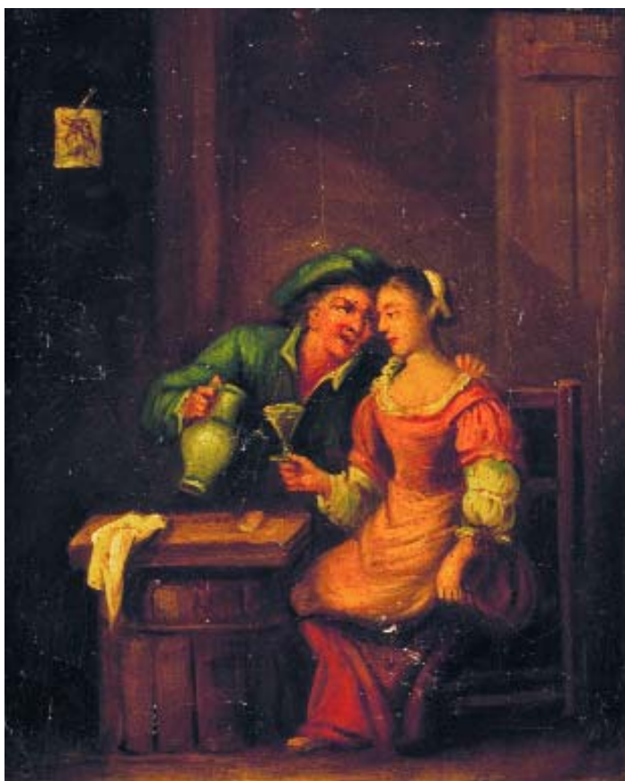
416 "CENA DE TABERNA - CASAL À MESA", óleo sobre tela, escola holandesa, séc. XIX, defeitos Dim. - 27 x 22 cm