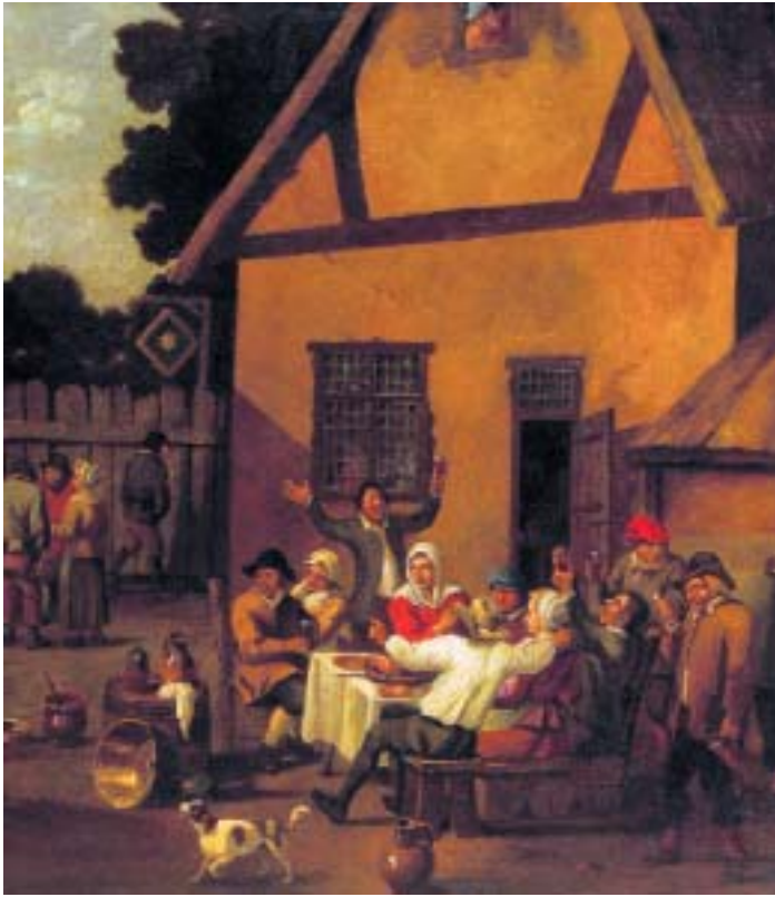
412 "FESTA NA ALDEIA", óleo sobre tela, escola holandesa, séc. XVII, reentelado e com restauros Dim. - 75 x 67 cm