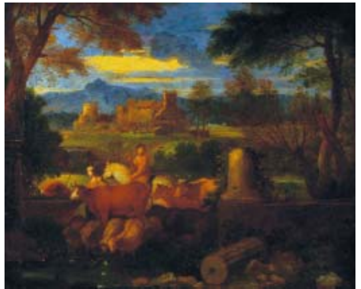
426 "PAISAGEM COM PASTORES E GADO PERTO DE RUÍNAS", óleo sobre tela, escola italiana, séc. XVIII/XIX, reentelado e pequenos restauros Dim. - 37 x 45,5 cm € 800 - 1.200