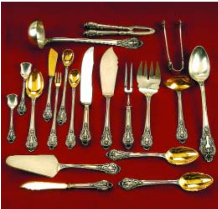
I233 FAQUEIRO PARA DOZE PESSOAS ESTILO D. JOÃO V EM PRATA PORTUGUESA , composto por vinte talheres de servir, colheres de sopa, talheres de carne, talheres de peixe, talheres de sobremesa, garfos de bolo, colheres de chá e colheres de café, séc. XX, contraste Águia do Porto (1938-1984) (Vidal - 65); Peso bruto - 9.644 grs. € 3.000 - 4.500