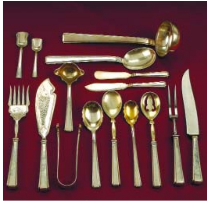
I234 FAQUEIRO PARA DOZE PESSOAS EM PRATA PORTUGUESA , composto por dezasseis talheres de servir, colheres de sopa, talheres de carne, talheres de peixe, talheres de sobremesa, colheres de chá e colheres de café, séc. XX, contraste Águia do Porto (1938-1984) (Vidal - 49 e 65) Peso bruto - 7.170 grs. € 3.000 - 4.500