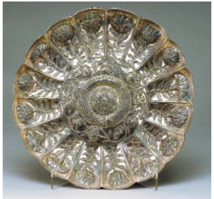
1079 SALVA GOMADA EM PRATA PORTUGUESA, séc. XVII/XVIII, contraste de Lisboa (1879-1881) (M. A. - L46), contraste posterior Dim. - 33,5 cm Peso - 605 grs. € 3.500 - 5.000