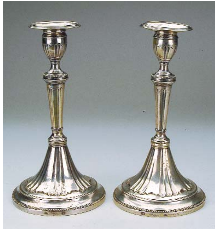
1078 PAR DE CASTIÇAIS D. MARIA EM PRATA PORTUGUESA, séc. XVIII, contraste do Porto (1784-1790), marca de ourives AIR (1784-1790) (M. A. - P15 e P134) Dim. - 19,5 cm Peso - 513 grs. € 1.500 - 2.250