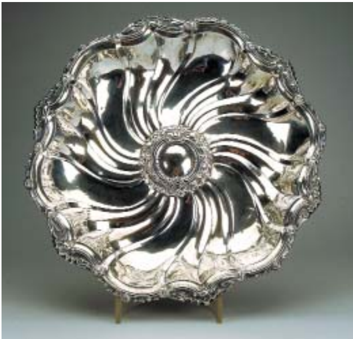
1077 SALVA D. JOSÉ EM PRATA PORTUGUESA, decoração gomada com espiral, séc. XVIII, contraste do Porto (1768-1784), marca de ourives GS (1768-1804) (M. A. - P13 e P-293) Dim. - 41,5 cm; Peso - 1.032 grs. € 2.500 - 3.750