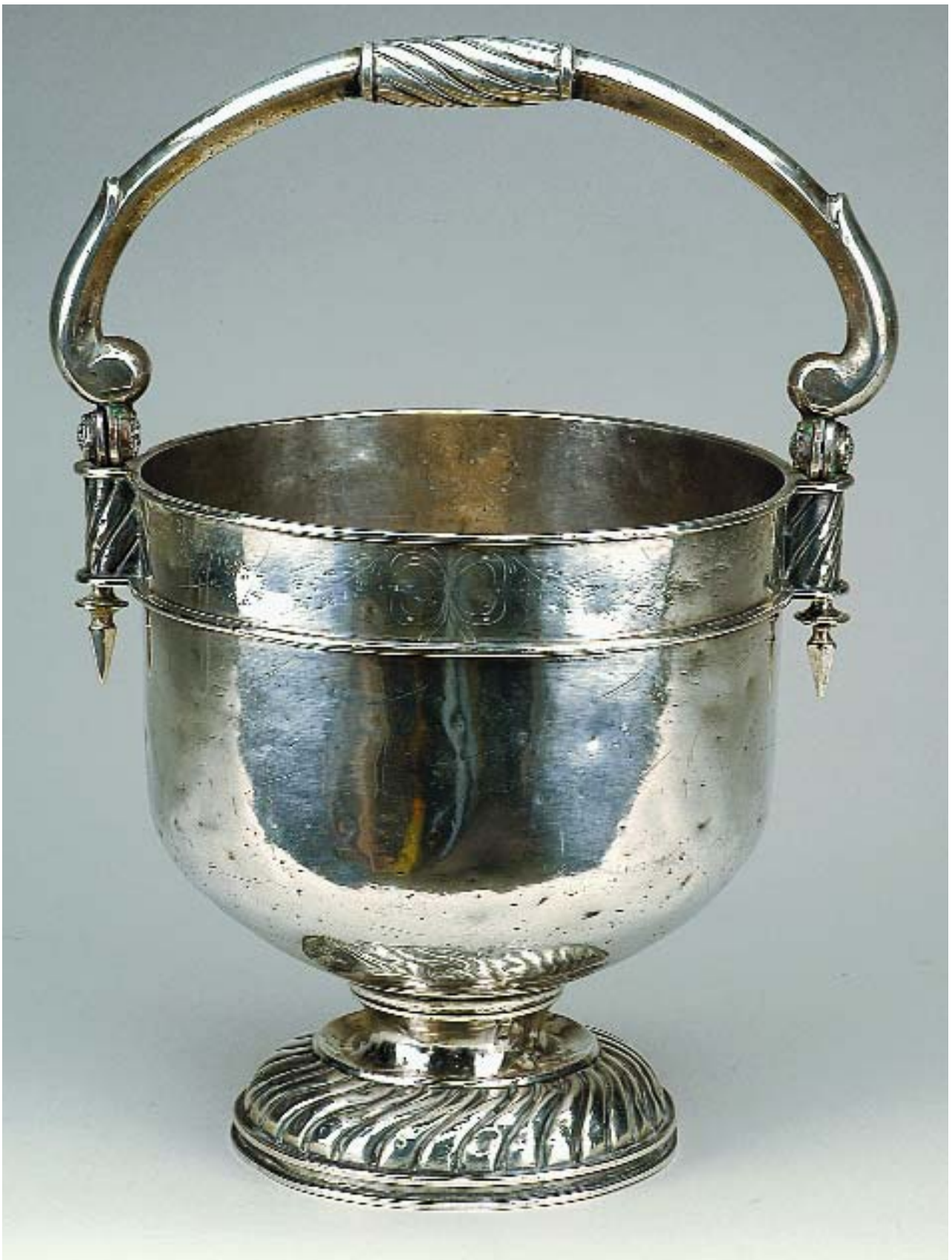
1083 CALDEIRA DE GRANDES DIMENSÕES EM PRATA PORTUGUESA,

séc. XVI, sem marcas, sem hissope, amolgadelas Dim. - 42,5 cm Peso - 3.466 grs.