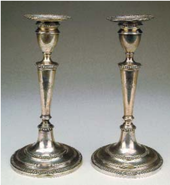
1084 PAR DE CASTIÇAIS D. MARIA EM PRATA PORTUGUESA, monogramados, séc. XIX, contraste de Lisboa (1810-1822), marca de ourives ilegível (M. A. - L36), arandela soldada Dim. - 18,5 cm Peso - 520 grs. € 1.700 - 2.500