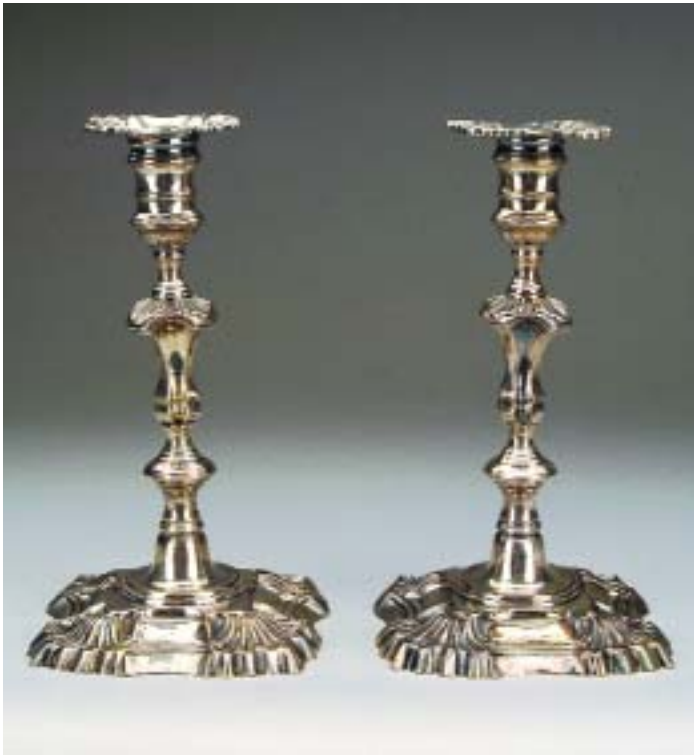
1076 PAR DE CASTIÇAIS D. JOSÉ EM PRATA PORTUGUESA, séc. XVIII, contraste do Porto (1784-1790), marca de ourives R (1758-1768) (M. A. - P11 e P518A) Dim. - 20 cm Peso - 983 grs. € 2.500 - 3.750