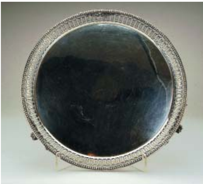
1085 SALVA DE GRADINHA D. MARIA COM TRÊS PÉS EM PRATA PORTUGUESA, séc. XVIII, contraste de Lisboa (1790-1795), marca de ourives ilegível (M. A. - L34) Dim. - 33 cm Peso - 1.251 grs. € 2.500 - 3.750