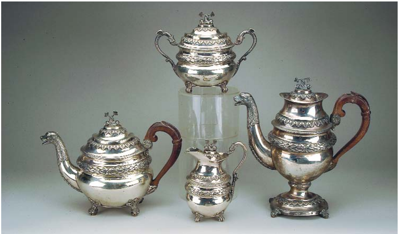
1081 SERVIÇO DE CHÁ E DE CAFÉ EM PRATA PORTUGUESA , composto por bule, cafeteira, açucareiro e leiteira, séc. XIX, contraste do Porto (1853), marca de ourives atribuível a