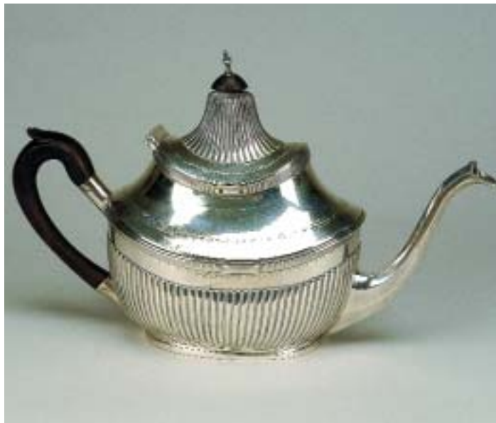
1092 BULE D. MARIA EM PRATA PORTUGUESA, séc. XVIII/XIX, contraste do Porto ilegível, marca de ourives IFG (1783-1836) (M. A. - P140), ligeira amolgadela no pináculo; Dim. - 20,5 cm Peso - 926 grs. € 2.500 - 3.750