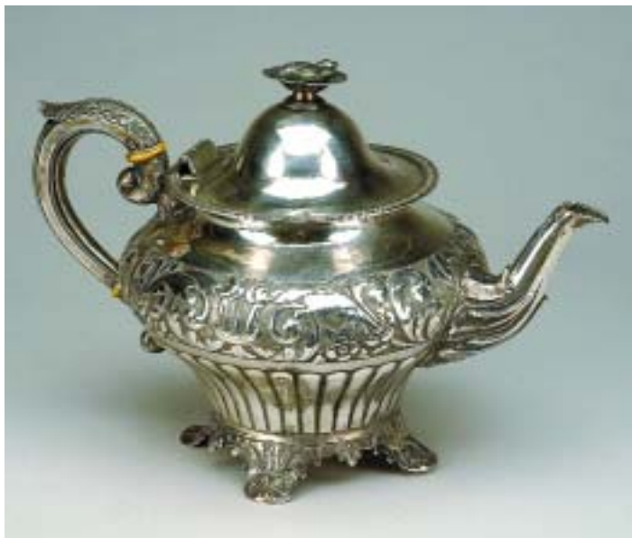
1090 BULE EM PRATA PORTUGUESA, séc. XIX, contraste do Porto (1853-1861), marca de ourives N&G (M. A. - P46) Dim. - 21 cm Peso - 1.138 grs. € 1.200 - 1.800