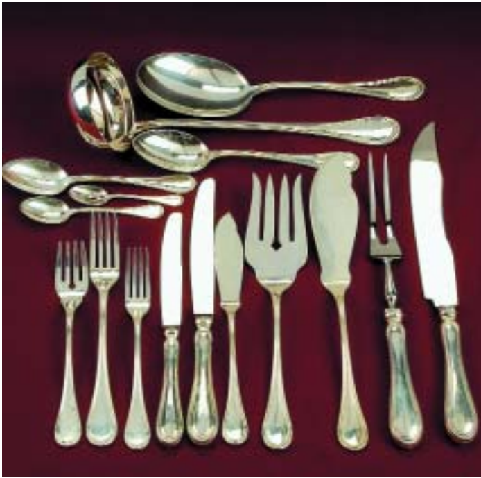
I232 FAQUEIRO PARA DOZE PESSOAS EM PRATA PORTUGUESA , composto por sete talheres de servir, colheres de sopa, talheres de carne, talheres de peixe, talheres de sobremesa, colheres de chá e colheres de café, séc. XX, contraste de Lisboa pós-1985 (Vidal - 4106), falta um garfo de peixe, garfo de sobremesa a mais; Peso bruto - 7.172 grs. € 2.000 - 3.000