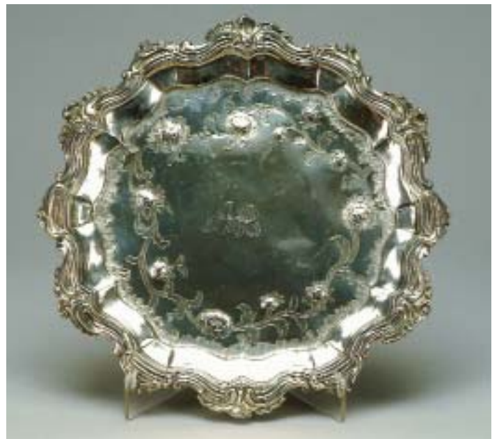
1087 SALVA D. JOSÉ EM PRATA PORTUGUESA, séc. XVIII, sem marcas, pés posteriores, pequeno defeito Dim. - 27 cm Peso - 445 grs. € 600 - 900