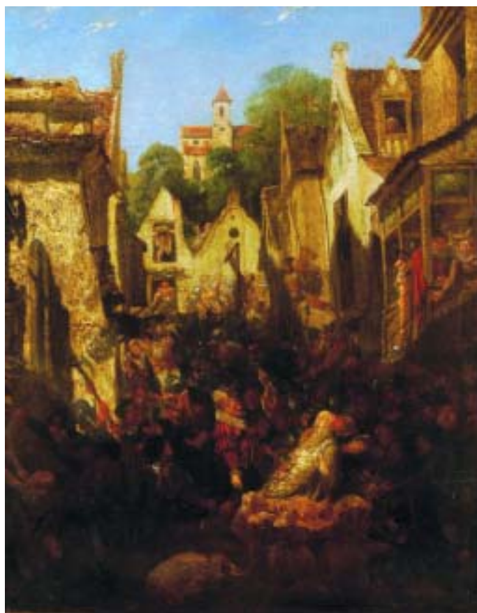
542 "CENA DE VILA COM PERSONAGENS", óleo sobre tela, escola flamenga, séc. XVIII/XIX, reentelado e restaurado Dim. - 102 x 81 cm