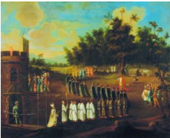
549 "PROCISSÃO SAINDO DO CASTELO", óleo sobre tela, séc. XVII/XVIII, reentelado e pequenos defeitos Dim. - 58,5 x 72,5 cm