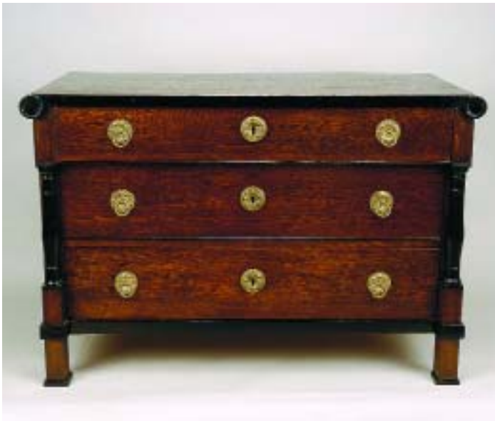
500 CÓMODA BIEDERMEIER EM CARVALHO, rolos, colunas e frisos a pintados a negro, Europa central, séc. XIX, pequenos defeitos Dim. - 84,5 x 124,5 x 63 cm