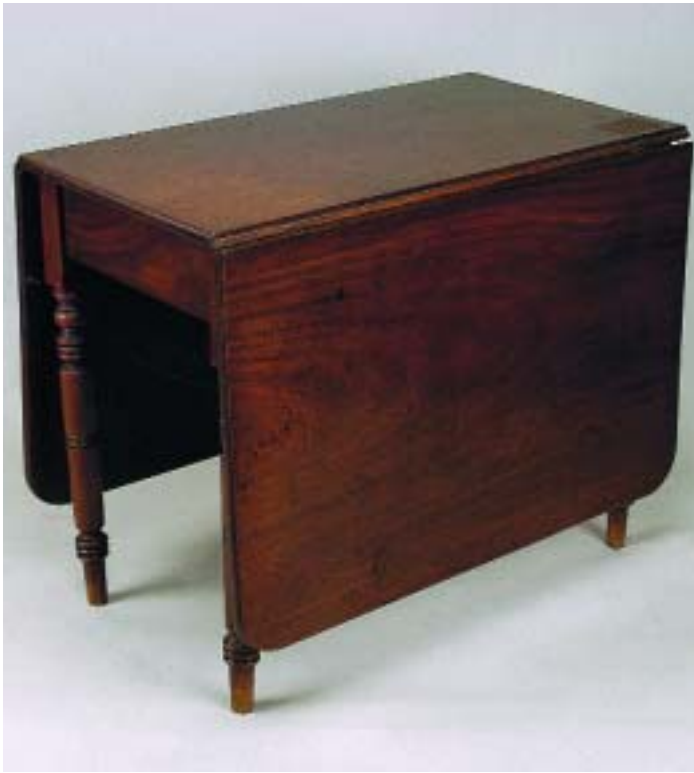
499 MESA DE ABAS VICTORIANA EM MOGNO, inglesa, séc. XIX, pequenos defeitos Dim. - 73 x 90 x 51 cm