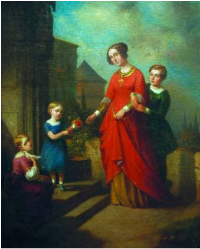
544 RUPERT BUNNY - 1864-1947 "Cena de família em terraço", óleo sobre tela, reentelado, pequenos defeitos - ver Benezit - vol. 2º, pág. 953 Dim. - 65 x 54 cm € 1.000 - 1.500