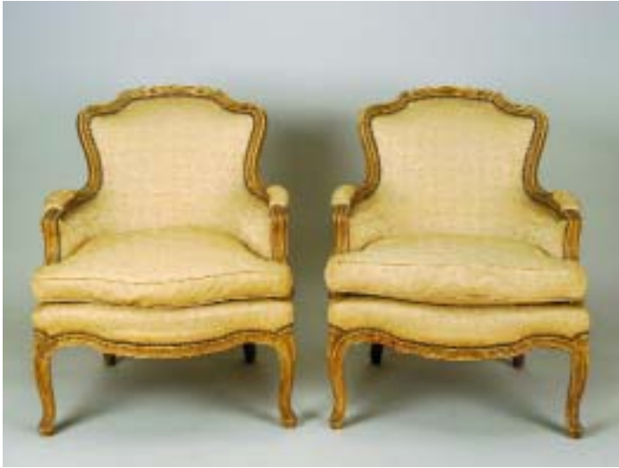
324 PAR DE BERGÈRES ESTILO LUÍS XV EM MADEIRA LACADA, estofadas a tecido, francesas, séc. XIX, faltas e defeitos Dim. - 80 x 66 x 65 cm € 600 - 900