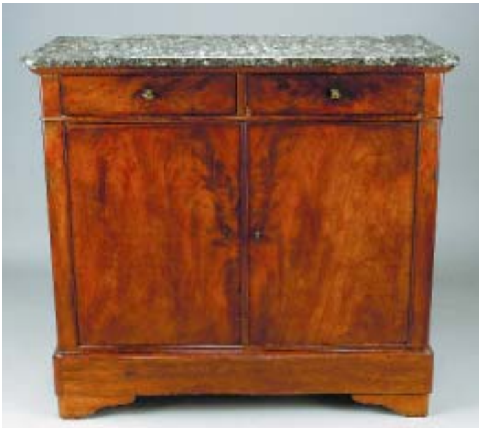
325 ARMÁRIO LUÍS FILIPE EM MOGNO E RAIZ DE MOGNO, tampo de mármore, francês, séc. XIX, pequenos defeitos Dim. - 100 x 114 x 55 cm € 800 - 1.200