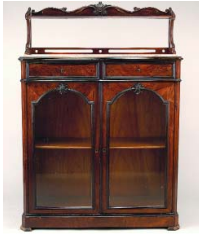
505 ARMÁRIO LIVREIRO ROMÂNTICO EM PAU SANTO COM PEQUENO ALÇADO,

tampo de mármore, séc. XIX, pequenos defeitos