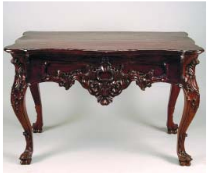
342 CREDÊNCIA ESTILO D. JOSÉ EM PAU SANTO COM ENTALHAMENTOS, brasileira, séc. XIX, faltas e pequenos defeitos Dim. - 76 x 138 x 51 cm