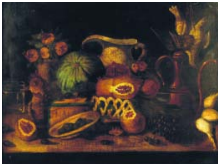
555 "NATUREZA MORTA - BODEGON" , óleo sobre tela, escola espanhola, séc. XIX, pequenas faltas e defeitos Dim. - 61,5 x 81 cm € 2.000 - 3.000