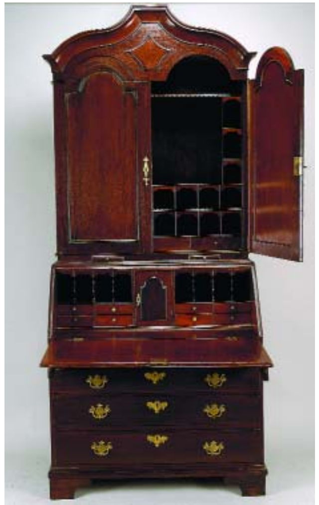
491 PAPELEIRA COM ALÇADO JORGE III EM MOGNO, interior do alçado com escaninhos, inglesa, séc. XVIII, restauros e pequenos defeitos; Dim. - 235 x 105 x 59 cm € 6.000 - 9.000