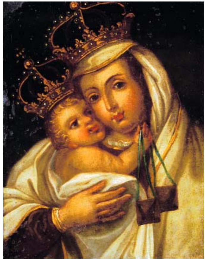
550 "NOSSA SENHORA DO CARMO", óleo sobre cobre, séc. XVIII, pequenas faltas e defeitos Dim. - 32,5 x 27 cm