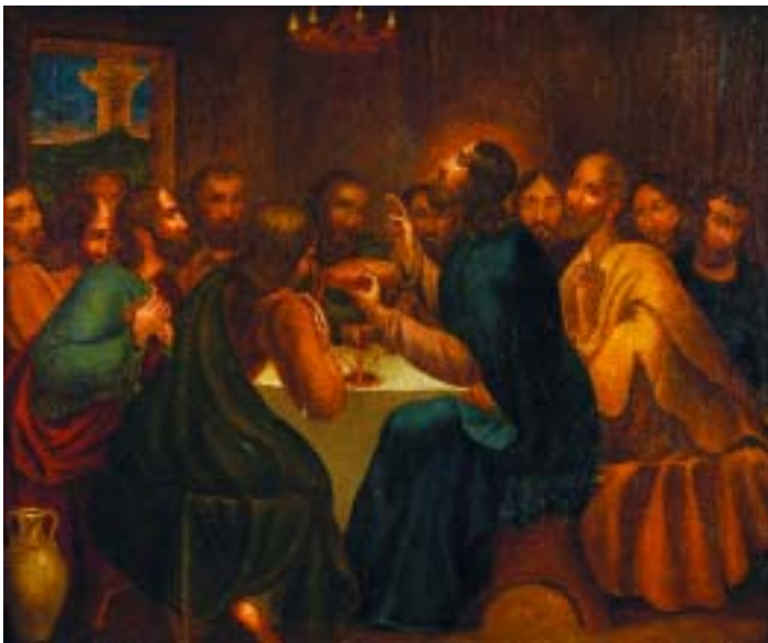
545 "ÚLTIMA CEIA", óleo sobre tela, escola portuguesa, séc. XVIII, pequenos restauros Dim. - 52,5 x 64,5 cm € 1.000 - 1.500