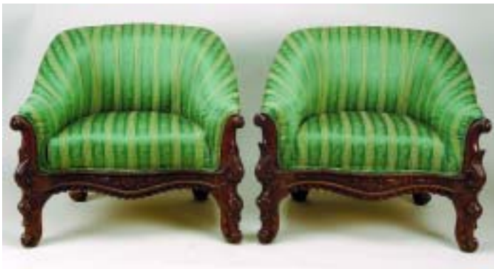
321 PAR DE CADEIRÕES ROMÂNTICOS EM MADEIRA EXÓTICA, estofados a tecido verde, séc. XIX/XX, pequenos defeitos Dim. - 83 x 90 x 72 cm