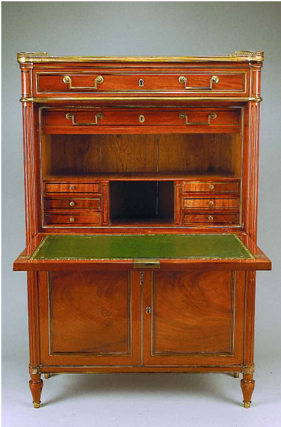
493 SECRETÁRIA "à ABATTANT" LUÍS XVI EM MOGNO , filetes e aplicações em metal dourado, estampilhada E. AVRIL (Étienne Avril) - Mestre em 1774, e JME (jurande des menuisiers-ébéniste de Paris), pequenos restauros Dim. - 144 x 94 x 37 cm