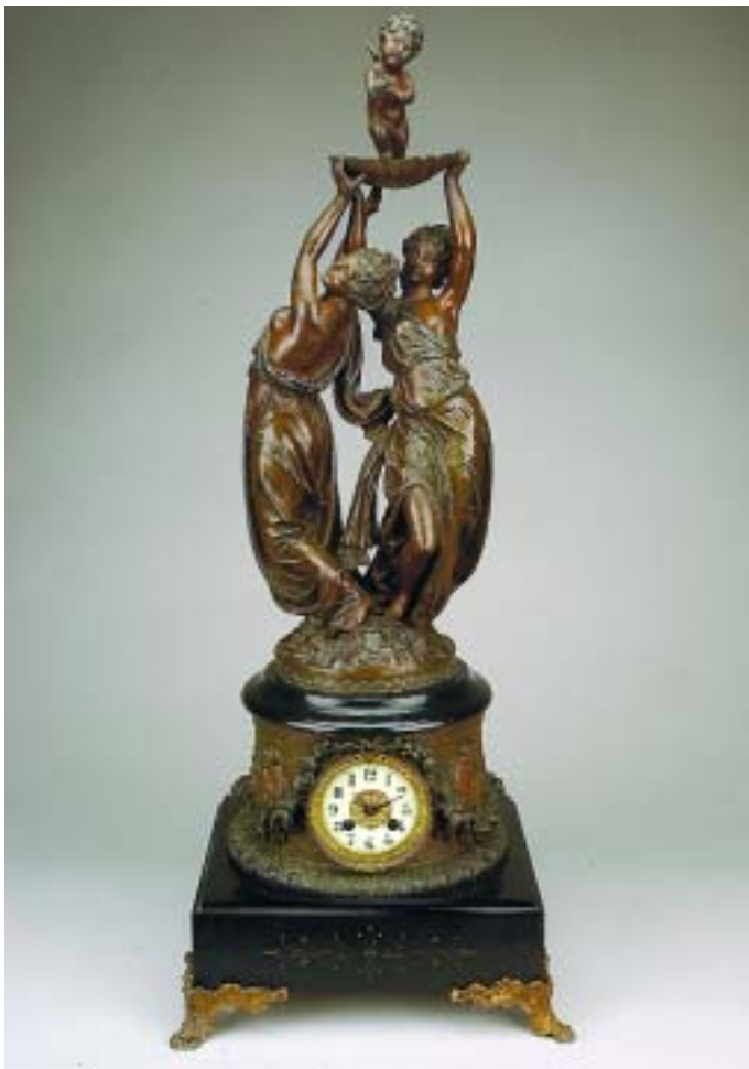
537 RELÓGIO "FIGURAS FEMININAS COM AMOR" EM BRONZE DE ARTE, mostrador em esmalte, séc. XIX, mecanismo a necessitar de conserto