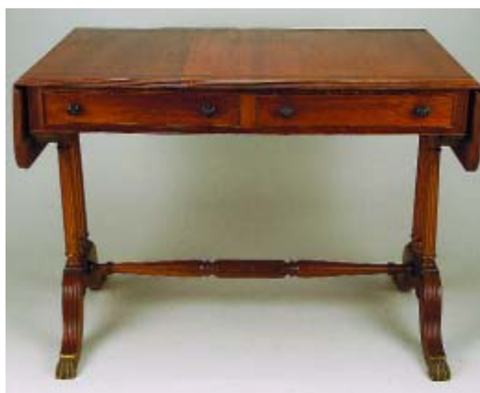
483 SOFA-TABLE EM MOGNO COM FAIXA EM PAU SANTO, inglesa, séc. XIX/XX, pequenos defeitos Dim. - 73,5 x 99 x 63,5 cm € 500 - 750