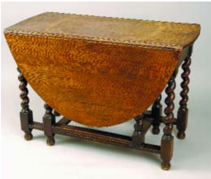
340 MESA DE CANCELA EM CARVALHO COM ABAS REDONDAS, pernas torneadas, inglesa, séc. XIX, pequenos defeitos Dim. - 73 x 107 x 52 cm