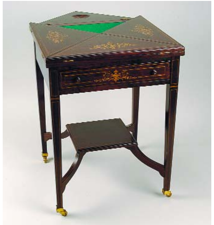
322 MESA DE JOGO DE ENVELOPE EDUARDIANA EM PAU SANTO COM EMBUTIDOS, inglesa, séc. XIX/XX, pequenos defeitos Dim. - 73 x 55 x 55 cm