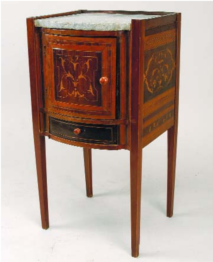
339 MESA DE CABECEIRA ESTILO D. MARIA EM PAU SANTO COM EMBUTIDOS, tampo de mármore, portuguesa, séc. XIX, defeitos Dim. - 73 x 39 x 35 cm