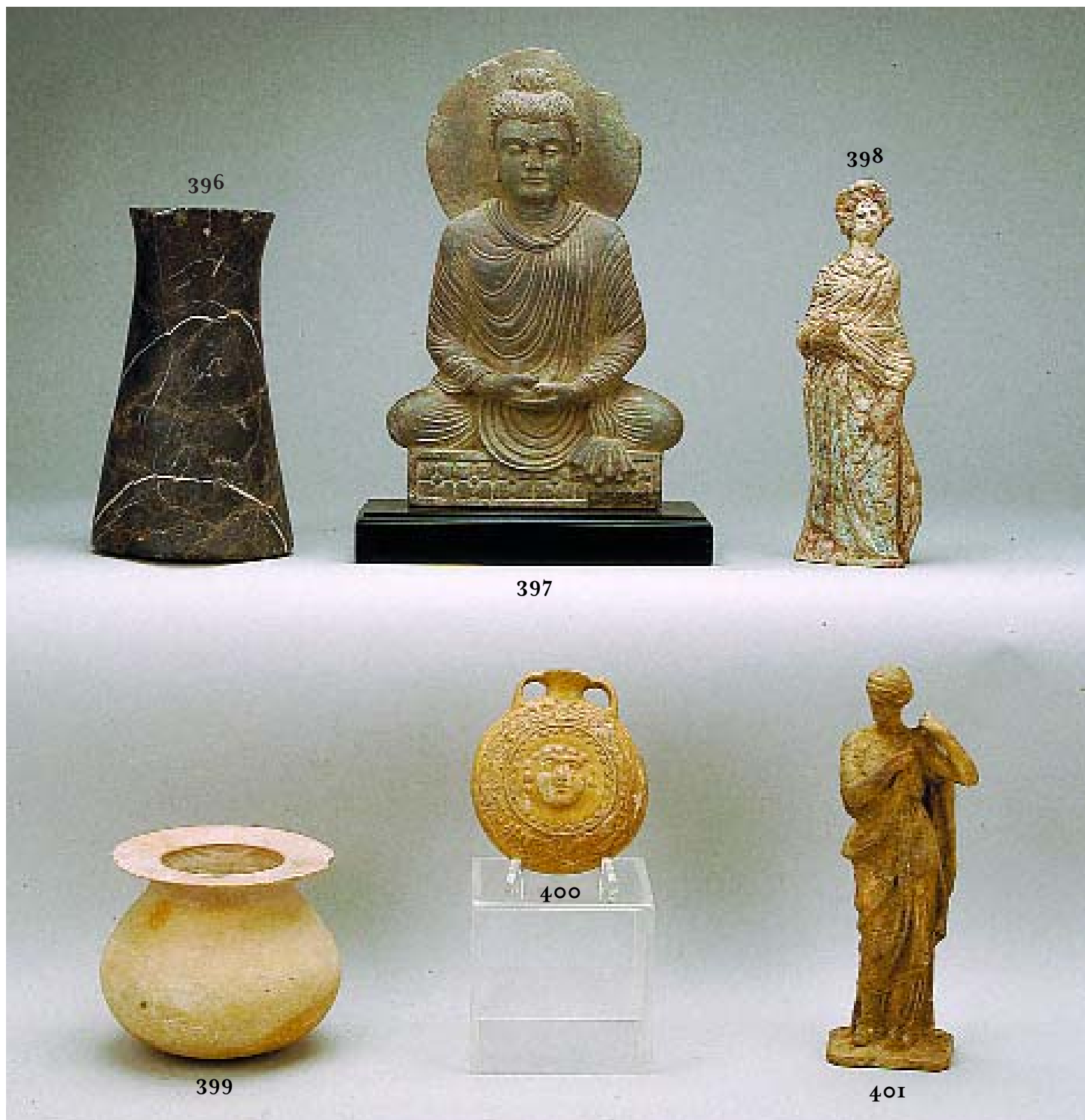
396 ÍDOLO/COLUNA EM MÁRMORE NEGRO COM LAIVOS BRANCOS , Afegã - Bacteriana, 3º milénio a.C., esbeçadelas Dim. - 22,5 cm € 1.500 - 2.250