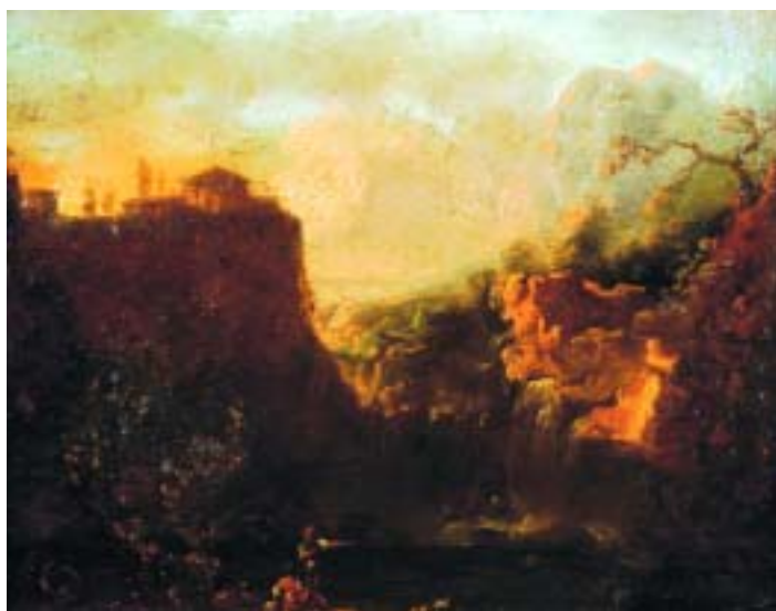
541 "PAISAGEM COM CONSTRUÇÃO E FIGURAS", óleo sobre tela, séc. XVII/XVIII, reentelado, restaura e defeitos Dim. - 32 x 40,5 cm