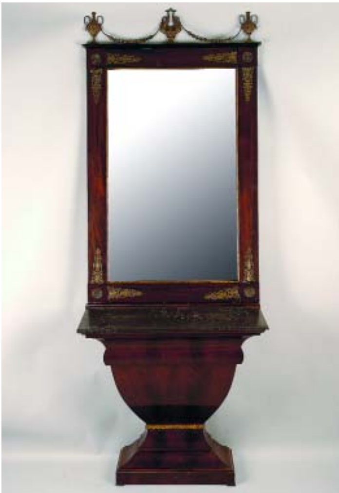
489 TREMÓ "URNA" IMPÉRIO EM MOGNO COM ESPELHO, aplicações em metal, tampo de mármore, séc. XIX, pequenos defeitos e mármore colado; D. - 238 x 88 x 40 cm € 2.000 - 3.000