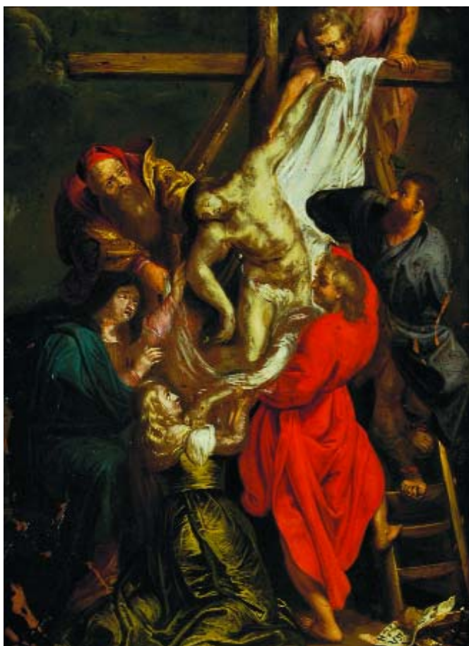
552 "DESCIDA DA CRUZ" , óleo sobre cobre, séc. XVII, segundo a obra de P.P. Rubens, faltas e pequenos defeitos Dim. - 34,5 x 25,5 cm € 1.200 - 1.800