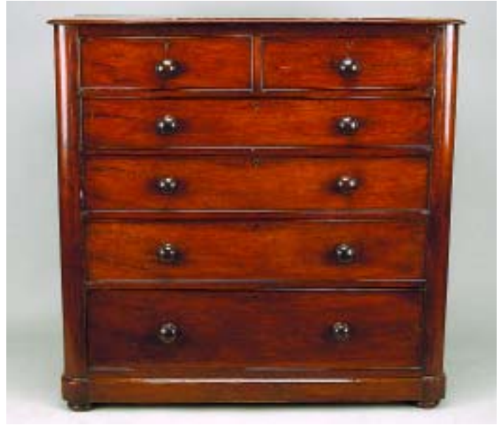
506 CÓMODA VICTORIANA EM MOGNO, inglesa,