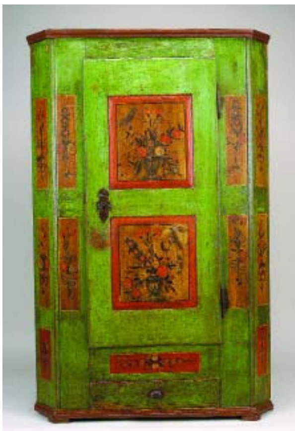
480 ARMÁRIO EM CASQUINHA PINTADA, decoração policromada "jarras com flores e pássaros" sobre fundo verde, Europa central, séc. XIX, faltas na pintura, restauros e pequenos defeitos Dim. - 160 x 102 x 47 cm € 1.000 - 1.500