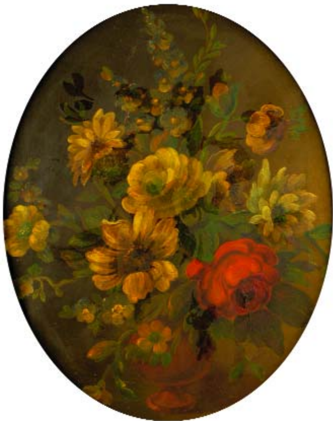
540 "NATUREZA MORTA - FLORES", óleo sobre tela oval, séc. XIX, reentelado e pequenos defeitos Dim. - 59,5 x 46,5 cm