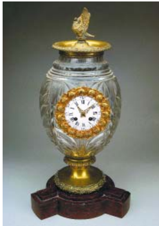
538 RELÓGIO EM CRISTAL LAPIDADO COM APLICAÇÕES EM BRONZE, base em mármore, francês, séc. XIX, pequenos defeitos, mecanismo a necessitar de conserto