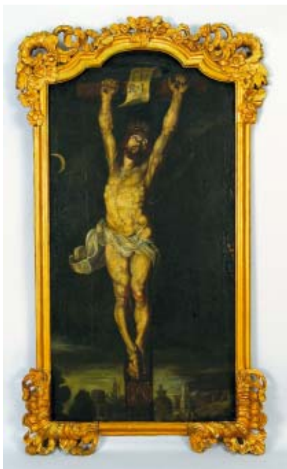
554 "CRISTO CRUCIFICADO" , óleo sobre tela, escola espanhola, séc. XVIII/XIX, reentelado e defeitos Dim. - 129 x 63 cm € 1.000 - 1.500