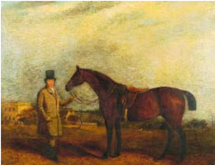
425 "SENHOR COM CAVALO", óleo sobre tela, escola inglesa, séc. XIX, restauros e pequenos defeitos Dim. - 66 x 85 cm € 1.000 - 1.500