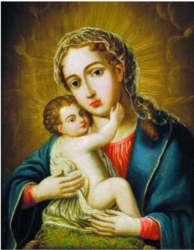
548 "NOSSA SENHORA COM O MENINO", óleo sobre madeira, séc. XVIII, restaurado Dim. - 54,5 x 43 cm