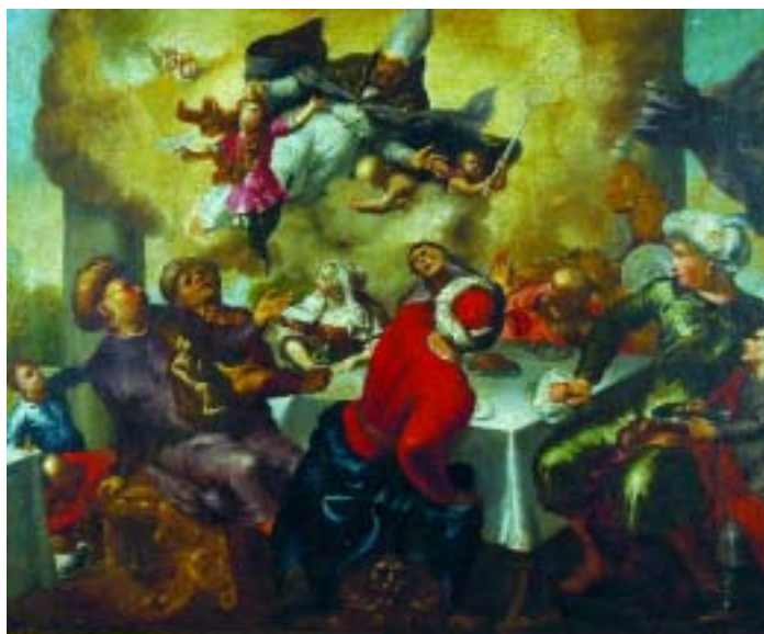
543 "ALEGORIA COM BISPO E FIGURAS À MESA", óleo sobre tela, escola italiana, séc. XVIII Dim. - 60 x 76,5 cm