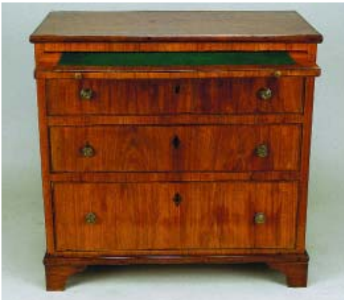
504 CÓMODA ESTILO JORGE III FOLHEADA A RAIZ DE MOGNO COM ESTIRADOR/SECRETÁRIA,

inglesa, séc. XIX, pequenas faltas e defeitos