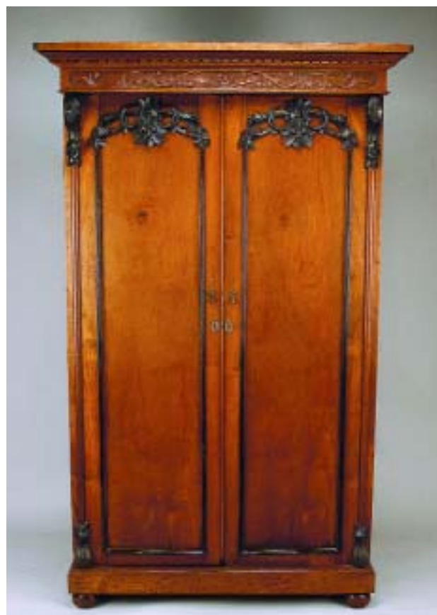
482 ARMÁRIO EM TECA COM ENTALHAMENTOS, interior com estiradores para roupa e gavetas, Índia, séc. XIX, pequenos defeitos Dim. - 196,5 x 161,5 x 64 cm € 700 - 1.000