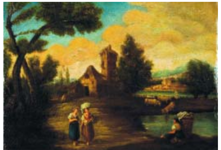
551 "PAISAGEM - FIGURAS E GADO PERTO DE LAGO", óleo sobre tela, escola inglesa, séc. XVIII/XIX, reentelado e restaurado Dim. - 39 x 55,5 cm