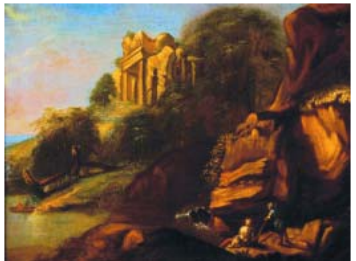
427 "PAISAGEM COM RUÍNAS E FIGURAS", óleo sobre tela, séc. XVIII/XIX, reentelado e restaurado Dim. - 45,5 x 59 cm € 1.500 - 2.250