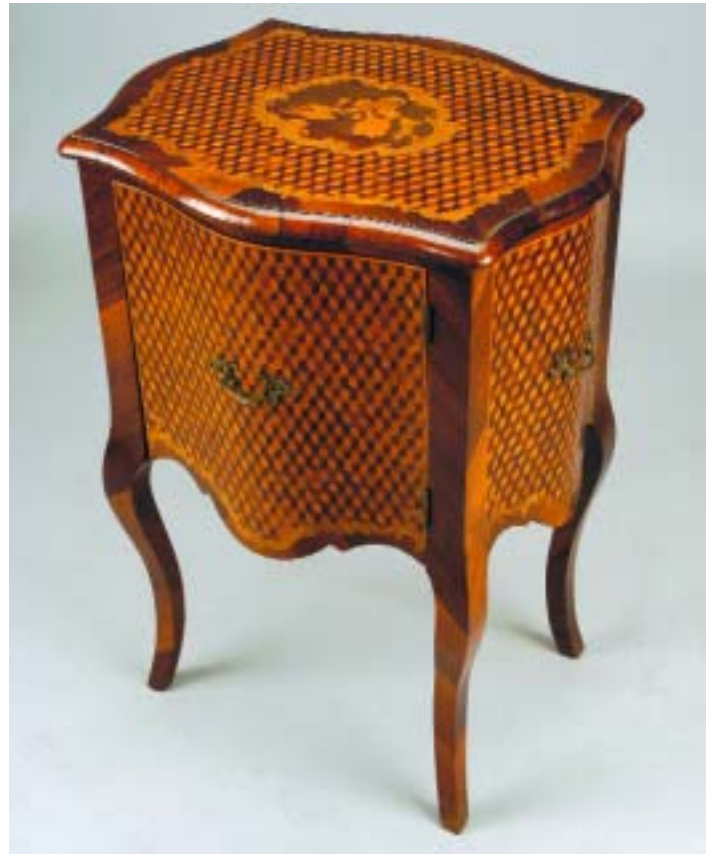
341 MÓVEL DE APOIO DE CENTRO ESTILO LUÍS XV EM PAU SANTO, trabalho de marqueterie de diversas madeiras, tampo com reserva "cena com personagens", francês, séc. XIX/XX pequenos defeitos; Dim. - 74 x 52 x 43 cm