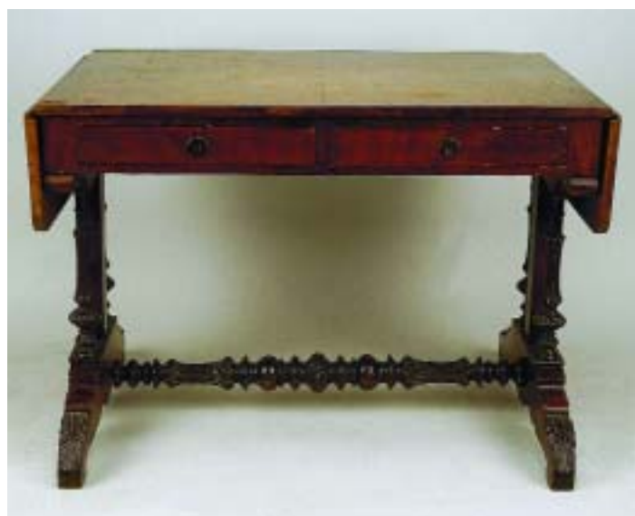
481 SOFA-TABLE VICTORIANA EM NOGUEIRA E RAIZ DE NOGUEIRA COM ENTALHAMENTOS, inglesa, séc. XIX, pequenas faltas e defeitos Dim. - 71 x 99,5 x 62,5 cm € 1.500 - 2.250