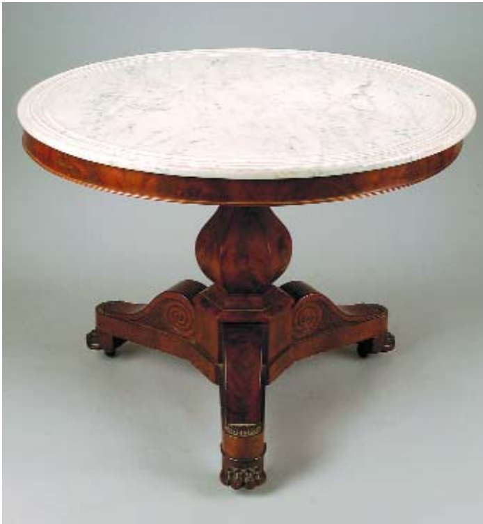
320 MESA REDONDA LUÍS FILIPE EM MOGNO E RAIZ DE MOGNO, tampo de mármore, francesa, séc. XIX, pequenas faltas e defeitos Dim. - 74 x 97 cm