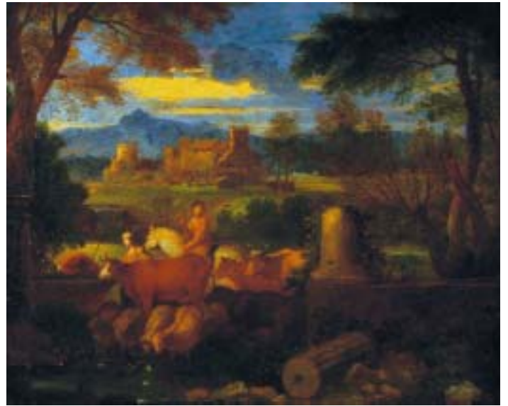
426 "PAISAGEM COM PASTORES E GADO PERTO DE RUÍNAS", óleo sobre tela, escola italiana, séc. XVIII/XIX, reentelado e pequenos restauros Dim. - 37 x 45,5 cm € 800 - 1.200