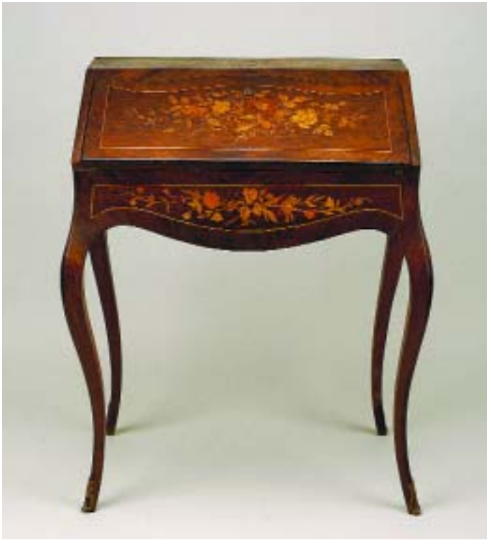
503 SECRETÁRIA ESTILO LUÍS XV FOLHEADA A PAU SANTO COM MARQUETERIE "FLORES",