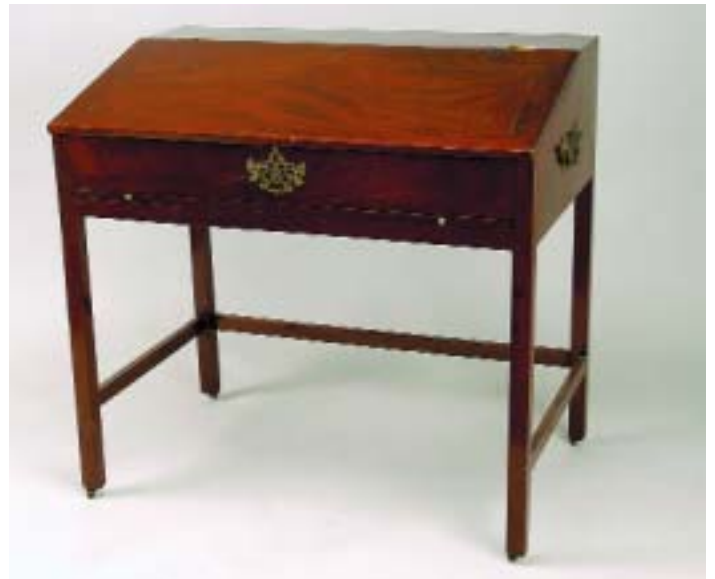
328 SECRETÁRIA JORGE III EM MOGNO, tampo inclinado, interior com escaninhos, inglesa, séc. XIX, pequenos defeitos Dim. - 93 x 99 x 58 cm € 1.500 - 2.250