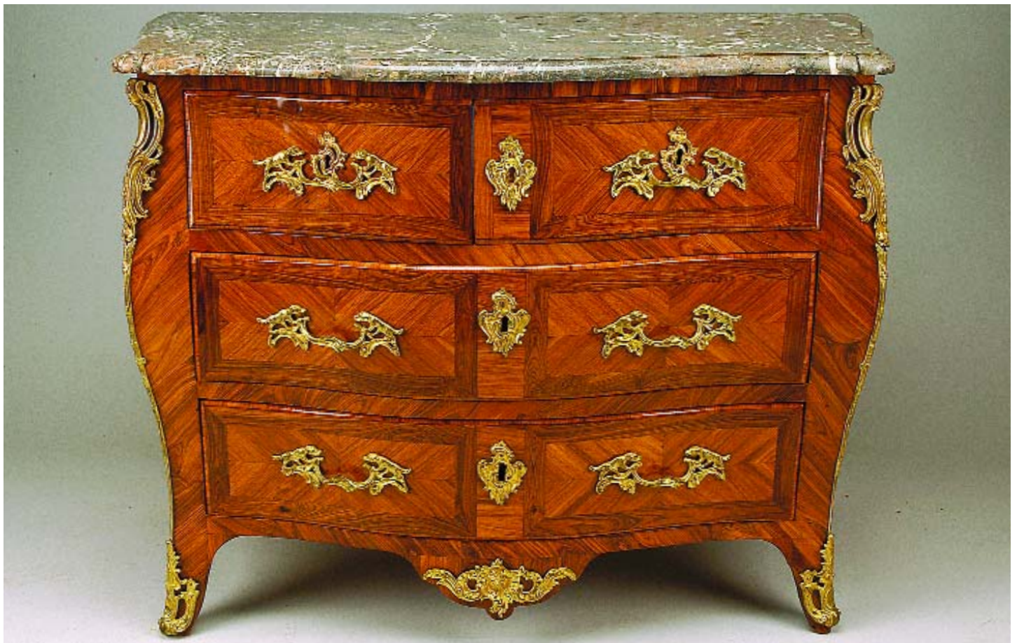
484 CÓMODA LUÍS XV FOLHEADA A PAU SANTO, aplicações em bronze dourado, tampo em mármore, francesa, séc. XVIII, estampilhada LARDIN (André Antoine Lardin) - Mestre em 1750 - e JME (jurande des menuisiers-ébeniste de Paris), pequenos restauros Dim. - 84,5 x 113 x 58,5 cm € 14.000 - 20.000