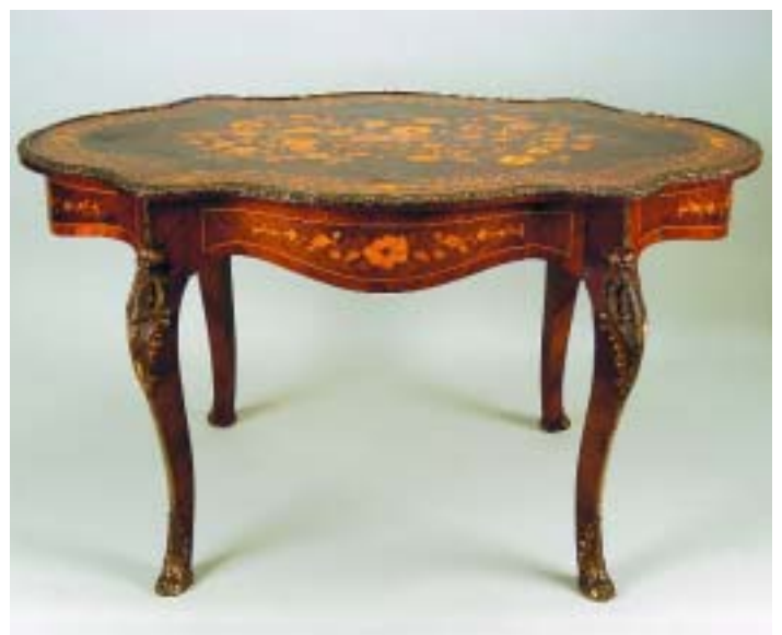
323 MESA DE CENTRO NAPOLEÃO III FOLHEADA A PAU SANTO E RAIZ DE NOGUEIRA COM EMBUTIDOS, aplicações em bronze dourado, francesa, séc. XIX, pequenos defeitos Dim. - 75 x 135 x 82 cm