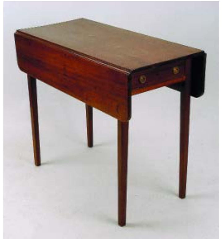
501 MESA DE ABAS JORGE III EM MOGNO, inglesa, séc. XIX, pequenos defeitos Dim. - 75 x 88 x 44 cm