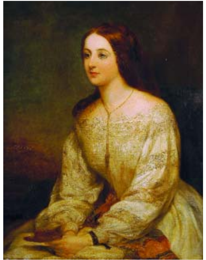
546 "RETRATO DE SENHORA JOVEM", óleo sobre tela, escola inglesa, séc. XIX, reentelado e pequenos restauros Dim. - 94 x 72 cm € 1.200 - 1.800