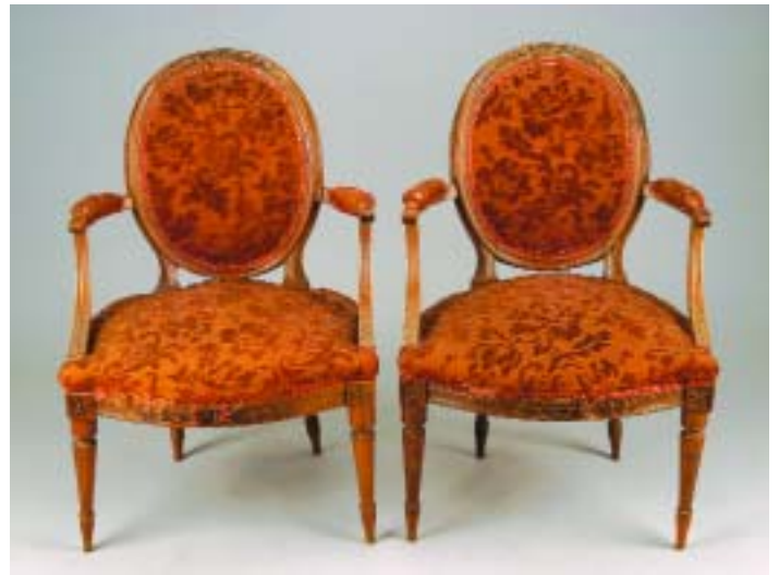
326 PAR DE FAUTEUILS D. MARIA EM NOGUEIRA COM ENTALHAMENTOS, assentos e costas estofados a veludo adamascado, portugueses, séc. XVIII, defeitos Dim. - 89 x 63 x 54 cm € 1.200 - 1.800