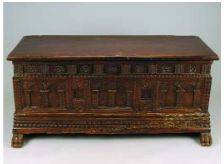
502 ARCA EM NOGUEIRA COM ENTALHAMENTOS "COLUNATA", séc. XVII, tampo parcialmente posterior, faltas e defeitos Dim. - 65 x 140 x 61 cm