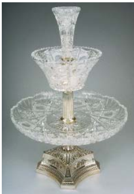
1024 CENTRO DE MESA EM PRATA ESTRANGEIRA, dois pratos e jarra em cristal lapidado, séc. XX, marca de teor de 925% Dim. - 48 cm € 2.000 - 3.000