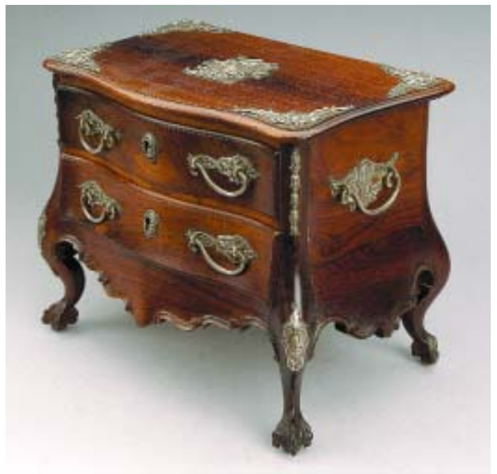
1048 CÓMODA ESTILO D. JOSÉ MINIATURA/GUARDA JÓIAS EM PAU SANTO, aplicações em prata portuguesa, séc. XIX/XX, contraste Javali de Lisboa (1887-1937), marca de ourives "Leitão & Irmão" (Vidal - 82 e 635), com chave, pequenas faltas e defeitos Dim. - 21,5 x 27 x 18 cm € 1.500 - 2.250