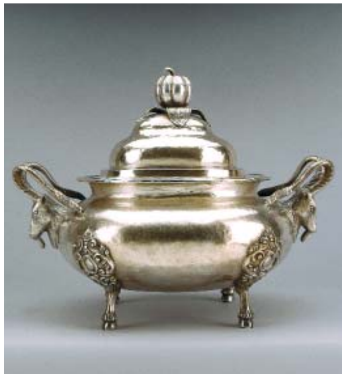
1026 TERRINA OVAL EM PRATA BOLIVIANA, pegas "bodes" e pega da tampa "abóbora", séc. XIX, sem marcas Dim. - 33 x 42 x 28 cm; Peso - 4.292 grs. € 2.500 - 3.750