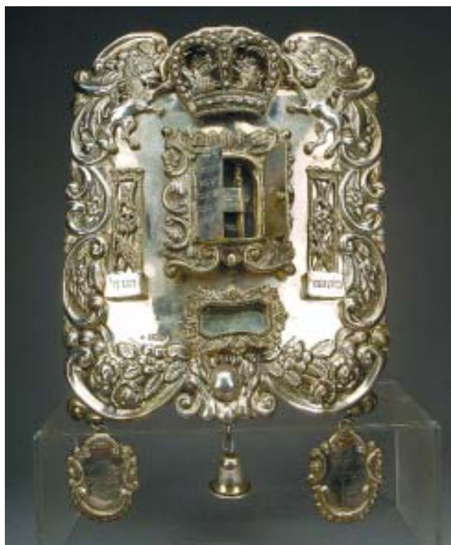
1023 PLACA JUDAICA EM PRATA INGLESA, séc. XX, contraste de Londres (1915-1916), marca de ourives J.R., pequena falta na coroa, Dim. - 34,5 x 22,5 cm € 3.000 - 4.500