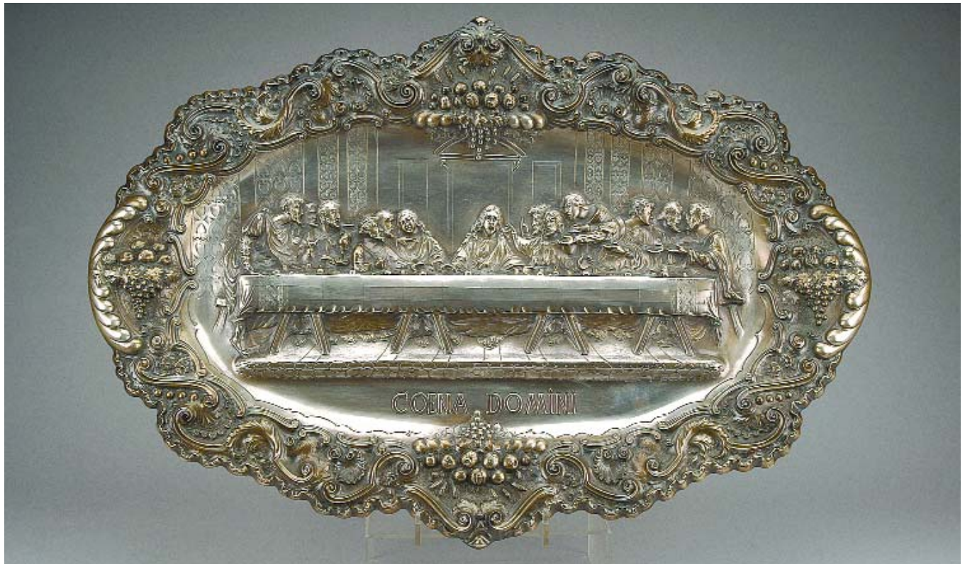
1047 SALVA OVAL "CEIA DO SENHOR" EM PRATA PORTUGUESA, séc. XX, contraste Águia do Porto (1938-1984) (Vidal - 46) Dim. - 86 x 59 cm Peso - 3,200 grs. € 1.500 - 2.250