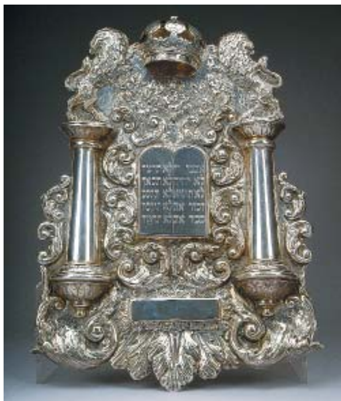
1025 PLACA JUDAICA EM PRATA AMERICANA, séc. XX, marcada, ligeira amolgadela Dim. - 39,5 x 28,5 cm € 3.000 - 4.500