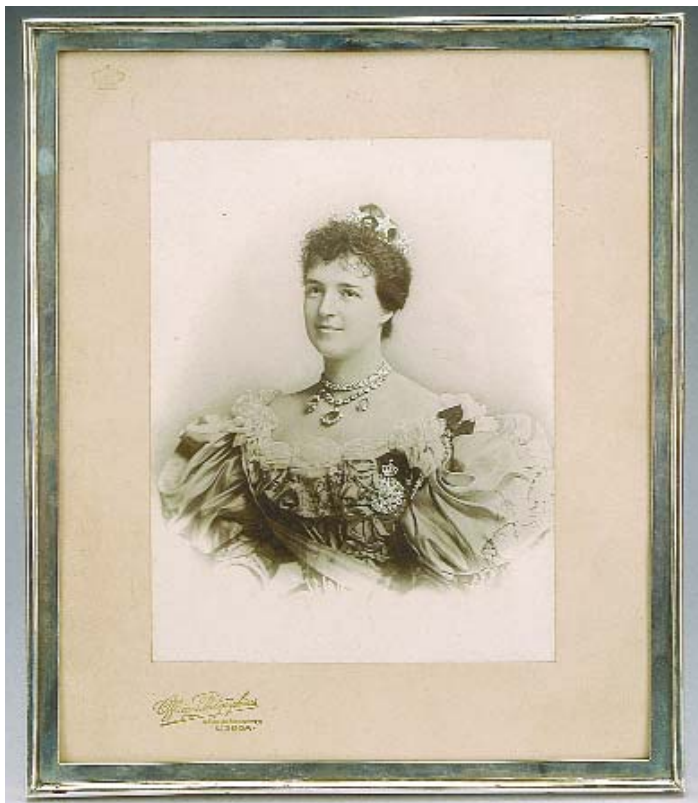
1046 "RAINHA DONA AMÉLIA", fotografia com moldura em prata, séc. XX, sem marcas Dim. - 33 x 28 cm € 300 - 450