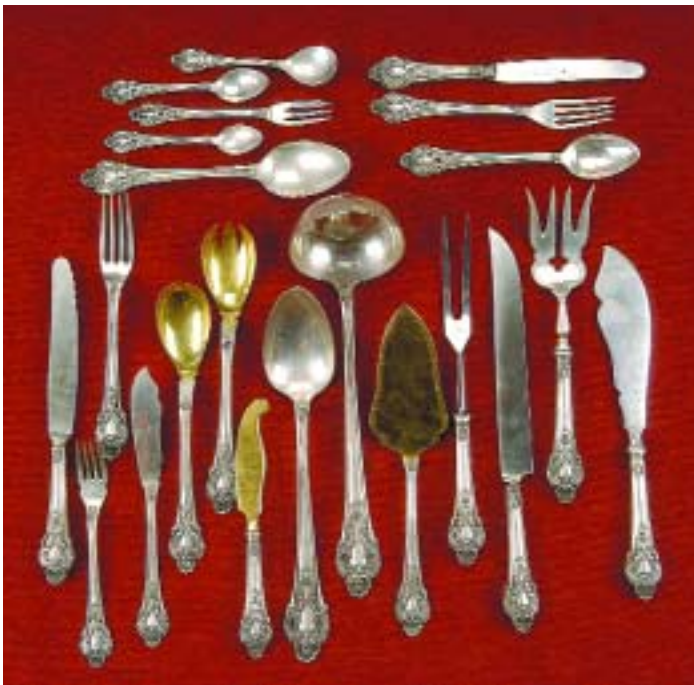
II00 FAQUEIRO PARA DOZE PESSOAS ESTILO D. JOÃO V EM PRATA PORTUGUESA , composto por 20 talheres de servir, colheres de sopa, talheres de carne e de peixe, talheres de sobremesa, colheres e garfos de bolo; facas de manteiga, colheres de chá e de café, séc. XIX/XX, marca de teor de 833