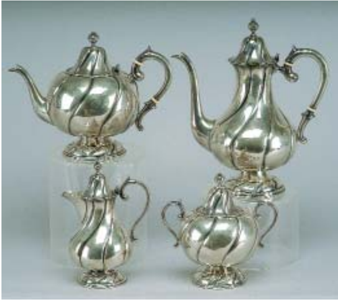
923 SERVIÇO DE CHÁ E DE CAFÉ EM PRATA PORTUGUESA, composto por bule, cafeteira, açucareiro e leiteira, séc. XIX/XX, contraste Javali do Porto (1887-1937) (Vidal - 73) Dim. - 27 cm; Peso - 2,150 grs. € 1.300 - 2.000