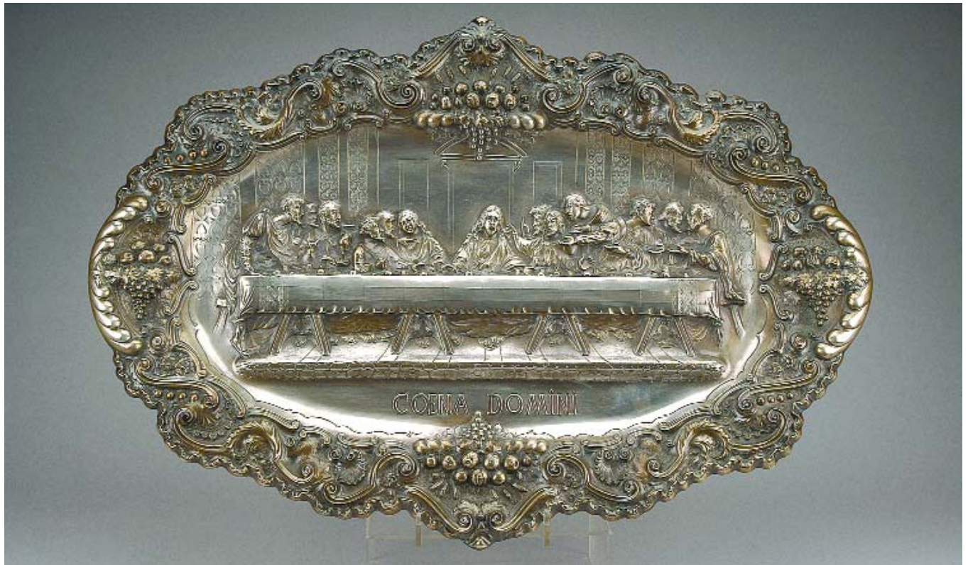
1047 SALVA OVAL "CEIA DO SENHOR" EM PRATA PORTUGUESA, séc. XX, contraste Águia do Porto (1938-1984) (Vidal - 46) Dim. - 86 x 59 cm Peso - 3,200 grs. € 1.500 - 2.250