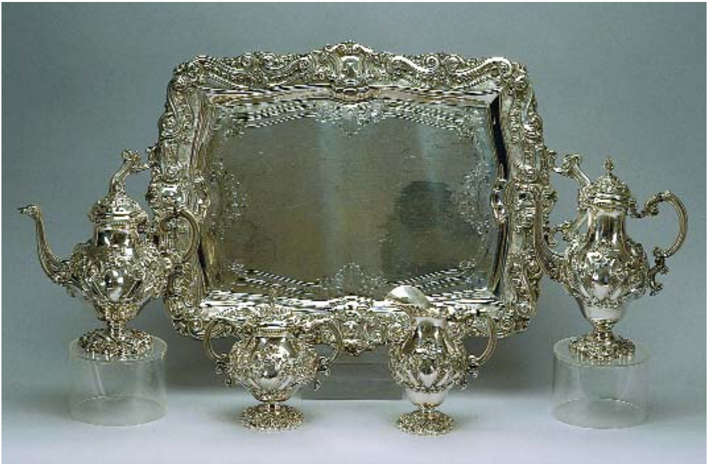
930 SERVIÇO DE CHÁ E DE CAFÉ COM BANDEJA EM PRATA PORTUGUESA, composto por bule, cafeteira, açucareiro, leiteira e bandeja,