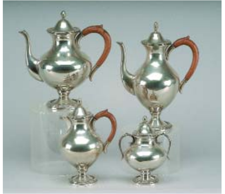
925 SERVIÇO DE CHÁ E DE CAFÉ EM PRATA PORTUGUESA, composto por bule, cafeteira, açucareiro e leiteira, séc. XX, contraste Águia do Porto (1938-1984) (Vidal - 49), amolgadela Dim. - 28 cm Peso - 2,209 grs. € 1.000 - 1.500