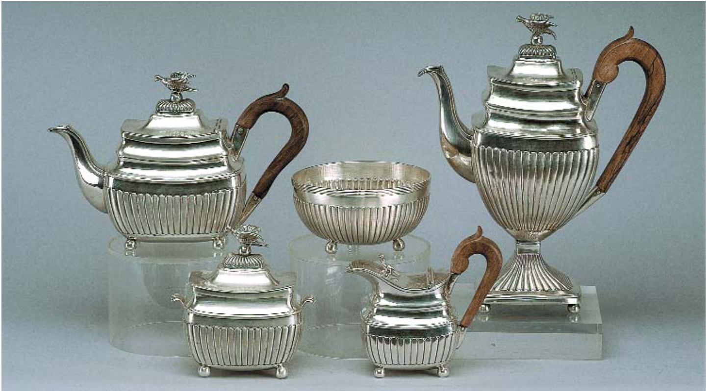
927 SERVIÇO DE CHÁ E DE CAFÉ EM PRATA PORTUGUESA, bule, cafeteira, leiteira, açucareiro e tigela de pingos,