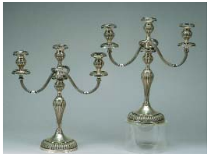
935 PAR DE CANDELABROS DE TRÊS LUMES EM PRATA PORTUGUESA séc. XX, contraste Águia de Lisboa (1938-1984) (Vidal - 45), interior com chumbo, ligeira amolgadela Dim. - 38 cm; Peso bruto - 2.600 grs. € 1.600 - 2.400