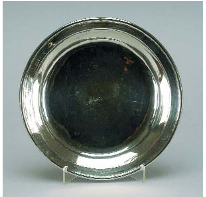
928 TAÇA EM PRATA PORTUGUESA, séc. XVII/XVIII, contraste de Lisboa (séc. XVII-1720), contraste de ourives MO (séc. XVII-1720) (M. A. - L21 e L435) Dim. - 4,5 x 24 cm Peso - 445 grs. € 4.000 - 6.000