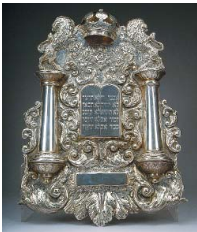
1025 PLACA JUDAICA EM PRATA AMERICANA, séc. XX, marcada, ligeira amolgadela Dim. - 39,5 x 28,5 cm € 3.000 - 4.500