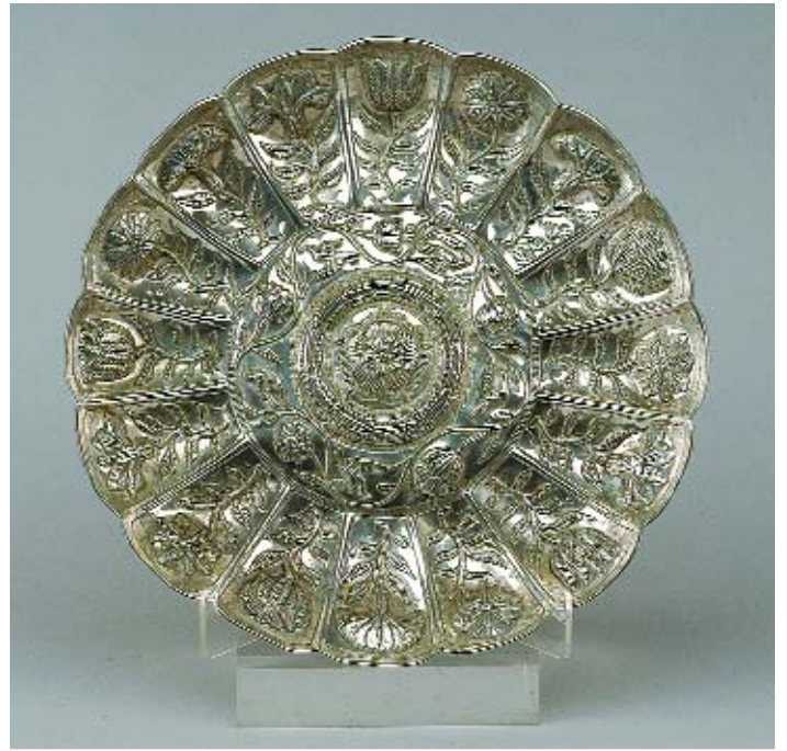
934 SALVA GOMADA EM PRATA PORTUGUESA, decoração "cravos e alcachofras", séc. XVII/XVIII, contraste posterior de Lisboa (1870-1879) (M. A. - L44) Dim. - 34 cm Peso - 602 grs. € 4.000 - 6.000