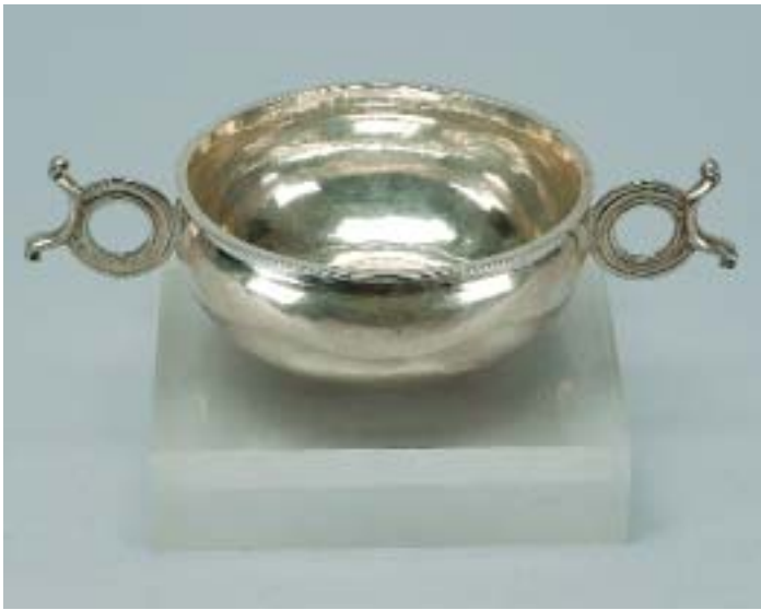
926 TAÇA EM PRATA PORTUGUESA, séc. XVIII, contraste do Porto (1768-1784), marca de ourives BC (M.A. - P13B e variante posterior de P197A) pegas posteriores, inscrição na base Dim. - 6 x 14,5 cm; Peso - 370 grs. € 1.200 - 1.800