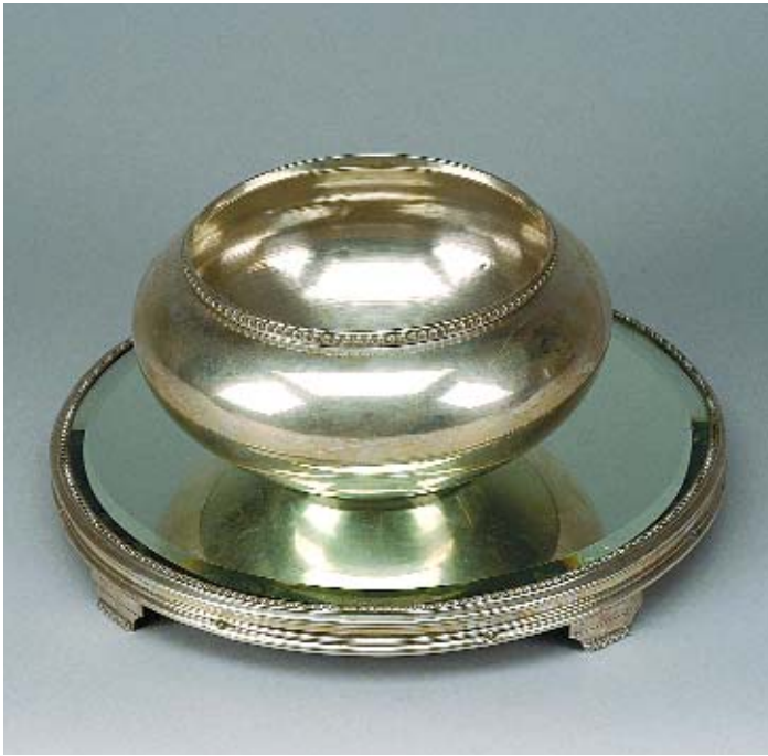
932 CENTRO DE MESA COM BASE EM PRATA PORTUGUESA, base com espelho, séc. XIX/XX, contraste Javali do Porto (1887-1937) (Vidal - 73), amolgadelas Dim. - 11 x 22 cm (centro) - 32 cm (base) Peso - 641 grs. € 800 - 1.200