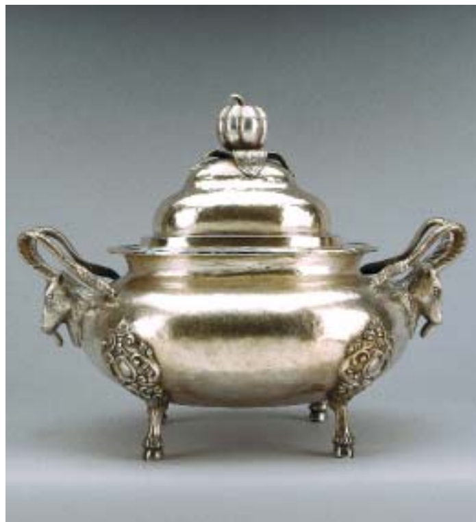
1026 TERRINA OVAL EM PRATA BOLIVIANA, pegas "bodes" e pega da tampa "abóbora", séc. XIX, sem marcas Dim. - 33 x 42 x 28 cm; Peso - 4.292 grs. € 2.500 - 3.750