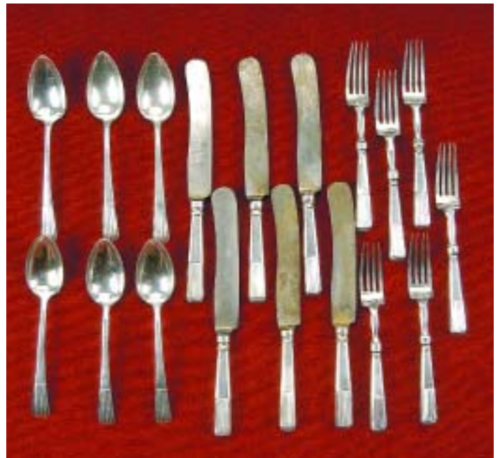
II03 DOZE COLHERES DE SOPA, GARFOS E FACAS DE CARNE EM PRATA PORTUGUESA , decoração dita "meia cana", séc. XIX/XX, contraste Javali do Porto (1887-1937) (Vidal - 73)