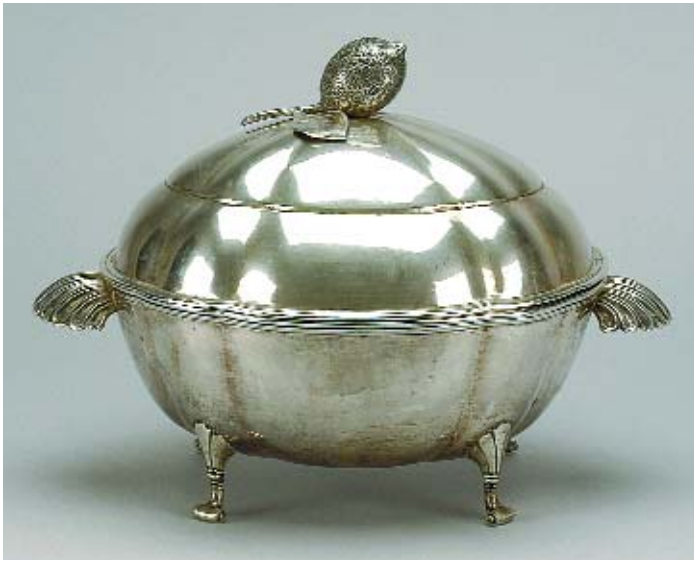
929 TERRINA OVAL GOMADA EM PRATA PORTUGUESA, séc. XX, contraste Águia do Porto (1938-1984) (Vidal - 49) Dim. - 26 x 35 x 22 cm Peso - 2,046 grs. €1.000 - 1.500