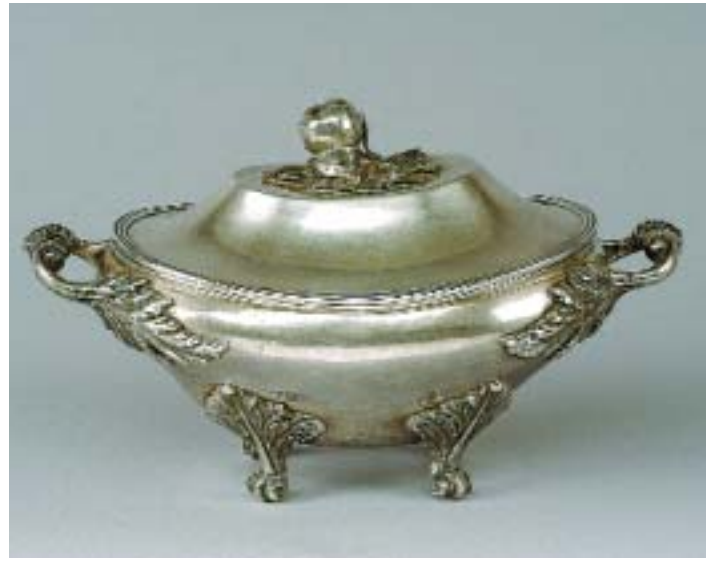
931 TERRINA OVAL EM PRATA PORTUGUESA, séc. XX, contraste Águia do Porto (1938-1984) (Vidal - 49) Dim. - 17,5 x 29 x 16,5 cm Peso - 1,585 grs. € 750 - 1.100