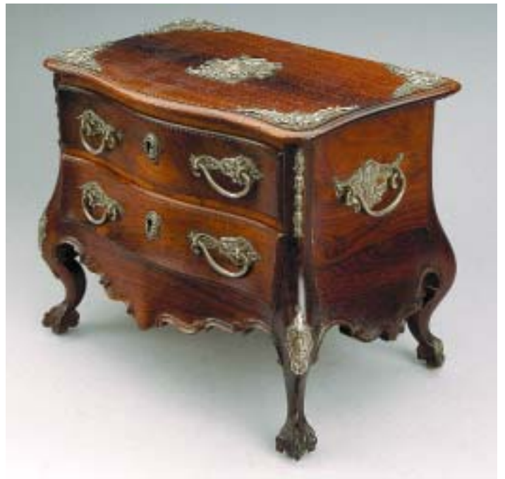
1048 CÓMODA ESTILO D. JOSÉ MINIATURA/GUARDA JÓIAS EM PAU SANTO, aplicações em prata portuguesa, séc. XIX/XX, contraste Javali de Lisboa (1887-1937), marca de ourives "Leitão & Irmão" (Vidal - 82 e 635), com chave, pequenas faltas e defeitos Dim. - 21,5 x 27 x 18 cm € 1.500 - 2.250