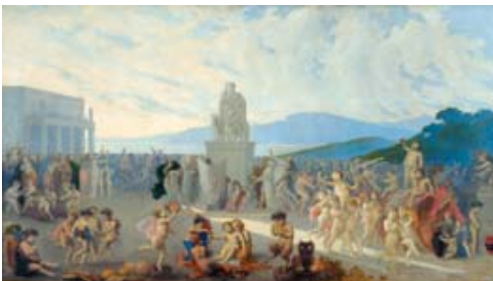
922 "PUTTI", óleo sobre tela, escola italiana, séc. XIX, reentelado Dim. - 77 x 135 cm