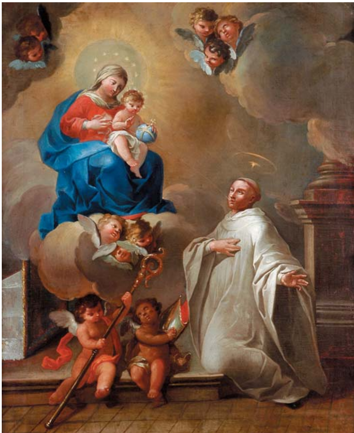
935 "NOSSA SENHORA DO LEITE E SÃO BERNARDO", óleo sobre tela, moldura em madeira entalhada e dourada,

escola portuguesa, séc. XVIII, reentelado, restauros Dim. - 127 x 106 cm