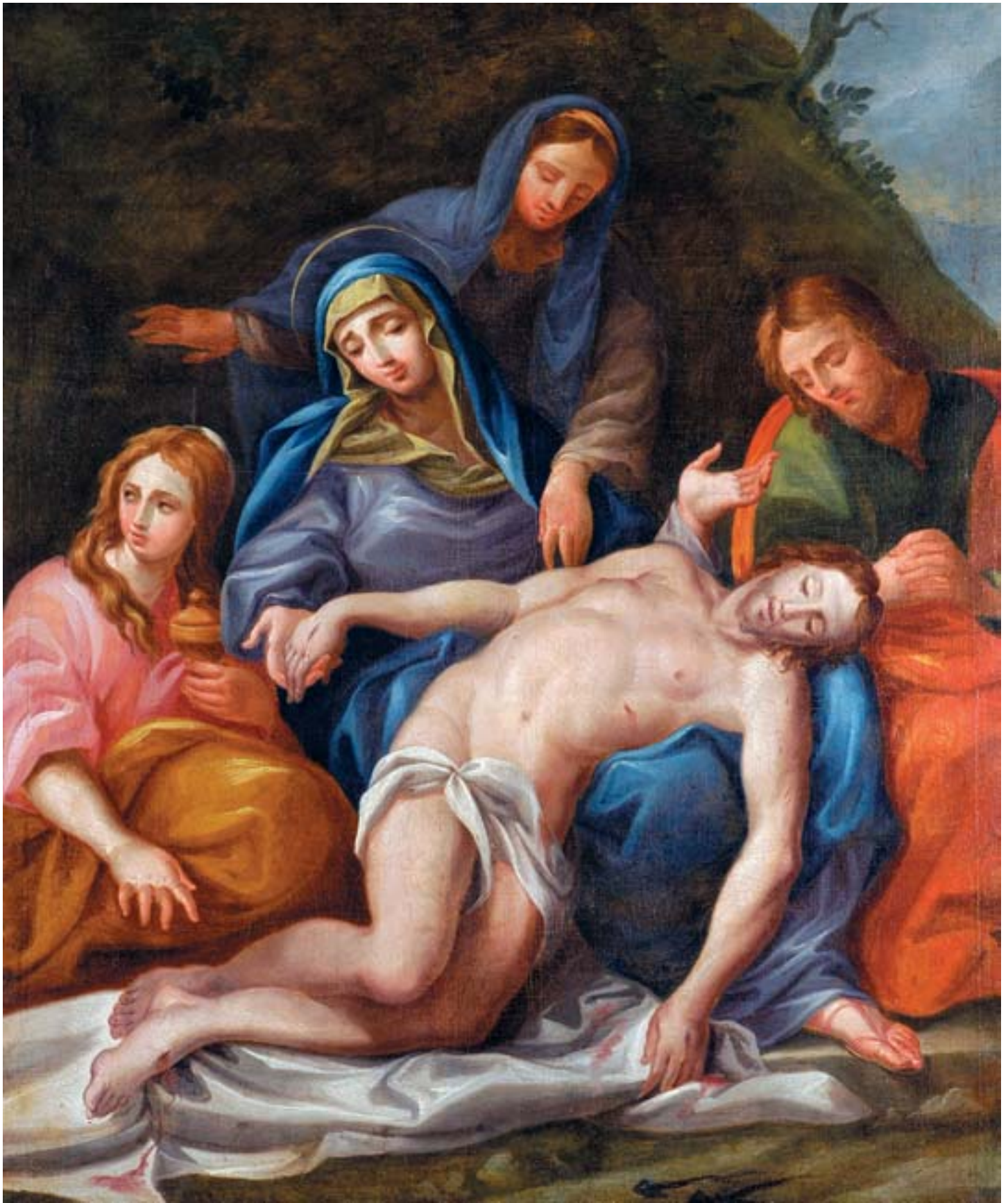
930 "PIETÀ", óleo sobre tela, escola portuguesa, séc. XVIII,

reentelado, restauros Dim. - 108 x 90 cm