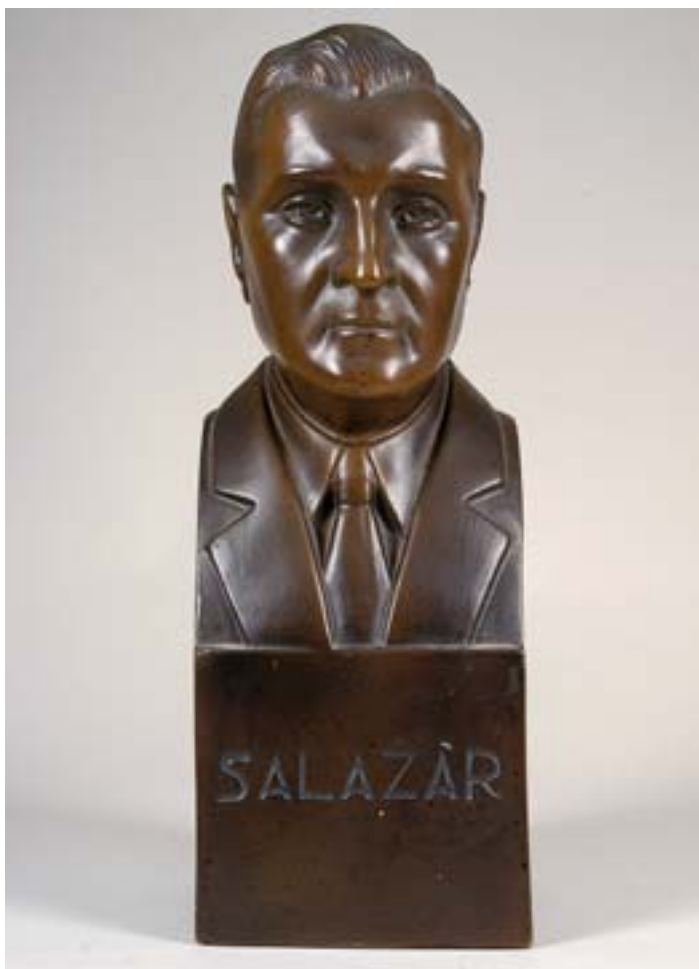
917 "BUSTO DE SALAZAR", escultura em barro pintado, inscrição SALAZAR, portuguesa, séc. XX, ligeiro defeito, marcado de Coimbra Dim. - 34 cm € 200 - 300