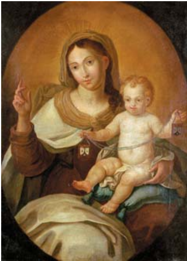
921 "NOSSA SENHORA DO CARMO", óleo sobre tela, escola portuguesa, séc. XVIII, reentelado e restaurado Dim. - 86,5 x 63 cm