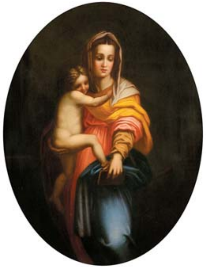
923 "NOSSA SENHORA COM O MENINO", óleo sobre tela, moldura em madeira entalhada e dourada, escola italiana, séc. XIX, pequenos restauros Dim. - 86 x 67 cm