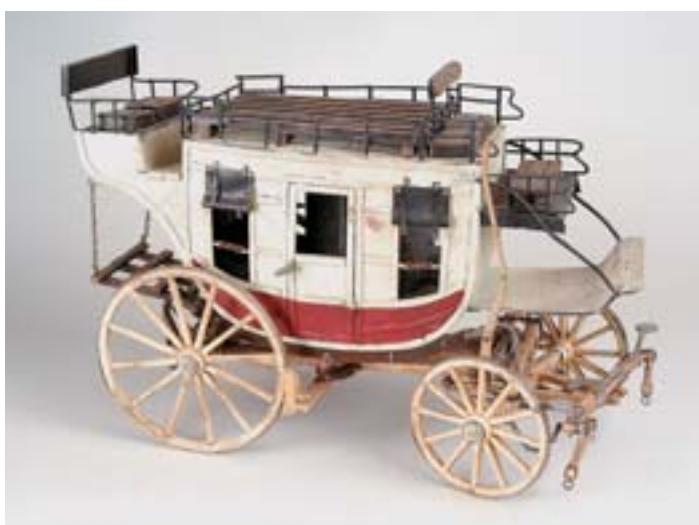
918 "MALAPOSTA", metal pintado, Europa, séc. XIX/XX, pequenos defeitos Dim. - 26 x 39 x 13,5 cm € 400 - 600