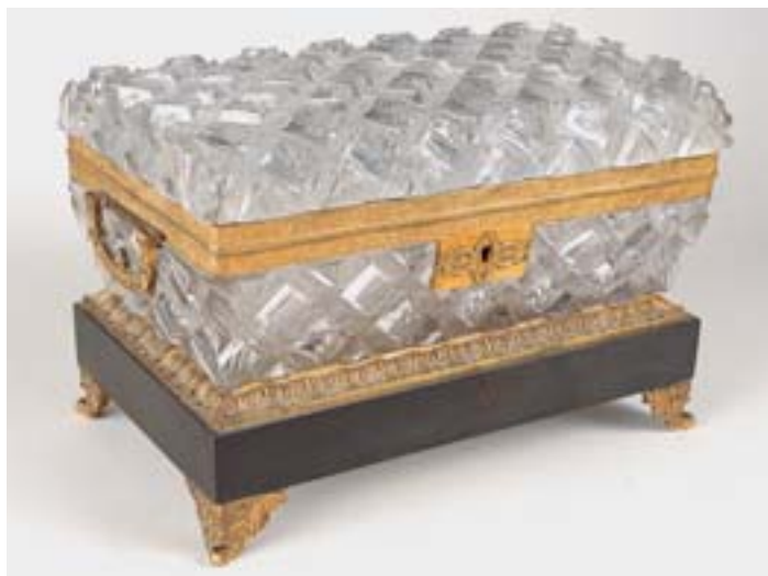
920 COFRE, ao gosto Império, cristal lapidado, base em metal negro, frisos e pés em metal dourado, Europa, séc. XIX, tampa rachada; Dim. - 20 x 30 x 18 cm € 500 - 750