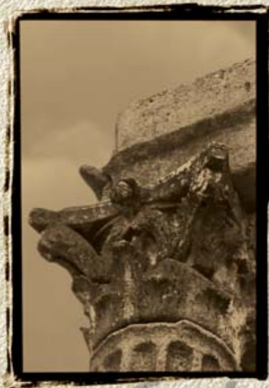
Centro Histórico de Évora Património Mundial UNESCO 1986