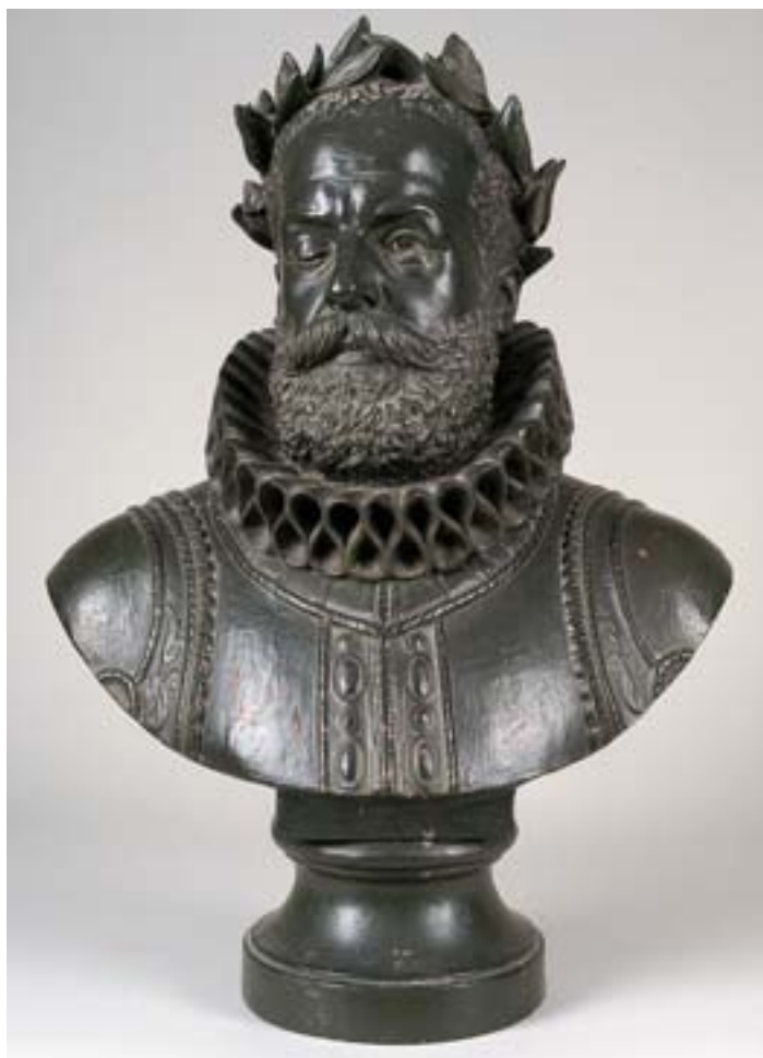
919 SIMÕES DE ALMEIDA JÚNIOR - 1844-1926, "BUSTO DE LUÍS DE CAMÕES", escultura em terracota pintada de verde, pequenas faltas na tinta, assinada e datada de 1880 Dim. - 48 cm € 150 - 225