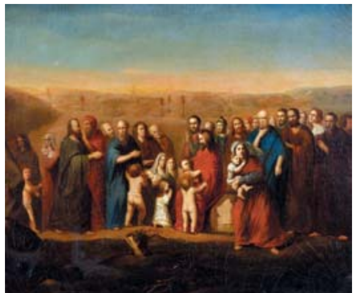
924 "CRISTO E OS APÓSTOLOS - PARÁBOLA DAS CRIANÇAS", óleo sobre tela, escola francesa, séc. XIX, pequeno restauro Dim. - 54 x 65 cm