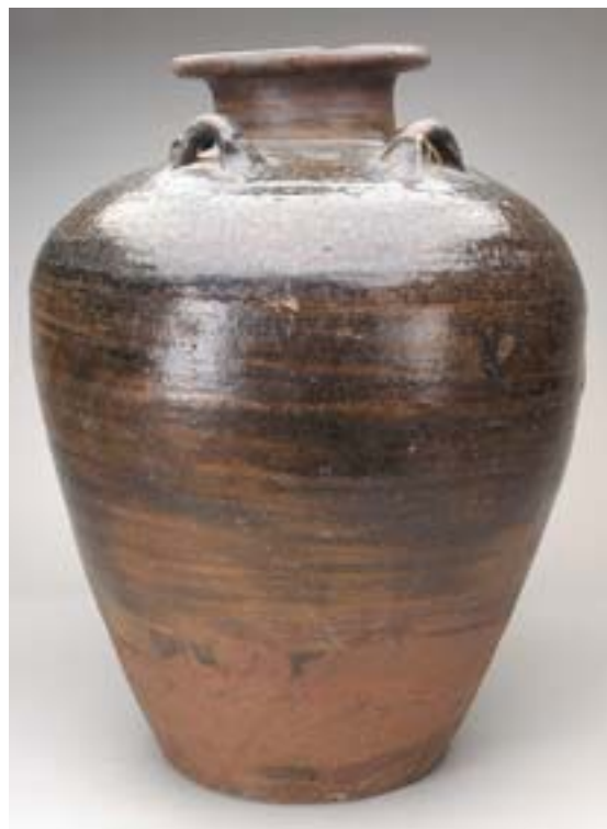
807 POTE DE ESPECIARIAS, grés vidrado, bojo com suporte de argolas, Oriente, séc. XVII Dim. - 61 cm € 500 - 750