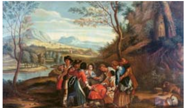
742 "PAISAGEM COM FIGURAS - JOGO DA MÃO QUENTE", óleo sobre tela, escola flamenga, séc. XVIII, restauração antiga, pequenos defeitos na tela Dim. - 103 x 196,5 cm