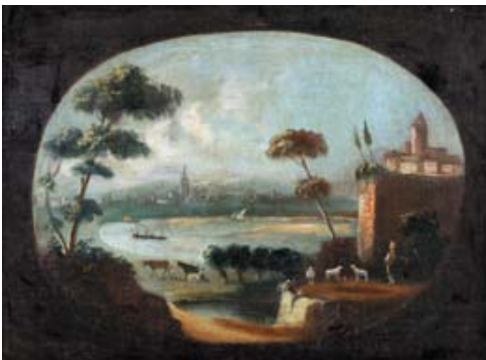
759 ↑ "PAISAGENS COSTEIRAS COM FIGURAS E ANIMAIS", par de óleos sobre tela, escola espanhola, séc. XIX, reentelados e restaurados Dim. - 62 x 82,5 cm € 1.200 - 1.800