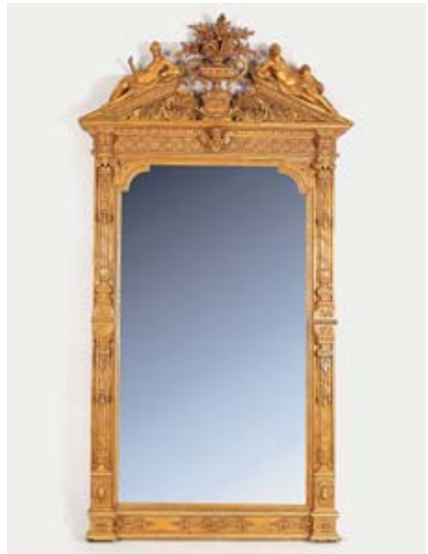
821 ESPELHO, estilo neoclássico, moldura em madeira entalhada e dourada, francês, séc. XIX, pequenos defeitos Dim. - 227 x 117 cm € 600 - 900