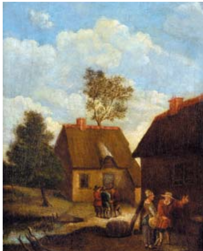
745 "ALDEÕES CONVERSANDO", óleo sobre tela, escola holandesa, séc. XVIII, reentelado e pequenos restauros Dim. - 37,5 x 30,5 cm € 1.500 - 2.250