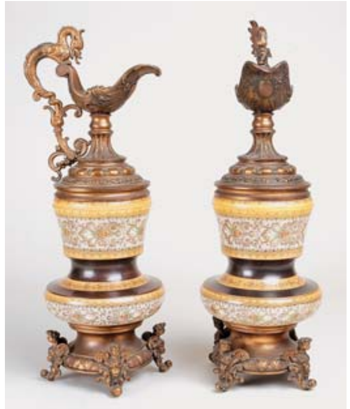
810 PAR DE ÂNFORAS, loíça com montagem em bronze de arte "querubins e grifos", Itália, séc. XIX, asas dos grifos partidas Dim. - 60 cm € 750 - 1.125