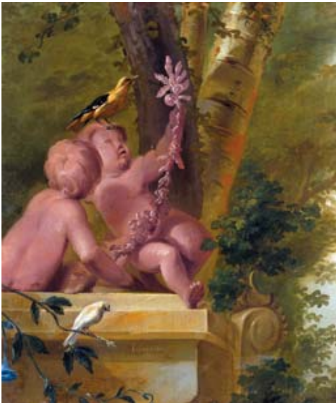
751 I. AGGUSTINI (?) - SÉC. XVIII, "BOSQUE COM MENINOS, ÁRVORES E PÁSSARO", óleo sobre tela, reentelado, restauros, assinado e datado de 1767 Dim. - 91 x 76 cm