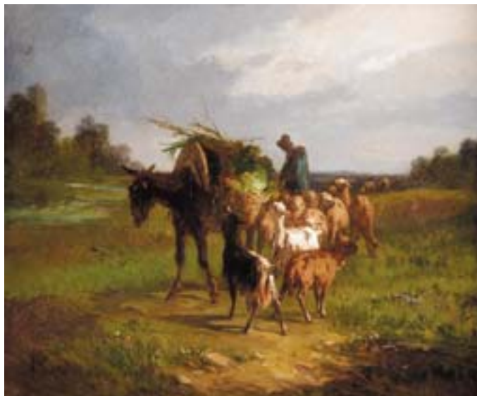
752 ANDRÉ CORTÈS - SÉC. XIX, "PASTORES COM GADO", par de óleos sobre tela, um com restauro, assinados Dim. - 38,5 x 46 cm