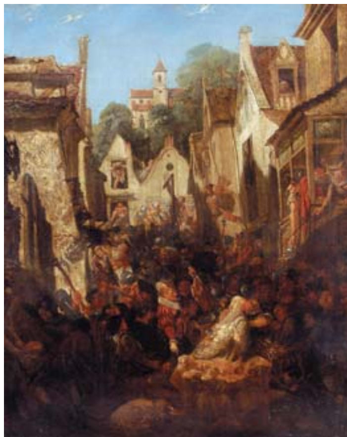
749 "CENA DE VILA COM PERSONAGENS", óleo sobre tela, escola flamenga, séc. XVIII/XIX, reentelado e restaurado Dim. - 102 x 81 cm