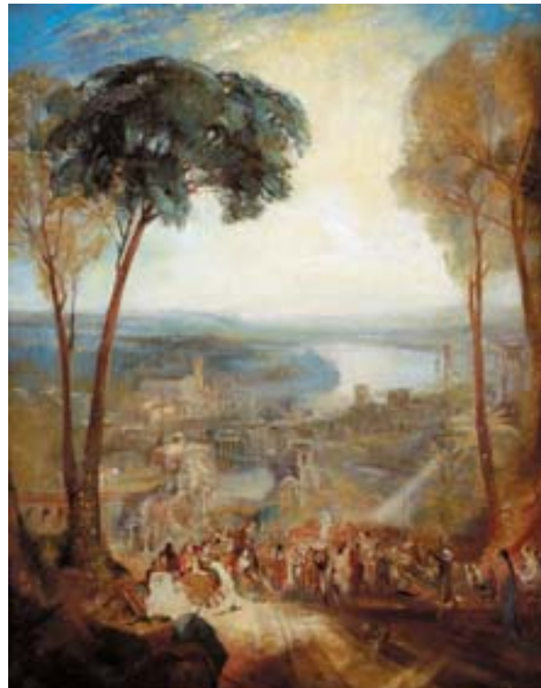
758 "FESTA NA CIDADE", óleo sobre tela, escola italiana, séc. XIX, pequenas faltas e defeitos na pintura Dim. - 91 x 71 cm € 700 - 1.050