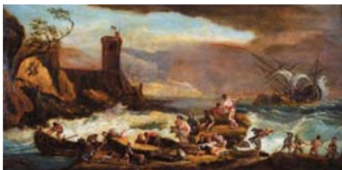
767 ↑ LOUIS GABRIEL EUGÈNE ISABEY - 1803-1886, "SALVANDO-SE DA TEMPESTADE", óleo sobre madeira, assinado Dim. - 22,5 x 45 cm € 3.000 - 4.500