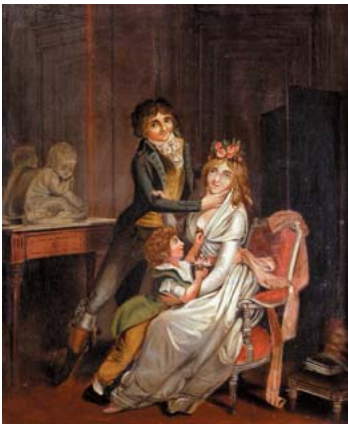
747 "CENAS DE INTERIOR", par de óleos sobre tela, escola inglesa, séc. XIX, pequenos defeitos Dim. - 45,5 x 38,5 cm