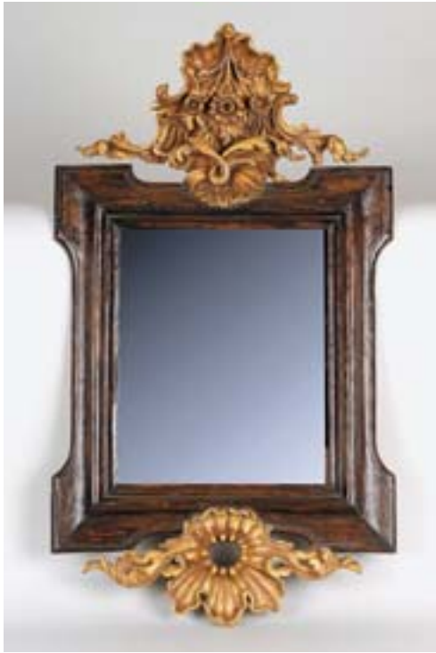
818 ESPELHO RÚSTICO, D. José/D. Maria, moldura em castanho com entalhamentos dourados, português, séc. XVIII, pequenos defeitos, restauros no dourado; Dim. - 78 x 45 cm € 200 - 300