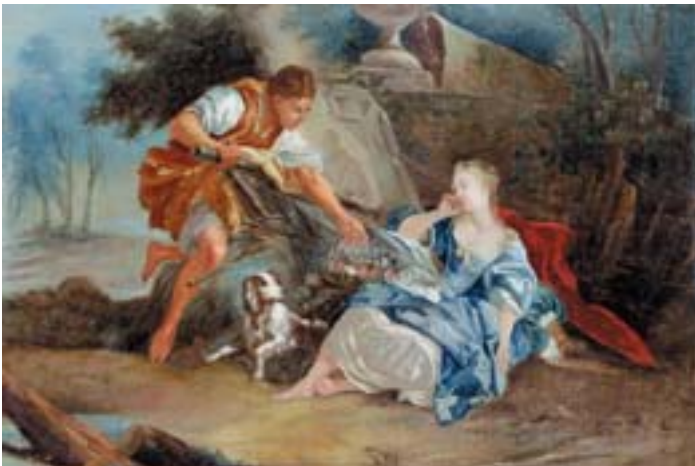
740 "CENA GALANTE", óleo sobre tela, escola francesa, séc. XVIII, reentelado e restaurado Dim. - 62,5 x 94 cm