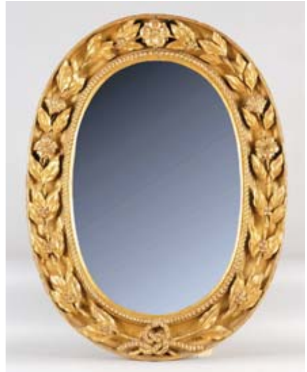
820 ESPELHO OVAL, moldura em madeira entalhada e dourada, vidro bizelado, português, séc. XIX/XX, pequenos defeitos Dim. - 108 x 80 cm € 800 - 1.200