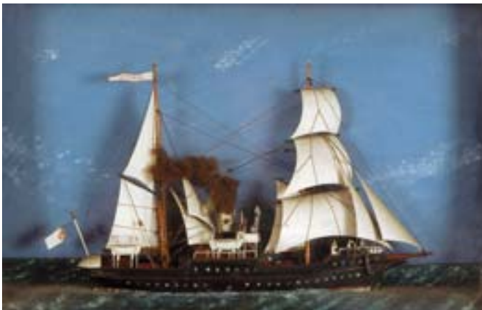
809 "UTILIA - BARCO A VAPOR E À VELA COM PAVILHÃO REAL", maqueta em madeira, emoldurada, portuguesa, séc. XIX, pequenos defeitos Dim. - 41,5 x 50 cm € 1.000 - 1.500