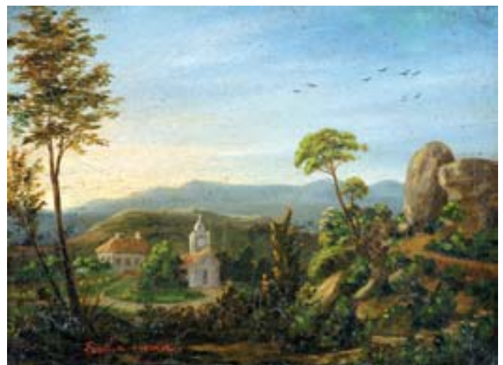
754 "PAISAGENS COM CASARIO E CASCATA", par de óleos sobre tela, escola inglesa, séc. XIX Dim. - 15,5 x 21 cm