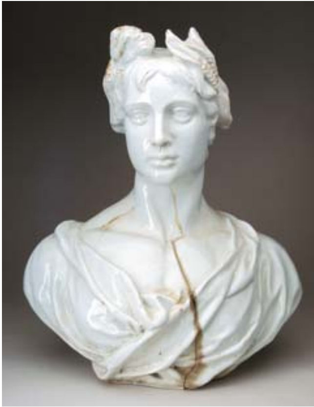
808 "ESTAÇÃO DO ANO", escultura em faiança, decoreção monocroma a branco, portuguesa, séc. XIX, defeito de fabrico e outros pequenos defeitos Dim. - 58 cm € 1.000 - 1.500