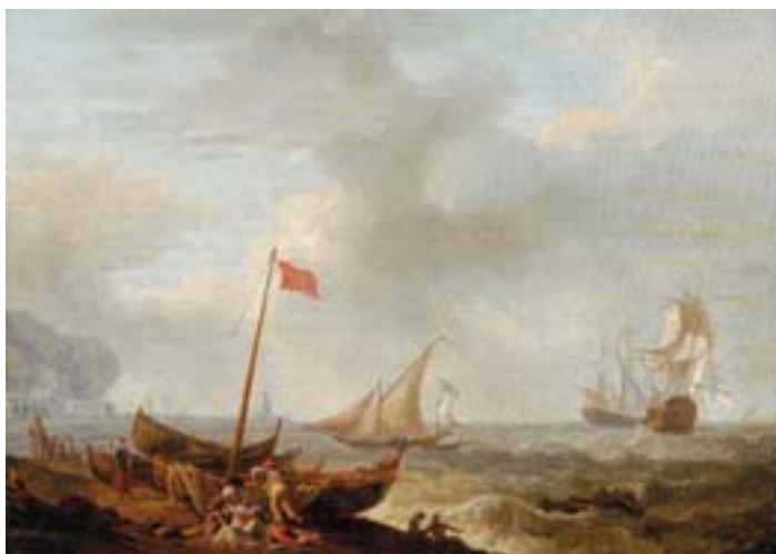
748 OLIVIER LE MAY - 1734-1797, "MARINHA - BARCOS E FIGURAS JUNTO À COSTA", óleo sobre tela colada em madeira, pequenos restauros, assinado; vd. Benezit, vol. 8 p. 489 Dim. - 34 x 45,5 cm