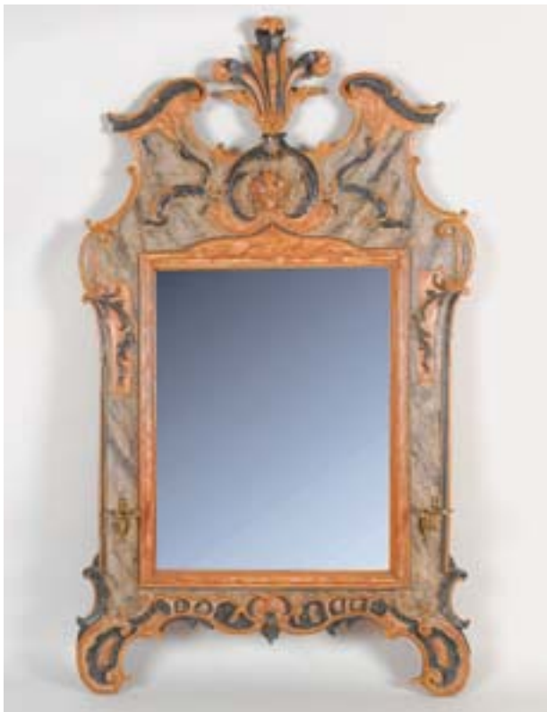
819 ESPELHO, D. José, vinhático entalhado e marmoreado, apliques em metal amarelo, português, séc. XVIII, pequenos defeitos, vidro não original; Dim. - 155 x 87 cm € 500 - 750