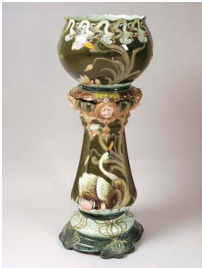
813 CACHEPOT COM COLUNA, Arte Nova, faiança policromada "flores" sobre fundo verde, austríaco, séc. XIX/XX, restauros Dim. - 101 cm € 300 - 450