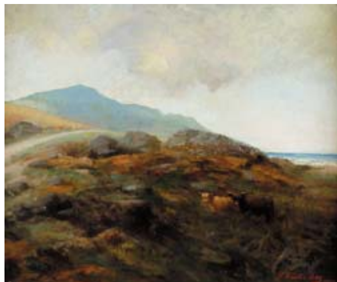
750 WILLIAM HARDIE HAY - SÉC. XIX/XX, "PAISAGEM COM GADO", óleo sobre tela, reentelado e restaurado Benezit, vol. 6, pág. 816 Dim. - 51 x 62 cm