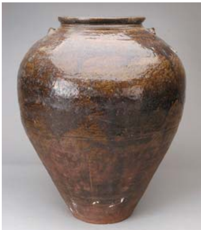
804 POTE DE ESPECIARIAS, grés vidrado, Oriente, séc. XVII Dim. - 54 cm