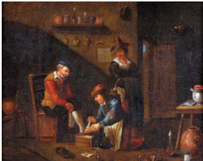
765 ↑ "INTERIOR - CURANDO UM PÉ", óleo sobre tela, escola holandesa, séc. XVII, reentelado, pequenos defeitos Dim. - 35 x 43 cm € 2.000 - 3.000