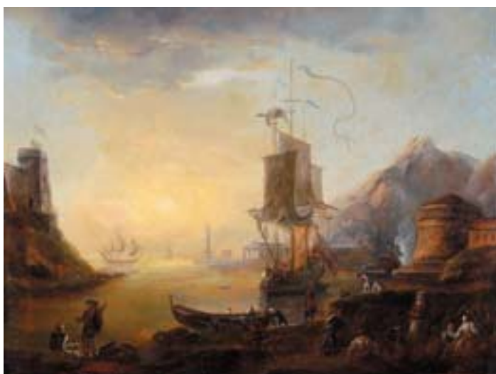
744 "MARINHA - PORTO DE MAR COM FIGURAS", óleo sobre tela, escola francesa, séc. XVIII, reentelado, restauros Dim. - 58 x 76 cm € 4.000 - 6.000