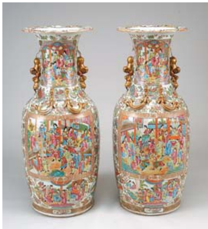
806 PAR DE POTES DE GRANDES DIMENSÕES, porcelana da China, decoreção Mandarin "figuras orientais", séc. XIX, restauro num bordo, falta numa pega; Dim. - 88 cm € 3.000 - 4.500