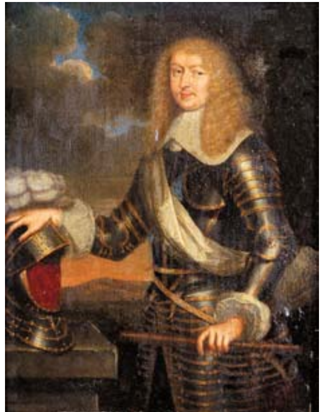
753 "RETRATO DO DUQUE DE LESDIGNIÈRES", óleo sobre madeira, escola francesa, séc. XVII Nota - no verso encontram-se coladas peritagem realizada em França atribuindo a Pierre Mignard e genealogia relacionando o retratado com os Duques de Cadaval e com os Condes de Alvor/Marquesses de Távora Dim. - 34,5 x 26 cm