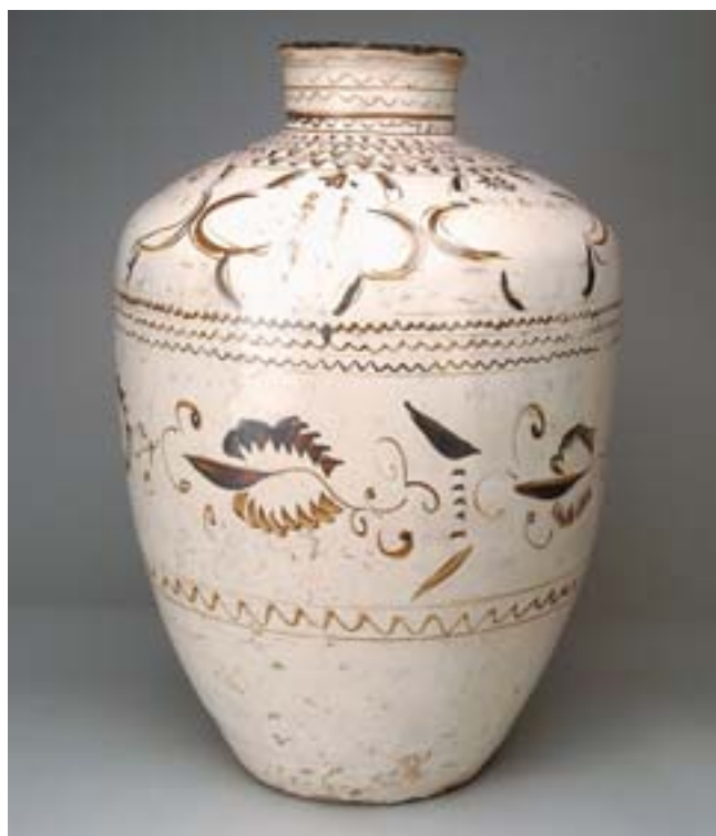
805 POTE, grés vidrado, decoreção a castanho, dinastia Ming, séc. XVI/XVII, pequenas faltas na decoreção Dim. - 65 cm € 1.300 - 1.950