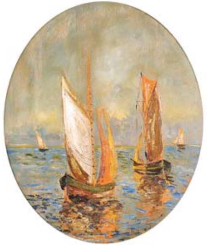
741 H. GERARD - SÉC. XIX/XX, "MARINHA", óleo oval sobre madeira, assinado Dim. - 78 x 66 cm