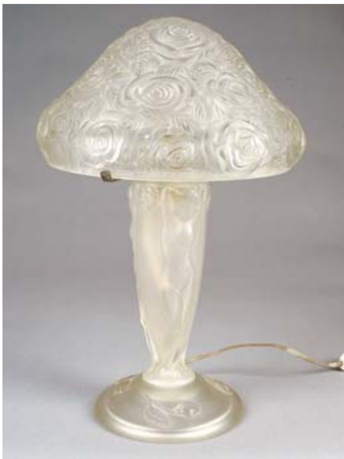
812 CANDEEIRO DE MESA, Arte Nova, fuste e quebra-luz em vidro moldado "nus femininos" e "flores", electrificado, Europa, séc. XX Dim. - 36 cm € 500 - 750