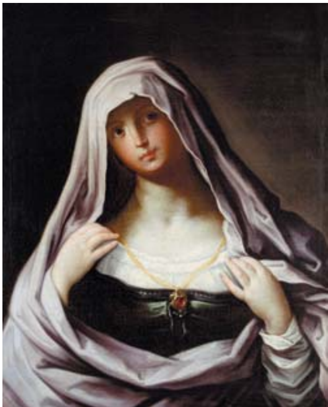
743 "SENHORA COM MANTO", óleo sobre tela, escola flamenga, séc. XVII/XVIII, reentelado e restaurado - etiqueta e carimbo de inventariação com o n o C 392 no verso Dim. - 94 x 76 cm € 3.000 - 4.500