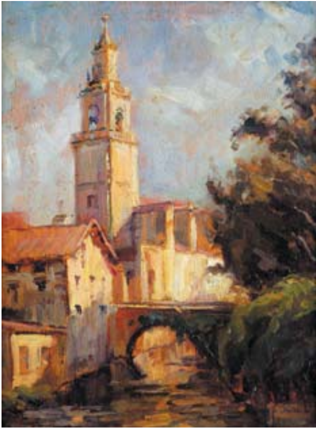
739 "TRECHO DE CIDADE", óleo sobre madeira, escola italiana, séc. XIX/XX, assinatura não identificada Dim. - 35 x 26,5 cm