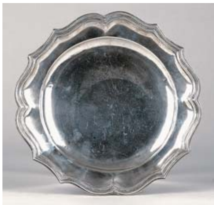
II35 PRATO RECORTADO , prata, contraste de Madrid de 1738, marca de ourives não identificado, espanhol, séc. XVIII, marcas muito sumidas - Nota - ver nota do lote 1139 Dim. - 25 cm, Peso - 494 grs. € 800 - 1.200