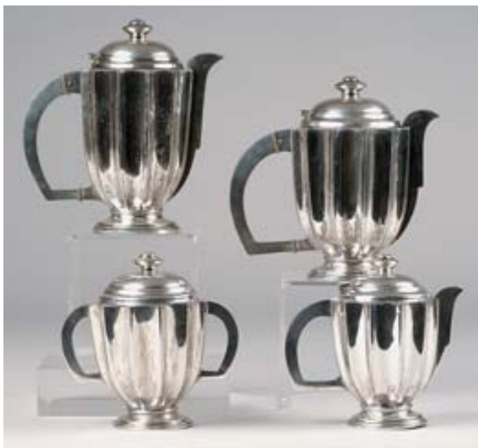
III1 SERVIÇO DE CHÁ E DE CAFÉ, Art Déco, prata, composto por bule, cafeteira, açucareiro e leiteira, contraste Águia do Porto (1887-1937) (Vidal - 49), português, séc. XX, amolgadelas; Dim. - 18 cm; Peso - 1.780 grs. € 1.000 - 1.500