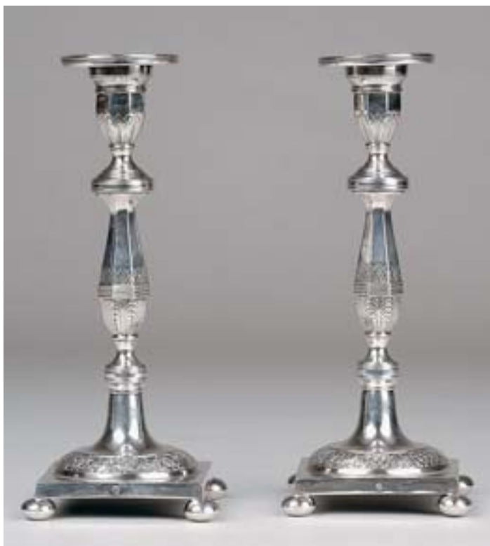
1085 PAR DE CASTIÇAIS , românticos, prata, marca de ensaiador de Lisboa (1822-1843), marca de ourives CRJG (1823-1870) (M. A. - L40 e L180), portugueses, séc. XIX (1ª década); Dim. - 24,5 cm Peso - 990 grs. € 1.500 - 2.250