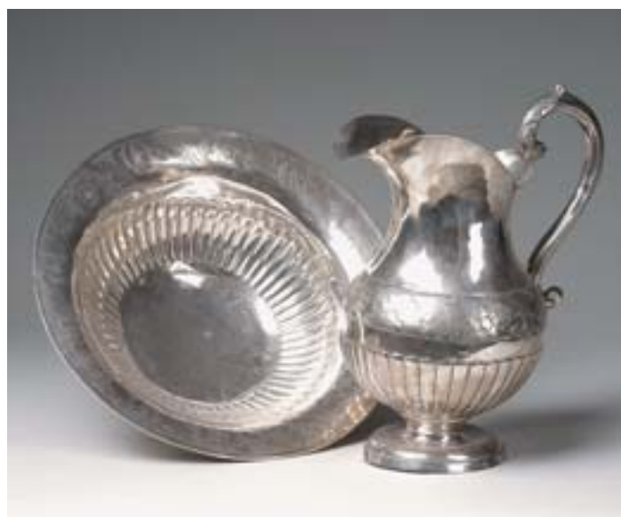
1088 JARRO E BACIA , prata, monogramados, marca de ensaiador do Porto (1853-1861), marca de ourives FLN (M. A. - P45 e P273A), portugueses, séc. XIX, amolgadelas e defeitos; Dim. - 30,5 cm (jarro); 11,5 x 32,5 cm (bacia) Peso - 2.628 grs. € 4.500 - 6.750