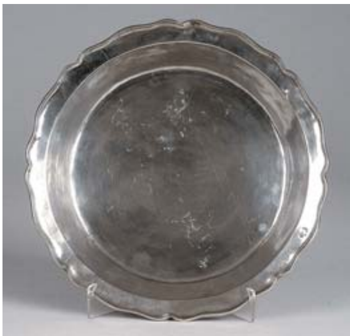
II33 BACIA , prata, bordo recortado, sem marcas, América do Sul, séc. XVII/XVIII Dim. - 28 cm; Peso - 650 grs. € 1.400 - 2.100