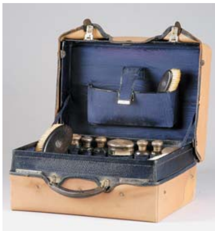
II34 CONJUNTO DE TOILETE , vidro, tampas em prata e cabos de escovas em ébano, composto por 7 frascos e 3 escovas, monogramados, contraste de Londres (1916-1917), marca de ourives "S & Cº", dentro de caixa de viagem, inglês, séc. XIX, faltas D. - 17 x 41 x 33 cm; € 200 - 300