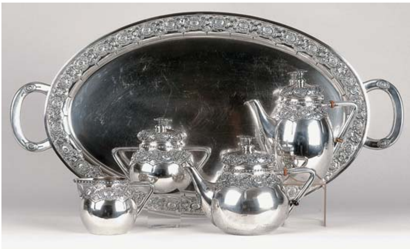
III2 SERVIÇO DE CHÁ E DE CAFÉ, prata, composto por bandeja, bule, cafeteira, açucareiro e leiteira, contraste Águia do Porto (1938-1984),