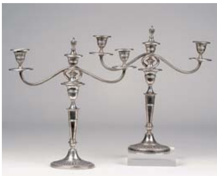
III3 PAR DE CANDELABROS DE TRÊS LUMES, estilo D. Maria, prata, contraste Águia do Porto (1938-1984) (Vidal - 48), portugueses, séc. XX, interior preenchido Dim. - 43 cm € 1.750 - 2.625