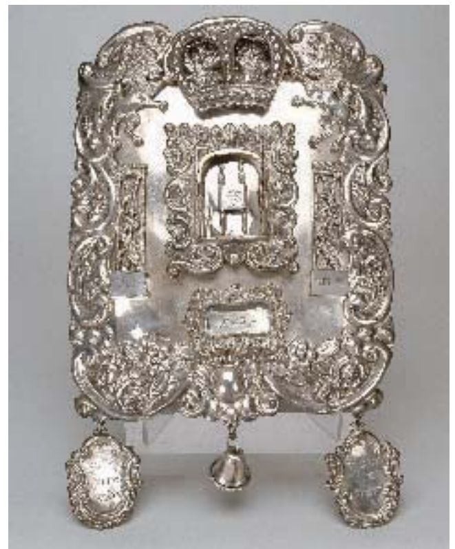
I377 PLACA JUDAICA, prata, americana, séc. XX, ligeira amolgadela, marcada Dim. - 39,5 x 28,5 cm € 2.100 - 3.150