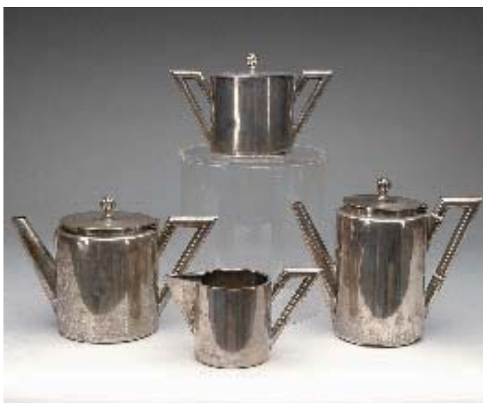
II71 SERVIÇO DE CHÁ E DE CAFÉ , Art Déco, prata, composto por bule, cafeteira, açucareiro e leiteira, contraste Águia de Lisboa (1938-1984), marca da ourivesaria GUIA (Vidal - 65), português, séc. XX, amolgadelas Dim. - 16 cm; Peso - 1.730 grs. € 800 - 1.200