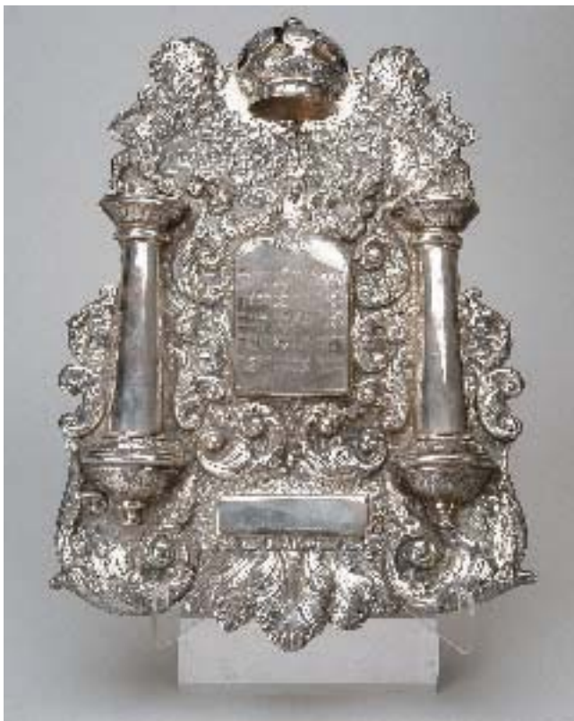
I376 PLACA JUDAICA, prata, contraste de Londres (1915-1916), marca de ourives JR, inglesa, séc. XX, pequena falta na coroa Dim. - 34,5 x 22,5 cm € 2.100 - 3.150