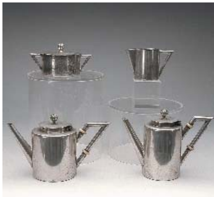
II73 SERVIÇO DE CHÁ E DE CAFÉ , Art Déco, prata, composto por bule, cafeteira, açucareiro e leiteira, contraste Javali de Lisboa (1887-1937), marca de ourives LEITÃO & IRMÃO (Vidal - 72 e 635), português, séc. XIX/XX, amolgadelas Dim. - 12 cm; Peso - 867 grs. € 500 - 750