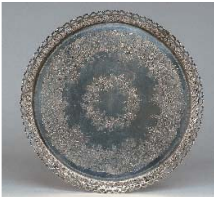
II53 SALVA DE GRADINHA , prata, fundo gravado, marca de ensaiador do Porto (1856-1861), marca de ourives DPC (1836-1861) (M. A. - P46 e P254), portuguesa, séc. XIX Dim. - 36,5 cm; Peso - 1.322 grs. € 1.000 - 1.500