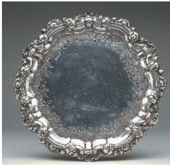
II55 SALVA DE TRÊS PÉS , D. José, prata, marca de ensaiador do Porto (1784-1790), marca de ourives GS (1768-1804) (M. A. - P15 e P293), portuguesa, séc. XVIII, remarcada com "cabeça de velho" Dim. - 21 cm; Peso - 280 grs. € 700 - 1.050