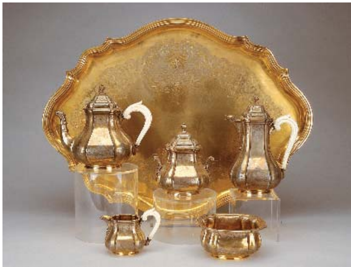
1388 SERVIÇO DE CHÁ E DE CAFÉ, prata vermeil, composto por bule, cafeteira, açucareiro, taça de pingos e leiteira, pegas em marfim, marca de ourives A. AUCOC, francês, séc. XIX/XX, bandeja em cobre dourado Dim. - 23, 5 x 69 x 51, 5 cm Peso - 3.380 grs. € 2.500 - 3.750