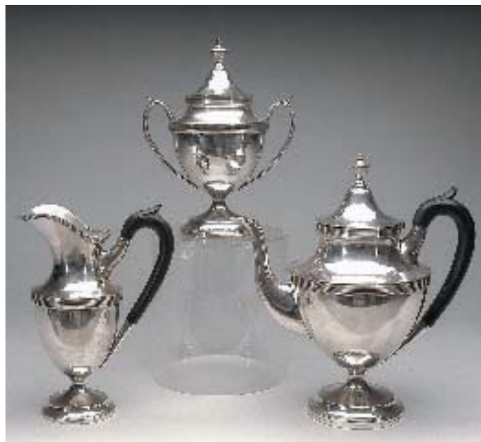
II72 SERVIÇO DE CHÁ , estilo D. Maria, prata, composto por bandeja, bule, açucareiro e leiteira, contraste Águia de Lisboa (1938-1984) (Vidal - 48), português, séc. XX; Dim. - 26,5 cm Peso - 1.880 grs. € 900 - 1.350