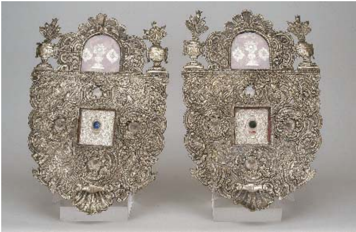
I375 PAR DE RELICÁRIOS, folha de latão prateado, portugueses

séc. XVIII, pequenos defeitos Dim. - 51 x 33 cm