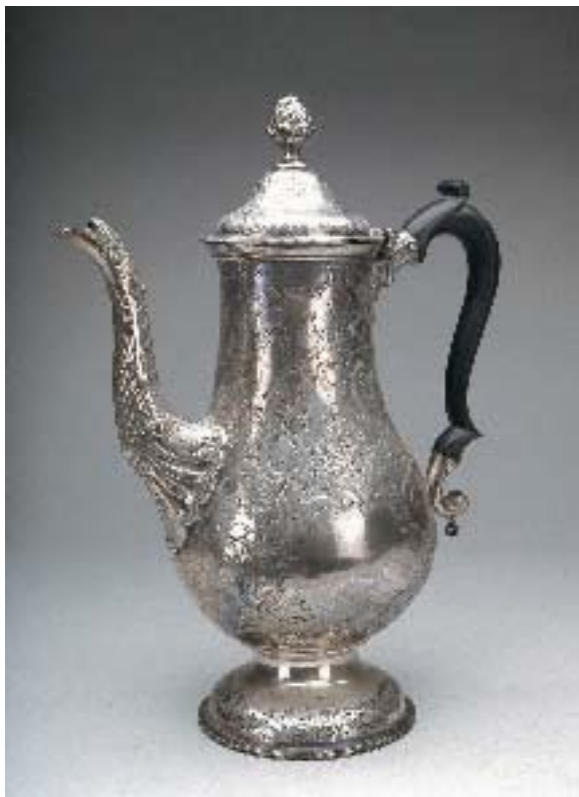
1387 CAFETEIRA, prata, contraste de Dublin, irlandesa, séc. XVIII/XIX Dim. - 31 cm; Peso - 1.111 grs. € 1.000 - 1.500