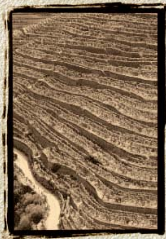
Região Vinícola do Alto Douro Património Mundial UNESCO 2001