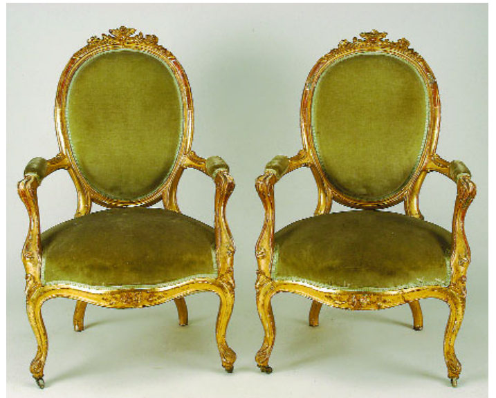
750 PAR DE FAUTEUILS ESTILO LUÍS XV, madeira dourada, estofados a veludo verde, franceses, séc. XIX, faltas e defeitos Dim. - 104 x 63 x 66 cm