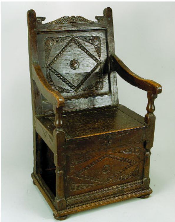
764 CADEIRA DE BRAÇOS, carvalho, assento de levantar com arca, inglesa, séc. XIX, faltas e defeitos Dim. - 104 x 60 x 55 cm