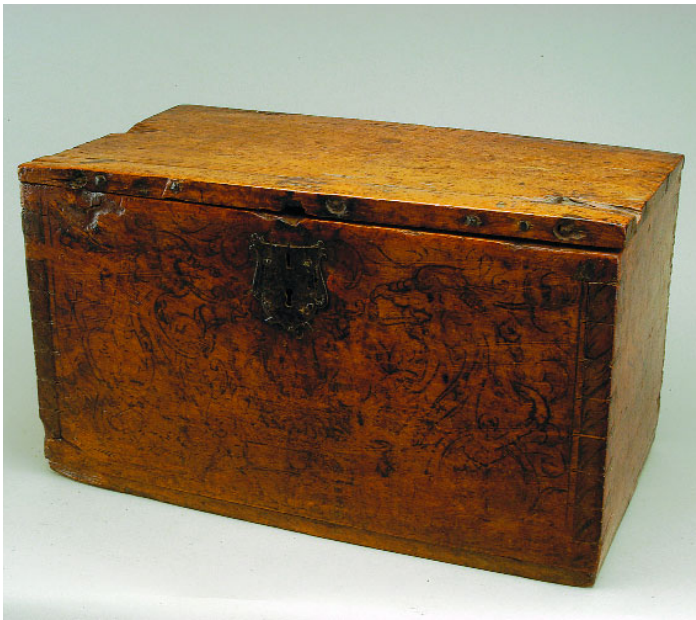
752 ARCA DE PEQUENAS DIMENSÕES, cedro ou zimbro pintado, Açores, séc. XVI, datada de 1597, faltas e defeitos Dim. - 32 x 56 x 31 cm € 2.500 - 3.750