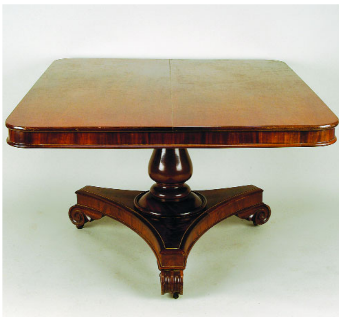
765 MESA VICTORIANA, mogno e raiz de mogno, tampa rectangular basculante, pé central, inglesa, séc. XIX, pequenos defeitos Dim. - 72,5 x 132 x 112 cm