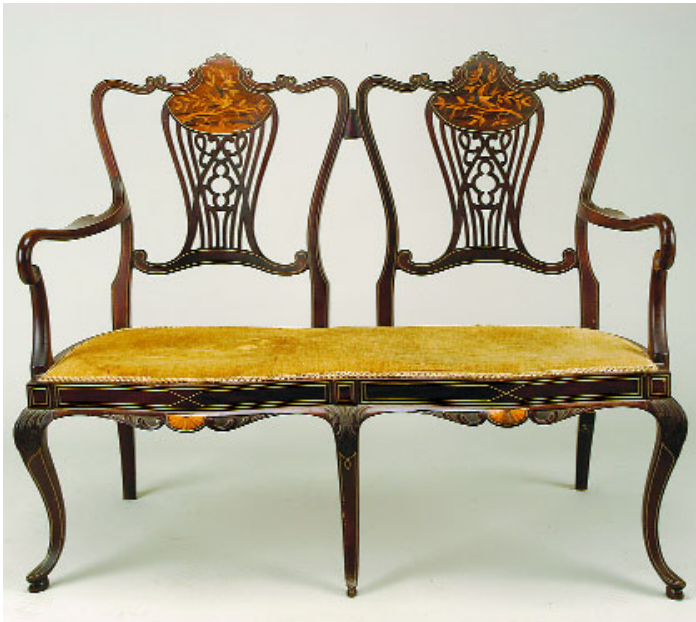
748 CANAPÉ EDUARDIANO DE DOIS LUGARES, mogno com embutidos, filetes em marfim, inglês, séc. XIX/XX, faltas e defeitos Dim. - 105 x 129,5 x 54 cm