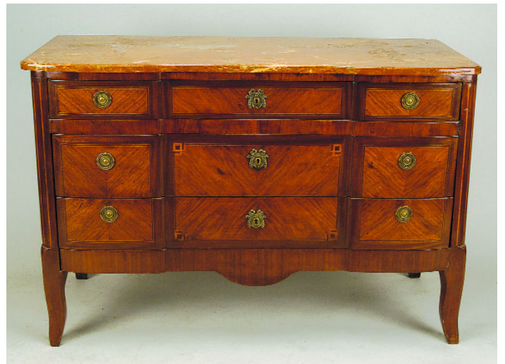
751 CÓMODA ESTILO LUÍS XV, mogno com embutidos, tampo de mármore, francesa, séc. XIX/XX, pequenos defeitos Dim. - 84 x 125 x 53 cm