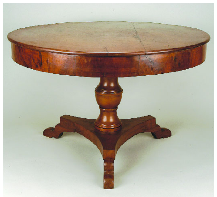
767 MESA DE TAMPO REDONDO, mogno, coluna central com três pés, portuguesa, séc. XIX, pequenos defeitos Dim. - 80 x 115 cm