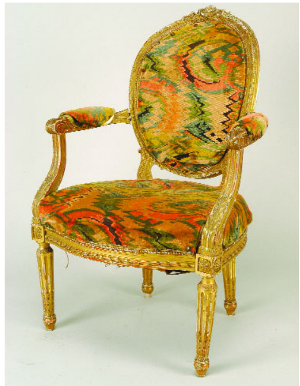
766 FAUTEUIL ESTILO LUIS XVI, madeira entalhada e dourada, assento e costas estofados, francês, séc. XIX, defeitos e estofado não original Dim. - 93 x 60 x 58 cm