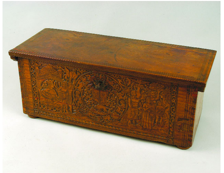
754 ARCA RENASCENTISTA, cedro, decoração relevada e pintada a negro "paisagem com figuras" e "armas de família", séc. XVI, pequenos defeitos Dim. - 32,5 x 80,5 x 31 cm € 2.000 - 3.000