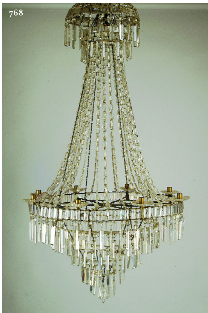
768 LUSTRE DE SACO, cristal com pingentes, séc. XIX, faltas e defeitos Dim. - 143 cm