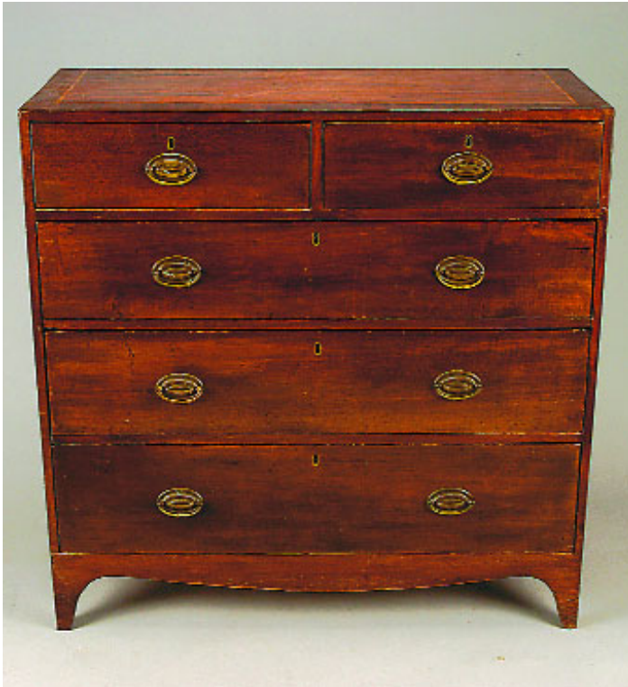
753 CÓMODA, mogno com filetes, estilo Jorge III, inglesa, séc. XIX, pequenos restauros e defeitos Dim. - 101 x 100 x 44 cm € 800 - 1.200