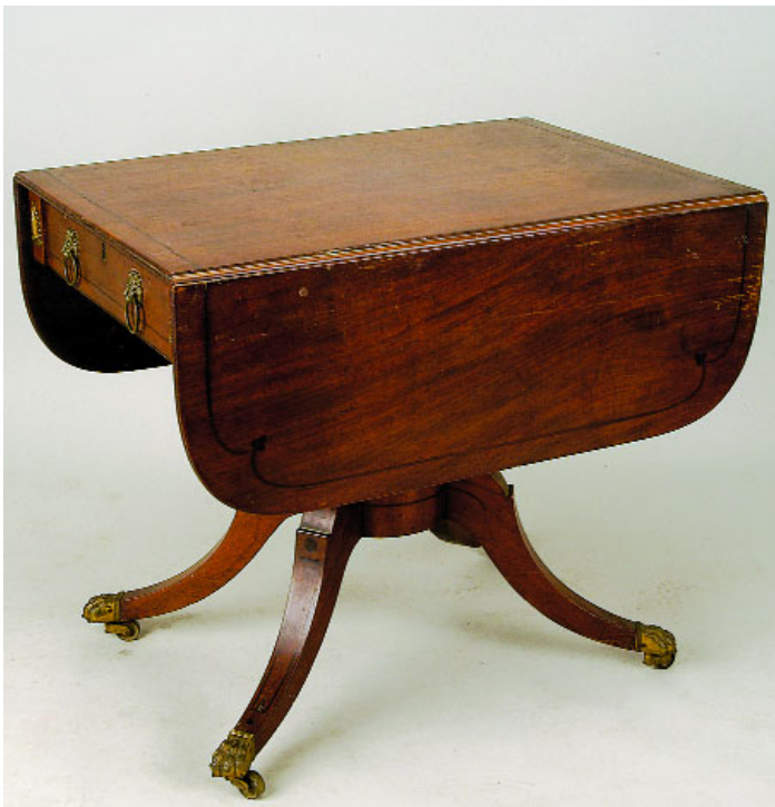
749 MESA DE ABAS ESTILO JORGE III, mogno com filete de pau santo, coluna central com quatro pés, inglesa, séc. XIX, pequenas faltas e defeitos Dim. - 72,5 x 59 x 84 cm