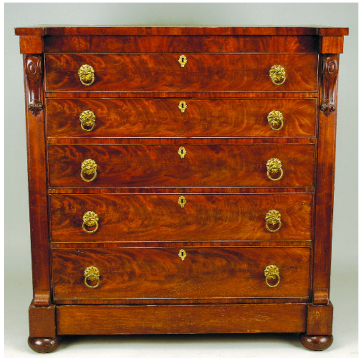
755 CÓMODA DE GRANDES DIMENSÕES, mogno e raiz de mogno, victoriana, inglesa, séc. XIX, pequenos defeitos Dim. - 134,5 x 130 x 63 cm € 1.500 - 2.250