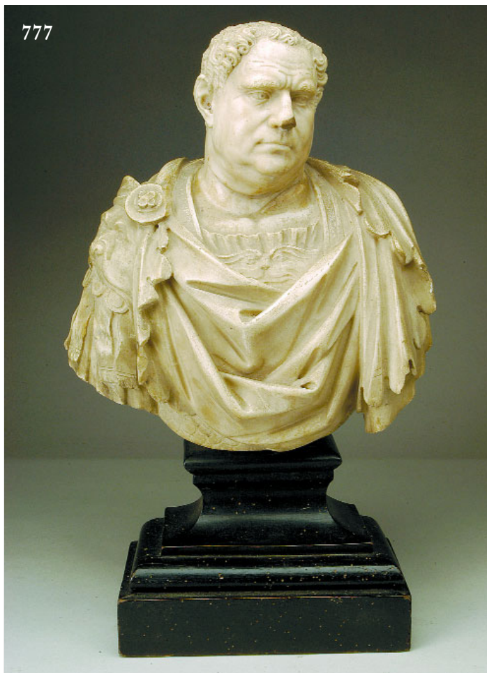
777 "BUSTO DE ROMANO", escultura em mármore, séc. XVIII, defeito no nariz Dim. - 56 cm