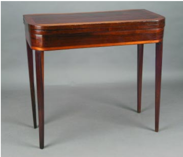
392 MESA DE JOGO D. MARIA EM PAU SANTO COM FAIXAS DE PAU CETIM , portuguesa, séc. XVIII/XIX, pequenos defeitos Dim. - 80 x 87,5 x 44 cm