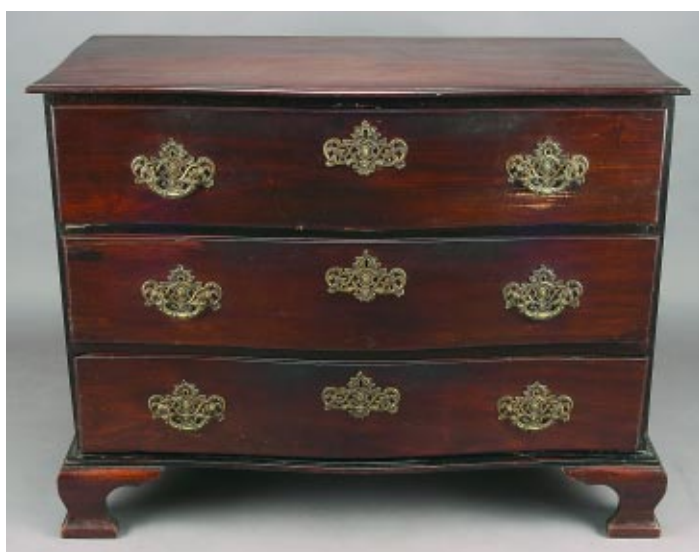
413 CÓMODA D. MARIA EM VINHÁTICO COM BARRIGA, portuguesa, séc. XVIII, pequenos defeitos Dim. - 93 x 122 x 63 cm