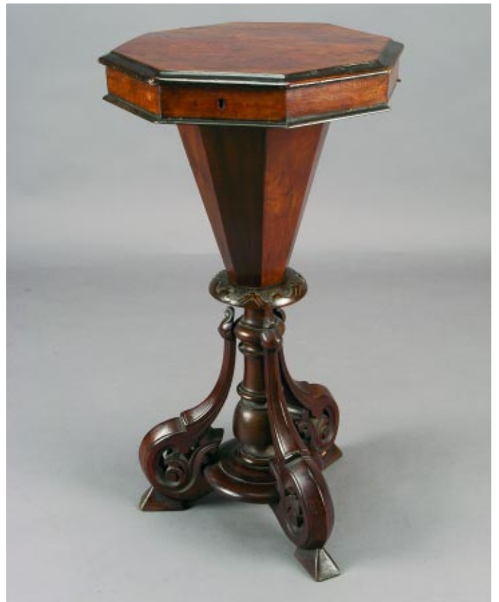
401 COSTUREIRA ROMÂNTICA OITAVADA EM NOGUEIRA E RAIZ DE NOGUEIRA COM ENTALHAMENTOS, inglesa, séc. XIX, pequenas faltas e defeitos Dim. - 80 x 42 cm