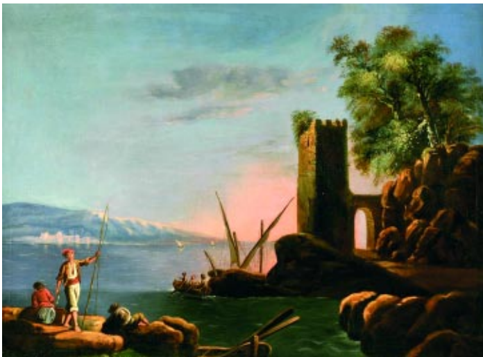
478 "PORTO DE MAR COM TORRE E PESCADORES" óleo sobre tela, escola francesa, séc. XVIII, reentelado e pequenos restauros Dim. - 63 x 84 cm