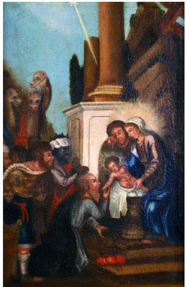
485 "NOSSA SENHORA COM O MENINO" , óleo sobre tela, Europa de Leste, séc. XVIII/XIX, pequenos restauros Dim. - 33,5 x 20 cm € 500 - 750