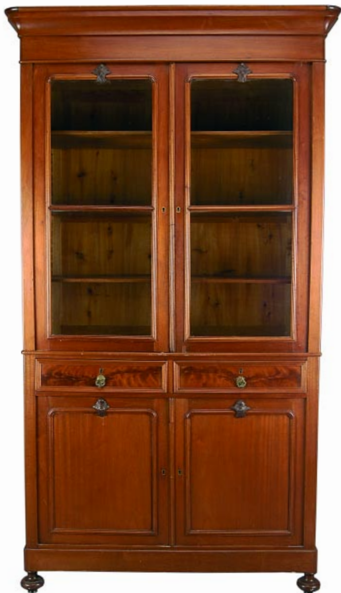
403 LOUCEIRO ROMÂNTICO EM MOGNO, corpo superior com vidros, português, séc. XIX/XX, pequenos defeitos Dim. - 218,5 x 121 x 55,5 cm € 1.500 - 2.250