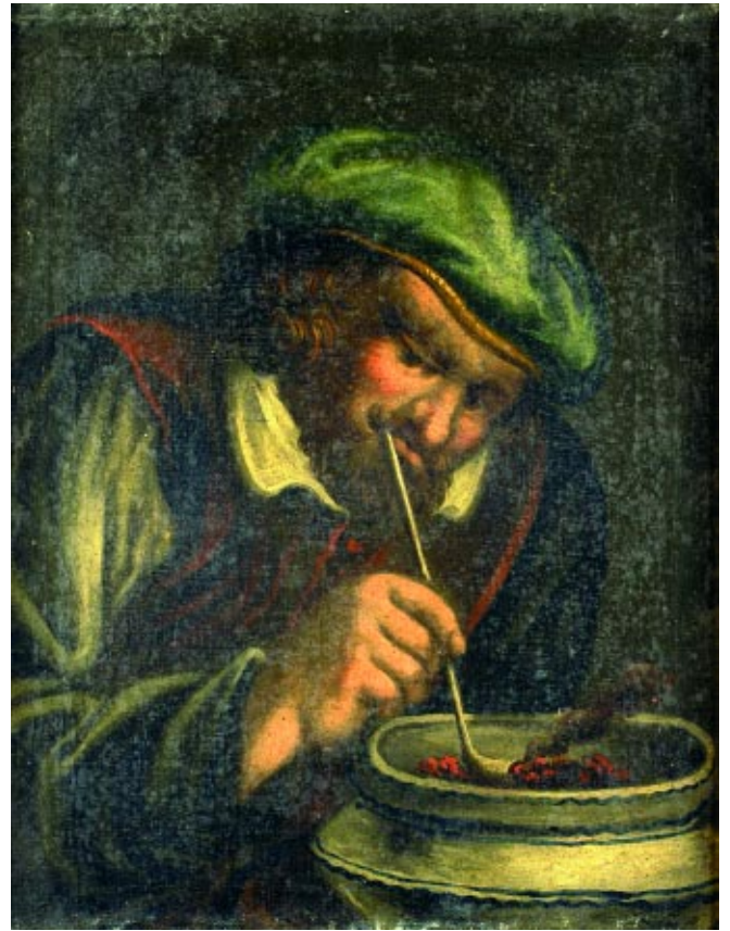
479 "FUMADOR" E "BEBEDOR" par de óleos sobre tela, escola holandesa, séc. XIX, pequenos restauros Dim. - 49 x 38 cm