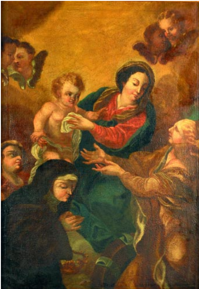
481 "ADORAÇÃO DE NOSSA SENHORA COM O MENINO" , óleo sobre tela, escola portuguesa, séc. XVIII, pequenos restauros e pequeno rasgão Dim. - 108 x 76 cm € 1.200 - 1.800