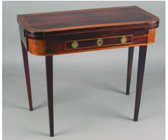
394 MESA DE JOGO D. MARIA EM PAU SANTO E ESPINHEIRO , com gaveta, portuguesa, séc. XVIII/XIX, pequenas faltas e defeitos Dim. - 75 x 89 x 43 cm