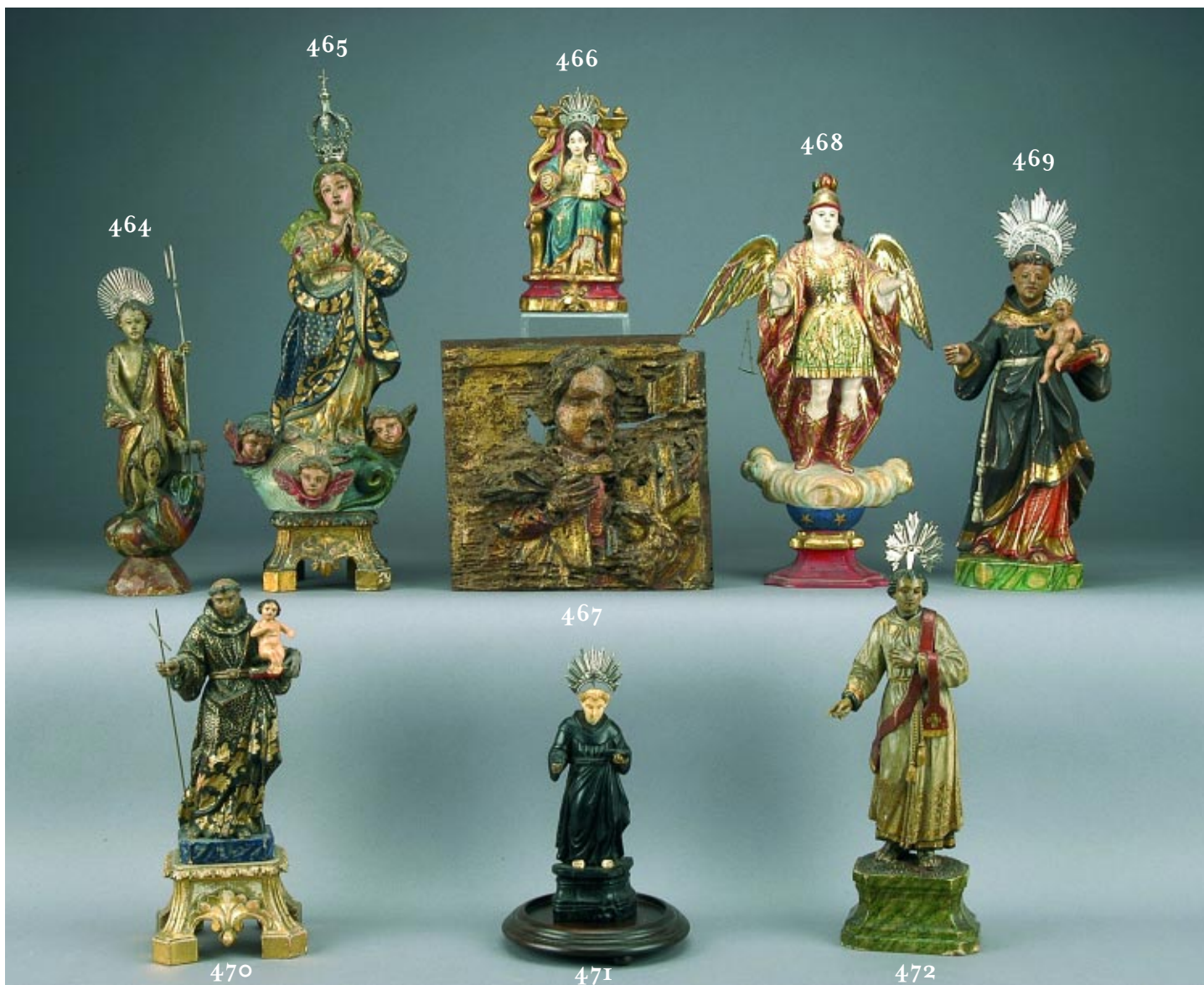
464 "SÃO JOÃO BAPTISTA" escultura em madeira policromada, resplendor e vara em prata, portuguesa, séc. XVIII, pequenos defeitos Dim. - 27,5 cm € 400 - 600