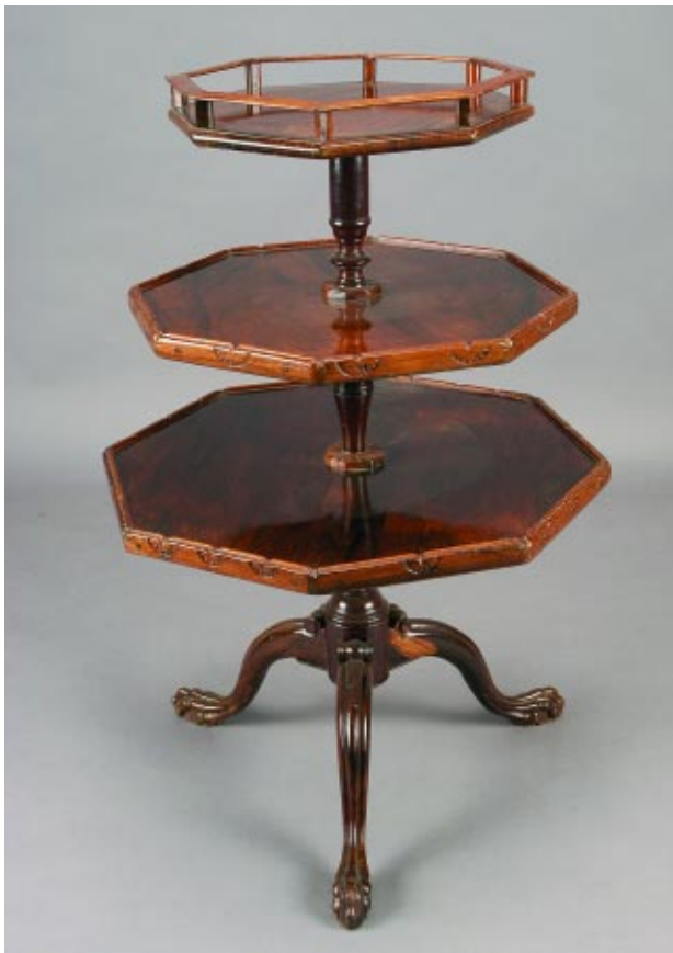
399 DUMB-WAITER ESTILO JORGE II EM PAU SANTO, com três tampos oitavados e gradinha no superior, português, séc. XIX, pequenos restauros e defeitos Dim. - 90 x 61,5 cm