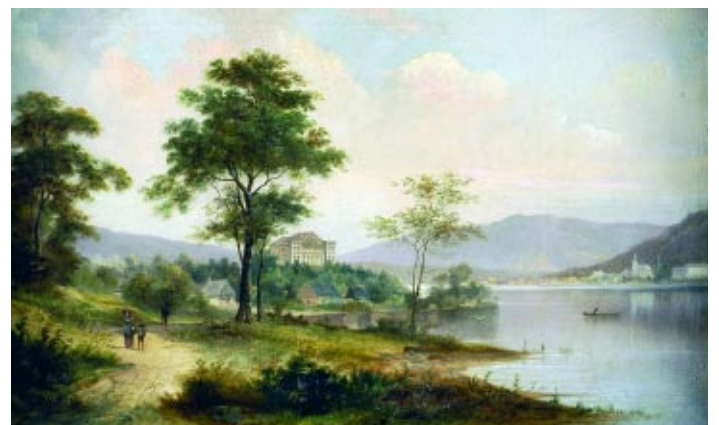
480 R. VOLANI - SÉC. XIX "Paisagem com palácio, casario, rio e figuras", óleo sobre tela, assinado Dim. - 42,5 cm 68,5 cm