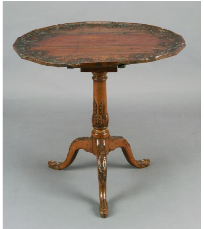
393 MESA DE PÉ DE GALO EM NOGUEIRA COM ENTALHAMENTOS , portuguesa, séc. XVIII, restauros, faltas e defeitos Dim. - 70 x 73,5 cm