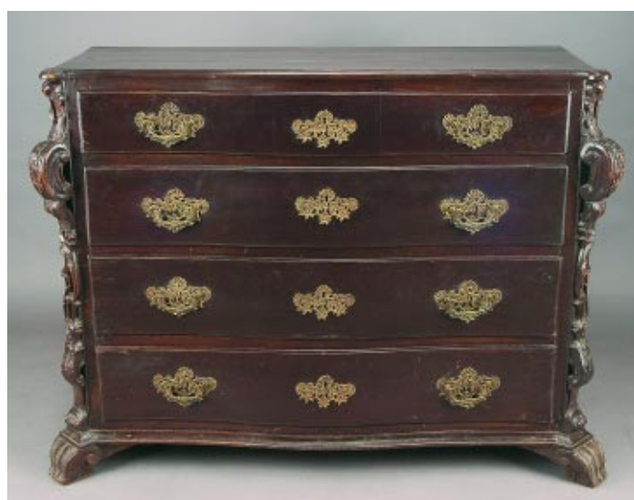
415 CÓMODA D. JOSÉ EM VINHÁTICO COM ENTALHAMENTOS, portuguesa, séc. XVIII, pequenos defeitos Dim. - 98 x 139 x 62 cm