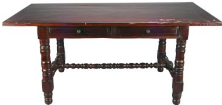
400 MESA RÚSTICA EM CASTANHO COM DUAS GAVETAS, portuguesa, séc. XVII, restauros, faltas e defeitos Dim. - 73,5 x 166,5 x 80 cm