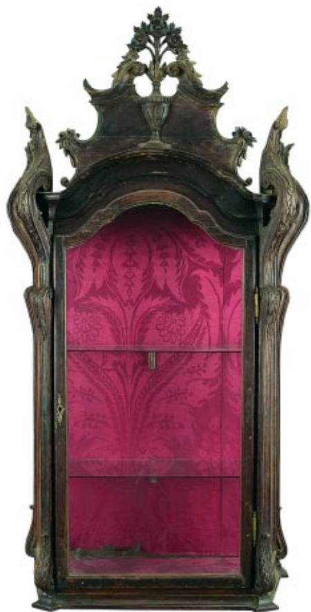
412 ORATÓRIO D. JOSÉ EM PAU SANTO COM ENTALHAMENTOS, português, séc. XVIII, faltas e defeitos, adaptado a vitrine Dim. - 145 x 66 x 34 cm