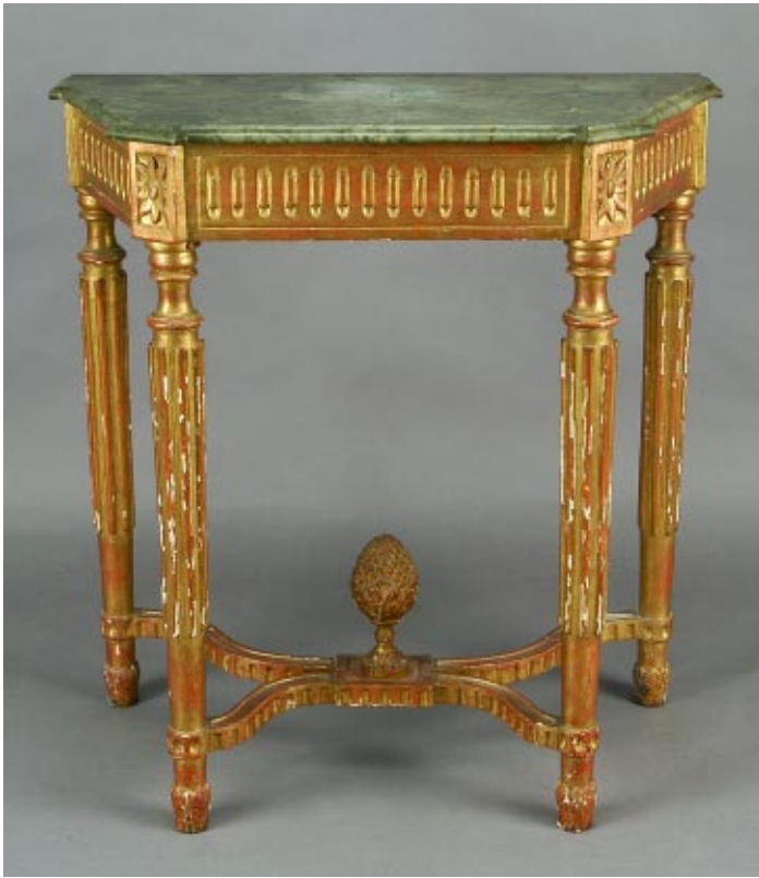
391 CONSOLE ESTILO D. MARIA EM MADEIRA ENTALHADA E DOURADA , tampo em mármore, portuguesa, séc. XIX, faltas no dourado, pequenos defeitos Dim. - 86,5 x 84 x 44,5 cm