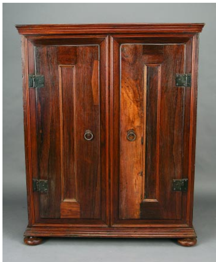
414 ARMÁRIO DE PEQUENAS DIMENSÕES EM PAU SANTO, português, séc. XVIII, pequenos restauros e defeitos Dim. - 121 x 97 x 25 cm