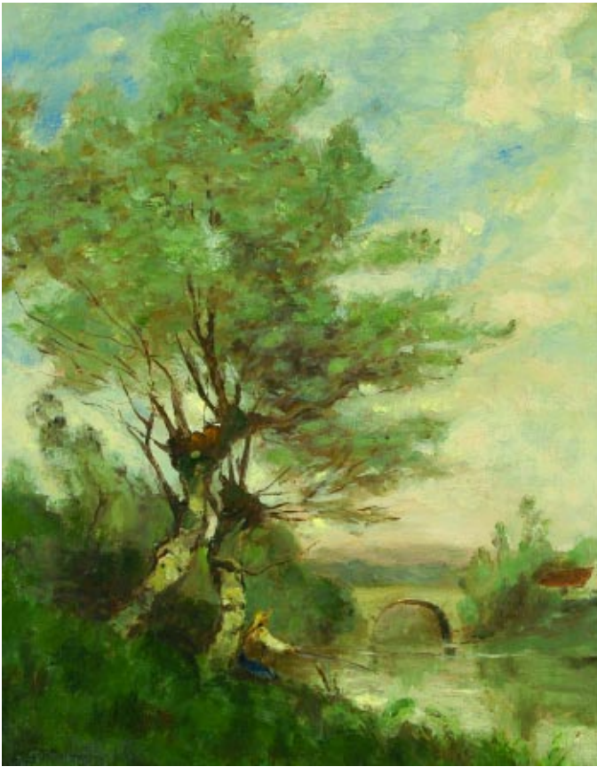
477 A. GUILLAUMET - SÉC. XIX/XX "Paisagem com rio, ponte e pescador", óleo sobre cartão, assinado Dim. 41 x 32,5 cm