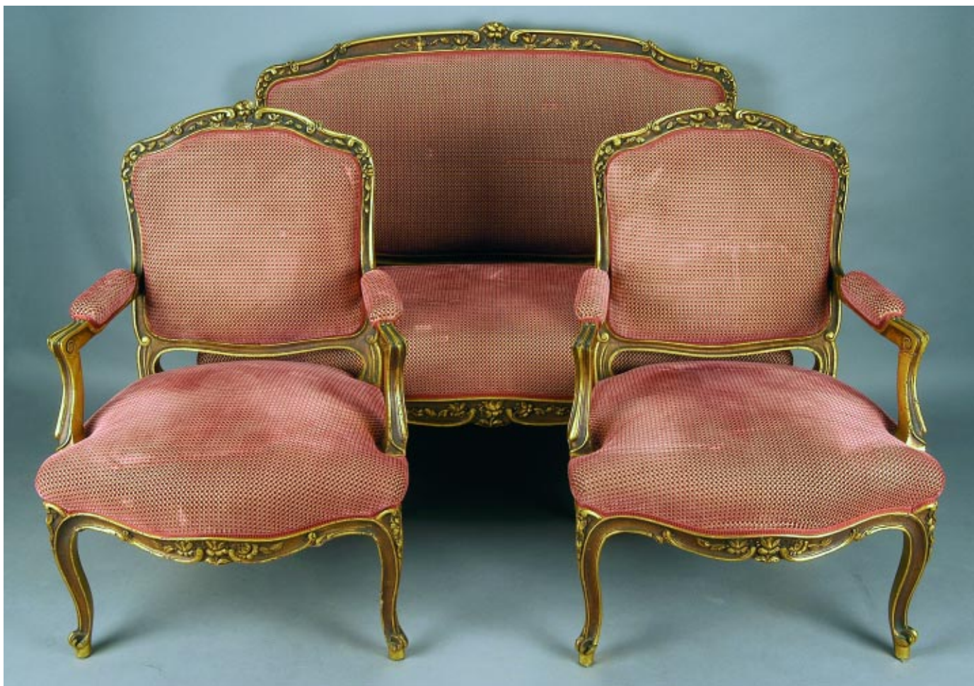
395 CONJUNTO DE CANAPÉ E PAR DE FAUTEUILS ESTILO LUÍS XV EM MADEIRA ENTALHADA E DOURADA, estofados a tecido, séc. XIX/XX, pequenos defeitos e estofos não original Dim. - 105,5 x 132 x 60 cm (canapé) € 1.200 - 1.800