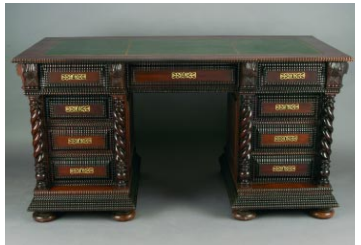
402 SECRETÁRIA DE TORCIDOS E TREMIDOS EM PAU SANTO, tampo forrado a couro com dourados, portuguesa, séc. XIX/XX, pequenos defeitos Dim. - 80 x 151 x 73,5 cm