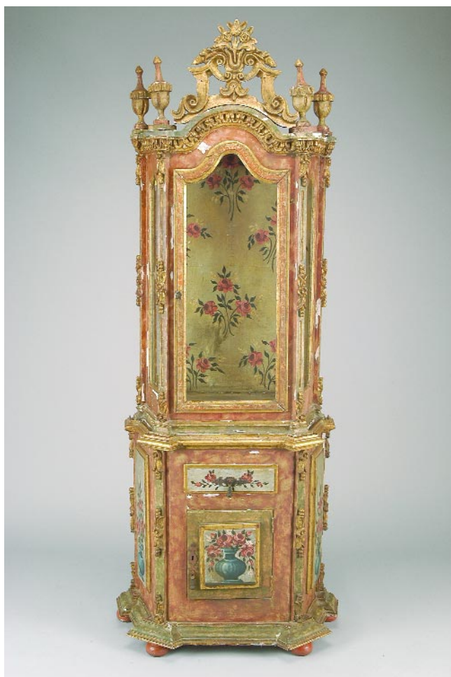
784 ORATÓRIO D. JOSÉ/ D. MARIA EM MADEIRA ENTALHADA E PINTADA, português, séc. XVIII, base posterior, faltas, defeitos e pintura posterior Dim. - 186 x 66 x 43 cm