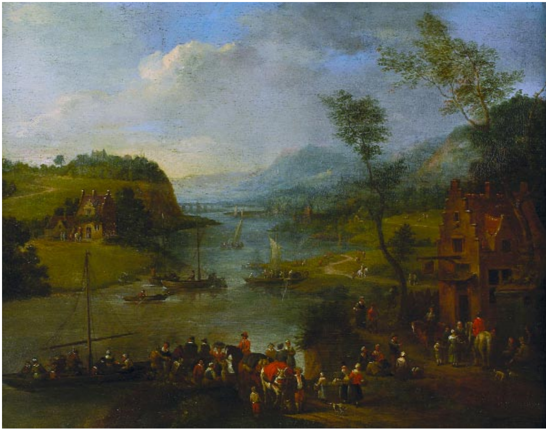
745 "PORTOS DE MAR COM FIGURAS" par de óleos sobre madeira,

escola holandesa, séc. XVIII, pequenos restauros Dim. - 44 x 56 cm