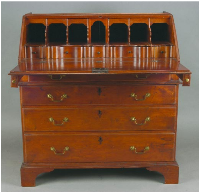
501 PAPELEIRA ESTILO D. MARIA EM CEREJEIRA, portuguesa, séc. XIX, restauros e pequenos defeitos Dim. - 101 x 97 x 50 cm