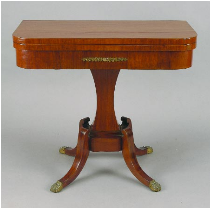
500 MESA DE JOGO EM VINHÁTICO COM COLUNA E PÉ CENTRAL, portuguesa, séc. XIX, pequenos defeitos Dim. - 78 x 87 x 43 cm