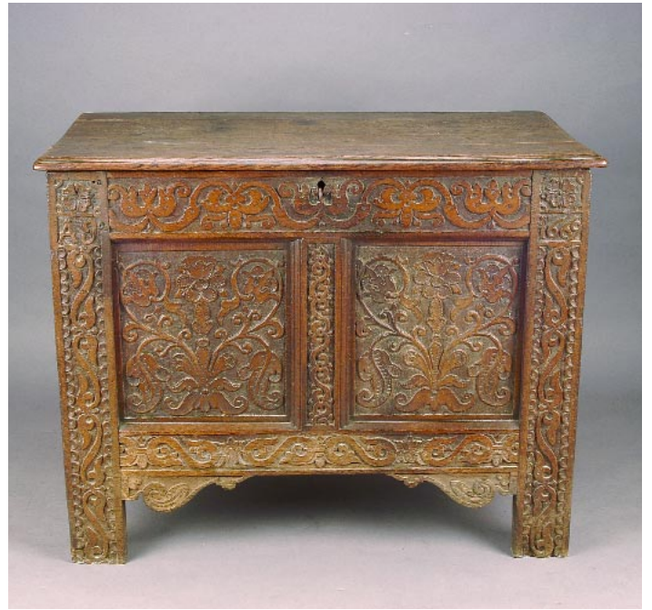
503 ARCA EM CARVALHO COM ENTALHAMENTOS, inscrição "AG" e datada de 1669, inglesa, séc. XVII, tampo posterior e com tábuas soltas Dim. - 75 x 97 x 52 cm