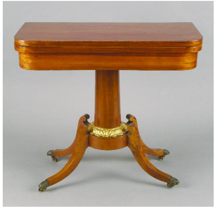
502 MESA DE JOGO EM MURTA COM COLUNA E PÉ CENTRAL, entalhamentos dourados, portuguesa, séc. XIX, pequenos defeitos Dim. - 78 x 86 x 42 cm