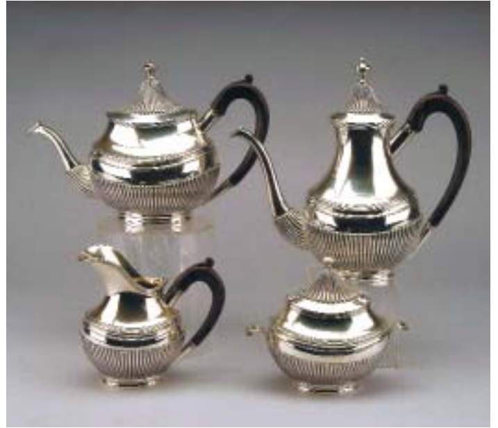
1750 SERVIÇO DE CHÁ E DE CAFÉ ESTILO D. MARIA EM PRATA PORTUGUESA, composto por bule, cafeteira, leiteira e açucareiro, séc. XX, contraste Águia do Porto (1938-1984), marca da ourivesaria "Mergulhão" (Vidal - 46) Dim. - 26,5 cm; Peso - 3.226 grs.