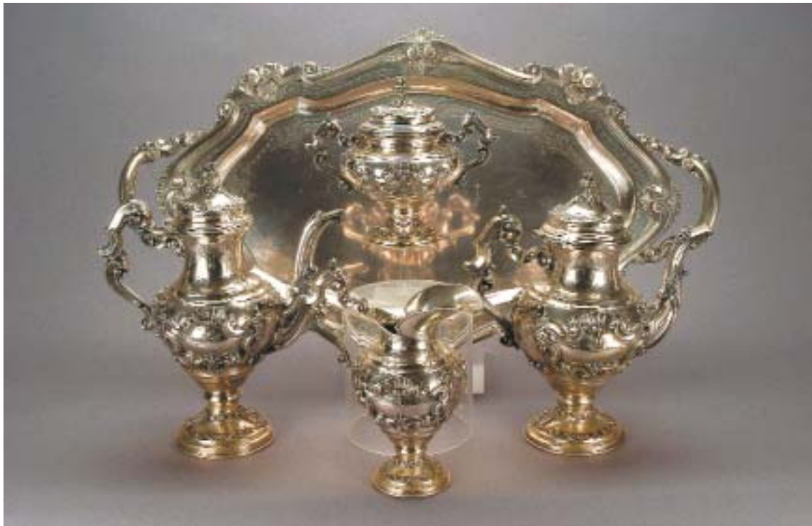
1749 SERVIÇO DE CHÁ E DE CAFÉ ESTILO D. JOÃO V EM PRATA PORTUGUESA, composto por bandeja, bule, cafeteira, açucareiro e leiteira, séc. XIX/XX, contraste Javali do Porto (1887-1937), marca da ourivesaria "Reis - Porto" (Vidal - 72) Dim. - 32,5 (cafeteira) - 76,5 x 45,5 cm (bandeja) Peso - 7.260 grs.