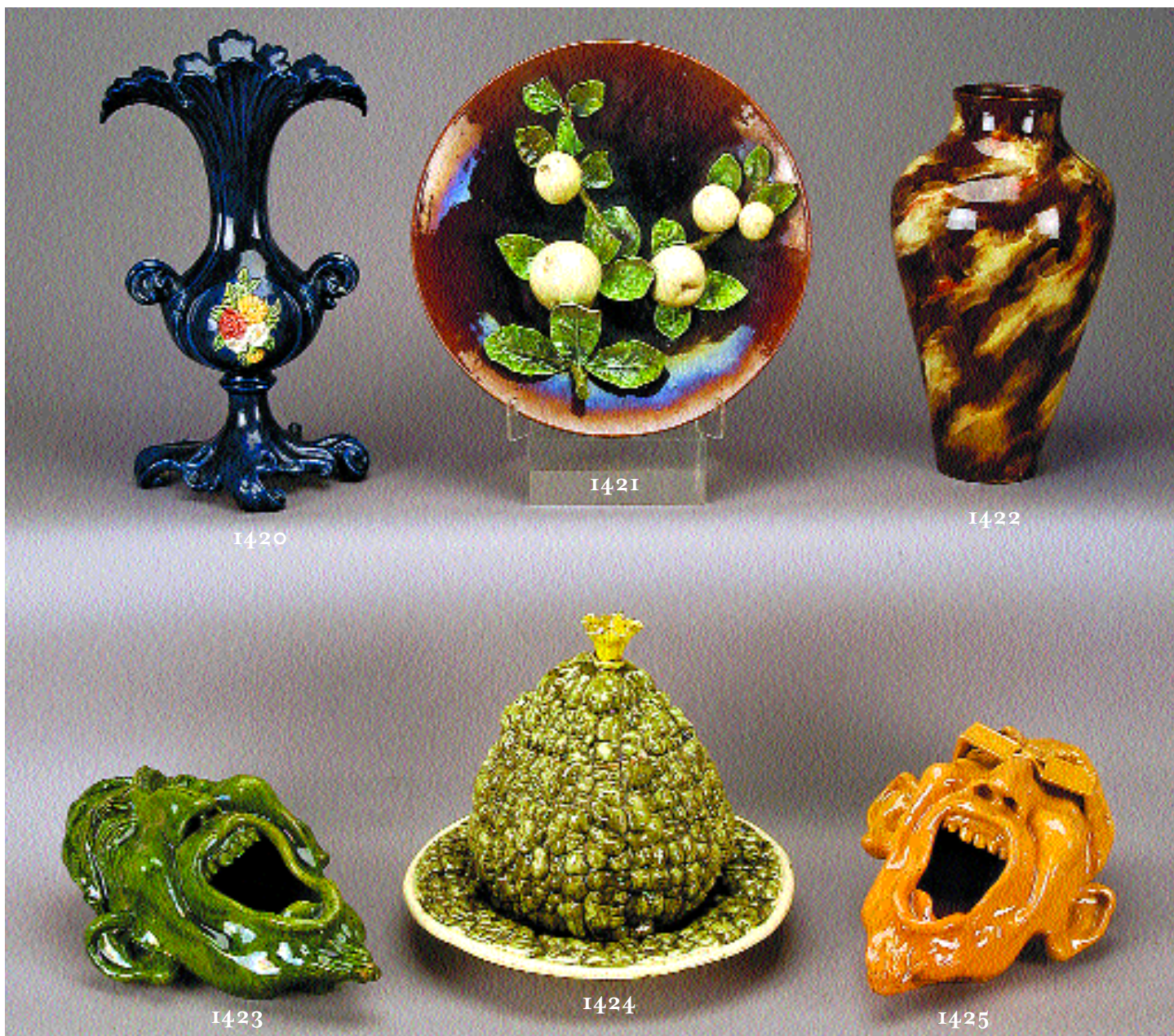
I420 JARRA EM FAIANÇA DAS CALDAS, decoração monocroma a azul com flores policromadas em relevo, séc. XX, restauro, marcada FÁBRICA DE FAIANÇAS ARTÍSTICAS BORDALO PINHEIRO - vd. Simas & Isidro , nº 108 Dim. - 41 cm € 300 - 450