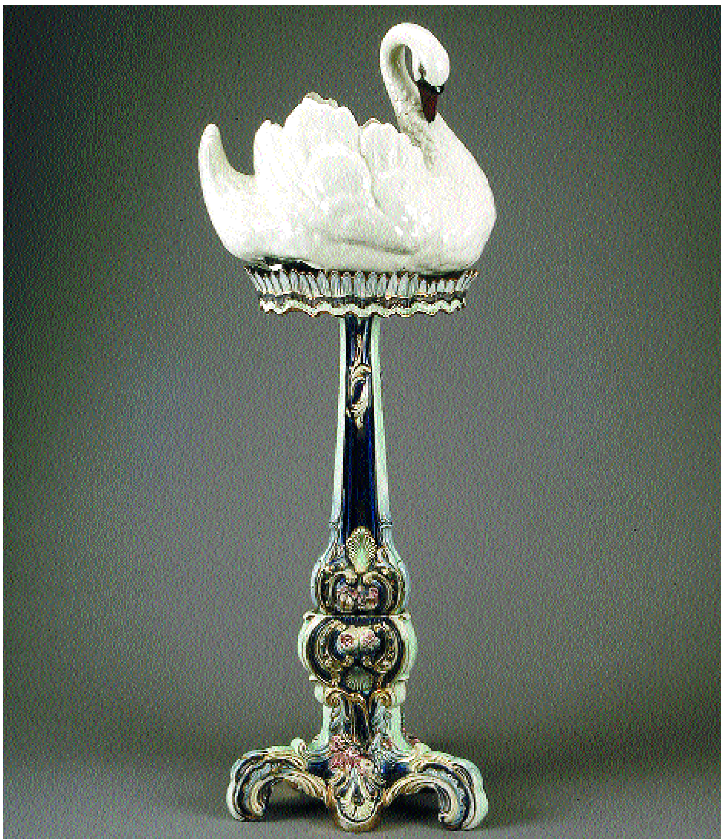
1510 COLUNA COM FLOREIRA "CISNE" ARTE NOVA EM LOIÇA, decoreção policromada e dourada, séc. XIX/XX, um pé da coluna e patas do cisne partidos Dim. - 123 cm