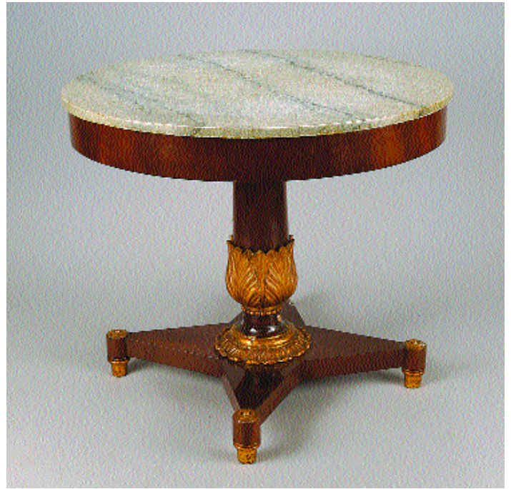
I356 MESA REDONDA EM MOGNO, pé central com entalhamentos dourados, tampo em mármore, portuguesa, séc. XIX, faltas e defeitos Dim. - 76 x 86 cm