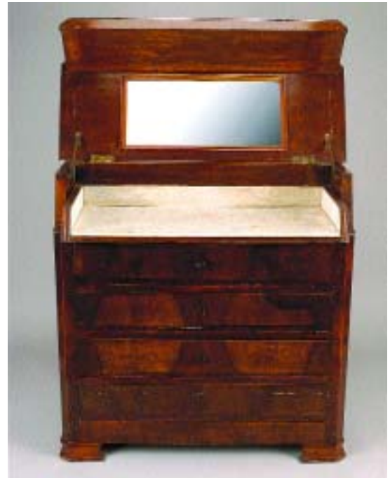
I373 CÓMODA/TOUCADOR LUÍS FILIPE EM MOGNO E RAIZ DE MOGNO, interior com mármore, francesa, séc. XIX, pequenos defeitos Dim. - 99 x 100 x 46 cm € 1.000 - 1.500