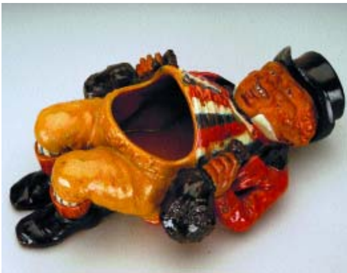
I402 ESCARRADOR "JOHN BULL" DEITADO DE VENTRE ABERTO E SEGURANDO SACOS DE LIBRAS EM FAIANÇA DAS CALDAS , decoração policromada, séc. XX, restaurado, marcado FÁBRICA DE FAIANÇAS DAS CALDAS DA RAINHA - vd. Simas & Isidro, nº 276 Dim. - 38 cm € 2.000 - 3.000