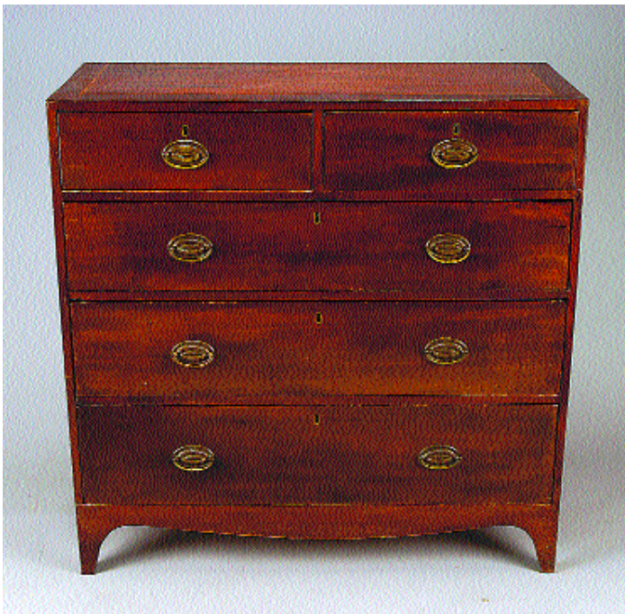
I355 CÓMODA ESTILO JORGE III EM MOGNO COM FILETES, inglesa, séc. XIX, pequenos restauros e defeitos Dim. - 101 x 100 x 44 cm