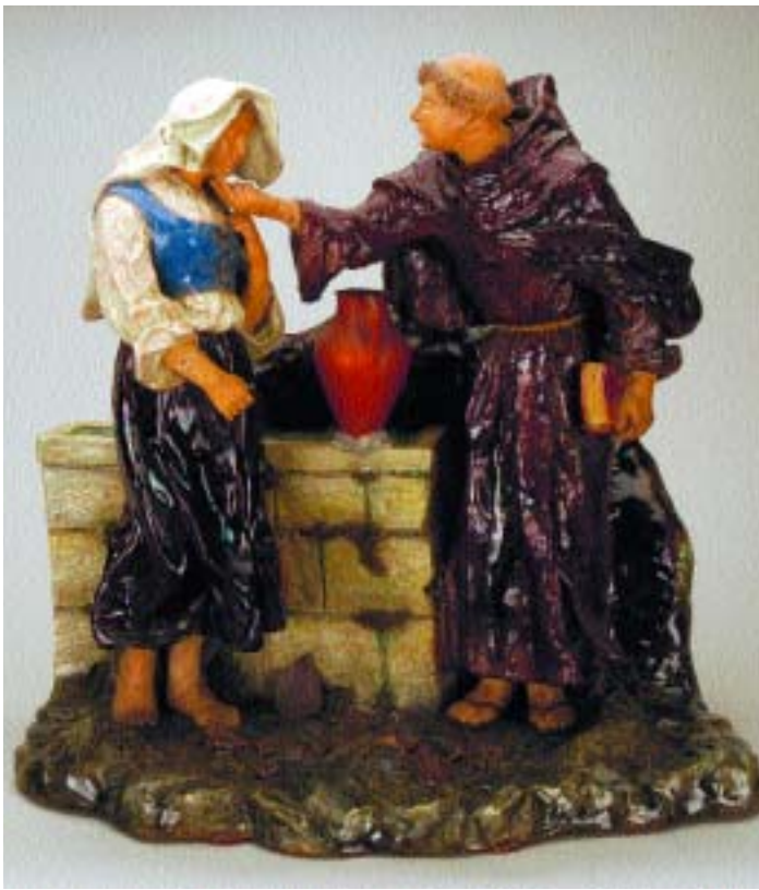
I401 MANUEL GUSTAVO BORDALO PINHEIRO - 1867-1920, "O milagre das bilhas", grupo escultórico em faiança das Caldas, decoração policromada, séc. XX, marcado FÁBRICA DE FAIANÇAS ARTÍSTICAS BORDALO PINHEIRO , assinado e datado de 1913 - vd. Simas & Isidro, nºs 108 e 529 Dim. - 50 x 51 x 29 cm € 2.000 - 3.000