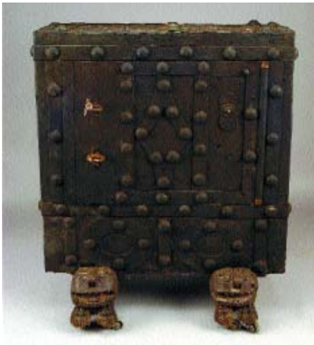
I371 ARMÁRIO/BURRA EM MADEIRA REVESTIDA A FOLHA DE FERRO, interior da porta com mecanismo, cachorros em madeira "leões", séc. XVIII/XIX, pequenos defeitos Dim. - 89 x 76 x 48 cm € 600 - 900