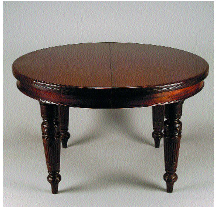
I357 MESA DE CASA DE JANTAR REDONDA EM MOGNO, pés canelados, portuguesa, séc. XIX, sem tábuas de extensão e manivela, restauros Dim. - 75 x 122 cm