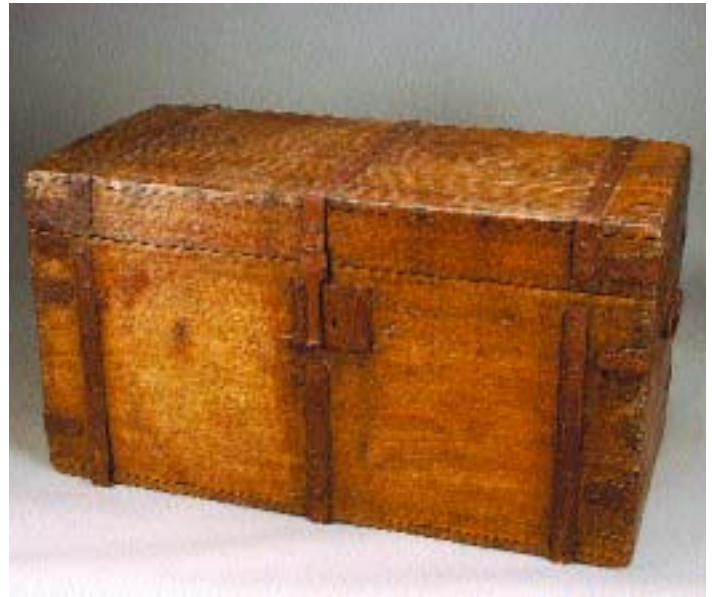
I372 ARCA EM TECA COM PRECINTAS EM FERRO, portuguesa, séc. XVIII, faltas e defeitos Dim. - 64 x 115 x 59 cm € 1.000 - 1.500