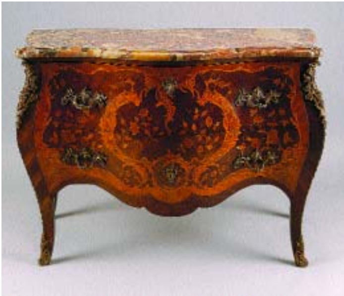
I370 CÓMODA ESTILO LUÍS XV COM MARQUETERIE DE PAU SANTO E OUTRAS MADEIRAS "FLORES" , aplicações em bronze, tampo de mármore, portuguesa, séc. XX, as duas gavetas trans- formadas em tampa de abater, pequenos defeitos Dim. - 86 x 118 x 57 cm € 1.500 - 2.250