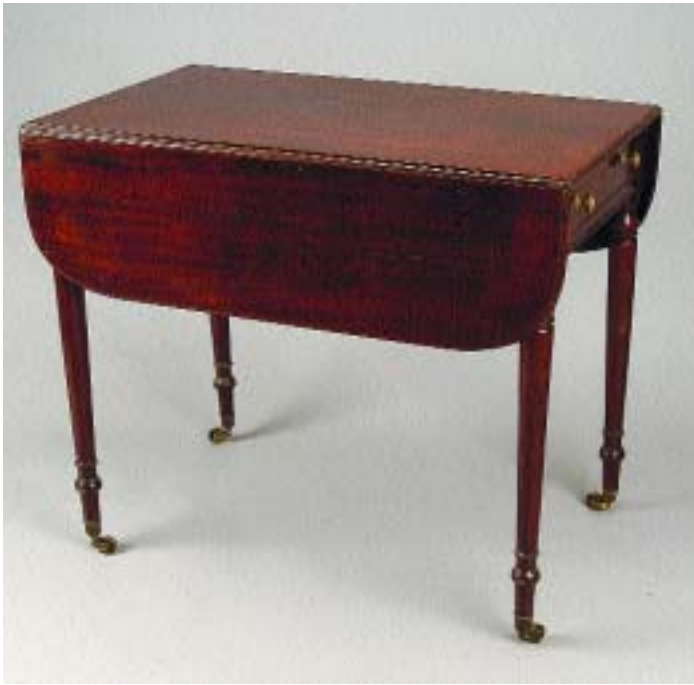
I354 MESA DE ABAS GUILHERME IV EM MOGNO, inglesa, séc. XIX, pequenos defeitos Dim. - 70,5 x 84 x 52 cm