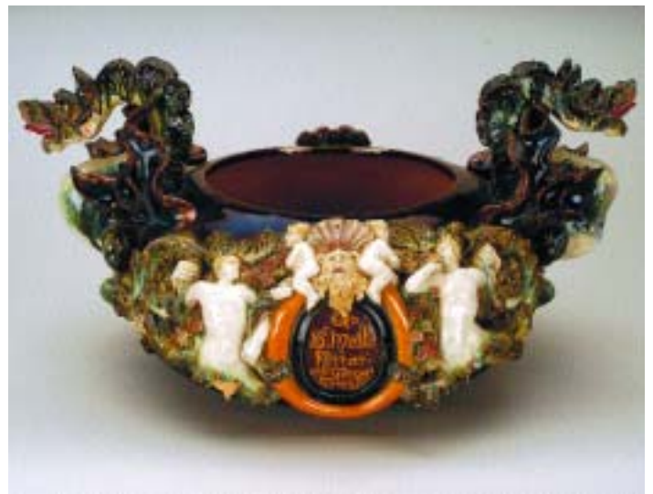
I404 CACHEPOT DE INSPIRAÇÃO RENASCENTISTA EM FAIANÇA DAS CALDAS , pegas em forma de cabeça de dragão, decoração policromada, séc. XX, faltas, uma asa partida e colada, marcado FÁBRICA DE FAIANÇAS ARTÍSTICAS BORDALO PINHEIRO - vd. Simas & Isidro, nº 108 ; Dim. - 27 x 48 cm € 1.200 - 1.800