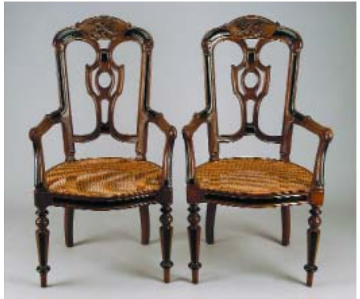
648 PAR DE CADEIRÕES DE BRAÇOS ROMÂNTICOS EM NOGUEIRA, partes pintadas de negro, assentos de palhinha, portugueses, séc. XIX, pequenas faltas e defeitos Dim. - 110 x 60 x 59 cm € 500 - 750