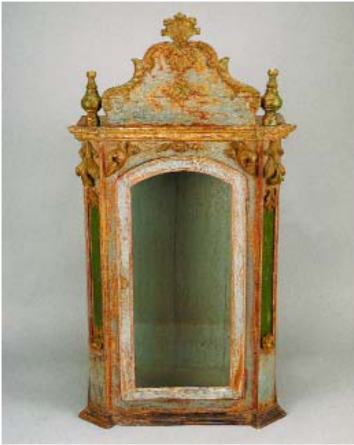
642 ORATÓRIO D. MARIA EM MADEIRA ENTALHADA, PINTADA E DOURADA, português, séc. XVIII, faltas e defeitos Dim. - 142 x 77,5 x 50 cm €1.000 - 1.500