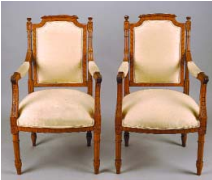
646 PAR DE FAUTEUILS ESTILO LUÍS XVI EM NOGUEIRA COM ENTALHAMENTOS, estofados a seda, franceses, séc. XIX, estofado não original, pequenos defeitos Dim. - 101 x 58 x 55 cm € 1.000 - 1.500