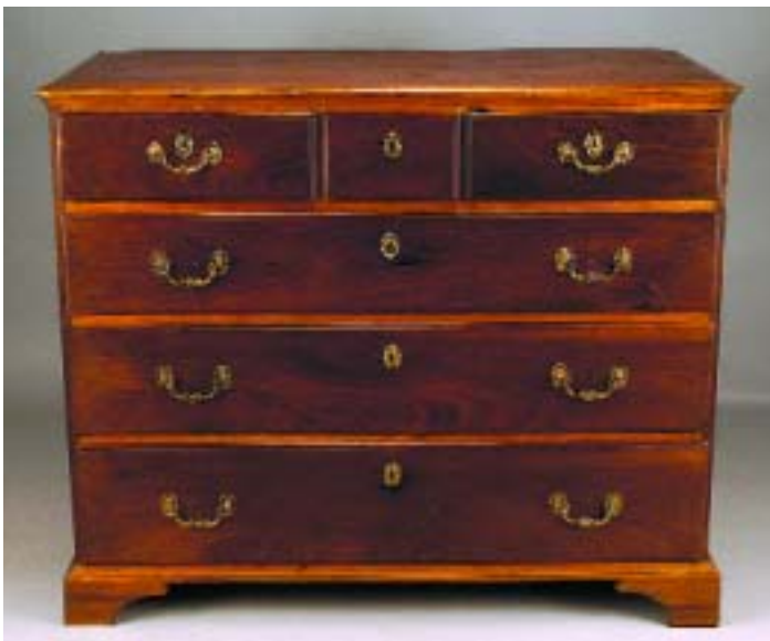
647 CÓMODA D. MARIA EM VINHÁTICO, portuguesa, séc. XVIII/XIX, pequenos restauros e defeitos, ferragens não originais Dim. - 100 x 119 x 60 cm € 1.500 - 2.250