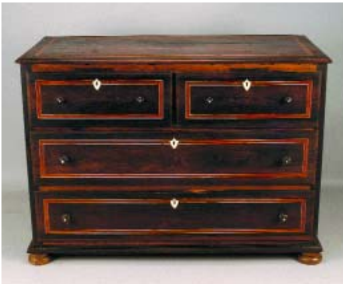
643 CÓMODA ESTILO D. MARIA EM PAU SANTO COM FILETES, portuguesa, séc. XIX, filetes posteriores, restauros, pequenos defeitos Dim. - 90 x 124 x 59 cm €5.000 - 7.500