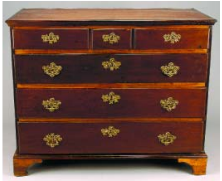
649 CÓMODA D. MARIA EM VINHÁTICO, ferragens em bronze, portuguesa, séc. XVIII/XIX, ferragens não originais, restauros, pequenas faltas e defeitos Dim. - 100 x 120 x 60 cm € 1.500 - 2.250