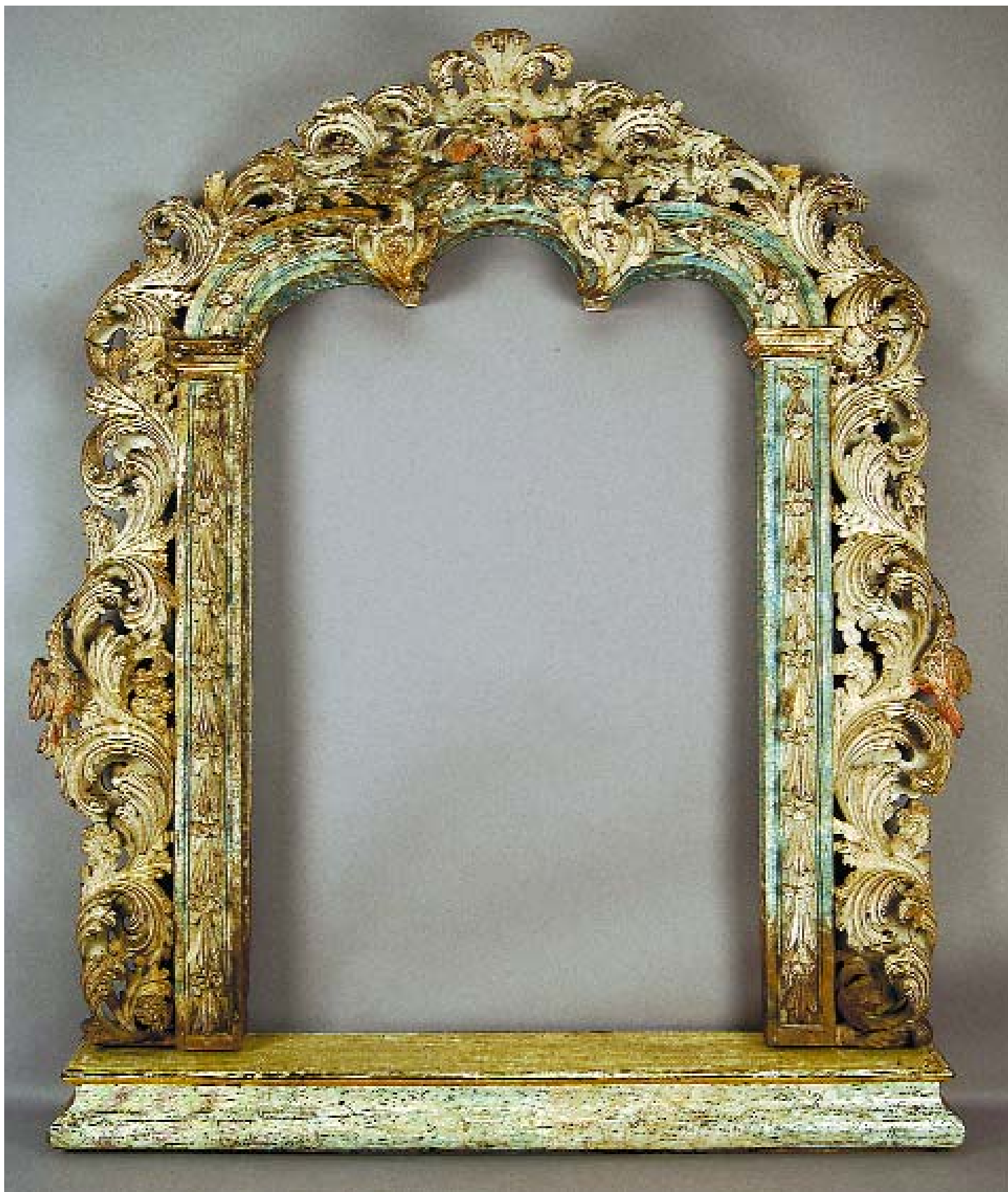
632 ARCO DE ALTAR EM MADEIRA ENTALHADA COM RESTOS DE PINTURA "AVES E FLORES",

português, séc. XVIII, faltas e defeitos Dim. - 210 x 185 x 47 cm