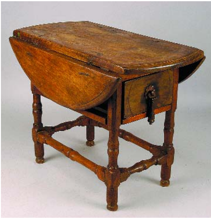
650 MESA DE ABAS EM NOGUEIRA, ferragens em ferro, brasileira, séc. XVIII, faltas e defeitos Dim. - 64 x 86 x 48 cm (fechada)