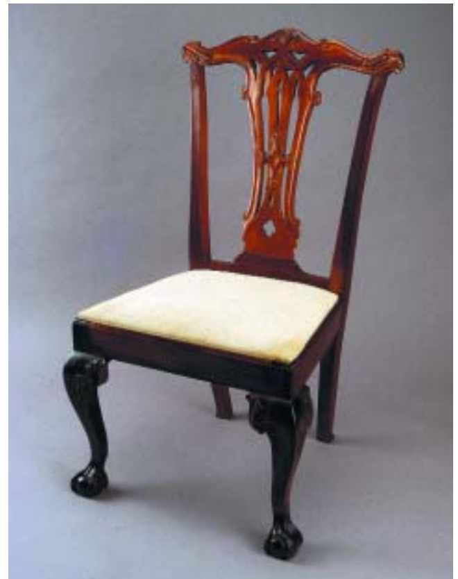
652 CONJUNTO DE OITO CADEIRAS ESTILO D. JOSÉ EM NOGUEIRA E VINHÁTICO, assentos estofados, portuguesas, séc. XIX, restauradas Dim. - 100 x 58 x 55 cm