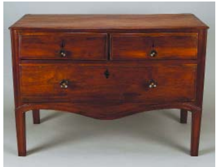
653 CÓMODA D. MARIA EM VINHÁTICO DE BAIXAS DIMENSÕES, portuguesa, séc. XVIII, pequenos defeitos Dim. - 75 x 110 x 60 cm