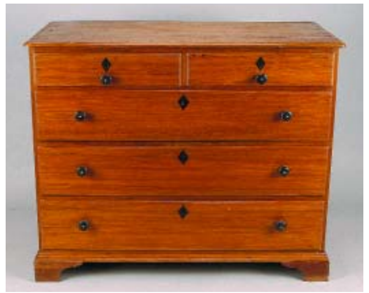
645 CÓMODA D. MARIA EM VINHÁTICO, entradas das fechaduras e puxadores em pau santo com embutido de marfim, portuguesa, séc. XVIII/XIX, pequenos defeitos Dim. - 99 x 122 x 62 cm €2.000 - 3.000