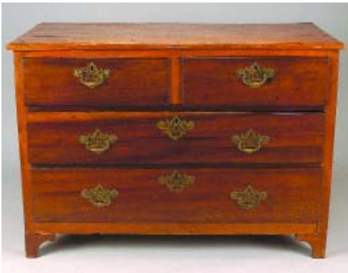
651 CÓMODA ESTILO D. MARIA EM VINHÁTICO, ferragens em bronze, portuguesa, séc. XIX, pequenos defeitos Dim. - 87 x 117 x 55 cm