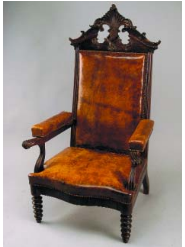
644 CADEIRÃO DE BRAÇOS EM PAU SANTO COM ENTALHAMENTOS, assento e costas estofados a couro, português, séc. XIX, restauros, pequenos defeitos e couro não original; Dim. - 136 x 73 x 69 cm €1.500 - 2.250