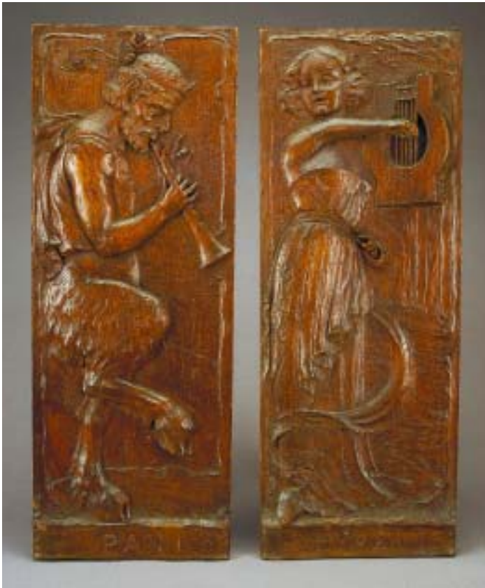
526 "PAN" E "HYMEN" par de placas em madeira entalhada, séc. XIX, pequenos defeitos Dim. - 74 x 27,5 cm