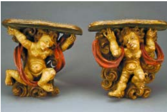
527 PAR DE MÍSULAS "QUERUBINS" EM MADEIRA ENTALHADA, PINTADA E DOURADA, portuguesas, séc. XVIII, pequenas faltas e defeitos Dim. - 33 x 34 x 17 cm