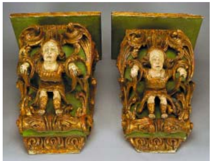
529 PAR DE MÍSULAS "ANJOS GUERREIROS" EM MADEIRA ENTALHADA, PINTADA E DOURADA, séc. XVIII, pequenas faltas e defeitos, repintados Dim. - 52 x 40 x 29 cm