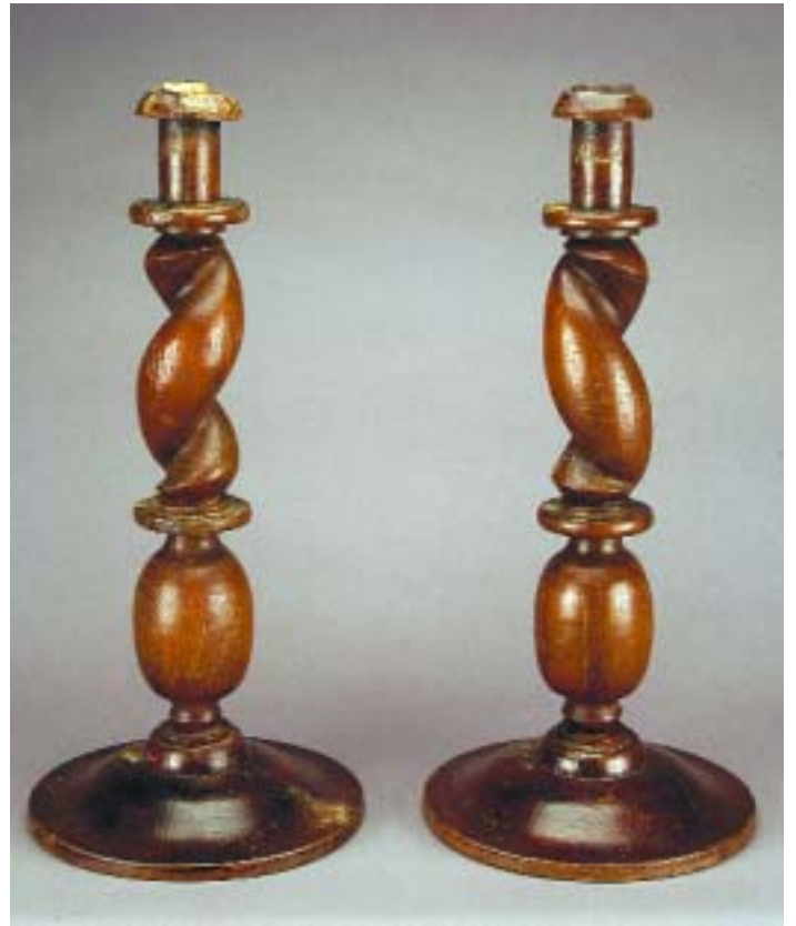
528 PAR DE TOCHEIROS RÚSTICOS EM CASTANHO TORNEADO, portuguesas, séc. XVII, pequenas faltas e defeitos Dim. - 66 cm