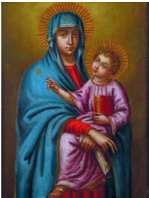
461 "NOSSA SENHORA DO PÓPULO"

óleo sobre cobre, escola italiana, séc. XVIII