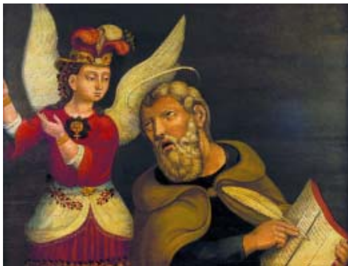
464 "SANTO EVANGELISTA E ARCANJO"

óleo sobre madeira, escola portuguesa, séc. XVII, restauros, pequenas faltas e defeitos