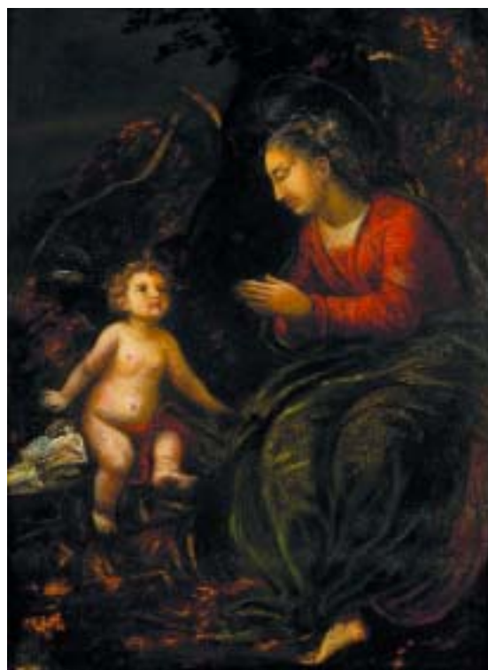
467 "NOSSA SENHORA COM O MENINO"

óleo sobre cobre, escola portuguesa, séc. XVIII/XIX, restauros Dim. - 24,5 x 19,5 cm € 300 - 450