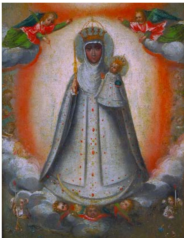
466 "NOSSA SENHORA COM O MENINO"

óleo sobre madeira, séc. XVIII, restauros Dim. - 39 x 30 cm € 1.300 - 1.900