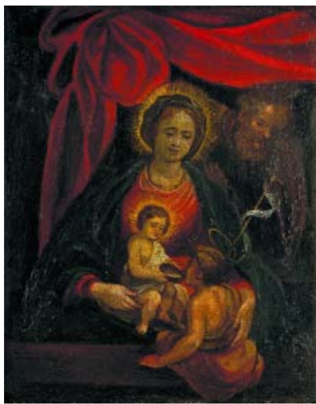
468 "SAGRADA FAMÍLIA E SÃO JOÃO BAPTISTA"

óleo sobre cobre, séc. XVII/XVIII, moldura em pau santo Dim. - 42 x 33 cm € 1.200 - 1.800