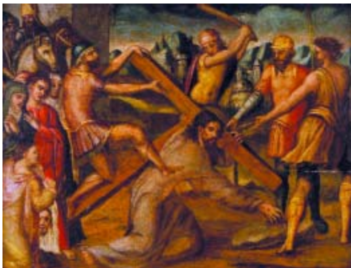
462 "ESTAÇÃO DA VIA SACRA"

óleo sobre madeira, escola flamenga, séc. XVII, restauros