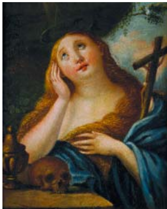
463 "SANTA MADALENA"

óleo sobre madeira, escola portuguesa, séc. XVIII, pequenos restauros