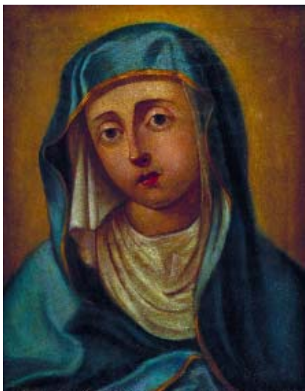
465 "NOSSA SENHORA"

óleo sobre cobre, escola portuguesa, séc. XVIII/XIX, restauros Dim. - 24,5 x 19,5 cm € 300 - 450