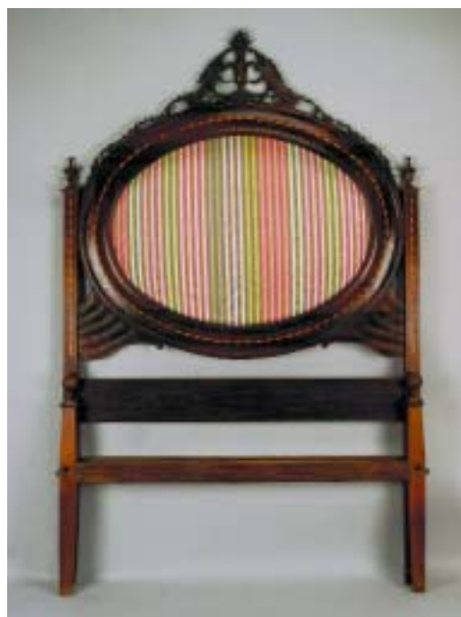
299 CAMA DE CASAL D. MARIA EM PAU SANTO COM FILETE DE PAU ROSA E ESPINHEIRO, espaldar oval estofado a tecido, portuguesa, séc. XVIII, pequenas faltas e defeitos, sem parafusos Dim. - 220 x 219 x 143 cm