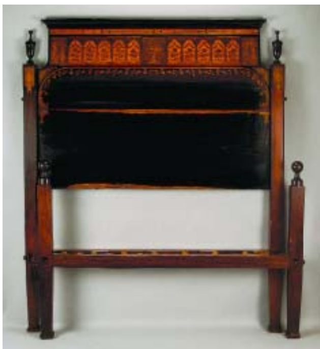
297 CAMA DE CASAL D. MARIA EM PAU SANTO COM EMBUTIDOS, portuguesa, séc. XVIII, pequenas faltas e defeitos Dim. - 181 x 217 x 151 cm