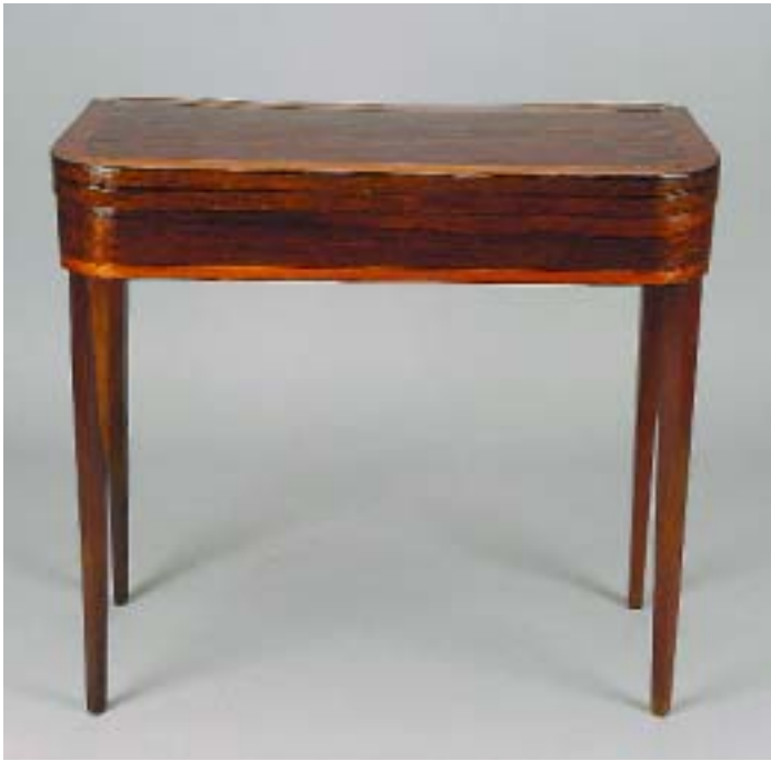
313 MESA DE JOGO D. MARIA FOLHEADA A PAU SANTO COM FAIXA EM PAU CETIM, portuguesa, séc. XVIII/XIX, restauros, faltas e defeitos Dim. - 80 x 87 x 44 cm