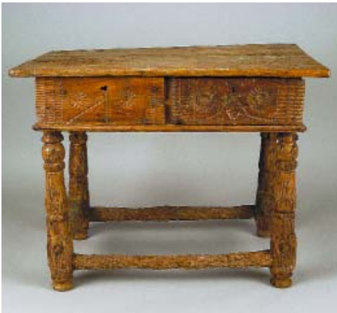
314 MESA RÚSTICA EM CASTANHO, gavetas com sulcos, portuguesa, séc. XVII, faltas e defeitos, muito atacada por xilófagos Dim. - 80 x 101 x 70 cm