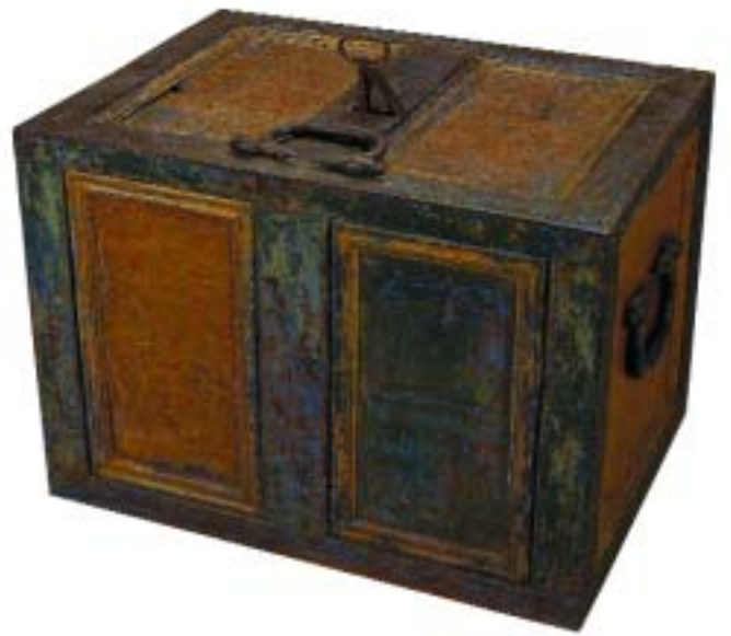
315 BURRA EM FERRO PINTADO, portuguesa, séc. XVIII/XIX, faltas na pintura, pequenos defeitos Dim. - 47 x 64 x 45 cm