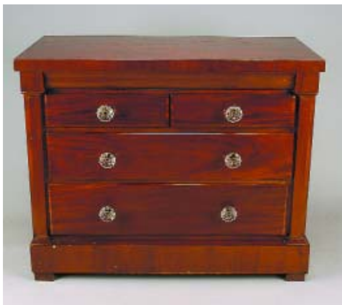
298 CÓMODA ROMÂNTICA EM MOGNO, puxadores em vidro, portuguesa, séc. XIX, pequenos defeitos Dim. - 87 x 108 x 58 cm