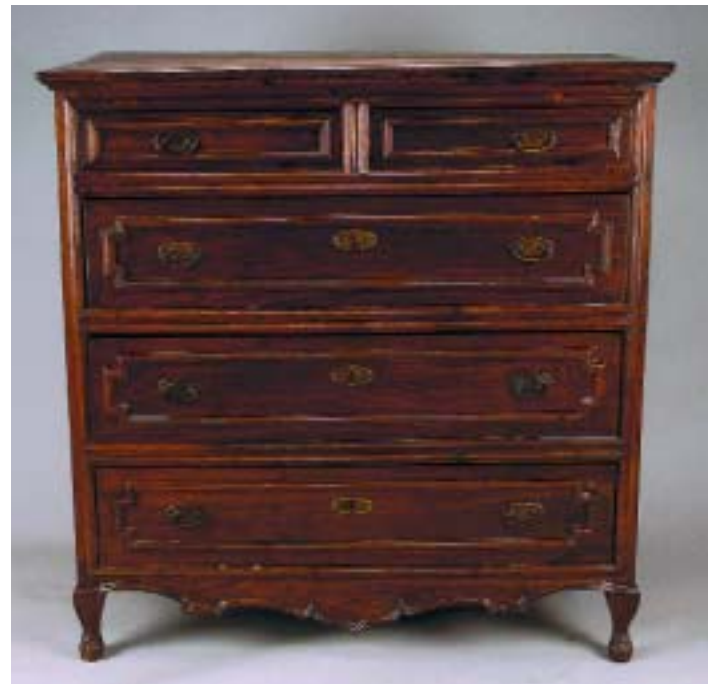
316 CÓMODA RÚSTICA D. JOSÉ EM CASTANHO, portuguesa, séc. XVIII, pequenos defeitos Dim. - 119 x 117 x 63 cm