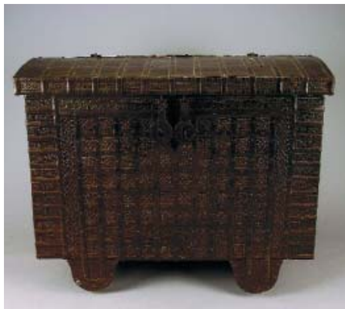
300 ARCA EM TECA COM PRECINTAS EM FERRO, Damão, séc. XIX, pequenos defeitos Dim. - 95 x 120 x 60 cm