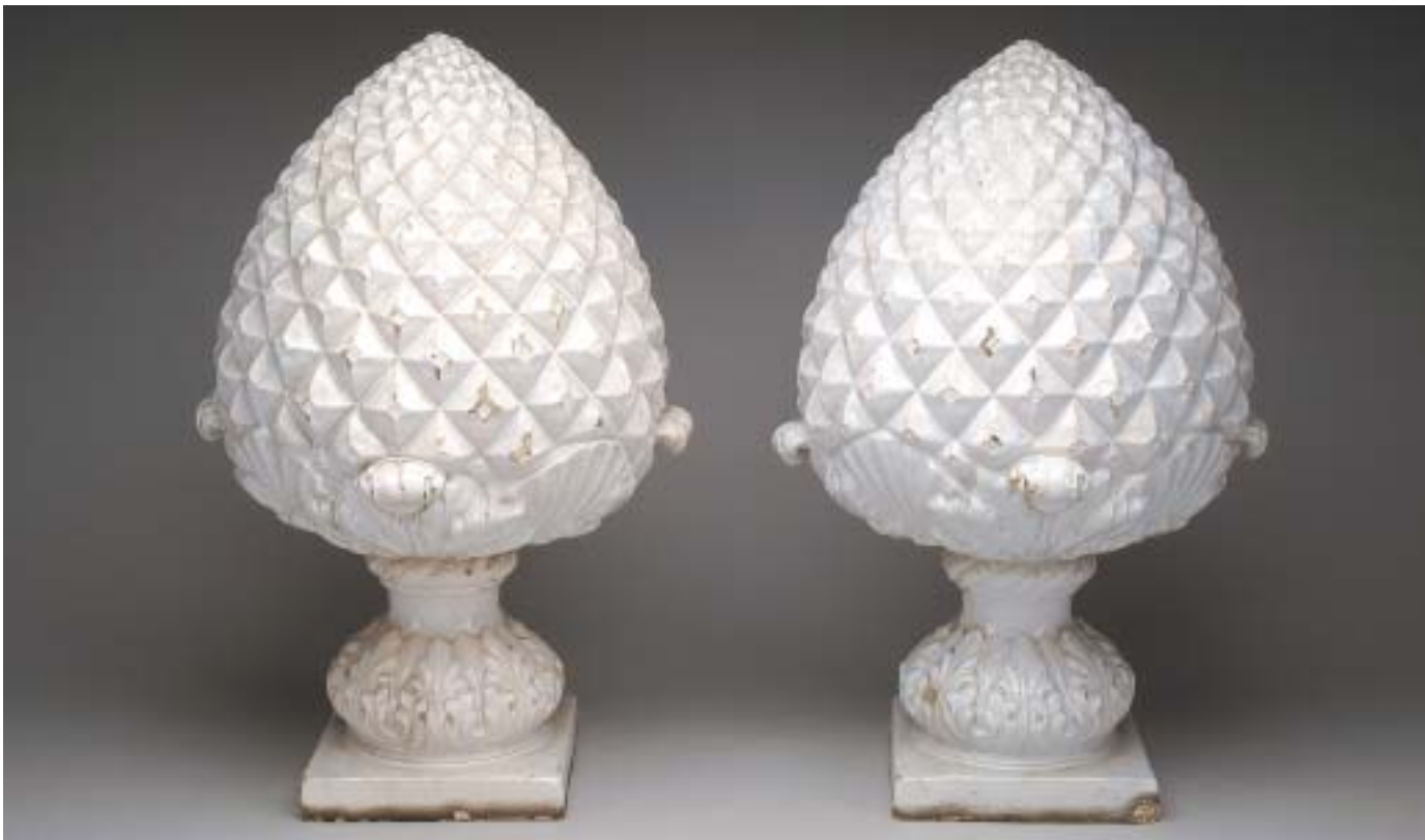
409 PAR DE PINÁCULOS "PINHAS", faiança da Fábrica das Devesas, decoração a branco, séc. XIX, faltas no vidrado, marcadas