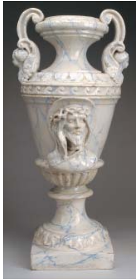
410 JARRÃO, faiança da Fábrica da Torrinha, decoração relevada "cabeça de Cristo com coroa de espinhos" e marmoreada a azul, séc. XIX/XX, pequenas esbeçadelas, marcado Dim. - 60 cm € 600 - 900