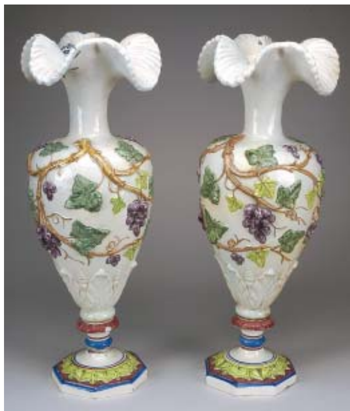
406 PAR DE JARRÕES , faiança da Fábrica de Fonte Nova - Aveiro, decoração relevada e policromada, séc. XIX, um com cabelo e bordo partido e gateado, marcados; Dim. - 62 cm € 1.000 - 1.500