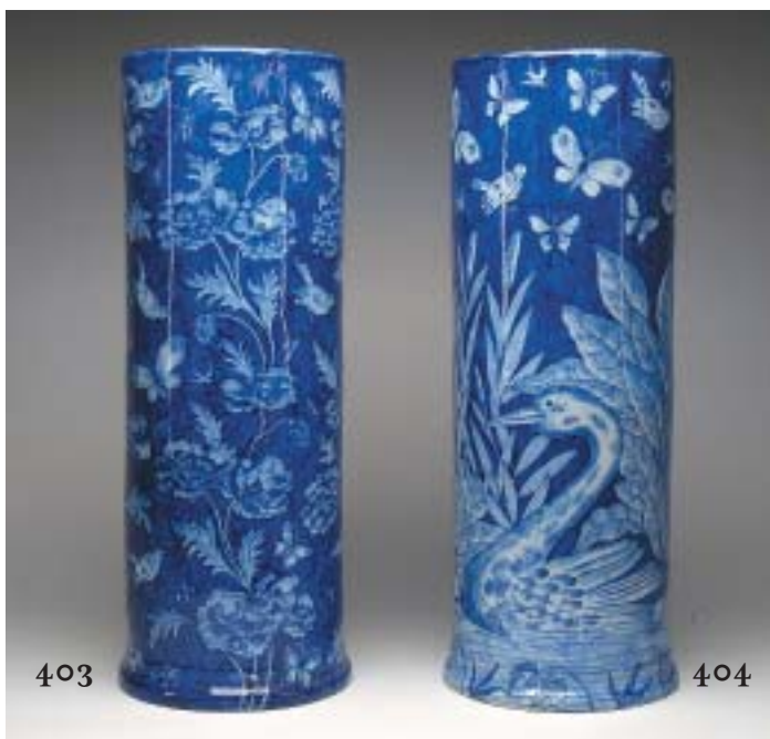
403 BENGALEIRO , faiança da Fábrica do Senhor do Além, decoração a azul "flores", séc. XX, esbeaçadelas e faltas no vidrado Dim. - 63 cm € 150 - 225