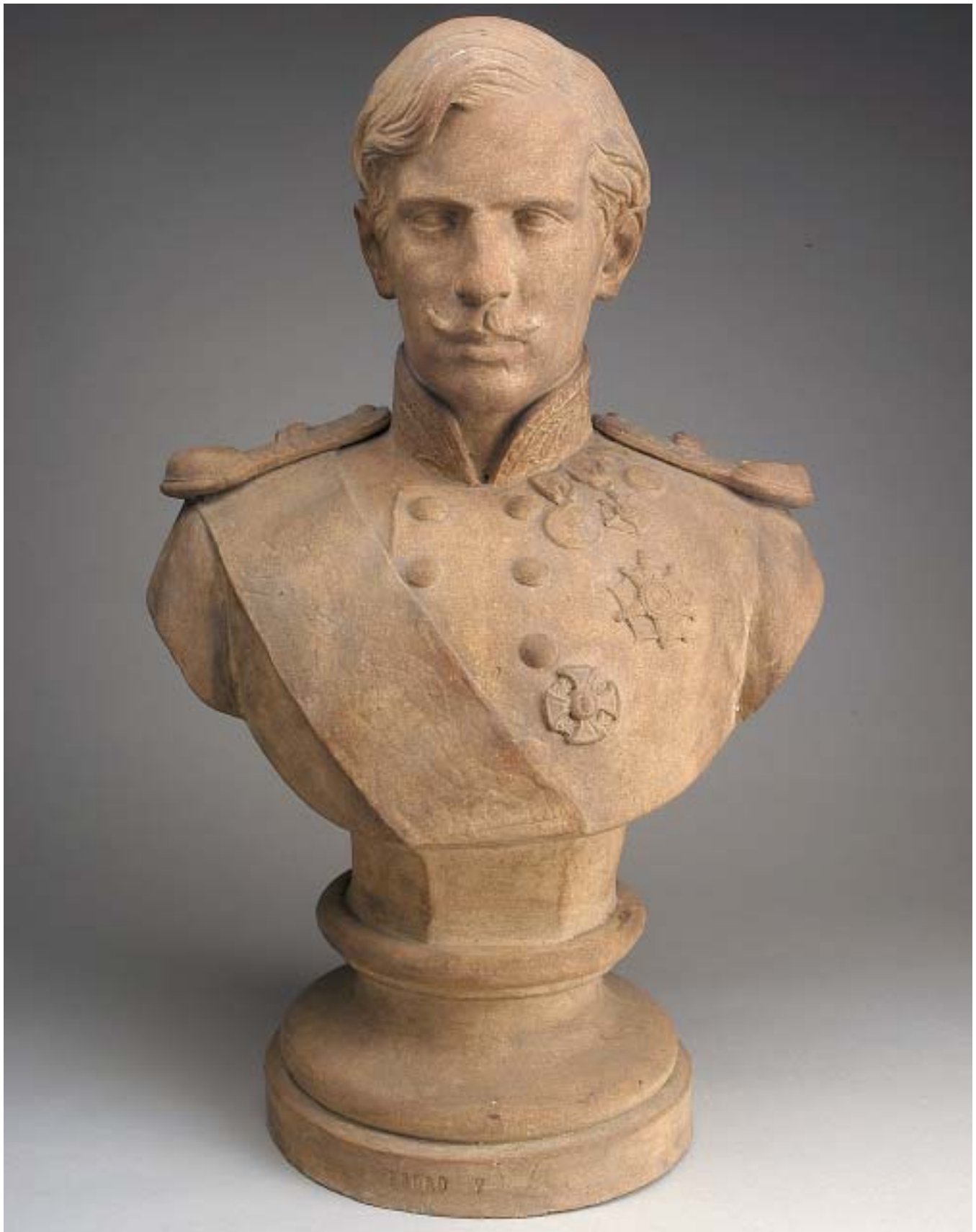
4II "BUSTO DE D. PEDRO V", escultura em terracota da Fábrica das Devesas, séc. XIX, pequena falta no bigode

Nota - vd. Catálogo da Fábrica Cerâmica e de Fundição das Devesas - António Almeida da Costa & C a - Vila Nova de Gaia - Portugal, 1910, Secção de Figuras, nº 233, p. 27.; Dim. - 72 cm € 600 - 900