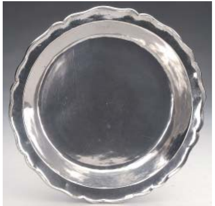
749 BACIA, prata, bordo recortado, sem marcas, América do Sul, séc. XVII/XVIII Dim. - 28 cm; Peso - 650 grs. €2.000 - 3.000