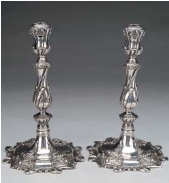
746 PAR DE CASTIÇAIS, D. José, prata, sem marcas, portuguesas, séc. XVIII, sem arandelas; Dim. - 21 cm Peso - 1.024 grs. €1.200 - 1.800