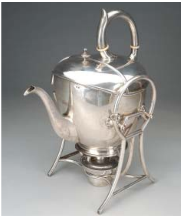
731 BULE COM ESCALFADOR, Art Déco, prata, contraste Javali do Porto (1887-1937) (Vidal - 83), português, séc. XIX/XX, falta Dim. - 35 cm Peso - 1.985 grs.