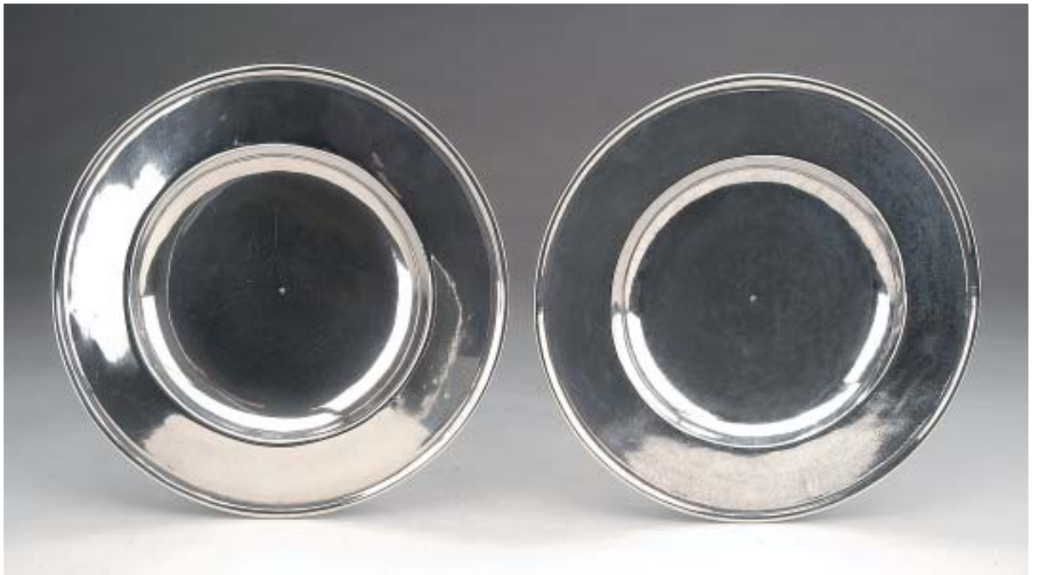
760 PAR DE PRATOS, prata, marcas ilegíveis, espanhóis, séc. XVIII, marca de posse Dim. - 24 cm Peso - 898 grs.