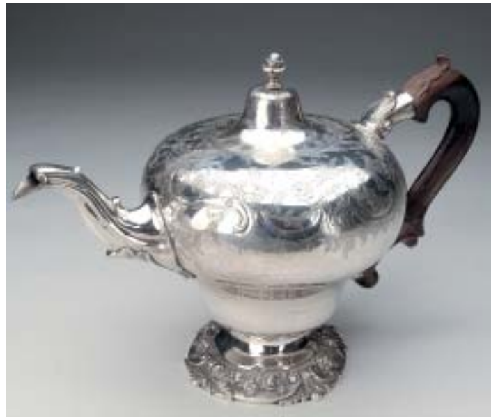
748 BULE, D. José, prata gravada, sem marcas, português, séc. XVIII Dim. - 20,5 cm Peso - 1.216 grs. €3.500 - 5.250