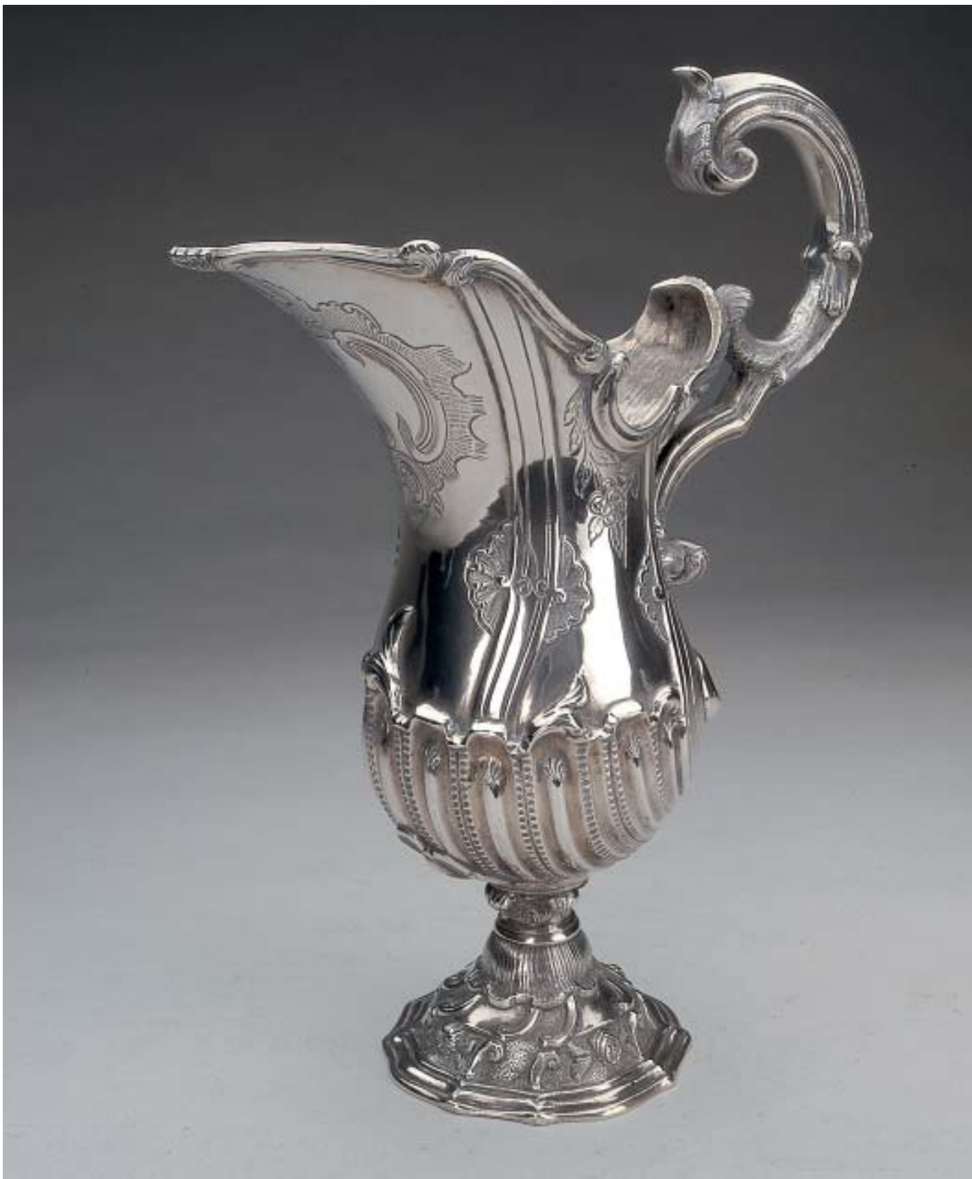
750 GOMIL DE ASA PERDIDA, D. José, prata, sem marcas,

português, séc. XVIII Dim. - 31 cm Peso - 1.400 grs.