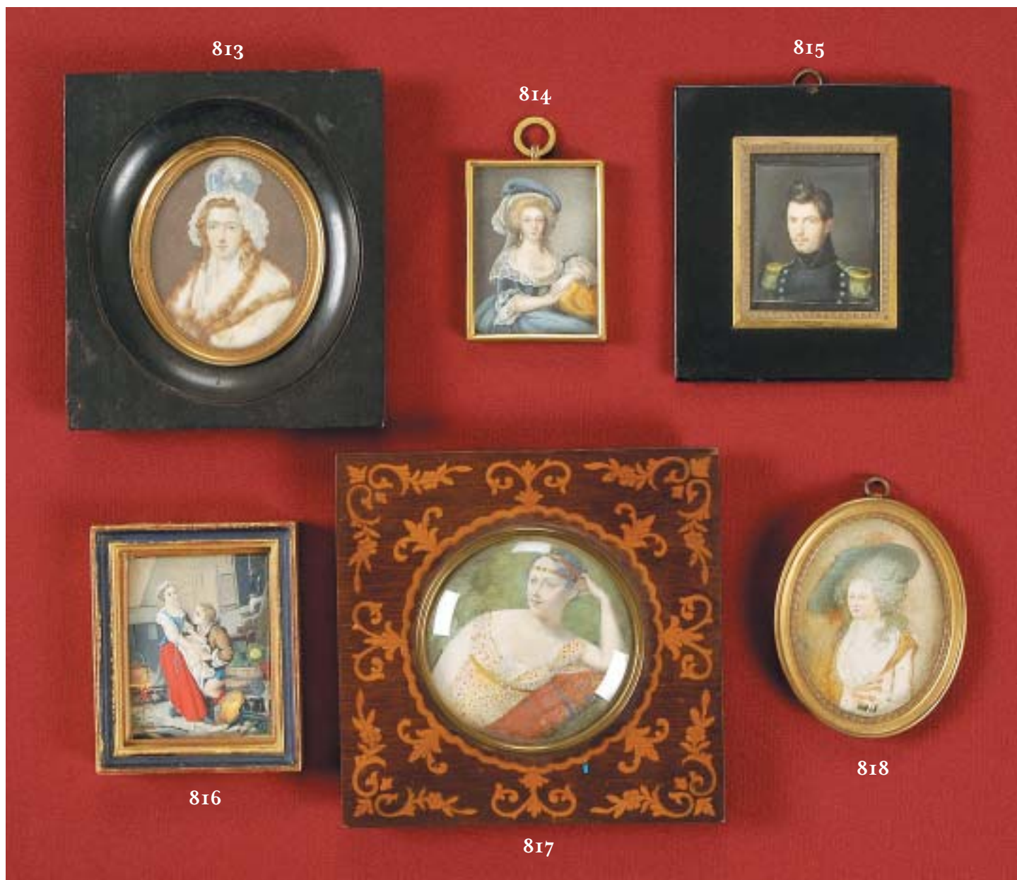
813 "SENHORA COM TOUCA", miniatura oval sobre marfim, séc. XIX Dim. - 8 x 7 cm