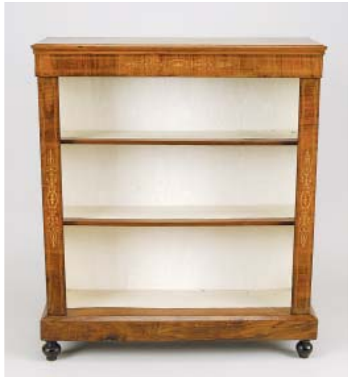
307 ESTANTE, victoriana, noqueira e raiz de noqueira com embutidos, fundo pintado, inglesa, séc. XIX, pequenos restauros e defeitos Dim. - 105 x 92 x 28 cm € 900 - 1.350