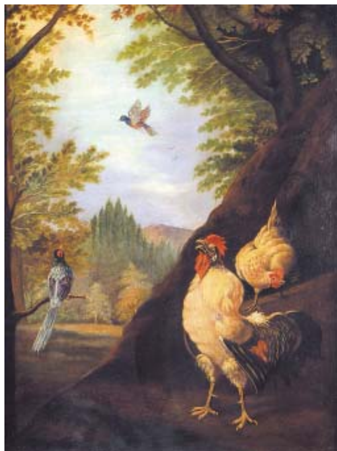
536 "PAISAGEM COM GALO E GALINHA", óleo sobre cobre, séc. XIX, restauros Dim. - 70 x 55 cm