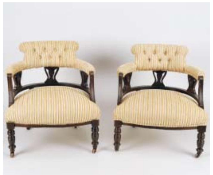
301 PAR DE CADEIRAS DE LAREIRA, victorianas, mogno, assentos e costas redondas estofadas, inglesas, séc. XIX, pequenos defeitos Dim. - 65 x 60 x 67 cm € 900 - 1.350