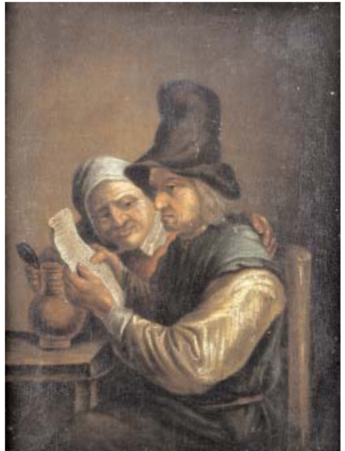
516 "CASAL LENDO CARTA", óleo sobre tela, escola holandesa, séc. XVIII/XIX, pequenas faltas Dim. - 37,5 x 28,5 cm