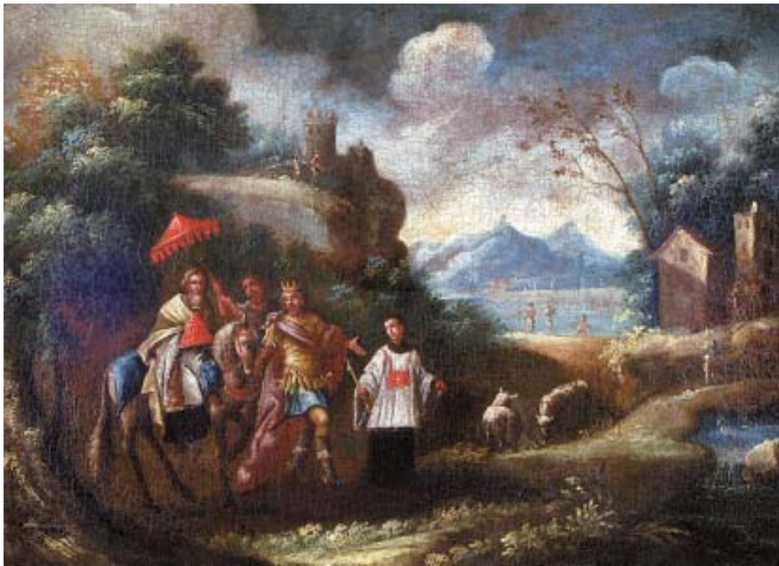
401 "PAISAGEM COM FIGURAS PERTO DE LAGO" , óleo sobre tela, séc. XVII/XVIII, reentelado e restauros Dim. - 68 x 91 cm