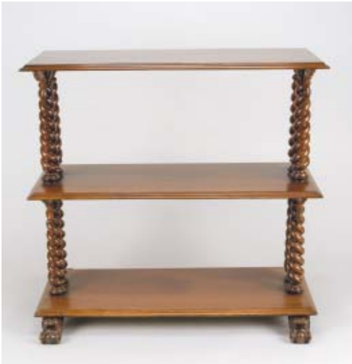
309 DUMB-WAITER DE TRÊS TAMPOS, victoriano, mogno, colunas torneadas e pés entalhados, inglês, séc. XIX, pequenos defeitos Dim. - 95 x 98,5 x 54 cm € 800 - 1.200