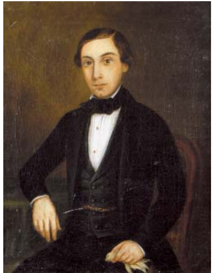
540 "SENHOR", óleo sobre tela, escola inglesa, séc. XIX Dim. - 44 x 34 cm