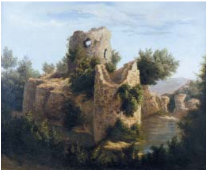
511 "RUÍNAS", óleo sobre tela, séc. XIX, pequeno restauro Dim. - 44 x 55 cm