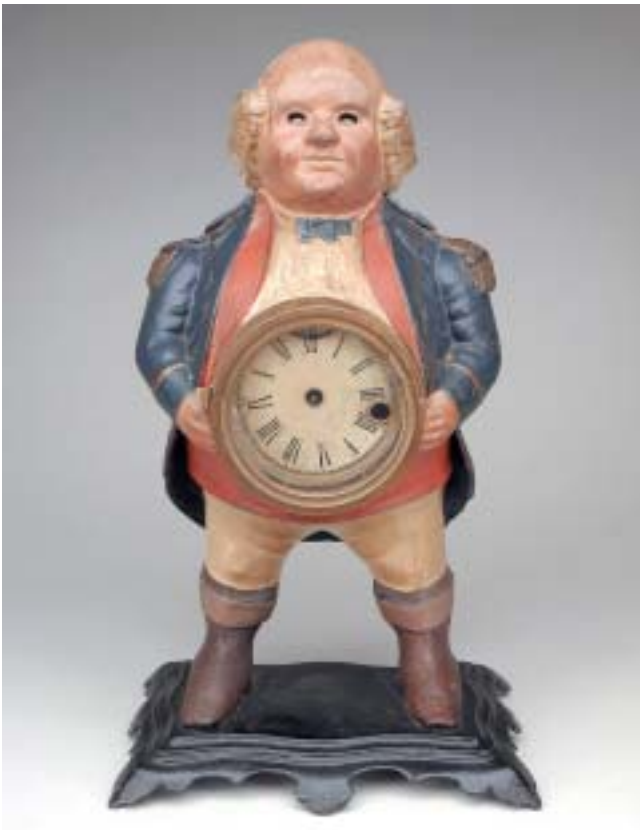
452 RELÓGIO/AUTÓMATO "FIGURA MASCULINA" , ferro policromado, americano, séc. XIX, mecanismo a necessitar de concerto Dim. - 37,5 cm