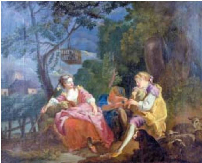
515 "CENA CAMPESTRE COM FIGURAS", óleo sobre tela, escola francesa, séc. XIX, faltas na tinta, pequenos defeitos na tela Dim. - 77 x 97 cm