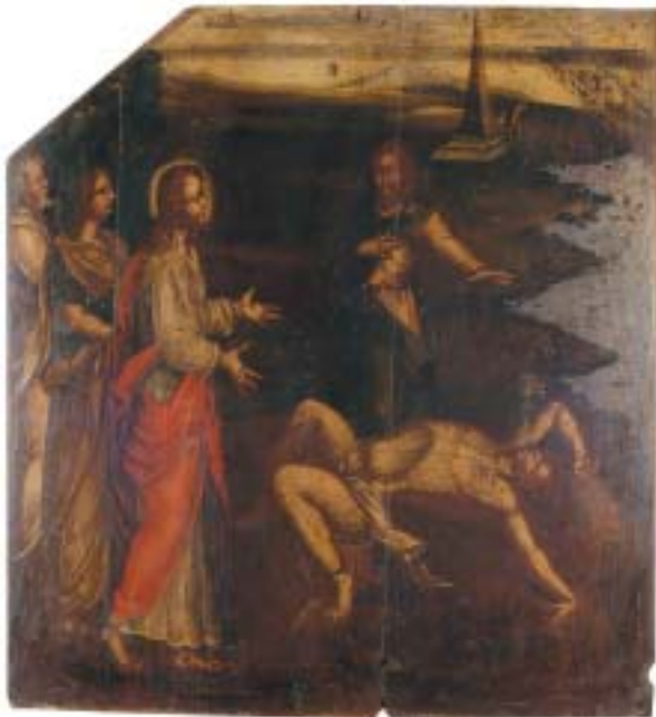
402 "CENA BÍBLICA" , óleo sobre castanho, escola portuguesa, séc. XVII, faltas e defeitos Dim. - 104 x 95 cm