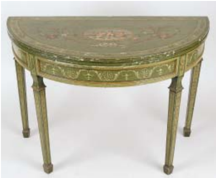
306 MESA DE JOGO DE MEIA LUA, estilo neoclássico, madeira pintada, fundo verde com decoração policromada "grinaldas" e reserva central "putti", Itália, séc. XIX, pequenas faltas e defeitos Dim. - 73 x 101 x 49,5 cm € 4.000 - 6.000