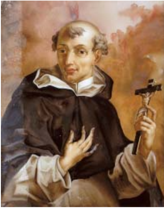
409 "SÃO DOMINGOS", pintura sobre vidro, moldura em madeira dourada e espelho, Itália, séc. XVIII, pequenas faltas na pintura Dim. - 59 x 48 cm € 800 - 1.200