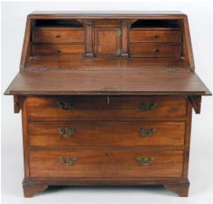
314 PAPELEIRA, estilo Jorge III, mogno e raiz de mogno, inglesa, séc. XIX, pequenos defeitos Dim. - 106 x 100 x 55 cm