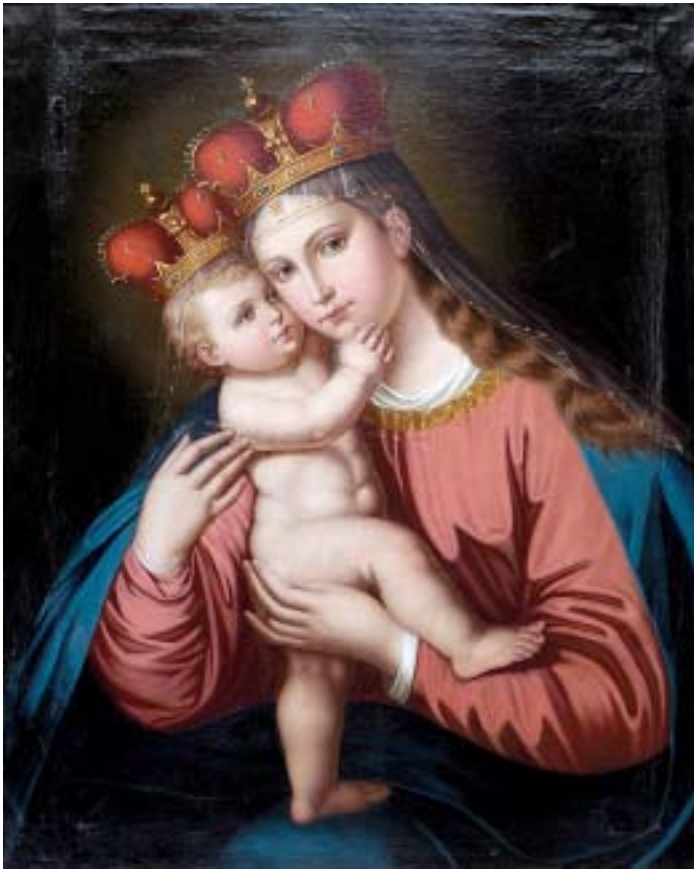
393 "NOSSA SENHORA COM O MENINO COROADOS" , óleo sobre tela, Europa Central, séc. XIX, pequenos defeitos Dim. - 69 x 56 cm € 700 - 1.050