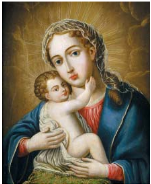
399 "NOSSA SENHORA COM O MENINO", óleo sobre madeira, séc. XVIII, restaurado Dim. - 54,5 x 43 cm