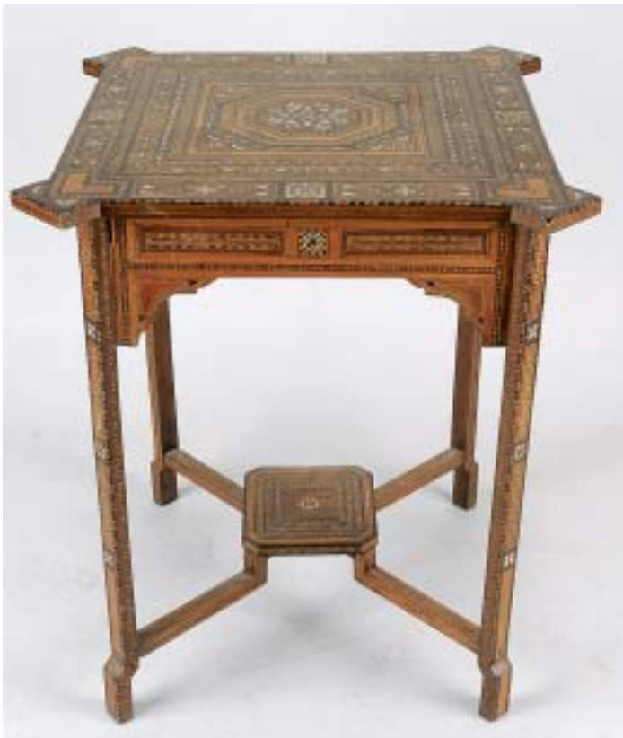
298 MESA, nogueira com embutidos de madrepérola, pau santo e outras madeiras, islâmica, séc. XIX, pequenas faltas e defeitos Dim. - 80 x 68 x 68 cm € 1.000 - 1.500