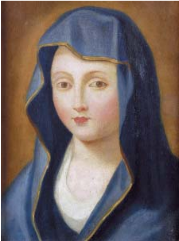
410 "NOSSA SENHORA", óleo sobre cobre, escola portuguesa, séc. XVIII/XIX, pequenos restauros Dim. - 26 x 20 cm € 300 - 450