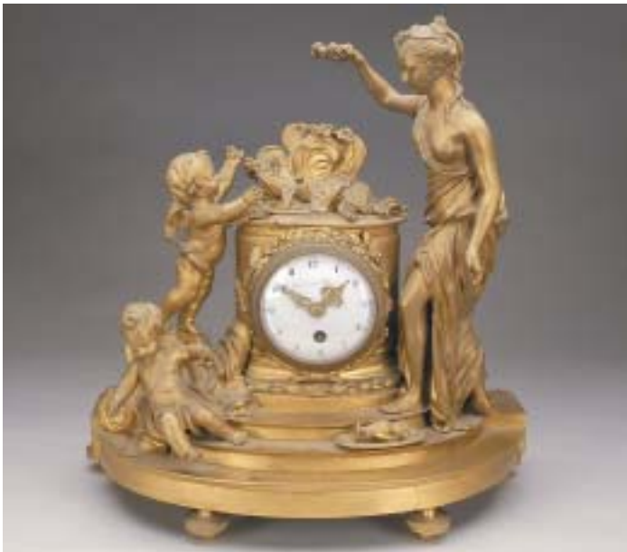
453 RELÓGIO , bronze "figura feminina e Amores", mostrador em esmalte, marcado GREBERT À PARIS, francês, séc. XIX, faltas e defeitos, mecanismo a necessitar de revisão Dim. - 40 cm