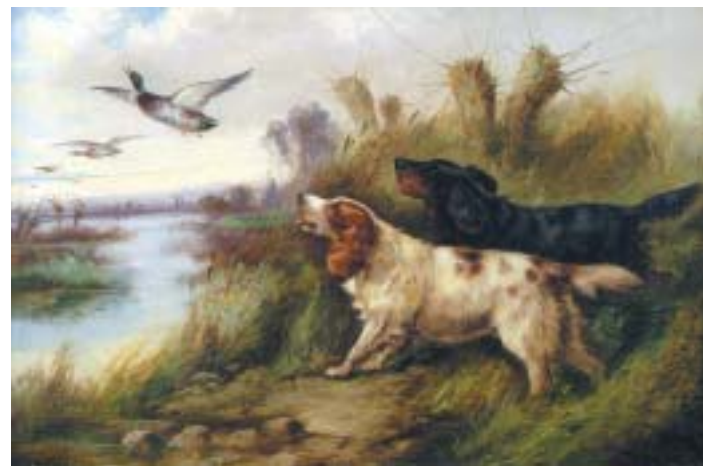
541 ROBERT CLEMINSON - SÉC. XIX, "Cena de caça com patos e cães", óleo sobre tela, assinado, reentelado e pequenos restauros Dim. - 41 x 61 cm