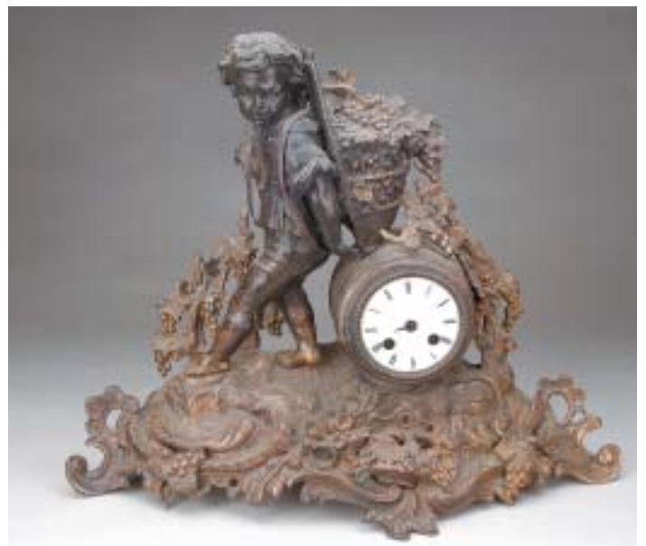
455 RELÓGIO DE MESA , bronze de arte "Menino nas vindimas", mostrador em esmalte, séc. XIX, faltas e defeitos, mecanismo a necessitar de revisão Dim. - 39 cm