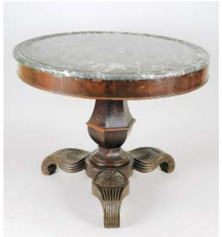
319 MESA REDONDA, mogno, coluna central, tampo em mármore, portuguesa, séc. XIX, pequenas faltas e defeitos, pequena falta no mármore Dim. - 78,5 x 98 cm