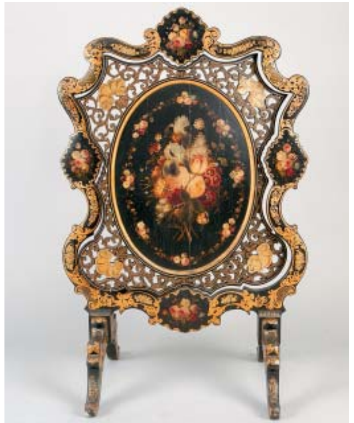
311 PÁRA-FOGO ROTATIVO, Napoleão III, madeira lacada de negro, pintada e dourada, decoração policromada "flores", francês, séc. XIX, pequenas faltas e defeitos Dim. - 108 x 69 x 48 cm € 600 - 900