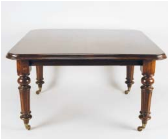
310 MESA DE CASA DE JANTAR, victoriana, mogno, quatro pernas torneadas, uma tábua de extensão, com manivela, inglesa, séc. XIX, pequenos defeitos Dim. - 75 x 185 x 123 cm € 2.000 - 3.000