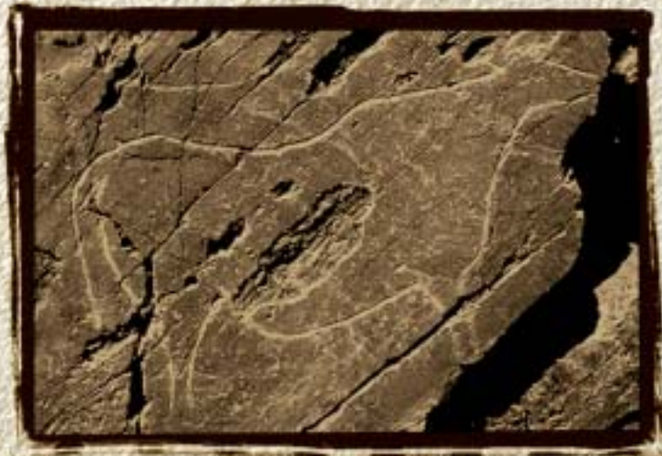
Arte Rupestre Paleolítica do Vale do Côa Património Mundial UNESCO 1998 © Instituto Português de Arqueologia