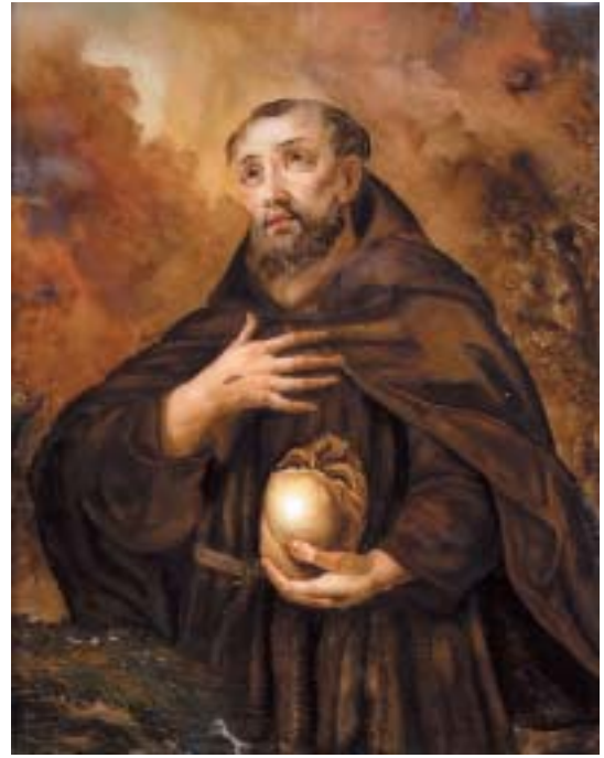
411 "SÃO FRANCISCO DE ASSIS", pintura sobre vidro, moldura em madeira dourada e espelho, Itália, séc. XVIII, pequenas faltas na pintura Dim. - 59 x 48 cm € 800 - 1.200