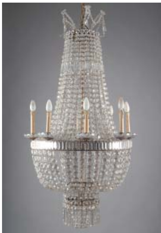
457 LUSTRE DE SACO DE OITO LUMES COM PINGENTES, cristal, electrificado, séc. XIX, pequenas faltas e defeitos Dim. - 137 cm € 1.500 - 2.250