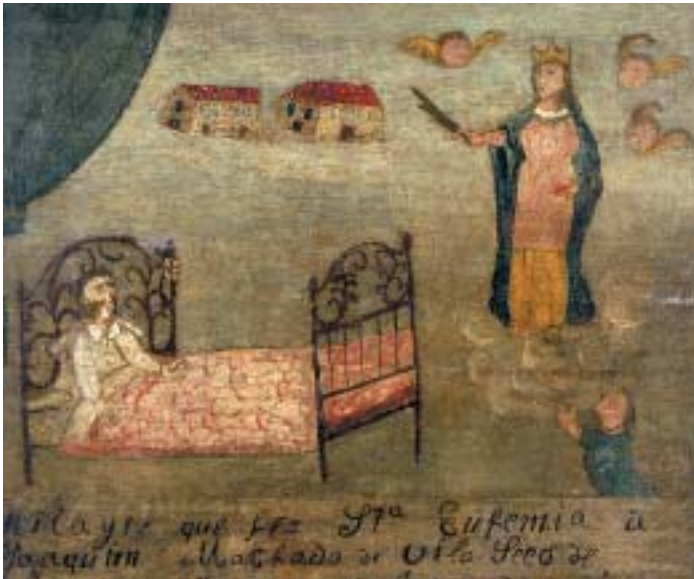
394 EX-VOTO "MILAGRE QUE FEZ SANTA EUFÉMIA" , pintura sobre madeira, datado de 1896, português, séc. XIX, pequenas faltas e defeitos Dim. - 32 x 35 cm € 500 - 750