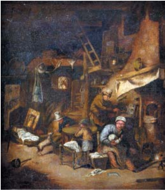
514 "CENA DE INTERIOR", óleo sobre tela, escola holandesa, séc. XVII, reentelado e restauros Dim. - 42 x 37 cm