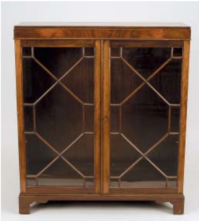
305 VITRINE, estilo Jorge III, mogno e raiz de mogno, portas com vidrinhos, inglesa, séc. XIX, pequenos defeitos Dim. - 107 x 93 x 28 cm € 500 - 750