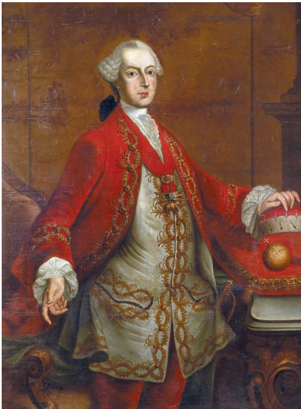
533 "IMPERADOR JOSÉ II DO SACRO IMPÉRIO", óleo sobre tela colada em plátex,

escola austríaca, séc. XVIII, restauros Dim. - 132 x 96 cm