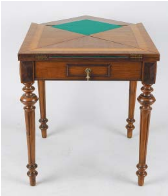
317 MESA DE JOGO DE ENVELOPE, victoriana, mogno, inglesa, séc. XIX, pequenos defeitos Dim. - 72,5 x 64 x 64 cm