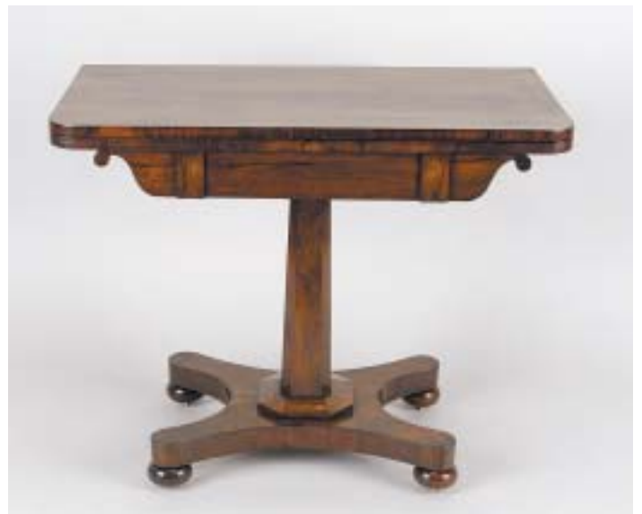
308 MESA DE JOGO, victoriana, pau santo, coluna central, inglesa, séc. XIX Dim. - 74 x 91 x 45 cm € 1.500 - 2.250