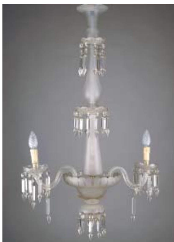
459 CANDEEIRO DE TECTO DE DOIS BRAÇOS COM PINGENTES, cristal, electrificado, séc. XX, pequenas faltas e defeitos Dim. - 92 cm € 100 - 150