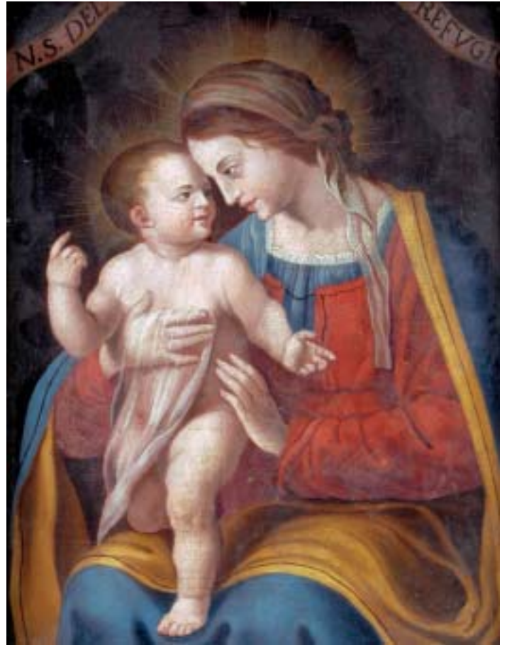
395 "NOSSA SENHORA DEL REFUGIO" , óleo sobre cobre, escola espanhola, séc. XVIII, pequenos defeitos Dim. - 21 x 16 cm € 800 - 1.200