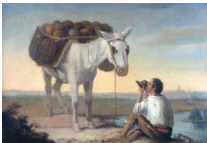
535 "RAPAZ COM BURRO E MELÕES", óleo sobre tela, escola espanhola, séc. XIX, assinatura não identificada, reentelado Dim. - 40 x 62 cm