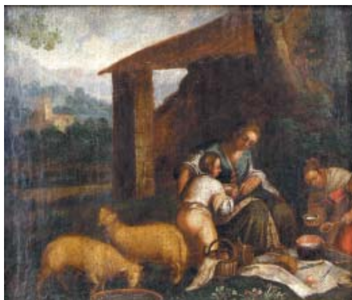
521 "CENA CAMPESTRE - FIGURAS PERTO DE CASA", óleo sobre tela colada em madeira, escola holandesa, séc. XVIII/XIX Dim. - 35 x 43 cm