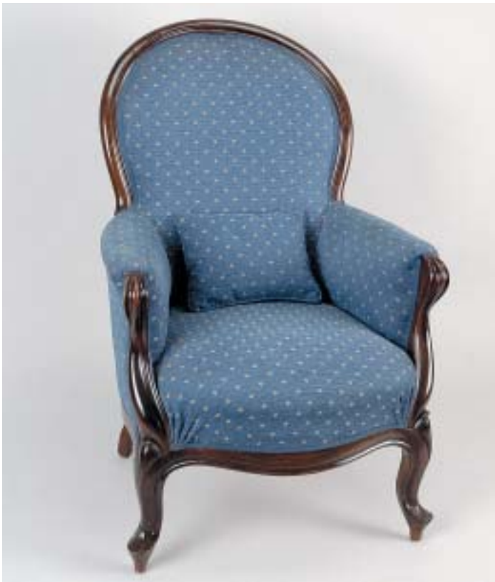
313 CADEIRÃO, victoriano, mogno, estofado a azul, inglês, séc. XIX, estofa não original Dim. - 101 x 69 x 82 cm