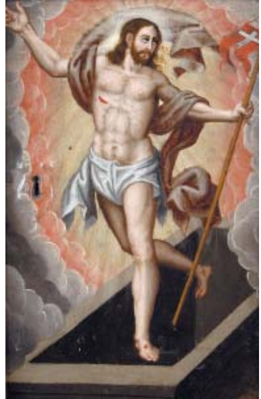
412 "CRISTO RESSUSCITADO", porta de sacrário em madeira pintada, parte posterior dourada, escola portuguesa, séc. XVII/XVIII, restauros Dim. - 31 x 20,5 cm € 300 - 450