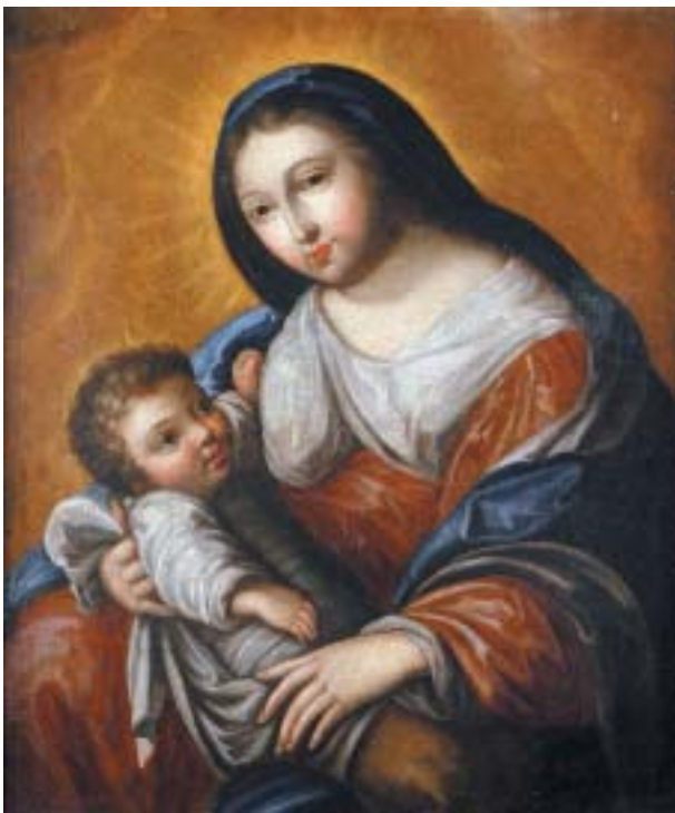
397 "NOSSA SENHORA COM O MENINO", óleo sobre tela, escola portuguesa, séc. XVIII/XIX, pequenos restauros Dim. - 69 x 58 cm