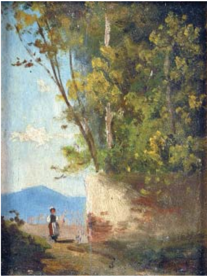
510 "PAISAGEM COM FIGURA PERTO DE MURO", óleo sobre madeira, escola inglesa, séc. XIX Dim. - 16 x 12 cm