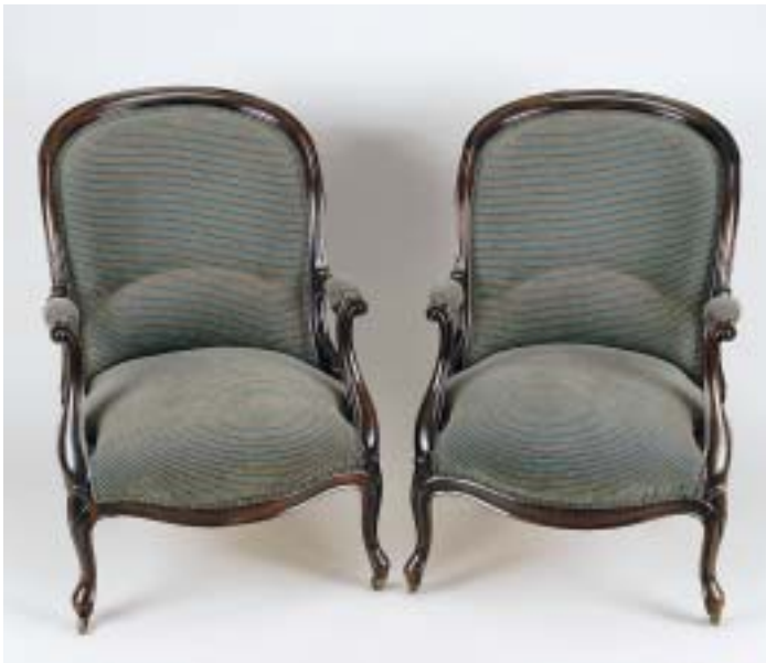
299 PAR DE FAUTEUILS, victorianos, pau santo, estofados a verde, ingleses, séc. XIX, estofa não original Dim. - 101 x 69 x 82 cm € 1.400 - 2.100