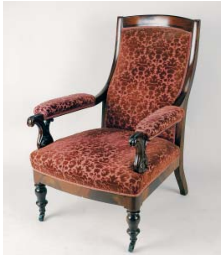
315 CADEIRÃO, victoriano, mogno com entalhamentos, estofado, inglês, séc. XIX, pequenos defeitos Dim. - 93 x 66 x 80 cm