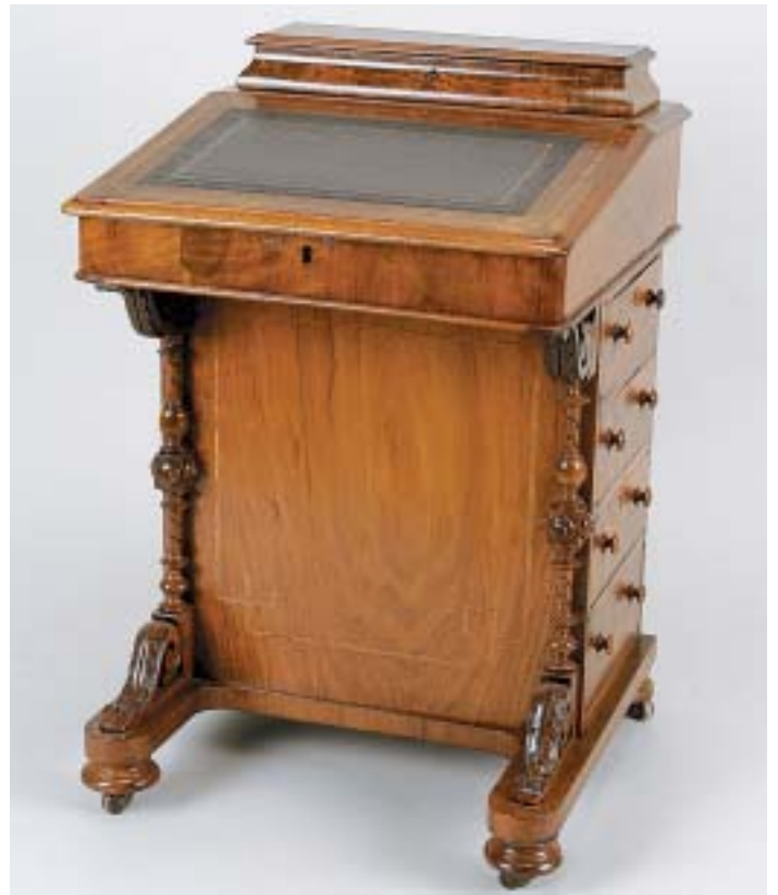
300 SECRETÁRIA DAVENPORT, victoriana, nogueira e raiz de nogueira, colunas torneadas, inglesa, séc. XIX, pequenos defeitos Dim. - 82 x 54 x 54 cm € 1.800 - 2.700