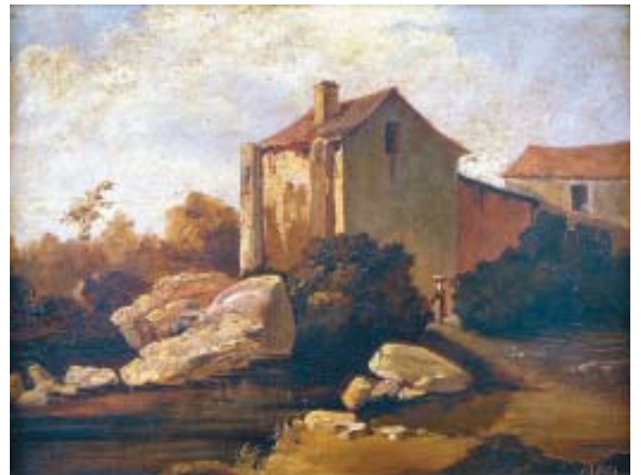
513 "PAISAGEM", óleo sobre cartão, séc. XX, assinatura não identificada Dim. - 23,5 x 32 cm