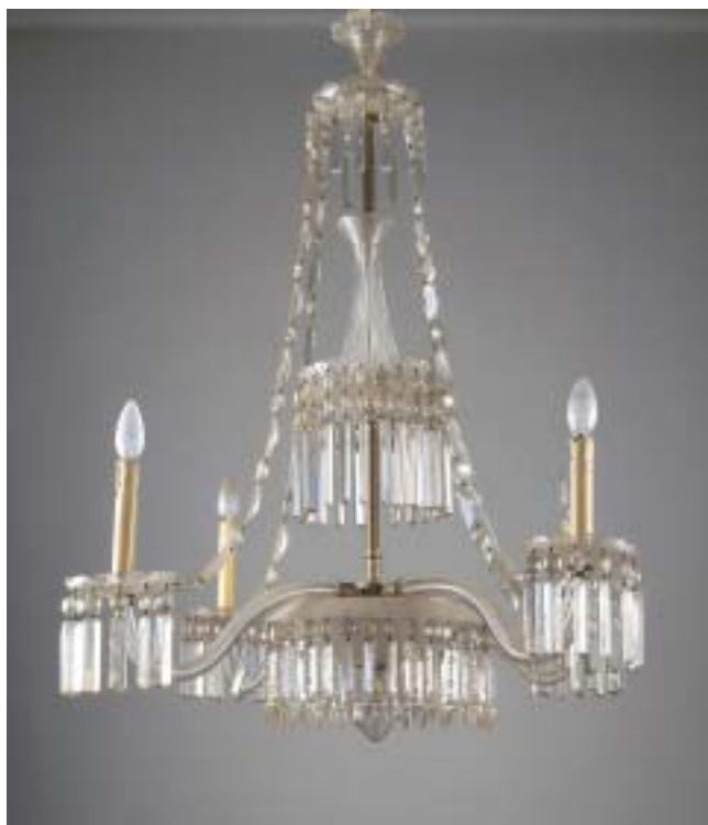
456 LUSTRE DE QUATRO BRAÇOS COM PINGENTES, cristal, electrificado, séc. XX, pequenas faltas e defeitos Dim. - 102 cm € 500 - 750