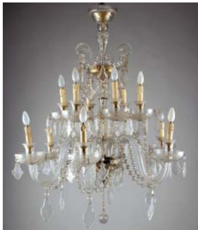
458 LUSTRE DE DOZE BRAÇOS COM PINGENTES, cristal, electrificado, séc. XIX/XX, pequenas faltas e defeitos Dim. - 117 cm € 1.000 - 1.500