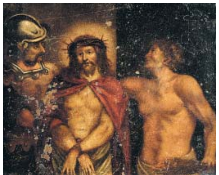
396 "SENHOR DA CANA VERDE" , óleo sobre cobre, escola portuguesa, séc. XVII, faltas na tinta, moldura em madeira lacada e tartaruga Dim. - 14 x 17 cm € 300 - 450