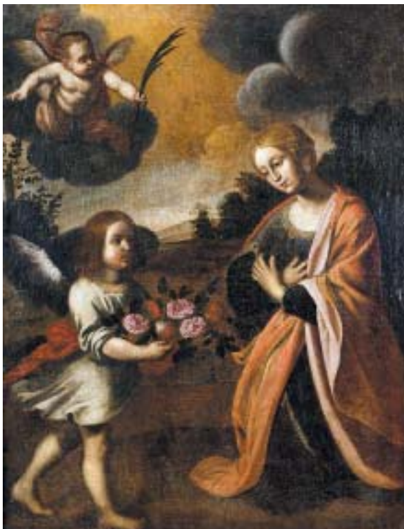
398 "SENHORA RECEBENDO FLORES DE AMOR", óleo sobre tela, séc. XVII/XVIII, reentelado e restaurado Dim. - 130 x 97 cm