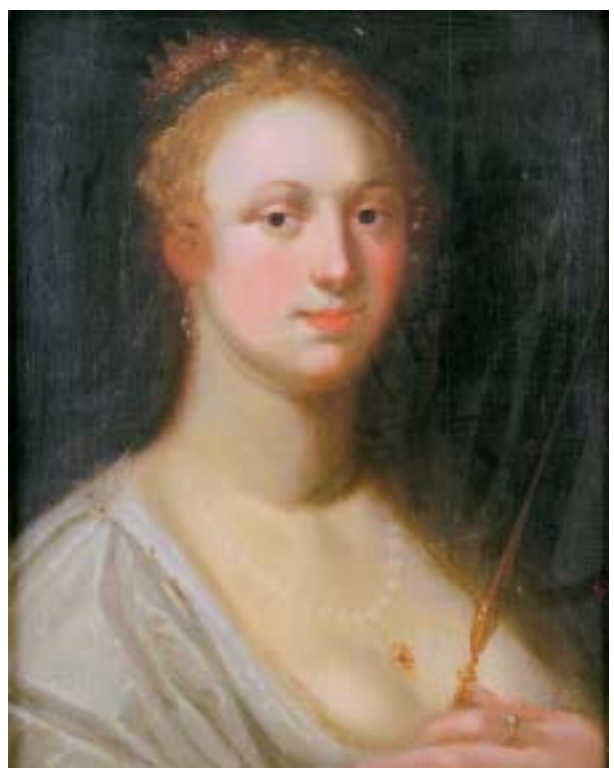
400 "SANTA COROADA", óleo sobre madeira, Europa Central, séc. XVII, pequenos defeitos Dim. - 55 x 43 cm