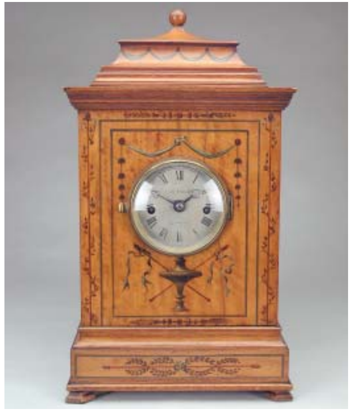
454 RELÓGIO DE MESA , estilo neoclássico, pau cetim, pintado "laços e grinaldas", inglês, séc. XIX, mecanismo a necessitar concerto Dim. - 45 cm