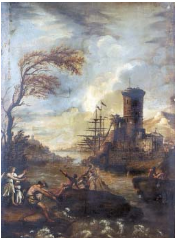
534 "PAISAGEM COM FIGURAS E RUÍNAS", óleo sobre tela, escola italiana, séc. XVIII, faltas e defeitos Dim. - 95,5 x 70 cm