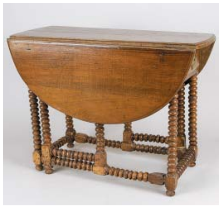
316 MESA DE ABAS, carvalho, travejamento torneado, inglesa, séc. XVIII, pequenos defeitos Dim. - 75 x 102 x 47,5 cm