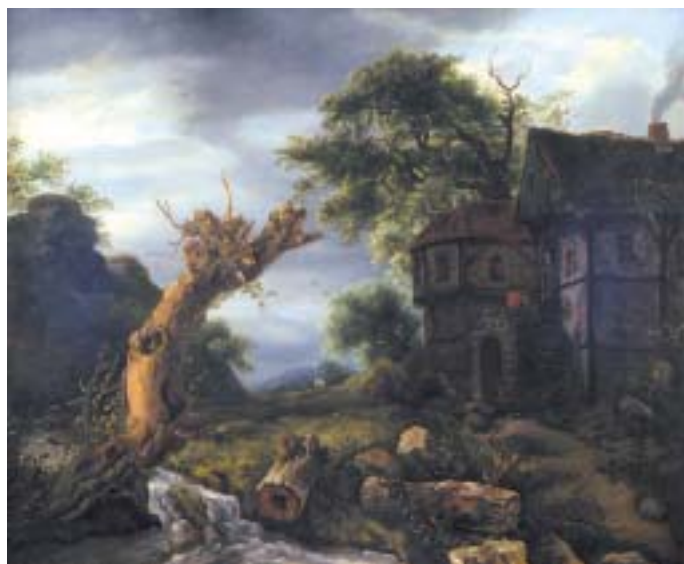
537 "PAISAGEM COM RIBEIRO, CASA E FIGURAS", óleo sobre tela, escola holandesa, séc. XVIII/XIX, reentelado, restauros Dim. - 67,5 x 81 cm