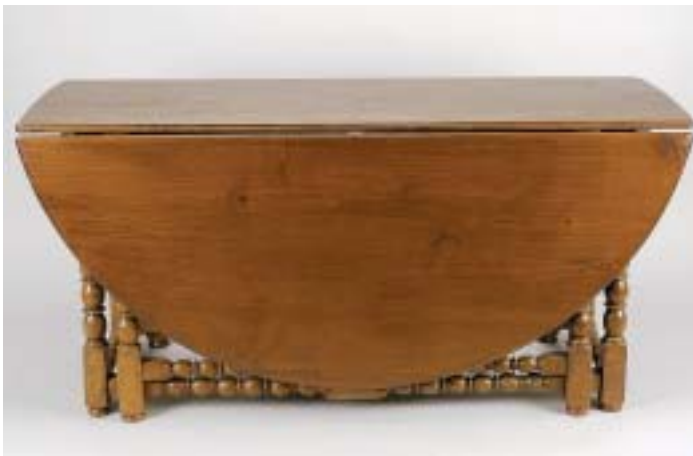
318 MESA DE ABAS DE GRANDES DIMENSÕES, carvalho, abas redondas, inglesa, séc. XIX, pequenos defeitos Dim. - 76 x 162 x 59 cm