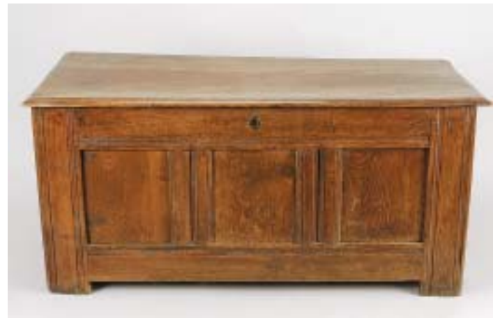
320 ARCA, carvalho apanelado, inglesa, séc. XVII, pequenos defeitos Dim. - 64 x 136 x 59 cm