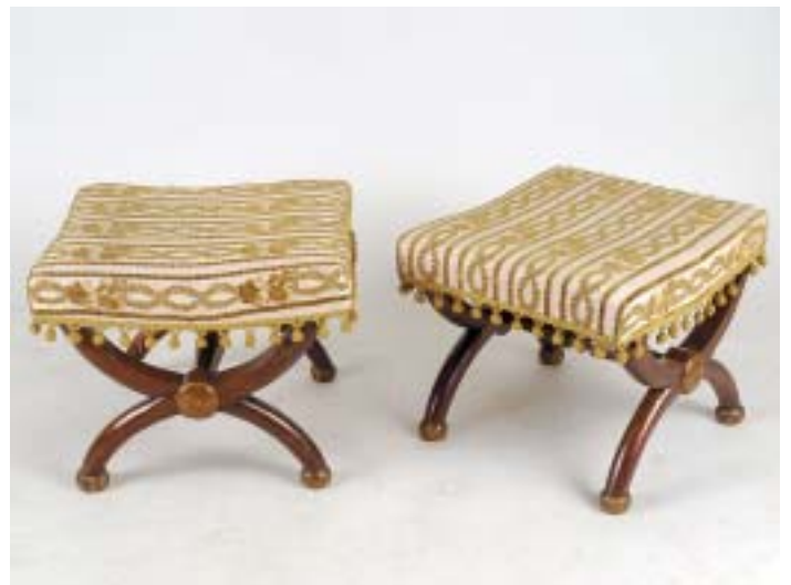
312 PAR DE BANCOS COM PERNAS EM X, nogueira com entalhamentos, estofamento posterior, séc. XIX, pequenas faltas e defeitos Dim. - 38 x 46,5 x 40 cm € 500 - 750