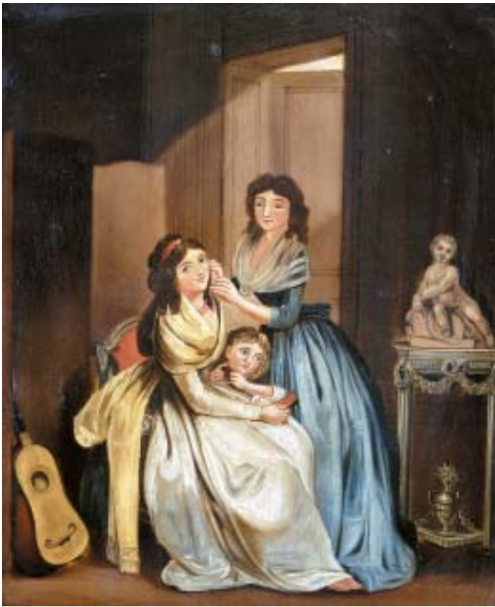
538 "CENAS DE INTERIOR", par de óleos sobre tela, escola inglesa, séc. XIX, ligeiros defeitos Dim. - 45,5 x 38,5 cm