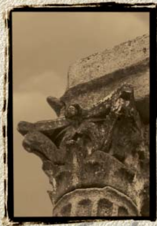
Centro Histórico de Évora. Património Mundial UNESCO 1986