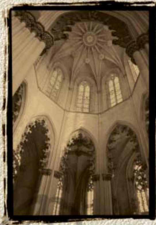
Mosteiro da Batalha Património Mundial UNESCO | 1983