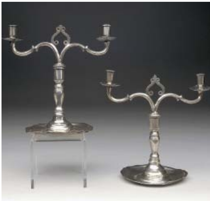
1034 PAR DE CANDELABROS MINIATURA COM DOIS LUMES, prata, sem marcas, portugueses, séc. XVIII, amolgadelas e restauro Dim. - 14 cm; Peso - 225 grs. €1.000 - 1.500