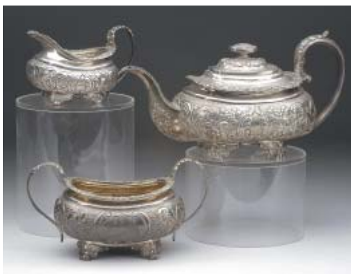
I334 SERVIÇO DE CHÁ , prata e prata dourada, decoração gravada "paisagem", composto por bule, leiteira e açucareiro, contraste de Londres (1779-1780), marca de ourives CP, inglês, séc. XVIII, decoração sumida Dim. - 15,5 cm; Peso - 1.532 grs. € 600 - 900