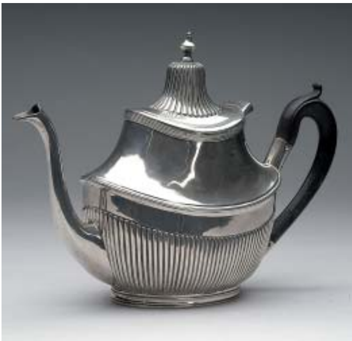
1031 BULE, D. Maria, prata gomada, contraste do Porto (1818-1836), marca de ourives IFG (1783-1836) (M. A. - P26 e P268), português, séc. XIX, remarcado com cabeça de velho, pequena falta na pega Dim. - 20,5 cm; Peso - 992 grs. € 1.500 - 2.250