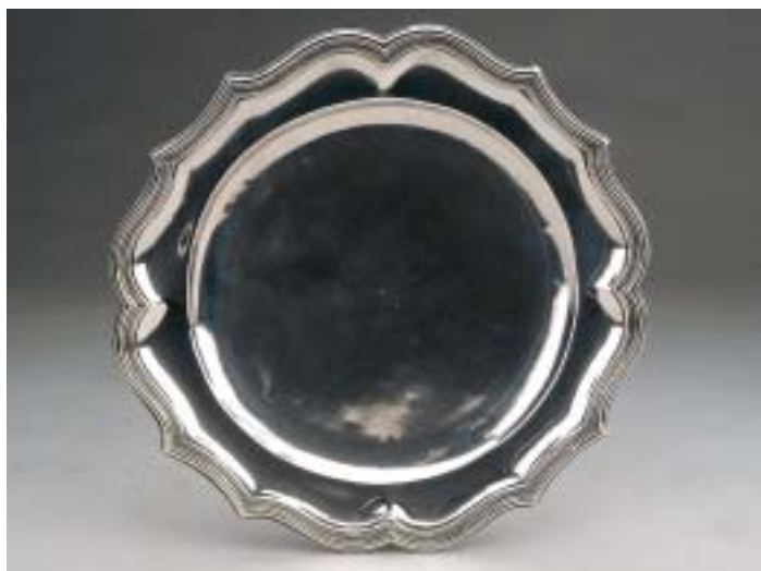
1062 PRATO RECORTADO , prata, contraste de Madrid (1738), marca de ourives não identificado, espanhol, séc. XVIII, marcas muito sumidas vd. nota ao lote nº 1060 Dim. - 25 cm; Peso - 494 grs. € 100 - 150