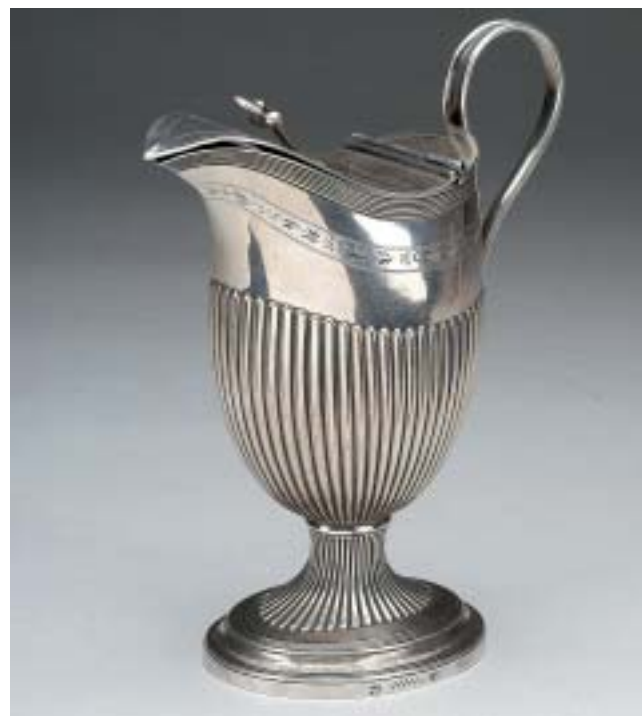
1036 LEITEIRA, D. Maria, prata, contraste do Porto (1784-1790), marca de ourives M H P (1784-1810) (M. A. - P15 e P469), portuguesa, séc. XVIII Dim. - 19 cm; Peso - 932 grs. €1.250 - 1.875