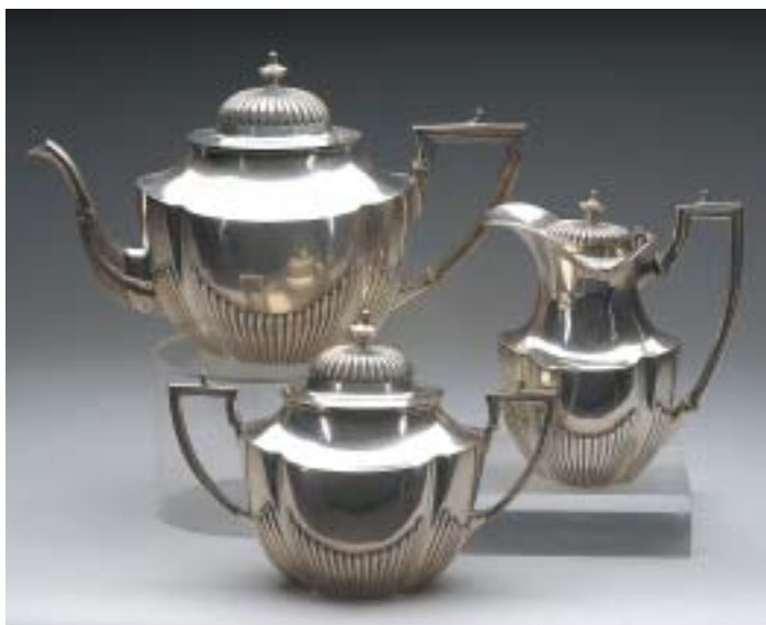
1046 SERVIÇO DE CHÁ , estilo D. Maria, prata, composto por bule, leiteira e açucareiro, contraste Javali do Porto (1887-1937), marca de ourives ilegível (Vidal - 73), português, séc. XIX/XX Dim. - 19 cm; Peso - 2.260 grs. € 1.000 - 1.500