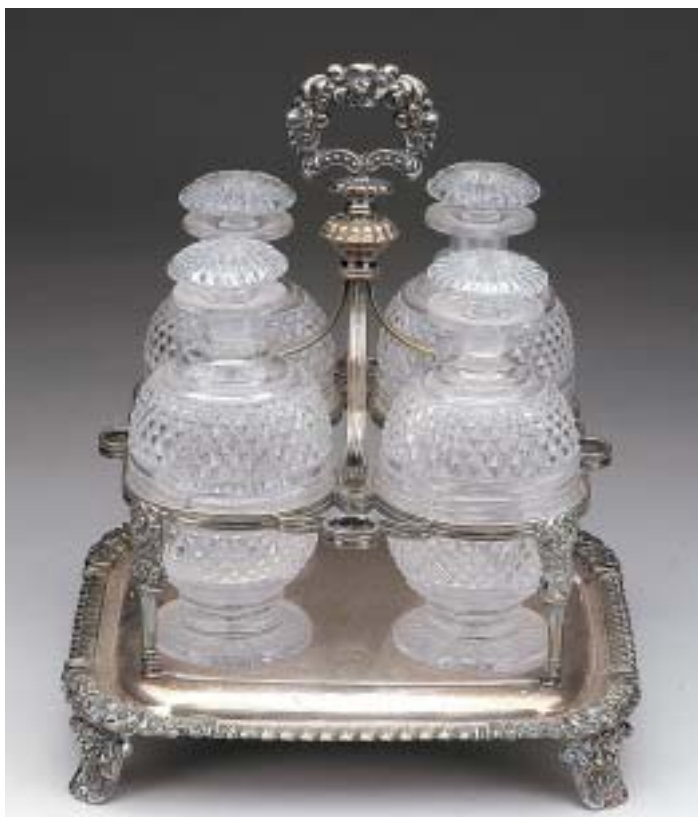
I331 PORTA GARRAFAS , metal prateado, quatro garrafas em cristal lapidado, séc. XIX/XX, defeitos Dim. - 32 cm € 180 - 270