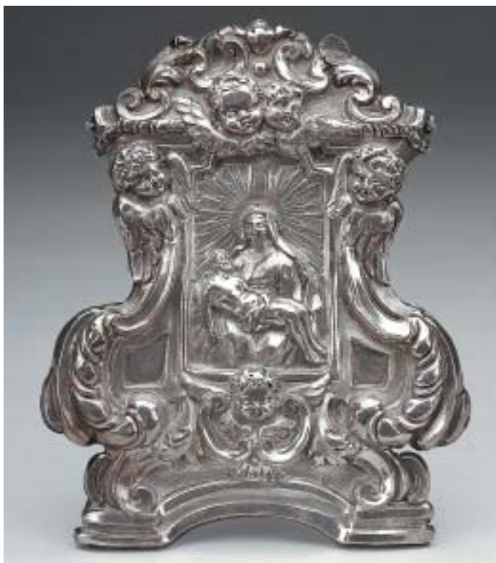
1055 PORTA-PAZ, prata relevada "Pietà", marcas eclesiásticas, Vaticano (?), séc. XVII/XVIII Dim. - 17 cm