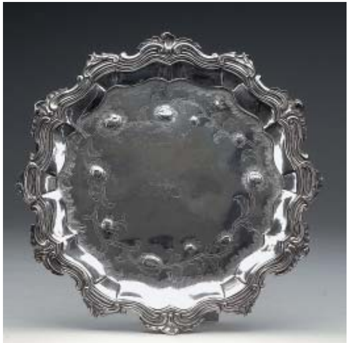
1032 SALVA, D. José, prata, monogramada, decoração gravada, cinzelada e relevada, sem marcas, portuguesa, séc. XVIII, pés posteriores, pequeno defeito Dim. - 27 cm; Peso - 445 grs. € 480 - 720