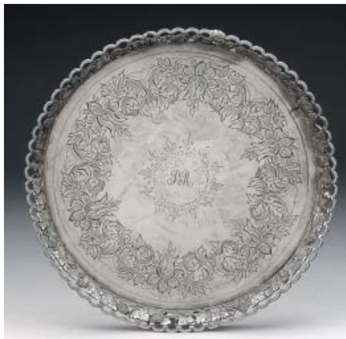
1037 SALVA DE GRADINHA COM TRÊS PÉS, prata, monogramada, contraste do Porto (1853-1861), marca de ourives JGTA (1853-1877) (M. A. - P45 e P392), portuguesa, séc. XIX Dim. - 31,5 cm; Peso - 1.025 grs. €600 - 900