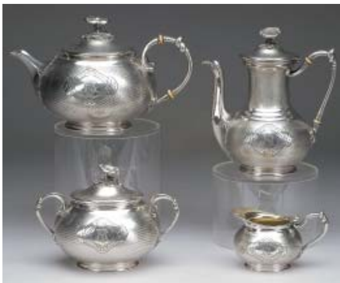
I332 SERVIÇO DE CHÁ E DE CAFÉ , casquinha, monogramado, composto por bule, cafeteira, açucareiro e leiteira, francês, séc. XIX/XX, marcado Dim. - 20 cm € 200 - 300