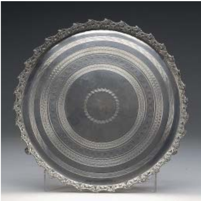
1030 SALVA DE GRADINHA COM TRÊS PÉS, prata guilochada, contraste do Porto (1870-1877), marca de ourives M J M (1870-1881) (M. A. - P58 e P58), portuguesa, séc. XIX Dim. - 31 cm; Peso - 635 grs. € 650 - 975