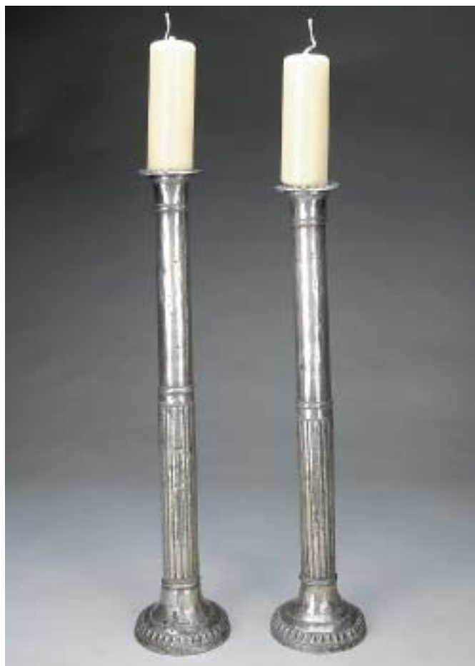
1061 PAR DE TOCHEIROS , madeira revestida a folha de prata, sem marcas, brasileiros, séc. XVIII, um ligeiramente menor, amolgadelas, restauros e defeitos; Dim. - 56 cm € 2.500 - 3.750