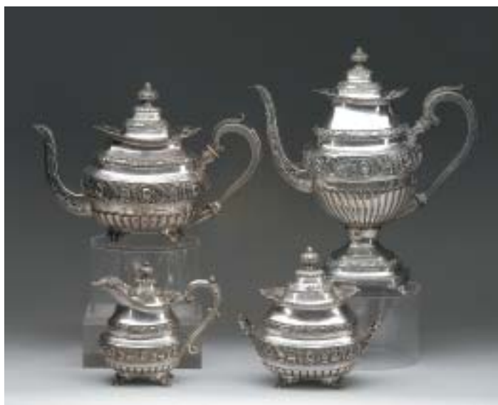
1048 SERVIÇO DE CHÁ E DE CAFÉ , prata, composto por bule, cafeteira, leiteira e açucareiro, contraste do Porto (1843-1853), marca de ourives A P C (1836-1853) (M. A. - P34 e P171), português, séc. XIX Dim. - 33,5 cm; Peso - 3.914 grs. € 3.000 - 4.500