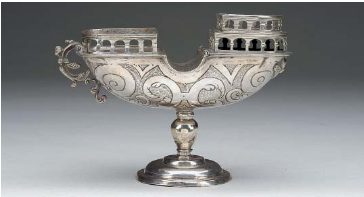
1056 NAVETA, maneirista, prata, sem marcas,