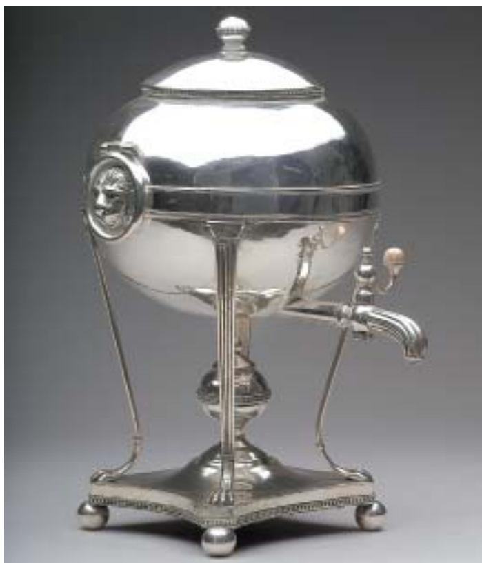
I333 SAMOVAR , casquinha, lamparina, puxador em marfim, sem marcas, inglês, séc. XIX/XX, restauros Dim. - 37 cm € 300 - 450