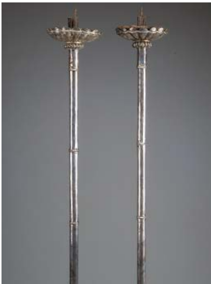
1059 PAR DE VARAS CÍRIAS , Lusíadas, madeira revestida a folha de prata, indo-portuguesas, séc. XVII, pequenos defeitos; Dim. - 172,5 cm € 2.500 - 3.750