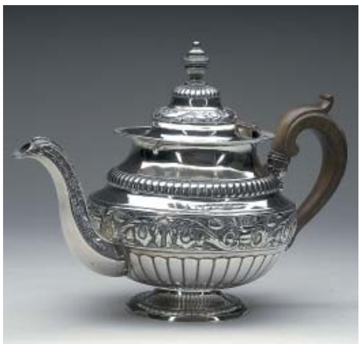
1033 BULE, prata, contraste do Porto (1843-1853), marca de ourives HIS (1843-1853) (M. A. - P35 e P300), português, séc. XIX Dim. - 22 cm; Peso - 1.176 grs. € 2.000 - 3.000