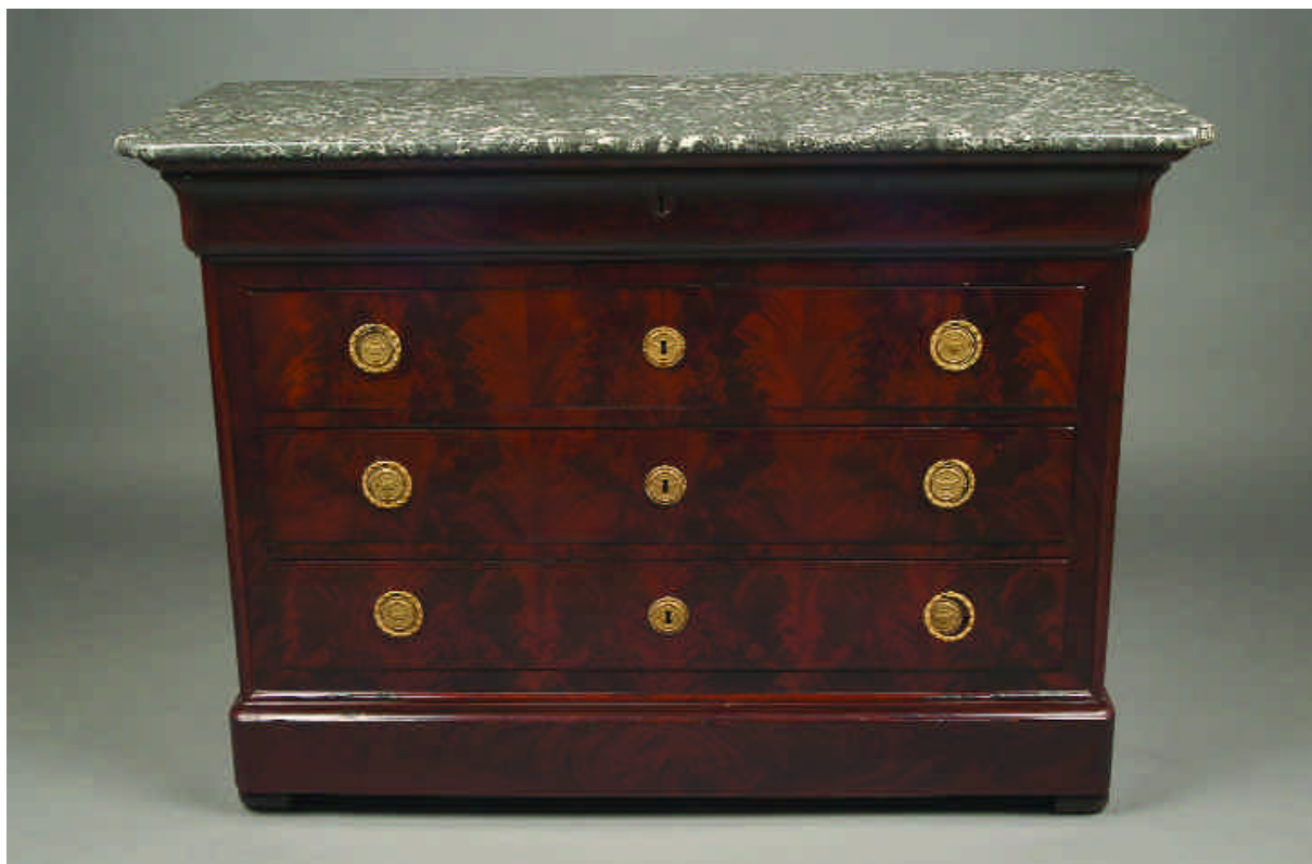
68 CÓMODA LUÍS FILIPE EM MOGNO E RAIZ DE MOGNO, tampo de mármore, francesa, séc. XIX, pequenos defeitos Dim. - 94 x 132,5 x 58,5 cm