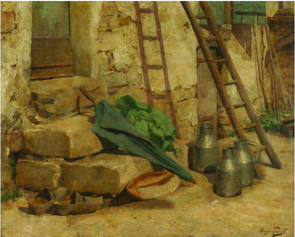
I64 SOUSA PINTO - 1856-1939 "Pátio rural", óleo sobre tela, ligeiros restauros, assinado Dim. - 33 x 41 cm