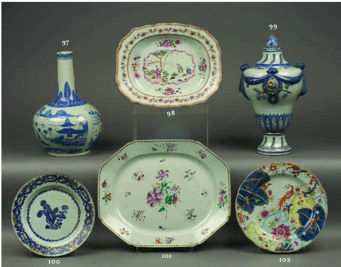
97 GARRAFA DE GRANDES DIMENSÕES EM PORCELANA DA CHINA , decoração a azul "Cantão", reinado Jiaqing, séc. XVIII/XIX esbeçadelas no bocal e furo no fundo Dim. - 38 cm € 1.400 - 2.100