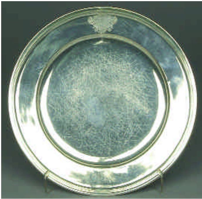
771 PRATO BRASONADO EM PRATA PORTUGUESA, decoração gravada com armas plenas da família Figueiroa, séc. XVIII, marca de ourives do Porto "A F" (1758-1768) (M. A. - PII e PIII) Dim. - 24,5 cm; Peso - 423 grs. € 1.800 - 2.500