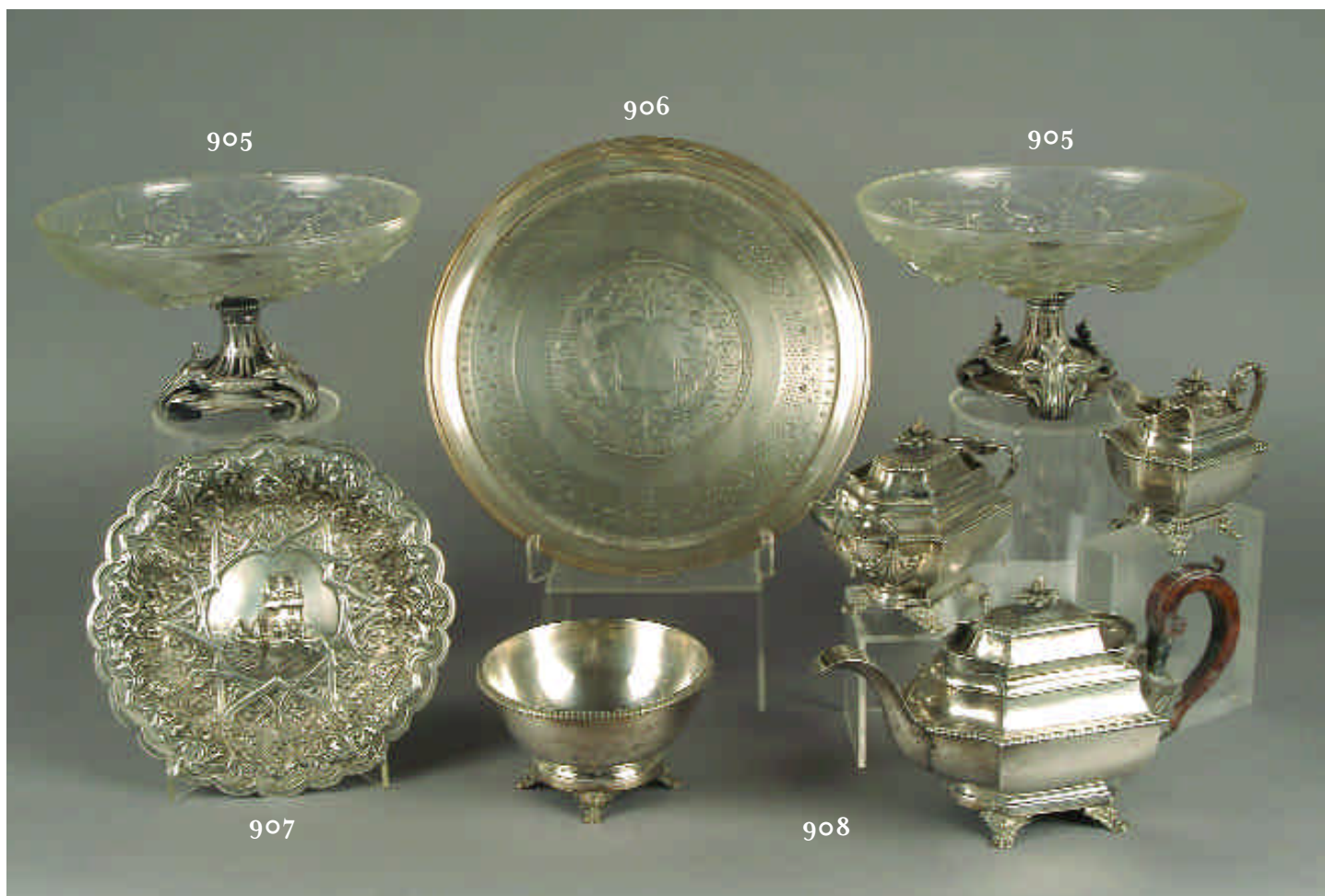
905 PAR DE TAÇAS EM CRISTAL RELEVADO "ROSAS", pés em metal prateado, séc. XIX/XX, pés marcados "Christofle" Dim. - 16,5 cm