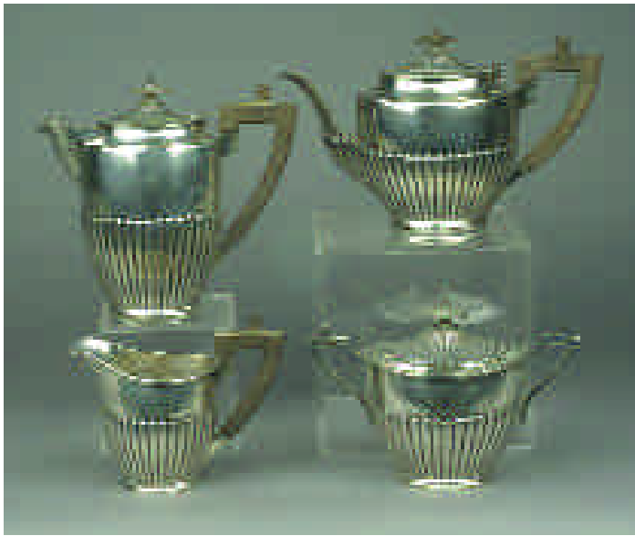
776 SERVIÇO DE CHÁ E DE CAFÉ GOMADO EM PRATA PORTUGUESA composto por bule, cafeteira, açucareiro e leiteira, séc. XX, contraste Águia do Porto (1937-1984) (Vidal - 49) Dim. - 20 cm Peso - 1.850 grs. € 1.000 - 1.500