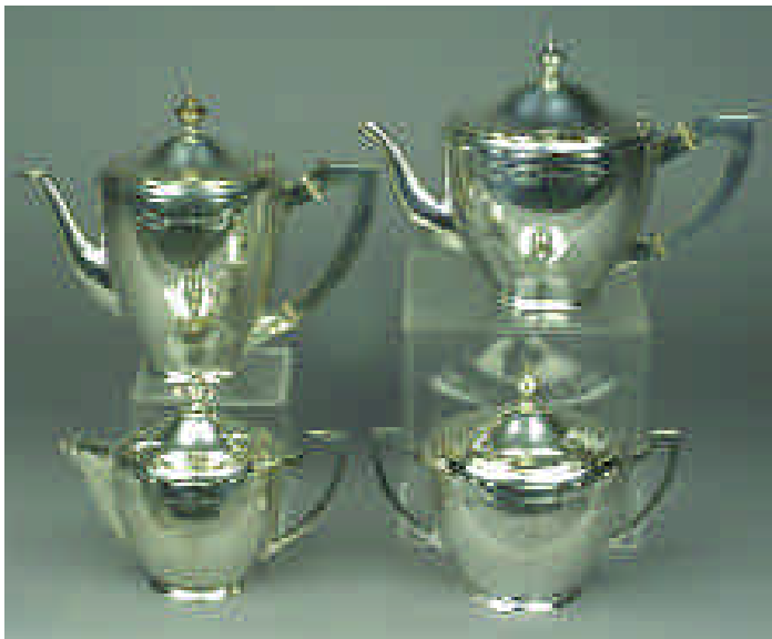
777 SERVIÇO DE CHÁ E DE CAFÉ EM PRATA PORTUGUESA, composto por bule, cafeteira, açucareiro e leiteira, séc. XX, contraste Águia de Lisboa (1938-1984), marca da "Joalheria do Carmo" (Vidal - 45) Dim. - 20 cm; Peso - 3.650 grs. € 1.800 - 2.500