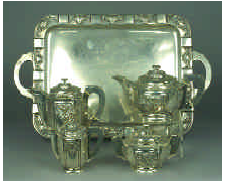
779 SERVIÇO DE CHÁ E DE CAFÉ EM PRATA ESTRANGEIRA, composto por bule, cafeteira, açucareiro, leiteira e bandeja, séc. XX, marca de 800 % Dim. - 17,5 cm (cafeteira) 58 x 37 cm (tabuleiro) Peso - 4.107 grs. € 2.000 - 3.000