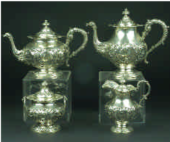
766 SERVIÇO DE CHÁ E DE CAFÉ "BICO DE AVE" EM PRATA PORTUGUESA, composto por bule, cafeteira, açucareiro e leiteira, séc. XIX, contraste do Porto (1861-1867), marca de ourives "ABR" (1861-1867) (M. A. - P53 e P100)