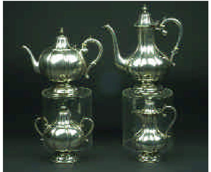
768 SERVIÇO DE CHÁ E DE CAFÉ GOMADO EM PRATA PORTUGUESA composto por bule, cafeteira, açucareiro e leiteira, séc. XIX/XX, contraste Javali do Porto (1887-1937) (Vidal - 73)