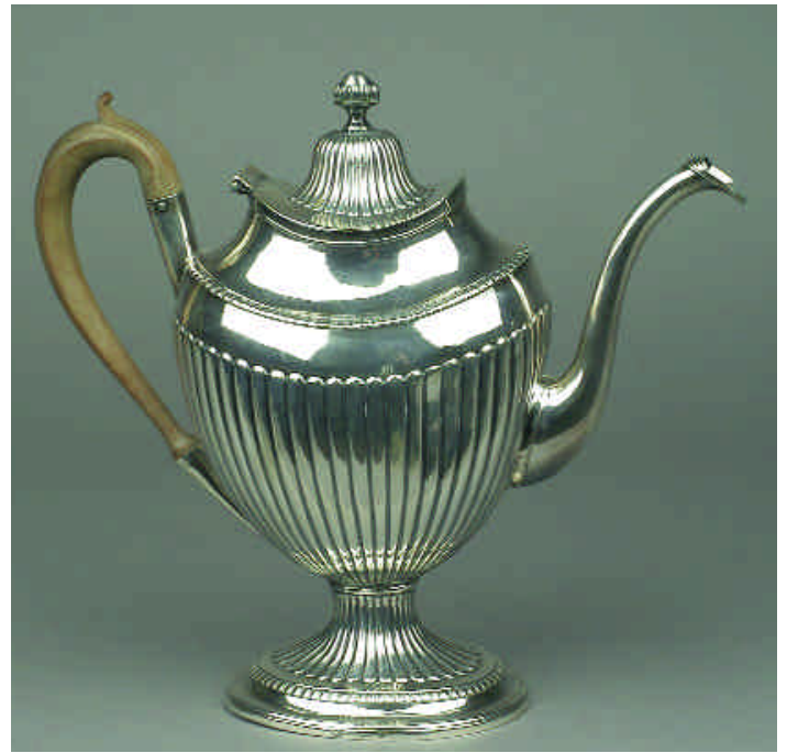
773 BULE GOMADO DE GRANDES DIMENSÕES EM PRATA PORTUGUESA, séc. XIX, contraste do Porto (1810 - 1818), marca de ourives ilegível (M. A. - P23), amolgadela Dim. - 28,5 cm Peso - 1.066 grs. € 1.500 - 2.250