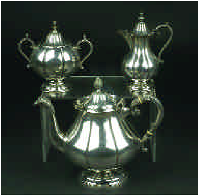
765 SERVIÇO DE CHÁ GOMADO EM PRATA PORTUGUESA, composto por bule, açucareiro e leiteira, séc. XIX/XX, contraste Javali do Porto (1887-1937) (Vidal - 73)