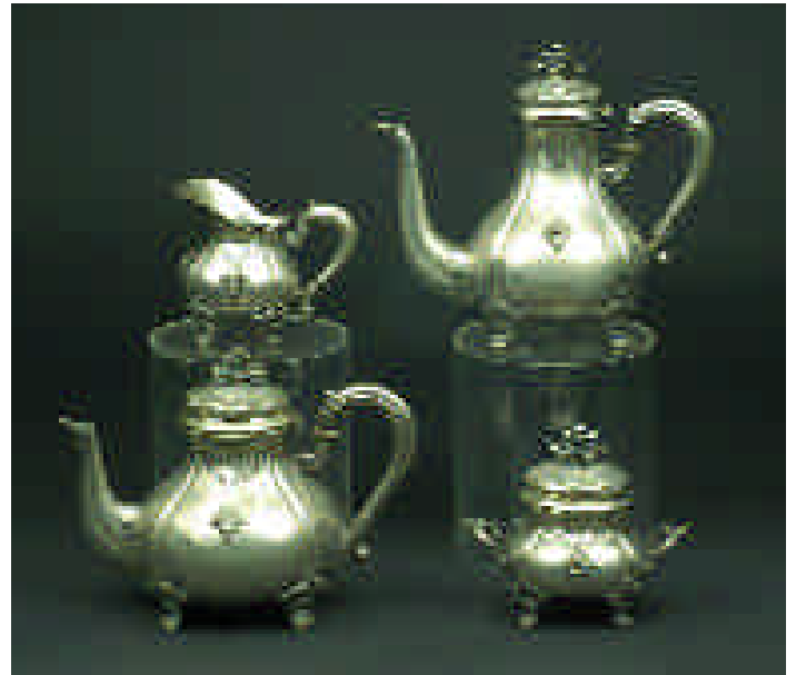
774 SERVIÇO DE CHÁ E DE CAFÉ EM PRATA PORTUGUESA, composto por bule, cafeteira, açucareiro e leiteira, séc. XIX/XX, contraste Javali do Porto (1887-1937) (Vidal - 73) Dim. - 22,5 cm Peso - 2.180 grs. € 1.400 - 2.000