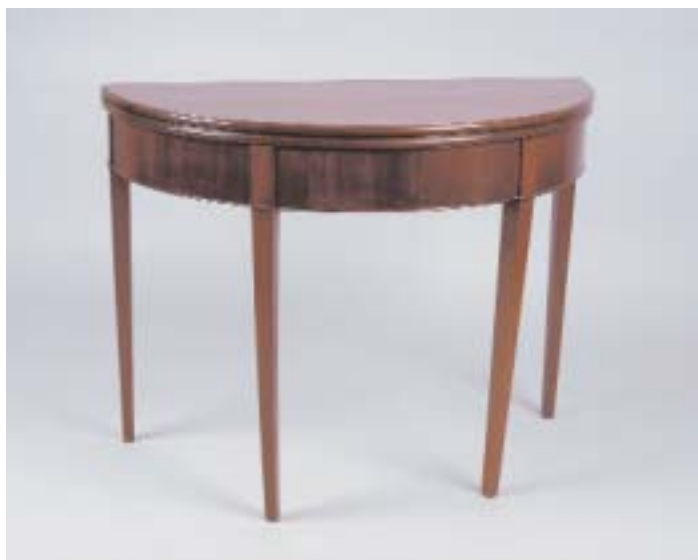
722 MESA DE JOGO DE MEIA LUA NEOCLÁSSICA EM MOGNO, séc. XVIII/XIX, pequenos defeitos Dim. - 75 x 97 x 44,5 cm