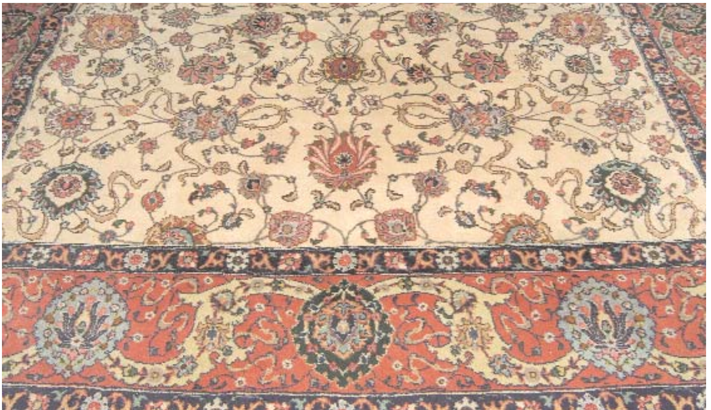
899 TAPETE ORIENTAL EM FIO DE LÃ , decoração policromada, séc. XX, pequenos defeitos Dim. - 390 x 294 cm