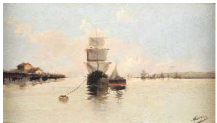
669 MUÑOZ - SÉC. XIX/XX

"Marinhas - barcos junto à costa", par de óleos sobre madeira, escola espanhola, defeitos, um assinado