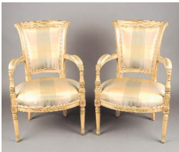
600 PAR DE FAUTEUILS ESTILO DIRECTÓRIO EM MADEIRA PINTADA E DOURADA, assentos, braços e costas forrados a seda com galões, franceses, séc. XIX, pequenos defeitos Dim. - 87,5 x 55,5 x 51 cm