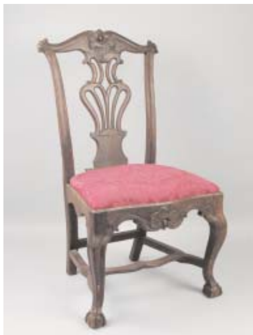
721 CADEIRA D. JOSÉ EM NOGUEIRA COM ENTALHAMENTOS, assento estofado a damasco vermelho, portuguesa, séc. XVIII, pequenas faltas e defeitos Dim. - 103 x 58 x 49 cm