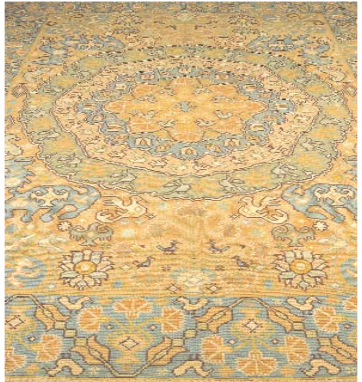
900 TAPETE DE ARRAIOLOS EM FIO DE LÃ , decoração policromada com bordo de fundo azul, séc. XIX/XX, defeitos Dim. - 293 x 218 cm 1.000 - 1.500