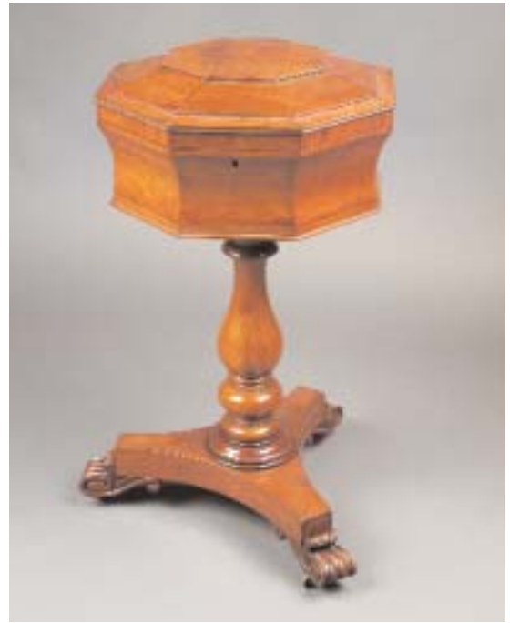
606 CAIXA PARA CHÁ VICTORIANA EM MOGNO COM COLUNA CENTRAL, pés com entalhamentos, inglesa, séc. XIX, falta de recipientes no interior Dim. - 73,5 x 40 x 40 cm