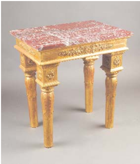
604 CONSOLE DE CENTRO ESTILO NEOCLÁSSICO EM MADEIRA ENTALHADA E DOURADA, tampo de mármore, francesa, séc. XIX/XX, pequenos defeitos Dim. - 70 x 66 x 47,5 cm