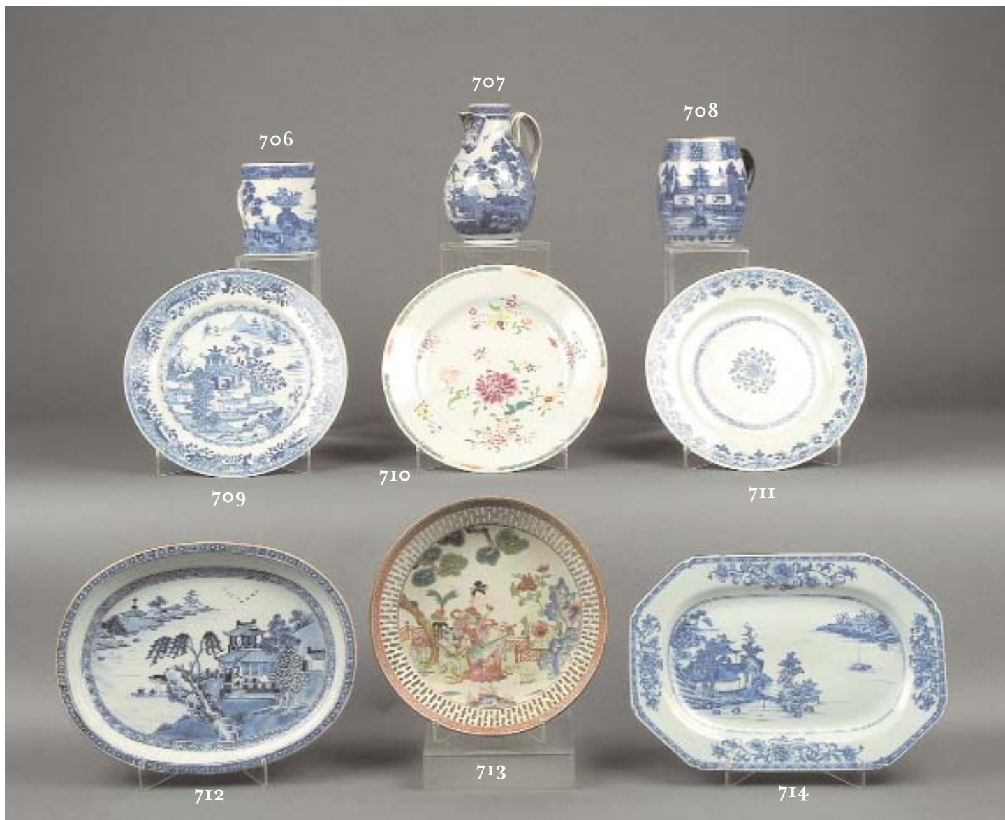
706 CANECA EM PORCELANA DA CHINA, decoração a azul "jardim oriental" reinado Qianlong, séc. XVIII, falha e cabelo Dim. - 12 cm 150 - 225