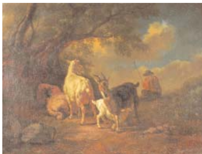
665 "PAISAGEM COM REBANHO E PASTOR",

óleo sobre tela, escola holandesa, séc. XVIII/XIX