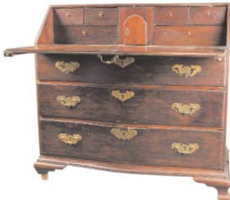
718 PAPELEIRA D. MARIA EM VINHÁTICO, interior com gavetas direitas, portuguesa, séc. XVIII/XIX, defeitos Dim. - 112 x 123 x 58 cm