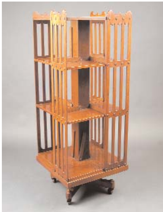
599 ÉSTANTE GIRATÓRIA EM MOGNO, estampilhada "J. DERU & C o - 24 PLACE DES VOSGES", francesa, séc. XIX, pequenos defeitos Dim. - 123,5 x 44,5 x 45 cm