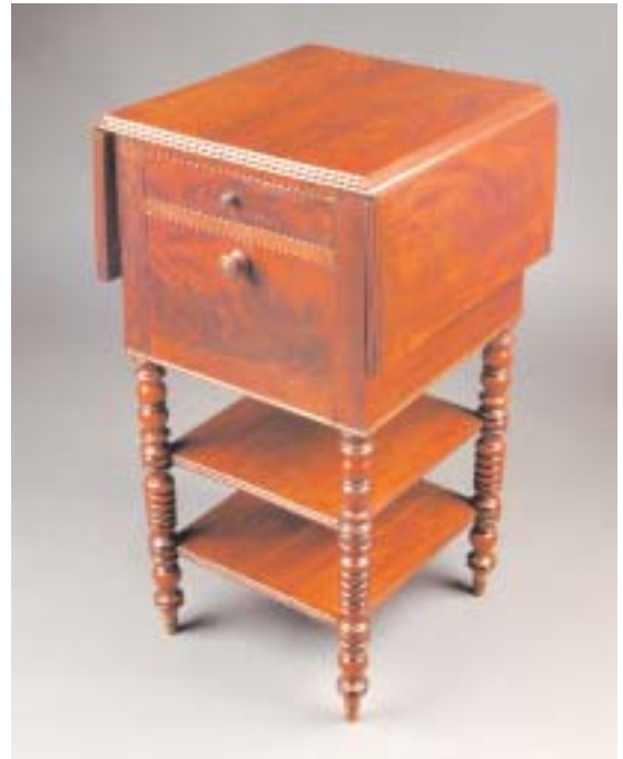
607 MESA DE APOIO COM ABAS EM MOGNO E RAIZ DE MOGNO, francesa, séc. XIX, pequenos restauros Dim. - 71 x 38,5 x 37 cm