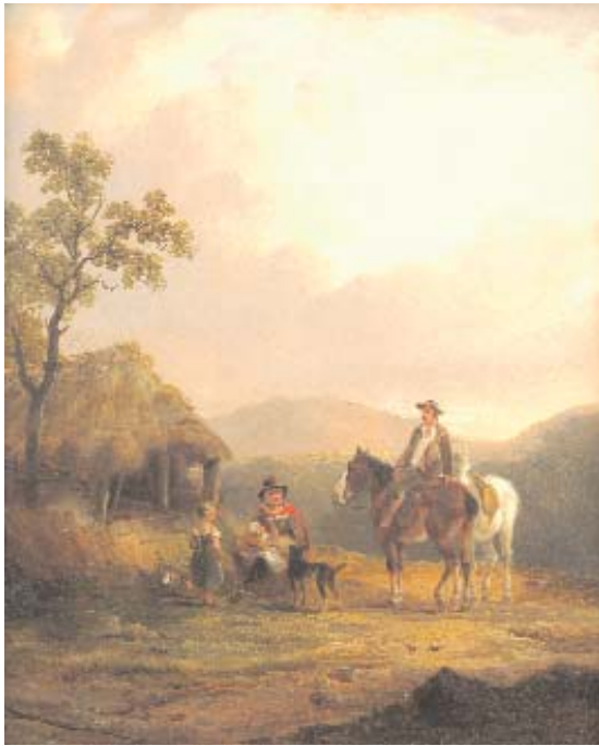
666 "PAISAGEM COM FIGURAS E ANIMAIS"

óleo sobre cartão, escola inglesa, séc. XIX