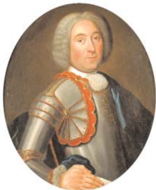
662 "RETRATO DE FIDALGO COM ARMADURA"

óleo oval sobre tela, séc. XVIII, restauro na zona central