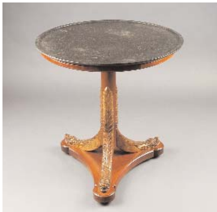
597 MESA REDONDA RESTAURAÇÃO EM MOGNO, coluna central com entalhamentos dourados "golfinhos", tampo de mármore cinzento, francesa, séc. XIX, pequenos defeitos Dim. - 71 x 62 cm