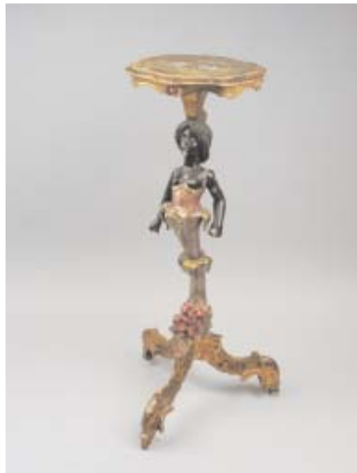
601 COLUNA FLOREIRA EM MADEIRA ENTALHADA, PINTADA E DOURADA, fuste com "busto de negra" veneziana, séc. XIX, faltas e defeitos Dim. - 93,5 cm