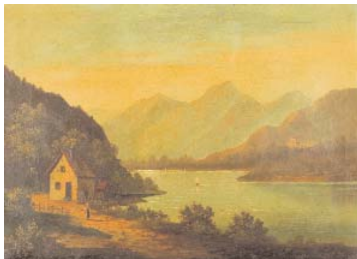
657 LOHMAN - SÉC. XIX "Paisagem com lago", óleo sobre tela, assinado e datado de 1873 Dim. - 46,5 x 45 cm