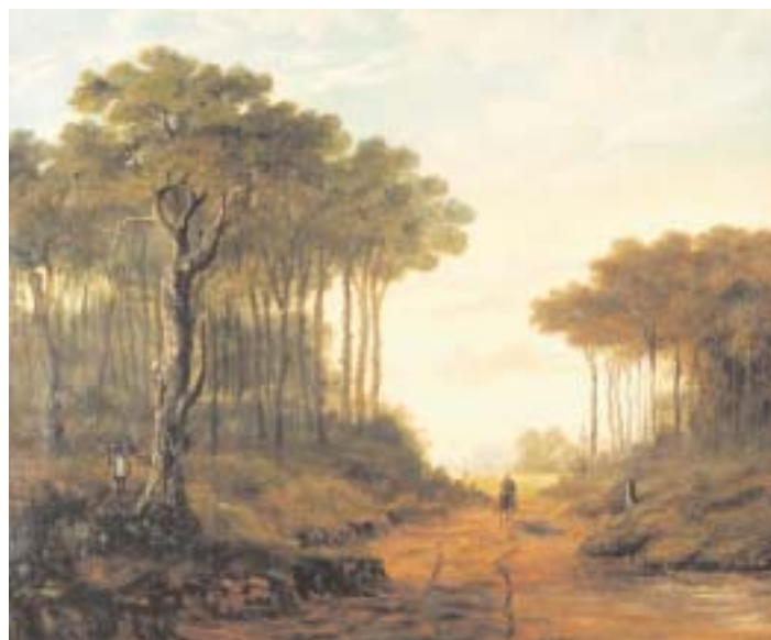
656 A. J. SAR - SÉC. XIX "Paisagem com cavaleiro", óleo sobre cartão, assinado Dim. - 58 x 70 cm