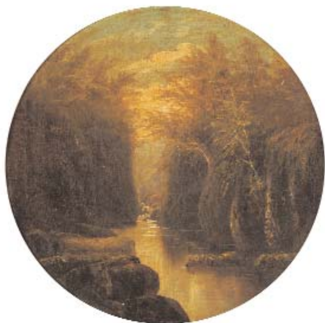
654 "PAISAGEM COM LAGO" óleo sobre tela, escola inglesa, séc. XIX, passepartout redondo, pequena falta de tinta Dim. - 41 x 40,5 cm