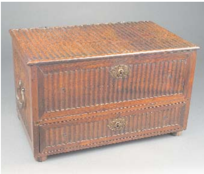
917 ARCA DE TREMIDOS EM PAU SANTO COM GAVETA, portuguesa, séc. XVII/XVIII, restauros e pequenos defeitos Dim. - 32,5 x 53 x 32,5 cm