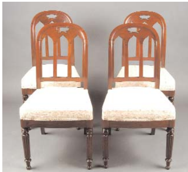
602 QUATRO CADEIRAS RESTAURAÇÃO EM MOGNO, assentos estofados, marcadas a carimbo "JALLOT", francesas, séc. XIX, pequenos defeitos Dim. - 87 x 45 x 40 cm