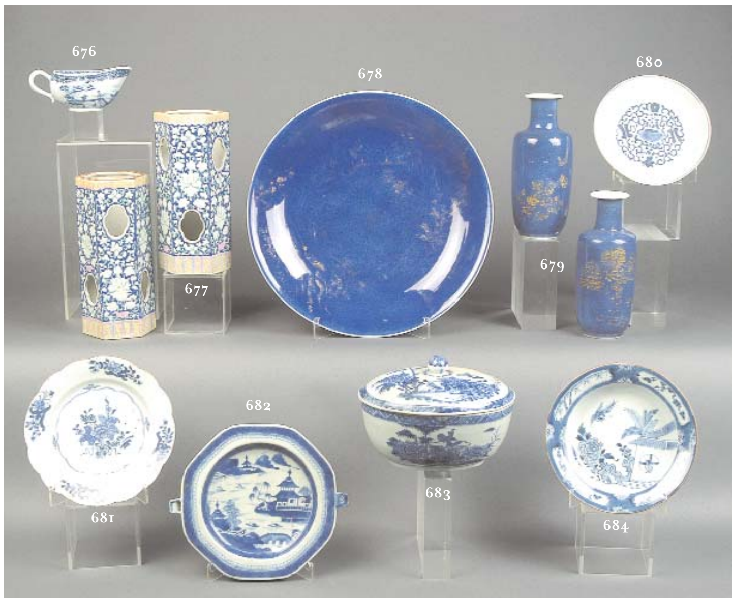
676 MOLHEIRA EM PORCELANA DA CHINA, decoração a azul "paisagem oriental", reinado Qianlong, séc. XVIII, cabelo e esbeçadelas Dim. - 7 x 18 cm 250 - 375