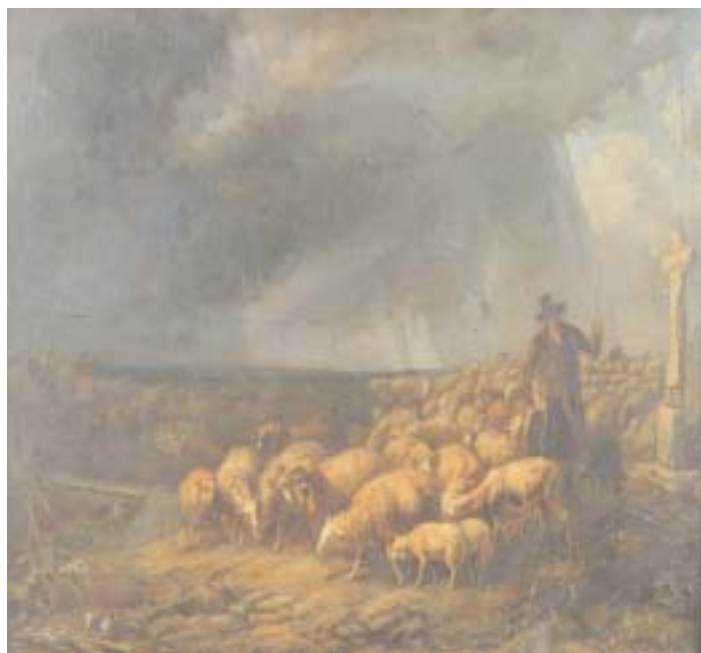
663 "HOMEM COM REBANHO"

óleo sobre madeira, escola inglesa, séc. XIX, restaurado