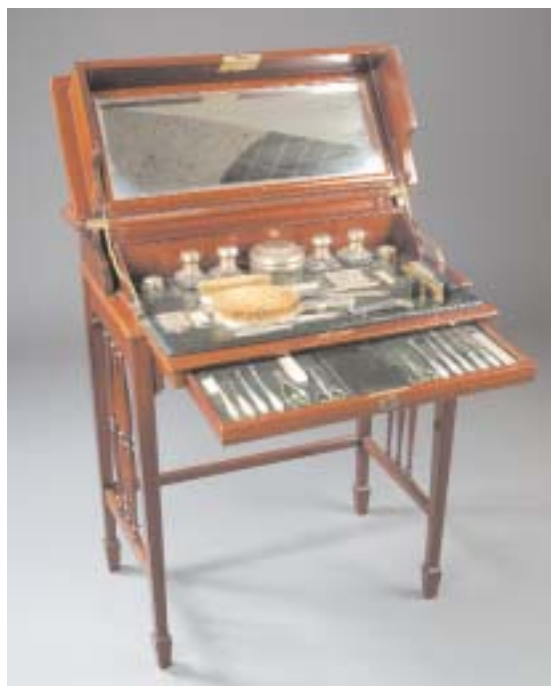
723 MÓVEL TOUCADOR EDUARDIANO EM MOGNO, interior com utensílios em prata inglesa, séc. XX, pequenos defeitos e falta de alguns utensílios Dim. - 81 x 68,5 x 41 cm