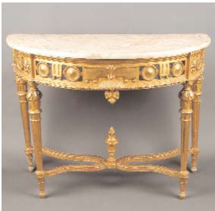
596 CONSOLE DE MEIA LUA D. MARIA EM MADEIRA ENTALHADA E DOURADA, tampo de mármore, portuguesa, séc. XVIII/XIX, pequenos defeitos Dim. - 85 x 110 x 54,5 cm