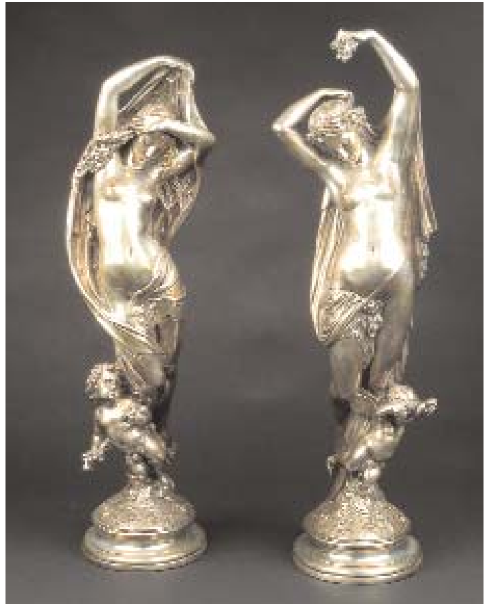
918 "FIGURAS FEMININAS NUAS E PUTTI", par de esculturas em metal prateado, séc. XIX/XX Dim. - 68 cm