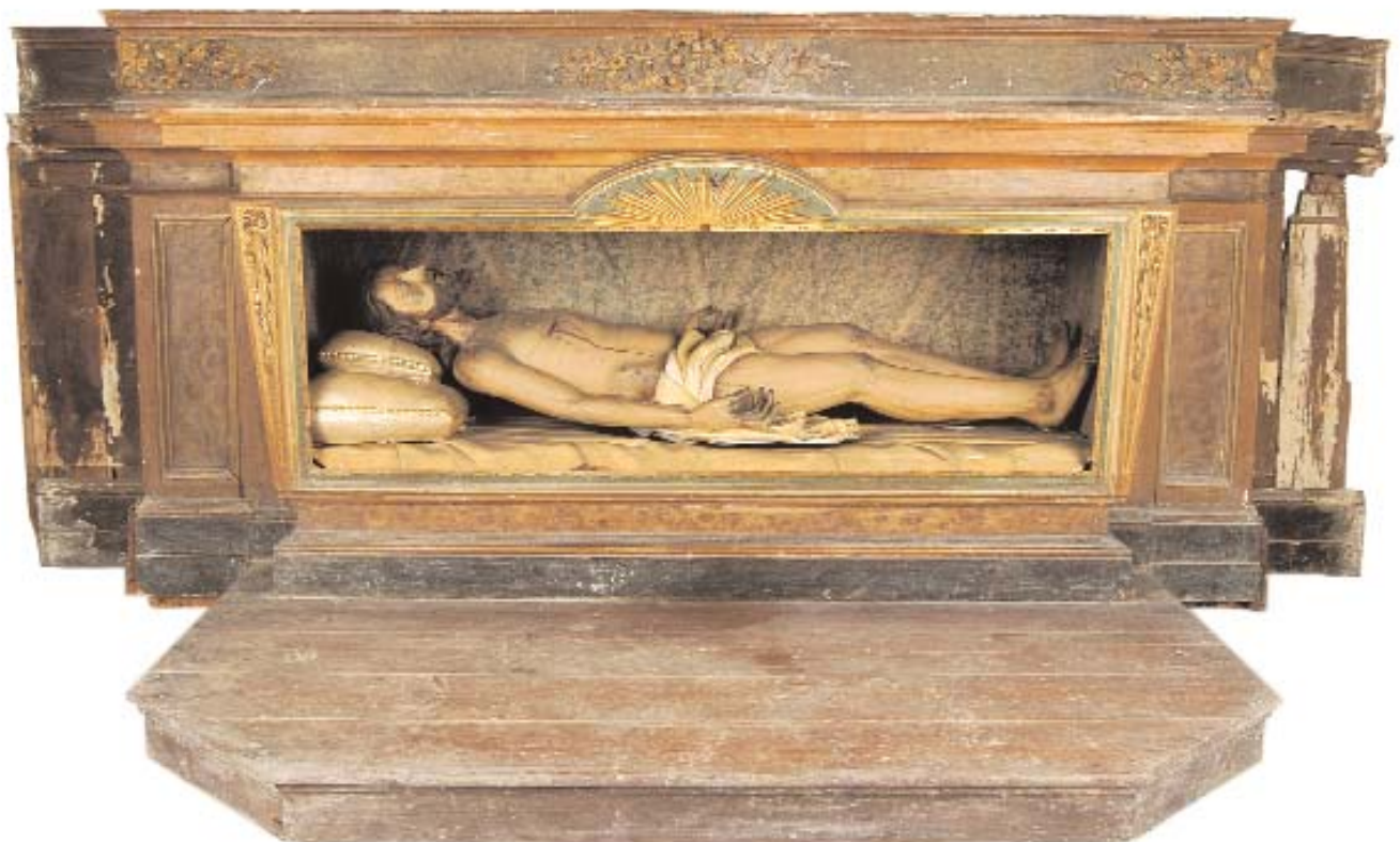
914 ALTAR D. MARIA EM MADEIRA ENTALHADA, MARMOREADA E DOURADA COM "CRISTO JACENTE" escultura em madeira policromada, português, séc. XVIII/XIX, faltas e defeitos Dim. - 125 x 310 x 156 cm 500 - 750