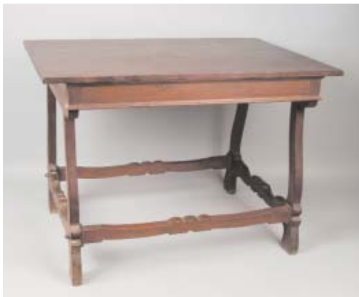
715 MESA FILIPINA EM SICUPIRA VERMELHA COM TAMPO EM MOGNO, portuguesa, séc. XVII, tampo posterior, restauros Dim. - 80 x 114,5 x 78 cm