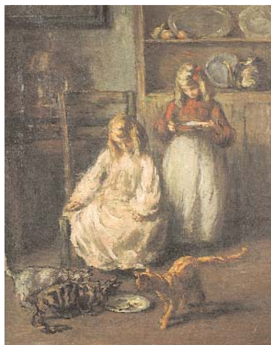
664 MULLER - SÉC. XIX/XX

"Gémeas", óleo sobre tela, pequeno restauro, assinado e datado de 1904