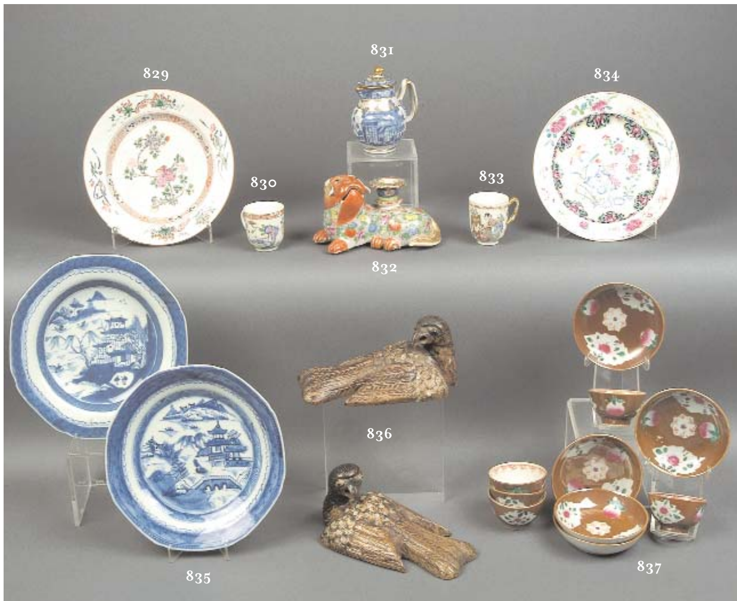
829 PRATO EM PORCELANA DA CHINA, Companhia das Índias, decoração policromada "flores", reinado Qianlong, séc. XVIII, esbeixadelas Dim. - 22 cm 125 - 180