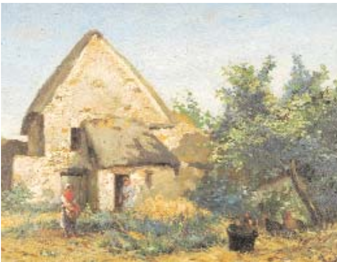
667 A. D. - SÉC. XIX

"Quinta com figuras e galinhas", óleo sobre madeira, escola inglesa, assinado