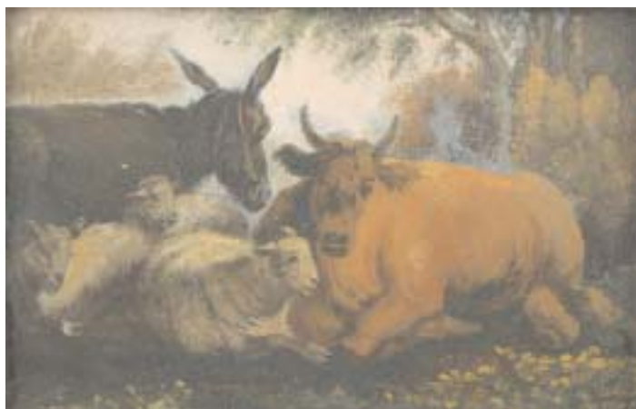
769 "GADO" par de óleos sobre madeira, escola francesa, séc. XIX Dim. - 12,5 x 18 cm