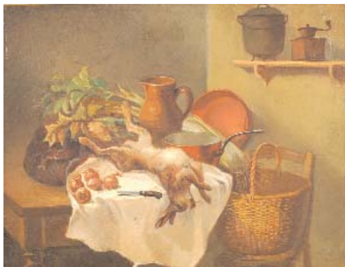
655 "NATUREZA MORTA - INTERIOR DE COZINHA" óleo sobre tela, séc. XIX, pequeno restauro Dim. - 32 x 40,5 cm