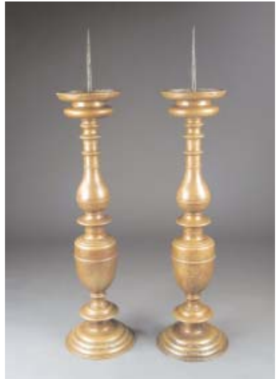
915 PAR DE TOCHEIROS DE GRANDES DIMENSÕES EM BRONZE COM BRASÃO , espigões em ferro, holandeses, séc. XIX Dim. - 134 cm 2.500 - 3.750