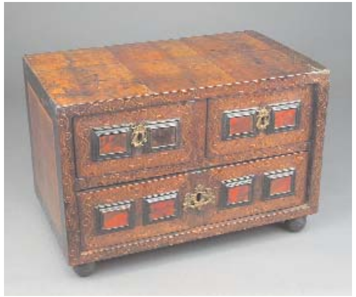
919 CONTADOR EM NOGUEIRA E TARTARUGA COM EMBUTIDOS, espanhol, séc. XVII, restauros, pequenas faltas e defeitos Dim. - 31 x 46 x 27 cm