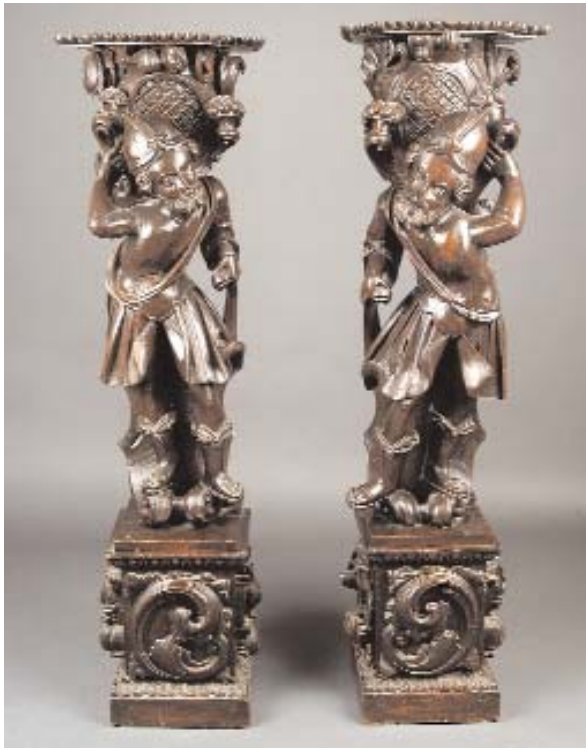
913 PAR DE COLUNAS EM CASTANHO ENTALHADO E ESCURECIDO "FIGURAS MASCULINAS" , portuguesas, séc. XVIII, faltas e defeitos - Dim. - 151 cm 1.000 - 1.500