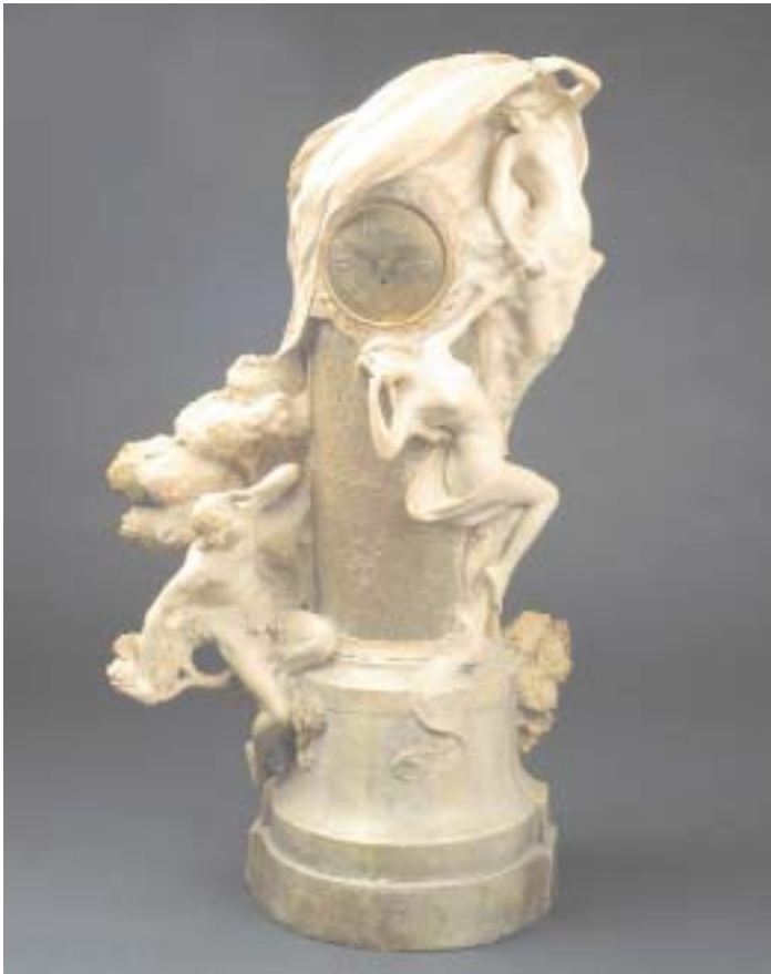
916 RELÓGIO DE MESA ARTE NOVA EM TERRACOTA "FIGURAS FEMININAS NUAS", mostrador em metal, francês, séc. XIX/XX, pequenos defeitos, mecanismo a necessitar de revisão Dim. - 88 cm