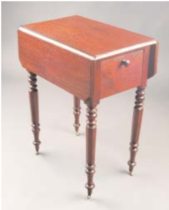
605 MESA DE APOIO COM ABAS EM MOGNO, francesa, séc. XIX, pequenos defeitos Dim. - 70,5 x 53,5 x 36,5 cm