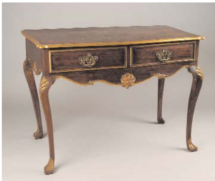
716 MESA DE ENCOSTAR ESTILO D. JOSÉ EM CASTANHO COM DOURADOS, portuguesa, séc. XIX, pequenos defeitos Dim. - 79 x 109 x 61 cm