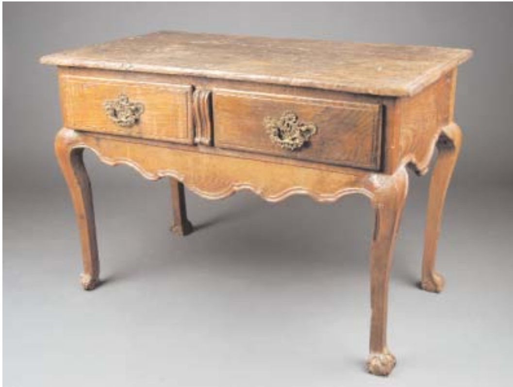
719 MESA DE ENCOSTAR RÚSTICA D. JOSÉ/D. MARIA EM CASTANHO, portuguesa, séc. XVIII, faltas e defeitos Dim. - 78,5 x 114 x 62,5 cm