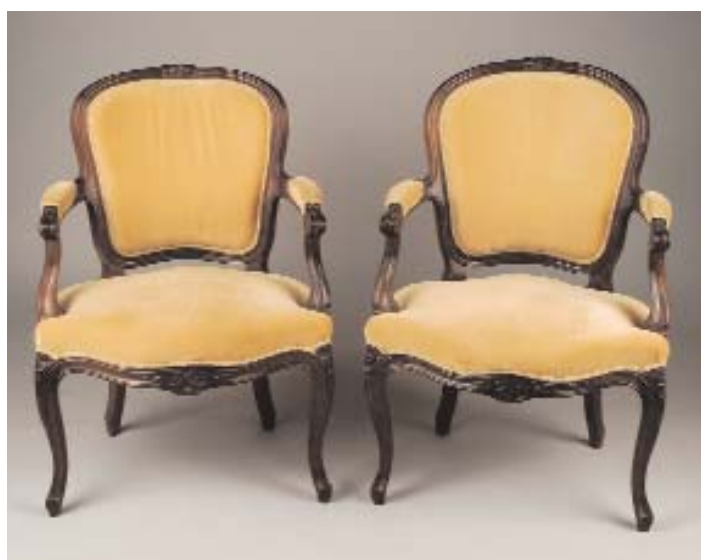
724 PAR DE FAUTEUILS D. JOSÉ AO GOSTO FRANCÊS EM MURTA, assento e costas estofados, portugueses, séc. XVIII, estofado não original Dim. - 84 x 58 c 56 cm