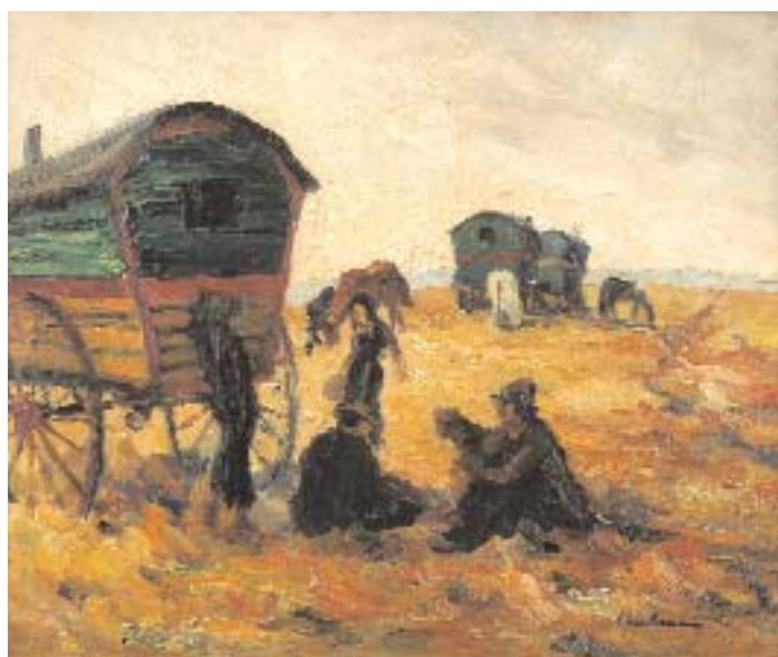
772 RENÉ CHENILLEAU - SÉC. XX "Nômadas" , óleo sobre aglomerado de madeira, assinado - vd. Bénézit - vol. 3, pág. 555 Dim. - 45 x 55 cm