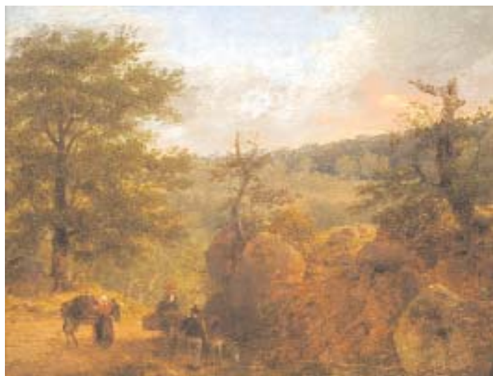
771 "PAISAGEM COM FIGURAS E BURROS" óleo sobre tela, escola francesa, séc. XIX Dim. - 24,5 x 32 cm