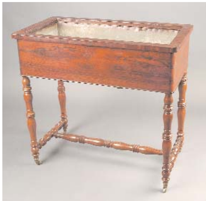
598 FLOREIRA LUÍS FILIPE EM PAU SANTO, francesa, séc. XIX, pequenos defeitos Dim. - 79 x 84 x 45,5 cm