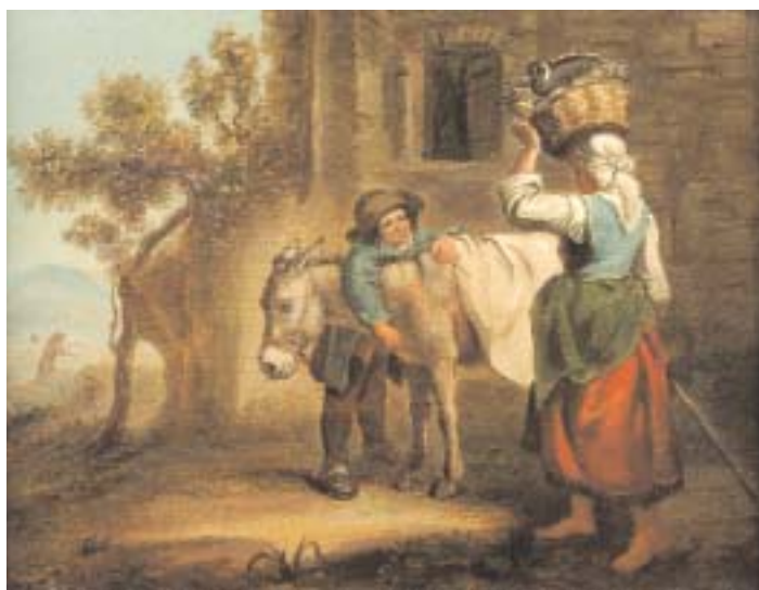
770 "FIGURAS E BURRO PERTO DE CASA" óleo sobre tela, escola holandesa, séc. XIX, reentelado e restauros Dim. - 24,5 x 31 cm