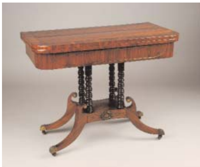
717 MESA DE JOGO GUILHERME IV EM PAU SANTO COM FILETES EM METAL, inglesa, séc. XIX, restauros e pequenos defeitos Dim. - 72 x 91 x 45 cm