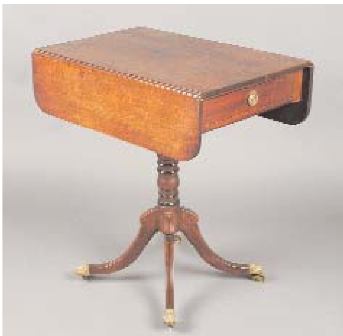
595 MESA DE ABAS COM PÉ CENTRAL EM MOGNO, inglesa, séc. XIX, pequenos defeitos Dim. - 73 x 69 x 44,5 cm