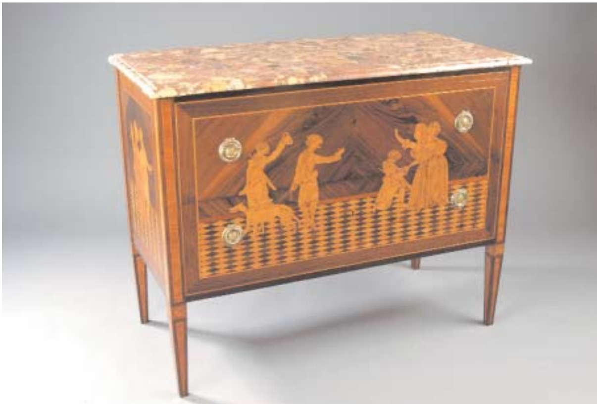
732 CÔMODA ESTILO D. MARIA EM PAU SANTO COM MARQUETERIE "CENAS COM FIGURAS", tampo de mármore, séc. XX, pequenos defeitos Dim. - 86 x 109 x 51 cm