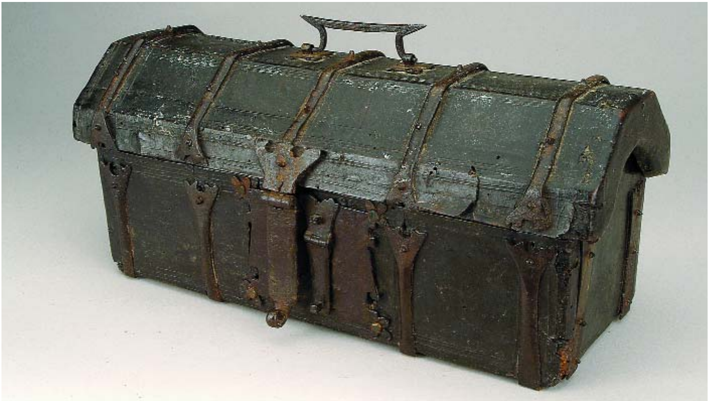
223 COFRE GÓTICO EM MADEIRA FORRADA A COURO, precintas em ferro, séc. XV, faltas e defeitos