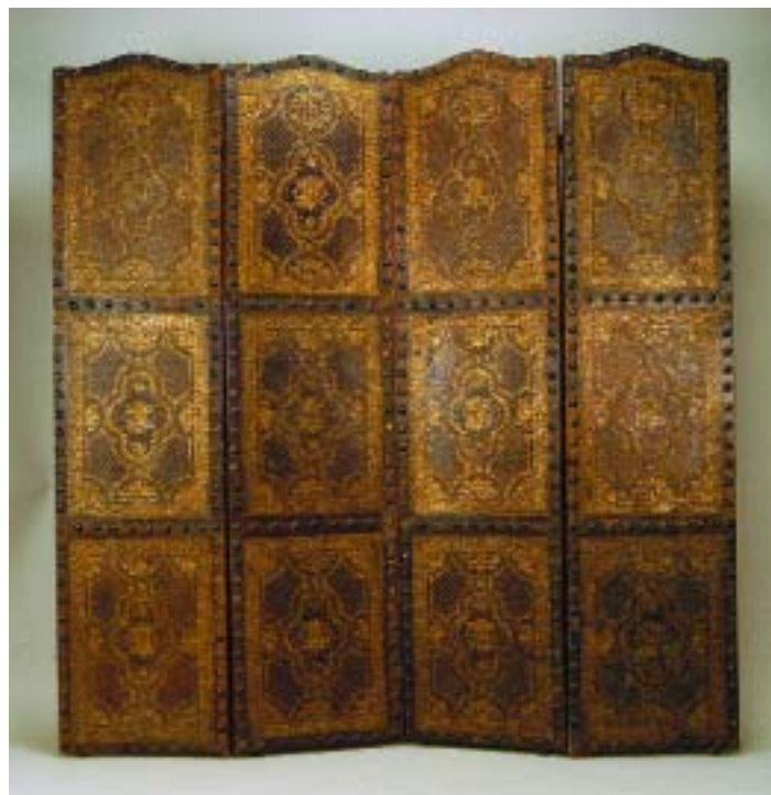
I84 BIOMBO DE QUATRO FOLHAS EM COURO LAVRADO E DOURADO, pregaria dourada, séc. XVIII/XIX, faltas e defeitos Dim. - 197 x 47,5 cm € 2.000 - 3.000