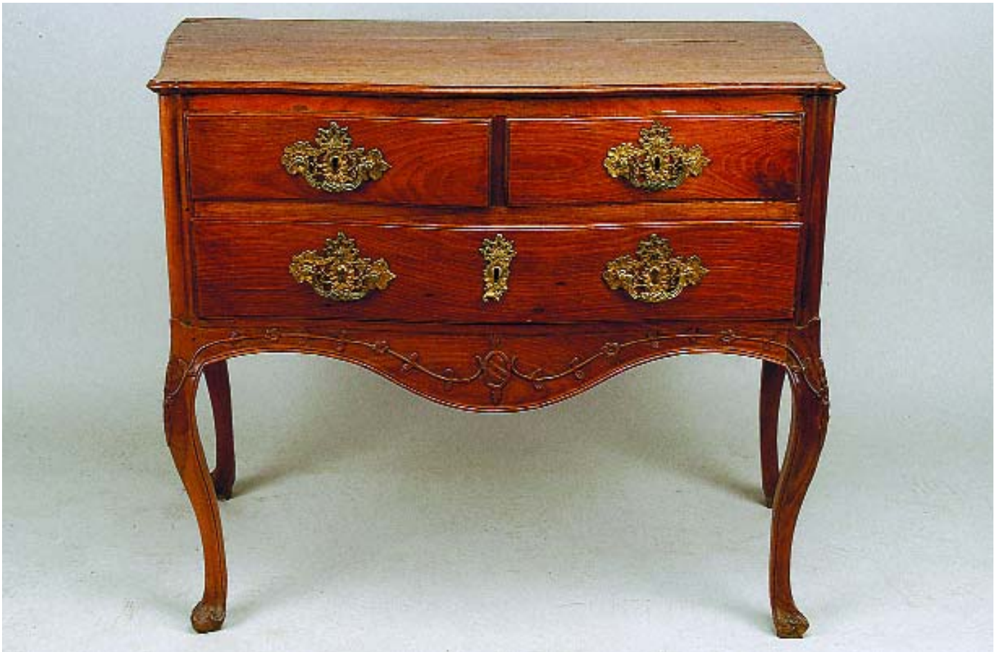
32 CÓMODA DE PERNAS ALTAS D. JOSÉ EM VINHÁTICO COM ENTALHAMENTOS, portuguesa, séc. XVIII, pequenos defeitos Dim. - 80 x 96,5 x 52 cm € 5.000 - 7.500