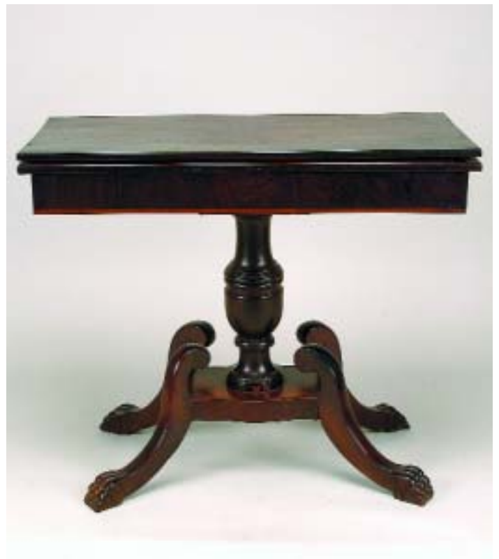
I92 MESA DE JOGO FOLHEADA A PAU SANTO COM FILETES DE PAU ROSA, coluna central e pés zoomórficos, portuguesa, séc. XIX, falta dos rodízios e pequenos defeitos