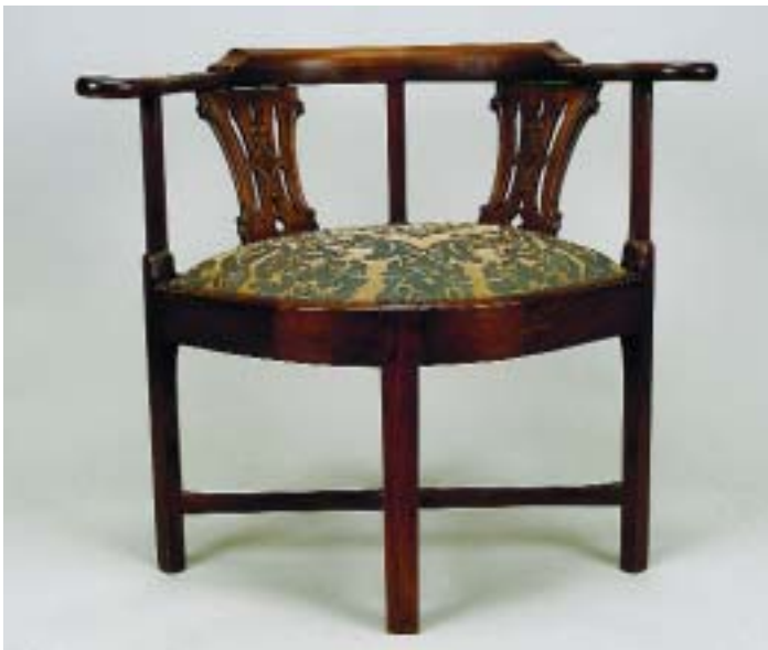
49 CADEIRA DE CANTO D. JOSÉ/D. MARIA EM VINHÁTICO, assento estofado a tecido, portuguesa, séc. XVIII, pequenos restauros Dim. - 69,5 x 82 x 57 cm € 1.000 - 1.500