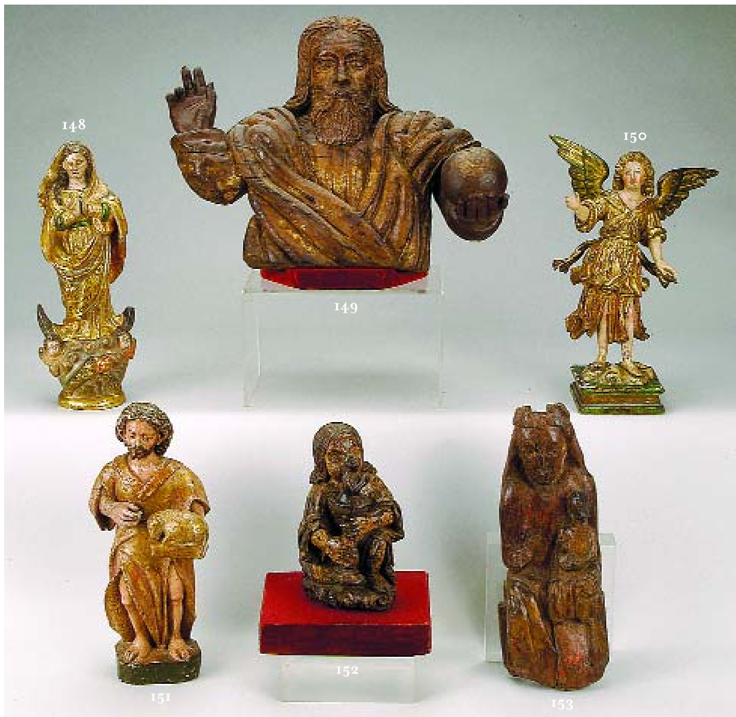
148 "NOSSA SENHORA DA CONCEIÇÃO" , escultura em terracota policromada e dourada, portuguesa, séc. XVIII, falta e pequenos defeitos Dim. - 36 cm € 600 - 900