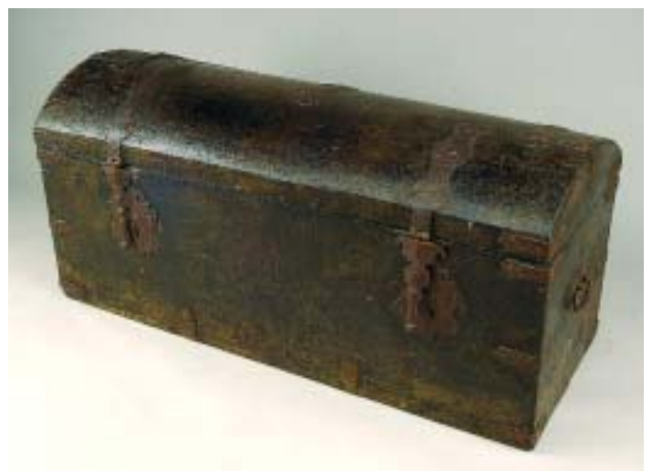
I93 BAÚ LUSÍADA EM ANGELIM COM RESTOS DE PINTURA, duas fechaduras, ferragens em ferro, indo-português, séc. XVII, faltas e defeitos