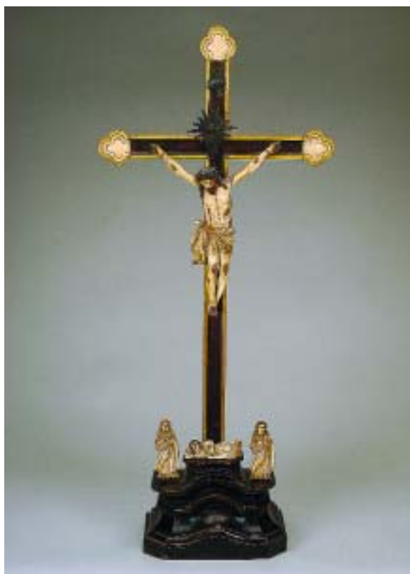
I64 CRUCIFIXO COM ESCULTURAS EM MARFIM, cruz em ébano com dourados e extremidades em marfim, indo-português, séc. XVIII, pequenos defeitos Dim. - 78,5 cm (total) € 2.000 - 3.000