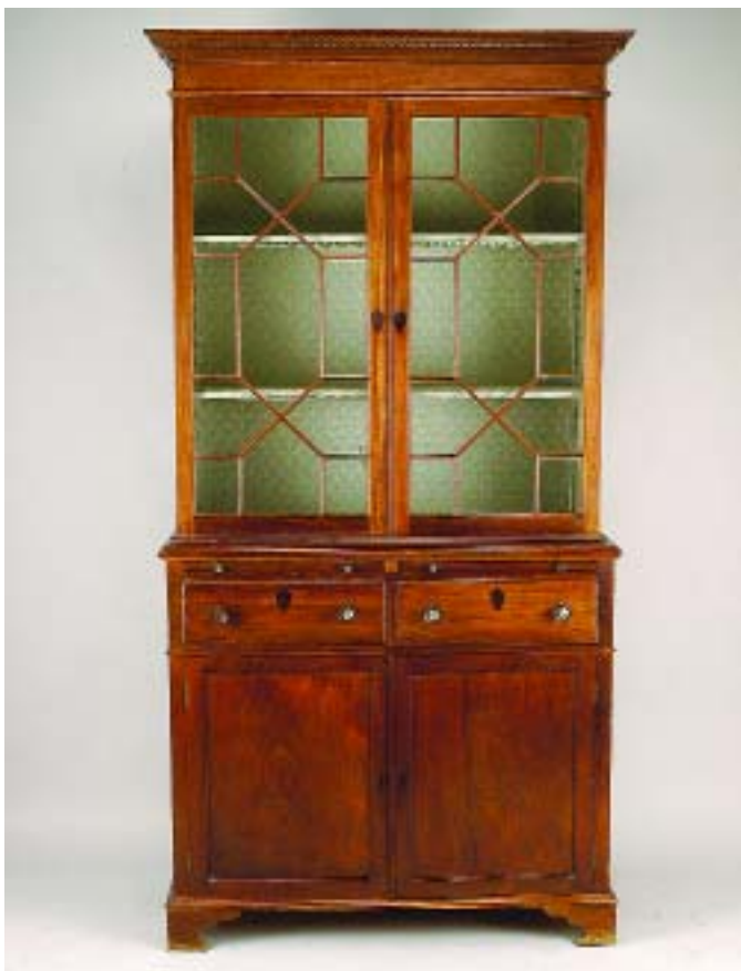
28 ARMÁRIO LOUCEIRO D. MARIA EM VINHÁTICO, corpo superior com vidrinhos, português, séc. XVIII/XIX, faltas e defeitos Dim. - 216 x 112 x 53 cm