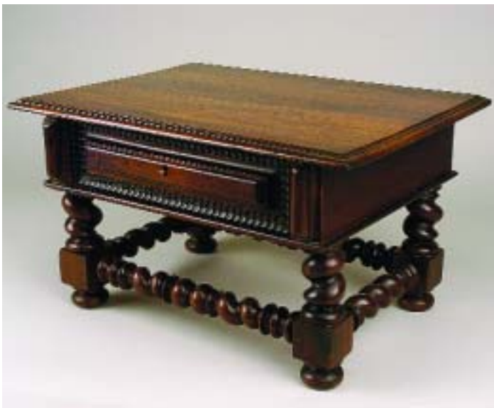
58 BUFETE DE PEQUENAS DIMENSÕES DE TORCIDOS E TREMIDOS EM PAU SANTO, português, séc. XVII/XVIII Dim. - 38 x 66 x 50 cm € 2.500 - 3.750