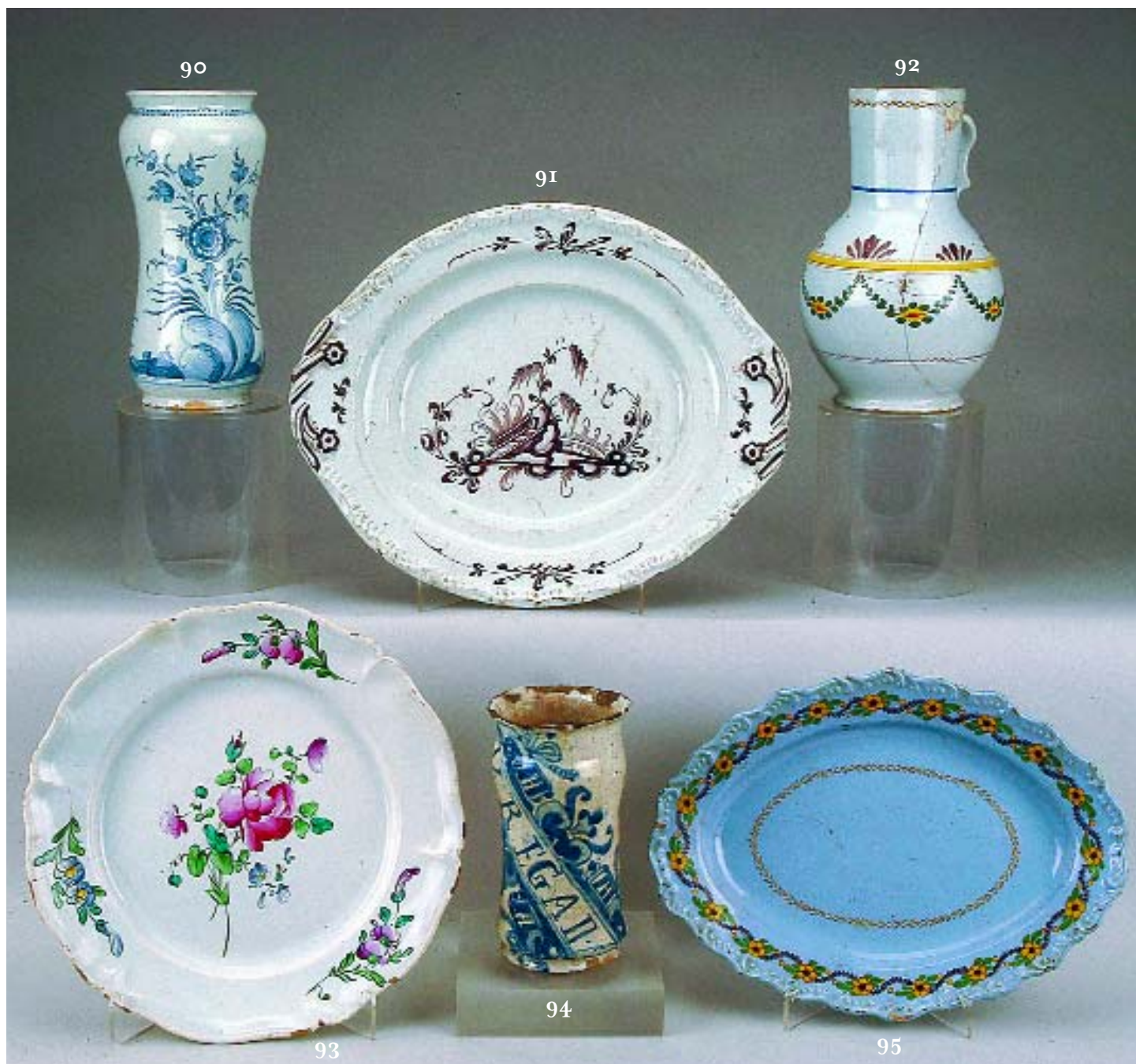
90 MANGA DE FARMÁCIA EM FAIANÇA PORTUGUESA, decoração a azul "flores", séc. XVII, craquelé e esbeiçadelas Dim. - 27,5 cm € 1.200 - 1.800