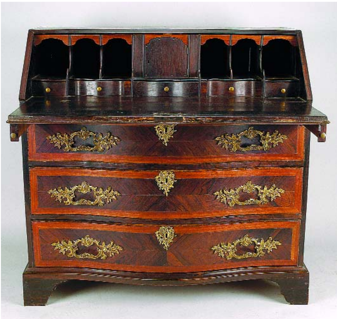
47 PAPELEIRA D. MARIA EM PAU SANTO COM FILETES EM PAU ROSA , portuguesa, séc. XVIII, pequenos defeitos Dim. - 108 x 114 x 62 cm € 5.000 - 7.500