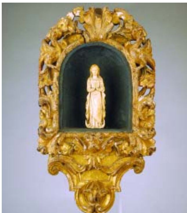
I63 "NOSSA SENHORA DA CONCEIÇÃO", escultura em marfim em nicho de madeira entalhada e dourada, indo-portuguesa, séc. XVII; Dim. - 14 cm € 2.000 - 3.000