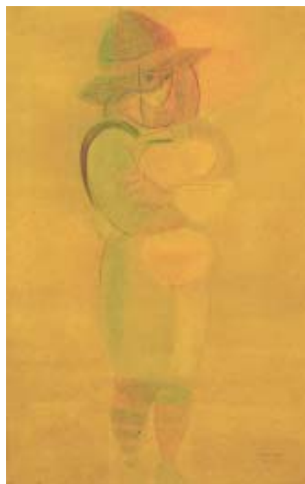
I32 JÚLIO POMAR - NASC. 1926 "Camponesa", aguarela sobre papel, assinada e datada de 28 de Janeiro de 1951 Dim. - 33 x 21 cm