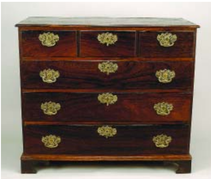
I76 CÓMODA D. MARIA EM PAU SANTO, portuguesa, séc. XVIII, pequenos restauros, pequenas faltas Dim. - 105,5 x 121 x 58 cm € 5.000 - 7.500