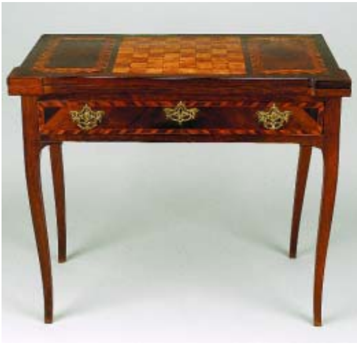
I86 MESA DE JOGO D. JOSÉ/D. MARIA EM PAU SANTO COM EMBUTIDOS "XADREZ", portuguesa, séc. XVIII, sem o pano verde, pequenas faltas e defeitos Dim. - 74,5 x 84,5 x 42 cm € 1.750 - 2.500