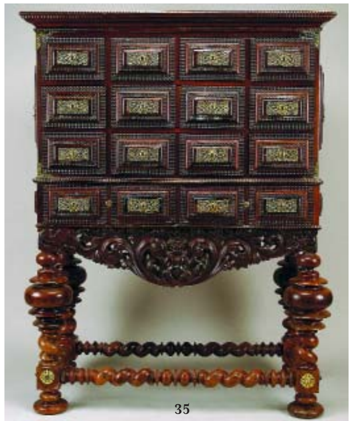
35 CONTADOR DE TORCIDOS E TREMIDOS EM PAU SANTO, saiais entalhados, ferragens e pegas em metal amarelo, português, séc. XIX, pequenas faltas e defeitos Dim. - 163 x 124 x 60 cm € 3.000 - 4.500