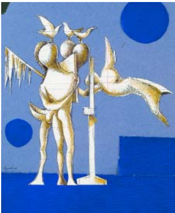
135 CRUZEIRO SEIXAS - NASC. 1920

"Figuras surrealistas", colagem sobre papel, assinado