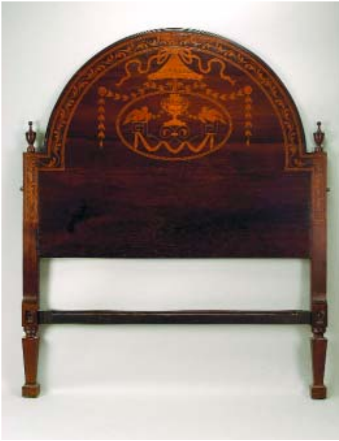
36 CAMA DE CASAL D. MARIA EM PAU SANTO COM EMBUTIDOS, portuguesa, séc. XVIII, pequenos defeitos Dim. - 179 x 198 x 148 cm € 3.000 - 4.500