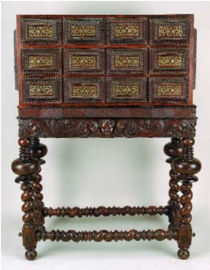
50 CONTADOR DE TORCIDOS E TREMIDOS EM PAU SANTO COM TREMPE, português, séc. XVII/XVIII, pequenos defeitos Dim. - 137,5 x 106,5 x 54 cm € 5.000 - 7.500