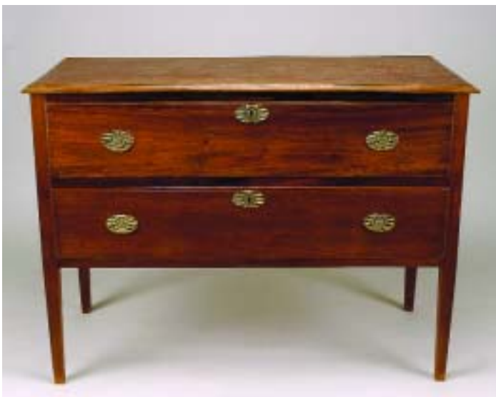
I91 CÓMODA D. MARIA DE PERNAS ALTAS EM VINHÁTICO, portuguesa, séc. XVIII/XIX, pequenos defeitos