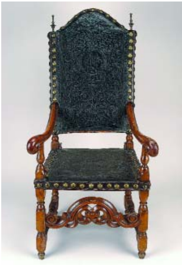
I75 CADEIRÃO DE BRAÇOS EM NOGUEIRA, assento e costas em couro "D. Pedro II" com pregaria, português, séc. XVII, restauros, faltas e defeitos Dim. - 132,5 x 65 x 64 cm € 2.000 - 3.000