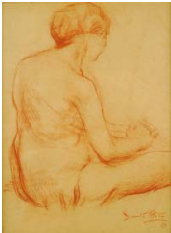
I31 SANTA RITA PINTOR - 1889-1918 "Nu feminino", desenho a sanguínea sobre papel, assinado e datado de 1917, esboço na verso Dim. - 31 x 23 cm