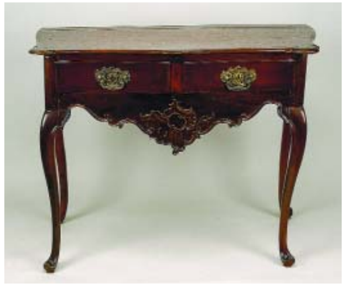
51 MESA DE ENCOSTAR D. JOSÉ EM NOGUEIRA COM ENTALHAMENTOS, tampo em vinhático, portuguesa, séc. XVIII, restauros e defeitos Dim. - 88 x 116 x 56,5 cm € 2.000 - 3.000