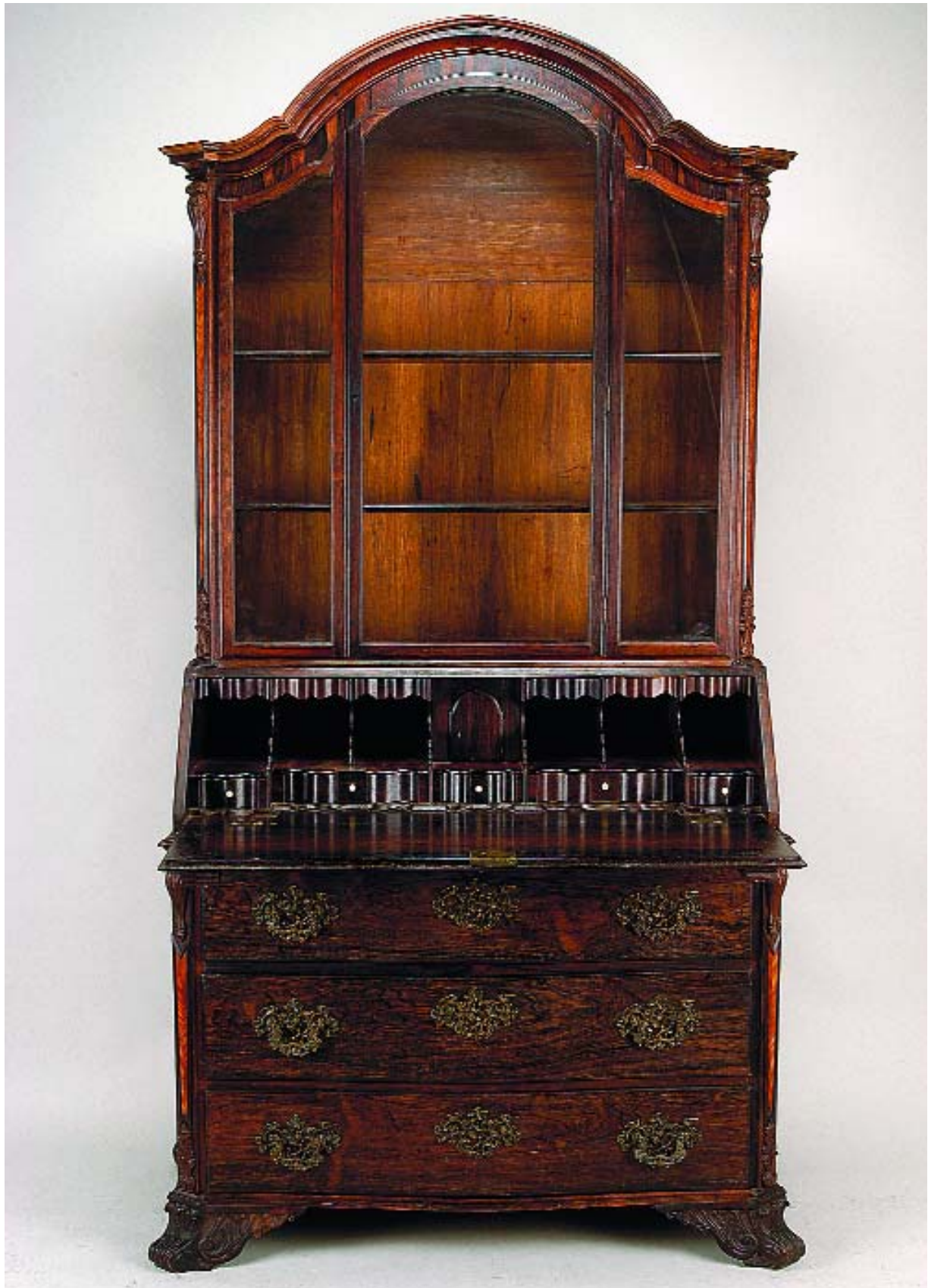
40 PAPELEIRA COM ALÇADO D. JOSÉ EM PAU SANTO COM ENTALHAMENTOS,

ilhargas em pau rosa, portuguesa, séc. XVIII, restauros e portas do alçado modificadas para vidros, pequenas faltas e defeitos Dim. - 228 x 122 x 57 cm € 12.000 - 18.000