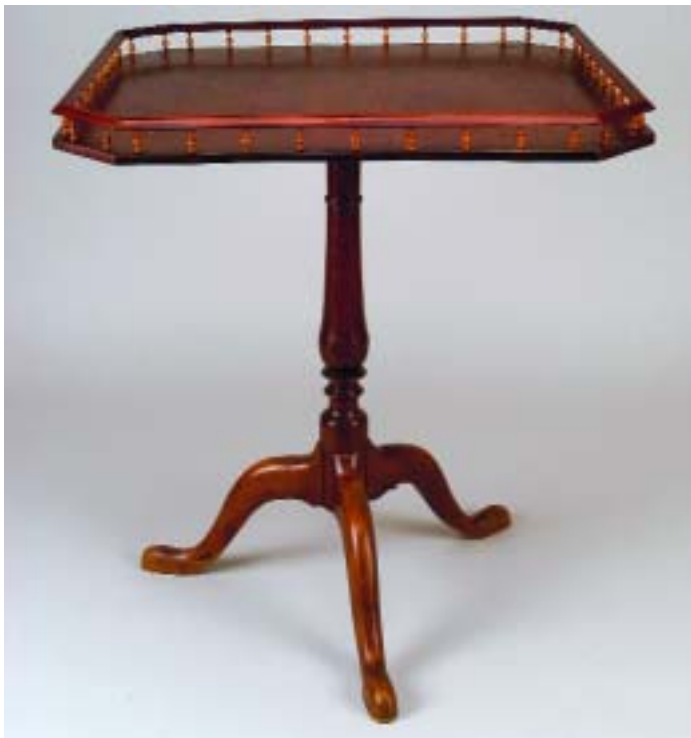
41 MESA DE PÉ DE GALO D. MARIA EM VINHÁTICO, tampo quadrado e basculante com gradinha, portuguesa, séc. XVIII, pequenos defeitos Dim. - 82 x 70,5 x 70,5 cm € 1.200 - 1.800