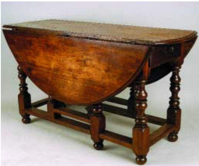
37 MESA DE CANCELA EM VINHÁTICO COM ABAS REDONDAS, portuguesa, séc. XVII/XVIII, pequenos defeitos Dim. - 80,5 x 148 x 56,5 cm € 2.500 - 3.750