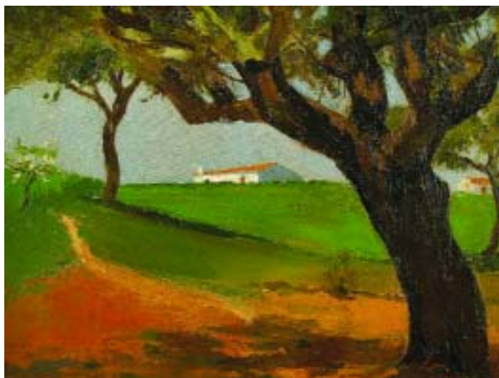
II3 LUCIANO SANTOS - NASC. 1911 "Paisagem rural com casas", óleo sobre tela, assinado e datado de 1934, pequenos defeitos Dim. - 41,5 x 50,5 cm