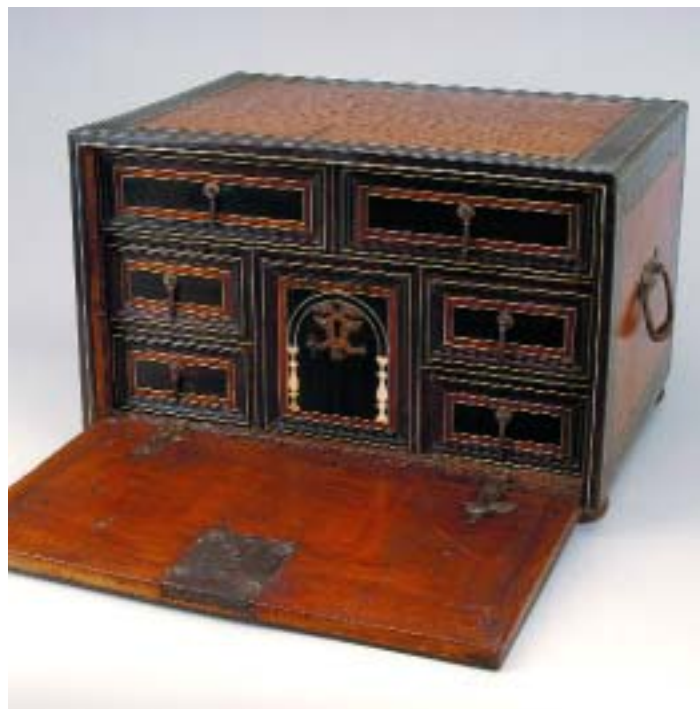
60 ESCRITÓRIO LUSÍADA EM TECA E ÉBANO COM FILETES DE MARFIM, ferragens em ferro, indo-português, séc. XVII, pequenos restauros, ferragem frontal não original, pequenos defeitos; Dim. - 25,5 x 40,5 x 29,5 cm € 3.000 - 4.500