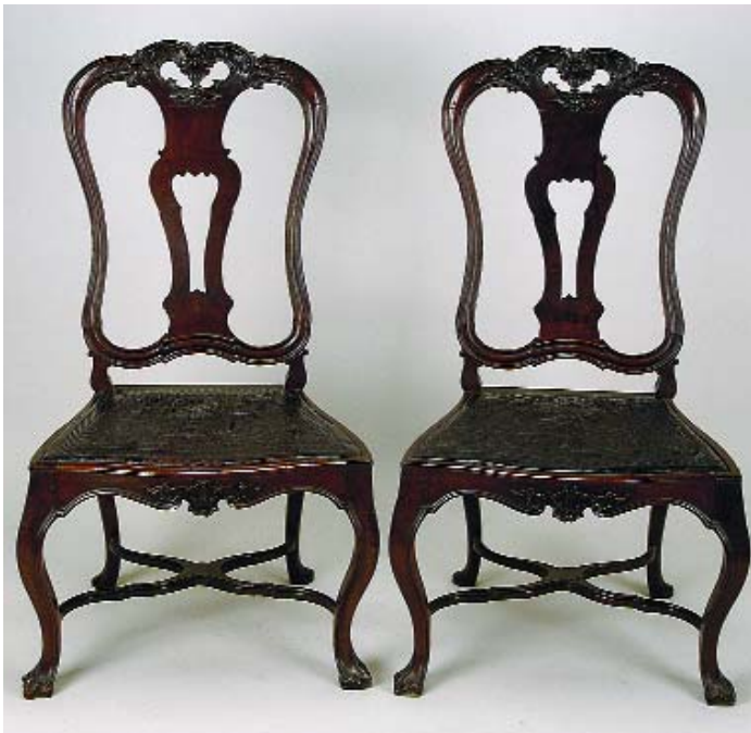
42 PAR DE CADEIRAS D. JOSÉ EM PAU SANTO COM ENTALHAMENTOS, assentos em couro lavrado, portuguesas, séc. XVIII, pequenos defeitos e couros posteriores Dim. - 108 x 60 x 51 cm € 6.000 - 8.000