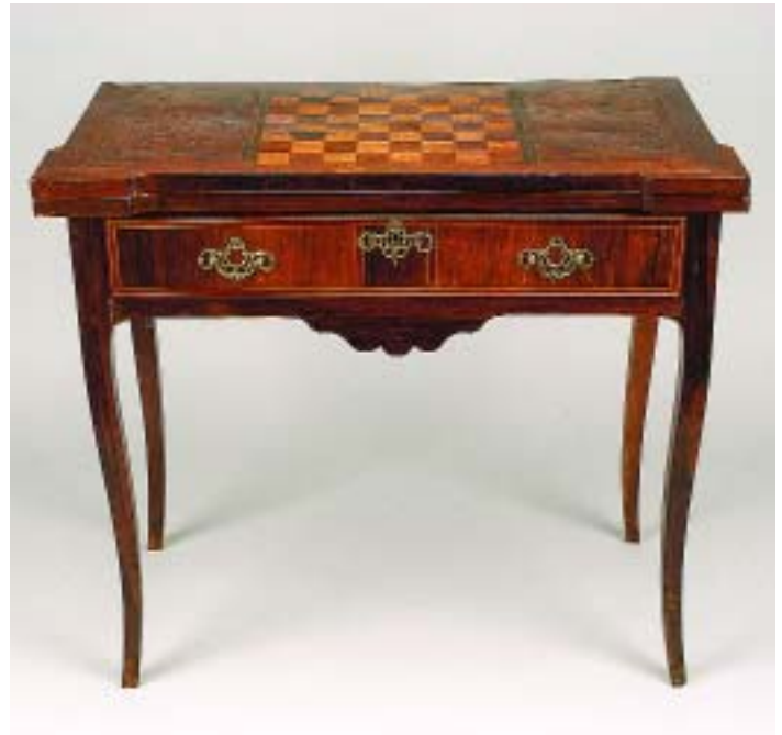
I88 MESA DE JOGO D. JOSÉ/D. MARIA EM PAU SANTO COM EMBUTIDOS "XADREZ" E "FLORES", portuguesa, séc. XVIII, pequenas faltas e defeitos Dim. - 77 x 89 x 42,5 cm € 1.750 - 2.500