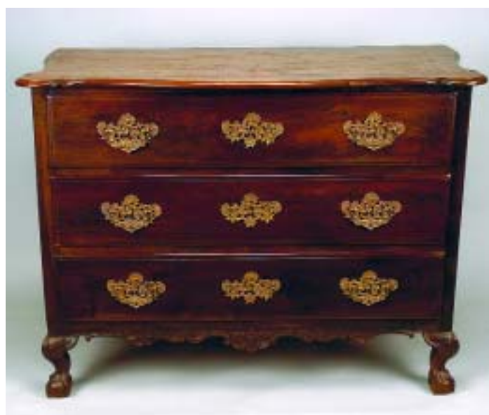
31 CÓMODA D. JOSÉ EM NOGUEIRA COM ENTALHAMENTOS, portuguesa, séc. XVIII, restauros, pequenas faltas e defeitos Dim. - 93 x 129 x 69 cm