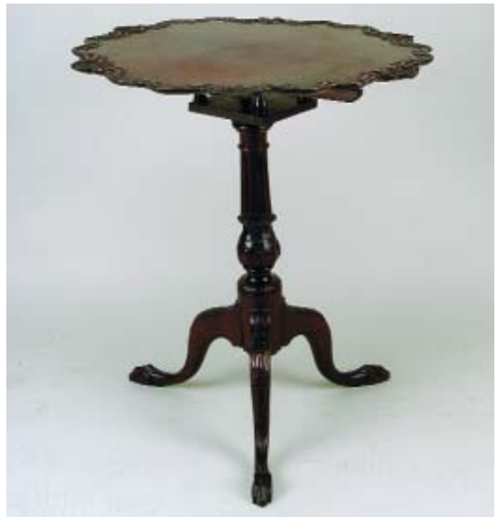
43 MESA DE PÉ DE GALO D. JOSÉ EM VINHÁTICO COM ENTALHAMENTOS, tampo redondo recortado e basculante, portuguesa, séc. XVIII, restauros nos pés, pequenos defeitos Dim. - 78 x 69 cm € 1.500 - 2.250