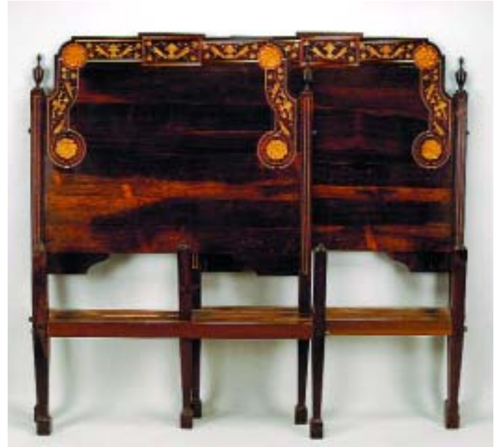
38 PAR DE CAMAS D. MARIA EM PAU SANTO COM EMBUTIDOS, portuguesas, séc. XVIII, pequenas faltas e defeitos Dim. - 152 x 197 x 108 cm € 3.000 - 4.500