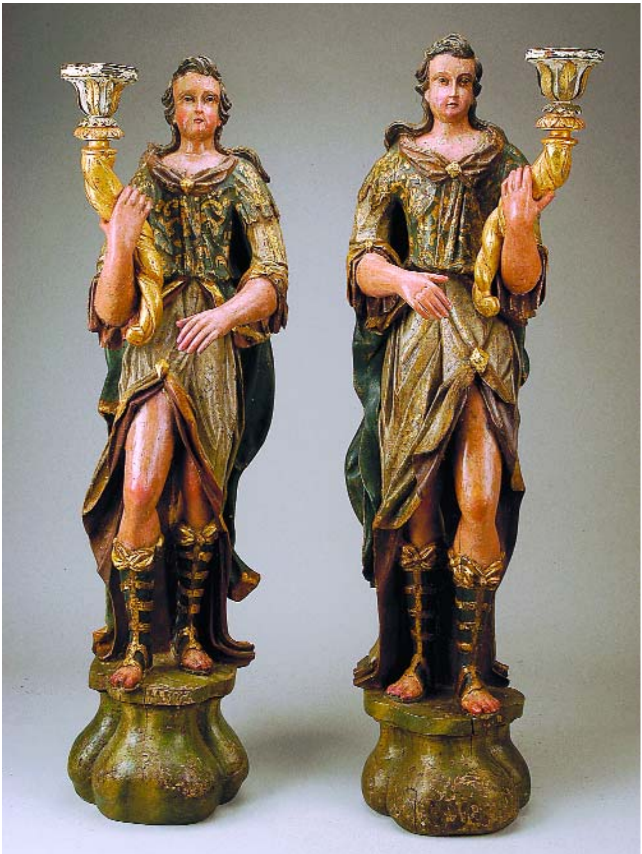
I74 "ANJOS CANDELÁRIOS", par de esculturas em madeira policromada,

portugueses, séc. XVIII, restauros, faltas e defeitos Dim. - 127,5 cm