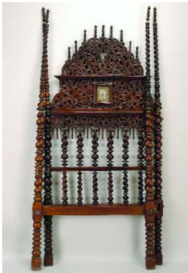
30 CAMA DE BILROS EM PAU SANTO COM DOSSEL, espaldar com registo "Jesus amabilis", aplicações em metal dourado, portuguesa, séc. XVII/XVIII, pequenos defeitos Dim. - 215 x 191 x 101 cm