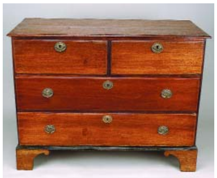
I79 CÓMODA D. MARIA EM VINHÁTICO, entrepanos em pau santo, portuguesa, séc. XVIII/XIX, pequenos restauros Dim. - 86,5 x 120 x 55 cm € 1.600 - 2.400