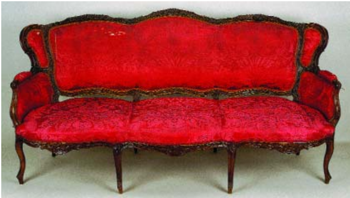
48 CANAPÉ D. JOSÉ EM NOGUEIRA ENTALHADA, assento e costas estofados a damasco, português, séc. XVIII, faltas e defeitos; Dim. - 99 x 200 x 76 cm € 1.000 - 1.500