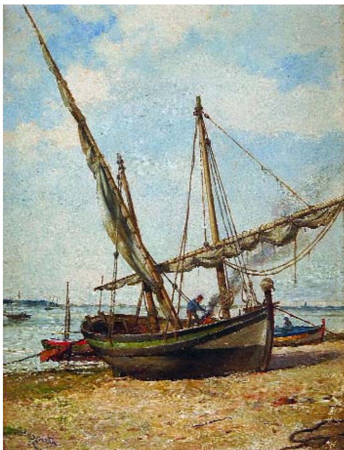
118 ANTÓNIO FRANCISCO BAETA - séc. XIX

"Barcos da Rasca - Setúbal", óleo sobre madeira, assinado