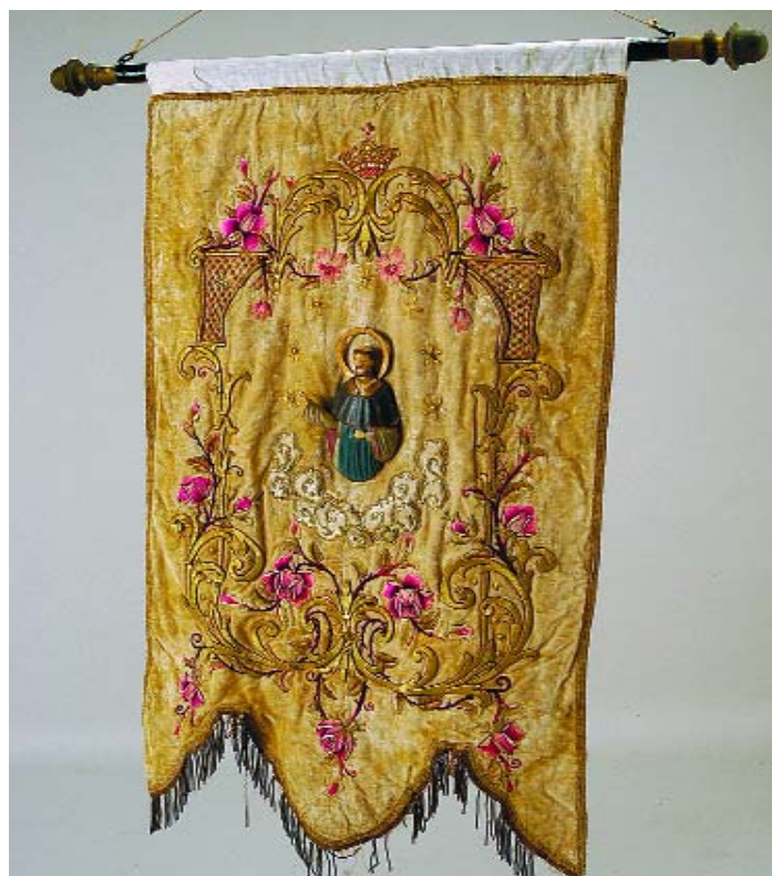
I65 ESTANDARTE RELIGIOSO EM TECIDO BORDADO, aplicação "Santo" em madeira com cara e mãos em marfim, Índia, séc. XIX, pequenos defeitos; Dim. - 113 x 62 cm € 400 - 600