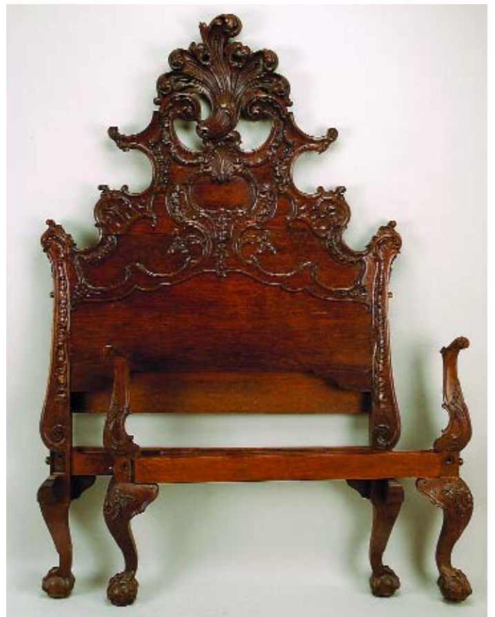
52 CAMA D. JOSÉ EM PAU SANTO COM ENTALHAMENTOS, portuguesa, séc. XVIII, pequenos defeitos Dim. - 170 x 212 x 106 cm € 1.000 - 1.500