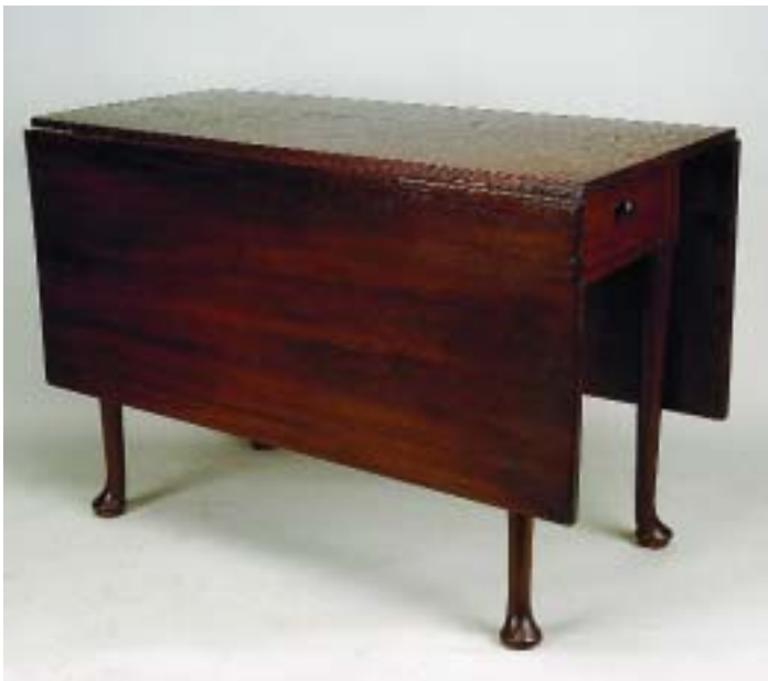
I87 MESA DE ABAS D. JOÃO V EM VINHÁTICO, portuguesa, séc. XVIII, pequenos restauros e defeitos Dim. - 76 x 114,5 x 55 cm € 1.500 - 2.250