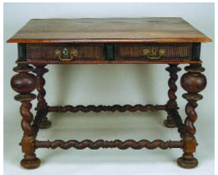
39 BUFETE DE TORCIDOS E TREMIDOS EM PAU SANTO, português, séc. XVIII, faltas e defeitos, pernas e travejamento provavelmente pertenceram a outro bufete Dim. - 79 x 106 x 79,5 cm € 4.000 - 6.000