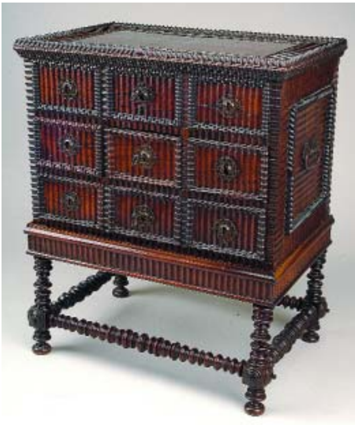
57 CONTADOR DE TREMIDOS EM PAU SANTO COM TREMPE, tampo superior de levantar, açoriano, séc. XVII, interior de duas gavetas refeitas, pequenos defeitos Dim. - 67 x 57 x 39 cm € 4.000 - 6.000