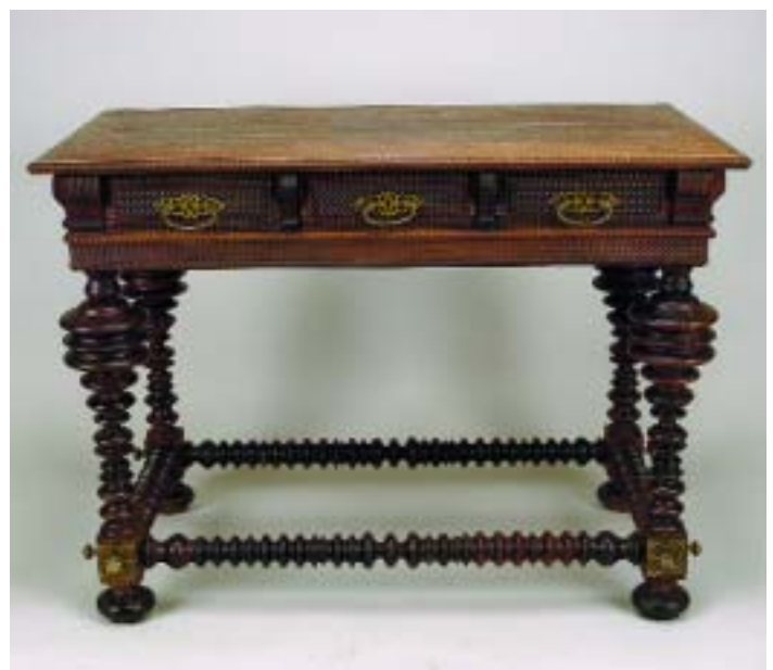
I89 BUFETE DE TORNEADOS E TREMIDOS EM PAU SANTO COM TAMPO EM VINHÁTICO, português, séc. XVIII, pequenos defeitos Dim. - 82 x 112 x 69 cm € 1.800 - 2.250