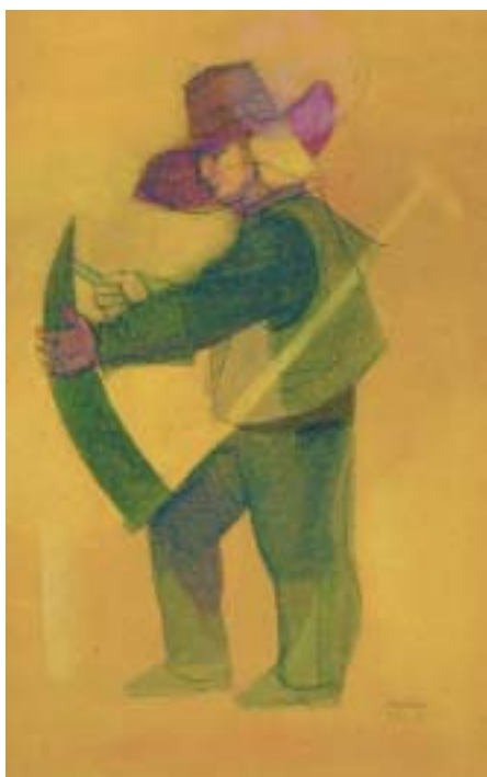
I30 JÚLIO POMAR - NASC. 1926 "Ceifador com gadanha", aguarela sobre papel, assinada e datada de 27 de Janeiro de 1951 Dim. - 33 x 21 cm