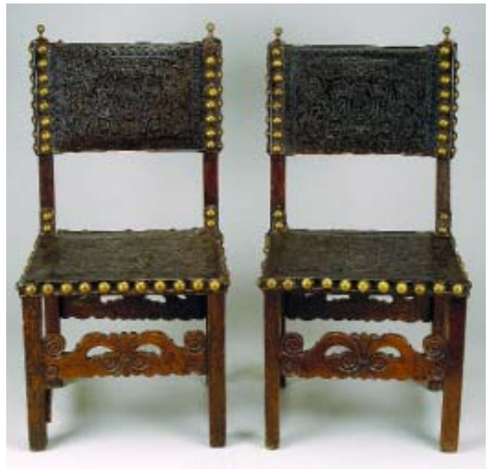
I77 PAR DE CADEIRAS EM CARVALHO, ASSENTO E COSTAS EM COURO "SENHORA COM PAPAGAIO" COM PREGARIA, portuguesas, séc. XVII, restauros, faltas e defeitos Dim. - 105 x 53,5 x 45 cm € 800 - 1.200