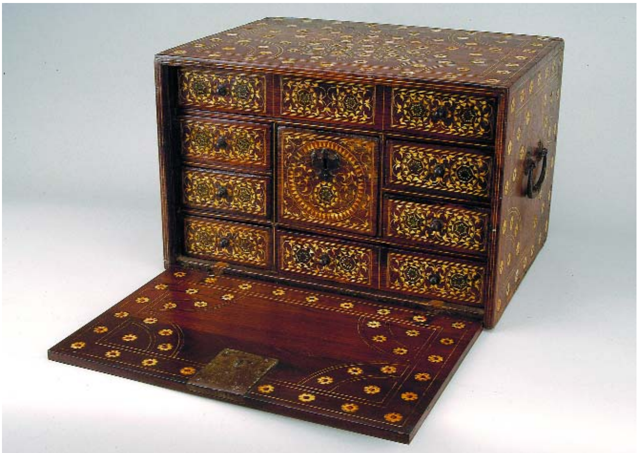
61 ESCRITÓRIO LUSÍADA - DE INFLUÊNCIA MOGOL - EM SISSÓ COM EMBUTIDOS DE MARFIM, séc. XVII, pequenas faltas e defeitos Dim. - 27 x 43 x 31 cm