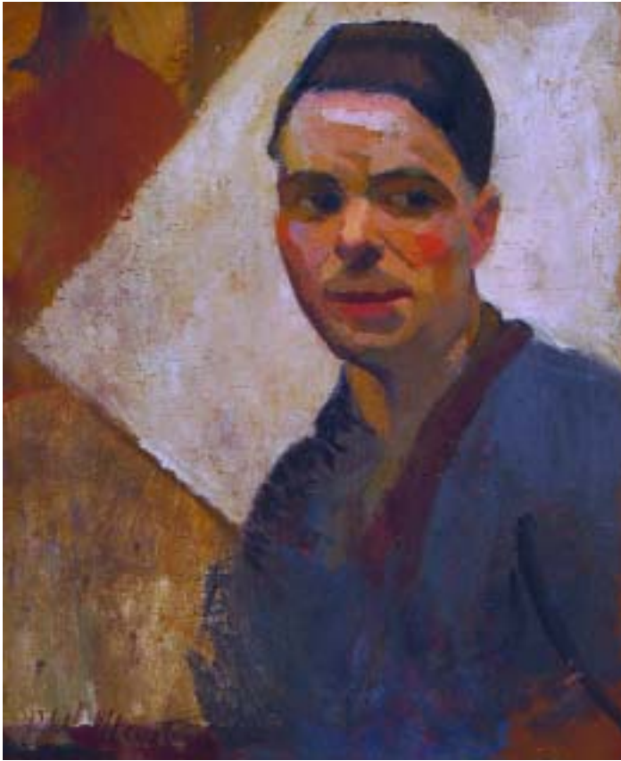
108 ABEL MANTA - 1888-1982

"Auto-retrato", óleo sobre tela, assinado Dim. - 60 x 50 cm