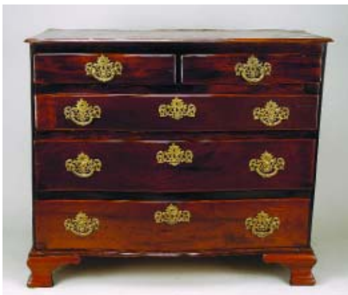
29 CÓMODA DE BARRIGA D. MARIA EM VINHÁTICO COM GUARNIÇÕES EM PAU SANTO, portuguesa, séc. XVIII/XIX, restauros, pequenos defeitos Dim. - 104 x 121 x 60,5 cm