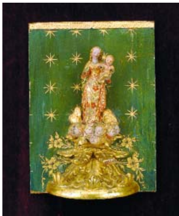
I66 "NOSSA SENHORA COM O MENINO", escultura em madeira policromada e dourada sobre placa de madeira, Malines, séc. XV/XVI, restauros, faltas e defeitos Dim. - 12 cm (escultura) € 1.500 - 2.250