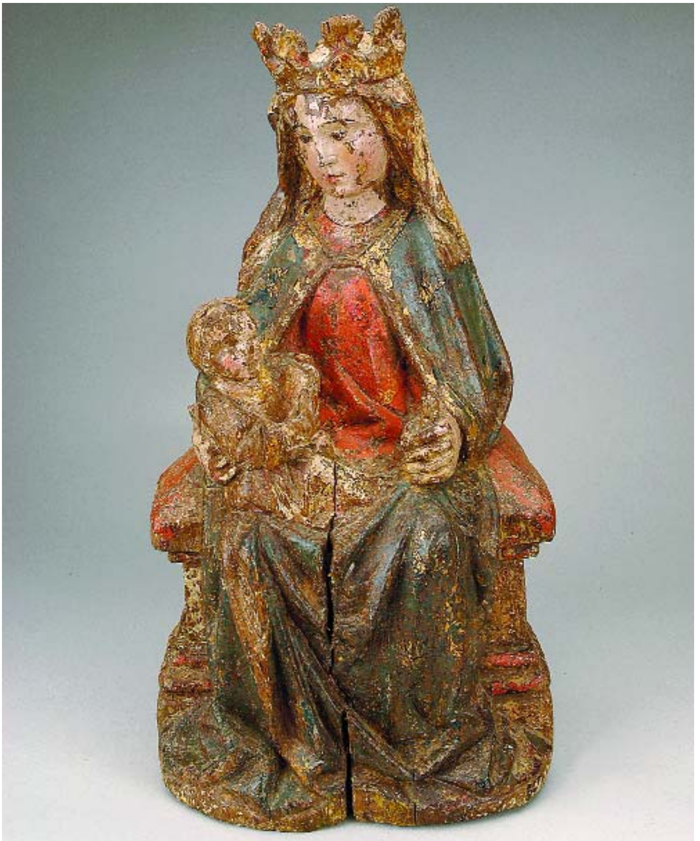
I67 "NOSSA SENHORA EM MAJESTADE COM O MENINO", escultura em madeira policromada,

séc. XIV/XV, faltas e defeitos Dim. - 45 cm