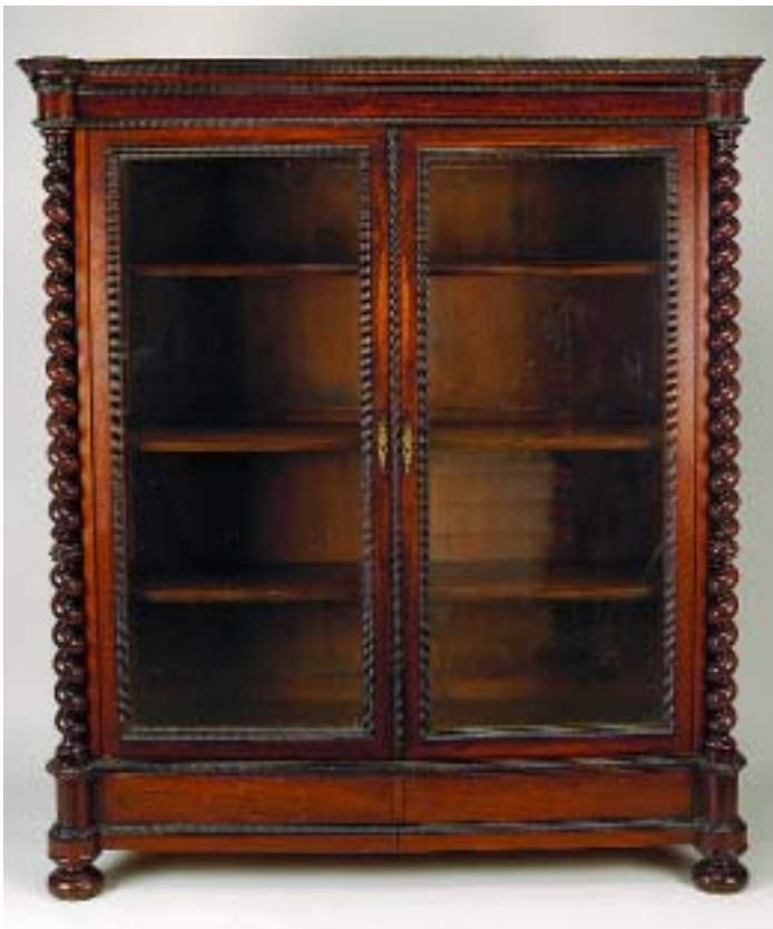
I90 ARMÁRIO LIVREIRO DE TORCIDOS E TREMIDOS EM PAU SANTO, duas gavetas na base, portas com vidros, português, séc. XIX/XX, pequenos defeitos