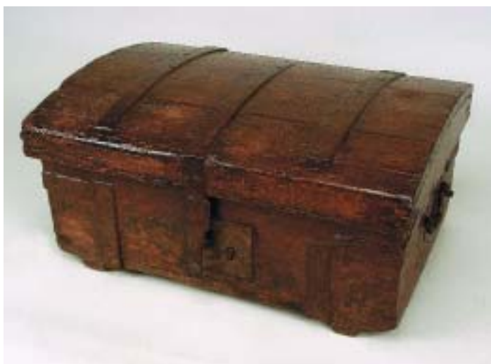
I83 BAÚ EM CASQUINHA COM PRECINTAS EM FERRO, português, séc. XVII, restaurado, faltas e defeitos Dim. - 37 x 76,5 x 55 cm € 500 - 750