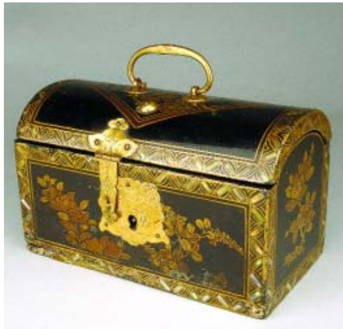
59 COFRE LUSÍADA - ARTE NAMBAN - EM MADEIRA LACADA DE NEGRO, pinturas a ouro "flores" e incrustações de madrepérola, ferragens em cobre dourado, período Momoyama, séc. XVI/XVII restauros, pequenas faltas e defeitos Dim. - 11 x 17,5 x 9,5 cm € 3.000 - 4.500