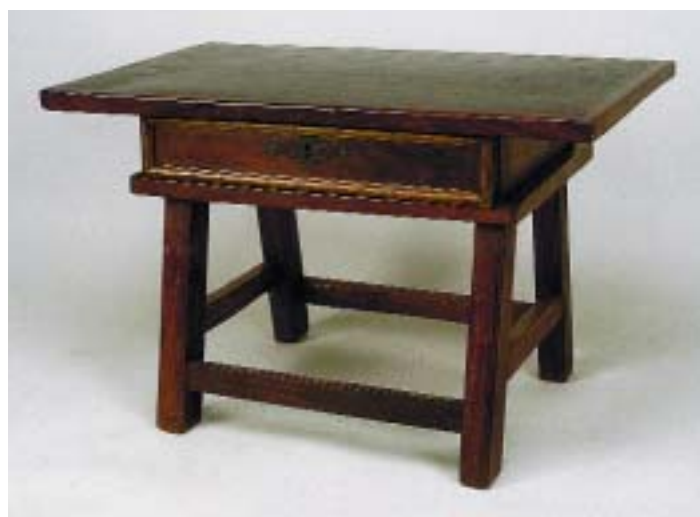
I85 MESA RÚSTICA DE PEQUENAS DIMENSÕES EM PAU SANTO, brasileira, séc. XIX, restauros, pequenos defeitos Dim. - 46,5 x 70,5 x 43 cm € 800 - 1.200