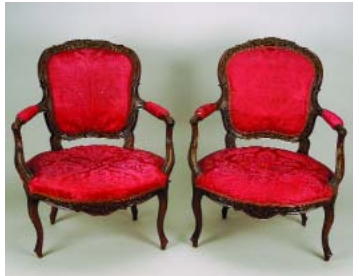
44 PAR DE FAUTEUILS D. JOSÉ EM NOGUEIRA ENTALHADA, assentos e costas estofados a damasco, portugueses, séc. XVIII, faltas e defeitos; Dim. - 92 x 74 x 67 cm € 2.000 - 3.000