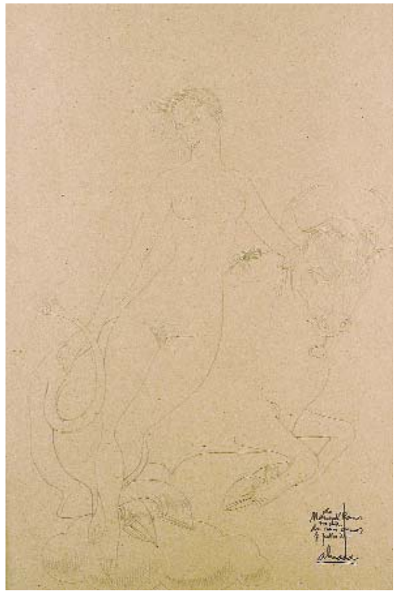
381 ALMADA NEGREIROS - 1893-1970 "Rapto da Europa", desenho a lápis sobre papel, assinado, dedicado e datado de 4 de Julho de 1925 Dim. - 34 x 22,5 cm