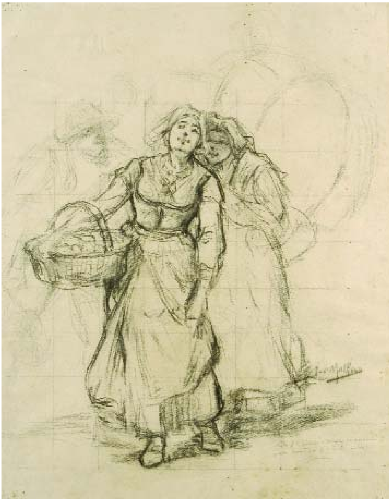
399 JOSÉ MALHOA - 1855-1933 "A Caminho da Romaria - estudo",

desenho a carvão sobre papel, assinado, pequenas manchas de humidade Dim. - 41,5 x 33 cm