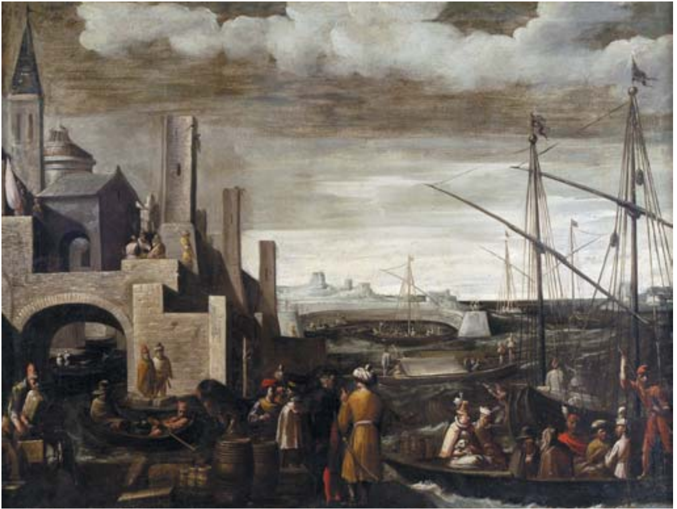
69 "PORTO DE MAR COM FIGURAS", óleo sobre tela, escola holandesa, séc. XVII, reentelado e pequenos restauros Dim. - 96 x 126 cm