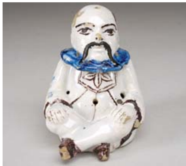
68 "FIGURA DE CHINÊS SENTADO", paliteiro em faiança, decoreção a azul e vinoso, português, séc. XIX, esbeçadelas e faltas no vidrado Nota - pertenceu à antiga coleção Eng. José Abecassis, conforme etiqueta do Leilão realizado pelo "Palácio do Correio Velho" Dim. - 9 cm