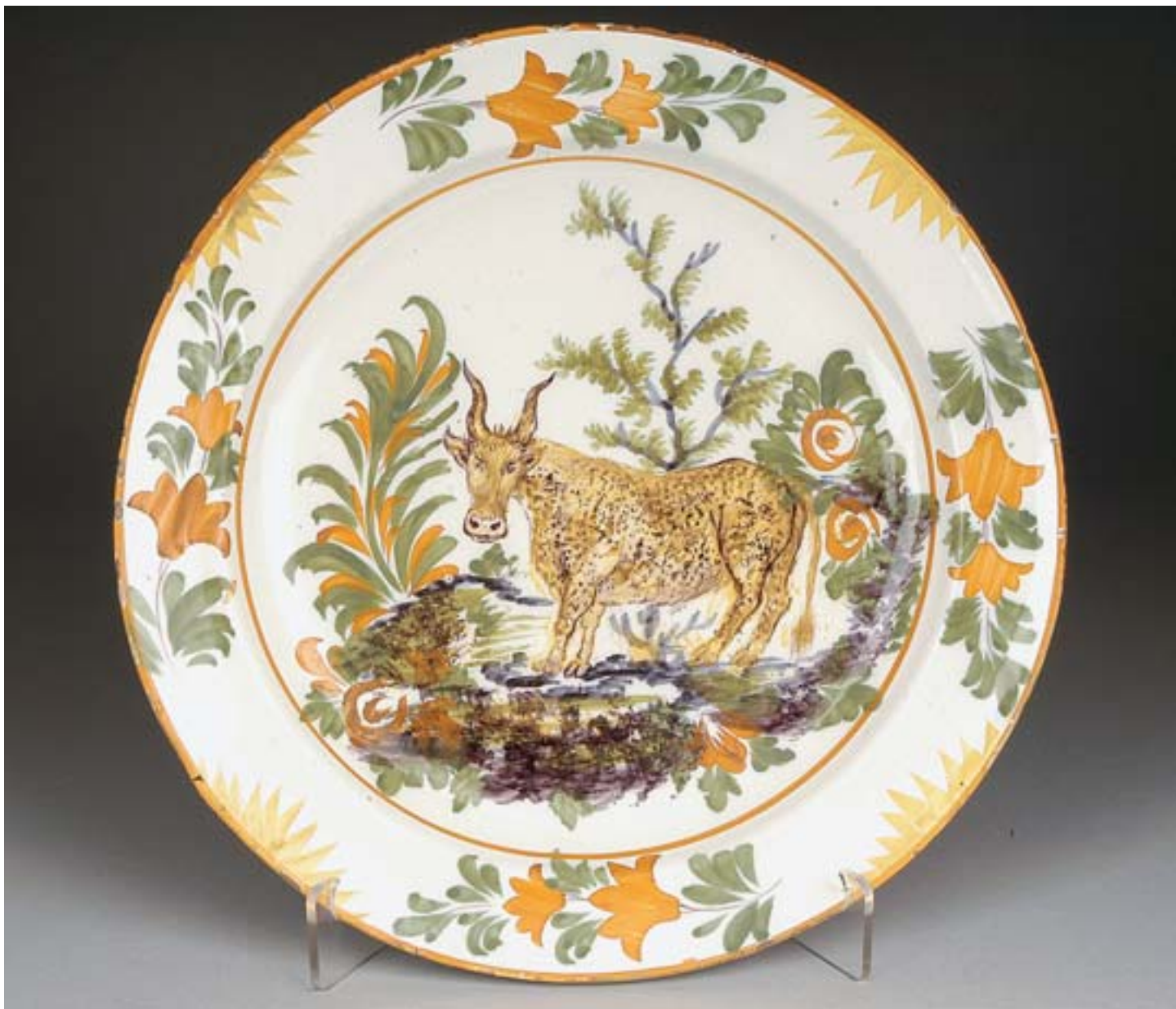
67 PRATO, faiança, decoreção policromada "paisagem com vaca", português, séc. XIX, pequenas esbeçadelas Dim. - 32,5 cm