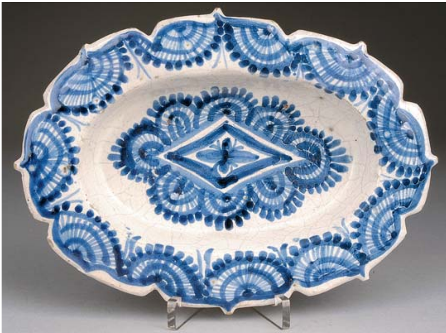
52 BANDEJA RECORTADA, faiança, decoreção a azul dita de "Rendas", portuguesa, séc. XVII (2ª metade), pequeno restauro no bordo Dim. - 22 x 16 cm € 1.000 - 1.500