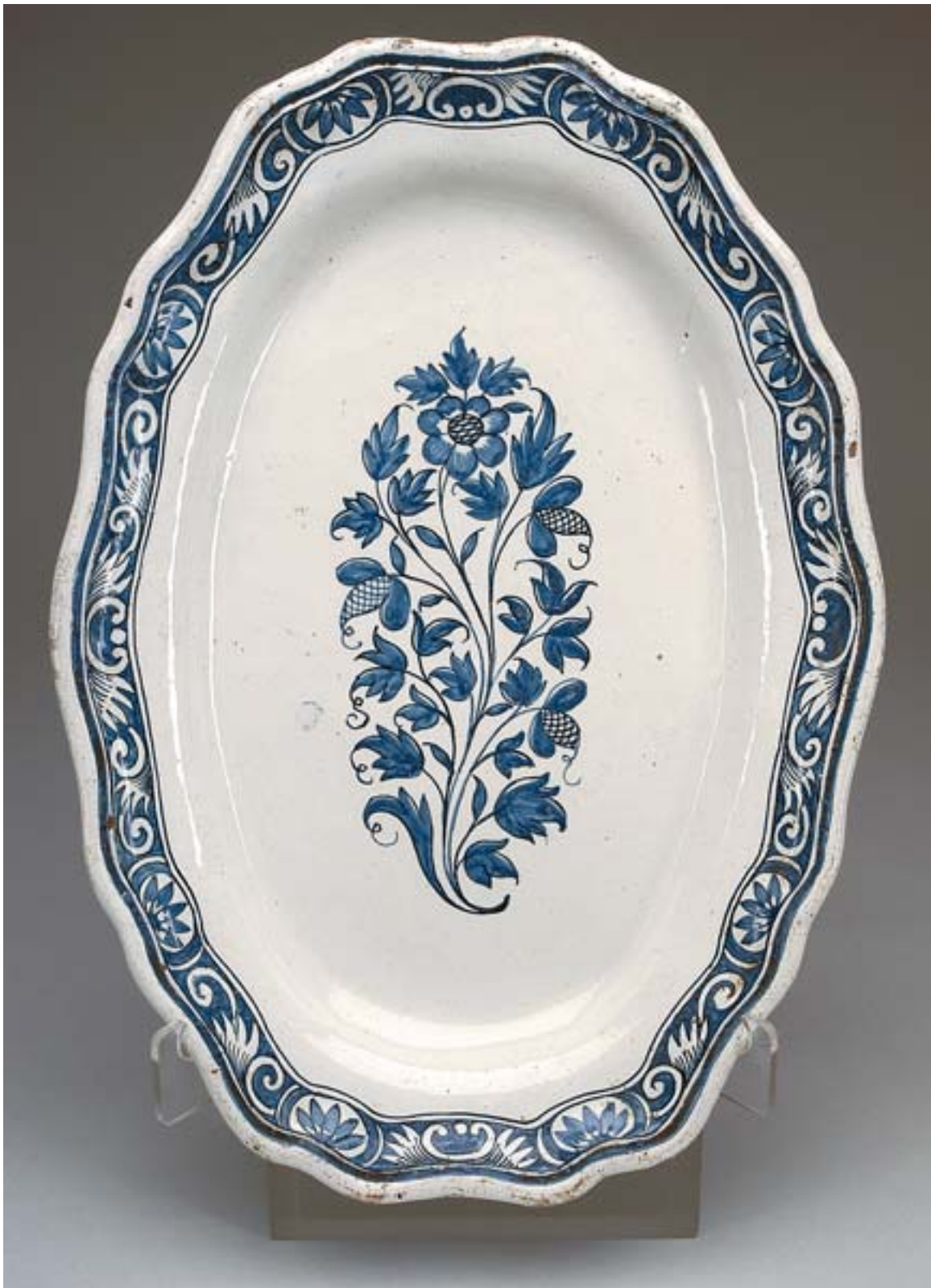
54 TRAVESSA OVAL, rocaille, faiança da Fábrica Real (do Rato), decoreção a azul "flores", pequenas faltas no vidrado, marcada Dim. - 41 x 29 cm