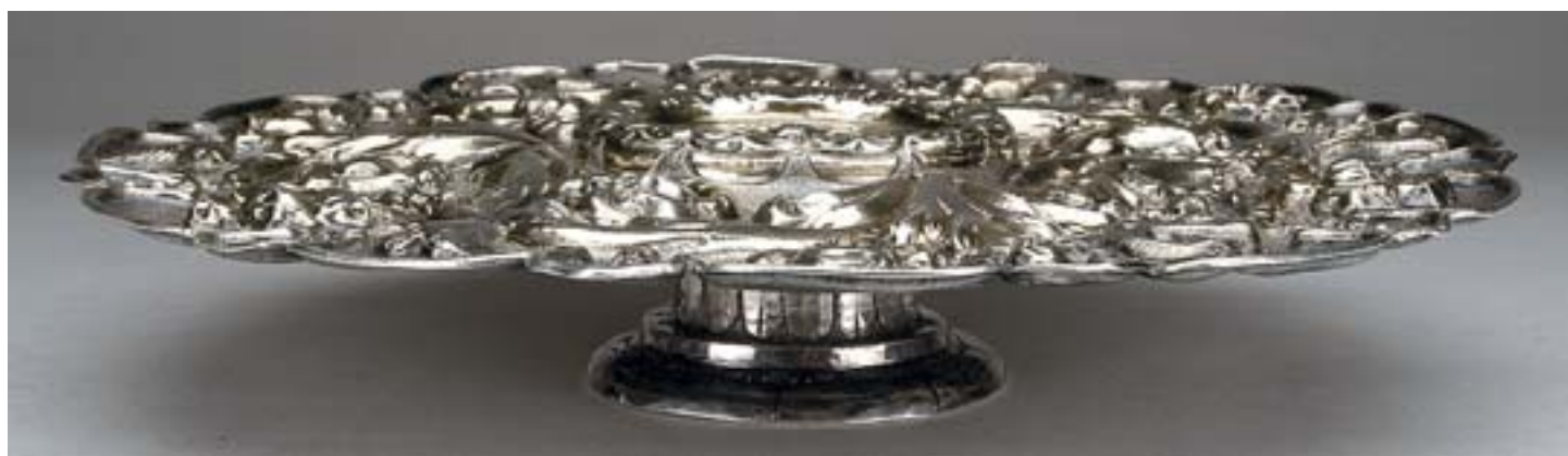
O primeiro valor indicado em euros corresponde à reserva contratada com o proprietário CABRAL MONCADA LEILÕES * PÁGINA 145