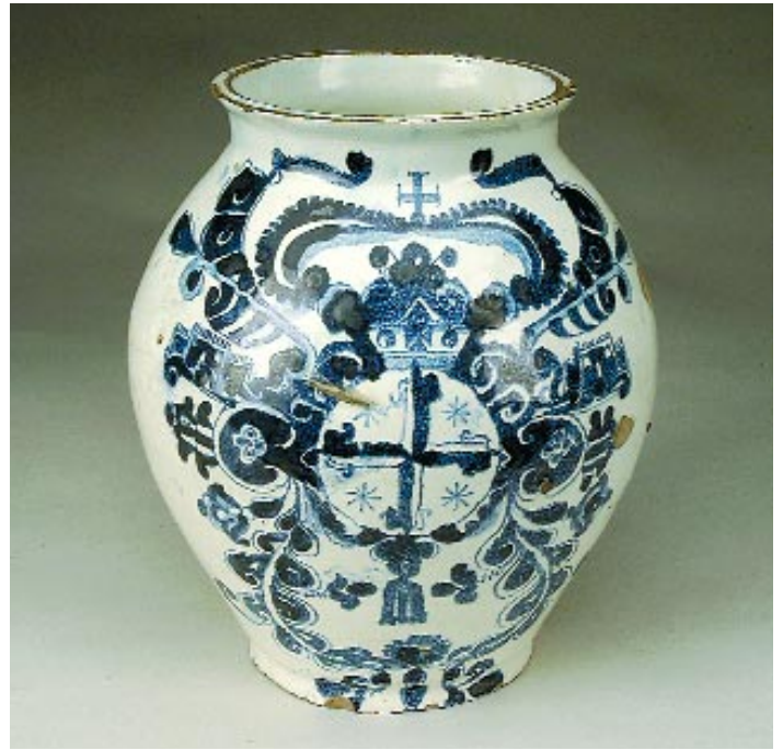
82 POTE DE FARMÁCIA EM FAIANÇA PORTUGUESA, decoração a azul com armas da Ordem dos Dominicanos, séc. XVII/XVIII, esbeaçadelas

Nota - exemplar idêntico vem reproduzido em "A Farmácia em Portugal", pág. 42