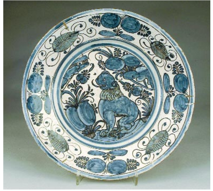
74 PRATO EM FAIANÇA PORTUGUESA DITA DE "ARANHÕES", decoração a azul e vinoso "paisagem com leão", séc. XVII, ligeiros cabelos e esbeaçadelas Dim. - 39 cm € 2.500 - 3.750