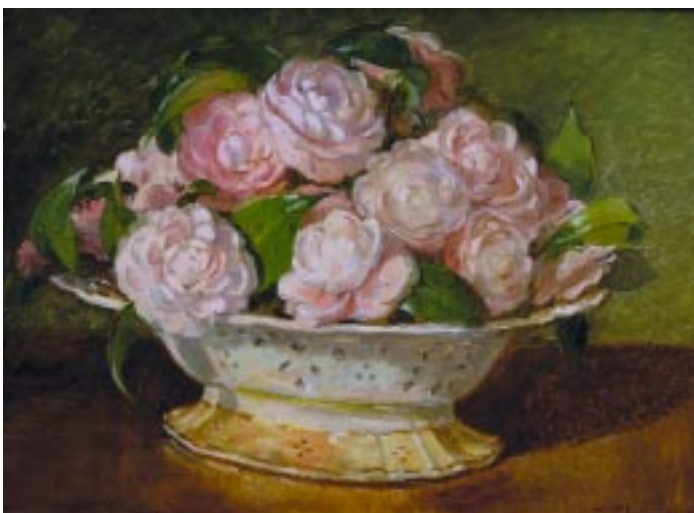
98 TEODORA ANDERSEN ABREU - 1900-19?? "Natureza morta - centro de mesa com flores", óleo sobre madeira, assinado Dim. - 24 x 33 cm