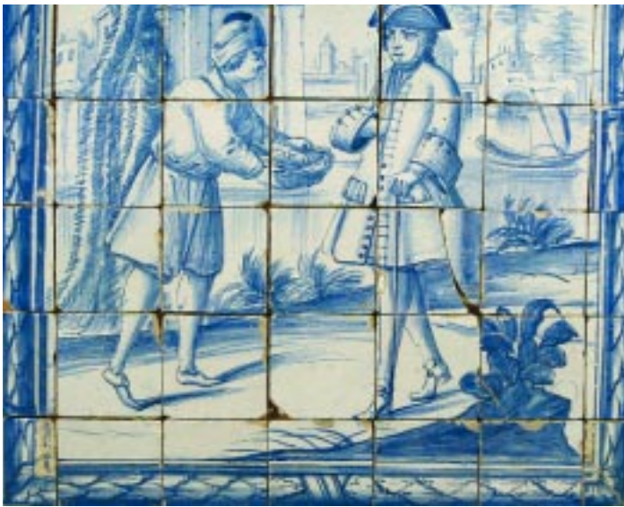
84 "FIDALGO COMPRANDO PEIXE" , painel de trinta e cinco azulejos, decoração a azul, portugueses, séc. XVIII, falta de faixas superiores, pequenas faltas e defeitos Dim. - 72 x 88 cm € 1.500 - 2.250