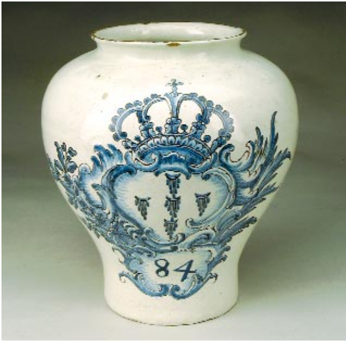
79 POTE DE FARMÁCIA EM FAIANÇA PORTUGUESA DE VIANA, decoração a azul e vinoso com armas da Ordem Terceira de São Francisco e numerado "84", séc. XVIII, marcado, esbeaçadelas

Nota - pertenceu à botica da Misericórdia de Viana do Castelo - vd. "A Farmácia em Portugal", pág. 20