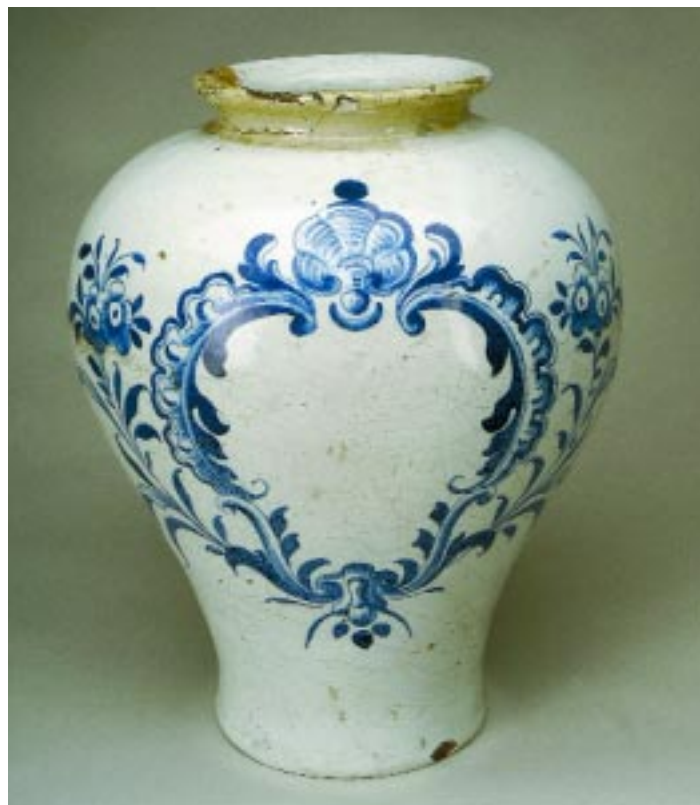
77 POTE DE FARMÁCIA EM FAIANÇA PORTUGUESA, decoração a azul com cartela barroca, séc. XVIII, restauro no bordo, esbeçadelas Dim. - 26,5 cm € 250 - 375