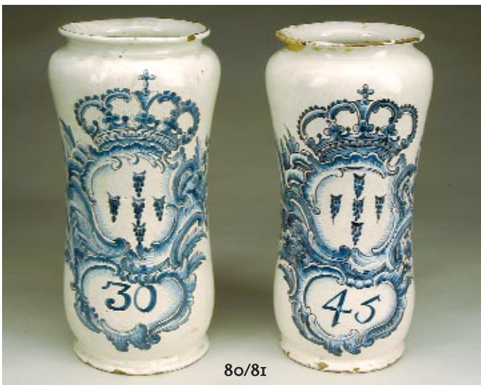
80 MANGA DE FARMÁCIA EM FAIANÇA PORTUGUESA DE VIANA, decoração idêntica ao pote do lote anterior, numerada "30", marcada, pequenas esbeaçadelas