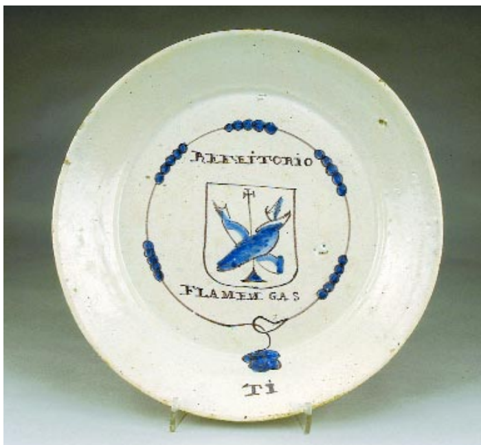
76 PRATO EM FAIANÇA PORTUGUESA DITA "CONVENTUAL", decoração a azul e vinoso com armas Franciscanas e inscrição REFEITÓRIO FLAMENGAS e TI , séc. XVII, pequenas esbeçadelas Dim. - 38,5 cm € 1.500 - 2.250