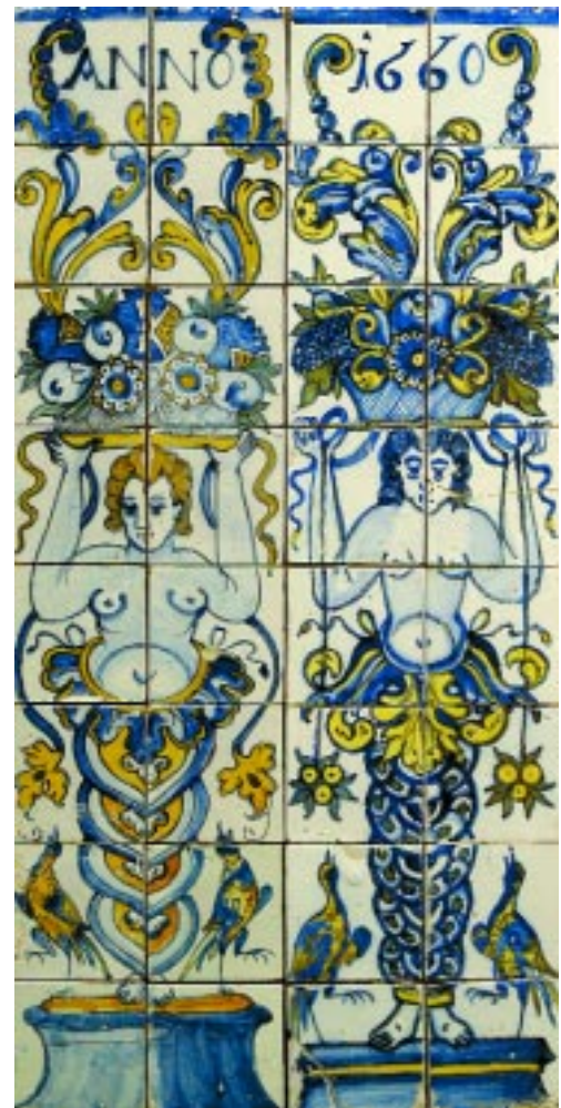
90 "FIGURAS COM CESTOS" , painel de trinta e dois azulejos, decoração a azul e amarelo, portugueses, séc. XVII, datado de 1660, pequenas faltas e defeitos Dim. - 114 x 57 cm € 3.500 - 5.000