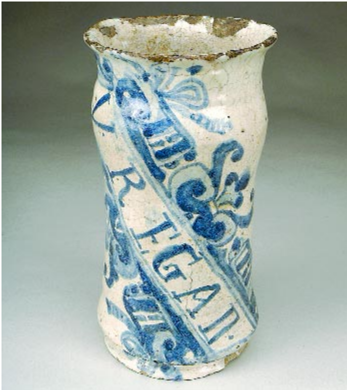
71 MANGA DE FARMÁCIA EM FAIANÇA PORTUGUESA, decoração a azul com cartela barroca e inscrição "V REGAD", séc. XVII, craquelé e esbeaçadelas Nota - exemplar idêntico vem reproduzido em "A Farmácia em Portugal", pág. 41 Dim. - 20,5 cm € 1.200 - 1.800