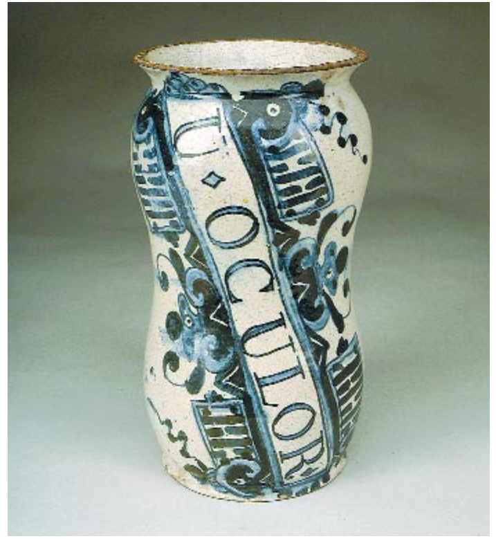
73 MANGA DE FARMÁCIA EM FAIANÇA PORTUGUESA, decoração a azul com cartela barroca e inscrição "U OCULOR", séc. XVII, esbeaçadelas e falta de vidrado no bordo Nota - exemplar idêntico vem reproduzido em "A Farmácia em Portugal", pág. 41 Dim. - 20,5 cm € 1.500 - 2.250