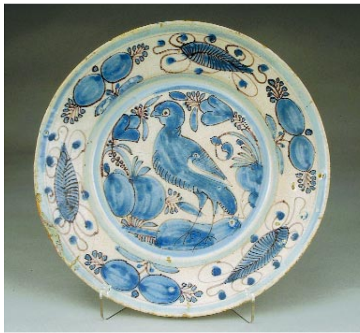
78 PRATO EM FAIANÇA PORTUGUESA DITA DE "ARANHÕES", decoração a azul e vinoso "paisagem com pássaro", séc. XVII, cabelos e esbeçadelas Dim. - 29,5 cm € 1.500 - 2.250