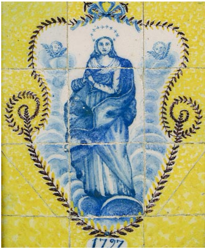
88 "NOSSA SENHORA DA CONCEIÇÃO LADEADA DE QUERUBINS" painel de doze azulejos, decoração a azul, vinoso e amarelo, portugueses, séc. XVIII, datado de 1797, defeitos Dim. - 52 x 43 cm € 500 - 750