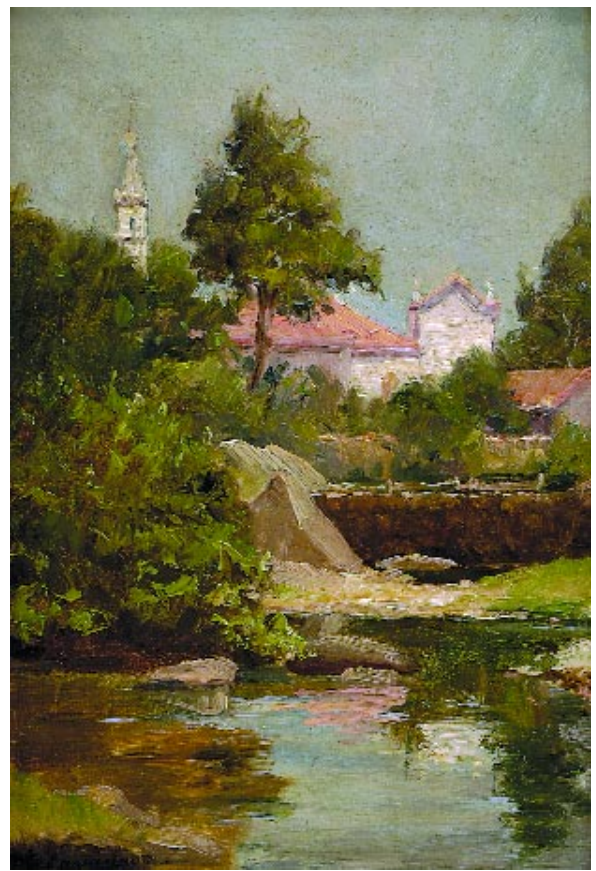
93 JOSÉ CAVADAS - 1882-19?? "Vizela - rio e trecho da Vila", óleo sobre madeira, assinado, datado no verso de 1924 Dim. - 33,5 x 24 cm