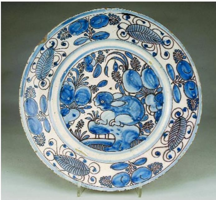
72 PRATO EM FAIANÇA PORTUGUESA DITA DE "ARANHÕES", decoração a azul e vinoso "paisagem com coelho", séc. XVII, esbeaçadelas e falha no bordo Dim. - 39 cm € 3.000 - 4.500