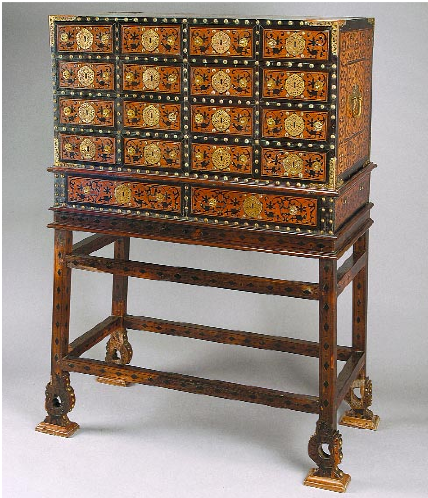
6I CONTADOR LUSÍADA EM TECA, ÉBANO E MARFIM, embutidos "leão, fauces de leão e pássaros", trempe em forma de mesa com duplo travejamento e pés em forma

de Jatayu estilizado, espelhos das fechaduras, pegas e tachas em cobre com restos de dourado, indo-português, séc. XVII, pequenos restauros, faltas e defeitos Dim. - 137 x 106 x 53 cm