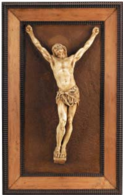
287 SOARES DOS REIS - 1847-1889, "CRISTO CRUCIFICADO", placa relevada em gesso patinado, moldura em madeira, assinada e datada de 1874 Dim. - 60 x 31 cm € 400 - 600