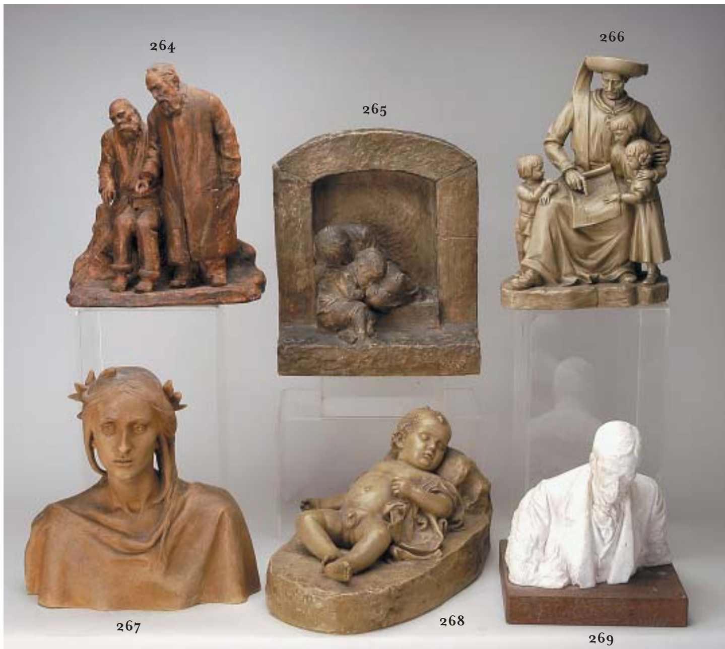
264 SOARES DOS REIS - 1847-1889, "GRUPO DE VELHOS", escultura em terracota patinada, assinada e datada de 1879 Dim. - 29 cm