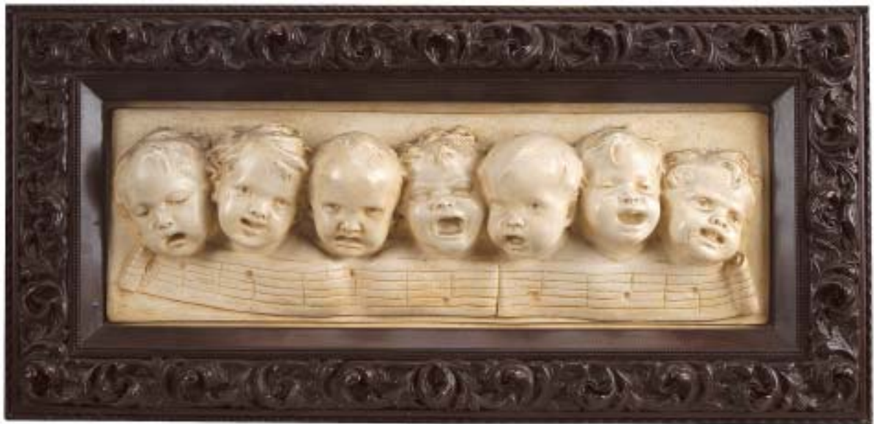
279 "MÚSICA", placa relevada em gesso,