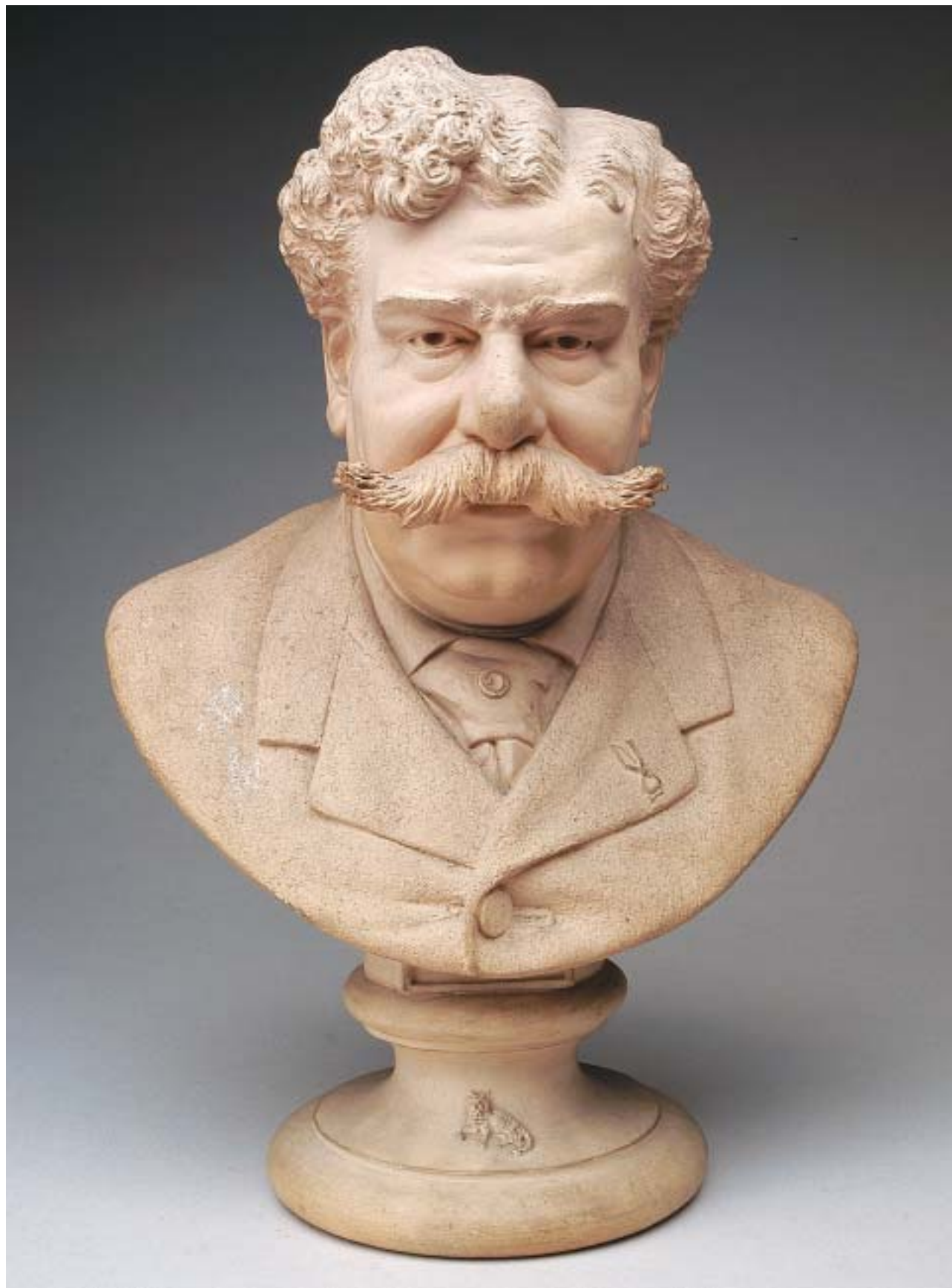
263 AVELINO BELLO - SÉC. XX, "BUSTO DE RAFAEL BORDALO PINHEIRO",

escultura em barro das Caldas, marcada e datada de 1906 Dim. - 36,5 cm