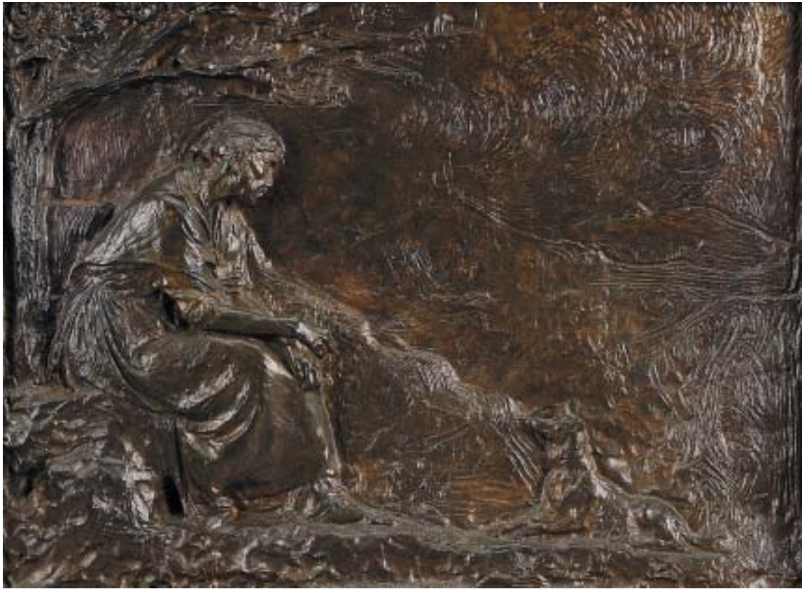
270 ANTÓNIO TEIXEIRA LOPES - 1866-1942, "ANCIÃ E CÃO", placa relevada em bronze, moldura em madeira, assinada; Dim. - 36 x 49 cm € 1.000 - 1.500