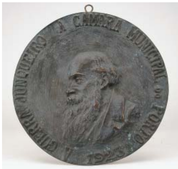
290 "BUSTO DE GUERRA JUNQUEIRO", placa em bronze, inscrição A GUERRA JUNQUEIRO A CÂMARA MUNICIPAL DO PORTO - 1923, portuguesa, séc. XX, assinatura não identificada Dim. - 29,5 cm € 120 - 180