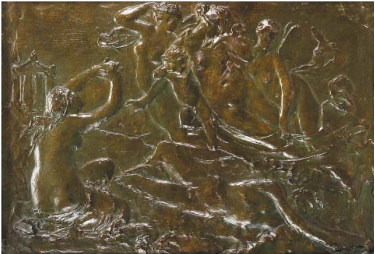
271 SOARES DOS REIS - 1847-1889, "MORTE DE ADÓNIS", placa relevada em gesso patinado, moldura em madeira, assinada; Dim. - 36 x 51 cm € 600 - 900