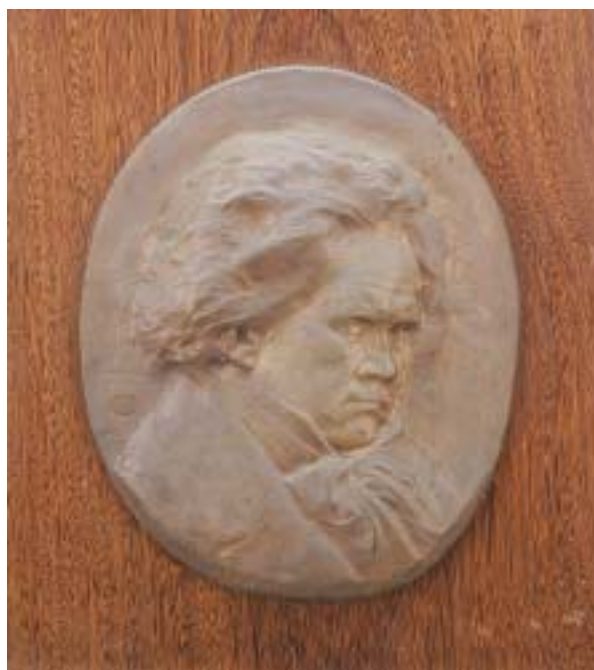
288 ANTÓNIO TEIXEIRA LOPES - 1866-1942, "BEETHOVEN", placa em bronze, carimbo da Fundação Artística de A. Teixeira Lopes - Gaia, assinada Dim. - 34,5 x 28,5 cm € 200 - 300