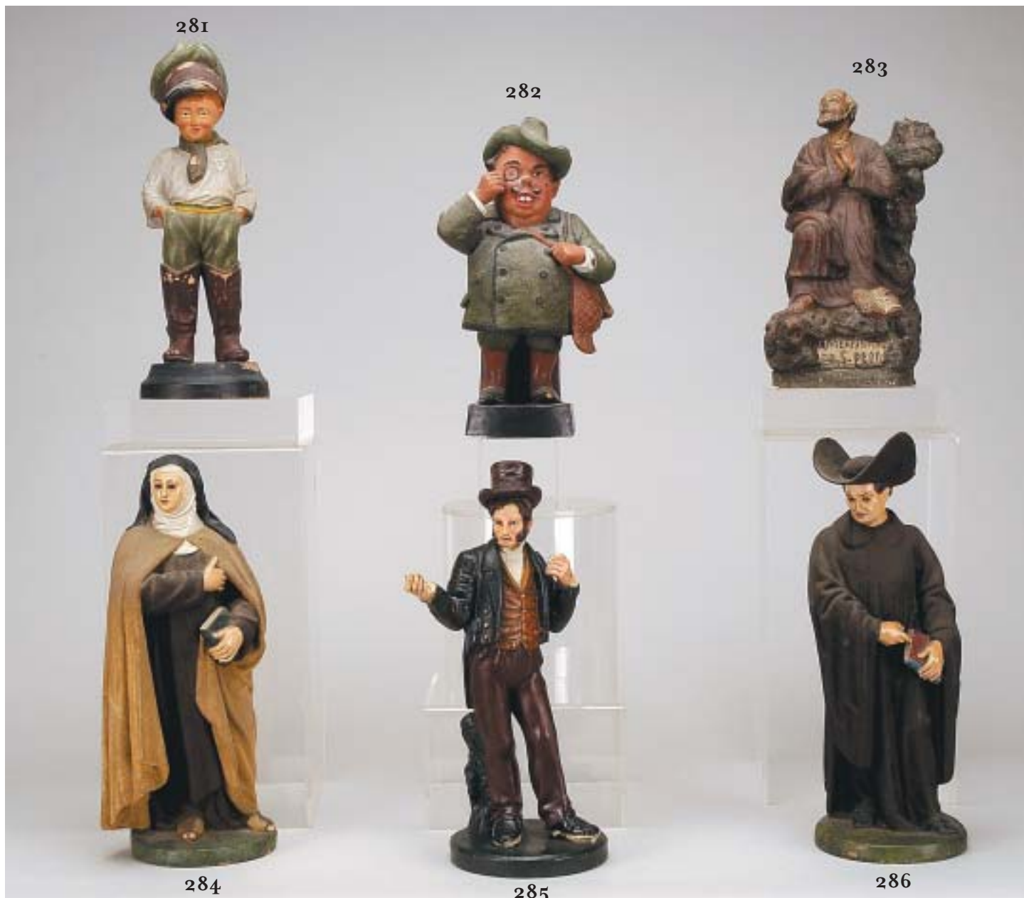
281 "MENINO DE MÃOS NOS BOLSOS" , escultura em barro policromado das Caldas, séc. XX, sem o cachimbo, faltas na pintura, marca E. M. CALDAS Dim. - 31 cm € 150 - 225