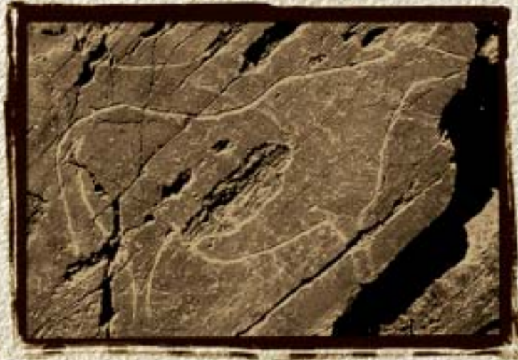
Arte Rupestre Paleolítica do Vale do Côa Património Mundial UNESCO 1998 © Instituto Português de Arqueologia